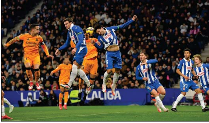
■ အက်စ်ပန်ညိုနှင့် ရီးရဲမက်ဒရစ်အသင်းတို့ အကြိတ်အနယ် ယှဉ်ပြိုင်ကစားစဉ်။

တီကို မက်ဒရစ်အသင်းနှင့် တစ်မှတ်သာ ကွာဟတော့သည်။ ပြိုင်ဘက် အက်စ်ပန်ညိုအသင်းက ယခုပွဲစဉ် နိုင်ပွဲရရှိခဲ့သည့်အတွက် လာလိဂါနွှေးပွဲသုံးပွဲရှိလာပြီး ခြောက်ပွဲရှိလာပြီ ဖြစ်သည်။