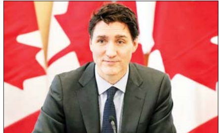
ချုပ်က ပြောကြားသည်။

ကနေဒါက ဖေဖော်ဝါရီ ၅ ရက်အထိ ကနေဒါဒေါ်လာ ၃၀ ဘီလီယံ (အမေရိကန်ဒေါ်လာ ၂၀ ဘီလီယံ) တန်ဖိုးရှိ အမေရိကန် ကုန်ပစ္စည်းများအပေါ် စည်းကြပ်ခွန် ၂၅ ရာခိုင်နှုန်း ကောက်ခံသွားမည်ဖြစ်ကြောင်း ကနေဒါဝန်ကြီးချုပ် ဂျက်စတင်ထရူးဒိုက အစိုးရအဖွဲ့အစည်းအဝေးအပြီးတွင် ပြောကြားခဲ့သည်။