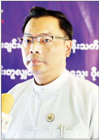
ဒုတိယဝန်ကြီး ဒေါက်တာအောင်ဇေယျ

ကျွန်တော်တို့ရဲ့ ဒစ်ဂျစ်တယ်ကော်နာပြခန်းကို လာရောက်လေ့လာကြည့်ရှုခြင်းဖြင့် ထွန်းသစ်စ ဒစ်ဂျစ်တယ်နည်းပညာတွေကို အသုံးပြုပြီး MSME လုပ်ငန်းတွေ ဖွံ့ဖြိုးတိုးတက်အောင် ဘယ်လိုဆောင်ရွက်နိုင်တယ်ဆိုတာကို သိရှိသွားမယ့်အပြင် နည်းပညာပိုင်းလွှဲပြောင်းပံ့ပိုးပေးဖို့ ချိတ်ဆက်ဆောင်ရွက်မှု စတဲ့အကျိုးကျေးဇူးတွေကို ရရှိမှာ ဖြစ်ပါတယ်။