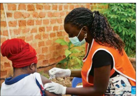
ကမ်ပါလာမြို့တွင် မျောက်ကျောက်ရောဂါကာကွယ်ဆေးကို ဖေဖော်ဝါရီ ၁ ရက်က ထိုးနှံပေးနေစဉ်။

မျောက်ကျောက် ရောဂါ ကူးစက်မှုကို ကာကွယ်ရန်အတွက် ကျန်းမာရေး ဝန်ထမ်းများနှင့် ကူးစက်နိုင်ခြေမြင့်သည့် သူများကို ပထမအကြိမ် ကာကွယ်ဆေးထိုးပေးမှု လုပ်ဆောင်ခဲ့ကြောင်း ကျန်းမာရေးဝန်ကြီးဌာန ညွှန်ကြားရေးမှူးချုပ် ချားလ်အိုလာရီက ဆင်ယာသို့ ပြောသည်။