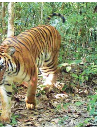
ထပ်သိတောရိုင်းတိရစ္ဆာန်ဘေးမဲ့တောအတွင်း ကျက်စားနေသည့် ဘင်္ဂလားကျားကို တွေ့ရစဉ်။

သစ္စာ(MNA) စာတံပုံ-ထပ်သိတောရိုင်း မှတ်တမ်း အုပ်ချုပ်ရေးမှူးရုံး