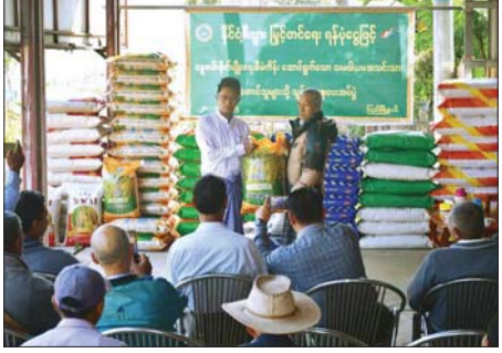
ဦးစော်မင်းသိန်းနှင့် မြို့နယ် ၂၀၂၅) ဘဏ္ဍာနှစ် နေ့စပါးစိုက်ပျိုးသည့် အခြေခံသမဝါယမအသင်းသား သွင်းအားစုပေးအပ်ပုံအခမ်းအနား

ပြည် ဇန်နဝါရီ ၂၉ ပဲခူးတိုင်းဒေသကြီး ပြည်မြို့နယ်၌ သမဝါယမကဏ္ဍမှ နိုင်ငံစီးပွားဖြင့်တင်ရေးရန်ပုံငွေဖြင့် (၂၀၂၄-၂၀၂၅) ဘဏ္ဍာနှစ် နေ့စပါး စိုက်ပျိုးသည့် သမဝါယမအသင်းသား တောင်သူများအတွက် သွင်းအားစုပေးအပ်ပုံအခမ်းအနားကို ယနေ့နံနက်ပိုင်းက ပြည်မြို့ ရွှေတံခါးရပ်တွက် တာဝလမ်းဆုံအနီးရှိ (သမာဓိ) မြို့စေ့နှင့်စိုက်ပျိုးရေးသုံးဆေးပစ္စည်း အရောင်းဆိုင်၌ ကျင်းပသည်။