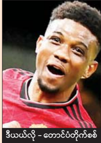
ဒီယယ်လို့ - တောင်ပံတိုက်စစ်

အုပ်စုပွဲစဉ် ခုနစ်ပွဲကစားပြီးချိန်မှာ မန်ယူက ရမှတ် ၁၅ မှတ်နဲ့ နောက်တစ်ဆင့်ကို တိုက်ရိုက်တက်လှမ်းခွင့်ရဖို့ နီးစပ်နေသလို ပြိုင်ဘက်အက်ဖ်စီအက်စ်ဘီအသင်းကလည်း ရမှတ် ၁၄ မှတ်နဲ့ တိုက်ရိုက်တက်လှမ်းခွင့်ရဖို့ အခြေအနေကောင်းနေပါတယ်။ သို့သော်ငြား နှစ်သင်းစလုံး ရမှတ် လိုအပ်ချက်ရှိနေသေးတဲ့အတွက် နိုင်ပွဲရရေး ဦးတည်လာမှာဖြစ်တာကြောင့် ပြိုင်ဆိုင်မှုပြင်းထန်လာမှာ သေချာတယ်။ ခြေစွမ်းပြသနိုင်တဲ့အသင်းထက် ရရှိလာမယ့် အခွင့်အရေးကို ဂိုးအဖြစ်ပြောင်းလဲနိုင်စွမ်းရှိတဲ့ အသင်းနိုင်ပွဲရမယ်။