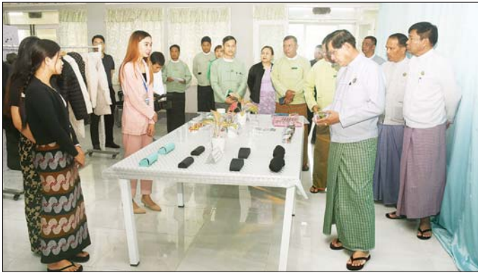
တက်ရောက်ကြပြီး ရင်းနှီးမြှုပ်နှံ သည့်ပစ္စည်း နမူနာပြသထားရှိ သည့် (အပေါ်ပုံ) အစည်းအဝေးတွင် တိုင်း မူများကို ကြည့်ရှုစစ်ဆေးကြ

ရန်ကုန် ဇန်နဝါရီ ၂၉ ရန်ကုန်တိုင်းဒေသကြီး ရင်းနှီးမြှုပ်နှံမှုကော်မတီ၏ (၁/၂၀၂၅) ကြိမ်မြောက် အစည်းအဝေးကို ယနေ့နံနက်ပိုင်းက ရန်ကင်းမြို့နယ် ရန်ကုန်တိုင်းဒေသကြီးရင်းနှီးမြှုပ်နှံမှုကော်မတီရုံး၌ ကျင်းပသည်။ အစည်းအဝေးသို့ ရန်ကုန်တိုင်းဒေသကြီး ရင်းနှီးမြှုပ်နှံမှုကော်မတီ ဥက္ကဋ္ဌ ရန်ကုန်တိုင်းဒေသကြီး ဝန်ကြီးချုပ် ဦးစိုးသိန်းနှင့် ကော်မတီအဖွဲ့ဝင် တိုင်းဒေသကြီး ဝန်ကြီးများ၊ တိုင်းဒေသကြီး ဌာနဆိုင်ရာ တာဝန်ရှိသူများ၊ အထူးဖိတ်ကြားထားသူများ