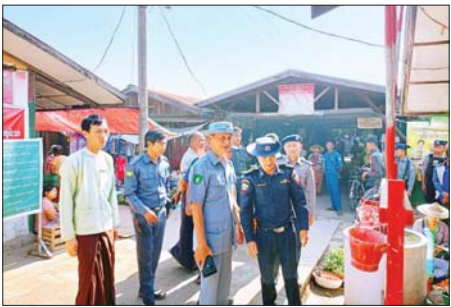
အောင်နှင့် ပူးပေါင်း အဖွဲ့တို့က မီးဘေးအန္တရာယ် ကြိုတင် ကာကွယ်ရေး ဆိုင်ရာများကို မြို့နယ် (ပြန်/ဆက်)

ကြံခင်း ဇန်နဝါရီ ၂၉ ဧရာဝတီတိုင်းဒေသကြီး ကြံခင်း မြို့၌ မီးဘေးအန္တရာယ် မကျရောက် စေရန်နှင့် ကြိုတင် ကာကွယ်မှုများ ပြုလုပ်နိုင်ရန်အတွက် မြို့နယ် မီးသတ်ဦးစီးဌာနနှင့် ဌာနဆိုင်ရာ များပူးပေါင်းကာ ယနေ့နံနက်ပိုင်း က မြို့မစည်ပင်သာယာဈေးကြီး ၌ မီးဘေးအန္တရာယ် ကြိုတင် ကာကွယ်ရေး လုပ်ငန်းများ ဆောင်ရွက်ထားရှိမှု အခြေအနေ ကို ကွင်းဆင်းစစ်ဆေးခဲ့ကြောင်း သိရသည်။ ထိုသို့ ဆောင်ရွက်ရာတွင်