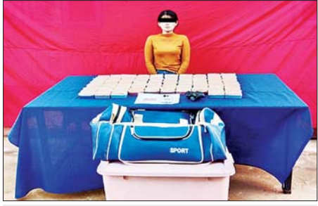
မကြာကြာဌေးအား သိမ်းဆည်းရမိသည့် ဘိန်းဖြူများနှင့်အတူ တွေ့ရစဉ်။