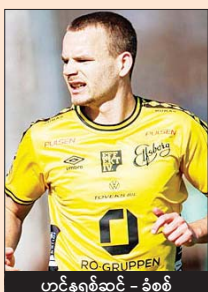
ဟင်နရစ်ဆင် - ခံစစ်

ရှုံးထွက်အဆင့်တက်လှမ်းဖို့ ခြေကုန်ထုတ်လာမယ့် အက်ဖ်စီဘော့ဂ်အသင်းက နောက်တစ်ဆင့်ကို တိုက်ရိုက်တက်လှမ်းဖို့ ရမှတ်လိုအပ်ချက်ရှိနေသေးတဲ့ စပါးအသင်းကို ခက်ခက်ခဲခဲ ယှဉ်ပြိုင်ကစားရဖယ်ရှိတယ်။ ရမှတ်လိုအပ်ချက်ရှိတဲ့ အသင်းနှစ်သင်း တွေ ဆုံမှုဖြစ်တဲ့အတွက် ပြိုင်ဆိုင်မှု ပြင်းထန်လာမှာ သေချာတယ်။ မည်သို့ပင်ဆိုစေ အက်ဖ်စီဘော့ဂ်အသင်း ကစားပုံထက်မြက်မှုရှိသော်ငြား ခြေစွမ်းသာလွန်မှုရှိတဲ့ စပါးအသင်းသာ နိုင်ပွဲရပြီး နောက်တစ်ဆင့်ကို တိုက်ရိုက်တက်လှမ်းခွင့်ရမယ်။