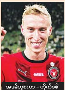
အဒမ်ဘူစကာ - တိုက်စစ်