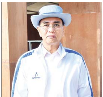
ဦးတင်အေး (စီးပွားရေးရာဝန်ကြီး၊ ဧရာဝတီတိုင်းဒေသကြီးအစိုးရအဖွဲ့)