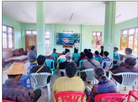
ဟိုပုံးမြို့နယ်၌ သစ်တောထိန်းသိမ်းရေး၊ ရေသယံဇာတထိန်းသိမ်းရေးနှင့် မီးခိုးမြို့ငွေ့ လျှော့ချရေးဆိုင်ရာ အသိပညာပေးဟောပြောပွဲကျင်းပ

ဟင်္သာတ ဇန်နဝါရီ ၂၉ ဟင်္သာတအကျဉ်းထောင်တွင် အကျဉ်းသား/အချုပ်သားများအား ကျန်းမာရေးအသိပညာပေးခြင်းနှင့် ရှာဖွေကုသခြင်းလုပ်ငန်းများကို ခရိုင်ပြည်သူ့ကျန်းမာရေးဦးစီးဌာနက ကွင်းဆင်းဆောင်ရွက်ခဲ့သည်။