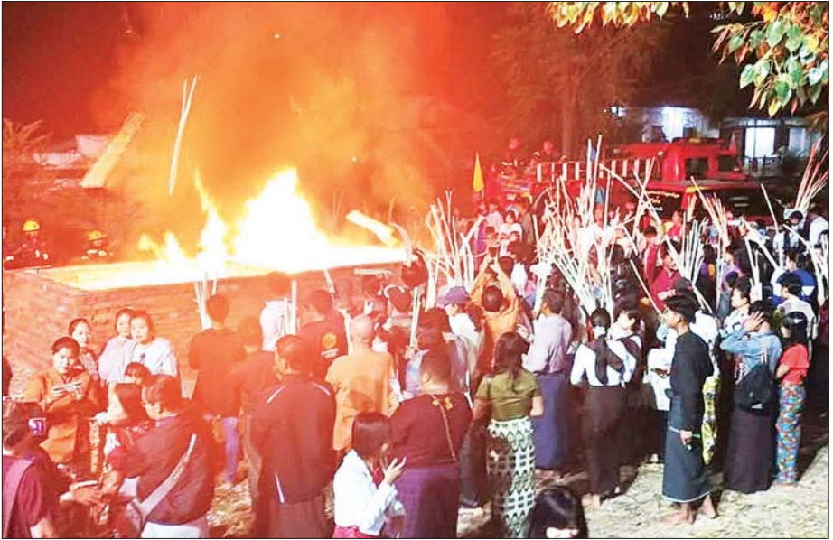
ပြည်မြို့ရှိ လေးဆူဓာတ်ပျော်ရွှေဆံတော်စေတီတော်မြတ်ကြီး၌ အကြိမ် (၁၀၀)မြောက် ညရိုးမီးပူဇော်ပွဲကို ယမန်နံနက် စည်ကားသိုက်မြိုက်စွာ ကျင်းပခဲ့မှုကို တွေ့ရစဉ်။