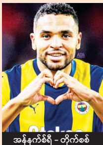
အန်နက်စ်ရီ - တိုက်စစ်

ဒိန်းမတ်ကလပ် မစ်ဂျေးလန်းရော တူကီယံကလပ် ဖီနာဘာချီအသင်းပါ ရှုံးထွက်အဆင့် တက်လှမ်းနိုင်ရေးကိုသာ အဓိကယှဉ်ပြိုင်ကစားသွားရမှာဖြစ်တယ်။ နှစ်သင်းစလုံး ဒီပွဲစဉ်နိုင်ပွဲရရှိမှသာ ရှုံးထွက်အဆင့်တက်လှမ်းဖို့ မျှော်လင့်နိုင်မှာ ဖြစ်တယ်။ ဖီနာဘာချီအသင်းကို မန်ယူနည်းပြဟောင်း မော်ရင်ဟို တာဝန်ယူတိုင်တွယ်နေပေမယ့် ယူရိုပါလိဂ်မှာ ရလဒ်ပိုင်းကောင်းမွန်မှုမရှိဘဲ ရုန်းကန်နေရတဲ့ အသင်းဖြစ်တယ်။ ဒါကြောင့် မစ်ဂျေးလန်းအသင်းထက် မော်ရင်ဟိုရဲ့ ဖီနာဘာချီအသင်း နိုင်ပွဲရဖွယ်ရှိတယ်။