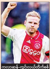
ကလာဆန် - ကွင်းလယ်တိုက်စစ်