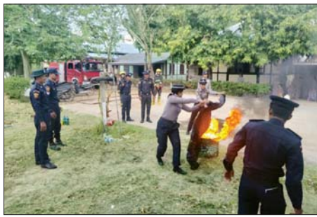
ဖြင့် မီးငြိမ်းသတ်ခြင်း၊ ဆီမီးသရုပ်ပြ လေ့ကျင့်ခဲ့ကြောင်း လောင်းခြင်း ငြိမ်းသတ်နည်း စသည်တို့ကို လက်တွေ့ငြိမ်းသတ်

ရမည်းသင်း ဇန်နဝါရီ ၂၉ မန္တလေးတိုင်းဒေသကြီး ရမည်းသင်းခရိုင်အတွင်း မီးဘေးအန္တရာယ် ကင်းဝေးရေးအတွက် ခရိုင်မီးသတ်ဦးစီးဌာနနှင့် ခရိုင်ရဲတပ်ဖွဲ့မှူးများ တို့ပူးပေါင်း၍ မီးဘေးအန္တရာယ် ကြိုတင်ကာကွယ်ရေး အသိပညာပေးဟောပြောပွဲနှင့် သရုပ်ပြလေ့ကျင့်ခြင်းကို ယနေ့နံနက် ၉နာရီက ခရိုင်ရဲတပ်ဖွဲ့မှူးရုံး၌ ဆောင်ရွက်သည်။