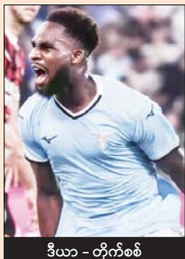
ဒီယာ - တိုက်စစ်

လာဇီယိုက ဒီပွဲစဉ်မတိုင်မီ နောက်တစ်ဆင့်ကို တိုက်ရိုက်တက်လှမ်းထားနိုင်ပြီဖြစ်လို့ လူစုံထုတ်လာဖွယ်မရှိဘူး။ ပေါ်တူဂီကလပ် ဘရာဂါက လာဇီယိုကို နိုင်ပွဲရမှသာလျှင် ရှုံးထွက်အဆင့်တက်လှမ်းနိုင်ရေး မျှော်လင့်နိုင်မှာ ဖြစ်တယ်။ ဘရာဂါက တိုက်စစ် ခံစစ်ဆိုးရွားတဲ့အသင်းထဲ ပါဝင်နေတယ်။ မဖြစ်မနေနိုင်ပွဲရဖို့ လိုအပ်နေတယ်ဆိုသော်ငြား ယူရိုပါလိဂ်မှာ တိုက်စစ်၊ ခံစစ်အကောင်းဆုံးအသင်းအဖြစ် ရပ်တည်နေတဲ့ လာဇီယိုကို အခက်တွေ့အောင်သာ ကစားနိုင်ဖွယ်ရှိပြီး နိုင်ပွဲရတဲ့အထိ စွမ်းဆောင်နိုင်ဖွယ်မရှိဘူး။