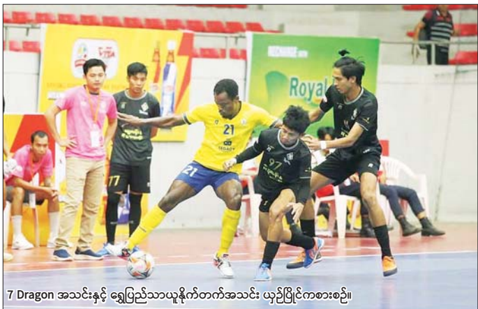
7 Dragon အသင်းနှင့် ရွှေပြည်သာယူနိုက်တက်အသင်း ယှဉ်ပြိုင်ကစားစဉ်။

ကို လေးဂိုး-နှစ်ဂိုး၊ Black Cross အသင်းက 7 Brother အသင်းကို ခုနစ်ဂိုးပြတ်၊ 7 Dragon အသင်းက ရွှေပြည်သာယူနိုက်တက်အသင်းကို သုံးဂိုး - နှစ်ဂိုး၊ Pacific Sun Far အသင်းက TG United အသင်းကို လေးဂိုး-နှစ်ဂိုး၊ YCDC Marga Youth အသင်းက လက်ဝဲသုနရအသင်းကို နှစ်ဂိုး - ဂိုးမရှိ၊ JZ Yangon အသင်းက Maryar အသင်းကို ခုနစ်ဂိုး - လေးဂိုးဖြင့် အနိုင်ရရှိသည်။ ပွဲစဉ် (၈) အပြီးတွင် TG United အသင်းက ၁၈ မှတ်၊ စာမျက်နှာ ၃၃ ကော်လံ ၅ ❖