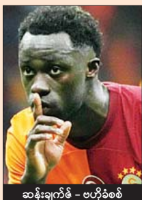
ဆန်းချက်စ် - ဗဟိုခံစစ်

အိုင်းယက်စ်က ရှုံးထွက်အဆင့် တက်လှမ်းနိုင်ရေး ကြိုးပမ်းလာမှာဖြစ်ပြီး ဂါလာတာစရေးအသင်းက တိုက်ရိုက်တက်လှမ်းခွင့်ရရေး ခြေကုန်ထုတ်လာမှာဖြစ်တယ်။ ဂါလာတာစရေးအသင်းထက် အိုင်းယက်စ်အသင်းက ခံစစ်တည်ငြိမ်တာ တွေ့ရတယ်။ ဒါပေမယ့် အိုင်းယက်စ်အသင်းက ခြေစွမ်းပုံမှန်မရှိဘူး။ ဂါလာတာစရေးအသင်းက ပြိုင်ပွဲပုံ၌ ၂၆ ပွဲဆက် ရှုံးပွဲကြုံတွေ့ထားခြင်းမရှိဘူး။ ကစားပုံမှာကျောပြီး တိုက်စစ်ပိုင်းထက်မြက်မှုရှိတဲ့ ဂါလာတာစရေးအသင်းကို အိုင်းယက်စ်အသင်းတို့ ဖြတ်ကျော်ဖို့မလွယ်ဘူး။