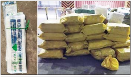
မြန်မာ့စက်မှုဆိုင်ကမ်း၌ ဖမ်းဆီးရမိမှု။

တစ်စီးပေါ်မှ တရားဝင်စာရွက်စာတမ်းအထောက်အထား တင်ပြနိုင်ခြင်း မရှိသည့် လုပ်ငန်းသုံးပစ္စည်း နှစ်မျိုး၊ လူသုံးကုန်ပစ္စည်းတစ်မျိုး (ခန့်မှန်း တန်ဖိုးငွေကျပ် ၂၀၀၀၀၀၀)နှင့် အဆိုပါပစ္စည်းများ တင်ဆောင်လာ သည့် စက်မှုဇုန်ထုတ် Pyay Truck တစ်စီး (ခန့်မှန်းတန်ဖိုးငွေကျပ် ၂၅၀၀၀၀၀) စုစုပေါင်း ခန့်မှန်းတန်ဖိုးငွေကျပ် ၄၅၀၀၀၀၀)ကို ဖမ်းဆီးရမိခဲ့ပြီး အကောက်ခွန်လုပ်ထုံးလုပ်နည်းများနှင့်အညီ အရေးယူ ဆောင်ရွက်လျက်ရှိသည်။