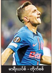
မာရီးယပ်စ် - တိုက်စစ်