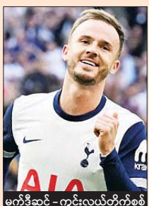
မက်ဒီဆင် - ကွင်းလယ်တိုက်စစ်