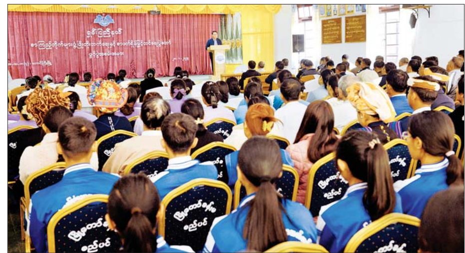
မြန်မာနိုင်ငံ စာကြည့်တိုက်များ ဖွံ့ဖြိုးတိုးတက်ရေးပူးပေါင်းဆောင်ရွက်မှုကော်မတီဥက္ကဋ္ဌ ပြန်ကြားရေးဝန်ကြီးဌာန ပြည်ထောင်စုဝန်ကြီး ဦးမောင်မောင်အုန်း တောင်ကြီးမြို့၌ ကျင်းပသည့် ကျောင်းစာကြည့်တိုက်များ ဖွံ့ဖြိုးတိုးတက်ရေးနှင့် စာဖတ်ရိုက်မြှင့်တင်ရေးပွဲတော်တွင် အမှာစကားပြောကြားစဉ်။

စကားပုံဆက်၊ မြားပစ်၊ စက်ဝိုင်းလှည့်၊ ဂုဏ်ထူးဆောင်၊ ဆန်ကောရွက်၊ ခုံမိနပ်စီး၊ ခွက်နင်း၊ ခါးလှည့်ပြိုင်ပွဲများနှင့် စာအုပ်အရောင်းဆိုင်တို့ကို လှည့်လည်ကြည့်ရှုပြီး ပြည်ထောင်စုဝန်ကြီးနှင့် ပြည်နယ်ဝန်ကြီးချုပ်တို့က ကျောင်းသားကျောင်းသူများအား အာဟာရဒါနများ ပေးဝေကာ ကလေးငယ်များအား အမှတ်တရ အရုပ်လက်ဆောင်များ ပေးအပ်၍ ပညာဗိမာန် ကျောင်းစာကြည့်တိုက် ကြည့်ရှုအားပေးသည်။