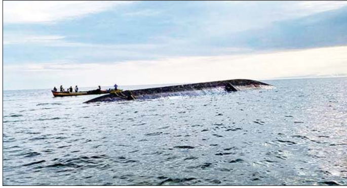
နှစ်မြှုပ်ပျောက်ဆုံးနေသော ကုန်တင်သင်္ဘောကို ရှာဖွေနေသည့် တာဝန်ရှိသူများကို တွေ့ရစဉ်။