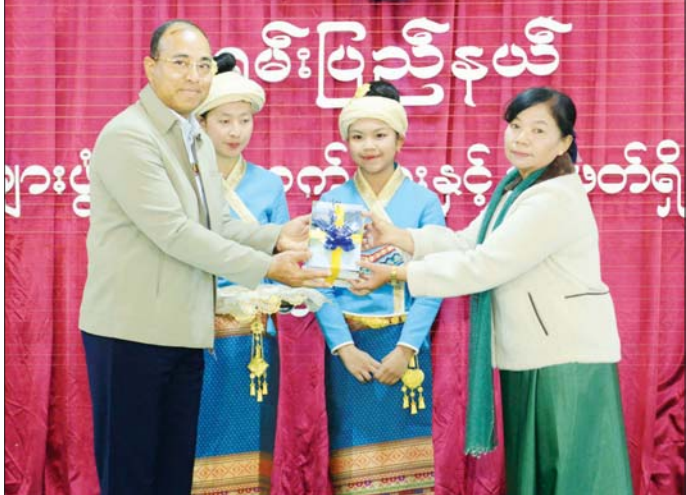
ရှမ်းပြည်နယ်ဝန်ကြီးချုပ် ဦးအောင်အောင် ကျောင်းစာကြည့်တိုက်များအတွက် သုတ၊ ရသ စာအုပ်စာစောင်များ လှူဒါန်းပေးအပ်စဉ်။