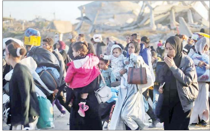
နေရပ်ပြန် ဂါဇာဒေသခံများကို တွေ့ရစဉ်။

အင်ကာရာ ဇန်နဝါရီ ၂၈ နာမည်ပေးထားသော စစ်ဆင်ရေး တူကီယံ အာဏာပိုင်များသည် နှစ်ခုကို နိုင်ငံ၏ ပြည်နယ် ၂၄ ခု လွန်ခဲ့သော သီတင်းပတ်က တွင် လုပ်ဆောင်ခဲ့ကြောင်း သိရ အိုင်အက်စ်အဖွဲ့ဝင်အဖြစ် သံသယ ရှိသူ အယောက် ၁၀၀ ကို ဖမ်းဆီး ထိန်းသိမ်းလိုက်ကြောင်း ပြည်ထဲ ရေးဝန်ကြီး အလီယာလီကာယာ က ဇန်နဝါရီ ၂၈ ရက်က ပြောကြား ခဲ့သည်။ Gurz-41 နှင့် Gurz-42 ဟု နာမည်ပေးထားသော စစ်ဆင်ရေး နှစ်ခုကို နိုင်ငံ၏ ပြည်နယ် ၂၄ ခု တွင် လုပ်ဆောင်ခဲ့ကြောင်း သိရ သည်။ ထို့အပြင် စစ်ဆင်ရေးတွင် မြို့တော်အနီးကရာနှင့် အစ္စတန် ဘူလ်မြို့များလည်း ပါဝင်ကြောင်း ပြည်ထဲရေးဝန်ကြီးက လူမှု မီဒီယာပလက်ဖောင်း တစ်ခု ဖြစ်သော အိတ်စ်တွင် ဖော်ပြ ခဲ့သည်။ သံသယ ရှိသူများသည် မြေအောက် လှုပ်ရှားမှုများကို လုပ်ဆောင် လျက်ရှိကြောင်း၊ ငွေကြေးပုံပိုင်းများနှင့် အကြမ်း ဖက်အဖွဲ့အစည်းအတွက် ဝါဒ ဖြန့်ခြင်းများကို လူမှုမီဒီယာပေါ် တွင် လုပ်ဆောင်လျက်ရှိကြောင်း ပြည်ထဲရေးဝန်ကြီးက ဆက်လက် ပြောကြားခဲ့သည်။ ဆင်ဟွာ