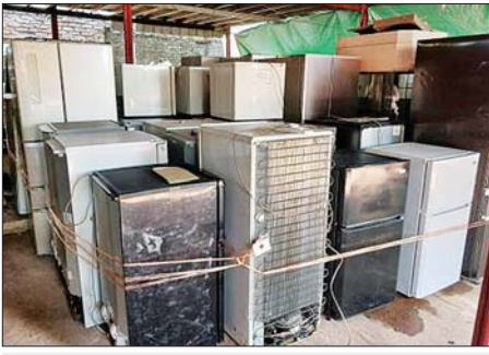
မွန်ပြည်နယ်၌ ဖမ်းဆီးရမိမှု

အထူးအဖွဲ့၏ စီမံခန့်ခွဲမှုဖြင့် တာဝန်ကျပူးပေါင်းအဖွဲ့များက စစ်ဆေးမှုများဆောင်ရွက်ခဲ့ရာ မော်လမြိုင်မြို့ မြို့ကြီးစုရပ် သီရိမင်္ဂလာလမ်းအမှတ်(၇၈၅)ရှိ ပိုဒေါင်တစ်လုံးအတွင်းမှ တရားဝင်စာရွက်စာတမ်းအထောက်အထားတင်ပြနိုင်ခြင်းမရှိသည့် လူသုံးကုန်ပစ္စည်းသုံးမျိုး (ခန့်မှန်းတန်ဖိုးငွေကျပ် ၁၁၅၀၀၀၀)ကို အကောက်ခွန်လုပ်ထုံးလုပ်နည်းများအရလည်းကောင်း၊ ပေါင်မြို့နယ် ဇေတဝန်ရပ်ကွက်သံလွင်တံတားစစ်ဆေးရေးရုံးတံခွန် လိုင်စင်မဲ့ Honda ADV-160 မော်တော်ဆိုင်ကယ်တစ်စီး (ခန့်မှန်းတန်ဖိုးငွေကျပ် ၂၀၀၀၀၀) ကို ပို့ကုန်သွင်းကုန်ဥပဒေအရလည်းကောင်း စုစုပေါင်း ခန့်မှန်းတန်ဖိုးငွေကျပ် ၁၃၅၀၀၀၀ ကို ဖမ်းဆီးအရေးယူဆောင်ရွက်လျက်ရှိသည်။ ယင်းအပြင် စစ်ကိုင်းတိုင်းဒေသကြီး တရားမဝင်ကုန်သွယ်မှုတိုက်ဖျက်ရေးအဖွဲ့၏ စီမံခန့်ခွဲမှုဖြင့် တာဝန်ကျပူးပေါင်းအဖွဲ့များက စစ်ဆေးမှုများ ဆောင်ရွက်ခဲ့ရာ မော်လမြိုင်မြို့ မော်လမြိုင်မြို့နယ် ခန့်မှန်းတန်ဖိုးငွေကျပ် ၁၃၅၀၀၀၀ ကို ဖမ်းဆီးရမိခဲ့ပြီး အကောက်ခွန်လုပ်ထုံးလုပ်နည်းများနှင့်အညီ အရေးယူဆောင်ရွက်လျက်ရှိသည်။ ထို့အပြင် မွန်ပြည်နယ် တရားမဝင်ကုန်သွယ်မှုတိုက်ဖျက်ရေး