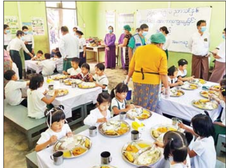
သထုံမြို့နယ်၌ မူလတန်းကြို ကျောင်းသားကျောင်းသူများအား အာဟာရပြည့် နေ့လယ်စာကျွေးမွေးစဉ်။