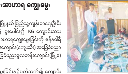
ဆောင်ရွက်ရန်၊ မူလတန်းကျောင်းသား ကျောင်းသူများ၏ ဖွံ့ဖြိုးမှုနှင့် ကျန်းမာရေးနှင့်ညီညွတ်သော အစားအသောက်ပုံစံများ မြှင့်တင်ရန် ရည်ရွယ်၍ ဆောင်ရွက်ခဲ့ခြင်းဖြစ်ကြောင်း သိရသည်။ နန်းဗွေခမ်း

ကျေးသီး ဇန်နဝါရီ ၂၀ ရှမ်းပြည်နယ်(တောင်ပိုင်း) ကျေးသီးမြို့နယ် ပြည်သူ့ကျန်းမာရေးဦးစီးဌာနနှင့် အခြေခံပညာဦးစီးဌာနတို့ ပူးပေါင်း၍ KG ကျောင်းသားကျောင်းသူများအား ကျောင်းတွင်းအာဟာရကျွေးမွေးခြင်းကို ဇန်နဝါရီ ၂၇ ရက်က အခြေခံပညာအထက်တန်းကျောင်း(ကျေးသီး)၊ အခြေခံပညာမူလတန်းလွန်ကျောင်း(လုံပု)နှင့် အခြေခံပညာမူလတန်းကျောင်း(မြို့မ)တို့၌ ဆောင်ရွက်သည်။