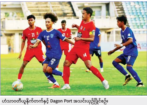
ဟံသာဝတီယူနိုက်တက်နှင့် Dagon Port အသင်းယှဉ်ပြိုင်ပွဲစဉ်။

ရန်ကုန် ဇန်နဝါရီ ၂၈ ၂၀၂၄-၂၀၂၅ ရာသီ MNL အမှတ်ပေးပြိုင်ပွဲ ပွဲစဉ် (၁၇) နောက်ဆုံးနေ့ကို ဇန်နဝါရီ ၂၈ ရက်က သုဝဏ္ဏကွင်း၌ကျင်းပရာ ဟံသာဝတီယူနိုက်တက်အသင်းက Dagon Port အသင်းကို နှစ်ဂိုး-တစ်ဂိုးဖြင့် အနိုင်ရခဲ့သည်။ ယခုတစ်ပတ် ပွဲစဉ် (၁၇) တွင် ထိပ်ဆုံးလေးသင်းအနက် ရှမ်းယူနိုက်တက်၊ ရန်ကုန်ယူနိုက်တက်နှင့် ဒဂုံစတားယူနိုက်တက်အသင်းတို့ နိုင်ပွဲရယူထားသဖြင့် ဒုတိယနေရာမှ ဟံသာဝတီယူနိုက်တက်အသင်းမှာလည်း အမှားအယွင်းမရှိ နိုင်ပွဲရယူနိုင်ခဲ့သည်။ နှစ်သင်းစလုံး အမှတ်ကစားသမားအများစုဖြင့် စာမျက်နှာ ၁၅ ကော်လံ ၁ *