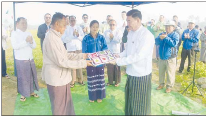
ကို အဆင့်မြင့်လယ်ယာဖော်ထုတ်မည့် အစီအစဉ်နှင့် စပ်လျဉ်း၍ ရင်းလင်းတင်ပြသည်။ တင်ပြချက်များအပေါ် ပြည်နယ်ဝန်ကြီးချုပ်က သိရှိလိုသည်များကို ပြန်လည်မေးမြန်းဆွေးနွေးပြီး

စစ်တွေ ဇန်နဝါရီ ၂၀ ရခိုင်ပြည်နယ်အစိုးရအဖွဲ့၏ ကြီးကြပ်မှုဖြင့် ဆောင်ရွက်သည့် ရေဆင်းစစ်မျိုး - ၁ နေကြာသီးနဲ့ ဖြည့်စွက်ဝတ်မှုန်ကူးပွဲနှင့် မတ်ပဲသီးနဲ့ ယူရီးယား၊ လက်ချား ရောစပ်အသုံးပြုခြင်း လက်တွေ့ကွင်းပြပွဲကို ယနေ့နံနက်ပိုင်းက စစ်တွေမြို့ အနောက်စံပြ ရပ်ကွက် စံပြစိုက်ကွင်း၌ ကျင်းပသည်။