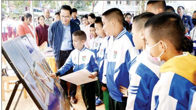
ပြည်ထောင်စုဝန်ကြီး ဦးမောင်မောင်အုန်း စာဖတ်ရိုက်နှံ့ဖြင့် တင်ပို့ပေးသည့် ကျောင်းသားလူငယ်များ ရုပ်ဝံ့ဆက်ပြိုင်ပွဲ ယှဉ်ပြိုင်နေမှုအား ကြည့်ရှုအားပေးစဉ်။

ညောင်တုန်းမြို့ စည်ပင်သာယာမြို့မဈေး၌ မီးဘေးအန္တရာယ်ကြိုတင်ကာကွယ်ရေး အသိပညာပေး ညောင်တုန်း ဇန်နဝါရီ ၂၈ ဧရာဝတီ တိုင်းဒေသကြီး ညောင်တုန်းမြို့နယ် အတွင်းရှိ ဈေးများ မီးဘေးအန္တရာယ်ကင်းဝေးရေးအတွက် မြို့နယ်မီးသတ်ဦးစီးဌာနနှင့် စည်ပင်သာယာရေးအဖွဲ့တို့ ပူးပေါင်း၍ မီးဘေးအန္တရာယ်ကြိုတင်ကာကွယ်ရေး အသိပညာပေး ဟောပြောပွဲနှင့် သရုပ်ပြလေ့ကျင့်ခြင်းကို ယနေ့ မွန်းလုံပိုင်းက စည်ပင်သာယာမြို့မဈေး၌ ဆောင်ရွက်သည်။ ဦးစွာ မြို့နယ်စီမံအုပ်ချုပ်ရေးအဖွဲ့ဥက္ကဋ္ဌ ဦးမျိုးကျော်က အမှာစကားပြောကြားပြီး မြို့နယ်စည်ပင်သာယာရေး ကော်မတီဥက္ကဋ္ဌ ဦးစောလွင်က မီးဘေးအန္တရာယ် ကြိုတင်ကာကွယ်ရေး