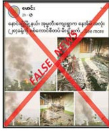
ရေးသား ဖြန့်ဝေနေခြင်းဖြစ်ကြောင်း သတင်းရရှိသည်။ သတင်းစဉ်

နေပြည်တော် ဇန်နဝါရီ ၂၈ - တစ်ဦး၏ ပြောကြားချက်အရ အားပေးမှုမရှိသည့် ကျေးရွာ၊ ရှမ်းပြည်နယ် (မြောက်ပိုင်း) အဆိုပါသတင်းမှာ မှန်ကန်မှုမရှိ ရပ်ကွက်များကို ခေါင်းစဉ်အမျိုးမျိုးတပ်၍ မီးရှို့ဖျက်ဆီးခြင်း၊ နောင်ချိုမြို့နယ် အမှတ်တံဆိပ်က ကြောင်း၊ လုံခြုံရေးတပ်ဖွဲ့ဝင်များ လက်နက်ကြီးများဖြင့် ပစ်ခတ်သည့် ပြည်သူများ၏ အသက်၊ အိုးအိမ်၊ စည်းစိမ်ကို အသက်ပေးခြင်းများ ဆောင်ရွက်လျက်ရှိကြောင်း၊ တရားမဝင်ပြည်ပျက်စီးယာများက လုံခြုံရေးလုပ်ငန်းများကို ဥပဒေမရှိဘဲ အကြမ်းဖက် လုပ်ရပ်များကို နှင့်အညီ ဆောင်ရွက်လျက်ရှိသမားများ၏ လုပ်ရပ်များကို ကြောင်း၊ အကြမ်းဖက်သမားများကသာ ပြည်သူလူထု၏ ဖုံးကွယ်ရန်နှင့် လုံခြုံရေးတပ်ဖွဲ့ဝင်များအပေါ် ပြည်သူများ အထင်အမြင်လွှဲမှားစေရန် ရည်ရွယ်၍ အဆိုပါသတင်းနှင့်ပတ်သက် အသက်၊ အိုးအိမ်၊ စည်းစိမ်ကို ဤနယ်မြေခံလုံခြုံရေးတာဝန်ရှိသူ မငဲ့ကွက်ဘဲ ၎င်းတို့အား ထောက်ခံ ယခုကဲ့သို့ မဟုတ်မမှန် လုပ်ကြ