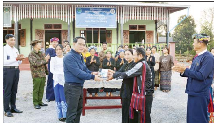
ပြည်ထောင်စုဝန်ကြီး ဦးမောင်မောင်အုန်း ပအိုဝ်းကိုယ်ပိုင်အုပ်ချုပ်ခွင့်ရဒေသ အောင်သာယာကျေးရွာရှိ အောင်သာယာစာကြည့်တိုက်သို့ စာအုပ်စာစောင်များ ပေးအပ်လှူဒါန်းစဉ်။

မွန်းလုံပိုင်းတွင် ပြည်ထောင်စုဝန်ကြီးတော်ကြီး တောင်ကြီး တက္ကသိုလ်၌ ကျောင်းသားကျောင်းသူများနှင့် တွေ့ဆုံသည်။ ရှေးဦးစွာ “တားဆီးကာကွယ်မီဒီယာအဆိပ်သင့်အန္တရာယ်” နှင့် “အားကစား မြှင့်တင်ခြင်းသည် နိုင်ငံတော်ကိုကာကွယ်စောင့်ရှောက်နေခြင်းဖြစ်ပါသည်” Video Clip တို့ကို ပြသသည်။ ဆွေးနွေးမှာကြား ယင်းနောက် ပြည်ထောင်စုဝန်ကြီးက မသမာသူများက သတင်းတု၊ သတင်းမှား ထုတ်လွှင့်၍ ပြည်သူများအား အတွေးအမြင် လွှဲမှားအောင် ဆောင်ရွက်နေကြပါကြောင်း၊ လူငယ်များအနေဖြင့် သတင်းမှားများကို မယုံကြည်ဘဲ မှန်ကန်စွာ ဝေဖန်ပိုင်းခြားတတ်ရန် လိုအပ်ကြောင်း၊ လူငယ်များသည် နိုင်ငံတော်၏ အနာဂတ်အတွက် အားကိုးအားထားရသည့် လူရွေးအရင်းအမြစ်များ ဖြစ်သဖြင့် စာဖတ်စွမ်းရည်လေး အသိအမြင်တိုးပွားအောင် ဆောင်ရွက်ကြစေ လိုကြောင်း ဆွေးနွေးမှာကြားသည်။