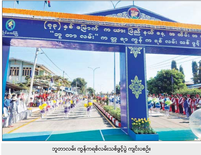
ဘူတာလမ်း ကွန်ကရစ်လမ်းသစ်ဖွင့်ပွဲ ကျင်းပစဉ်။

“ ကယားပြည်နယ် အစိုးရအဖွဲ့အနေ ဖြင့် ဝန်ထမ်းအိမ်ရာများကို ဗဟိုအခြေ အနေထက် သာလွန်ကောင်းမွန်အောင် ပြုပြင်ပေးထားကြောင်း တွေ့ရှိရ ၎င်းဝန်ထမ်း အိမ်ရာများသည်လည်း အကြမ်းဖက်ဖြစ်စဉ်များကြောင့် ထိခိုက် ပျက်စီးမှုဖြစ်ပေါ်ခဲ့ရာ အမြန်ဆုံး ပြန်လည်ပြုပြင်၍ ပြီးသမျှအိမ်ရာများ ၌ စနစ်တကျ နေရာချထားပေးခဲ့”