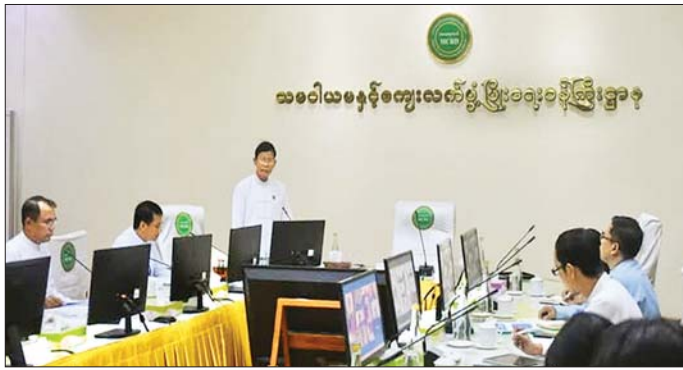
ပြိုင်ပွဲကျင်းပရေး၊ ဆုရွေးချယ်ရေးနှင့် ဆုချီးမြှင့်ရေး ဆက်စပ်ဖတ်မတီထွင်မှု သမဝါယမနှင့် ကျေးလက်ဖွံ့ဖြိုးရေး ဝန်ကြီးဌာန ဒုတိယဝန်ကြီး ဦးမြင့်စိုး ဆက်စပ်ဖတ်ပထမအကြိမ် အစည်းအဝေးတွင် အမှာစကားပြောကြားစဉ်။

ဖြေ။ ။ ပြိုင်ပွဲကျင်းပရေး၊ ဆုရွေးချယ်ရေးနဲ့ ဆုချီးမြှင့်ရေး ဆက်စပ်ဖတ်ကို အဖွဲ့ဝင် ၁၁ ဦးနဲ့ ဖွဲ့စည်းဆောင်ရွက်ထားပါတယ်။ ဒီအဖွဲ့မှာ သမဝါယမနှင့် ကျေးလက်ဖွံ့ဖြိုးရေးဝန်ကြီးဌာန ဒုတိယဝန်ကြီး ဦးမြင့်စိုးက ဥက္ကဋ္ဌအဖြစ် တာဝန်ယူ ပြီးတော့ အသေးစားစက်မှု လက်မှုလုပ်ငန်းဦးစီးဌာန၊ မူပိုင်ခွင့်ဦးစီးဌာန၊ သုတေသနနှင့် တီထွင်ဆန်းသစ်မှု