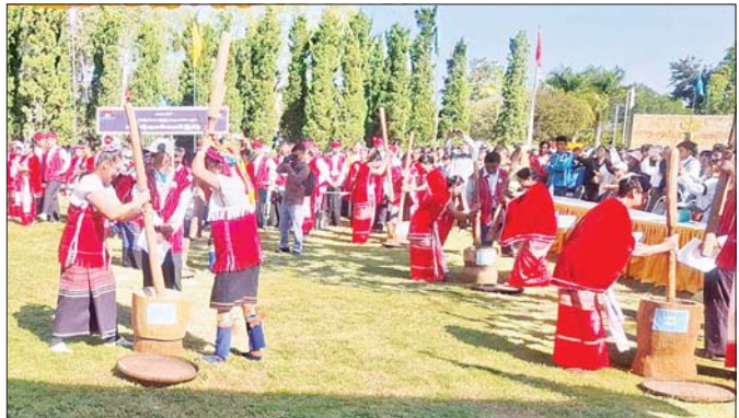
ကယားရိုးရာ စပါးထောင်းပြိုင်ပွဲ ကျင်းပနေစဉ်။

ယင်းသို့ ဆောင်ရွက်ခဲ့ရာမှ အကြမ်းဖက် တိုက်ခိုက်မှုဖြစ်စဉ်များဖြစ်ပွားပြီးနောက် လှိုင်ကော် မြို့နယ်အတွင်း၌ လောလေးတိုက်နယ်ဆေးရုံ စာမျက်နှာ ၁၁ သို့