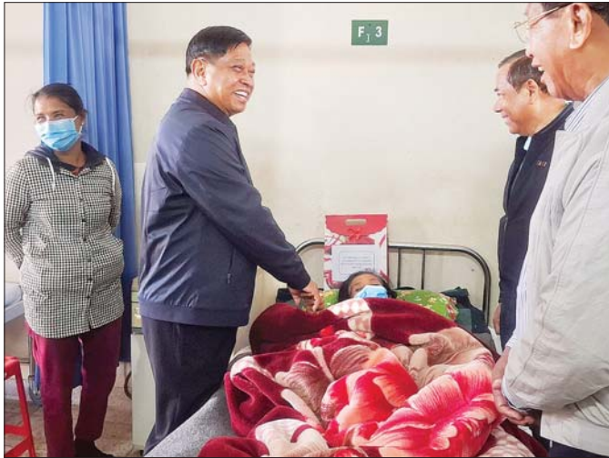
နိုင်ငံတော်စီမံအုပ်ချုပ်ရေးကောင်စီအဖွဲ့ဝင် ဒုတိယဝန်ကြီးချုပ်နှင့် နိုင်ငံတော်ဝန်ကြီးချုပ်ရုံး၊ ပြည်ထောင်စု ဝန်ကြီး ဗိုလ်ချုပ်ကြီးတင်အောင်စန်း၊ လှိုင်ကော်ပြည်သူ့ဆေးရုံကြီး၌ ဆေးကုသနေသည့် သားသစ် ၁၄ ဦး ထွန်းကားခဲ့သော ဒေါ်ညိုအား တွေ့ဆုံအားပေးစကားပြောကြားစဉ်။

ထူးခြားသည့် အခြားပြိုင်ပွဲတစ်ခုမှာ ကယား ရိုးရာ ချောတိုင်တက်ပွဲဖြစ်သည်။ ကျွန်တော်တို့ ဆီမှာလဲ ဝါးတုံးဝါးကို ဆီထည့်၍ ချောတိုင်လုပ်ထား