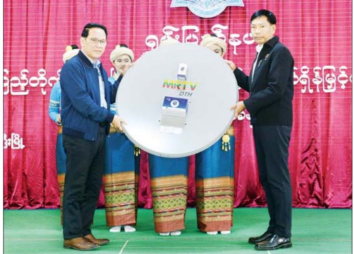
ပြည်ထောင်စုဝန်ကြီး ဦးမောင်မောင်အုန်း ရှမ်းပြည်နယ်အစိုးရအဖွဲ့အတွက် DTH စလောင်းအစုံ ၁၀၀ နှင့် DVB T2 Set Top Box အလုံး ၁၀၀ ပေးအပ်စဉ်။

လှူဒါန်းရာ ပြည်နယ်ပညာရေးမှူးတို့က လက်ခံရယူသည်။ ထို့နောက် ရှမ်းပြည်နယ် စာကြည့်တိုက်များ ဖွံ့ဖြိုးတိုးတက်ရေး ပူးပေါင်းဆောင်ရွက်မှု ကော်မတီနာယက ပြည်နယ်ဝန်ကြီးချုပ်က စာဖတ်ရိုက်မြှင့်တင်ရေး လှုပ်ရှားမှုများကို နိုင်ငံတော်က အားပေးဆောင်ရွက်လျက်ရှိကြောင်း၊ ရှမ်းပြည်နယ်တွင် စာဖတ်ရိုက်မြှင့်တင်ရေးပွဲတော်များ ကျင်းပလျက်ရှိရာ ယခုပွဲတော်သည် (၁၃) ကြိမ်မြောက် ကျင်းပခြင်းဖြစ်ပြီး ခရိုင်နှင့်မြို့နယ်များတွင် စဉ်ဆက်မပြတ် ဆက်လက်ကျင်းပသွားမည်ဖြစ်ပါကြောင်း။