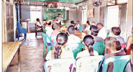
ဝေကြည်(ပြန်/ဆက်)