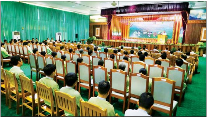
တောမီးကြိုခံနိုင်ခြင်း၊ နိုင်ငံအဆင့် နယ်စပ်ဖြတ်ကျော် တောမီးနှင့်မီးခိုးမြှင့်တင်မှုထိန်းချုပ်နိုင်ရေးအတွက် မြန်မာနိုင်ငံအနေဖြင့် ထိုင်း၊ လာအို၊ တရုတ်ပြည်သူ့သမ္မတနိုင်ငံများနှင့် ပူးပေါင်းဆောင်ရွက်

နေပြည်တော် ဇန်နဝါရီ ၂၀ တောမီးကြိုခံနိုင်ခြင်း၊ ဒေသခံများ၏ လူမှုစီးပွားနှင့် ဈေးကွက်ချိတ်ဆက်ခြင်းဆိုင်ရာ စွမ်းဆောင်ရည်မြှင့်တင်ခြင်းစီမံကိန်း၏ ကနဦးအလုပ်ရုံဆွေးနွေးပွဲ ဖွင့်ပွဲအခမ်းအနားကို ယနေ့နံနက်ပိုင်းတွင် နေပြည်တော်ရှိ သစ်တောဦးစီးဌာန အင်ကြင်းခန်းမ၌ ကျင်းပရာ သယံဇာတနှင့်သဘာဝပတ်ဝန်းကျင် ထိန်းသိမ်းရေးဝန်ကြီးဌာန ပြည်ထောင်စုဝန်ကြီးဦးအောင်မောင်ရီ၊ ဒုတိယဝန်ကြီး ဦးမင်းသူ၊ အမြဲတမ်းအတွင်းဝန်နှင့် ဌာနဆိုင်ရာအကြီးအကဲများ၊ ဆက်စပ်ဌာနများမှ ကိုယ်စားလှယ်များနှင့် တာဝန်ရှိသူများ တက်ရောက်ကြသည်။