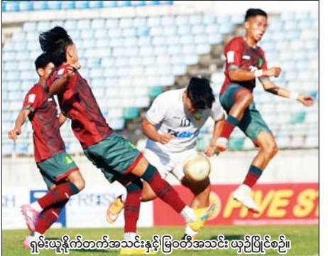
ရှမ်းထူးနိုင်တတ်အသင်းနှင့် မြဝတီအသင်း ယှဉ်ပြိုင်စဉ်။

MNL ပြိုင်ပွဲတွင် ဦးဆောင်နေသည့် လက်ရှိချန်ပီယံ ရှမ်းယူနိုက်တက်အသင်း ဂိုးပြတ်နိုင်ပွဲရယူ ရန်ကုန် ဇန်နဝါရီ ၂၆ ယူနိုက်တက်အသင်းသည် ဂိုးပြတ်နိုင်ပွဲ ၂၀၂၄-၂၀၂၅ ရာသီ MNL အမှတ်ပေးပြိုင်ပွဲပွဲစဉ်(၁၇) တတိယနေ့ကို ဇန်နဝါရီ ၂၆ ရက် က သုဝဏ္ဏကွင်း၌ ကျင်းပရာ လက်ရှိချန်ပီယံ ရှမ်းယူနိုက်တက်အသင်းက မြဝတီအသင်းကို ငါးဂိုး-တစ်ဂိုးဖြင့် အနိုင်ရရှိသည်။ ဇယားထိပ်ဆုံးတွင် အမှတ်ပြတ် ဦးဆောင်နေသည့် လက်ရှိချန်ပီယံ ရှမ်း စာမျက်နှာ ၁၁ ကော်လံ ၁ ၀