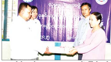
နာရေးစရိတ်ငွေကျပ် ၉၉၀၀၀၀ စုစုပေါင်းငွေကျပ် ၁၀၈ သိန်း ၉ သောင်းကို ကျန်ရစ်သူမိသားစု ထံ ပေးအပ်ခဲ့ကြောင်း သိရ သည်။ ခရိုင်(ပြန်/ဆက်)