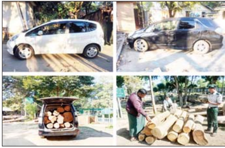
ပဲခူးတိုင်းဒေသကြီး၌ ဖမ်းဆီးရမိမှု။

ယင်းအပြင် ဇန်နဝါရီ ၂၅ ရက်တွင် အကောက်ခွန်ဦးစီးဌာန၏ စီမံခန့်ခွဲမှုဖြင့် တာဝန်ကျပူးပေါင်းအဖွဲ့များက စစ်ဆေးမှုများ ဆောင်ရွက်