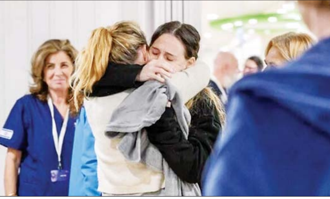
ရာမက်ဂန်မြို့ ရှိဘာဆေးဘက်ဆိုင်ရာစင်တာ၌ ဟားမားစ်တို့ ပြန်လွှတ်ပေးသည့် စားစာခံတစ်ဦးအား ဇန်နဝါရီ ၂၄ ရက်က တွေ့ရစဉ်။

ယခုတစ်ကြိမ် စားစာခံများ ပြန်လွှတ်ပေးခြင်းသည် လက်ရှိ ဂါဇာကမ်းခြေခံသော အပစ် အခတ်ရပ်စဲရေး သဘောတူညီ ချက်အရ ဒုတိယအကြိမ်မြောက် စားစာခံများ ပြန်လွှတ်ပေးခြင်း ဖြစ်သည်။ ဟားမားစ် အုပ်စုသည်