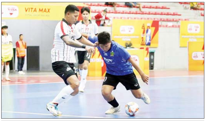
လက်ရှိချန်ပီယံ VUC အသင်းနှင့် ဖူဆယ်ချစ်သူအသင်း ယှဉ်ပြိုင်နေစဉ်။

ရန်ကုန် ဇန်နဝါရီ ၂၆ ၂၀၂၄ - ၂၀၂၅ ရာသီ MFF ဖူဆယ် လိဂ်-၁ ပြိုင်ပွဲ ပွဲစဉ် (၇) ကို ဇန်နဝါရီ ၂၆ ရက်က ရန်ကုန်မြို့ သုဝဏ္ဏဘေးလုံးကွင်းရှိ MFF ဖူဆယ်အားကစားရုံ၌ကျင်းပရာ MIU အသင်း သရေပွဲကြောင့် ထိပ် ဆုံးနေရာအတွက် အပြိုင်ဖြစ်လာ သည်။