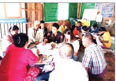
အိမ်ပြင်ပဗွတ်ကုန်းသော မီးများကို နေ့အလင်းရောင်ရှိချိန်တွင် ပိတ်ထားခြင်းဖြင့် လျှပ်စစ်ကို ချွေတာပါ

ချောင်းဆုံ ဇန်နဝါရီ ၂၆ မွန်ပြည်နယ် ချောင်းဆုံမြို့နယ်အတွင်း ၂၀၂၂ ခုနှစ်တွင် ကောက်ယူပြီးစီးခဲ့သည့် မြေပြင်လူဦးရေစာရင်းများကို လူဝင်မှုကြီးကြပ်ရေးနှင့် ပြည်သူ့အင်အားဝန်ကြီးဌာန မြို့နယ်ဦးစီးမှူးရုံးနှင့် ရပ်ကွက်ကျေးရွာအုပ်စု မြေပြင်ကွင်းဆင်းလူဦးရေစာရင်း ကောက်ယူရေးကြီးကြပ်မှုကော်မတီတို့ ပူးပေါင်းကာ မြေပြင်ကွင်းဆင်းအတည်ပြု စစ်ဆေးခြင်းကို ဇန်နဝါရီ ၂၄ ရက်က ကျေးရွာခြောက်ရွာတွင် ဆောင်ရွက်သည်။