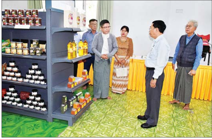
နေပြည်တော်ကောင်စီဥက္ကဋ္ဌ ဦးသန်းထွန်းဦး နေပြည်တော်ကိုယ်စားပြု ဒေသထွက် MSME ထုတ်ကုန်ပစ္စည်းများ ခင်းကျင်းပြသထားမှုကို ကြည့်ရှုအားပေးစဉ်။

ထိုနေ့က ပြည်နယ်ဝန်ကြီးချုပ် အမျိုးပြုသော ပြည်နယ်အစိုးရအဖွဲ့ဝင်များ၊ ဌာနဆိုင်ရာများ၊ ဘားအံမြို့ပေါ်ရှိ ဒါယကာ၊ ဒါယိကာမများနှင့် ဧည့်ပရိသတ်အပေါင်းတို့က အမိတာရာမရကျောင်းတိုက် ဆရာတော်အမျိုးပြုသော ဆရာတော်၊ သံဃာတော်၊ သီလရှင် စုစုပေါင်း ၁၀၈ ပါးတို့အား ဆန်၊ ဆီ၊ ဆေး၊ ဆား အစရှိသော လှူဖွယ်ပစ္စည်းများကို လောင်းလှူခဲ့ကြပြီး အခမ်းအနားကို ရုပ်သိမ်းခဲ့ကြောင်း သိရသည်။ ခရိုင်(ပြန်/ဆက်)