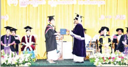
Science (B.C.Sc.) ၅၃ ဦး၊ Technology (B.C.Tech.) ရှစ်ဦး ကွန်ပျူတာ နည်းပညာဘွဲ့ တို့အား ဘွဲ့လက်မှတ်များ ချီးမြှင့် အပ်နှင်းပြီးနောက် ပါမောက္ခချုပ်

သထုံ ဇန်နဝါရီ ၂၆ မွန်ပြည်နယ် သထုံမြို့နယ်ရှိ ကွန်ပျူတာတက္ကသိုလ်(သထုံ)၏ (၁၄)ကြိမ်မြောက် ဘွဲ့နှင်းသဘင် အခမ်းအနားကို ဇန်နဝါရီ ၂၅ ရက် နံနက်က တက္ကသိုလ်ဘွဲ့နှင်း သဘင်ခန်းမ၌ ကျင်းပသည်။ အခမ်းအနားတွင် ကွန်ပျူတာ တက္ကသိုလ်(သထုံ) ပါမောက္ခချုပ် ဒေါက်တာနီလာသိန်းနှင့် ပညာရေးအဖွဲ့ဝင်များက ကွန်ပျူတာ သိပ္ပံဘွဲ့ Bachelor of Computer