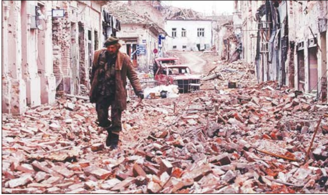
၁၉၉၁ ခုနှစ်တွင် ပြည်တွင်းစစ် စတင်ဖြစ်ပွားခဲ့မှုကြောင့် ပျက်စီးခဲ့ရသည့် ခရိုအေးရှားနိုင်ငံ ဗူကိုဗာ (Vukovar) မြို့။

ယူဂိုဆလားဗီးယားနိုင်ငံကို မာရှယ်တီတိုးက ဒုတိယကမ္ဘာစစ်ပြီးစ ၁၉၄၅ ခုနှစ် နိုဝင်ဘာလ ၂၉ ရက်နေ့တွင် စတင်တည်ထောင်ခဲ့သည်။ ယူဂိုဆလားဗီးယားသည် ဧရိယာစတုရန်းမိုင် ၉၈၇၆၆ ရှိပြီး ထိုစဉ်က လူဦးရေ ၁၇ သန်းကျော်မျှသာရှိသည်။ သို့သော် ပြည်နယ်နှင့် လူမျိုးအလိုက် ကွဲပြားခြားနားမှုများရှိသောကြောင့် ဒေသနယ်ပယ်အစွဲရှိကြသော တိုင်းရင်းသားလူမျိုးများ၏ ဆန္ဒနှင့်အညီ ကိုယ်ပိုင် အုပ်ချုပ်ရေး ပြည်သူ့သမ္မတနိုင်ငံ ခြောက်နိုင်ငံ ထူထောင်ရန် မာရှယ်တီတိုးက လက်ခံသဘောတူခဲ့သည်။