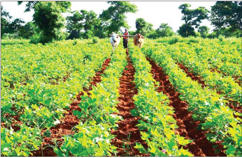
မိတ္ထီလာမြို့နယ်ရှိ ဝါသီးနှံစိုက်ခင်းတစ်ခုကို တွေ့ရစဉ်။

အယ်လ်နီညို ရာသီဥတုကြောင့် မြန်မာနိုင်ငံ ဝါစိုက်ပျိုးထုတ်လုပ်မှုကဏ္ဍကို သက်ရောက်မှု ကမ္ဘာ့ရာသီဥတုသည် အယ်လ်နီညိုနှင့် ရာသီဥတု ဖောက်ပြန်ပြောင်းလဲမှုတို့ကြောင့် ပူနွေးလာလျက်ရှိပြီး စိုက်ပျိုးထုတ်လုပ်မှုကဏ္ဍကို ရိုက်ခတ်လျက်ရှိသကဲ့သို့ ဝါစိုက်ပျိုးထုတ်လုပ်မှုကဏ္ဍကိုပါ သက်ရောက်နေပါသည်။ အယ်လ်နီညိုအားကောင်းမှုက စိုက်ပျိုးရေးအပေါ် သက်ရောက်မှုများစွာ ဖြစ်ပေါ်စေပြီး စားနပ်ရိက္ခာထောက်ပံ့မှု ကွင်းဆက်ကို နှောင့်ယှက်ဟန့်တားမှုများနှင့် နိုင်ငံ