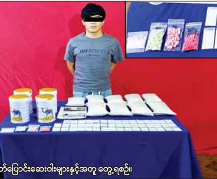
မြစ်မှုကျူးလွန်သူများကို သိမ်းဆည်းရမိသည့် စိတ်ပြောင်းဆေးဝါးများနှင့်အတူ တွေ့ရစဉ်။

နေပြည်တော် ဇန်နဝါရီ ၂၆ မန္တလေးတိုင်းဒေသကြီး မဟာအောင်မြေမြို့နယ်၌ ငွေကျပ် ၁ ဒသမ ၄ ဘီလီယံကျော်တန်ဖိုးရှိ မူးယစ်ဆေးဝါးများ ဖမ်းဆီးရမိကြောင်း မြန်မာနိုင်ငံရဲတပ်ဖွဲ့မှ သိရသည်။ ဖြစ်စဉ်မှာ မူးယစ်ဆေးဝါးတားဆီးနှိမ်နင်းရေးရဲတပ်ဖွဲ့မှ တပ်ဖွဲ့ဝင်များ ပါဝင်သော ပူးပေါင်းအဖွဲ့သည် ဇန်နဝါရီ ၂၃ ရက် မွန်းလွဲ ၃ နာရီတွင် မဟာအောင်မြေမြို့နယ် မဟာမြိုင်(၁) ရပ်ကွက်၊ ၆၈ လမ်း၊ ၄၀x၄၀ လမ်းကြားရှိ ဖူရီပွ(၃၁)နှစ်၊ (၁)ဦးဖာချင်း၏ နေအိမ်ကိုရှာဖွေရာ စိတ်ပြောင်းဆေးဝါး Happy Water ၃ ကီလို သိမ်းဆည်းရမိခဲ့ပြီး ကွင်းဆက် စစ်ဆေးဖော်ထုတ်ချက်အရ ယင်းနေ့ ညနေ ၅ နာရီတွင် မဟာအောင်မြေမြို့နယ် မဟာမြိုင်(၁) ရပ်ကွက် ၄၂ လမ်းနှင့် ၆၇(A) လမ်းထောင့်ရှိ နေအိမ်တွင် မူးယစ်ဆေးဝါးများ ဖြန့်ဖြူးရောင်းချသူ စာမျက်နှာ ၁၀ ကော်လံ ၁ ❖