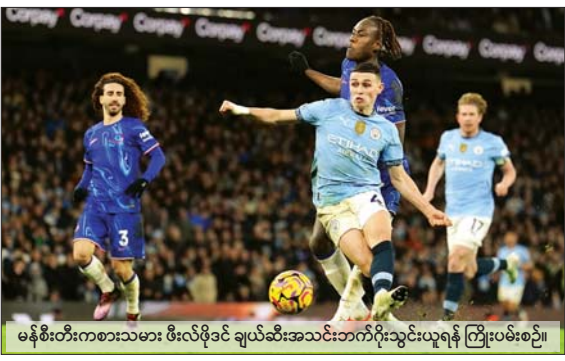
မန်စီးတီးကစားသမား ဖီးလ်ဗိုဒင် ချယ်ဆီးအသင်းဘက်ဂိုးသွင်းယူရန် ကြိုးပမ်းစဉ်။

မန်စီးတီးက တိုက်စစ်ခြေစွမ်းပြကာ ချယ်ဆီးကို သုံးဂိုး-တစ်ဂိုးဖြင့် နိုင်ပွဲရ ပရီမီယာလိဂ်ပွဲစဉ် (၂၃) မှ အကောင်းဆုံးပွဲစဉ်တစ်ပွဲဖြစ်သည့် မန်စီးတီးနှင့် ချယ်ဆီးအသင်းပွဲစဉ်ကို ဇန်နဝါရီ ၂၆ ရက် နံနက်အစောပိုင်းက အီတလီကွင်း၌ ယှဉ်ပြိုင်ကစားခဲ့ရာ မန်စီးတီးအသင်းက တိုက်စစ်ခြေစွမ်းပြကာ သုံးဂိုး-တစ်ဂိုးဖြင့် နိုင်ပွဲရရှိခဲ့သည်။ ချယ်ဆီးအသင်းသည် ပွဲအစ သုံးမိနစ်တွင် မာဒူဂီ၏ သွင်းဂိုးဖြင့် မန်စီးတီးအသင်းကို ဦးဆောင်ထားနိုင်ခဲ့သော်လည်း နောက်ပိုင်းပွဲချိန်များတွင် ကစားအားကျလာကာ ပြိုင်ဘက်အသင်း၏ တရစပ်ထိုးဖောက် စာမျက်နှာ ၁၁ ကော်လံ ၅ ❖