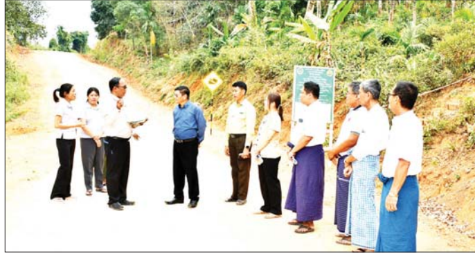
သည့် စခန်းသစ်-ဝါးအော်-သဲအော်ကျေးရွာချင်း ဝါးအော် ကျောက်ချောလမ်း ရန်ပုံငွေဖြင့် ဆောင်ရွက် ဆက်လမ်း မိုင်တိုင်အမှတ် (၁/၁) မိုင်မှ (၁/၇)မိုင် အကြား (၀/၆) မိုင်ကို အကျယ် ၁၂ ပေ၊ ၃ မြောက်လက်မ ကွန်ကရစ်လမ်းခင်းခြင်းလုပ်ငန်းနှင့် စခန်းသစ်- ဦးထူး(ပြန်/ဆက်)

ကျေးရွာဖွံ့ဖြိုးရေးလုပ်ငန်းများအတွက် ပံ့ပိုးငွေများ ပေးအပ်သည်။ ထို့နောက် တိုင်းဒေသကြီးဝန်ကြီးနှင့် အဖွဲ့ဝင်များသည် ကျေးလက်လမ်းဖွံ့ဖြိုးရေးဦးစီးဌာနက စခန်းသစ်-ဝါးအော် ကျေးရွာချင်းဆက် (၁/၄)မိုင်ကို ၂၀၂၄-၂၀၂၅ ဘဏ္ဍာနှစ် ရန်ပုံငွေ ၂၀၈ ဒသမ ၀၆၅ သန်းဖြင့် ဆောင်ရွက်သည့် အကျယ် ၁၄ ပေ၊ ၃ မြောက်လက်မ ကျောက်ချောလမ်းကို ကြည့်ရှု စစ်ဆေးသည်။ ယင်းနောက် ဝါးအော်ကျေးရွာ မူလတန်းလွန်ကျောင်းသို့ ရောက်ရှိပြီး ကျောင်းအုပ်ကြီးနှင့် ဆရာ ဆရာမများအား တွေ့ဆုံ ကျောင်းအတွက် လိုအပ်သည်များကို ပံ့ပိုးဆောင်ရွက်ပေးသည်။ ထိုမှတစ်ဆင့် ကျေးလက်လမ်းဖွံ့ဖြိုးရေးဦးစီးဌာန၏ ရန်ပုံငွေ ၃၈၄ ဒသမ ၁၂၀ သန်းဖြင့် ဆောင်ရွက်