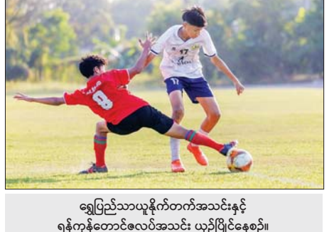
ရွှင်ရယ်သာယာယူနိုက်တက်အသင်းနှင့် ရန်ကုန်တောင်ဇလပ်အသင်း ယှဉ်ပြိုင်နေစဉ်။

ရန်ကုန် ဇန်နဝါရီ ၂၆ ၂၀၂၄-၂၀၂၅ ရာသီ MFF ယူ-၁၅ လူငယ်လိဂ်ပြိုင်ပွဲ ပွဲစဉ် (၃) ဒုတိယ နေ့ကို ဇန်နဝါရီ ၂၆ ရက် ညနေပိုင်းက ရန်ကုန်မြို့ရှိ သုဝဏ္ဏလှေကွင်းရေ ကွင်း၌ကျင်းပရာ ရွှင်ရယ်ရန်ကုန်အသင်း သုံးပွဲဆက်အနိုင်ရရှိခဲ့သည်။ ဒုတိယနေ့တွင် ရွှင်ရယ်သာယာယူနိုက်တက်အသင်းက ရန်ကုန် တောင်ဇလပ်အသင်းကို လေးဂိုး-ဂိုးမရှိ၊ ရွှင်ရယ်ရန်ကုန်အသင်းက Mar Rein အသင်းကို နှစ်ဂိုး-ဂိုးမရှိဖြင့် အနိုင်ရရှိသည်။ ပွဲစဉ် (၂) အပြီး နှစ်ပွဲဆက်အနိုင်ရထားသည့်နှစ်သင်း ထိပ်တိုက်တွေ့ ဆုံရာတွင် ရွှင်ရယ် ရန်ကုန်အသင်းအနိုင်ရပြီး ထိပ်ဆုံးသို့ တက်လှမ်းနိုင်ခဲ့သည်။ ပွဲစဉ် (၃) အပြီးတွင် ရွှင်ရယ်ရန်ကုန်အသင်းက ကိုးမှတ်၊ အသာဝတီအသင်း၊ Mar Rein အသင်း၊ Southern Yangon Star အသင်းနှင့် ရွှင်ရယ်သာ ယူနိုက်တက်အသင်းတို့က ခြောက်မှတ်စီ၊ Burmese Youth အသင်းနှင့် မင်္ဂလာဒုံဗီးတီးအသင်းတို့က လေးမှတ်စီ၊ The Honour အသင်းနှင့် ဗြသီတာအသင်း၊ Golden Light United အသင်း၊ Yangon Focus