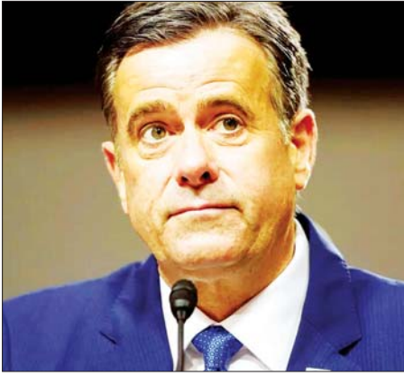
စီအိုင်အေညွှန်ကြားရေးမှူး ဂျွန်ရက်ကလစ်ဖ်။

ဝါရှင်တန် ဇန်နဝါရီ ၂၄ အမျိုးသားထောက်လှမ်းရေးအေဂျင်စီ ညွှန်ကြားရေးမှူးဟောင်း ဂျွန်ရက်ကလစ်ဖ်ကို ဗဟိုထောက်လှမ်းရေးအေဂျင်စီ (စီအိုင်အေ) ၏ ညွှန်ကြားရေးမှူးအဖြစ် ခန့်အပ်ရန် အမေရိကန်အထက်လွှတ်တော်၌ ဇန်နဝါရီ ၂၄ ရက်က မဲပေးခဲ့သည်။ ၎င်းသည် ဒေါ်နယ်ထရမ်၏ ပထမ သမ္မတသက်တမ်းကာလ နောက်ဆုံးရှစ်လတွင် အမျိုးသားထောက်လှမ်းရေးအေဂျင်စီ၏ ညွှန်ကြားရေးမှူးအဖြစ် တာဝန်ထမ်းဆောင်ခဲ့သူလည်းဖြစ်သည်။ ရက်ကလစ်ဖ်သည် ၂၀၁၅ ခုနှစ်မှ ၂၀၂၀ ပြည့်နှစ်အထိ တက္ကဆက်ပြည်နယ်၏ လေးကြိမ်မြောက် ခရိုင်ကွန်ဂရက်လွှတ်တော်အတွက် အမေရိကန်အောက်လွှတ်တော် ကိုယ်စားလှယ်အဖြစ် တာဝန်ထမ်းဆောင်ခဲ့သည်။ ဒီမိုကရက်တစ် အမတ် ၂၁ ဦးသည်လည်း ရက်ကလစ်ဖ်ကို စီအိုင်အေ ညွှန်ကြားရေးမှူးအဖြစ် ခန့်အပ်ရေးမဲပေးရာတွင် ရိုပတ်ဘလီကင် အမတ်များနှင့်အတူ ထောက်ခံမဲပေးခဲ့သည်။ ထရမ်ကွမ်းသစ္စာကျန်ဆိုပြီး နာရီပိုင်းအကြာတွင် ဖလော်ရီဒါမှ အမေရိကန် အထက်လွှတ်တော်အမတ် မာကိုဂျာဘီရိုလိုကို နိုင်ငံခြားရေးဝန်ကြီးအဖြစ် အထက်လွှတ်တော်က တည်တညွတ်တည်း အတည်ပြုခဲ့ကြသည်။ ယင်းသို့အတည်ပြုပြီး သုံးရက်အကြာ ဇန်နဝါရီ ၂၃ ရက်တွင်