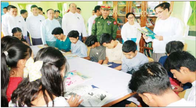
နေကြား ပဲခူးမြို့ စံပြစိုက်ခင်းများနှင့် စားဖို့ဆောင် သီးနှံစိုက်ခင်းများအား သွားရောက်ကြည့်ရှုခဲ့ပြီး ခြံလှောင်မွေးမြူရေးစနစ်များ ပြသသွားရန်၊ ဇေတီ တော်မြတ်ကြီး၏ ရင်ပြင်ပတ်လည်၌ စိမ်းလန်းစိုပြည်

ထို့နောက် တိုင်းဒေသကြီးဝန်ကြီးချုပ်သည် တောင်သူလယ်သမားနေ့ကျင်းပမည့် ပဲခူးမြို့ ရှေးဟောင်းသမိုင်းဝင်ဆုတောင်းပြည့် ကျိုက်ပညာ ယူစေတီတော်မြတ်ကြီးဘေး၌ စပါး၊ ပြောင်း၊