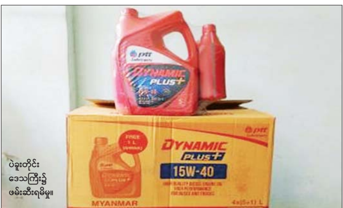
ပဲခူးတိုင်းဒေသကြီး၌ ဖမ်းဆီးရမိမှု။

နေပြည်တော် ဇန်နဝါရီ ၂၄ တရားမဝင်ကုန်သွယ်မှုတိုက်ဖျက်ရေး ဦးဆောင်ကော်မတီ၏ ကြီးကြပ်ကွပ်ကဲမှုဖြင့် တရားမဝင်ကုန်သွယ်မှုများကို ဥပဒေနှင့်အညီ ထိရောက်စွာ တားဆီးအရေးယူနိုင်ရေး ဆောင်ရွက်လျက်ရှိရာ ဇန်နဝါရီ ၂၂ ရက်တွင် နေပြည်တော် တရားမဝင်ကုန်သွယ်မှုတိုက်ဖျက်ရေးအထူးအဖွဲ့၏ စီမံခန့်ခွဲမှုဖြင့် တာဝန်ကျပူးပေါင်းအဖွဲ့များက စစ်ဆေးမှုများ ဆောင်ရွက်ခဲ့ရာ ဥက္ကဋ္ဌရခိုင် ဥက္ကဋ္ဌရခိုင်မြို့နယ်အတွင်း၌ တရားမဝင် အခြားသစ် ၁ ဒဿမ ၉၈၈ တန် (ခန့်မှန်းတန်ဖိုးငွေကျပ် ၁၁၁၁၇၆)ကို ဖမ်းဆီးရမိခဲ့ပြီး သစ်တောဥပဒေနှင့်အညီ အရေးယူဆောင်ရွက်လျက်ရှိသည်။