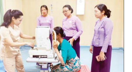
ဆွေနွယ် (ပြန်/ဆက်)

အဆိုပါ မျက်စိခွဲစိတ်ရမည့် လူနာ ၁၀ ဦးအနက် နှစ်ဦးမှာ မျက်စိခွဲစိတ်ရန်အတွက် ရောဂါများပြန်လည်စမ်းသပ်ချိန်တွင် သွေးတိုးနေခြင်းနှင့် ဆီးချိုရောဂါဖြစ်နေသည်ဟု ဆေးစစ်ချက်ပေါ်ထွက်လာသဖြင့် ခွဲစိတ်ခြင်းမပြုရဘဲ ကျန်လူနာ ဂရုစိုက်မှုကုသ ခွဲစိတ်သွားမည်ဖြစ်သဖြင့် ခွဲစိတ်ကုသရမည့် မျက်စိဝေဒနာရှင်များ ဆေးရုံတက်ရောက်နိုင်ရန် မြို့နယ်မိခင်နှင့်ကလေးစောင့်ရှောက်ရေးအဖွဲ့ဝင်များက ပိုင်းဝန်းကူညီဆောင်ရွက်ပေးခဲ့ကြောင်း သိရသည်။