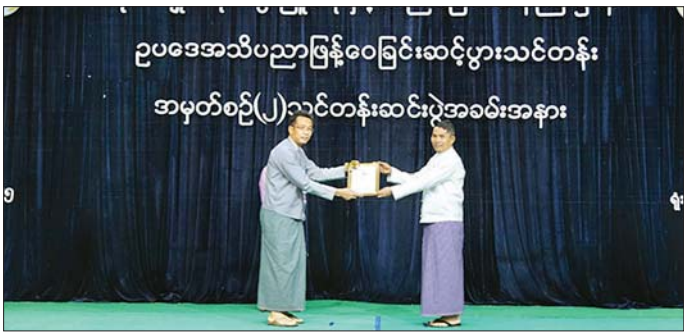
ကိုစွရပ်များမှ ကင်းဝေးစေမည်ဖြစ်သကဲ့သို့ မိမိတို့ လုပ်ငန်းတာဝန်များကို ဥပဒေနှင့်အညီ ယုံကြည်ချက် ခိုင်မာစွာ ဆောင်ရွက်နိုင်မည်ဖြစ်ကြောင်း၊ သင်တန်း ပြီးမြောက် အောင်မြင်သွားကြသည့် သင်တန်းသား သင်တန်းသူများအနေဖြင့် သင်တန်းမှ ရရှိသော ဥပဒေဆိုင်ရာ အသိပညာဗဟုသုတများကို စဉ်ဆက်

နေပြည်တော် ဇန်နဝါရီ ၂၄ စိုက်ပျိုးရေး၊ မွေးမြူရေးနှင့် ဆည်မြောင်းဝန်ကြီးဌာန ဥပဒေအသိပညာဖြန့်ဝေခြင်း ဆင့်ပွားသင်တန်း အမှတ်စဉ် (၂) သင်တန်းဆင်း အောင်လက်မှတ် ပေးအပ်ပွဲ အခမ်းအနားကို ယနေ့နံနက်ပိုင်းက နေပြည်တော် ရုံးအမှတ်(၃၆) စုတေးဆောင်ခန်းမ၌ ကျင်းပရာ ပြည်ထောင်စုဝန်ကြီး ဦးမင်းနေဝင်း၊ ဒုတိယဝန်ကြီးများ၊ ညွှန်ကြားရေးမှူးချုပ်များ၊ ပါမောက္ခချုပ်များ၊ သင်တန်းကြီးကြပ်ဆရာများ၊ သင်တန်းနည်းပြများနှင့် သင်တန်းသား သင်တန်းသူ များ တက်ရောက်ကြသည်။