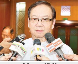
ဒေါက်တာအောင်မြတ်ဦး (ဗဟိုအလုပ်အမှုဆောင်ကော်မတီဝင်၊ ပြည်ထောင်စုကြံ့ခိုင်ရေးနှင့် ဖွံ့ဖြိုးရေးပါတီ)