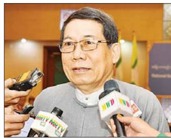
ဒေါက်တာအေးမောင် (ဥက္ကဋ္ဌ ရခိုင်ဦးဆောင်ပါတီ)