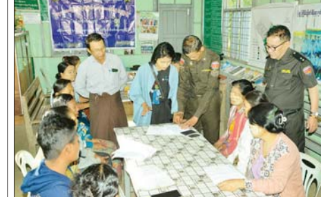
○ ကျော့ဖုံးမှ

ပွဲချိန်ပြည့်ခါနီးတွင် သွင်းယူရရှိခဲ့သော ဖာနန်ဒက်စ်၏ သွင်းဂိုးကြောင့် နိုင်ပွဲရရှိခဲ့ခြင်း ဖြစ်သည်။