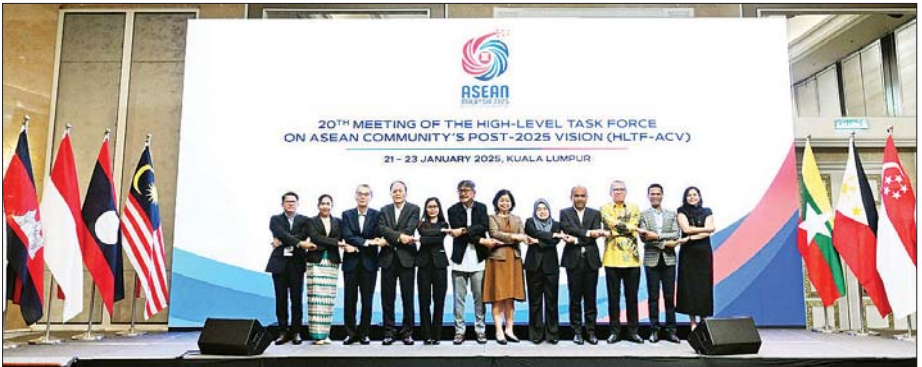
အာဆီယံအသိုက်အဝန်း ၂၀၂၅ ခုနှစ်အလွန် မျှော်မှန်းချက်ရေးဆွဲရေးဆိုင်ရာ အဆင့်မြင့်လုပ်ငန်းအဖွဲ့ဝင် ကိုယ်စားလှယ်များ တက်ရောက်စဉ်။

အစည်းအဝေးတွင် အာဆီယံအသိုက်အဝန်း ၂၀၂၅ ကွာလာလမ်ပူ