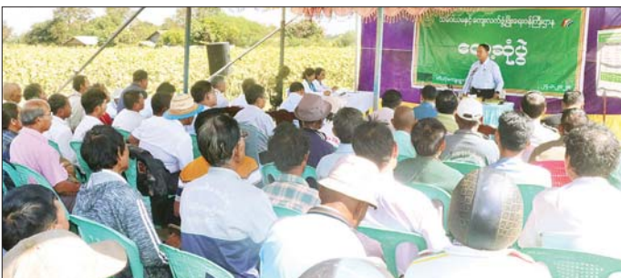
ပိုင် ဆီစက်များမှ ပွဲစားမလိုဘဲ ဒေသပေါက်ဈေးနှုန်းဖြင့် တိုက်ရိုက် ဝယ်ယူ ကြိုတင်ခွဲဝေနိုင်ရေး ချိတ်ဆက်ဆောင်ရွက်ပေးမည်ဖြစ် ကြောင်း၊ တောင်သူများ၏ လူမှု စီးပွားဘဝ မြင့်မားလာစေရေး အတွက် စိုက်ပျိုးရေး၊ မွေးမြူရေး လုပ်ငန်းများ ပိုမိုလုပ်ကိုင်နိုင်ရေး အတွက် တစ်ဦးချင်း ဆောင်ရွက် မြင်းမပြုတ် အမှန်တကယ်လုပ်ငန်း လုပ်ကိုင်လုံခြုံမှု၊ လုပ်ငန်း အမျိုး အစားတူညီသူများ၊ စိတ်တူ ကိုယ်တူ ဆန္ဒတူသူများကို စုပေါင်း ထားရှိမှုကို ကြည့်ရှုစစ်ဆေးကြောင်း သတင်းရရှိသည်။ သတင်းစဉ်

၏ စိုက်ပျိုးခြေစာ ၂၇၀၀ ကျော် အကျိုးပြုပေးနိုင်မည့် ဇီးဖြူကုန်း ကျေးရွာ ကုန်ထုတ်လမ်းတံတား ဖောက်လုပ်နေမှု အခြေအနေ များကို ကြည့်ရှုစစ်ဆေးပြီး ပြည်ထောင်စုဝန်ကြီးက လိုအပ် သည့်များကို ဆွေးနွေးမှာကြား၍ ကျေးရွာနေ ပြည်သူများ၏ တင်ပြချက်များကို ပေါင်းစပ်ညှိနှိုင်း ဆောင်ရွက်ပေးကာ ကုန်ထုတ် လမ်းတံတား ဖောက်လုပ်နေမှုကို ကြည့်ရှုစစ်ဆေးသည်။ ထို့နောက်ရမည်းသင်းမြို့နယ် သစ်ကုန်းကျေးရွာ ယာယီ ရှင်းလင်းဆောင်၍ ရွှေစင်စိုက်ပျိုး ရေးနှင့် အထွေထွေစီးပွားရေး သမဝါယမအသင်း အသင်းအမှု ဆောင်များ၊ ဆီထွက်သီးနှံအောင် ရွက်နေကြပါသည်။