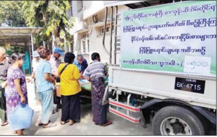
ဘဏ်ခွဲ (သန်လျင်)၌ ရောင်းချဆောင်ရွက်ပေးလျက်ရှိကြောင်း သိရသည်။ ထိုသို့ စားအုန်းဆီများ အိမ်တိုင်ရာရောက် ပြန်ဖြူးရောင်းချပေးရာတွင် နိုင်ငံဝန်ထမ်း

ရန်ကုန်တိုင်းဒေသကြီး စားအုန်းဆီ အိမ်တိုင်ရာရောက်ပြန်ဖြူးရောင်းချရေးကော်မတီ၏ စီစဉ်ကြီးကြပ်မှုဖြင့် ရန်ကုန်တိုင်းဒေသကြီး သန်လျင်မြို့နယ်ရှိ ခရိုင်မြန်မာ့စီးပွားရေးဘဏ် (သန်လျင်) ဘဏ်ခွဲတွင် နိုင်ငံဝန်ထမ်းပင်စင်စား (အငြိမ်းစား)များအား စားအုန်းဆီများ အိမ်တိုင်ရာရောက်ပြန်ဖြူးရောင်းချရေး အစီအစဉ်ကို ဇန်နဝါရီ ၂၃ ရက်မှ စတင်ကာ အဆိုပါ မြန်မာ့စီးပွားရေး