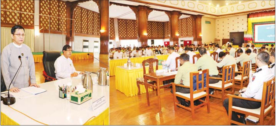
ပြည်ထောင်စုဝန်ကြီး ဦးမြင့်ကျော် ရန်ကုန်တိုင်းဒေသကြီးအတွင်းရှိ တိုင်း၊ ခရိုင်၊ မြို့နယ် မြေပြင်ကွင်းဆင်းစာရင်းကောက်ယူရေး ကြီးကြပ်မှု ကော်မတီဝင်များနှင့် တွေ့ဆုံအမှာစကားပြောကြားစဉ်။

နေပြည်တော် ဇန်နဝါရီ ၂၄ မြေပြင်ကွင်းဆင်းစာရင်းကောက်ယူရေး ကြီးကြပ်မှုကော်မတီဝင်များနှင့် လူဝင်မှုကြီးကြပ်ရေးနှင့် ပြည်သူ့အင်အားဝန်ကြီးဌာန ပြည်ထောင်စုဝန်ကြီး ဦးမြင့်ကျော်သည် ရန်ကုန်တိုင်းဒေသကြီး မြေပြင်ကွင်းဆင်းစာရင်းကောက်ယူရေးကြီးကြပ်မှုကော်မတီဝင်များနှင့် တွေ့ဆုံခဲ့သည်။