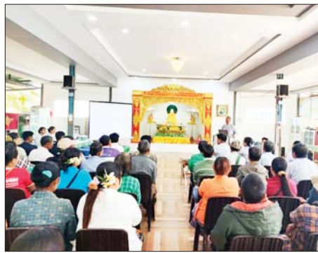
မြူငွေ အန္တရာယ်အကြောင်း သိကောင်းစရာများဖြင့်လည်းကောင်း အသိပညာပေး ဆွေးနွေးကြသည်။

ရန်ကုန် ဇန်နဝါရီ ၂၄ လှည်းကူးမြို့နယ် ရဲမှန်ခေတ်စိစစ်ဌာနမှ ရဲမှန်အုပ်ချုပ်ရေးမှူးရုံး ဓမ္မာရုံ၌ ကျေးရွာနေပြည်သူများအား မီးခိုးမြူငွေအန္တရာယ် အသိပညာ ပေးဟောပြောပွဲကို ဇန်နဝါရီ ၂၃ ရက်က ကျင်းပသည်။