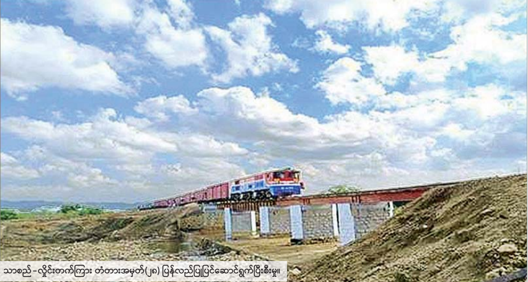
သာစည်-လှိုင်းတက်ကြား တံတားအမှတ်(၂၈) ပြန်လည်ပြုပြင်ဆောင်ရွက်ပြီးစီးမှု။

နေပြည်တော် ဇန်နဝါရီ ၂၄ ၂၀၂၄ ခုနှစ် စက်တင်ဘာလအတွင်း ကြိုတွေ့ခဲ့ရ သည့် ရာဂီစူပါတိုင်းဖွန်းမုန်တိုင်း သဘာဝဘေးဒဏ် ရေကြီးရေလျှံမှုကြောင့် ရန်ကုန်-မန္တလေးလမ်းပိုင်း၊ သာစည်-ရွှေညောင်-တောင်ကြီး လမ်းပိုင်းတို့ရှိ အချို့နေရာများတွင် ရထားလမ်းတာဝင်များ၊ တံတားများပျက်စီးခြင်းနှင့် ကြိုတွေ့ခဲ့သော်လည်း မြန်မာ့စီးရထားအနေဖြင့် လမ်းပိုင်းအလိုက် ပျက်စီးမှု များကို ဦးစားပေး၍ပြုပြင်နိုင်ခဲ့သောကြောင့် ၂၀၂၄ ခုနှစ် အောက်တိုဘာ ၃ ရက်မှစ၍ ရန်ကုန်-မန္တလေး ရထားလမ်းတောက်လျှောက် ပြန်လည်ဖွင့်လှစ်ပြီး လူစီးရထားများနှင့် ကုန်ရထားများကို ပုံမှန်ခရီးစဉ် များအဖြစ် ပြန်လည်ပေးဆွဲနိုင်ခဲ့သည်။ ထို့အတူ သာစည်-ရွှေညောင်လမ်းပိုင်းအတွင်း ပျက်စီးမှုများဖြစ်ပေါ်ခဲ့သည့် လမ်းပိုင်းအလိုက် ဦးစားပေးပြုပြင်နိုင်ခဲ့သဖြင့် ဇန်နဝါရီ ၂၈ ရက်တွင် လမ်းပိုင်းအားလုံး ပြန်လည်ဖွင့်လှစ်ပေးနိုင်မည် ဖြစ်၍ သာစည်-ရွှေညောင်လမ်းပိုင်းတွင် ပြေးဆွဲ ပေးခဲ့သော အမှတ်(၁၄၁)အဆန် သာစည်-ရွှေညောင် စာမျက်နှာ ၅ ကော်လံ ၁ င