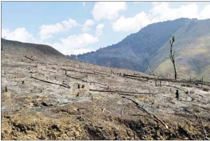
တောင်ယာမီးရှို့ထားသည့် မြန်မာနိုင်ငံ တောင်စောင်းဒေသရှိ နေရာတစ်ခု။

မီးခိုးမြူငွေ့တွေမှာ အလွန်သေးငယ်တဲ့ အချင်း ၂ ဒဿမ ၅၊ ၁၀ တို့ထက်မပိုတဲ့ အမှုန်အမွှားများ (Particulate Matter, PM 2.5 နှင့် PM 10) ကာဗွန်ဒိုင်အောက်ဆိုက်၊ ကာဗွန်မိုနောက်ဆိုက်၊ နိုက်ထရိုဂျင်ဒိုင်အောက်ဆိုက်၊ ဆာလ်ဖာဒိုင်အောက်ဆိုက်၊ မြေပြင်အလွှာအိုဇုန်း၊ ရေငွေ့နဲ့ လေထုကို ညစ်ညမ်းစေနိုင်တဲ့ အခြားဓာတ်ငွေ့များစွာ ရောနှောပါဝင်နေပါတယ်။ မီးခိုးမြူငွေ့တွေဟာ လေထုကိုခတ်မှုလမ်းကြောင်းပေါ် မူတည်ပြီး တစ်နေရာမှ အခြားတစ်နေရာဆီကို အလွယ်တကူ ရွေ့လျားလျှံ့နှံ့ ရောက်ရှိနိုင်ပါတယ်။ ကျေးလက်တွေမှာ ဖြစ်ပေါ်တဲ့ မီးခိုးမြူငွေ့တွေဟာ မြို့ပြတွေကို ရောက်လာနိုင်ပါတယ်။ နယ်စပ်ဒေသတွေမှာဆိုရင် မူလဖြစ်ပေါ်ရာ နိုင်ငံရဲ့ နယ်နိမိတ်ကို ကျော်လွန်ပြီး အခြားနိုင်ငံကိုလည်း ရောက်သွားနိုင်တာကြောင့် နယ်စပ်ပြတ်ကျော် မီးခိုးမြူငွေ့ညစ်ညမ်းမှုများ ဖြစ်ပေါ်လာရပါတယ်။