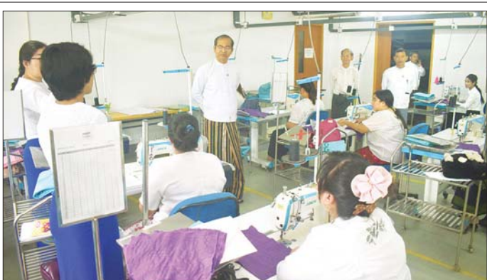
လုပ်ငန်းခွင်ဆက်ဆံရေးကောင်းမွန် ဖြစ်ပြီးဖြင့် လုပ်ငန်းခွင်တည်ငြိမ် အေးချမ်း၍ ကုန်ထုတ်စွမ်းအား တိုးတက်ရေးအတွက် စဉ်ဆက်

စိုက်ပျိုးရေး၊ မွေးမြူရေးနှင့် ဆည် မြောင်းဝန်ကြီးဌာန စိုက်ပျိုးရေး ဦးစီးဌာန၏“သင်ကြားလမ်းညွှန်မှု ဗီဒီယို (Instructional Video) ရိုက် ကူးထုတ်လုပ်ရန်”သင်တန်းဆင်း ပွဲအခမ်းအနားတွင် ဒုတိယဝန်ကြီး က ထိုသို့ပြောကြားခဲ့ခြင်းဖြစ်သည်။ အဆိုပါ သင်တန်းတွင် နည်းပညာပေး ဗီဒီယိုရိုက်ကူး ထုတ်လုပ်ခြင်းနှင့် ကင်မရာအသုံး ပြုနည်း၊ ဒစ်ဂျစ်တယ်ဗီဒီယို တည်းဖြတ်ခြင်း နည်းပညာ၊ နောက်ခံ စကားပြောခြင်းနှင့် တင်ဆက်သူ၏ အခန်းကဏ္ဍ၊ အွန်လိုင်းတွင် လွှင့်တင်ခြင်း၊ လက်တွေ့စာတိညွှန်း ရေးခြင်း တို့ကို သင်ကြားပို့ချခဲ့ကြောင်း သတင်းရရှိသည်။ သတင်းစဉ်