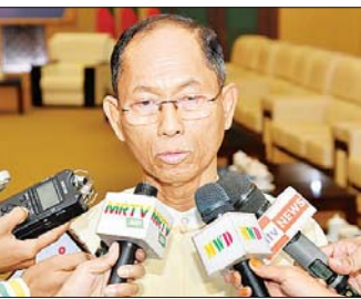
ဦးကိုကိုကြီး (ဥက္ကဋ္ဌ ပြည်သူ့ပါတီ)

နေပြည်တော် ဇန်နဝါရီ ၂၄ အမျိုးသားစည်းလုံးညီညွတ်ရေးနှင့် ငြိမ်းချမ်းရေး ဖော်ဆောင်မှုညှိနှိုင်းရေးကော်မတီနှင့် နိုင်ငံရေးပါတီ များအစုအဖွဲ့၏ အလုပ်အဖွဲ့တို့တွေ့ဆုံဆွေးနွေးပွဲ ကို ဇန်နဝါရီ ၂၄ ရက်အထိ နေပြည်တော်ရှိ အမျိုးသားစည်းလုံးညီညွတ်ရေးနှင့် ငြိမ်းချမ်းရေး ဖော်ဆောင်မှုဗဟိုဌာန၌ ကျင်းပလျက်ရှိရာ နှစ်ဖက် ရင်းနှီးပွင့်လင်းစွာ တွေ့ဆုံဆွေးနွေးပွဲတစ်ဆင့် ရရှိခဲ့ သည့် သဘောတူညီမှုရလဒ်များ၊ နိုင်ငံရေးနည်းလမ်း မှတစ်ဆင့် နိုင်ငံတော်တည်ငြိမ် အေးချမ်းသာယာမှုရရှိရန် လုပ် ဆောင်သင့်သော အစီအမံများနှင့် ဒီမိုကရေစီ နှင့် ဖက်ဒရယ်စနစ်ကိုအခြေခံသည့် ပြည်ထောင်စု တည်ဆောက်နိုင်ရေးဆိုင်ရာများနှင့် စပ်လျဉ်း၍ တက်ရောက်လာကြသူများ၏ စကားသံများကို စုစည်းဖော်ပြလိုက်ရပါသည်။ ဦးကိုကိုကြီး (ဥက္ကဋ္ဌ ပြည်သူ့ပါတီ) နိုင်ငံတစ်နိုင်ငံမှာ အမြင့်ဆုံးဥပဒေက ဖွဲ့စည်းပုံ အခြေခံဥပဒေဖြစ်ပါတယ်။ ဒီဥပဒေရဲ့ သဘောတရား ကလည်း ကျင့်သုံးရင်းနဲ့ လိုအပ်ချက်တွေ အားနည်း ချက်တွေရှိရင် တဖြည်းဖြည်းပြင်ဆင်ပြီးတော့ ကောင်းသတက်ကောင်းအောင် ကြိုးစားကြရတာ ဖြစ်ပါတယ်။ ပြီးမှ လွှတ်တော်သက်တမ်း နှစ်ဆက် အတွင်း ၂၀၂၈ ခုနှစ် ဖွဲ့စည်းပုံအခြေခံဥပဒေ ကျင့်သုံး ပြီးတဲ့အချိန်မှာ လိုအပ်ချက်တွေ အားနည်းချက်တွေ ကို တွေ့ရှိလာရတာတွေရှိပါတယ်။ လက်ရှိနိုင်ငံတော် ရဲ့ အခက်အခဲတွေကို ဖွဲ့စည်းပုံအခြေခံဥပဒေအောက် အတွင်းကနေ ဖြေရှင်းရမယ်ဆိုရင် မဖြစ်မနေ ပြင်ဆင်သင့်တဲ့အချက်တွေကို ဆွေးနွေးကြပါတယ်။