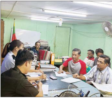
မြို့နယ်(ပြန်/ဆက်)

ရန်ကုန် ဇန်နဝါရီ ၂၀ ရန်ကုန်တိုင်းဒေသကြီး ပန်းဘဲတန်းမြို့နယ် လူဝင်မှုကြီးကြပ်ရေးနှင့် ပြည်သူ့အင်အားဝန်ကြီးဌာန မြို့နယ်ဦးစီးမှူးရုံးမှ ဝန်ထမ်းများက ပန်းခင်းစိမ့်ချက်အဆင့်(၃)ဖြင့် အိမ်ထောင်စုလူဦးရေစာရင်းနှင့် နိုင်ငံသား စိစစ်ရေးကတ်များထုတ်ပေးခြင်းလုပ်ငန်းကို မြို့နယ်အတွင်းရှိ ပြည်သူများအား ကွင်းဆင်းဆောင်ရွက်ပေးလျက်ရှိသည်။(ယာဝုံ) အဆိုပါ ရပ်ကွက်များအလိုက် ကွင်းဆင်းဆောင်ရွက်ရာတွင် ပန်းဘဲတန်းမြို့နယ်ဦးစီးမှူးရုံးရှိ ဝန်ထမ်းများက အမှတ် (၃)ရပ်ကွက် အတွင်းရှိ ပြည်သူများအား လိုအပ်သော သက်သေခံအထောက်အထား များနှင့် စာရွက်စာတမ်းများကိုစိစစ်၍ အိမ်ထောင်စုလူဦးရေစာရင်းနှင့် နိုင်ငံသားစိစစ်ရေးကတ်များကိုလည်း ပြုလုပ်ပေးခဲ့ကြောင်း မြို့နယ် လူဝင်မှုကြီးကြပ်ရေးနှင့်ပြည်သူ့အင်အားဝန်ကြီးဌာန မြို့နယ်ဦးစီးမှူးရုံး ရှိ တာဝန်ရှိသူထံမှ သိရသည်။