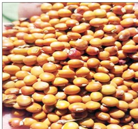
၂၀-၁-၂၀၂၅ ရက်နေ့ တိုင်းဒေသကြီးနှင့် ပြည်နယ် မြို့နယ်အလိုက် ဆန်၊ ဆီ၊ မီးဖိုချောင်သုံးပစ္စည်းများ၊ သားငါးဈေးနှုန်းများ