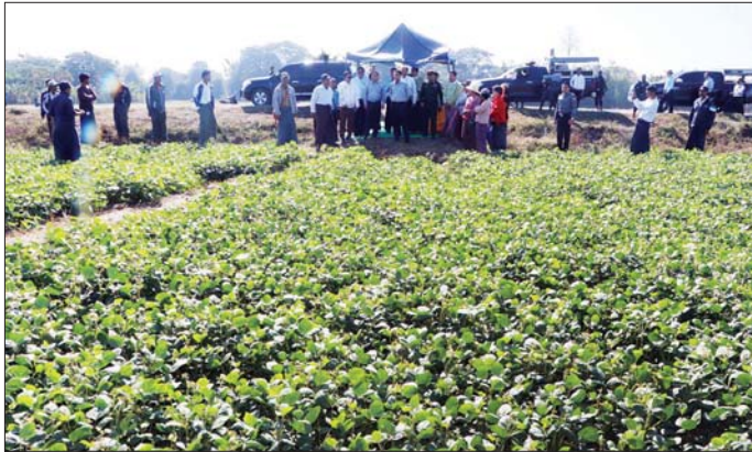
ပေးဒါလက်မှုလုပ်ငန်း ပိုမိုဆန်းသစ်လုပ်ကောင်းမွန် ထို့နောက် ပေးဒါလက်မှုထုတ်ကုန် တန်ဖိုးမြှင့် ထုတ်လုပ်ခြင်းသင်တန်းအတွက် သင်ထောက်ကူ ပစ္စည်းများကို သင်တန်းသူများထံသို့လည်းကောင်း၊

ဦးစွာတိုင်းဒေသကြီးဝန်ကြီးချုပ်က တိုင်းဒေသကြီး အတွင်း ဒေသခံပြည်သူများ၏ လူမှုစီးပွားဘဝများ ဘက်စုံတိုးတက်မြှင့်တင်ပေးရေးအတွက် ဒေသ ထုတ်ကုန်ပစ္စည်းများကိုအခြေခံ၍ ပေးဒါရိုးဖြင့် အရည်အသွေးကောင်းမွန်ပြီး အဆင့်မြင့်ထုတ်ကုန် များ ဆန်းသစ်တီထွင်ကာ ကိုယ်ပိုင်တံဆိပ်ဖြင့် အရည်သွေးကောင်းမွန်သည့် ထုတ်ကုန်များ ထုတ်လုပ် နိုင်ရေးအပြင် ဈေးကွက်ရရှိရေးကိုလည်း ဖော်ဆောင် ပေးသွားမည်ဖြစ်ကြောင်း၊ သင်တန်းသူများအနေဖြင့် မိမိတို့၏ မိသားစုဝင်ငွေတိုးတက်ရရှိရေး၊ ကိုယ်ပိုင် စီးပွားရေးလုပ်ငန်းရှင်သစ်များ ဖြစ်ပေါ်လာစေရေးနှင့်