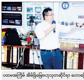
ပထမအကြိမ် အိမ်ခြံမြေဗဟုသုတဆိုင်ရာ ဟောပြောပွဲ ပြုလုပ်စဉ်။

အိမ်ခြံမြေကို ကိုယ်တိုင် နေထိုင်ရန်၊ စီးပွားရေးလုပ်ငန်းများ လုပ်ကိုင်ရန်၊ ဆိုင်ဖွင့်ရန်နှင့် အငှားချထားရန် ရည်ရွယ်ချက် များဖြင့် ဝယ်ယူကြသကဲ့သို့ အရောင်းအဝယ် ပြုလုပ်ရန် ရည်ရွယ်၍ ဝယ်ယူလေ့ရှိကြရာ အရည်အသွေးပိုင်းနှင့် ပတ်သက်၍ ဆောက်လုပ်ပြီး အဆောက်အအုံသစ်အချို့ ယိုင်နဲ့သွားခြင်း ဖြစ်စဉ်များ ရှိခဲ့သည့်အတွက် ကြိုပြိုင်ဝယ်ယူမည့် သူများအနေဖြင့် လေ့လာရန် လိုအပ်ကြောင်း သိရသည်။ “တိုက်ခန်း ဝယ်ယူတဲ့အခါ quality နဲ့ facility တိုက်အရည်အသွေးကို သတိပြုသင့်တယ်။ ကန့်သတ်တိုက်ခန်းကိုပဲ ဝယ်ဝယ်၊ ကွန်ဒိုတိုက်ခန်းကိုပဲ ဝယ်ဝယ် အိမ်က တိုက်ခန်းအရည်အသွေး ဖြစ်ပါတယ်။ ကန့်သတ်တိုက်ခန်း ဆောက်တဲ့ လက်ရာက ဘယ်လိုရှိသလဲ၊ ဆေးသားက ဘယ်လိုရှိသလဲ ဆိုတာတွေကိုပါ ကြည့်ပြီး ဝယ်နိုင်ရင်တော့ အကောင်းဆုံးပဲ။ အချို့ ကန့်သတ်တိုက်ခန်း ပင့်တိုင်မပါဘဲ ဆောက်လုပ်ထားတာလို့