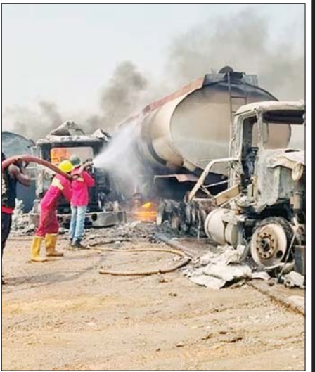
နိုင်ဂျီးရီးယားနိုင်ငံ၌ စက်သုံးဆီတင်ယာဉ်ပေါက်ကွဲမှုကြောင့် လူပေါင်း ၈၀ ကျော်သေဆုံး

ယမန်နှစ် စက်တင်ဘာလတွင် နိုက်ဂျာပြည်နယ် အဝေးပြေးလမ်း ၌ စက်သုံးဆီယာဉ် တစ်စီး ပေါက်ကွဲမှုဖြစ်ပွားရာ လူပေါင်း ၄၉ ဦးထက်မနည်း သေဆုံးမှုဖြစ်ပွားခဲ့သည်။ ဆင်ဟွာ