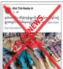
ဝါဒဖြန့်ဝေနေသည်ကို တွေ့ရှိရ သည့်။

နေပြည်တော် ဇန်နဝါရီ ၂၀ - ပဲခူးတိုင်းဒေသကြီး နတ်တလင်း မြို့နယ် ဆီဆုံကုန်းကျေးရွာကို ဇန်နဝါရီ ၁၅ ရက်တွင် လုံခြုံရေး တပ်ဖွဲ့ဝင်များက ဝင်ရောက် စီးနင်းပြီး ပြည်သူ ၁၀ ဦးကျော် ကို ဖမ်းဆီးသတ်ဖြတ်ခဲ့ကြောင်း တရားမဝင် ပြည်ဖျက်မီဒီယာ များက သတင်းတူ၊ သတင်းအမှား များဖြင့် လူမှုကွန်ရက်စာမျက်နှာ များတွင် မဟုတ်မမှန် လှုံ့ဆော်