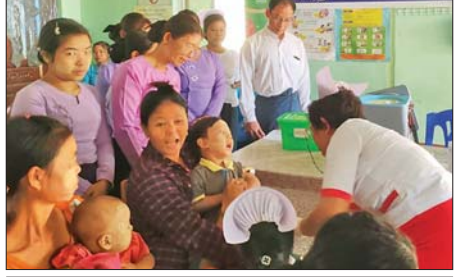
ဥတုရာသီ၊ တောက်မို၏

ငါးနှစ်အရွယ်ကလေးငယ်များကို Big Catch-up နည်းလမ်းဖြင့် ကာကွယ်ဆေးထိုးနှံတိုက်ကျွေးခြင်းလုပ်ငန်းများ ဆောင်ရွက်သည်။ အဆိုပါ အသက်တစ်နှစ်မှ ငါးနှစ်အရွယ်ကလေးငယ်များအား Big Catch-up ကာကွယ်ဆေးထိုးနှံတိုက်ကျွေးခြင်းလုပ်ငန်းများကို ဆက်လက်ဆောင်ရွက်ပေးသွားမည်ပြီး ကာကွယ်ဆေးအားလုံးကို သတ်မှတ်ထားအကြိမ်နှင့် သတ်မှတ်ထားသော အသက်အရွယ်တွင် ဆေးထိုး၊ ဆေးတိုက်ပေးနိုင်မှုသာလျှင် ကလေးငယ်တို့ကို ပြင်းထန်တီတီ ရောဂါ၊ ဆုံဆုံဆုံရောဂါ၊ ကြက်ညှာချောင်းဆိုးရောဂါ၊ မေးခိုင်ရောဂါ၊ အသည်းရောင်အသားဝါ(ဘီ)ရောဂါ၊ ပြင်းထန်အဆုတ်ရောင်ရောဂါ၊ ပိုလီယိုအကြောသေရောဂါ၊ ပြင်းထန်ဝမ်းပျက်ဝမ်းလျှောရောဂါ၊ ဂျပ်နီနော့ကရောင်ရောဂါ၊ ဝက်သက်ရောဂါနှင့် ဂျိုက်သိုးရောဂါတို့မှ ကာကွယ်ပေးနိုင်မည်ဖြစ်ကြောင်းနှင့် ကျိုက်လတ်မြို့နယ်၌ (ပထမအကြိမ်) ကို ဇန်နဝါရီ ၂၀ ရက်မှစတင်ပြီး ဇန်နဝါရီ ၂၆ ရက်အထိ မြို့နယ်အတွင်းရှိ ရပ်ကွက်ကျေးရွာများတွင်လည်း ဆက်လက်ထိုးနှံပေး သွားမည်ဖြစ်ကြောင်း မြို့နယ်ပြည်သူ့ကျန်းမာရေးဦးစီးဌာနမှ သိရ သည်။ (မြို့နယ်(ပြန်/ဆက်))