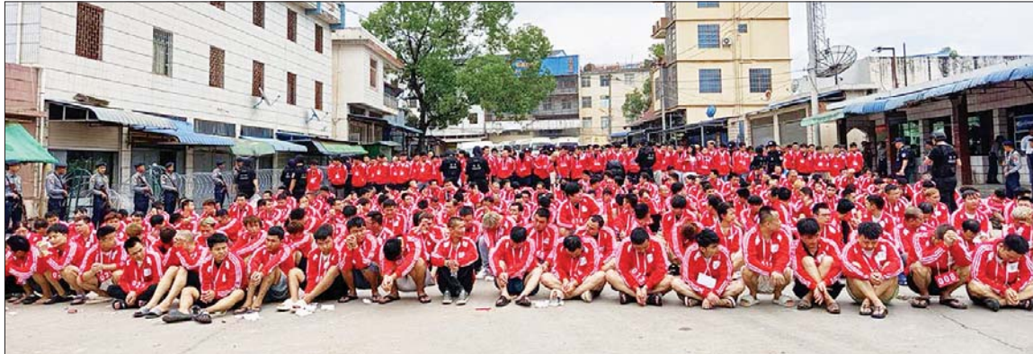
မြန်မာနိုင်ငံအတွင်းသို့ တရားမဝင် ဝင်ရောက်လာပြီး အွန်လိုင်းလောင်းကစားမှုကျူးလွန်နေကြသည့် ပြည်ပနိုင်ငံသားများအား သက်ဆိုင်ရာနိုင်ငံများအလိုက်သို့ ပြန်လည်လွှဲပြောင်း ပေးအပ်စဉ်။

ပထမအကြိမ်ကို ၂၀၂၄ ခုနှစ် မတ် ၂၈ ရက်မှ ၃၁ ရက်အတွင်း ဆောင်ရွက်ခဲ့ခြင်းဖြစ်ပြီး ဒုတိယ အကြိမ်ကို ၂၀၂၄ ခုနှစ် စက်တင် ဘာ ၂၃ ရက်မှ ၂၆ ရက်အတွင်း ဆောင်ရွက်ခဲ့သည်။ အွန်လိုင်း လိမ်လည်မှုများ၊ အွန်လိုင်း လောင်းကစားမှုနှင့် ပတ်သက်၍ လုပ်ဆောင်နေသူ များသည် သာမန်လူများမဟုတ် ကြဘဲ သက်ဆိုင်ရာနိုင်ငံများနှင့် ရာဇဝတ်မှုများဖြစ်ပြီး တိမ်းရှောင် ထွက်ပြေးနေသည့်လောင်းကစား လုပ်နေကြသူများက ဦးဆောင် နေကြခြင်းပင်ဖြစ်ပြီး နိုင်ငံတော် စီမံအုပ်ချုပ်ရေးကောင်စီ သတင်း ထုတ်ပြန်ရေးအဖွဲ့၏ ထုတ်ပြန်မှု တိုင်းရင်းသား လက်နက်ကိုင် အဖွဲ့အစည်းအချို့ အပါအဝင် လက်နက်ကိုင် အဖွဲ့အစည်းများ၊ ဆက်စပ်နေရာများမှ ယိုယွင်းမှု စီးပွားရှာသူများနှင့် ပူးပေါင်းကာ လုပ်ဆောင်လျက်ရှိ ကြသဖြင့် နိုင်ငံတော်အနေဖြင့် နိုင်ငံတကာ မှအဖွဲ့အစည်းများနှင့် ပူးပေါင်း၍ စုစမ်းဖော်ထုတ်အရေးယူမှုများကို ပြုတ်ပြတ်သားသား ဆောင်ရွက် လျက်ရှိသည်။ ဒေသဆိုင်ရာ အဖွဲ့ အစည်းများ နိုင်ငံသူ၊ နိုင်ငံသား များအနေဖြင့်လည်း ၎င်းအွန်လိုင်း လိမ်လည်မှုနှင့် ပတ်သက်သည့် သတင်းအချက်အလက်များ ရရှိ ပါက သက်ဆိုင်ရာသို့ ပေးပို့ခြင်း ဖြင့် အွန်လိုင်းလောင်းကစားမှု တိုက်ဖျက်ရေးကို အမျိုးသား ရေး တာဝန်တစ်ရပ်အဖြစ် ခံယူကာ ပူးပေါင်းတိုက်ဖျက်သွား ကြပါရန် သတင်းထုတ်ပြန်အပ် ပါသည်။