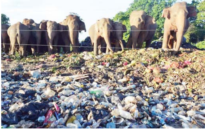
တိရစ္ဆာန်များကျက်စားရာနေထိုင်ရာများ၌တွေ့ရသည့် စွန့်ပစ်ပလတ်စတစ် ပစ္စည်းများ။

ပလတ်စတစ်ညစ်ညမ်းမှု၏ အဓိကပြဿနာမှာ ပလတ်စတစ်သည် စက္ကူ၊ သစ်ရွက်၊ သစ်၊ ဝါး စသည့် အော်ဂဲနစ်ပစ္စည်းများကဲ့သို့ ဆွေးမြေ့ညှိ ကွယ်ပျောက်ခြင်းမရှိဘဲ နှစ်ပေါင်းများစွာ တည်မြဲနေခြင်းကြောင့် ဖြစ်သည်။ ထိုမျှသာမက ပလတ်စတစ်သည် မြေကြီးထဲ၊ ရေထဲမှစတင်ပြီး ဓာတုဗေဒ တုံ့ပြန်မှုများဖြစ်ကာ ပတ်ဝန်းကျင်ကို ထိခိုက်စေနိုင်သည့် ဓာတုဒြပ်ပေါင်းများ ထွက်ရှိလာခြင်း၊ ရေထဲတွင် ရေနေသတ္တဝါများသေဆုံးကာ ဂေဟစနစ် ပျက်စီးခြင်းများကို ဖြစ်ပေါ်စေသည်။ ထို့ကြောင့် ကမ္ဘာ့နိုင်ငံများအနေဖြင့် ပင်လယ်သမုဒ္ဒရာအတွင်း ပလတ်စတစ်များ ရောက်ရှိနေမှုကို မထိန်းချုပ်နိုင်ပါက ၂၅၀၀ ပြည့်နှစ်အရောက်တွင် ပင်လယ်သမုဒ္ဒရာနေ သတ္တဝါမျိုးစိတ် ပမာဏထက် ပလတ်စတစ်ပမာဏက ပိုများနေလိမ့်မည်ဖြစ်ကြောင်း ပတ်ဝန်းကျင်ဆိုင်ရာ ကျွမ်းကျင်ပညာရှင်များက သတိပေးထားသည်။