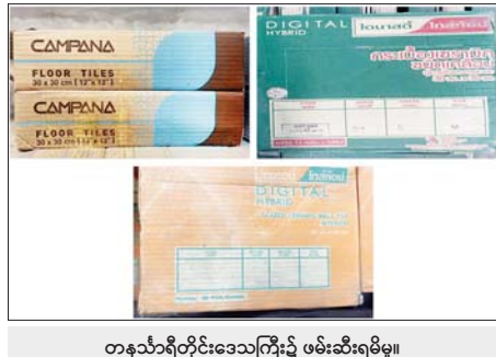
တရားမဝင်ကုန်ပစ္စည်းများ ဖမ်းဆီးရမိမှု။

နေပြည်တော် ဇန်နဝါရီ ၂၀ - တရားမဝင်ကုန်သွယ်မှုတိုက်ဖျက်ရေးဦးဆောင်ကော်မတီ၏ ကြီးကြပ် ကွပ်ကဲမှုဖြင့် တရားမဝင်ကုန်သွယ်မှုများကို ဥပဒေနှင့်အညီ ထိရောက် စွာ တားဆီးအရေးယူနိုင်ရေး ဆောင်ရွက်လျက်ရှိသည်။ ဇန်နဝါရီ ၁၇ ရက်တွင် အကောက်ခွန်ဦးစီးဌာန၏ စီမံခန့်ခွဲမှုဖြင့် တာဝန်ကျပူးပေါင်းအဖွဲ့များက စစ်ဆေးမှုများဆောင်ရွက်ခဲ့ရာ အေးရှား ပေါလ်ကုန်သေတ္တာစစ်ဆေးရေးစခန်း၌ ကုန်သေတ္တာခုခံလုံးအတွင်းမှ တရားမဝင်စာရွက်စာတမ်းအထောက်အထား တင်ပြနိုင်ခြင်းမရှိသည့် လုပ်ငန်းသုံးပစ္စည်း တစ်မျိုး၊ လူသုံးကုန်ပစ္စည်းတစ်မျိုး စုစုပေါင်း ခန့်မှန်းတန်ဖိုးငွေကျပ် ၄၅၁၅၀၀၀၀ ကို ဖမ်းဆီးရမိခဲ့ပြီး အကောက်ခွန် လုပ်ထုံးလုပ်နည်းများနှင့်အညီ အရေးယူဆောင်ရွက်လျက် ရှိသည်။