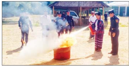
မိတ္ထီလာမြို့၌ မီးဘေးအန္တရာယ်ကြိုတင်ကာကွယ်ရေး အသိပညာပေး

ခေါင်းစဉ်တို့ဖြင့် ၎င်းတို့ဖတ်ရှု လေ့လာထားသည့် စာရေးသူ၏ ဆိုလိုရင်းနှင့် ၎င်းတို့၏ အတွေ့အကြုံများ၊ အတွေးအခေါ်များကို ကျယ်ကျယ်ပြန့်ပြန့် ဖြေဆို ဆွေးနွေးကြသည်။(ဝဲပုံ) ယင်းနောက် တက်ရောက်လာ ကြသည့် ကျောင်းသား ကျောင်းသူများက သိလိုသည့်များကို မေးမြန်းကြရာ စကားပိုင်းပိတ်ဆွေးနွေးသူများက မြေကြားပေးကြပြီး ခရိုင်ပြန်ကြားရေးနှင့် ပြည်သူ့ဆက်ဆံရေးဦးစီးဌာနမှ လက်ထောက် ညွှန်ကြားရေးမှူးချုပ် စကားပိုင်းနှင့် ပတ်သက်၍ ပြန်လည်သုံးသပ် ဆွေးနွေးသည်။ အဆိုပါအခမ်းအနားတွင် နံရံကပ်စာစောင်များကို ခင်းကျင်းပြသခဲ့ကြောင်း သိရသည်။ ခရိုင်(ပြန်/ဆက်)