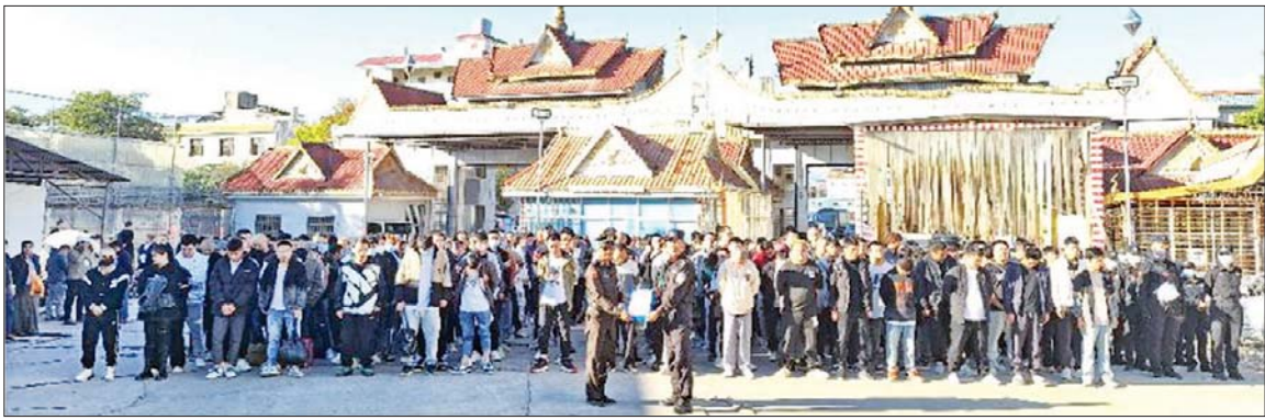
မြန်မာနိုင်ငံအတွင်းသို့ တရားမဝင် ဝင်ရောက်လာပြီး အွန်လိုင်းလောင်းကစားမှုကျူးလွန်နေကြသည့် ပြည်ပနိုင်ငံသားများအား သက်ဆိုင်ရာနိုင်ငံများအလိုက်သို့ ပြန်လည် လွှဲပြောင်းပေးအပ်စဉ်။

စာမျက်နှာ ၅ မှ အနေဖြင့် ၎င်းတို့ကို တရားမဝင် ဝင်ရောက်လာသူများ ဖြစ်သော် လည်း လူသားချင်းစာနာထောက် ထားမှုနှင့် နိုင်ငံအချင်းချင်း ချစ်ကြည်ရင်းနှီးမှုတို့ကို ရှေးရှု၍ တရားဥပဒေနှင့်အညီ စစ်ဆေး ၍ သက်ဆိုင်ရာ နိုင်ငံများသို့ ပြန်လည် လွှဲပြောင်းပေးလျက် ရှိသည်။ တရားမဝင် ဝင်ရောက် နေထိုင်၍ အွန်လိုင်းလိမ်လည်မှု များ၊ အွန်လိုင်းလောင်းကစားမှုများ ကျူးလွန်နေကြသည့် ပြည်ပနိုင်ငံ သားများအား စိစစ်ဖော်ထုတ်ခဲ့ ရာ နယ်စပ်ဒေသများဖြစ်သည့် လောက်ကိုင်၊ မုဆယ်၊ တာချီလိတ်၊