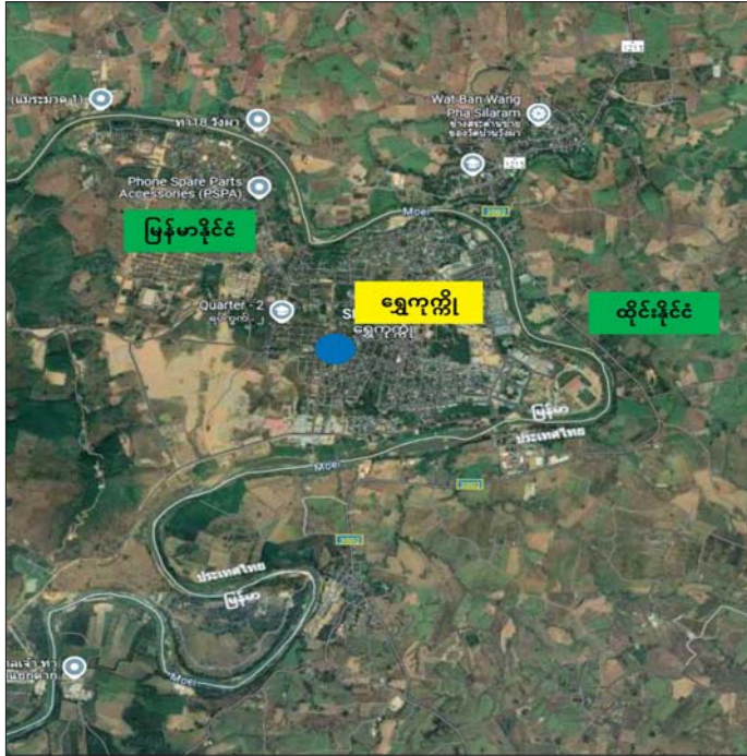
တာရာမဝင် အွန်လိုင်းလောင်းကစားအပါအဝင် ဒုစရိုက်မှုများ ဖြစ်ပေါ်လျက်ရှိသည့် KK Park နယ်မြေပြင်ပ။