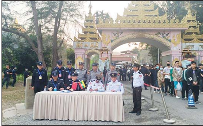
မြန်မာနိုင်ငံအတွင်းသို့ တရားမဝင် ဝင်ရောက်လာပြီး အွန်လိုင်းလောင်းကစားမှုကျူးလွန်နေကြသည့် ပြည်ပနိုင်ငံသားများအား သက်ဆိုင်ရာနိုင်ငံများအလိုက်သို့ ပြန်လည်လွှဲပြောင်းပေးအပ်စဉ်။

လေကြောင်းခရီးဖြင့် ရောက်ရှိခဲ့ ကြောင်း၊ ထို့နောက် ဘန်ကောက် မြို့မှ တာဝန်ပြည်နယ် မဲဆောက် မြို့ မွဲကွန်းကန်ရွာအနီးရှိ သောင်ရင်းမြစ်ကမ်း (ထိုင်းနိုင်ငံ ဘက်ခြမ်း)သို့ရောက်ရှိပြီးနောက် လေ့ဖြင့် မြန်မာနိုင်ငံဘက်ခြမ်း၊ မြဝတီ - ရွှေကုက္ကိုလ်နယ်မြေသို့ ခေါ်ဆောင်ခြင်းခံခဲ့ရကြောင်း။ ထို့နောက် အဆောက်အအုံ တစ်ခုသို့ ပို့ဆောင်ခြင်းခံခဲ့ရပြီး ကွန်ပျူတာစာစီစာရိုက် ကျွမ်းကျင် စေရန် ဦးစွာလေ့ကျင့်ပေးခဲ့ ကြောင်းနှင့် ယင်းအဆောက်အအုံ၌ တရုတ်နိုင်ငံသား ၁၀ ဦးခန့် တွေ့ရှိခဲ့ကြောင်း၊ ယင်းနောက် ဒုတိယအဆောက်အအုံ တစ်ခုသို့ ဆက်လက်ရောက်ရှိခဲ့ပြီး ခေါင်း တုံးတုံးပေးခဲ့ကြောင်းနှင့် အွန်လိုင်း လိမ်လည်မှုလုပ်ကိုင်ရန် စေခိုင်း ခြင်းခံခဲ့ရကြောင်း၊ အဆိုပါနေရာ သည် အွန်လိုင်းလောင်းကစား လိမ်လည်သည့် နေရာဖြစ်ပြီး အဆောက်အအုံအတွင်း တရုတ်