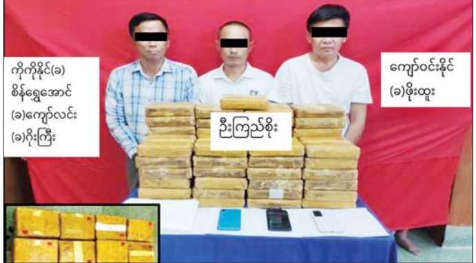
သိမ်းဆည်းရမိသည့် မူးယစ်ဆေးဝါးများနှင့်အတူ တွေ့ရစဉ်။