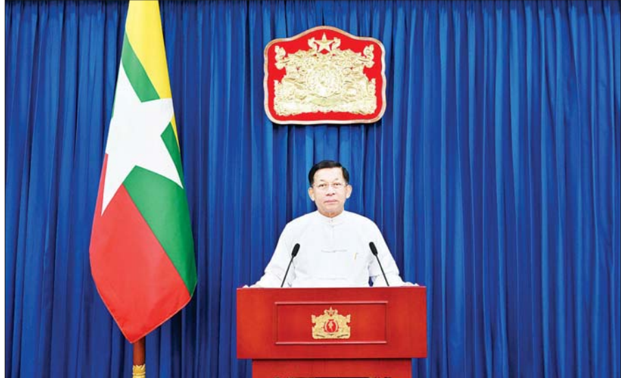
စာမျက်နှာ ၃ ကော်လံ ၁ ၀

အားလုံး မင်္ဂလာပါ။ ဒီနေ့ကျင်းပပြုလုပ်တဲ့ “(၅၃) ကြိမ်မြောက် မြန်မာနိုင်ငံ ကျန်းမာရေးဆိုင်ရာ သုတေသနညီလာခံ” ကို တက်ရောက်လာကြတဲ့ ဧည့်သည်တော်များအားလုံး စိတ်၏ချမ်းသာခြင်း၊ ကိုယ်၏ ကျန်းမာခြင်းနှင့် ပြည့်စုံပြီး ကျက်သရေမင်္ဂလာအပေါင်းနဲ့ ပြည့်စုံကြပါစေလို့ ဦးစွာဆုမွန်ကောင်းတောင်းရင်း နှုတ်ခွန်းဆက်သအပ်ပါတယ်။ မြန်မာနိုင်ငံရဲ့ ကျန်းမာရေးဆိုင်ရာ သုတေသနလုပ်ငန်းတွေကို နိုင်ငံတကာနဲ့ ရင်ပေါင်တန်းဆောင်ရွက်နိုင်စေဖို့ ရည်ရွယ်ပြီး မြန်မာ နိုင်ငံကျန်းမာရေးဆိုင်ရာ သုတေသနညီလာခံကို ကျင်းပလာခဲ့တာ ယခုအခါ (၅၃)ကြိမ်တိုင်ခဲ့ပြီဖြစ်ပါတယ်။ ၁၉၆၅ ခုနှစ်မှာ ပထမအကြိမ်ညီလာခံကို စတင်ကျင်းပနိုင်ခဲ့ ပါတယ်။ ညီလာခံစတင်ကျင်းပခဲ့တဲ့နှစ်တွေမှာ သုတေသနစာတမ်း တွေကိုသာ တင်သွင်းဖတ်ကြားနိုင်ခဲ့ရာက ၁၉၉၁ ခုနှစ်မှာပြုလုပ်တဲ့ ကျန်းမာရေးဆိုင်ရာ သုတေသနညီလာခံကစပြီး သုတေသနပုံစံတာ ပြပွဲကို ထည့်သွင်းနိုင်ခဲ့တာ တွေ့ရပါတယ်။ ၂၀၀၂ ခုနှစ် ညီလာခံက စတင်ပြီး ပညာရပ်ဆိုင်ရာ နှီးနှေးဖလှယ်ဆွေးနွေးပွဲတွေကိုပါ ထည့်သွင်းပြီး ပိုမိုအကျိုးရှိထိရောက်အောင် ကျယ်ကျယ်ပြန့်ပြန့် ကျင်းပလာခဲ့ကြောင်း သိရှိရပါတယ်။