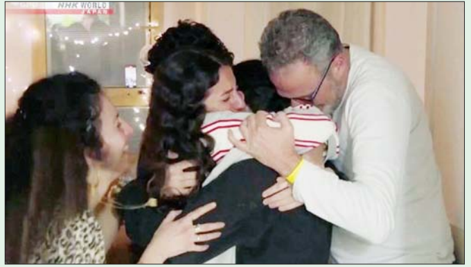
ကမ်းခြေတွင် အမြဲတမ်းအပစ်အခတ် ရပ်စဲရေးနှင့် ပြန်လည်တည်ဆောက်ရေးအတွက် သဘောတူညီမှု ရရှိရန် ဆွေးနွေးပွဲများကို အဆိုပါ ကာလအတွင်း ဆက်လက်လုပ်ဆောင်သွားမည်ဖြစ်ကြောင်း သိရ သည်။ အင်န်အိတ်ချ်ကေ

နှစ်ဖက်သက်ဆိုင်ရာ အဖွဲ့အစည်းများသည် ဒုတိယနှင့် တတိယဆင့်ဆွေးနွေးပွဲများ၌ ဂါဇာ