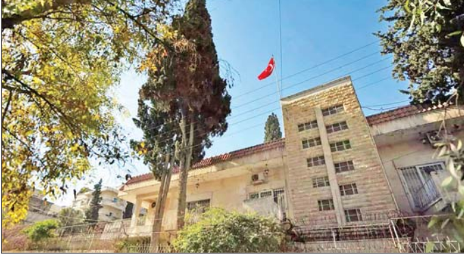
ဆီးရီးယားနိုင်ငံ အလက်ပိုမြို့ရှိ တူကီယံကောင်စစ်ဝန်ရုံးချုပ်ကို တွေ့ရစဉ်။