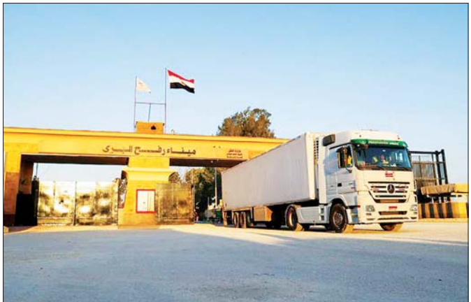
သဘောတူညီချက်အရ ဆေးဝါးအကူအညီ များ၊ ခန့် ဂါဇာသို့ဝင်ရောက်နိုင်ရန် ခန့်မှန်းထားကြောင်း ရွက်ဖျင်တံများနှင့် ကယ်ဆယ်ရေးပစ္စည်းများ အီဂျစ်လုံခြုံရေးသတင်းရင်းမြစ်တစ်ဦးက ပြော တင်ဆောင်လာသည့် ကုန်တင်ယာဉ် အစီးရေ ၆၀၀ ကြားသည်။ ဆင်ဟွာ

အစ္စရေး ၁၂ ဦးကို သတ်ဖြတ်မှုအတွက် ထောင်ဒဏ် တစ်သက်တစ်ကျွန်းကျခံနေရသော အမက်ဘာဂူတီနှင့် ၂၀၀၃ ခုနှစ်က ဂျေရုဆလင် ၌ အသေခံစားခဲ့ရသူတို့ကို အကျဉ်းမှ လွှတ်ပေးမည်ဖြစ်ကြောင်း အစ္စရေးက ဂါဇာကမ်းခြေတွင် ရာဟာဂီတီကိုလည်း ဇန်နဝါရီ ၁၉ ရက်တွင် ပြန်လည်လွှတ်ပေးမည် ဖြစ်ပြီး စားစာခံများလဲလှယ်ရေး အပစ်ရပ်