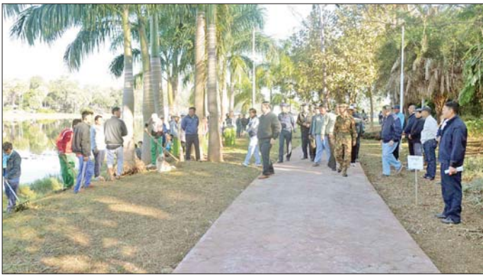
တွင် ပိုမိုအဆင်ပြေချောမွေ့စွာ ဆောင်ရွက်ပေးနိုင်ရန်အတွက် ရုံးအဆောက်အအုံ ပြန်လည်ပြုပြင်ဆောင်ရွက်ပေးနေမှုအခြေအနေကို ကြည့်ရှုစစ်ဆေးပြီး လုပ်ငန်းများ သတ်မှတ်စီမံချိန်စံညွှန်း ပြည့်မီစွာ

ဆက်လက်၍ ရင်းနှီးမြှုပ်နှံမှုနှင့် ကုမ္ပဏီများ ညွှန်ကြားမှုဦးစီးဌာနအနေဖြင့် သက်ဆိုင်ရာရုံး၌ ဌာန၏ လုပ်ငန်းတာဝန်များ ပြန်လည်ဆောင်ရွက်နိုင်ရန်နှင့် ပြည်နယ်ဖွံ့ဖြိုးတိုးတက်ရေးအတွက် ရင်းနှီးမြှုပ်နှံမှုများလုပ်ငန်းများ ဖိတ်ခေါ်ဆောင်ရွက်ရာ