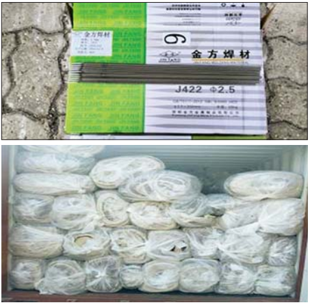
သီလဝါဆိပ်ကမ်း၌ ဖမ်းဆီးရမိမှု။

ဇန်နဝါရီ ၁၆ ရက်တွင် အကောက်ခွန်ဦးစီးဌာန၏ စီမံခန့်ခွဲမှုဖြင့် တာဝန်ကျပေးပေါင်းအဖွဲ့များက စစ်ဆေးမှုများဆောင်ရွက်ခဲ့ရာ မြန်မာ့စက်မှုဆိုင်ကမ်း၌ ကုန်သွယ်မှုတစ်လုံးအတွင်းမှ တရားဝင် စာရွက်စာတမ်းအထောက်အထားတင်ပြနိုင်ခြင်းမရှိသည့် လုပ်ငန်းသုံးပစ္စည်းလေးမျိုး (ခန့်မှန်းတန်ဖိုးငွေကျပ် ၆၈၂၉၈၂၉၈) ကို လည်းကောင်း၊ သီလဝါဆိပ်ကမ်း၌ ကုန်သွယ်မှုတစ်လုံးအတွင်းမှ တရားဝင်စာရွက်စာတမ်းအထောက်အထားတင်ပြနိုင်ခြင်းမရှိသည့် လုပ်ငန်းသုံးပစ္စည်းနှစ်မျိုး (ခန့်မှန်းတန်ဖိုးငွေကျပ် ၃၀၉၃၄၇၈၀)ကို လည်းကောင်း၊ စုစုပေါင်း ခန့်မှန်းတန်ဖိုးငွေကျပ် ၃၇၇၄၅၅၈၇၈ ကို ဖမ်းဆီးရမိခဲ့ပြီး အကောက်ခွန်လုပ်ထုံးလုပ်နည်းများနှင့်အညီ အရေးယူဆောင်ရွက်လျက်ရှိသည်။