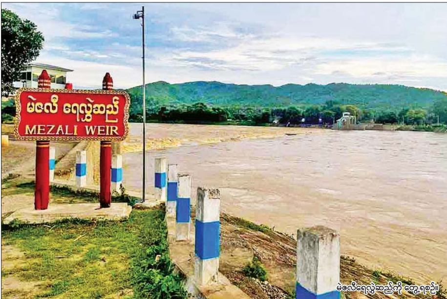
မဲလီရေလွှဲဆည်ကို တွေ့ရဦး

ပွင့်ဖြူ ဇန်နဝါရီ ၁၈ မကွေးတိုင်းဒေသကြီး ပွင့်ဖြူမြို့နယ်၌ ယခုနှစ် နွေသီးနှံစိုက်ပျိုးရာသီ၌ မဲလီရေလွှဲဆည်ရေဖြင့် ဧက ၃၃၂၂၅ ဧက လျာထားစိုက်ပျိုး ဆောင်ရွက်သွားမည် ဖြစ်ကြောင်း ပွင့်ဖြူမြို့နယ်စိုက်ပျိုးရေးဦးစီးဌာနမှ သိရသည်။ ပွင့်ဖြူမြို့နယ်၌ ယခုနှစ် နွေသီးနှံစိုက်ပျိုးရာသီတွင် စပါး ၃၃၂၂၅ ဧက စိုက်ပျိုးရန် လျာထားပြီး ဒေသတွင်းရှိ တောင်သူများ သီးနှံအချိန်မီ စိုက်ပျိုးနိုင်ရေးအတွက် မြို့နယ်ဆည်မြောင်းနှင့် ရေအသုံးချမှုစီမံခန့်ခွဲရေးဦးစီးဌာနက ၂၀၂၅ ခုနှစ် ဖေဖော်ဝါရီ ၁၅ ရက်တွင် မဲလီရေလွှဲဆည်မှ စိုက်ပျိုးရေးများ စတင် ဖြန့်ဝေပေးသွားမည်ဖြစ်ကြောင်း၊ သတ်မှတ်လျာထားဧက ပြည့်မီအောင် စိုက်ပျိုးနိုင်ရေးအတွက် စိုက်ပျိုးရေးဦးစီးဌာနမှ ဝန်ထမ်းများက သက်ဆိုင်ရာ စပ်ဆက်ဌာနများနှင့် ပူးပေါင်းပြီး အထွက်နှုန်းကောင်းသော မျိုးကောင်းမျိုးသန့်များ စိုက်ပျိုးနိုင်ရေး၊ စာမျက်နှာ ၄ ကော်လံ ၁