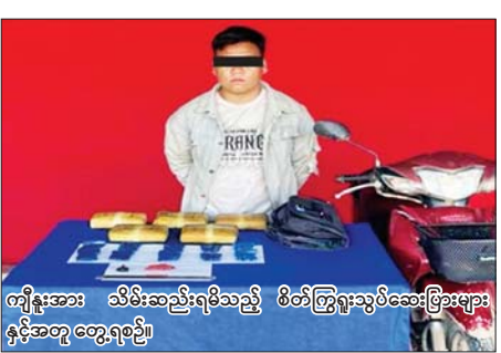
ကျိန်းအား သိမ်းဆည်းရမိသည့် စိတ်ကြွရွေးသွပ်ဆေးပြားများနှင့်အတူ တွေ့ရစဉ်။

ဇန်နဝါရီ ၁၇ ရက် ညနေ ၄ နာရီတွင် မူးယစ်ဆေးဝါး တားဆီးနှိမ်နင်းရေးရဲတပ်ဖွဲ့မှ တပ်ဖွဲ့ဝင်များပါဝင်သော ပူးပေါင်းအဖွဲ့သည် မိုင်းဆတ်မြို့နယ် စတုံးကျေးရွာအုပ်စု လွယ်ပါရင် ကျေးရွာအနီး၌ ကျိန်း မောင်းနှင်လာသည့် မော်တော်ဆိုင်ကယ်ကို ရပ်တန့်စစ်ဆေးရှာဖွေရာ ၎င်းလွယ်ထားသည့် ကျောပိုးအိတ်အတွင်းမှ စိတ်ကြွရွေးသွပ်ဆေးပြား ၃၀၀၀၀ သိမ်းဆည်းရမိခဲ့သဖြင့် ကျိန်း