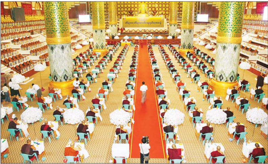
သတင်းစဉ်

ရန်ကုန် ဇန်နဝါရီ ၁၈ သာသနာရေးနှင့် ယဉ်ကျေးမှု ဝန်ကြီးဌာန သာသနာရေးဦးစီးဌာနက ကြီးမှူးကျင်းပသည့် (၇၇) ကြိမ်မြောက် တိပိဋကဓရ တိပိဋကကောဝိဒ ရွေးချယ်ရေးစာမေးပွဲ (သဘောရေးဖြေ) ဖြေဆိုပွဲကို ယနေ့မန္တလေးလွှဲပိုင်းတွင် ရန်ကုန်မြို့ သီရိမင်္ဂလာ ကမ္ဘာ့အေးကုန်းမြေရှိ ဆဋ္ဌသင်္ဂါယနာ မဟာပါသာလှိုင်ဓာတ်တော်ကြီး၌ ကျင်းပသည်။ (ယာပုံ) (၇၇)ကြိမ်မြောက် တိပိဋကဓရ တိပိဋကကောဝိဒ ရွေးချယ်ရေးစာမေးပွဲ (သဘောရေးဖြေ)ပွဲ၌ အဘိဓမ္မာ (ဒုတိယပိုင်း) တွင် စာရင်းသွင်း သံဃာတော် လေးပါး၊ ရှိပြီး ဖြေဆို သံဃာတော် လေးပါး၊ အဘိဓမ္မာ (ပထမပိုင်း) တွင် စာရင်းသွင်း သံဃာတော် ၁၇ ပါး