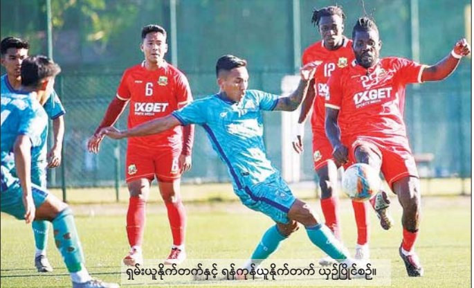
ရှမ်းယူနိုက်တက်နှင့် ရန်ကုန်ယူနိုက်တက် ယှဉ်ပြိုင်စဉ်။