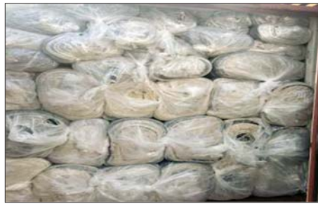
သီလဝါဆိပ်ကမ်း၌ ဖမ်းဆီးရမိမှု။

ဇန်နဝါရီ ၁၆ ရက်တွင် စစ်ကိုင်းတိုင်းဒေသကြီး တရားမဝင်ကုန်သွယ်မှုတိုက်ဖျက်ရေးအဖွဲ့အဖွဲ့၏ စီမံခန့်ခွဲမှုဖြင့် တာဝန်ကျပူးပေါင်းအဖွဲ့က စစ်ဆေးမှုများ ဆောင်ရွက်ခဲ့ရာ စစ်ကိုင်းမြို့ ရတနာပုံတံတား ပူးပေါင်းစစ်ဆေးရေးဂိတ်၌ တရားဝင်စာရွက်စာတမ်းအထောက်အထား တင်ပြနိုင်ခြင်းမရှိသည့် လုပ်ငန်းသုံးပစ္စည်း သုံးမျိုး စုစုပေါင်း