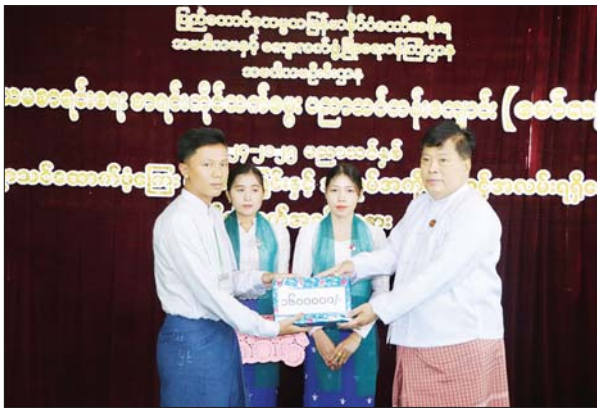
အသင်းများက မိမိတို့ လုပ်ငန်းခွင်အလိုက် အလုပ်အကိုင်ရရှိရေး ဆောင်ရွက်ပေးနိုင်မည့် အခြေအနေများကို မိတ်ဆက်ရှင်းလင်း သွေးနှေးပြီး ကျောင်းသား ကျောင်းသူများ ကိုယ်စား ကျောင်းသူတစ်ဦးက သင်ကြား တတ်မြောက်မှုနှင့် စပ်လျဉ်း၍ ရင်းလင်းတင်ပြ သည်။

မော်လမြိုင် ဇန်နဝါရီ ၁၇ မွန်ပြည်နယ် မော်လမြိုင်မြို့ သမဝါယမ စာရင်းရေးစာရင်းကိုင် သက်မွေးပညာ သင်တန်းကျောင်း၏ ၂၀၂၄-၂၀၂၅ ပညာသင် နှစ်တွင် တက်ရောက်ပညာသင်ကြားလျက် ရှိသော ကျောင်းသား ကျောင်းသူများအား ပညာသင်ကြေးပေးအပ်ခြင်းနှင့် ဒုတိယနှစ် ကျောင်းသား ကျောင်းသူများအား အလုပ် အကိုင်အခွင့်အလမ်းရရှိရေး မိတ်ဆက် အခမ်း အနားကို သက်မွေးပညာသင်တန်းကျောင်း ခန်းမ(ရာမညဆောင်)၌ ဇန်နဝါရီ ၁၆ ရက်က ကျင်းပသည်။