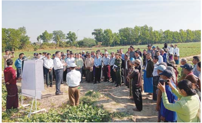
ဆီထွက်သီးနှံ ၅၃၂၅ စက စိုက်ပျိုးနိုင်ရန် လျာထား ဆောင်ရွက်လျက်ရှိပြီး နေ့စပါး ၁၂၄ စက၊ ပဲမျိုးစုံ ၁၉၉၂ စက နှင့် ပိုက်ဆံလျှော်စက ၂၀ စိုက်ပျိုးနိုင်ရန် လျာထားဆောင်ရွက်လျက်ရှိရာ ယနေ့အထိ ဆောင်းသီးနှံ စုစုပေါင်း ၉၆၅၃ စက စိုက်ပျိုးပြီးစီးပြီ ဖြစ်ကြောင်း သိရသည်။ မြို့နယ်(ပြန်/ဆက်)

များအနေဖြင့် မိမိတို့၏ဒေသနှင့်ကိုက်ညီသည့် မျိုးကောင်းမျိုးသန့်များကို ရွေးချယ်စိုက်ပျိုးကြရန် လိုကြောင်း၊ စိုက်ပျိုးရေးကဏ္ဍမှရရှိသည့် အရည် အသွေးပြည့်မီသော ထုတ်ကုန်များကိုလည်း နိုင်ငံ တကာဖျားကွက်သို့ တင်ပို့နိုင်ရေး ဆောင်ရွက်သွားရန် လိုကြောင်းနှင့် တောင်သူများ၏ အခက်အခဲအပိုအပို ချက်များကို စိုက်ပျိုးရေးဦးစီးဌာနနှင့် သက်ဆိုင်ရာ တာဝန်ရှိသူများက ပူးပေါင်းဆောင်ရွက်ကြရန် ပြောကြားပြီး တောင်သူများ၏ ဆွေးနွေးတင်ပြချက် များအပေါ် ညှိနှိုင်းဆောင်ရွက်ပေးခဲ့ကြောင်း သိရ သည်။ ချောင်းဆုံမြို့နယ်အတွင်း ၂၀၂၄-၂၀၂၅ ဆောင်း သီးနှံ စိုက်ပျိုးထုတ်လုပ်မှုအနေဖြင့် နေကြာစက ၃၉၂၇၊ မြေပဲစက ၁၃၆၃၊ နှမ်း ၂၅၈၈ စတုစုပေါင်း