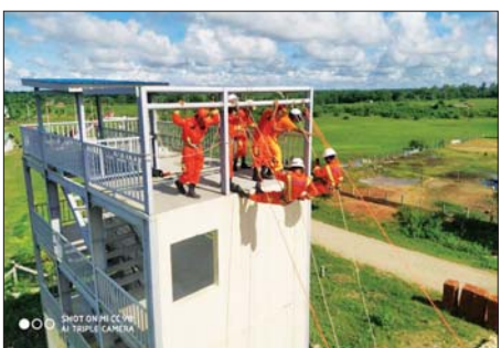
အဝင် အခြားသောဘေးအန္တရာယ် များ ကျရောက်လာသည့်အခါ အရေးပေါ် ရှာဖွေကယ်ဆယ်ရေး လုပ်ငန်းများကို တာဝန်ယူဆောင် ရွက်ရန် စသည့် ရည်ရွယ်ချက်များ ဖြင့် ဇန်နဝါရီ ၆ ရက်မှ ၂၆ ရက်

လပွတ္တာ ဇန်နဝါရီ ၁၇ ဧရာဝတီတိုင်းဒေသကြီး လပွတ္တာ ခရိုင်အတွင်းရှိ မီးသတ်တပ်ဖွဲ့ဝင် များ ရှာဖွေကယ်ဆယ်ရေးမွမ်းမံ သင်တန်းကို လပွတ္တာ ၃ မိုင် မြို့သစ်ရှိ ခရိုင်မီးသတ်ဦးစီးမှူးရုံး ၌ ဇန်နဝါရီ ၆ ရက်မှစ၍ သင်ကြား ပို့ချလျက်ရှိသည်။ ပြည်သူ့ထု၏ အသက် အိုးအိမ်ပစ္စည်းများ၊ နိုင်ငံတော် အတွင်းရှိ ထုတ်ကုန်အရင်းအနှီး များကို မီးဘေးအန္တရာယ်မှ တားဆီးကာကွယ်ရေးလုပ်ငန်းစဉ် နှင့် သဘာဝဘေးအန္တရာယ်အပါ