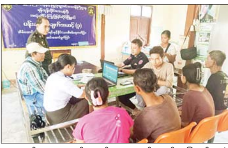
အထောက်အထားများနှင့် စာရွက်စာတမ်းများစိစစ်၍ အိမ်ထောင်စုလူဦးရေစာရင်းနှင့် နိုင်ငံသားစိစစ်ရေးကတ်များကို ပြုလုပ်ပေးခဲ့ကြောင်း သိရသည်။