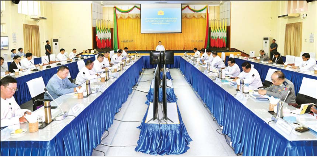
နိုင်ငံတော်စီမံအုပ်ချုပ်ရေးကောင်စီဒုတိယဥက္ကဋ္ဌ ဒုတိယဝန်ကြီးချုပ် ဒုတိယဗိုလ်ချုပ်မှူးကြီး စိုးဝင်း ပြည်ထောင်စုအဆင့် MSME ထုတ်ကုန်ပြပွဲနှင့် ပြိုင်ပွဲကျင်းပနိုင်ရေး ညှိနှိုင်းအစည်းအဝေးတွင် အမှာစကားပြောကြားစဉ်။

နေပြည်တော် ဇန်နဝါရီ ၁၇ ပြည်ထောင်စုအဆင့် MSME ထုတ်ကုန်ပြပွဲနှင့် ပြိုင်ပွဲကျင်းပနိုင်ရေး ညှိနှိုင်းအစည်းအဝေးကို ယနေ့မွန်းလွဲပိုင်းတွင် နေပြည်တော်ရှိ စက်မှုဝန်ကြီးဌာန အစည်းအဝေးခန်းမ၌ ကျင်းပရာ အသေးစား၊ အငယ်စားနှင့် အလတ်စားစီးပွားရေးလုပ်ငန်းများ ဖွံ့ဖြိုးတိုးတက်ရေးလုပ်ငန်းကော်မတီ ဥက္ကဋ္ဌ နိုင်ငံတော်စီမံအုပ်ချုပ်ရေးကောင်စီ ဒုတိယဥက္ကဋ္ဌ ဒုတိယဝန်ကြီးချုပ် ဒုတိယဗိုလ်ချုပ်မှူးကြီး စိုးဝင်း တက်ရောက်အမှာစကား ပြောကြားသည်။ အခမ်းအနားသို့ စက်မှုဝန်ကြီးဌာန ပြည်ထောင်စုဝန်ကြီး ဒေါက်တာ ချာလီသန်း၊ နေပြည်တော်ကောင်စီဥက္ကဋ္ဌ ဦးသန်းထွန်းဦး၊ ဒုတိယဝန်ကြီးများ၊ နေပြည်တော်ကောင်စီဝင်၊ ဒုတိယမြို့တော်ဝန်၊ ဌာနဆိုင်ရာအကြီးအကဲများနှင့် တာဝန်ရှိသူများ တက်ရောက်ကြသည်။ စာမျက်နှာ ၅ ကော်လံ ၁ ❖