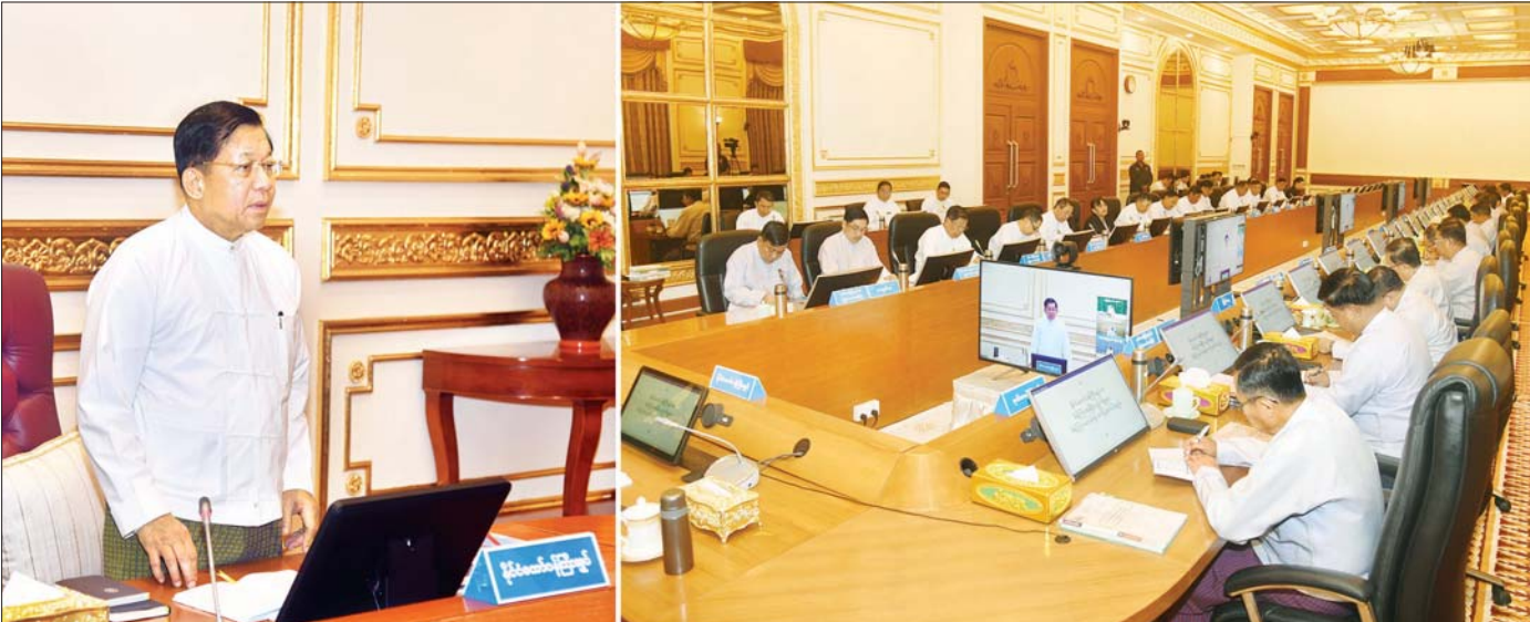
နိုင်ငံတော်စီမံအုပ်ချုပ်ရေးကောင်စီဥက္ကဋ္ဌ နိုင်ငံတော်ဝန်ကြီးချုပ် ဗိုလ်ချုပ်မှူးကြီး မင်းအောင်လှိုင် ပြည်ထောင်စုအစိုးရအဖွဲ့အစည်းအဝေးတွင် အမှာစကားပြောကြားစဉ်။

နိုင်ငံတော်စီမံအုပ်ချုပ်ရေးကောင်စီဥက္ကဋ္ဌ နိုင်ငံတော်ဝန်ကြီးချုပ် ဗိုလ်ချုပ်မှူးကြီး မင်းအောင်လှိုင် ပြည်ထောင်စုအစိုးရအဖွဲ့အစည်းအဝေးသို့ တက်ရောက်အမှာစကားပြောကြား အကြမ်းဖက်သမားများ၏ တိုက်ခိုက်မှုများကြောင့် ယာယီနေရပ်စွန့်ခွာနေကြရသည့် ပြည်သူများအတွက် အမျိုးသားသဘာဝဘေးအန္တရာယ်ဆိုင်ရာစီမံခန့်ခွဲရေးရန်ပုံငွေမှ လိုအပ်သည့်ထောက်ပံ့မှုများ ဆောင်ရွက်ပေးရန်စီစဉ်ဆောင်ရွက်