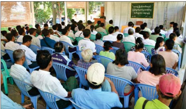
လျှော့ပေါ့ခွင့်နှင့် ရွှေ့ဆိုင်းခွင့်များကိုလည်း ဗဟိုအဖွဲ့က သတ်မှတ်ပေးထားသည့် ပြည်သူ့ စစ်မှုထမ်းဥပဒေနှင့်အညီ ပြောကြားသည်။ ထို့နောက် ပျဉ်းမနားခရိုင်စီမံအုပ်ချုပ်ရေး အဖွဲ့ဥက္ကဋ္ဌ ခရိုင်အုပ်ချုပ်ရေးမှူး၊ အဖွဲ့ဝင် (၁) ခရိုင်စီမံအုပ်ချုပ်ရေးအဖွဲ့ အဖွဲ့ဝင် (၁) ဗိုလ်မှူးကြီး၊ တွန်းလင်းဦးနှင့် မြို့နယ်ဥပဒေ

နေပြည်တော် ဇန်နဝါရီ ၁၇ ဒေသပွဲမြိုးတိုးတက်ရေးနှင့် ပြည်သူ့စစ်မှုထမ်း ဥပဒေဆိုင်ရာ အသိပညာပေးဆွေးနွေးပွဲကို ဇန်နဝါရီ ၁၆ ရက်က ပျဉ်းမနားမြို့နယ် သနပ်ပင်ဆိပ်ကျေးရွာ၌ ကျင်းပသည်။ ဦးစွာ နေပြည်တော်ကောင်စီဝင် ဗိုလ်မှူးကြီးရုံးက အမှာစကားပြောကြားရာ တွင် ပြည်သူ့စစ်မှုထမ်းဥပဒေဆိုင်ရာများ သိရှိ နားလည်စေရန်၊ ပြည်သူ့ထုတ်တစ်ရပ်လုံးက ပူးပေါင်းပါဝင်ပံ့ပိုး ကူညီဆောင်ရွက်နိုင်စေရန်၊ လူမှုကွန်ရက်မီဒီယာများနှင့် တရားမဝင် သတင်းဌာနများမှ ပြည်သူ့စစ်မှုထမ်းဥပဒေ ဆိုင်ရာ သတင်းမှားများကို အသိလွယ်လမ်းမှား မရောက်ရှိစေရေး တရားဝင်သတင်းဌာနများ ၏ ထုတ်ပြန်ချက်များကိုသာ လေ့လာနိုင်ရေး အသိပညာပေးဆောင်ရွက်ရန် ရည်ရွယ်၍ ဆောင်ရွက်ခြင်းဖြစ်ကြောင်း၊ ပြည်သူ့ စစ်မှုထမ်းဥပဒေတွင် သတ်မှတ်ထားသည့် အသက်အရွယ်အတွင်း ဥပဒေနှင့်ကိုက်ညီ သူများထံမှ ခေါ်ယူခြင်းဖြစ်ပြီး ကင်းလွတ်ခွင့်၊