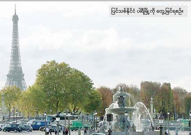
ပြင်သစ်နိုင်ငံ ပါရီမြို့ကို တွေ့မြင်ရစဉ်။

ပါရီ ဇန်နဝါရီ ၁၇ ပြင်သစ်နိုင်ငံ ပါရီမြို့၌ ဇန်နဝါရီ ၂၀ ရက်မှစတင်ကာ ယခင်က တွစ်တာဟုခေါ်သည့် X အသုံးပြုမှုကို ရပ်နားသွားမည်ဖြစ်ကြောင်း ပါရီမြို့က ဆိုသည်။ လူမှုကွန်ရက် မီဒီယာပလက်ဖောင်း X က တမင်ဖန်တီးထားသည့် မမှန်သတင်းများနှင့် ပြင်းထန်သောမှတ်ချက်များကို ပျံ့နှံ့ရန် ကူညီပေးနေမှုနှင့် ပတ်သက်၍ ကိုးကား ဖော်ပြထားခြင်းကြောင့် ဖြစ်ကြောင်း သိရသည်။ ပြင်သစ်မြို့သည် ဇန်နဝါရီ ၂၀ ရက်တွင် လူမှုကွန်ရက်မီဒီယာ X ပလက်ဖောင်းမှ ထွက်ခွာမည်ဖြစ်ကြောင်း၊ ၎င်းအကောင်ကို ၂၀၀၉ ခုနှစ်က ဖွင့်လှစ်ခဲ့ပြီး လက်ရှိတွင် ဖော်လိုဝါ ၂ ဒသမ ၂ သန်းကျော်ရှိကြောင်း ဇန်နဝါရီ ၁၆ ရက်က