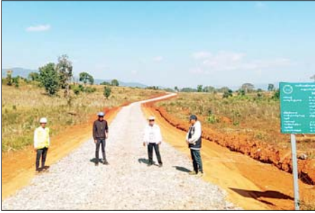
များက ယနေ့နံနက်ပိုင်းက မိုးနဲ-ကုန်းလုံ-လွိုင်ယူးကာ ကွင်းဆင်းကြည့်ရှု စစ်ဆေး လမ်းကို ၂၀၂၄-၂၀၂၅ ဘဏ္ဍာနှစ် ပြည်နယ် ငွေလုံးငွေရင်း ခွင့်ပြု

မိုးနဲ ဇန်နဝါရီ ၁၇ သမဝါယမနှင့် ကျေးလက်ဖွံ့ဖြိုးရေး ဝန်ကြီးဌာန ရှမ်းပြည်နယ် (တောင်ပိုင်း) မိုးနဲမြို့နယ် ကျေးလက်လမ်းဖွံ့ဖြိုးရေး ဦးစီးဌာန၏ ၂၀၂၄-၂၀၂၅ ဘဏ္ဍာနှစ် ပြည်နယ်ငွေလုံးငွေရင်း ခွင့်ပြုရန်ပုံငွေဖြင့် ဆောင်ရွက်လျက် ရှိသော ကုန်းလုံ-လွိုင်ယူးကာလမ်း လွိုင်ယူးကာကျေးရွာရှိ မိုးနဲ-ကုန်းလုံ - လွိုင်ယူးကာ လမ်း မြေသားလမ်းမှ ကျောက်ချောလမ်းအဖြစ် အဆင့်မြှင့်တင် ဆောင်ရွက်နေမှုကို တာဝန်ရှိသူ