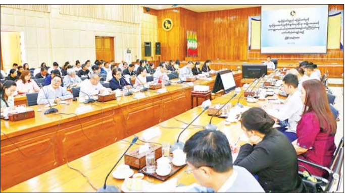
ငွေကြေးဆိုင်ရာ မှုခင်းတားဆီးရောင်းဝယ်ရေးလုပ်ငန်း၊ မြန်မာနိုင်ငံ စာရင်းကောင်စီ၊ ငွေချေးသက်သေခံလက်မှတ် လုပ်ငန်းကြီးကြပ်ရေးကော်မရှင်၊ သတင်းပို့အဖွဲ့အစည်းများမှ တာဝန်ရှိသူများနှင့် မြန်မာနိုင်ငံတော်ဗဟိုဘဏ်မှ တာဝန်ရှိသူများ တက်ရောက်ကြသည်။

နေပြည်တော် ဇန်နဝါရီ ၁၅ ငွေကြေးခဝါချမှုနှင့် အကြမ်းဖက်မှုတိုက်ဖျက်ရေးဆိုင်ရာ အမျိုးသားအဆင့် မဟာဗျူဟာနယ်ပယ်(၃) အကောင်အထည်ဖော်မှု ကြီးကြပ်ရေး ကော်မတီအစည်းအဝေးကို ယနေ့မနက်လွှဲပိုင်းတွင် မြန်မာနိုင်ငံတော် ဗဟိုဘဏ်၌ ကျင်းပသည်။ အစည်းအဝေးသို့ ကော်မတီဥက္ကဋ္ဌ မြန်မာနိုင်ငံတော်ဗဟိုဘဏ် ဒုတိယဥက္ကဋ္ဌ ဒေါက်တာလင်းအောင်၊ ကော်မတီအတွင်းရေးမှူး၊ ငွေကြေးခဝါချမှုနှင့် အကြမ်းဖက်မှုတိုက်ဖျက်ရေးဆိုင်ရာ အမျိုးသားအဆင့် မဟာဗျူဟာနယ်ပယ်(၃) အကောင်အထည်ဖော်မှု ကြီးကြပ်ရေး ကော်မတီအဖွဲ့ဝင်များ ဖြစ်သည့် အဂတိလိုက်စားမှုတိုက်ဖျက်ရေးကော်မရှင်၊ မြန်မာ့စီးပွားရေးဘဏ်