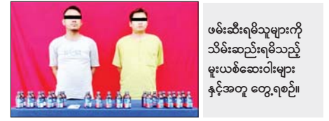
ဖမ်းဆီးရမိသူများကို သိမ်းဆည်းရမိသည့် မူးယစ်ဆေးဝါးများ နှင့်အတူ တွေ့ရစဉ်။