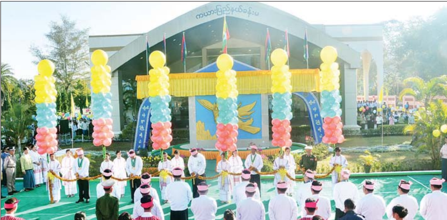
နိုင်ငံတော်စီမံအုပ်ချုပ်ရေးကောင်စီ အဖွဲ့ဝင် ပိုးရယ်အောင်သိန်း၊ ပြည်ထောင်စုဝန်ကြီး ဒုတိယဗိုလ်ချုပ်ကြီး ထွန်းထွန်းနေ့နှင့် ဦးညောင်ထွန်း၊ ပြည်နယ်ဝန်ကြီးချုပ်နှင့် ဒေသကွက်ကရေးမှူးတို့ ကယားပြည်နယ်နေ့အထိမ်းအမှတ်မုခ်ဦးကို ဖဲကြီးမြတ်ဖွင့်လှစ်ပေးစဉ်။

ရောက်ရှိနေရာယူပြီး နိုင်ငံတော် အလံနှင့် ကျဆုံးလေပြီးသော ခေါင်းဆောင်ကြီးများနှင့် ရဲဘော် အပေါင်းကို အလေးပြုကြသည်။ ယင်းနောက် နိုင်ငံတော်စီမံ အုပ်ချုပ်ရေးကောင်စီဥက္ကဋ္ဌ နိုင်ငံ တော်ဝန်ကြီးချုပ် ဗိုလ်ချုပ်မှူးကြီး သတိုးမဟာသရေစည်သူ သတိုး သီရိသူဓမ္မ မင်းအောင်လှိုင် ထံမှ ပေးပို့သော (၇၃) နှစ်မြောက် ကယားပြည်နယ်နေ့ အထိမ်း အမှတ်သံဝင်ကဏ္ဍကို ဒုတိယ ဝန်ကြီးချုပ်နှင့် ပြည်ထောင်စု ဝန်ကြီး ဗိုလ်ချုပ်ကြီး တင်အောင် စန်းက ဖတ်ကြားပြီး ပြည်နယ် ဝန်ကြီးချုပ်က ကယားပြည်နယ် နေ့ အထိမ်းအမှတ် နှုတ်ခွန်းဆက် အမှာစကား ပြောကြားသည်။ ဆက်လက်၍ (၇၃)နှစ်မြောက် ကယားပြည်နယ်နေ့ အထိမ်း အမှတ် ဂုဏ်ထူးဆောင်လက်မှတ် နှင့် ဂုဏ်ထူးဆောင်ဆုရရှိသူများ၊ ပဉ္စမအကြိမ်အမျိုးသားအားကစား ပြိုင်ပွဲနှင့် (၂၇) ကြိမ်မြောက် အဆို ဆုရရှိသူများအား ဒုတိယဝန်ကြီး ချုပ်နှင့် ပြည်ထောင်စုဝန်ကြီး နှင့် နိုင်ငံတော်စီမံအုပ်ချုပ်ရေး ကောင်စီအဖွဲ့ဝင်များ၊ ပြည်ထောင်စု ဝန်ကြီးများ၊ ပြည်နယ်ဝန်ကြီး ချုပ်နှင့် ဒေသကွက်ကရေးမှူးတို့က ဂုဏ်ပြုဆုများ ချီးမြှင့်ပေးအပ် သည်။ ထို့နောက် ပြည်ထောင်စု ဝန်ကြီး ဒုတိယဗိုလ်ချုပ်ကြီး ထွန်းထွန်းနေ့က နယ်စပ် ရေးရာဝန်ကြီးဌာနမှပေးအပ်သည့် 50 KW ဆိုလာအစုံ ၁၀၀ နှင့် ကယားပြည်နယ်အတွင်း တာဝန် ထမ်းဆောင်လျက်ရှိသော ဝန်ထမ်း များအတွက် ငွေကျပ် ၁၅၁ သိန်း တန်ဖိုးရှိ အခြေခံစားသောက် ကုန်များကို လည်းကောင်း၊ ပြည်ထောင်စုဝန်ကြီး ဦးညောင် ထွန်းက ပြန်ကြားရေးဝန်ကြီးဌာန မှ ပေးအပ်သည့် DTH စလောင်အစုံ ၅၀ နှင့် Set Top Box အစုံ ၅၀ တို့ကိုလည်းကောင်း ပေးအပ် ရာ ပြည်နယ်အစိုးရအဖွဲ့ဝင်များက လက်ခံရယူကြသည်။ ယင်းနောက် ဒုတိယဝန်ကြီး ချုပ်နှင့် ပြည်ထောင်စုဝန်ကြီးနှင့် ဧည့်သည်တော်များသည် အခမ်း အနားသို့ တက်ရောက်လာကြသူ များ၊ ဆုရရှိသူများနှင့်အတူ