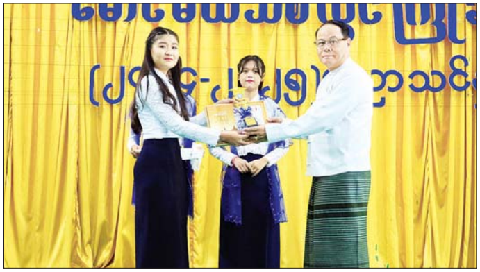
ပြောကြားပြီး ပြည်နယ်ဝန်ကြီးချုပ်နှင့် တာဝန်ရှိသူ စွာ တွေ့ဆုံနှုတ်ဆက်၍ အားပေးစကားများ များသည့် မောင်မယ်သစ်လွင် ကျောင်းသား ပြောကြားခဲ့ကြောင်း သိရသည်။ မောင်မယ်သစ်လွင် မောင်မယ်သစ်လွင် ကျောင်းသား ပြောကြားခဲ့ကြောင်း သိရသည်။

ပါမောက္ခချုပ် ဒေါက်တာအောင်စော်လတ်က သင်ကြားသင်ယူနေမှု အခြေအနေများကို ရှင်းလင်းတင်ပြပြီး နည်းပညာတက္ကသိုလ်ကျောင်းသား ကျောင်းသူများက တိုင်းရင်းသားတို့၏ ရိုးရာယဉ်ကျေးမှုအကအလှများဖြင့် သီဆိုပြပွဲဖော်ပြမှုကြားကာ တက္ကသိုလ် King & Queen ကို ရွေးချယ်ကြသည်။ ယင်းနောက် ပြည်နယ်ဝန်ကြီးချုပ်၊ ပြည်နယ်တရားလွှတ်တော်တရားသူကြီးချုပ် ဦးညွန့်လင်း၊ ပြည်နယ်အစိုးရအဖွဲ့ဝင်များနှင့် တာဝန်ရှိသူများက ၂၀၂၄-၂၀၂၅ ပညာသင်နှစ်မှ ပထမနှစ်၊ ဒုတိယနှစ်၊ တတိယနှစ်၊ စတုတ္ထနှစ် အောင်မြင်ခဲ့ကြသော ထူးချွန်ကျောင်းသား ကျောင်းသူများနှင့် တက္ကသိုလ် King & Queen ရရှိကြသူများအား ဆုများ ပေးအပ်ချီးမြှင့်ကြသည်။ (ယာပုံ)