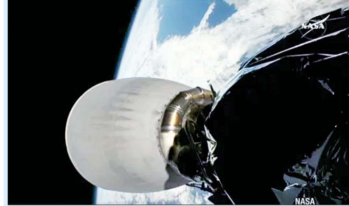
ispace ကုမ္ပဏီသည် ၎င်း၏ လဆင်းယာဉ်လကမ္ဘာသို့ အောင်မြင်စွာ ဆင်းသက်နိုင်ပါက လကမ္ဘာသို့ ဆင်းသက်နိုင်သော ပထမဆုံးပုဂ္ဂလိက ဂျပန်ကုမ္ပဏီဖြစ်လာမည်ဖြစ်သည်။ ispace ကုမ္ပဏီမှ စီအီးအိုဖြစ်သူ ဟာကာမာဒါ တာကေရှိက လွန်ခဲ့သည့် နှစ်နှစ်ခန့်က ပထမဆုံးအကြိမ် ကြိုးပမ်းအားထုတ်မှုမှ သင်ခန်းစာများကို လေ့လာပြီး ယုံကြည်မှုအပြည့်ဖြင့် လဆင်းယာဉ်မစ်ရှင်ကို လုပ်ဆောင်နေကြောင်း ပြောသည်။ အင်န်အိတ်ချ်ဂေက

ပြီးနောက် ယခုအခါ လကမ္ဘာသို့ လဆင်းယာဉ် ဒုတိယအကြိမ် ဆင်းသက်ရန် လုပ်ဆောင်လျက်ရှိသည်။ လဆင်းယာဉ် သယ်ဆောင်သော ဒုံးပျံကို ဇန်နဝါရီ ၁၅ ရက် ဒေသစံတော်ချိန် နံနက် ၁ နာရီက ကနေဒီအကာသစင်တာမှ လွှတ်တင်ခဲ့ခြင်းဖြစ်သည်။ အာကာသယာဉ်သည် လွှတ်တင်ပြီး မိနစ် ၉၀ ခန့်အကြာတွင် ဒုံးပျံမှ ခွဲထွက်ကာ ပတ်လမ်းအတွင်းသို့ အောင်မြင်စွာ ဝင်ရောက်နိုင်ခဲ့သည်။