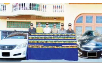
ပြည်တွင်းသတင်း ၈၁ ၁၅

မန္တလေးမြို့၌ မြန်မာ-အိန္ဒိယနယ်စပ်သို့ မူးယစ်ဆေးဝါး သယ်ဆောင်ရောင်းဝယ်သည့် အဖွဲ့အား ဘိန်းဖြူ ၅ ဒသမ ၉၄ ကီလို၊ PHENSEDYL ပုလင်း ၃၀ နှင့်အတူ ဖော်ထုတ်ဖမ်းဆီးရမိ