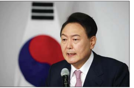
ရန် ငြင်းဆိုကြောင်း ယွန်ဟက်သတင်းဌာနက ပြောသည်။ သမ္မတလုံခြုံရေးအဖွဲ့နှင့် ပဋိပက္ခဖြစ်ပွားခြင်းမရှိကြောင်း သိရသည်။ အင်န်အိတ်ချ်ဂေက

ယွန်ကို ဆိုးလ်မြို့အနီး ဂျောင်ဂီပြည်နယ်ရှိ အဆင့်မြင့်အရာရှိများအတွက် စုံစမ်းစစ်ဆေးရေးရုံးတွင် မေးမြန်းစစ်ဆေးနေသည်။ စီဒီယိုရိုက်ကူးမှုကိရိယာများပါရှိသည့် အခန်းတစ်ခုအတွင်း မေးမြန်းမှုများ လုပ်ဆောင်နေသော်လည်း ယွန်က စကားပြောရန် သို့မဟုတ် ရိုက်ကူး