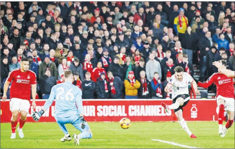
လီဗာပူးအသင်းမှ လူစားဝင်တိုက်စစ်ကစားသမား ဂျီတာ နော်တင်ဟမ်အသင်းဘက်သို့ ရိုးသွင်းယူရန် ကြိုးပမ်းစဉ်။

ပရီမီယာလိဂ်ပွဲစဉ် (၂၁) မှ စိတ်ဝင်စားဖွယ်ရာ အကောင်းဆုံးပွဲစဉ်တစ်ပွဲဖြစ်သည့် နော်တင်ဟမ်ဖော့ရက်စ်နှင့် လီဗာပူးအသင်းပွဲစဉ်ကို ဇန်နဝါရီ ၁၅ ရက် နံနက် ၂ နာရီခွဲက ယှဉ်ပြိုင်ကစားခဲ့ရာ တစ်ဖက်တစ်ရိုးစီဖြင့် ပွဲပြီးဆုံးခဲ့သည်။