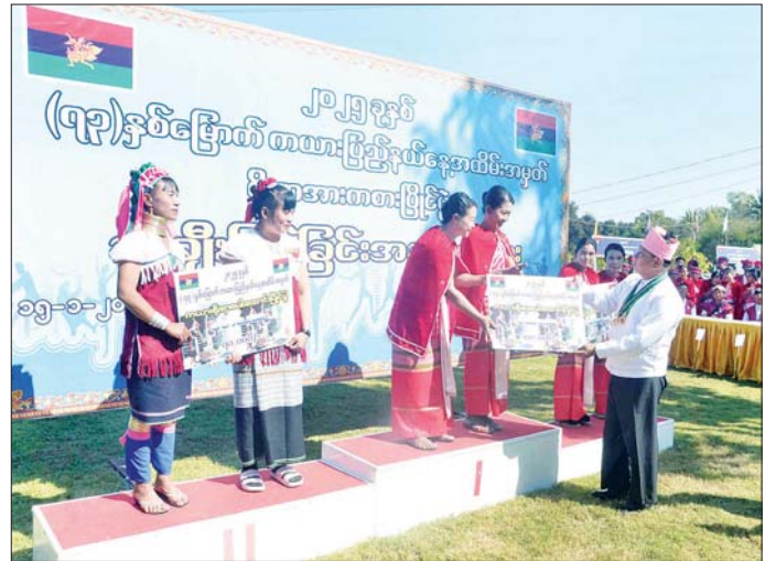
နိုင်ငံတော်စီမံအုပ်ချုပ်ရေးကောင်စီအဖွဲ့ဝင် ဒုတိယဝန်ကြီးချုပ်နှင့် ပြည်ထောင်စုဝန်ကြီး ဗိုလ်ချုပ်ကြီး တင်အောင်စန်း (၇၃)နှစ်မြောက် ကယားပြည်နယ်နေ့အထိမ်းအမှတ် အားကစားပြိုင်ပွဲတွင် ဆုရရှိသူများ အား ဆုပေးအပ်စဉ်။

* ရှေးမှူးမှ ပြည်နယ်ဝန်ကြီးချုပ်နှင့် ဒေသ တင်အောင်စန်းက အထိမ်းအမှတ် အခမ်းအနားတွင် နိုင်ငံတော် ကွက်ကရေးမှူးတို့က ကယား မုခ်ဦးကို စက်ခလုတ်နှိပ်၍ စီမံအုပ်ချုပ်ရေးကောင်စီ အဖွဲ့ဝင် ပြည်နယ်နေ့အထိမ်းအမှတ် မုခ်ဦး ဖွင့်လှစ်ပေးသည်။ ပိုးရယ်အောင်သိန်း၊ ပြည်ထောင်စု ကို ဖဲကြီးမြတ်ဖွင့်လှစ်ပေးပြီး ထို့နောက် အခမ်းအနားကို ဝန်ကြီး ဒုတိယဗိုလ်ချုပ်ကြီး ဒုတိယဝန်ကြီးချုပ်နှင့် ပြည် ပြည်နယ်ခန်းမ၌ ဆက်လက် ထွန်းထွန်းနေ့နှင့် ဦးညောင်ထွန်း၊ ထောင်စုဝန်ကြီး ဗိုလ်ချုပ်ကြီး ကျင်းပရာ သဘာပတိအဖွဲ့ဝင်များ