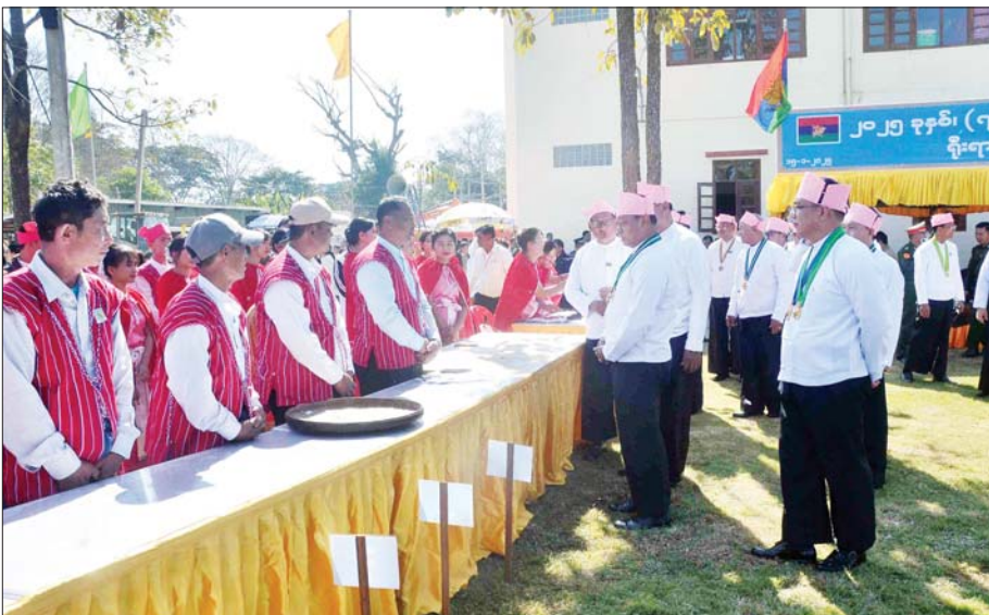
နိုင်ငံတော်စီမံအုပ်ချုပ်ရေးကောင်စီအဖွဲ့ဝင် ဒုတိယဝန်ကြီးချုပ်နှင့် ပြည်ထောင်စုဝန်ကြီး ဗိုလ်ချုပ်ကြီး တင်အောင်စန်း (၇၃)နှစ်မြောက် ကယားပြည်နယ်နေ့ အခမ်းအနား တက်ရောက်လာကြသည့် ဒေသခံတိုင်းရင်းသားများအား ရင်းရင်းနီးနီးနှုတ်ဆက်စဉ်။

နှင့် ဒေါတမရပ်ကွက်ရှိ ဘူတာ လမ်း ကတ္တရာကွန်ကရစ်လမ်းသစ် ဖွင့်ပွဲသို့ တက်ရောက်ရာ ဒုတိယ ဝန်ကြီးချုပ်နှင့် ပြည်ထောင်စု ဝန်ကြီးက ဘူတာလမ်း ကတ္တရာ ကွန်ကရစ်လမ်းသစ် ဖွင့်ပွဲမှစဉ်း ကို စက်လှေတံတိုင်းပေးပြီး အကအဖွဲ့များကို ဂုဏ်ပြုချီးမြှင့် ငွေများ ပေးအပ်၍ လမ်းသစ်ကို ဖြတ်သန်းကြည့်ရှုကာတက်ရောက် လာသော တိုင်းရင်းသားရိုးရာ အကအဖွဲ့များနှင့် ဒေသခံပြည်သူ များအား ရင်းရင်းနီးနီးနှုတ်ဆက် ကြသည်။ ယင်းနေ့က လှိုင်ကော်မြို့ တည်ဆောက်ဆဲ သီရိမင်္ဂလာ ဈေးသစ်လုပ်ငန်းများ ဆောင်ရွက် နေမှု၊ လုပ်ငန်းပြီးစီးမှုအခြေအနေ များကို လှည့်လည်ကြည့်ရှုပြီး ဒုတိယဝန်ကြီးချုပ်နှင့် ပြည် ထောင်စုဝန်ကြီးက အဆင့်မြင့် ဈေးသစ် တည်ဆောက်ခြင်းနှင့် စပ်လျဉ်း၍ လိုအပ်သည်များ မှာကြားသည်။ ဆက်လက်၍ လှိုင်ကော်မြို့ ခုတင် ၅၀၀ ဆံ့ ပြည်နယ်ပြည်သူ့ ဆေးရုံကြီး၌ ကျန်းမာရေးဝန်ထမ်း များနှင့်တွေ့ဆုံပြီး ဒုတိယဝန်ကြီး ချုပ်နှင့် ပြည်ထောင်စုဝန်ကြီးနှင့် တာဝန်ရှိသူများက ဆေးပဒေသာ