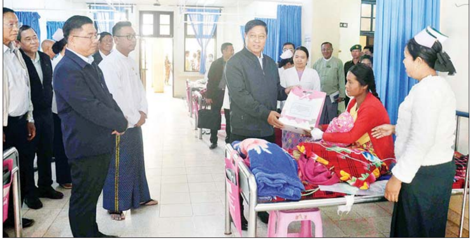
နိုင်ငံတော်စီမံအုပ်ချုပ်ရေးကောင်စီအဖွဲ့ဝင် ဒုတိယဝန်ကြီးချုပ်နှင့် ပြည်ထောင်စုဝန်ကြီး ဗိုလ်ချုပ်ကြီး တင်အောင်စန်း၊ လှိုင်ကော်မြို့၊ ဒုတင် ၅၀၀ ဆံ့ ပြည်နယ်ပြည်သူ့ဆေးရုံကြီး၌ ဆေးကုသသည့်လူနာများအား အာဟာရဖြည့်စွက်စာနှင့် ချီးမြှင့်ငွေပေးအပ်စဉ်။

ကျောက်ကပ်တု သန့်စင်ဌာန၊ ရောဂါရှာဖွေရေးဌာန၊ ကွန်ပျူတာ ဓာတ်မှန်ဌာနနှင့် ဆေးသိုလှောင် ရုံများသို့ လှည့်လည်ကြည့်ရှုသည်။ မွန်းလွဲပိုင်းတွင် လှိုင်ကော် မြို့ပေါ်ရှိ ရွှေတောင်ပရိယတ္တိ စာသင်တိုက်၌ ကျင်းပသည့် ဆန်း၊