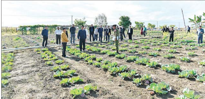
နိုင်ငံတော်စီမံအုပ်ချုပ်ရေးကောင်စီအဖွဲ့ဝင် ဒုတိယဝန်ကြီးချုပ်နှင့် ပြည်ထောင်စုဝန်ကြီး ဗိုလ်ချုပ်ကြီး တင်အောင်စန်းနှင့် အဖွဲ့ဝင်များ ပုတာအိုမြို့နယ်အတွင်းရှိ တပ်နယ်ဧက ၅၀၀ ဘက်စုံစိုက်ပျိုးမွေးမြူရေးမြေ (နမ့်တာလဲ) ၌ သီးပင်စားပင်များ စိုက်ပျိုးထားရှိမှုကို ကြည့်ရှုစစ်ဆေးစဉ်။

မျိုးစေ့အိတ်များ၊ အိမ်သုံးဆီလှူဒါန်း အစုံ ၅၀၊ ကျောင်းသူအိပ်ဆောင်များကို လှည့်လည် နိုင်ငံတော်က အခမဲ့ပေးအပ်သည့် ကျောင်း သုံးဗလာစာအုပ်များ ချီးမြှင့်ပေးအပ်ကြ ပြီး ခန်းမအတွင်း ခင်းကျင်းပြသထား သည့် ဒေသထွက် အသင့်စားထုတ်ကုန် ပစ္စည်းများကို ကြည့်ရှုအားပေးကြသည်။ ဆက်လက်၍ ပုတာအို မြို့မရပ်ကွက် အတွင်းရှိ နယ်စပ်ရေးရာဝန်ကြီးဌာန ပညာရေးနှင့် လေ့ကျင့်ရေးဦးစီးဌာန နယ်စပ်ဒေသ တိုင်းရင်းသားလူငယ်များ ဖွံ့ဖြိုးရေးသင်တန်းကျောင်း (ပုတာအို)၌ ပုတာအိုဒေသအတွင်းရှိ ဘာသာရေး ဆရာ ဆရာမများ၊ ကျောင်းသား ကျောင်းသူများကို တွေ့ဆုံအားပေးစကား ပြောကြားပြီး ချီးမြှင့်ငွေများ၊ ကျောင်း ဝတ်စုံများ၊ ကျောင်းသုံးပစ္စည်းများနှင့် အားကစားအထောက်အကူပြုပစ္စည်းများ ပေးအပ်ချီးမြှင့်၍ သင်တန်းကျောင်းဝင်း အတွင်းရှိ စားရိပ်သာနှင့် ကျောင်းသား ကျောင်းသူအိပ်ဆောင်များကို လှည့်လည် ကြည့်ရှုစစ်ဆေးသည်။ ပြည်ဆည်းဆောင်ရွက်ပေး ယမန်နေ့ညနေပိုင်းက ဒုတိယ ဝန်ကြီးချုပ်နှင့် ပြည်ထောင်စုဝန်ကြီး ဗိုလ်ချုပ်ကြီး တင်အောင်စန်း၊ နိုင်ငံတော် စီမံအုပ်ချုပ်ရေးကောင်စီအဖွဲ့ဝင်၊ ပြည် ထောင်စုဝန်ကြီးများ၊ ပြည်နယ်ဝန်ကြီး ချုပ်နှင့် တာဝန်ရှိသူများသည် ခါကာ ဘိုရာဇီရိပ်သာ ဧည့်ခန်းမဆောင်၌ ပုတာအိုဒေသအတွင်းရှိ ဘာသာရေး အသင်းအဖွဲ့များမှ ခေါင်းဆောင်များ၊ စာပေနှင့်ယဉ်ကျေးမှုအဖွဲ့များမှ တာဝန် ရှိသူများနှင့်တွေ့ဆုံပြီး ဒေသဖွံ့ဖြိုးတိုးတက် ရေးဆိုင်ရာကိစ္စရပ်များကို ဆွေးနွေး ညှိနှိုင်း၍ လိုအပ်သည်များကို ပြည့်ဆည်း ပေးအပ်ချီးမြှင့်၍ သင်တန်းကျောင်းဝင်း ဆောင်ရွက်ပေးခဲ့ကြောင်း သတင်းရရှိ အတွင်းရှိ စားရိပ်သာနှင့် ကျောင်းသား သတင်းစဉ်