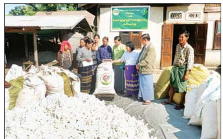
အစဉ်အလာ ပြည်သူ့စိမ်းစိုင်းပွဲအကောင်အထည်ဖော်ဆောင်ရွက်နေကြောင်း မြေပုံဖော်ပြချက်ကို ရှင်းပြကြောင်း သိရသည်။

သာစည် ဇန်နဝါရီ ၁၂ - မန္တလေးတိုင်းဒေသကြီး သာစည်မြို့နယ်၌ မိုးနှောင်းချည်မျှင်ရှည်ဝါ Grade ခွဲခြားဝယ်ယူစုပေါင်းရောင်းချပွဲကို ဇန်နဝါရီ ၁၂ ရက်က