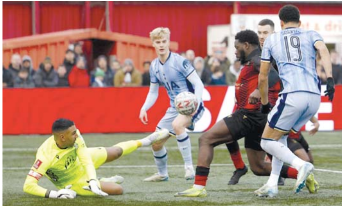
■ နေရှင်နယ်လီဂလပ် တမ်းဂျယ်အသင်းနှင့် စပါးအသင်းတို့ အကြိတ်အနယ်ယှဉ်ပြိုင်ကစားစဉ်။

ကြီးပွဲစဉ်ရလဒ်များတွင် လိဒ်စစ်က ဟာဂိုးဂိုးတိုကို တစ်ဂိုး - ဂိုးမရှိ၊ မန်စီးတီးက ဆဲလ်ဗီးဒီကို ရှစ်ဂိုး - ဂိုးမရှိဖြင့် နိုင်ပွဲကိုယ်စီရရှိပြီး နောက်တစ်ဆင့်သို့ တက်လှမ်းနိုင် ခဲ့သည်။