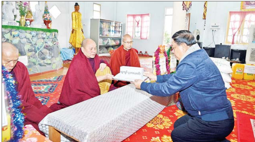
နိုင်ငံတော်စီမံအုပ်ချုပ်ရေးကောင်စီအဖွဲ့ဝင် ဒုတိယဝန်ကြီးချုပ်နှင့် ပြည်ထောင်စုဝန်ကြီး ဗိုလ်ချုပ်ကြီး တင်အောင်စန်း ပူတာအိုမြို့ မြို့မရပ်ကွက်အတွင်းရှိ တောင်တန်းသာသနာပြုဗဟိုကျောင်း ကျောင်းထိုင်ဆရာတော်ထံ အလှူငွေကျပ်သိန်း ၃၀ ပေးအပ်လှူဒါန်းစဉ်။

တည်ထားကိုးကွယ်သော ရှေးဟောင်း သမိုင်းဝင် ကောင်းမွန်စေတီတော်သို့ သွားရောက်ဖူးမြော်ကြည့်ညိုကာ စေတီ တော်ဘက်စွဲပြုပြင်မွမ်းမံနိုင်ရေးအတွက် အလှူငွေများ ပေးအပ်လှူဒါန်းသည်။ အစာအိတ်များ ပေးအပ် ထိုနောက် ပူတာအိုမြို့နယ်အတွင်းရှိ တပ်နယ် ၈၈ ဘက်စုံစိုက်ပျိုး မွေးမြူရေးမြို့ (နန်တာလဲ)၌ သီးပင်စားပင် စိုက်ပျိုးထားရှိမှု၊ ဥစားကြက်နှင့် အသား တိုးဝက်များမွေးမြူထားရှိမှုကို လှည့်လည် ကြည့်ရှုစစ်ဆေးပြီး စိုက်ပျိုးဆောင်ရွက် နိုင်မှုနှင့် ဒေသတွင်း ပြန်လည်ရောင်းချ ပေးနိုင်သည့် အခြေအနေများကို မေးမြန်း ဆွေးနွေးကာ မွေးမြူရေးအထောက်အကူ ပြုဆေးဝါးများနှင့် စွမ်းအားပြည့်ဖြည့်စွက် အစာအိတ်များကို ပေးအပ်သည်။ ယင်းနောက် ဒုတိယဝန်ကြီးချုပ် နှင့် ပြည်ထောင်စုဝန်ကြီး ဗိုလ်ချုပ်ကြီး တင်အောင်စန်းသည် အဖွဲ့ဝင်များနှင့် အတူ ပူတာအိုမြို့ ဖုန်ကန်ရာဇီခန်းမ၌ ကျင်းပသည့် ခရိုင်အဆင့်ဌာနဆိုင်ရာများ၊ မြို့မ၊ မြို့ဖများ၊ တိုင်းရင်းသားစာပေနှင့်