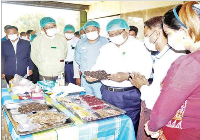
ပြည်ထောင်စုဝန်ကြီး ဒေါက်တာချာလီသန်း မိတ္ထီလာမြို့နယ် ကဲဦးစံပြကျေးရွာရှိ အသားခြောက်လုပ်ငန်း နှင့် အေးခဲသားများ ထုတ်လုပ်သည့် လုပ်ငန်းများအား ကြည့်ရှုစစ်ဆေးစဉ်။