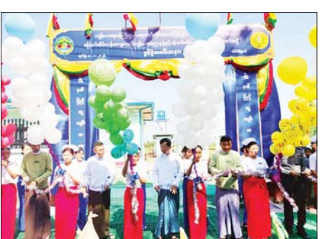
မြေနေရာအလျှောက်အား ဂုဏ်ပြုမှတ်တမ်းလွှာများ ပေးအပ်ခဲ့ကြောင်း သိရသည်။

အိမ်မဲ ဇန်နဝါရီ ၁၂ - ရောဂါတိုင်းဒေသကြီး အိမ်မဲမြို့နယ် ပြည်သူ့ကျန်းမာရေးဦးစီးဌာန လူကောင်းကျွန်း ကျေးလက်ကျန်းမာရေးဌာနအောက်ရှိ ခြောက်အိမ်တန်း ကျေးလက်ကျန်းမာရေးဌာနခွဲနှင့် ဝန်ထမ်းအိမ်ရာ စံကိုက်အဆောက်အအုံဖွင့်ပွဲအခမ်းအနားကို ခြောက်အိမ်တန်းကျေးရွာ၌ ယမန်နေ့က ကျင်းပသည်။