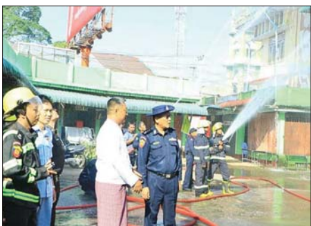
တွင် ပြည်သူတို့၏ အရင်းအနှီးအတွက် မီးငြိမ်းသတ်ရေး သရုပ်ပြလေ့ကျင့်ခြင်းကို ယနေ့နံနက် ၉ နာရီက ဘားအံမြို့နယ် မြို့မဈေးကြီး၌ ဆောင်ရွက်ရာနေရာဖြစ်သည့် ဈေးများတွင် မီးလောင်မှုဖြစ်ပွားပါက ထိရောက်

မြန်မာနိုင်ငံတွင် ပွင့်လင်းရာသီသို့ ရောက်ရှိလာမှုနှင့်အတူ မီးလောင်မှုများလည်း ဒေသအနှံ့အပြား၌ မကြာခဏ ဖြစ်ပေါ်လျက်ရှိရာ ကရင်ပြည်နယ် ဘားအံမြို့နယ်တွင် ဈေးမီးလောင်မှုဖြစ်ပွားစေရန်နှင့် မီးလောင်မှုဖြစ်ပွားလာပါက ထိရောက်လျင်မြန်စွာ မီးငြိမ်းသတ်နိုင်ရေးအတွက် ဈေးမီးငြိမ်းသတ်ရေး သရုပ်ပြလေ့ကျင့်ခြင်းကို ယနေ့နံနက် ၉ နာရီက ဘားအံမြို့နယ် မြို့မဈေးကြီး၌ ဆောင်ရွက်သည်။