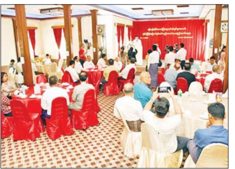
များအသင်းမှတစ်ဆင့် တိုက်တွန်းလိုကြောင်း ပြောကြားသည်။

ရန်ကုန် ဇန်နဝါရီ ၁၂ - ရန်ကုန်တိုင်းဒေသကြီး ရွှေလုပ်ငန်းရှင်များအသင်း(၁၆) ကြိမ်မြောက် နှစ်ပတ်လည်အသင်းသားစုံညီအစည်းအဝေးကို ယနေ့နံနက် ၉ နာရီတွင် လမ်းမတော်မြို့နယ် အမှတ်(၂၀၅) ဝါးတန်းလမ်းနှင့်မင်းရဲကျော်စွာလမ်းထောင့်ရှိ Panda Restaurant ၌ ကျင်းပသည်။