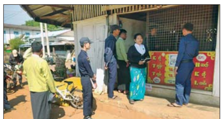
စစ်ဆေးကာ ဈေးသူဈေးသားများအား မီးဘေးအန္တရာယ်ကြိုတင်ကာကွယ်ရေးလုပ်ငန်းများနှင့်ပတ်သက်၍ အသိပညာပေးဟောပြောခဲ့ကြောင်း သိရသည်။

ပဲခူးတိုင်းဒေသကြီး ရွှေကျင်မြို့နယ် မြို့မဈေးအတွင်း မီးဘေးလုံခြုံရေးအတွက် မြို့နယ်မီးသတ်ဦးစီးဌာနနှင့် မြို့နယ်စည်ပင်သာယာရေးအဖွဲ့တို့ပူးပေါင်း၍ မီးဘေးကြိုတင်ကာကွယ်ရေးအသိပညာပေးခြင်းကို ယနေ့ နံနက် ၁၀ နာရီက ပြုလုပ်သည်။