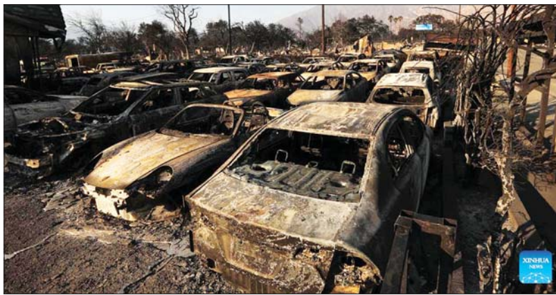
လော့ခ်အိန်ဂျလိစ်မြို့ Altadena ဒေသညီ တောမီးကြောင့် ကားများ ပျက်စီးနေသည်ကို ဇန်နဝါရီ ၁၀ ရက်က တွေ့ရစဉ်။

လော့ခ်အိန်ဂျလိစ်ရဲ့ နေရာအနှံ့အပြားမှာ ပြင်းထန်တဲ့တောမီးက ဇန်နဝါရီ ၁၀ ရက်အထိ ဆက်လက်လောင်နေတဲ့အတွက် ကျောင်းတွေပိတ်ထားရခြင်း၊ ဖျော်ဖြေရေးနှင့် အားကစားပွဲတွေပယ်ဖျက်ခဲ့ရပါတယ်။