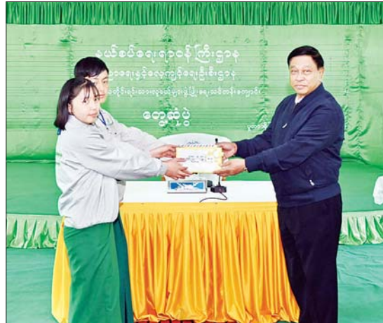
နိုင်ငံတော်စီမံအုပ်ချုပ်ရေးကောင်စီအဖွဲ့ဝင် ဒုတိယဝန်ကြီးချုပ်နှင့် ပြည်ထောင်စု ဝန်ကြီး ဗိုလ်ချုပ်ကြီး တင်အောင်စန်း ပူတာအို မြို့မရပ်ကွက်ရှိ နယ်စပ်ဒေသ တိုင်းရင်းသားလူငယ်များ ဖွံ့ဖြိုးရေးသင်တန်းကျောင်း (ပူတာအို)၌ ကျောင်းသား ကျောင်းသူများအား ချီးမြှင့်ငွေများ ပေးအပ်စဉ်။