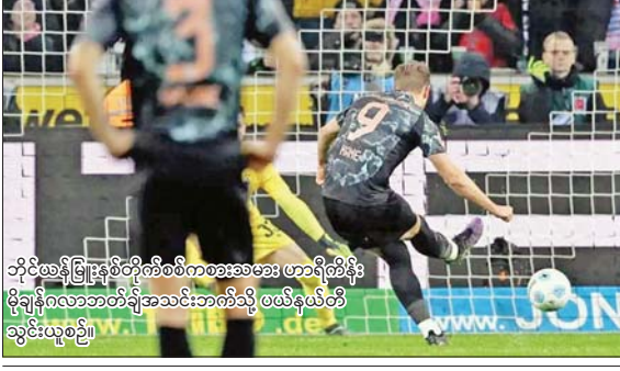
ဘိုင်ထန်မြူးနွဲ့စိတိကစားစခန်း ဟာဂီစိန်နိုး မိုချန်ဂလာဘတ်ချီအသင်းဘက်သို့ ဖယ်နယ်တီ ဆွဲခွင်းယူစဉ်။