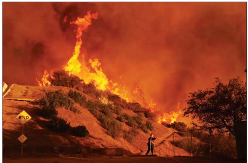
လော့ခ်အိန်ဂျလိစ်မြို့ Palisades ဒေသညီ မီးသတ်သမားတစ်ဦးက မီးငြိမ်းသတ်နေသည်ကို ဇန်နဝါရီ ၁၁ ရက်ကတွေ့ရစဉ်။

မြို့အနီး ၁၄၁၁၇ ဧကကို လောင်ခဲ့ပြီး ဇန်နဝါရီ ၁၁ ရက် မွန်းလွဲပိုင်းအထိ မီးလောင်မှု ၁၅ ရာခိုင်နှုန်း ထိန်းချုပ်နိုင်ခဲ့ပါတယ်။ မီးဟာ မတ်စောက်ပြီး လက်လှမ်းမမီတဲ့မြေခဲ၊ ခြောက်သွေ့တဲ့ သဘာဝပေါက်ပင်တွေရှိတဲ့ နေရာကို နေချင်းညချင်းလောင်တယ်လို့ ကယ်လီဖိုးနီးယားသစ်တောနှင့်မီးဘေးကာကွယ်ရေးဌာနက ဆိုတယ်။ လော့ခ်အိန်ဂျလိစ်ဒေသအတွင်း လောင်နေတဲ့ တောမီးဟာ ဒေသငါးခုထက်မနည်း ရှိတဲ့အနက် Palisades မီးဟာ မီးလောင်မှုအကြီးဆုံးဖြစ်ပြီး ဧက ၂၂၆၀၀ ကို လောင်ခဲ့တယ်။ ယင်းဒေသမှာလောင်တဲ့ တောမီးဟာ ဇန်နဝါရီ ၇ ရက်ကစပြီး အဆောက်အအုံ ၅၃၀၀ ကျော်ကို ဖျက်ဆီးပစ်လိုက်ပြီး အခုအချိန်အထိ မီးလောင်မှု ၁၁ ရာခိုင်နှုန်းကို ထိန်းထားနိုင်ခဲ့တယ်။