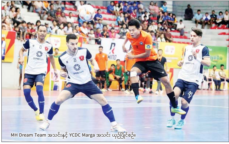
MH Dream Team အသင်းနှင့် YCDC Marga အသင်း ယှဉ်ပြိုင်စဉ်။

ရန်ကုန် ဇန်နဝါရီ ၁၂ ၂၀၂၄-၂၀၂၅ ရာသီ MFF ဖူဆယ်လိဂ်-၁ ပြိုင်ပွဲ ပွဲစဉ် (၅) ကို ဇန်နဝါရီ ၁၂ ရက်က ရန်ကုန်မြို့ သုဝဏ္ဏဘေလုံးကွင်းရှိ MFF ဖူဆယ်အားကစားရုံ၌ ကျင်းပရာ MIU နှင့် MH Dream Team နိုင်ပွဲဆက်ပြီး YRG အသင်း ပထမဆုံး နိုင်ပွဲရရှိကာ လက်ရှိချန်ပီယံ VUC အသင်း နိုင်ပွဲပျောက်ဆုံးခဲ့သည်။ ယခုရာသီတွင် မြေမှန်ရနေသည့် နာမည်ကြီး MIU အသင်းသည် ရာနှုန်းပြည့်နိုင်ပွဲဖြင့် ဆက်လက်ဦးဆောင်လျက်ရှိပြီး MH Dream Team အသင်းကလည်း နိုင်ပွဲရယူကာ ဖိအားပေးလျက်ရှိသည်။ လက်ရှိချန်ပီယံ စာမျက်နှာ ၁၂ ကော်လံ ၃ ၀