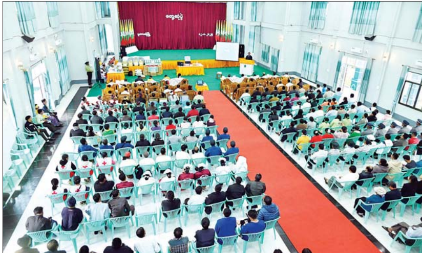
နိုင်ငံတော်စီမံအုပ်ချုပ်ရေးကောင်စီအဖွဲ့ဝင် ဒုတိယဝန်ကြီးချုပ်နှင့် ပြည်ထောင်စုဝန်ကြီး ဗိုလ်ချုပ်ကြီး တင်အောင်စန်း ပူတာအို မြို့ ဖုန်ကန်ရာဇီခန်းမ၌ ခရိုင်အဆင့်ဌာနဆိုင်ရာများ၊ မြို့မ၊ မြို့ဖများ၊ တိုင်းရင်းသားစာပေနှင့် ယဉ်ကျေးမှုအသင်းအဖွဲ့များ၊ ဒေသခံပြည်သူများအား တွေ့ဆုံအမှာစကားပြောကြားစဉ်။

ယဉ်ကျေးမှုအသင်းအဖွဲ့များ၊ ဒေသခံ ပြည်သူများနှင့် တွေ့ဆုံအမိန့်အနားသို့ တက်ရောက်သည်။ ထိုသို့တွေ့ဆုံစဉ် ခရိုင်စီမံအုပ်ချုပ်ရေး အဖွဲ့ဥက္ကဋ္ဌ ဦးစိုးထွန်းက ပူတာအိုဒေသ ရှိရာယဉ်ကျေးမှုအဖွဲ့ ခေါင်းဆောင်များ ဆိုင်ရာအချက်အလက်များကို လည်း က စာမျက်နှာ ၄ သို့