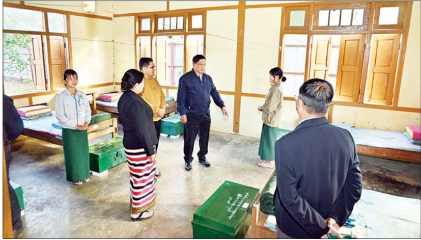
နိုင်ငံတော်စီမံအုပ်ချုပ်ရေးကောင်စီအဖွဲ့ဝင် ဒုတိယဝန်ကြီးချုပ်နှင့် ပြည်ထောင်စုဝန်ကြီး ဗိုလ်ချုပ်ကြီး တင်အောင်စန်း ပုတာအို မြို့မရပ်ကွက်အတွင်းရှိ နယ်စပ်ရေးရာဝန်ကြီးဌာန ပညာရေးနှင့် လေ့ကျင့်ရေးဦးစီးဌာန နယ်စပ်ဒေသ တိုင်းရင်းသားလူငယ်များ ဖွံ့ဖြိုးရေးသင်တန်းကျောင်း (ပုတာအို)အတွင်းရှိ ကျောင်းသူ အိပ်ဆောင်ကို ကြည့်ရှုစစ်ဆေးစဉ်။

ဒေသတွင်း စိုက်ပျိုးရေးနှင့် မွေးမြူရေး လုပ်ငန်းများကို တိုးချဲ့လုပ်ဆောင်ပြီး စိုက်ပျိုးမွေးမြူရေးထုတ်ကုန်များ၊ MSME လုပ်ငန်းများ တိုးမြှင့်ဆောင်ရွက်ခြင်းဖြင့် ဒေသတွင်း ဝမ်းစာဖူလုံအောင် ကြိုးစားဆောင်ရွက်ကြစေလိုကြောင်း ပြောကြားသည်။ ကြည့်ရှုအားပေး ယင်းနောက် ခုတီယဝန်ကြီးချုပ်နှင့် ပြည်ထောင်စုဝန်ကြီး ဗိုလ်ချုပ်ကြီး တင်အောင်စန်းနှင့် အဖွဲ့ဝင်များသည် ဘာသာရေးအဖွဲ့ (၁၃)ဖွဲ့အတွက် ဂုဏ်ပြု ချီးမြှင့်ငွေများ၊ ဝန်ထမ်းများအတွက် အခြေခံစားသောက်ကုန်များ၊ ပုတာအို မြို့နယ်နှင့် မချမ်းဘော့မြို့နယ် ပြည်သူ့ လုံခြုံရေးနှင့် အကြမ်းဖက်နှိမ်နင်းရေး အဖွဲ့များအတွက် ချီးမြှင့်ငွေများ၊ စာပေနှင့် ယဉ်ကျေးမှုအဖွဲ့များအတွက် DTH စလောင်းအစုံ ၃၀၊ တောင်သူများအတွက် အစေ့ထုတ်ပြောင်းနှင့် ဟင်းသီးဟင်းရွက်