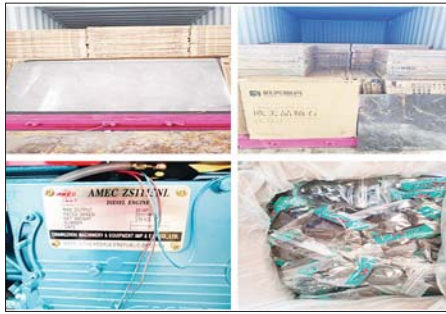
မြန်မာ့စက်မှုဆိပ်ကမ်း၌ ဖမ်းဆီးရမိမှု။

ထို့ပြင် ဧရာဝတီတိုင်းဒေသကြီး တရားမဝင်ကုန်သွယ်မှုတိုက်ဖျက် ရေးအထူးအဖွဲ့၏ စီမံခန့်ခွဲမှုဖြင့် တာဝန်ကျပူးပေါင်းအဖွဲ့က စစ်ဆေးမှု