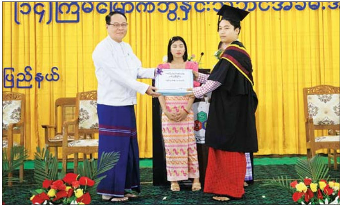
ဘွဲ့နှင်းသဘင်မိန့်ခွန်းပြောကြားသည်။ ၂၅ ဦးအား သက်ဆိုင်ရာကွန်ပျူတာဘွဲ့ အသီးသီးကို ယနေ့ ဘွဲ့နှင်းသဘင် အခမ်းအနားတွင် အပ်နှင်းခဲ့သည်။ အဝေးရောက်ဘွဲ့ ယူသူ လေးဦးအပါအဝင် စုစုပေါင်း ၁၅၆ ဦး (ပြန်/ဆက်)

ထို့နောက် ကွန်ပျူတာတက္ကသိုလ် (ဘားအံ) ပါမောက္ခချုပ် ဒေါက်တာ ခင်မာလာထွန်း အမှူးပြုသော စီမံခန့်ခွဲရေးအဖွဲ့နှင့် ပညာရေးအဖွဲ့ဝင်ပုဂ္ဂိုလ်များက ဘွဲ့အပ်နှင်းမည့်စင်မြင့်ထက်တွင် နေရာယူကြပြီး လိုအပ်သည့် ကတိဝန်ခံချက်များ ရယူကာ ကွန်ပျူတာတက္ကသိုလ်(ဘားအံ) ပါမောက္ခချုပ်က B.S. (Bachelor of Computer Science (B.C.Sc.)) ၁၆ ဦး၊ B.Tech. (Bachelor of Computer Technology (B.C.Tech.)) ၄၆ ဦးတို့အား ဘွဲ့လက်မှတ်များအပ်နှင်းပေးအပ်ပြီး အဝေးရောက်ဘွဲ့ ယူသူ ကွန်ပျူတာဘွဲ့အပ်နှင်းပေးအပ်ပြီး B.S. (Bachelor of Computer Science (B.C.Sc.)) လေးဦးတို့အား ဘွဲ့အပ်နှင်းပေးအပ်ဘွဲ့ရ မှတ်ပုံတင်စာအုပ်တွင် ဘွဲ့ရရှိသူစာရင်းကို အတည်ပြုလက်မှတ်ရေးထိုး၍