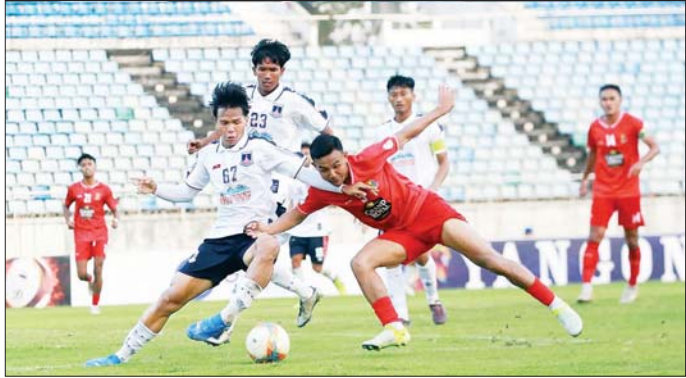
ယှဉ်ပြိုင်ရမည်ဖြစ်သောကြောင့် ပွဲထွက်လူစာရင်းကို အပြောင်းအလဲ ပြုလုပ်ခဲ့သော်လည်း အိမ်ကွင်း၌ အမှတ်ပြည့်ရယူနိုင်ခဲ့သည်။ ရှမ်းယူနိုက်တက်အသင်း အတွက် အနိုင်ဂိုးများကို ၄၅+၂ မိနစ်တွင် ကျော်ကိုကို၊ ၅၂ မိနစ်တွင် ဘာတာယိုကို၊ မိနစ် ၇၀ တွင် ရင်တာရီ တို့က သွင်းယူပြီး သစ္စာအားမာန်အသင်းအတွက် ချေပဂိုးတစ်ဂိုးကို ၈၅ မိနစ်တွင် ပြည့်စုံအောင်က သွင်းယူသည်။ ယခုပွဲအတွက် အကောင်းဆုံးဆုကို ရှမ်းယူနိုက်တက်အသင်းက သက်တမ်းစိုက် ရရှိသည်။ ယခုပွဲအပြီးတွင် ရှမ်းယူနိုက်တက်အသင်း က ၁၅ ပွဲကစား ၄၃ မှတ်ဖြင့် ဦးဆောင်နေပြီး သစ္စာ အားမာန်အသင်းက ၁၅ ပွဲကစား ၁၁ မှတ် ရရှိထား သည်။ ပွဲစဉ် (၁၅) နောက်ဆုံးနေ့အဖြစ် ဇန်နဝါရီ ၁၃ ရက် (ယနေ့)တွင် သုဝဏ္ဏကင်း၌ ဧရာဝတီ ယူနိုက်တက်အသင်းနှင့် အား/ကာသိပွဲအသင်း ယှဉ်ပြိုင်ကစားမည်ဖြစ်သည်။ ရဲရင့်လွင်

ပထမပိုင်းတွင် ဂိုးမရှိသရေကျနေသည်။ ၅၉ မိနစ် တွင် ရတနာပုံအသင်း ဂိုးစတင်ရရှိခဲ့ပြီး တိုက်စစ်မှူး ပြည့်မိုးက သွင်းယူခဲ့ခြင်းဖြစ်သည်။ ဂိုးပေးလိုက်ရ သဖြင့် ဟံသာဝတီအသင်းသည် ချေပရိုးရရန် ကြိုးပမ်းလာပြီး ၇၇ မိနစ်တွင် အောင်မြင်သူက ဂိုးပြန်သွင်းခဲ့ပြီး အနိုင်ဂိုးကို ၉၀+၀ မိနစ်တွင် ဝင်းမိုးကျော်က သွင်းယူခဲ့သည်။ ယခုပွဲအတွက် အကောင်းဆုံးဆုကို ဟံသာဝတီအသင်းတိုက်စစ်မှူး အောင်မြင်သူက ရရှိသည်။ ယခုပွဲအပြီးတွင် ဟံသာဝတီယူနိုက်တက်အသင်းက ၁၅ ပွဲကစား ၃၆ မှတ်၊ ရတနာပုံအသင်းက ၁၅ ပွဲကစား ၁၉ မှတ် ရရှိ ထားသည်။ တောင်ကြီးကွင်း၌ ကျင်းပသည့်ပွဲတွင် ရှမ်း ယူနိုက်တက်အသင်းက သစ္စာအားမာန်အသင်းကို သုံးဂိုး-တစ်ဂိုးဖြင့် အနိုင်ရခဲ့သည်။ ရှမ်းယူနိုက်တက် အသင်းသည် လာမည့်တစ်ပတ်တွင် ရန်ကုန်ယူနိုက် တက်အသင်း၊ ကြားရက်တွင် အာဆီယံကလပ်ပြိုင်ပွဲ