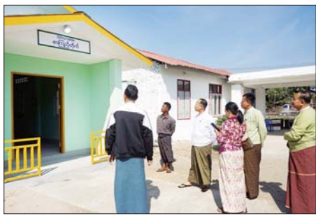
များကို ကြည့်ရှု၍ ပြည်နယ်လူမှုရေးရာဝန်ကြီးက စာကြည့်တိုက်ကို သတ်မှတ်ခံချိန်ဆွဲနံ့များနှင့် အညီ ဆောက်လုပ်ပြီးစီးမှုအခြေအနေများအဆောက်အအုံအရည်အသွေးပြည့်စီစေရေး၊ စာကြည့်

မော်လမြိုင် ဇန်နဝါရီ ၁၂ - စွန်ပြည်နယ် မော်လမြိုင်မြို့နယ် သာယာအေးရပ်ကွက်၌ စာကြည့်တိုက် အဆောက်အအုံသစ် တည်ဆောက်မှု အခြေအနေများကို ပြည်နယ်လူမှုရေးရာဝန်ကြီး ဦးစောကြည်နိုင်က ယနေ့နံနက်ပိုင်းက ကွင်းဆင်းကြည့်ရှုစစ်ဆေးသည်။