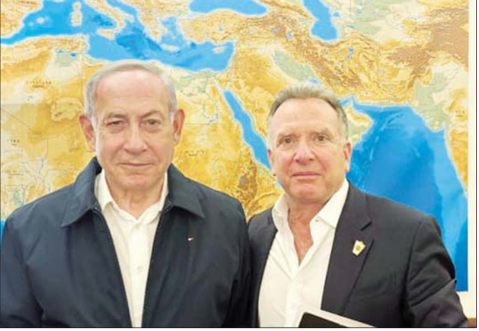
အစွဲရေးဝန်ကြီးချုပ် ဘင်ဂျမင်နေတန်ယာဟုနှင့် အမေရိကန်သမ္မတအဖြစ် ရွေးကောက်ခံထားရသည့် ဒေါ်နယ်ထရမ်၏ အရှေ့အလယ်ပိုင်းဆိုင်ရာ သံတမန် စတိဗ်ဝယ်ကော့။