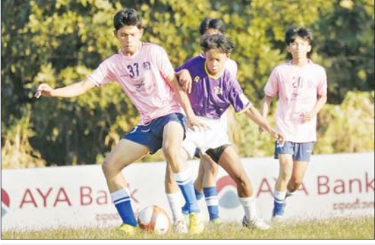
The Honour အသင်းနှင့် Golden Light United အသင်း ယှဉ်ပြိုင်နေစဉ်။

ရန်ကုန် ဇန်နဝါရီ ၁၁ ၂၀၂၄-၂၀၂၅ MFF ယူ-၁၅ လူငယ်လိဂ်ပြိုင်ပွဲ ပွဲစဉ် (၂) ပထမနေ့ကို ဇန်နဝါရီ ၁၁ ရက် နံနက်ပိုင်းနှင့် ညနေပိုင်းက သုဝဏ္ဏဘေသာကွင်း၌ ကျင်းပသည်။ နံနက်ပိုင်းကျင်းပသည့်ပွဲစဉ်များတွင် Southern Yangon Star အသင်းက မြသီတာအသင်းကို ငါးဂိုးပြတ်အနိုင်ရပြီး Burmese Youth အသင်းနှင့် မင်္ဂလာဒုံစီးတီးအသင်း တစ်ဂိုးစီသာရကျခဲ့သည်။ ညနေပိုင်း ကျင်းပသည့်ပွဲတွင် ရှိုင်ရယ်ရန်ကုန်အသင်းက ရန်ကုန်တောင်လေအသင်းကို သုံးဂိုး-တစ်ဂိုး၊ The Honour အသင်းက Golden Light United အသင်းကို နှစ်ဂိုး-ဂိုးမရှိဖြင့် အနိုင်ရခဲ့သည်။ ညိုမြတ်သော်တာ၊ ဓာတ်ပုံ-MFF