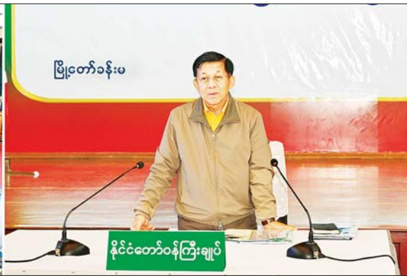
နိုင်ငံတော်စီမံအုပ်ချုပ်ရေးကောင်စီဥက္ကဋ္ဌ နိုင်ငံတော်ဝန်ကြီးချုပ် ဗိုလ်ချုပ်မှူးကြီး မင်းအောင်လှိုင် ပြင်ဦးလွင်မြို့နယ်အတွင်းရှိ အသေးစား၊ အငယ်စားနှင့် အလတ်စားစီးပွားရေး (MSME) လုပ်ငန်းရှင်များနှင့် တွေ့ဆုံ၍ ဒေသဖွံ့ဖြိုးတိုးတက်ရေးနှင့် ဒေသထုတ်ကုန်များတိုးမြှင့်ထုတ်လုပ်ရေးဆိုင်ရာများ ဆွေးနွေးပြောကြားစဉ်။