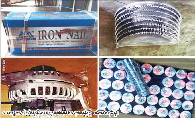
အေးရှားဝေါလီကုန်သွယ်ရေးစစ်ဆေးရေးစခန်း၌ ဖမ်းဆီးရမိမှု။

နေပြည်တော် ဇန်နဝါရီ ၁၁ တရားမဝင်ကုန်သွယ်မှုတိုက်ဖျက်ရေး ဦးဆောင်ကော်မတီ၏ ကြီးကြပ်ကွပ်ကဲမှုဖြင့် တရားမဝင်ကုန်သွယ်မှုများကို ဥပဒေနှင့်အညီ ထိရောက်စွာ တားဆီးအရေးယူနိုင်ရေး ဆောင်ရွက်လျက်ရှိပါသည်။ ထိုသို့ဆောင်ရွက်လျက်ရှိရာ ဇန်နဝါရီ ၉ ရက်တွင် အကောက်ခွန်ဦးစီးဌာန၏ စီမံခန့်ခွဲမှုဖြင့် တာဝန်ကျပူးပေါင်းအဖွဲ့များက စစ်ဆေးမှုများဆောင်ရွက်ခဲ့ရာ သီလဝါဆိပ်ကမ်း၌ ကုန်သွယ်ရေးကုန်ပစ္စည်းများမှ တရားဝင်စာရွက်စာတမ်းအထောက်အထား တင်ပြနိုင်ခြင်းမရှိသည့် လုပ်ငန်းသုံးပစ္စည်း ၁၀ မျိုး (ခန့်မှန်းတန်ဖိုးငွေကျပ် ၁၉၂၄၅၅၇၉)ကို လည်းကောင်း၊ အေးရှားဝေါလီကုန်သွယ်ရေး စစ်ဆေးရေးစခန်း၌ ကုန်သွယ်ရေး ၁၆ လုံးအတွင်းမှ တရားဝင်စာရွက်စာတမ်း အထောက်အထားတင်ပြနိုင်ခြင်းမရှိသည့် လုပ်ငန်းသုံးပစ္စည်း ၇၃ မျိုး (ခန့်မှန်းတန်ဖိုးငွေကျပ် ၁၂၅၆၃၀၆၈၀)ကို လည်းကောင်း၊ မြန်မာ့စက်မှုဆိပ်ကမ်း၌ ကုန်သွယ်ရေးစစ်ဆေးရေးစခန်းအတွင်းမှ တရားဝင်စာရွက်စာတမ်းအထောက်အထား တင်ပြနိုင်ခြင်းမရှိသည့် လုပ်ငန်းသုံးပစ္စည်းတစ်မျိုး (ခန့်မှန်းတန်ဖိုးငွေကျပ် ၂၄၂၅၅၀၀၀) ကိုလည်းကောင်း၊ ရွာသာကြီး Dry Port ၌ မြိုင်မြို့မှ ရန်ကုန်မြို့သို့ မောင်းနှင်လာသော မော်တော်ယာဉ်တစ်စီးနှင့် မော်လမြိုင်မြို့မှ ရန်ကုန်မြို့သို့ မောင်းနှင်လာသော မော်တော်ယာဉ်တစ်စီးတို့ပေါ်မှ တရားဝင်စာရွက်စာတမ်းအထောက်အထား တင်ပြနိုင်ခြင်းမရှိသည့် လုပ်ငန်းသုံးပစ္စည်းနှစ်မျိုး (ခန့်မှန်းတန်ဖိုးငွေကျပ် ၅၇၄၀၀၀၇၃)နှင့် အဆိုပါပစ္စည်းများ တင်ဆောင်လာသည့် Mitsubishi Fuso Truck တစ်စီးနှင့် Cheng Long Truck တစ်စီးနှင့် နောက်တွဲယာဉ်တစ်စီး (ခန့်မှန်းတန်ဖိုးငွေကျပ် ၁၂၃၀၀၀၀၀)ကိုလည်းကောင်း စုစုပေါင်း ခန့်မှန်းတန်ဖိုးငွေကျပ် ၁၆၁၇၄၀၇၅၇၃ ကို ဖမ်းဆီးရမိခဲ့ပြီး အကောက်ခွန်လုပ်ထုံးလုပ်နည်းများနှင့်အညီ အရေးယူဆောင်ရွက်လျက်ရှိပါသည်။