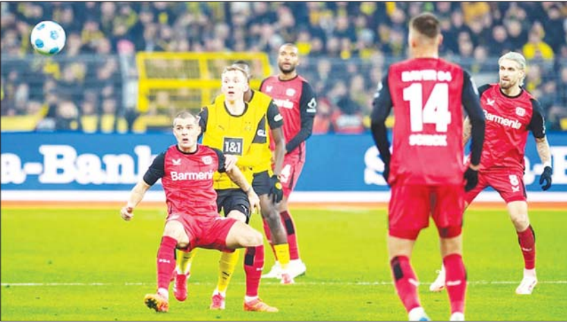
ဒေါ့မွန်နှင့် လေဗာကူဆင်အသင်းတို့ အကြိတ်အနယ်ယှဉ်ပြိုင်ကစားစဉ်။