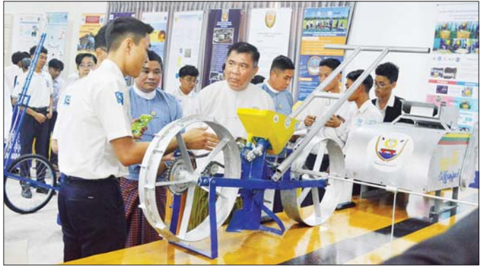
ဖိုရစ်တွင် မြန်မာနိုင်ငံကိုယ်စားပြု ဝင်ရောက်ယှဉ်ပြိုင် ဦးစီးဌာန ညွှန်ကြားရေးမှူးချုပ်က နိဂုံးချုပ်အမှာရန် အဖွဲ့ငါးဖွဲ့ကို ယနေ့ ရွေးချယ်ဆုချီးမြှင့်ကြပြီး နည်းပညာ၊ သက်မွေးပညာနှင့် လေ့ကျင့်ရေး

အဆိုပါပရောဂျက် ၂၁ ခုမှ ပဉ္စမအကြိမ်မြောက် အာဆီယံ-အိန္ဒိယ အခြေခံဆန်းသစ်တီထွင်မှုဆိုင်ရာ