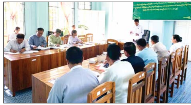
ပတ်သက်၍ ရှင်းလင်းတင်ပြကာ ပြည်နယ် သယံဇာတရေးရာဝန်ကြီးက ပြည်နယ်အတွင်း အောင်မြင်စွာ ဆောင်ရွက်ကြရန် မှာကြားခဲ့ မီးလောင်မှုအရေအတွက် ၂၀ ရာခိုင်နှုန်း လျော့ချ နိုင်ရေး လုပ်ငန်းအဖွဲ့ဝင်ဌာနများအလိုက် အောင်မြင်စွာ ဆောင်ရွက်ကြရန် မှာကြားခဲ့ ကြောင်း သိရသည်။ ခရိုင်(ပြန်/ဆက်)

ဘားအံ ဇန်နဝါရီ ၁၁ ကရင်ပြည်နယ် ဘားအံမြို့၌ တေးမီးနှင့် အခြားမီးများကြောင့် မီးလောင်မှုအရေအတွက် များပြားနေခြင်းကို လျော့ချရေးနှင့် မီးခိုး မြှူငွေညစ်ညမ်းမှု ထိန်းချုပ်ရေးလုပ်ငန်းများ အကောင်အထည်ဖော်နိုင်ရေး ပြည်နယ်အဆင့် လုပ်ငန်းညှိနှိုင်းအစည်းအဝေး (၁/၂၀၂၅) ကို ပတ်ဝန်းကျင်ထိန်းသိမ်းရေးဦးစီးဌာန ဘားအံ ခရိုင်ဦးစီးမှူးရုံး၌ ဇန်နဝါရီ ၈ ရက်က ကျင်းပ သည်။(ယာပုံ) ဦးစွာ ကရင်ပြည်နယ် သယံဇာတရေးရာ ဝန်ကြီး ဦးဇော်ဝင်းက အမှာစကားပြောကြား ပြီး ပြည်နယ်ပတ်ဝန်းကျင်ထိန်းသိမ်းရေး ဦးစီးဌာန လက်ထောက်ညွှန်ကြားရေးမှူး ဦးကျော်ဆန်းက လုပ်ငန်းဆောင်ရွက်မှုနှင့်