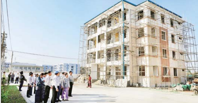
ဖွင့်လှစ်နိုင်တော့မည်ဖြစ်သည်။ ထိုသို့ တည်ဆောက်ပြီးစီးနေမှုကို ကရင်ပြည်နယ်ဝန်ကြီးချုပ်ဦးစောမြင့်ဦးနှင့် တာဝန်ရှိသူများသည် ယနေ့ နံနက်ပိုင်းက သွားရောက်ကြည့်ရှု စစ်ဆေးရာ အဆောက်အအုံအထူးအဖွဲ့ (၁၃)မှ တာဝန်ရှိသူများက ညွှန်ကြားမှုအဖွဲ့အစည်းအဖွဲ့ဝင်များနှင့် တာဝန်ရှိသူများအားလုံးက အခြေခံအဆောက်အအုံ တည်ဆောက်ပြီးစီးနေပြီး မကြာမီဖွင့်လှစ်နိုင်တော့မည်ဖြစ်သည်။

ဘားအံ ဇန်နဝါရီ ၁၁ ကရင်ပြည်နယ်သို့ နိုင်ငံတော်အဆင့်အကြီးအကဲများ၊ နိုင်ငံတကာမှ အထူးစည်ညီပတ်များ ရောက်ရှိတည်ဆောက်နေထိုင်နိုင်ရန် ပြည်နယ်အစိုးရအဖွဲ့ခွင့်ပြုရန်ပုံငွေကျပ် ၆၀၆၁ ဒသမ ၅၂၁ သန်းဖြင့် ဘားအံတက္ကသိုလ်ဘွဲ့နှင့်သဘာဝခန်းမအနီး စိန်ပန်းလှလမ်းနှင့် စိန်ပန်းနီလမ်းတောင့်၌ အဆောက်အအုံအထူးအဖွဲ့ (၁၃)မှ တာဝန်ယူတည်ဆောက်လျက်ရှိသော ကရင်ပြည်နယ်