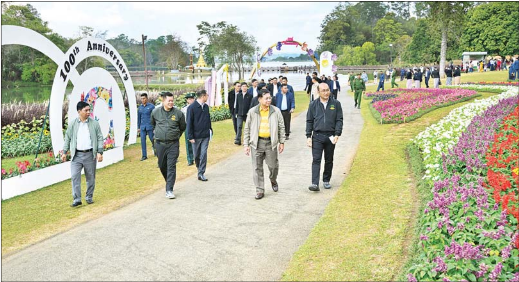
နိုင်ငံတော်စီမံအုပ်ချုပ်ရေးကောင်စီဥက္ကဋ္ဌ နိုင်ငံတော်ဝန်ကြီးချုပ် ဗိုလ်ချုပ်မှူးကြီး မင်းအောင်လှိုင်နှင့်အဖွဲ့ဝင်များ အမျိုးသားကန်တော်ကြီးဥယျာဉ်အတွင်း လှည့်လည်ကြည့်ရှုစဉ်။

စိုက်ပျိုးမြေအသုံးချမှုများ စနစ်တကျဖြစ်ရန်နှင့် အကျိုးရှိရှိအသုံးချနိုင်ရန်လို စိုက်ပျိုးရေးအပေါ်တွင် စိုက်ပျိုးရေးနှင့် မသက်ဆိုင်သည့်လုပ်ငန်းများ ဆောင်ရွက်ခြင်း မပြုရန်လိုပြီး စည်းကမ်းသတ်မှတ်ချက်များနှင့်အညီ စိုက်ပျိုးရေးလုပ်ငန်းများကို ဆောင်ရွက်အောင် ဆောင်ရွက်ရန်လိုကြောင်း၊ အချို့စိုက်ပျိုးမြေရယူ ထားသူများအနေဖြင့် စိုက်ပျိုးမြေများပေါ်တွင် သတ်မှတ်ချက်ထက်ကျော်လွန်သည့် အိမ်ရာများ ဆောက်လုပ်ခြင်းနှင့် အဆောက်အအုံဆောက်လုပ်ရန် အတွက် မြေကွက်များပြုလုပ်ထားသည်ကို တွေ့ရှိရ