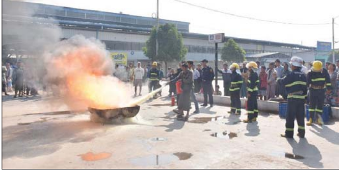
ဒီဇင်ဘာ ၂၉ ရက်က ပြည်ကြီးတံခွန်မြို့နယ် ချမ်းမြေ့ပြည် ရာယီကားကြီးကွင်း၌ မီးသတ်တပ်ဖွဲ့ဝင် များက မီးငြိမ်းသတ်ခြင်း လက်တွေ့သရုပ်ပြသစဉ်။

မီးသည် သုံးတတ်လျှင် မိတ်ဆွေဖြစ်သော်လည်း မသုံးတတ်ပါက ရန်သူဖြစ်၍ လူနီးလျှင် အစုတ်ကျန့် မီးနိုးလျှင် အပြတ်နံ့ဟု ပြောဆိုလေ့ရှိသည်။ မေ၊ မီး၊ မင်း၊ ခိုးသူ၊ မချစ်မနှစ်သက်သူဟူသော ရန်သူမျိုး ငါးပါးတွင်လည်း မီးဘေးအန္တရာယ်ကို ထည့်သွင်း သတ်မှတ်ထားကြသည်။ ယနေ့ကာလတွင် နိုင်ငံ တစ်ဝန်းရှိ မြို့ကြီးပြကြီးများ၌ ဝေဖန်ပွားပြား တိုးတက်လာသည့်နှင့်အမျှ အထပ်မြင့် လူနေ အဆောက်အအုံများ၊ လူနေရပ်ကွက်အသစ်များ ပို၍များပြားလာသည်။ သို့ရာတွင် ဆိုးအိမ်အဆောက် အအုံများ နီးကပ်စွာတည်ဆောက်ထားခြင်း၊ လျှပ်စစ် ပစ္စည်းအသုံးပြုမှု များပြားခြင်း၊ မီးလောင်ပေါက်ကွဲ စေတတ်သည့်ပစ္စည်း၊ လောင်စာများကို ရပ်ကွက် များအတွင်း တရားမဝင် သိုလှောင်ရောင်းချခြင်း တို့ကြောင့် မီးလောင်မှုကို ပိုမိုဖြစ်ပွားစေနိုင်ပြီး မီးလောင်ပါကလည်း ဆုံးရှုံးမှုကြီးမားလေ့ရှိသည်။