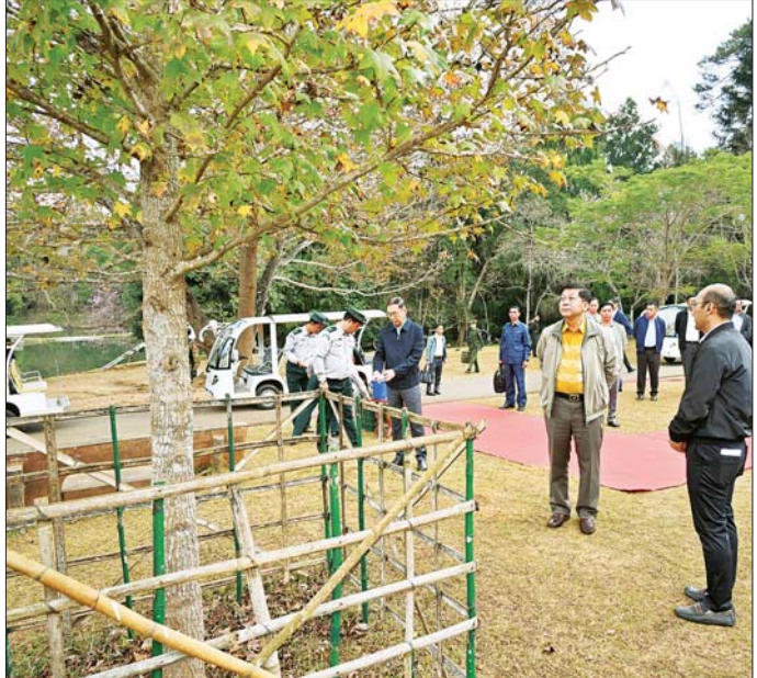
နိုင်ငံတော်စီမံအုပ်ချုပ်ရေးကောင်စီဥက္ကဋ္ဌ နိုင်ငံတော်ဝန်ကြီးချုပ် ဗိုလ်ချုပ်မှူးကြီး မင်းအောင်လှိုင် အမျိုးသား ကန်တော်ကြီးဥယျာဉ်အတွင်းရှိ နှစ် ၁၀၀ နီးပါး သက်တမ်းရှိသော ဂင်ဂိုပင် (Ginkgo Biloba) (ကမ္ဘာဦးပင်) အား ကြည့်ရှုပြီး စနစ်တကျထိန်းသိမ်းဆောင်ရွက်သွားရန် တာဝန်ရှိသူများအား မှာကြားစဉ်။

ကြောင်း၊ စိုက်ပျိုးမြေများအား အခြားနည်းများဖြင့် အသုံးပြုရာတွင် ဥပဒေစည်းမျဉ်း၊ စည်းကမ်းများနှင့် အညီ အဆင့်ဆင့်တင်ပြ၍ ခွင့်ပြုချက်ရယူဆောင်ရွက် ရန်လိုကြောင်း၊ မြေအသုံးချမှုများ စည်းကမ်းတကျ ဖြစ်စေရေး တာဝန်ရှိသူများအနေဖြင့် စနစ်တကျဖြင့် ကြပ်မတ်ဆောင်ရွက်သွားကြရန်လိုကြောင်း၊ စိုက်ပျိုး ရေး သီးနှံများအထွက်နှုန်း ကောင်းမွန်စေရန်အတွက် မျိုး၊ မြေ၊ ရေ၊ နည်း စသည့် စိုက်ပျိုးရေးအခြေခံ နည်းလမ်းလေးသွယ်ကို စနစ်တကျဆောင်ရွက်သွား ရန်လိုကြောင်း၊ ပြင်ပဗဟိုပြုသည့် အရေးပိုင်ဒေသ ဖြစ်သဖြင့် ဂျီသီအိုရီများစိုက်ပျိုးမည်ဆိုပါက ဖြစ်ထွန်း အောင်မြင်နိုင်မည်ဖြစ်ကြောင်း။