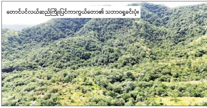
တောင်ပင်လယ်ဆည်ကြီးပြင်ကာကွယ်တော၏ သဘာဝရှုခင်းပုံ။