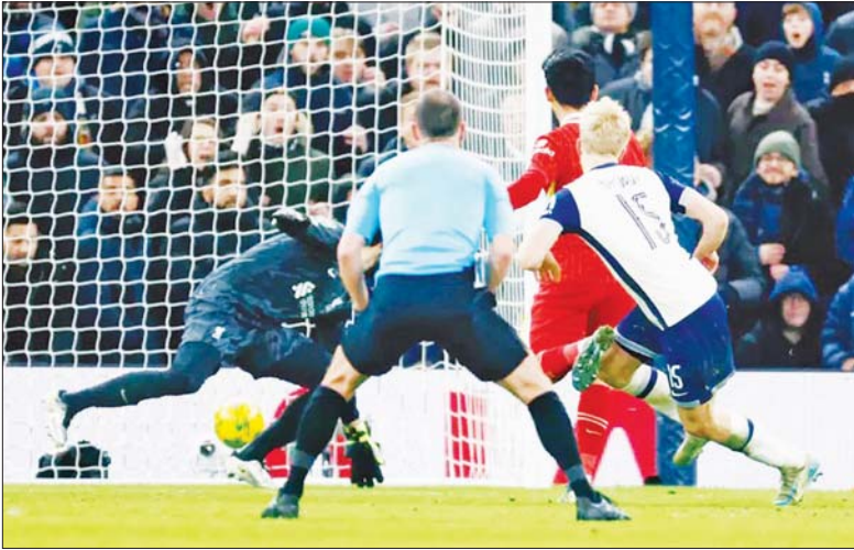
စပါးအသင်းအတွက် တစ်လုံးတည်းသော အနိုင်ရိုးကို တွက်တော သွင်းယူစဉ်။

ကာရာဘောင်ဖလား ဖြိုင်ပွဲ ဆီမီးဖိုင်နယ် ပထမအကျော့မှ ဇန်နဝါရီ ၉ ရက် နံနက် ၂ နာရီခွဲက ယှဉ်ပြိုင်ကစားခဲ့သည့် စပါးနှင့် လီဟပူးအသင်းပွဲစဉ်တွင် စပါး အသင်းက အကြိတ်အနယ်ကစား ပြီး တစ်ရိုး - ရိုးမရှိဖြင့် နိုင်ပွဲရရှိခဲ့ သည့်အတွက် ဗိုလ်လုပွဲတက်လှမ်း နိုင်ရေး အခွင့်အရေးကောင်း ပိုင်ဆိုင်ခဲ့သည်။ ထို့ပြင် စပါးအသင်းသည် ယခုပွဲစဉ် နိုင်ပွဲရရှိခဲ့သည့်အတွက် နောက်ဆုံးလေးပွဲဆက် နိုင်ပွဲ ပျောက်ဆုံးမှုကို ချေဖျက်နိုင်ခဲ့ သည်။ ပြိုင်ဘက်လီဟပူးအသင်း က ယခုပွဲစဉ် နှိမ့်ခဲ့သည့်အတွက် နောက်ဆုံးနှစ်ပွဲဆက် နိုင်ပွဲ ပျောက်ဆုံးခဲ့သည်။