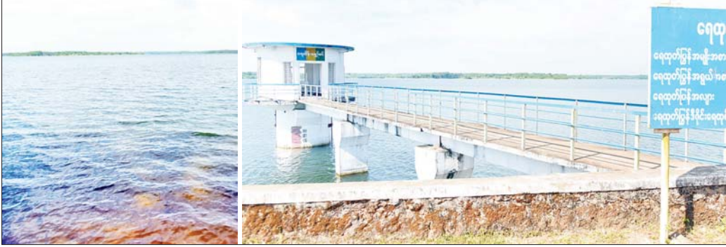
စိုက်ပျိုးရေးနှင့် သောက်သုံးရေအတွက် အကျိုးပြုနေသည့် မစင်းဆည်တစ်ခုကို တွေ့ရစဉ်။

ပဲခူးတိုင်းဒေသကြီးသည် စိုက်ပျိုးရေးကဏ္ဍတွင် နှစ်သီးစားမှ သုံးသီးစားအဖြစ် မြှင့်တင်ဆောင်ရွက် နေသော တိုင်းဒေသကြီးတစ်ခုဖြစ်ပြီး စိုက်ပျိုးရေး ကဏ္ဍ အောင်မြင်ဖြစ်ထွန်းရန် ပံ့ပိုးကူညီဆောင်ရွက် ပေးနေသော ဆည်တစ်ခုမှာ အခန်းကဏ္ဍသည် အထူးအရေးပါလျက်ရှိသည်။ စိုက်ပျိုးရေးကိုအခြေခံ သည့် မြန်မာနိုင်ငံတွင် မိုးစပါးကို အများဆုံး စိုက်ပျိုး ကြသည့်နည်းတူ တောင်သူများ အထူးအားထားရာ နွေစပါးကိုလည်း နှစ်စဉ်မပြတ် စိုက်ပျိုးလျက်ရှိသည်။ စိုက်ပျိုးရေး၊ မွေးမြူရေးနှင့် ဆည်မြောင်းဝန်ကြီး ဌာနအနေဖြင့် တောင်သူတို့၏ လူမှုစီးပွားဖွံ့ဖြိုးတိုး တက်မှုကို အစဉ်အလေးထားဆောင်ရွက်နေသည့် နည်းတူ ပြည်တွင်းစားသုံးမှုနှင့် ပြည်ပပို့ကုန်အတွက် စိုက်ပျိုးထုတ်လုပ်လျက်ရှိသည့် ဆန်စပါးစိုက်ပျိုးမှု ကဏ္ဍတွင်လည်း တောင်သူများလိုအပ်သည့် ဆည် ရေကို အစဉ်မပြတ် ပို့လွှတ်ပေးမှုဖြင့် စိုက်ပျိုးရေး ကဏ္ဍတွင် ဆည်တစ်ခု၏အခန်းကဏ္ဍသည် အသက်သွေးကြောသဖွယ် အရေးပါလာခြင်း ဖြစ် သည်။