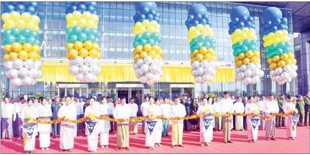
နိုင်ငံတော်စီမံအုပ်ချုပ်ရေးကောင်စီ ဒုတိယဥက္ကဋ္ဌ ဒုတိယဝန်ကြီးချုပ် ဒုတိယဗိုလ်ချုပ်မှူးကြီး စိုးဝင်း၊ ကောင်စီတွဲဖက်အတွင်းရေးမှူး ဗိုလ်ချုပ်ကြီး ရဲဝင်းဦး၊ ကောင်စီဝင် ဗိုလ်ချုပ်ကြီး မြထွန်းဦး၊ ပညာရေးဝန်ကြီးဌာန ပြည်ထောင်စုဝန်ကြီး ဒေါက်တာညွန့်ဖေနှင့် သိပ္ပံနှင့်နည်းပညာဝန်ကြီးဌာန ပြည်ထောင်စုဝန်ကြီး ဒေါက်တာမျိုးသိန်းကျော်တို့က အခမ်းအနားကို ဖဲကြိုးဖြတ်ဖွင့်လှစ်ပေးစဉ်။

နေပြည်တော် ဇန်နဝါရီ ၉ ပညာရေးဆိုင်ရာအသုံးချသုတေသန နိုင်ငံတကာညီလာခံ (၂၀၂၅) ဖွင့်ပွဲအခမ်းအနားကို ယနေ့နံနက်ပိုင်းတွင် နေပြည်တော်ရှိ မြန်မာအပြည်ပြည်ဆိုင်ရာ ကွန်ဗင်းရှင်းဗဟိုဌာန - ၂ ၌ ကျင်းပပြုလုပ်ရာ နိုင်ငံတော်စီမံအုပ်ချုပ်ရေးကောင်စီဥက္ကဋ္ဌ နိုင်ငံတော်ဝန်ကြီးချုပ် ဗိုလ်ချုပ်မှူးကြီး မင်းအောင်လှိုင် တက်ရောက်၍ မိန့်ခွန်းပြောကြားသည်။ အခမ်းအနားသို့ နိုင်ငံတော်စီမံအုပ်ချုပ်ရေးကောင်စီဥက္ကဋ္ဌ နိုင်ငံတော်ဝန်ကြီးချုပ် ဗိုလ်ချုပ်မှူးကြီး မင်းအောင်လှိုင်၊ ကောင်စီဒုတိယဥက္ကဋ္ဌ ဒုတိယဝန်ကြီးချုပ် ဒုတိယဗိုလ်ချုပ်မှူးကြီး စိုးဝင်း၊ ကောင်စီတွဲဖက်အတွင်းရေးမှူး ဗိုလ်ချုပ်ကြီး ရဲဝင်းဦး၊ ကောင်စီဝင်များ၊ ပြည်ထောင်စုဝန်ကြီးများနှင့် ပြည်ထောင်စုအဆင့်ပုဂ္ဂိုလ်များ၊ နိုင်ငံတကာသံရုံးများမှ မြန်မာနိုင်ငံဆိုင်ရာ သံအမတ်ကြီးများ၊ နေပြည်တော်ကောင်စီဥက္ကဋ္ဌ၊ ကာကွယ်ရေးဦးစီးချုပ်ရုံးမှ အဆင့်မြင့်တပ်မတော်အရာရှိကြီးများ၊ နေပြည်တော်တိုင်း စစ်ဌာနချုပ်တိုင်းမှူး၊ ဒုတိယဝန်ကြီးများ၊ ပါမောက္ခချုပ်များနှင့် ကျောင်းအုပ်ကြီးများ၊ တိုင်းဒေသကြီးနှင့် ပြည်နယ်များမှ ပညာရေးမှူးများ၊ ပါမောက္ခများ၊ ပညာရှင်များ၊ ဝန်ကြီးဌာနများမှ တာဝန်ရှိသူများ၊ ပြည်တွင်း၊ ပြည်ပ စာတမ်းရှင်များ၊ ဆရာ ဆရာမများနှင့် ကျောင်းသား ကျောင်းသူများ တက်ရောက်ကြသည်။