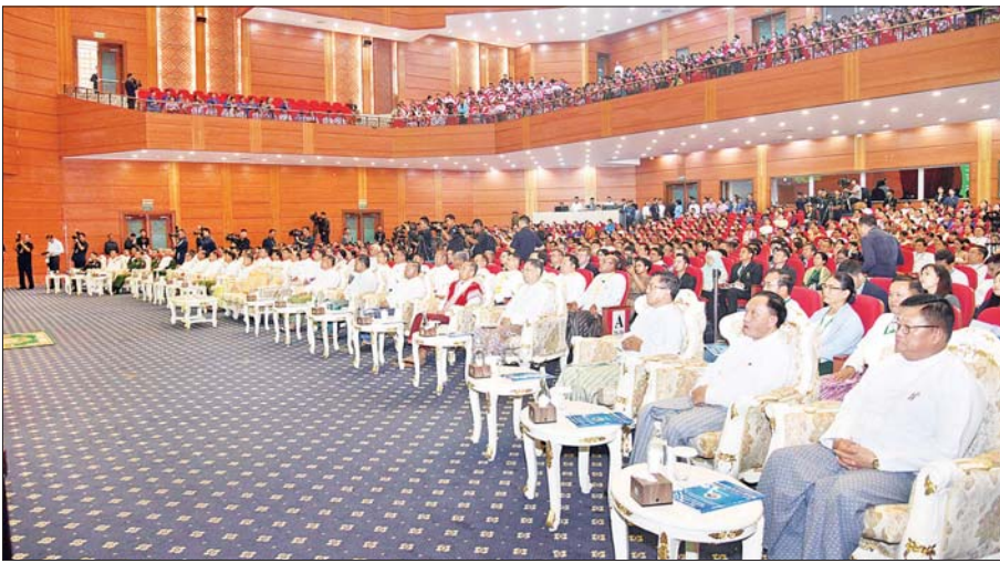
နိုင်ငံတော်စီမံအုပ်ချုပ်ရေးကောင်စီဥက္ကဋ္ဌ နိုင်ငံတော်ဝန်ကြီးချုပ် ဗိုလ်ချုပ်မှူးကြီး မင်းအောင်လှိုင် ပညာရေးဆိုင်ရာအသုံးချသုတေသန နိုင်ငံတကာညီလာခံ (၂၀၂၅) ဖွင့်ပွဲအခမ်းအနားတွင် မိန့်ခွန်းပြောကြားစဉ်။

စာမျက်နှာ ၄ မှ ထို့ကြောင့် စိုက်ပျိုးမွေးမြူရေးနှင့် စက်မှုနည်းပညာ ဆိုင်ရာ လူသားအရင်းအမြစ်များ မွေးထုတ်နိုင်ရေး အတွက် ခရိုင်အသီးသီးတွင် စက်မှု၊ စိုက်ပျိုးရေးနှင့် မွေးမြူရေးပညာများကို သင်ကြားပေးနေသည့် အခြေခံပညာအထက်တန်းကျောင်း ၈၅ ကျောင်းကို ဖွင့်လှစ်သင်ကြားပေးလျက်ရှိပြီး KG+၅ ပြီးမြောက် အောင်မြင်သူများ တက်ရောက်နိုင်မည်ဖြစ်ကြောင်း၊ ထိုမှတစ်ဆင့် ထူးချွန်စွာအောင်မြင်ပါက သက်ဆိုင် ရာ တက္ကသိုလ်၊ ကောလိပ်များကို ဆက်လက် တက်ရောက်နိုင်မည်ဖြစ်ကြောင်း၊ နိုင်ငံအတွက် ပညာရှင်များစွာ လိုအပ်လျက်ရှိနေဆဲဖြစ်သော ကြောင့် အသိပညာရှင်၊ အတတ်ပညာရှင် လူသား အရင်းအမြစ်များ မွေးထုတ်ပေးနိုင်ရေး နိုင်ငံတော်က စီမံဆောင်ရွက်ပေးလျက်ရှိသကဲ့သို့ တာဝန်ရှိသူများ နှင့် ဆရာ ဆရာမများ၊ ကျောင်းသား ကျောင်းသူများ ကလည်း ပူးပေါင်းဆောင်ရွက်ပေးကြရန် တိုက်တွန်း မှာကြားလိုကြောင်း။