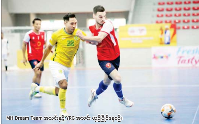
MH Dream Team အသင်းနှင့် YRG အသင်း ယှဉ်ပြိုင်နေစဉ်။

ရန်ကုန် ဇန်နဝါရီ ၉ ၂၀၂၄-၂၀၂၅ ရာသီ MFF ဖူဆယ် လိဂ် - ၁ ပြိုင်ပွဲ ပွဲစဉ် (၄) ကို ဇန်နဝါရီ ၉ ရက်က ရန်ကုန်မြို့ သုဝဏ္ဏဘေသာလုံးကွင်းရှိ MFF ဖူဆယ်အားကစားရုံ၌ ဆက်လက် ကျင်းပပြီး MIU အသင်း လေးပွဲ ဆက်နိုင်ပြီး MH Dream Team နှင့် YRG အသင်း သရေကျခဲ့သည်။ ရာသီကြိုပြိုင်ဆင်မှု များစွာ ပြုလုပ်ထားပြီး လက်ရွေးစင်အဆင့် ကစားသမားများ၊ နိုင်ငံခြားသား ကစားသမားများ ခေါ်ယူထား သည့် MH Dream Team အသင်းနှင့် YRG အသင်းတို့ စာမျက်နှာ ၁၈ ကော်လံ ၁ ၀