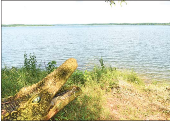
ကြည်လင်သန့်ရှင်းမှုကြောင့် မြို့ပြသောက်သုံးရေအတွက် အကျိုးပြုသည့်အပြင် စိုက်ပျိုးရေးကိုလည်း ပေးဝေလျက်ရှိသည့် မစင်းရေလှောင်တံခါးကို တွေ့ရစဉ်။

ပဲခူးမြို့သည် ဧရိယာအားဖြင့် ၇၁၇၈၆၁ ဧက၊ စတုရန်းမိုင်အားဖြင့် ၁၁၂၁ ဒသမ ၆၆ ကျယ်ဝန်းပြီး အရှေ့ဘက်တွင် ဝေါမြို့နယ်၊ သနပ်ပင်မြို့နယ်၊ အနောက်ဘက်တွင် ရန်ကုန်တိုင်းဒေသကြီး လှည်းကူးမြို့နယ်၊ တိုက်ကြီးမြို့နယ်၊ သာယာဝတီ မြို့နယ်၊ တောင်ဘက်တွင် ကဝမြို့နယ်၊ မြောက်ဘက် တွင် ဒိုက်ဦးမြို့နယ်နှင့် လက်ပံတန်းမြို့နယ်တို့ တည်ရှိသည်။ ပဲခူးမြို့သည် ပဲခူးမြစ်ကို အခြေပြု တည်ရှိပြီး ပဲခူးမြစ်သည် ရိုးမပေါ်ရှိ ဆင်နာမောင်း တောင်တွင် ဖြစ်ပေါ်ကာ တောင်ဘက်တွင်ရှိသော ရန်ကုန်မြစ်အတွင်းသို့ စီးဆင်းသွားသည်။ ရိုးမ မြောက်ဘက်တွင် မြစ်ဖျားခံသော ကိုလူကွဲချောင်း၊ လက်ပံချောင်း၊ အောင်မြချောင်း၊ ရွှေလောင်းချောင်း နှင့် စလူချောင်းတို့သည်လည်း ပဲခူးမြစ်အတွင်းသို့ ပေါင်းစုံစီးဆင်းပြီး မစင်းချောင်း၊ ဇလင်ထော်