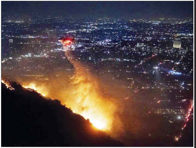
ဟောလီဝုဒ်တောင်ကုန်းတွင် လောင်နေသည့်တောမီးအား ရဟတ်ယာဉ်ဖြင့် ငြိမ်းသတ်နေသည်ကို တွေ့ရစဉ်။

အညီပေးရေး အစီအစဉ်များပါဝင်သည်ဟု အိမ်ဖြူတော်က သတင်းထုတ်ပြန်ထားသည်။ ကယ်လီဖိုးနီးယား တောမီးလောင်မှုကို ထိန်းချုပ်ရန်နှင့် ပြန်လည်တည်ဆောက်ရေး ကူညီရန် လုပ်နိုင်သမျှအရာအားလုံးကို ပြင်ဆင်ထားကြောင်း၊ သို့သော်လည်းယင်းအရာသည် ခရီးရှည်ကြီးဖြစ်မည်ဖြစ်ကြောင်း တိုင်ခင်က လူမှုကွန်ရက် မီဒီယာတွင် ရေးသားခဲ့သည်။ အမေရိကန်ပြည်ထောင်စု ကယ်လီဖိုးနီးယားပြည်နယ် လူနေအများဆုံးဒေသဖြစ်သည့် လော့စ်အိန်ဂျလစ်တွင် တောမီးများကြောင့် ငါးဦးထက်မနည်း သေဆုံးခဲ့ပြီး အဆောက်အအုံ ၁၀၀ ထက်မနည်း ပျက်စီးခဲ့ကြောင်း ဒေသဆိုင်ရာအာဏာပိုင်များက ပြောသည်။ ကယ်လီဖိုးနီးယားအုပ်ချုပ်ရေးမှူး ဂါဗင်နယူဆစ်သည် ဇန်နဝါရီ ၇ ရက်တွင် ပြည်နယ် အရေးပေါ်အခြေအနေအဖြစ် ကြေညာခဲ့သည်။ ကယ်လီဖိုးနီးယားတောင်ပိုင်းတွင် တောမီးများ လျင်မြန်စွာ ပျံ့နှံ့လောင်မှုကြောင့် လူပေါင်းထောင်နှင့်ချီ၍ ဘေးလွတ်ရာသို့ ရွှေ့ပြောင်းကြရန် အမိန့်ထုတ်ပြန်ခဲ့သည်။ ဆင်ဟွာ