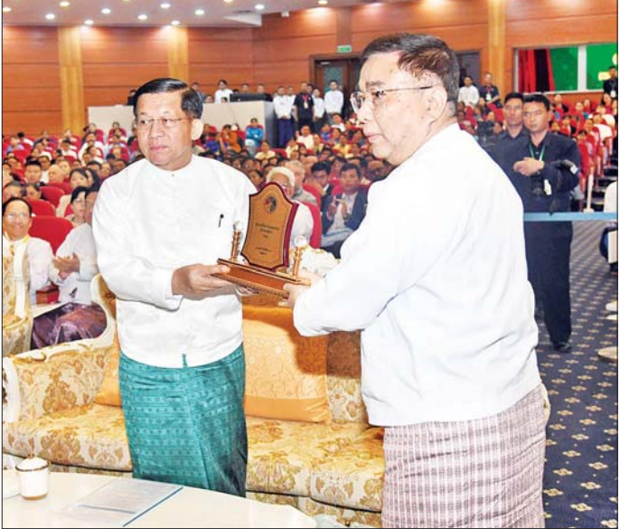
နိုင်ငံတော်စီမံအုပ်ချုပ်ရေးကောင်စီဥက္ကဋ္ဌ နိုင်ငံတော်ဝန်ကြီးချုပ် ဗိုလ်ချုပ်မှူးကြီး မင်းအောင်လှိုင် ထံ ပညာရေးဝန်ကြီးဌာန ပြည်ထောင်စုဝန်ကြီး ခေါက်တာညွန့်ဖေက ပညာရေးဆိုင်ရာအသုံးချသုတေသန နိုင်ငံတကာညီလာခံ (၂၀၂၅) အထိမ်းအမှတ်လက်ဆောင်ကို ဂါရဝပြုပေးအပ်စဉ်။

ဆက်လက်၍ နိုင်ငံတော်စီမံအုပ်ချုပ်ရေးကောင်စီဥက္ကဋ္ဌ နိုင်ငံတော်ဝန်ကြီးချုပ်နှင့် အခမ်းအနားတက်ရောက်လာကြသူများသည် စုပေါင်း