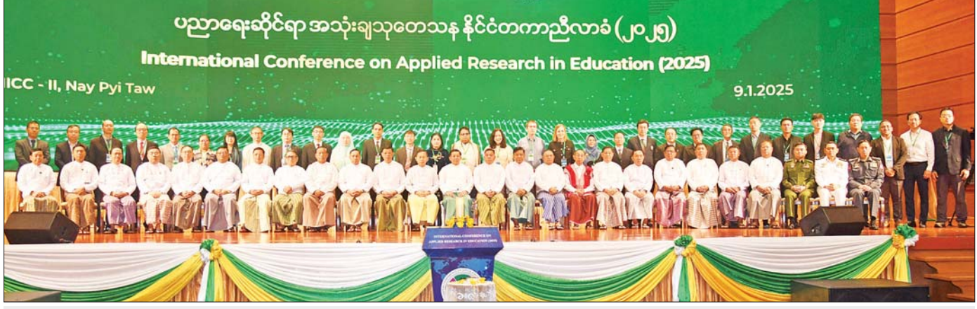
နိုင်ငံတော်စီမံအုပ်ချုပ်ရေးကောင်စီဥက္ကဋ္ဌ နိုင်ငံတော်ဝန်ကြီးချုပ် ဗိုလ်ချုပ်မှူးကြီး မင်းအောင်လှိုင် အခမ်းအနားတက်ရောက်လာကြသူများနှင့်အတူ စုပေါင်းမှတ်တမ်းတင်ဓာတ်ပုံရိုက်စဉ်။