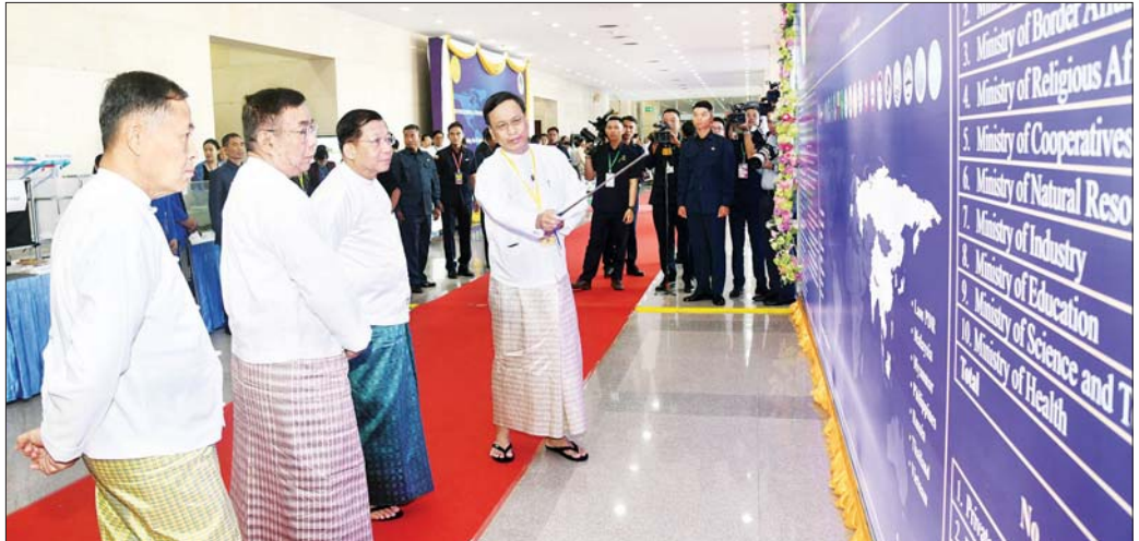
နိုင်ငံတော်စီမံအုပ်ချုပ်ရေးကောင်စီဥက္ကဋ္ဌ နိုင်ငံတော်ဝန်ကြီးချုပ် ဗိုလ်ချုပ်မှူးကြီး မင်းအောင်လှိုင်နှင့် အဖွဲ့ဝင်များ ပညာရေးဆိုင်ရာအသုံးချသုတေသန နိုင်ငံတကာညီလာခံ(၂၀၂၅) အထိမ်းအမှတ် ပို့စတာပြခန်းကို စိတ်ပါဝင်စားစွာ လိုက်လံကြည့်ရှုစဉ်။

အဆိုပါ ပညာရေးဆိုင်ရာ အသုံးချသုတေသန နိုင်ငံတကာညီလာခံ(၂၀၂၅) ကို “ပညာရေး၊ သိပ္ပံနှင့် နည်းပညာစွမ်းပကားဖြင့် ပိုမိုကြွယ်ဝပြည့်စုံသော လူ့ဘောင်အဖွဲ့အစည်းအတွက် အနာဂတ်သို့ညွှန်ပြခြင်း” ဟူသည့် ဦးတည်ချက်နှင့်အညီ ဇန်နဝါရီ ၉ ရက်မှ ၁၀ ရက်အထိ ကျင်းပပြုလုပ်သွားမည်ဖြစ်ကြောင်း၊ ညီလာခံတွင် နိုင်ငံတကာမှ ဝါရင့်ပညာရှင်များနှင့် ပညာရှင်မျိုးဆက်သစ်များပါဝင်ကြပြီး နိုင်ငံပေါင်း ၁၆ နိုင်ငံနှင့် အဖွဲ့အစည်းပေါင်း ၄၅ ခုမှ ပညာရှင် ၆၂ ဦး၊ ပညာရေးဝန်ကြီးဌာနနှင့် ဆက်စပ်ဝန်ကြီးဌာန ၁၁ ခုနှင့် ပညာရေးအဖွဲ့အစည်းများမှ ပြည်တွင်း၊ ပြည်ပပညာရှင် ၄၀ တို့ တက်ရောက်ကြမည်ဖြစ်ကာ Keynote Address ခြောက်ခု၊ Special Talk ငါးခုနှင့် ပြည်တွင်း ပြည်ပသုတေသနစာတမ်း ၁၃၃ စောင် ဖတ်ကြားတင်သွင်းသွားမည်ဖြစ်ကြောင်း၊ ယခုကဲ့သို့ ညီလာခံကြီးကို ကျင်းပပြုလုပ်ခြင်းဖြင့် မြန်မာနိုင်ငံ၏ အနာဂတ်ပညာရေးနှင့်တိုးမြှင့်တက်ကောင်းမွန်တိုးတက်စေရေး၊ နိုင်ငံတော်နှင့်ဒေသတွင်းနိုင်ငံများ၏ နိုင်ငံစီးပွားဖြင့်တင်နိုင်ရေး၊ လူမှုစီးပွားဘဝ မြှင့်တင်ပေးစေရေးတို့အတွက် များစွာအကျိုးဖြစ်ထွန်းစေနိုင်မည်ဖြစ်ကြောင်း သတင်းရရှိသည်။ သတင်းစဉ်