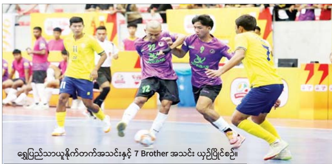
ရွှေပြည်သာယူနိုက်တက်အသင်းနှင့် 7 Brother အသင်း ယှဉ်ပြိုင်ပွဲစဉ်။

ရန်ကုန် ဇန်နဝါရီ ၈ ၂၀၂၄-၂၀၂၅ ရာသီ MFF ဖူဆယ်လိဂ်-၂ ပြိုင်ပွဲ ပွဲစဉ် (၄) ကို ဇန်နဝါရီ ၈ ရက်က ရန်ကုန်မြို့၊ သုဝဏ္ဏဘောလုံးကွင်းရှိ MFF ဖူဆယ်အားကစားရုံ၌ ဆက်လက်ကျင်းပရာ ထိပ်ဆုံးနေရာ အပြောင်းအလဲဖြစ်ပေါ်ခဲ့သည်။ ပွဲစဉ် (၄) တွင် 7 Dragon အသင်းက Pacific Sun Far အသင်းကို နှစ်ဂိုး-ဂိုးမရှိ၊ ရွှေပြည်သာ စာမျက်နှာ ၁၅ ကော်လံ ၅ ❖