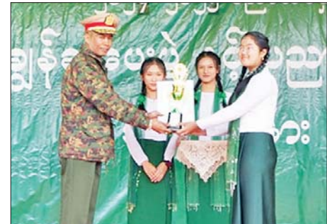
အားပေးခဲ့ကြပြီး သင်ထောက်ကူ များအား လှည့်လည်ကြည့်ရှုခဲ့ကြ ပြခန်းနှင့် သိပ္ပံပြခန်းများအတွင်း ခင်းကျင်းပြသထားသည့် ပစ္စည်း သတင်းစဉ်

သီချင်းဖြင့်အခမ်းအနားကို ဖွင့် လှုပ်ခဲ့သည်။ ထို့နောက် တိုင်းမှူး က အဖွဲ့အမှတ်စကားပြောကြားပြီး ပညာရေး စုံညီပွဲတော်အတွက် ချီးမြှင့်ငွေများပေးအပ်ရာ တာဝန် ရှိသူတစ်ဦးက လက်ခံရယူခဲ့ သည်။ ယင်းနောက် တိုင်းမှူးနှင့် တာဝန်ရှိသူများက ပြည်နယ် အဆင့် ထူးချွန်ဆုရရှိသူများ၊ တက္ကသိုလ်ဝင်တန်းတွင် ဂုဏ်ထူး ရရှိခဲ့သူများ၊ ၂၀၂၃-၂၀၂၄ ပညာ သင်နှစ်တွင် အတန်းအလိုက် ပညာရည်ချွန် ဆုရရှိသူများနှင့် မြို့နယ်အဆင့် ထူးချွန်ဆုရရှိသူ ကျောင်းသား ကျောင်းသူများကို ဆုများ အသီးသီးပေးအပ်ချီးမြှင့်ခဲ့ ကြသည်။ ယင်းနောက် တိုင်းမှူး နှင့် တက်ရောက်လာကြသူများက ကျောင်းသား ကျောင်းသူများ၏ ကပြဖျော်ဖြေမှုများကို ကြည့်ရှု