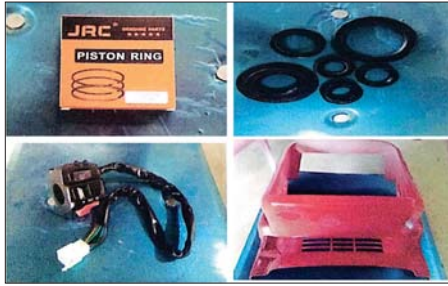
ကချင်ပြည်နယ်၌ ဖမ်းဆီးရမိမှု။

နေပြည်တော် ဇန်နဝါရီ ၈ တရားမဝင်ကုန်သွယ်မှုတိုက်ဖျက်ရေးဦးဆောင်ကော်မတီ၏ ကြီးကြပ် ကွပ်ကဲမှုဖြင့် တရားမဝင်ကုန်သွယ်မှုများကို ဥပဒေနှင့်အညီ ထိရောက်စွာ တားဆီးအရေးယူနိုင်ရေးအောင်ရွက်လျက်ရှိရာ ဇန်နဝါရီ ၆ ရက်တွင် မကွေးတိုင်းဒေသကြီး တရားမဝင်ကုန်သွယ်မှုတိုက်ဖျက်ရေး အထူးအဖွဲ့၏ စီမံခန့်ခွဲမှုဖြင့် တာဝန်ကျပူးပေါင်းအဖွဲ့များက စစ်ဆေးမှုများ ဆောင်ရွက်ခဲ့ရာ မကွေးမြို့နယ်နှင့် မင်းလှမြို့နယ်တို့၌ လိုင်စင်မဲ့ ဖော်တော်ယာဉ်တစ်စီးနှင့် ဖော်တော်ဆိုင်ကယ်တစ်စီး (ခန့်မှန်းတန်ဖိုး ငွေကျပ် ၆၀၀၀၀၀) ကို ပို့ကုန်သွင်းကုန်ဥပဒေအရလည်းကောင်း၊ မင်းသွားမြို့ မနန်းရေခံမြေဝင်းအတွင်း၌ တရားမဝင် ရေနံစိမ်း ၂၃ ဂါလန် (ခန့်မှန်းတန်ဖိုးငွေကျပ် ၈၅၅၀၀) ကို ပြည်သူပိုင်ပစ္စည်းကာကွယ်ရေးဥပဒေအရလည်းကောင်း စုစုပေါင်း ခန့်မှန်းတန်ဖိုးငွေကျပ် ၆၂၆၀၅၀၀ ကို ဖမ်းဆီးအရေးယူဆောင်ရွက်လျက်ရှိသည်။