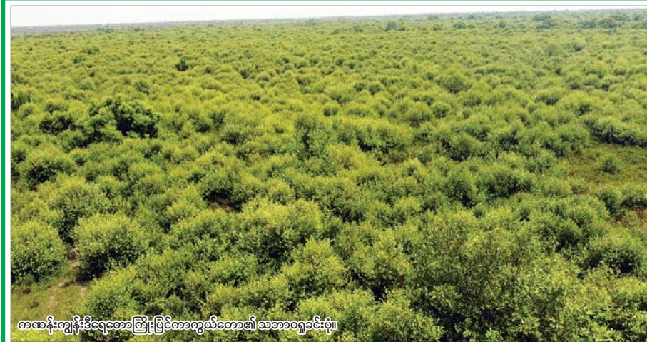
ကဏန်းကျွန်းဒီရေတောကြီးပြင်ကာကွယ်တော၏ သဘာဝရှုခင်းပုံ။

(နိုင်ငံတော်စီမံအုပ်ချုပ်ရေးကောင်စီဥက္ကဋ္ဌ နိုင်ငံတော်ဝန်ကြီးချုပ် ဗိုလ်ချုပ်မှူးကြီး မင်းအောင်လှိုင်၏ ၂၀၂၄ခုနှစ် ဧပြီလ ၂၂ ရက်နေ့တွင် ပြုလုပ်သော ပြည်ထောင်စုအစိုးရအဖွဲ့ အစည်းအဝေးအမှတ်စဉ် (၄/၂၀၂၄) သို့ တက်ရောက် အမှာစကားပြောကြားမှုမှ ကောက်နုတ်ချက်)