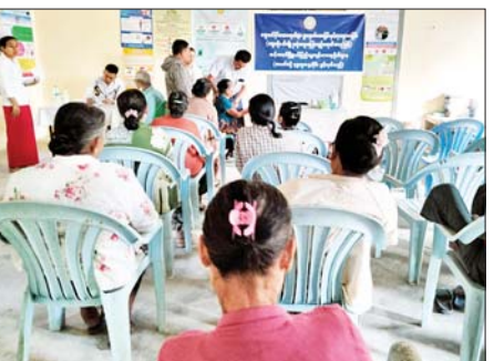
မြို့နယ်(ပြန်/ဆက်)

(၄၀)နှင့်အထက် သက်ကြီးရွယ်အိုများ၊ သွေးတိုး၊ ဆီးချို၊ နှလုံးသွေးကြောကျဉ်းရောဂါအခံရှိသူများ၊ နာတာရှည်ရောဂါ ဝေဒနာရှင်များ စိတ်အေးချမ်းသာစွာ ကျန်းမာရေးစစ်ဆေးမှုများခံယူနိုင်ရန် စမ်းသပ်စက်ကိရိယာများဖြင့် စစ်ဆေးဆောင်ရွက်ပေးခြင်း၊ လိုအပ်သည့် ဆေးကုသမှုများခံယူနိုင်စေရန် ချိတ်ဆက်ဆောင်ရွက်ပေးခြင်း၊ ကျန်းမာရေးအသိပညာပေးခြင်းများကို မြို့နယ်ကျန်းမာရေးစစ်ဆေးရေးအဖွဲ့က စနစ်တကျ ဆောင်ရွက်ပေးခဲ့ကြောင်း သိရသည်။