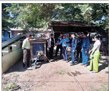
ခရိုင်(ပြန်/ဆက်)

မြို့သစ် ဇန်နဝါရီ ၈ မကွေးခရိုင် မြို့သစ်မြို့ မီးသတ်ဦးစီးဌာနက မြို့မဈေးကြီးအတွင်း မီးဘေးလုံခြုံရေးအတွက် မီးဘေးကာကွယ်ရေးပစ္စည်းများထားရှိမှု အခြေအနေနှင့် မီးသတ်ရေးကန်ပြည့်တင်းထားရှိမှု မီးသတ်ယာဉ်ဝင်/ ထွက်သွားလာနိုင်ရေးအတွက် ရှင်းလင်းထားရှိမှုအခြေအနေများကို မြို့နယ်အထွေထွေအုပ်ချုပ်ရေးဦးစီးဌာနမှ မီးသတ်ဦးစီးဌာန၊ လျှပ်စစ် ဦးစီးဌာနနှင့် စည်ပင်သာယာရေးဦးစီးဌာနတို့က ပူးပေါင်းကာ ကွင်းဆင်း စစ်ဆေးကြည့်ရှုပြီး အကြံပြုခြင်းများဆောင်ရွက်ခဲ့ကြောင်း သိရသည်။ ကိုဇော်(ပြန်/ဆက်)