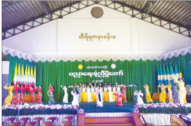
အလုပ်ဖြူနယ်၌ ဇန်နဝါရီ ၆ ရက်က ရန်ကုန်တိုင်းဒေသကြီးအဆင့် ၂၀၂၄-၂၀၂၅ ပညာသင်နှစ် ပညာရေးစုံညီပွဲတော်ကျင်းပစဉ်။

အထူးသဖြင့် ပညာရေးစုံညီပွဲတော်များကျင်းပလာသဖြင့် ဘာသာရပ်အလိုက် ထူးချွန်ဆု