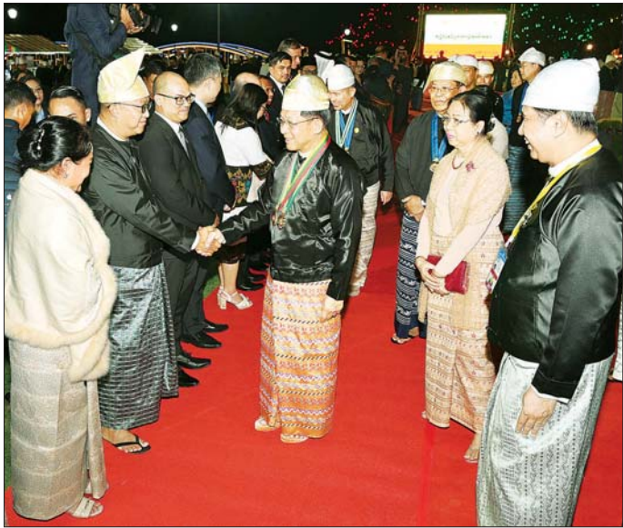
နိုင်ငံတော်စီမံအုပ်ချုပ်ရေးကောင်စီဥက္ကဋ္ဌ နိုင်ငံတော်ဝန်ကြီးချုပ် ဗိုလ်ချုပ်မှူးကြီး သတိုးမဟာသရေစည်သူ သတိုးသိရီသုဓမ္မ မင်းအောင်လှိုင်နှင့်ဇနီး ဒေါ်ကြူကြူလှ (၇၇) နှစ်မြောက် လွတ်လပ်ရေးနေ့အထိမ်းအမှတ် ဂုဏ်ပြုညစာစားပွဲနှင့် ဂုဏ်ပြုဖျော်ဖြေပွဲအခမ်းအနား တက်ရောက်လာကြသူများအား ရင်းရင်းနှီးနှီး နှုတ်ဆက်စဉ်။