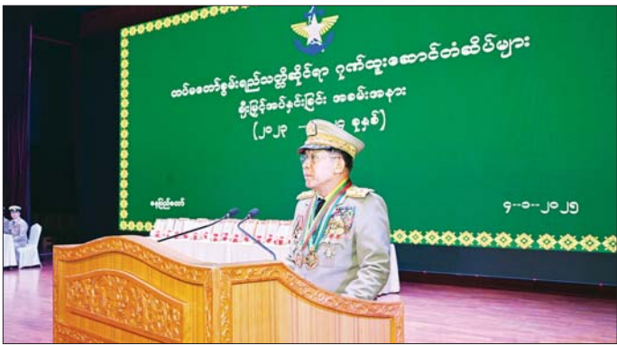
နိုင်ငံတော်စီမံအုပ်ချုပ်ရေးကောင်စီဥက္ကဋ္ဌ တပ်မတော်ကာကွယ်ရေးဦးစီးချုပ် ဗိုလ်ချုပ်မှူးကြီး သတိုးမဟာသရေစည်သူ သတိုးသိရီသုဓမ္မ မင်းအောင်လှိုင် တပ်မတော်စွမ်းရည်သတ္တိဆိုင်ရာ ဂုဏ်ထူးဆောင်တံဆိပ်ချီးမြှင့်အပ်နှင်းခြင်းအခမ်းအနားတွင် ဂုဏ်ပြုအမှာစကားပြောကြားစဉ်။

အဆိုပါ အခမ်းအနားသို့ နိုင်ငံတော်စီမံအုပ်ချုပ်ရေးကောင်စီဥက္ကဋ္ဌ တပ်မတော်ကာကွယ်ရေးဦးစီးချုပ် ဗိုလ်ချုပ်မှူးကြီး သတိုးမဟာသရေစည်သူ သတိုးသိရီသုဓမ္မ မင်းအောင်လှိုင်နှင့်အတူ ဇနီးဒေါ်ကြူကြူလှ၊ နိုင်ငံတော်စီမံအုပ်ချုပ်ရေးကောင်စီ ဒုတိယဥက္ကဋ္ဌ ဒုတိယတပ်မတော်ကာကွယ်ရေးဦးစီးချုပ် ဒုတိယဗိုလ်ချုပ်မှူးကြီး သီရိပျံချိမဟာသရေစည်သူ စိုးဝင်းနုဇနီး ဒေါ်သန်းသန်းနွယ်၊ ညွှန်ကြားကွပ်ကဲရေးမှူး (ကြည်း၊ ရေပေ) ဒုတိယဗိုလ်ချုပ်ကြီး ဝေယျာကျော်ထင် သရေစည်သူ ကျော်စွာလင်းနှင့် ဇနီး၊ ကာကွယ်ရေးဦးစီးချုပ် (ရေ) ဗိုလ်ချုပ်ကြီး ဝေယျာကျော်ထင်ထိန်ဝင်းနှင့် ဇနီး၊ ကာကွယ်ရေးဦးစီးချုပ် (လေ) ဗိုလ်ချုပ်ကြီး ဝေယျာကျော်ထင် စည်သူ ထွန်းအောင်နှင့် ဇနီး၊ ပြည်ထောင်စုအဆင့်ပုဂ္ဂိုလ်များနှင့် ဇနီးများ၊ ပြည်ထောင်စုဝန်ကြီးများနှင့် ဇနီးများ၊ ကာကွယ်ရေးဦးစီးချုပ်ရုံးမှ တပ်မတော်အရာရှိကြီးများနှင့် ဇနီးများ တပ်မတော်စွမ်းရည်သတ္တိဆိုင်ရာ ဂုဏ်ထူးဆောင်တံဆိပ် လက်ခံရယူကြမည့်အရာရှိ၊ စစ်သည်များနှင့် အမှုဆောင်များ တက်ရောက်ကြသည်။ ဦးစွာ နိုင်ငံတော်စီမံအုပ်ချုပ်ရေးကောင်စီဥက္ကဋ္ဌ တပ်မတော်ကာကွယ်ရေးဦးစီးချုပ်က ဂုဏ်ပြုအမှာစကားပြောကြားရာတွင် နိုင်ငံတော်စီမံအုပ်ချုပ်ရေးဦးစီးချုပ် အချဉ်အခြာအာဏာတော်တို့ခိုင်မြဲရေးကို ကာကွယ်အောင်ရှောက်ရမည့်တာဝန်သည် နိုင်ငံသားတိုင်း မဖြစ်မနေထမ်းဆောင်ကြရမည့် မွေးရာပါ သမိုင်းပေးတာဝန်ပင်ဖြစ်ကြောင်း၊ ထိုကဲ့သို့ သမိုင်းပေးတာဝန်များကို ထမ်းဆောင်ရာတွင် "ရဲသော်မသေသေသော် ရဲမလား" ဟု သည် စိတ်ဓာတ်ပံ့ပိုးချက်တို့ဖြင့် မိမိတို့၏ အသက်ခန္ဓာကို စွန့်လွှတ်ပြီး တိုင်းပြည်နှင့်လူမျိုးအကျိုး သယ်ပိုးခဲ့ကြသည့် နိုင်ငံ