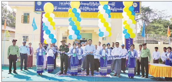
က ချမှတ်ထားသော ရှေ့လုပ်ငန်းစဉ် (၅)ရပ်၊ ဦးတင်ချက် (၉) ရပ်အနက် စီးပွားရေးဦးစွာဌာနချုပ်တွင် ပါဝင်သော "တိုးတက်ကောင်းမွန်လာသည့် စီးပွားရေး မောင်းနှင်အားကို မဏ္ဍိုင်ပြု၍ MSME စက်မှုလုပ်ငန်းများကို အားပေးဆောင်ရွက်ကာ ပို့ကုန်ကဏ္ဍ မြှင့်တင်ရေးကို တစ်ဖက်တစ်လမ်းမှ အကောင်

မင်းဘူး ဇန်နဝါရီ ၄ မကွေးတိုင်းဒေသကြီး မင်းဘူးမြို့၌ (၇၇)နှစ်မြောက် လွတ်လပ်ရေးနေ့ကို ဂုဏ်ပြုသောအားဖြင့် မင်းဘူးခရိုင် အသေးစားစက်မှုလက်မှုလုပ်ငန်းဦးစီးဌာနရုံး အဆောက်အအုံအသစ် ဖွင့်ပွဲအခမ်းအနားကို ဇန်နဝါရီ ၄ ရက်က အဆိုပါရုံး၌ ကျင်းပသည်။ ဦးစွာ မကွေးတိုင်းဒေသကြီး ဝန်ကြီးချုပ် ဦးတင်လွင်နှင့် တိုင်းဒေသကြီးဝန်ကြီးများက မင်းဘူးခရိုင် အသေးစားစက်မှုလက်မှုလုပ်ငန်း ဦးစီးဌာနရုံး အဆောက်အအုံအသစ်အား ဖဲကြီးမြတ် ဖွင့်လှစ်ပေးပြီး ရုံးဆိုင်းဘုတ်အား အမွှေးနံ့သာရည်များ ပက်ဖျန်းကာ ရုံးသစ်အတွင်းရှိ အခန်းဖွဲ့စည်းများကို လှည့်လည်ကြည့်ရှုစစ်ဆေးသည်။ ဆက်လက်ပြီး တိုင်းဒေသကြီး ဝန်ကြီးချုပ် ဦးတင်လွင်က နိုင်ငံတော်စီမံအုပ်ချုပ်ရေးကောင်စီ