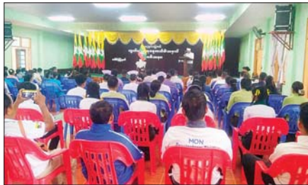
ပေါင်မြို့နယ်၌ (၇၇)နှစ်မြောက် လွတ်လပ်ရေးနေ့ အလံတင်အခမ်း အနားနှင့် သဝဏ်လွှာဖတ်ကြားပွဲ အခမ်းအနားကို ဇန်နဝါရီ ၄ ရက် က ကျင်းပရာ မြို့နယ်စီမံအုပ်ချုပ်ရေးအဖွဲ့ဥက္ကဋ္ဌ ဦးထင်လင်း အောင် လွတ်လပ်ရေးသဝဏ်လွှာဖတ်ကြားစဉ်။ မွန်မလေး (ပြန်/ဆက်)