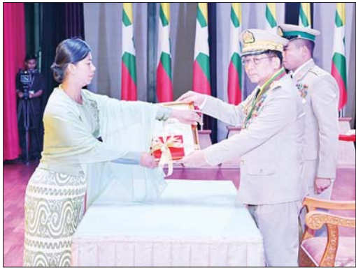
နိုင်ငံတော်စီမံအုပ်ချုပ်ရေးကောင်စီဥက္ကဋ္ဌ တပ်မတော်ကာကွယ်ရေးဦးစီးချုပ် ဗိုလ်ချုပ်မှူးကြီး သတိုးမဟာသရေစည်သူ သတိုးသီရိသုဓမ္မ မင်းအောင်လှိုင် တပ်မတော်စွမ်းရည်သတ္တိဆိုင်ရာ ဂုဏ်ထူးဆောင်တံဆိပ် ရရှိသူများအား ဆုတံဆိပ်ပေးအပ်ခြင်းဖြစ်သည်။

ဆုတံဆိပ်များ ပေးအပ်ချီးမြှင့် ယင်းနောက် နိုင်ငံတော်စီမံအုပ်ချုပ်ရေးကောင်စီဥက္ကဋ္ဌ တပ်မတော်ကာကွယ်ရေး ဦးစီးချုပ်က သူရဲကောင်းမှတ်တမ်းဝင်တံဆိပ်ရရှိသူ ဗိုလ်မှူးချုပ် ၄ ဦး၊ ဗိုလ်မှူးကြီး ၂ ဦး၊ ဒုတိယဗိုလ်မှူးကြီး ၈ ဦး၊ ဗိုလ်မှူး ၉ ဦး၊ ဗိုလ်ကြီး ၄ ဦး၊ အရာခံဗိုလ် ၁ ဦး၊ တပ်ကြပ်ကြီး ၁ ဦး၊ တပ်ကြပ် ၃ ဦး၊ ဒုတိယတပ်ကြပ် ၂ ဦး တို့အား ဆုတံဆိပ်များ ပေးအပ်ချီးမြှင့်ခဲ့သည်။