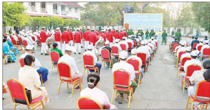
သရေစည်သူ သတိုးသိရီသမ္မ (၇၇)နှစ်မြောက် လွတ်လပ်ရေးနေ့ ကြောင်း သတင်းရရှိသည်။ မင်းအောင်လှိုင်ထံမှ ပေးပို့သည့် သဝဏ်လွှာအား ဖတ်ကြားခဲ့ တိုင်းဒေသကြီး (ပြန်/ဆက်)

တပ်မဌာနချုပ် အလံတင်တပ်ဖွဲ့နှင့် စစ်တီးဝိုင်းအဖွဲ့တို့ တက်ရောက်ကြပြီး အလံတင်တပ်ဖွဲ့မှ ပြည်ထောင်စုသမ္မတ မြန်မာနိုင်ငံတော်အလံအား အလံတင်ထိပ်သို့ လှည့်တင်ကာ တိုင်းဒေသကြီး လုံခြုံရေးနှင့် နယ်စပ်ရေးရာဝန်ကြီးဌာနမှ ဝန်ကြီးချုပ် ဦးအောင်သောင်းထိုက်၊ ဝန်ကြီးများ၊ ဥပဒေချုပ်၊ အစိုးရအဖွဲ့ အတွင်းရေးမှူးနှင့် တိုင်းဒေသကြီး/ခရိုင်/မြို့နယ်အဆင့် ဌာနဆိုင်ရာများ၊ တိုင်းရင်းသားလူမျိုးများ၊ အမှတ် (၇၇) မြေမြန်