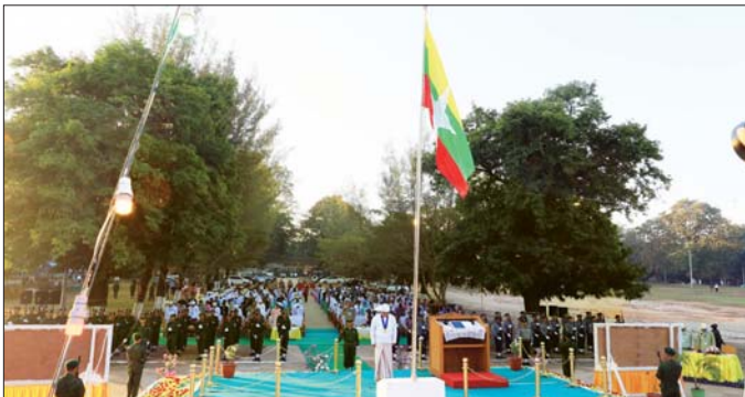
အစိုးရအဖွဲ့ဝင်များနှင့် ဌာနဆိုင်ရာတာဝန်ရှိသူများ တက်ရောက်ကြပြီး တပ်မတော်သားများ၊ မြန်မာနိုင်ငံ ရဲတပ်ဖွဲ့ဝင်များပါဝင်သော ဂုဏ်ပြုတပ်ခွဲ၊ အလံစောင့်တပ်ဖွဲ့နှင့် အလံတင်အရာရှိများက နိုင်ငံတော်အလံကို တိုင်ထိပ်သို့ လွှင့်ထူခဲ့ကြကာ တက်ရောက်လာသူများက နိုင်ငံတော်အလံကို အလေးပြုကြသည်။ ထို့နောက် နံနက် ၇ နာရီတွင် (၇၇)နှစ်မြောက်လွတ်လပ်ရေးနေ့

ဘားအံ ဇန်နဝါရီ ၄ ၂၀၂၅ ခုနှစ် ဇန်နဝါရီ ၄ ရက်တွင် ကျရောက်သော (၇၇)နှစ်မြောက် လွတ်လပ်ရေးနေ့အလံတင်အခမ်းအနားနှင့် သဝဏ်လွှာဖတ်ကြားသည့်အခမ်းအနားကို ယနေ့နံနက်ပိုင်းက ကရင်ပြည်နယ် ဘားအံမြို့၊ သီရိကွင်းရှိ လွတ်လပ်ရေးကျောက်တိုင်ရှေ့၌ ကျင်းပသည်။ ဦးစွာ နံနက် ၄ နာရီ မိနစ် ၂၀ တွင် (၇၇)နှစ်မြောက် လွတ်လပ်ရေးနေ့ အလံတင်အခမ်းအနားကို ကျင်းပရာ ပြည်နယ်လုံခြုံရေးနှင့် နယ်စပ်ရေးရာဝန်ကြီးဗိုလ်မှူးကြီး မင်းသုဏ္ဍော်က အကြီးအမှူးအဖြစ် ဆောင်ရွက်၍ ပြည်နယ်