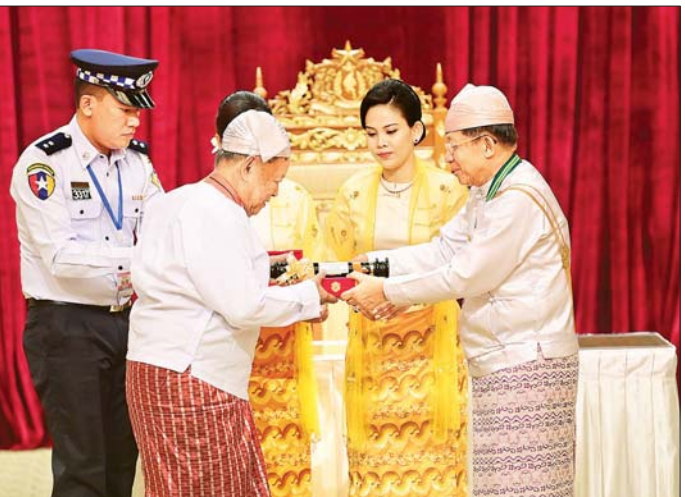
နိုင်ငံတော်စီမံအုပ်ချုပ်ရေးကောင်စီဥက္ကဋ္ဌ နိုင်ငံတော်ဝန်ကြီးချုပ် ဗိုလ်ချုပ်မှူးကြီး သတိုးမဟာသရေစည်သူ သတိုးသိရီသုဓမ္မ မင်းအောင်လှိုင် အလင်္ကာကျော်စွာဘွဲ့ရရှိသူ စာပေပညာရှင် ဒေါက်တာထွန်းတင် (ဒေါက်တာထွန်းတင်-မြန်မာစာ) အား ဂုဏ်ထူးဆောင်ဘွဲ့ ချီးမြှင့်အပ်နှင်းစဉ်။

စာမျက်နှာ ၅ မှ တရားဥပဒေစိုးမိုးရေး အပြည့်အဝ ရရှိလာအောင် အလေးထားဆောင်ရွက်သွားမည်”ဆိုသည့်အချက် အပါအဝင် ရှေ့လုပ်ငန်းစဉ် (၅) ရပ်ကို ချမှတ်ထားကြောင်း၊ “စစ်မှန်စွာ စည်းကမ်း ပြည့်ဝသော ပါတီနီဒီမိုကရေစီစနစ် ခိုင်မာစေရေးနှင့် ဒီမိုကရေစီနှင့် ဖက်ဒရယ်စနစ်ကို အခြေခံသည့် ပြည်ထောင်စုတည်ဆောက်နိုင်ရေး” အပါအဝင် ဦးတည်ချက် (၉) ရပ်ကိုလည်း နိုင်ငံတော်တာဝန်ထမ်းဆောင်ချိန်ကစပြီး တစ်စိတ်တစ်ပိုင်း အကောင်အထည်ဖော် ဆောင်ရွက်လျက်ရှိကြောင်း၊ ထို့ပြင် တိုင်းပြည်သာယာဝပြောရေး၊ စားရေး ရိက္ခာဖူလုံရေးဆိုင်ရာ အမျိုးသားရေး ရည်မှန်းချက် (၂) ရပ်ကိုလည်း ချမှတ်အကောင်အထည်ဖော် ဆောင်ရွက်လျက်ရှိကြောင်း။ ချီးမြှင့်အပ်နှင်းလျက်ရှိ ထိုသို့အကောင်အထည်ဖော်ဆောင်ရွက်ရာတွင် ပြည်ထောင်စုဖွား တိုင်းရင်းသားပြည်သူအားလုံး၏ အင်အားသည် အဓိကကျပြီး အားလုံးပူးပေါင်းပါဝင်မှုသည် အရေးကြီးကြောင်း၊ နိုင်ငံတော်အစိုးရ၏ ဦးဆောင်မှုနှင့်အတူ စိတ်ရာ