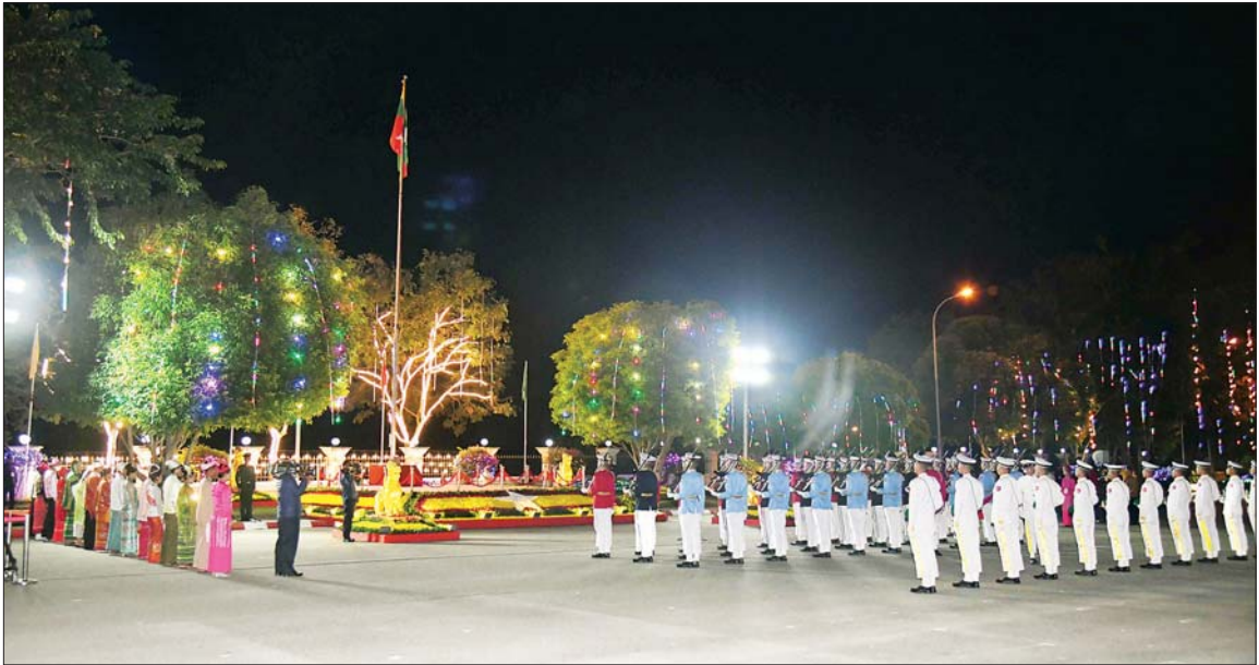
၂၀၂၅ ခုနှစ် (၇၇) နှစ်မြောက် လွတ်လပ်ရေးနေ့ နိုင်ငံတော်အလံတင်အခမ်းအနား ကျင်းပစဉ်။

ဟန်ချက်ညီညီ ဖွံ့ဖြိုးတိုးတက်ရန် အတွက် ပြည်သူ့လူထုတစ်ရပ်လုံး၏ “စုပေါင်းအား” ဖြင့် ဆောင်ရွက်ရေး၊ (၅) “ရှေ့သို့ချီမည် ပန်းတိုင်ဆီ” ဆိုသည့် ဆောင်ပုဒ်အတိုင်း နိုင်ငံရေး၊ စီးပွားရေး၊ ကာကွယ်ရေး၊ အမျိုးသားရေးစရိုက်လက္ခဏာနှင့် အမျိုးသားစိတ်ဓာတ် မြှင့်တင်ရေး တို့အတွက် ခိုင်မာသည့် ဇွဲ၊ လုံ့လ၊ ဝီရိယထားပြီး စည်းလုံးညီညွတ်စွာဖြင့် ကြိုးပမ်းဖော်ဆောင်ရေး ဟူသည့် (၇၇)နှစ်မြောက်လွတ်လပ်ရေးနေ့ အမျိုးသားရေးဦးတည်ချက်များနှင့်အညီ အနှစ်သာရပြည့်ဝစွာ ကျင်းပခြင်းဖြစ်သည်။ နိုင်ငံတော်အလံကို လွှင့်တင်ရေးဦးစွာ နံနက် ၄ နာရီ မိနစ် ၂၀ တွင် ၂၀၂၅ ခုနှစ် (၇၇) နှစ်မြောက် လွတ်လပ်ရေးနေ့ နိုင်ငံတော်အလံတင် အခမ်းအနားကို ကျင်းပရာ အလံတင်တပ်စုက တိုင်းရင်းသား၊ တိုင်းရင်းသူများ ဖြစ်၍ နိုင်ငံတော်အလံကို လွှင့်တင်သည်။