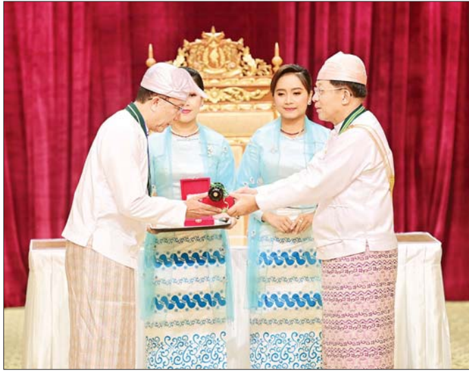
နိုင်ငံတော်စီမံအုပ်ချုပ်ရေးကောင်စီဥက္ကဋ္ဌ နိုင်ငံတော်ဝန်ကြီးချုပ် ဗိုလ်ချုပ်မှူးကြီး သတိုးမဟာသရေစည်သူ သတိုးသီရိသုဓမ္မ မင်းအောင်လှိုင် ပြည်ထောင်စု စည်သူသင်္ဂဟဘွဲ့ ဖြစ်သည့် စည်သူဘွဲ့ ရရှိသူ ဒုတိယဝန်ကြီး ချုပ်နှင့် ပြည်ထောင်စုဝန်ကြီး ဦးဝင်းရှိန်အား ဂုဏ်ထူးဆောင်ဘွဲ့ ချီးမြှင့်အပ်နှင်းစဉ်။