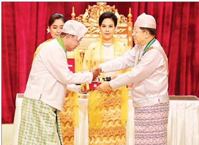
နိုင်ငံတော်စီမံအုပ်ချုပ်ရေးကောင်စီဥက္ကဋ္ဌ နိုင်ငံတော်ဝန်ကြီးချုပ် ဗိုလ်ချုပ်မှူးကြီး သတိုးမဟာသရေစည်သူ သတိုးသိရီသုဓမ္မ မင်းအောင်လှိုင် ဝဏ္ဏကျော်ထင်ဘွဲ့ရရှိသူ ဒုတိယဝန်ကြီး ဦးဝင်းဖေ အား ဂုဏ်ထူးဆောင်ဘွဲ့ ချီးမြှင့်အပ်နှင်းစဉ်။