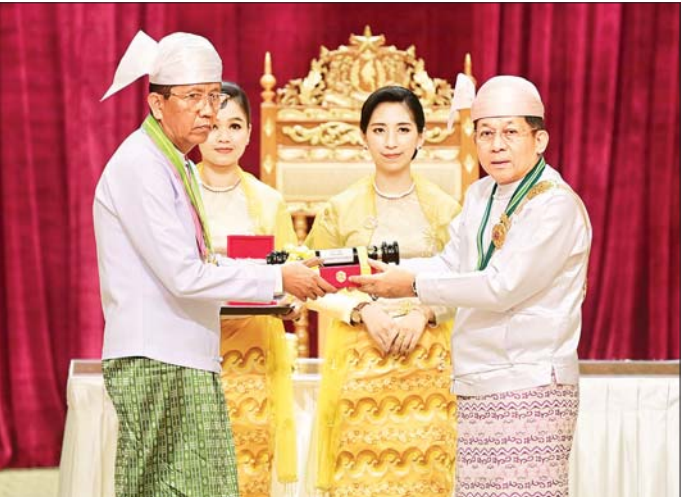
နိုင်ငံတော်စီမံအုပ်ချုပ်ရေးကောင်စီဥက္ကဋ္ဌ နိုင်ငံတော်ဝန်ကြီးချုပ် ဗိုလ်ချုပ်မှူးကြီး သတိုးမဟာသရေစည်သူ သတိုးသိရီသုဓမ္မ မင်းအောင်လှိုင် ဝဏ္ဏကျော်ထင်ဘွဲ့ရရှိသူ ဒုတိယဝန်ကြီး ဦးအောင်မြိုင် အား ဂုဏ်ထူးဆောင်ဘွဲ့ ချီးမြှင့်အပ်နှင်းစဉ်။