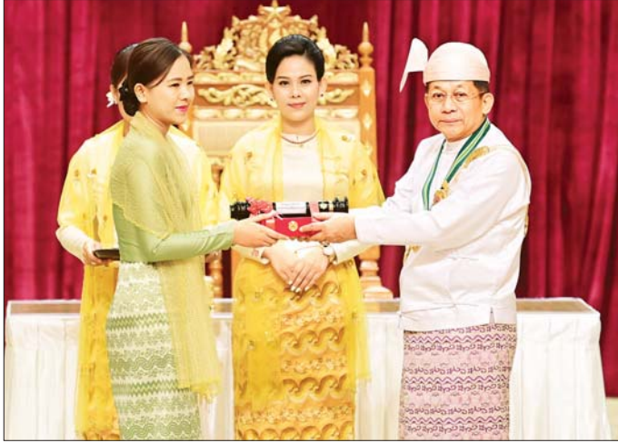
နိုင်ငံတော်စီမံအုပ်ချုပ်ရေးကောင်စီဥက္ကဋ္ဌ နိုင်ငံတော်ဝန်ကြီးချုပ် ဗိုလ်ချုပ်မှူးကြီး သတိုးမဟာသရေစည်သူ သတိုးသီရိသုဓမ္မ မင်းအောင်လှိုင် တပ်မတော်စွမ်းရည်သတ္တိဆိုင်ရာဘွဲ့ဖြစ်သည့် သူရဘွဲ့ရရှိသူ ဗိုလ်မှူးသက်ပိုင်ထက်(ကိုယ်စား) ဇနီး ဒေါ်နန်းမေဟန်ဖူးအား ဂုဏ်ထူးဆောင်ဘွဲ့ ချီးမြှင့်အပ်နှင်းစဉ်။