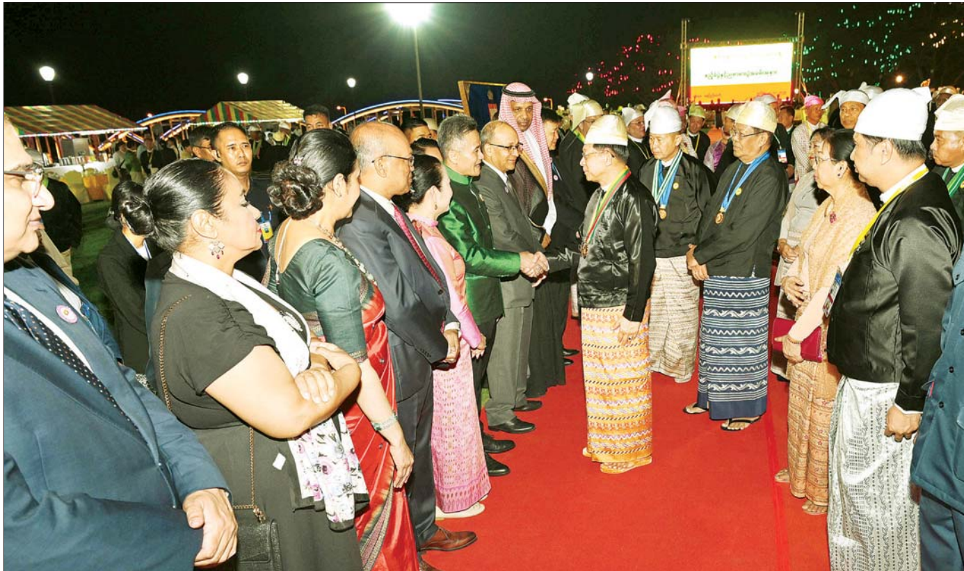
နိုင်ငံတော်စီမံအုပ်ချုပ်ရေးကောင်စီဥက္ကဋ္ဌ နိုင်ငံတော်ဝန်ကြီးချုပ် ဗိုလ်ချုပ်မှူးကြီး သတိုးမဟာသရေစည်သူ သတိုးသိရီသူဓမ္မ မင်းအောင်လှိုင်နှင့်ဇနီး ဒေါ်ကြူကြူလှ (၇၇)နှစ်မြောက် လွတ်လပ်ရေးနေ့အထိမ်းအမှတ် ဂုဏ်ပြုညစာစားပွဲနှင့် ဂုဏ်ပြုဖျော်ဖြေပွဲ အခမ်းအနား တက်ရောက်လာကြသည့် နိုင်ငံခြားသံရုံးများမှ သံအမတ်ကြီးများနှင့် သံရုံးတာဝန်ခံများအား ရင်းရင်းနှီးနှီး နှုတ်ဆက်စဉ်။