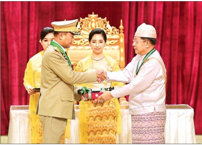
နိုင်ငံတော်စီမံအုပ်ချုပ်ရေးကောင်စီဥက္ကဋ္ဌ နိုင်ငံတော်ဝန်ကြီးချုပ် ဗိုလ်ချုပ်မှူးကြီး သတိုးမဟာသရေစည်သူ သတိုးသီရိသုဓမ္မ မင်းအောင်လှိုင် ဇေယျကျော်ထင်ဘွဲ့ရရှိသူ ဒုတိယဗိုလ်ချုပ်ကြီး ထိန်ဝင်းအား ဂုဏ်ထူးဆောင်ဘွဲ့ ချီးမြှင့်အပ်နှင်းစဉ်။