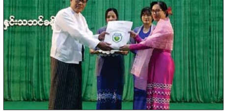
အင်္ဂုတက္ကသိုလ်၌ (၇၇) နှစ်မြောက် လွတ်လပ်ရေးနေ့အထိမ်းအမှတ် ဟောပြောပွဲကျင်းပ

ရန်ကုန် ဇန်နဝါရီ ၄ ရန်ကုန်တိုင်းဒေသကြီး ဒဂုံမြို့သစ်(အရှေ့ပိုင်း)မြို့နယ်တွင် (၇၇)နှစ် မြောက် လွတ်လပ်ရေးနေ့အထိမ်းအမှတ် ဟောပြောပွဲကို ဇန်နဝါရီ ၃ ရက်က ဒဂုံတက္ကသိုလ် ဘွဲ့နှင်းသင်္ဘောခန်းမ၌ ကျင်းပသည်။