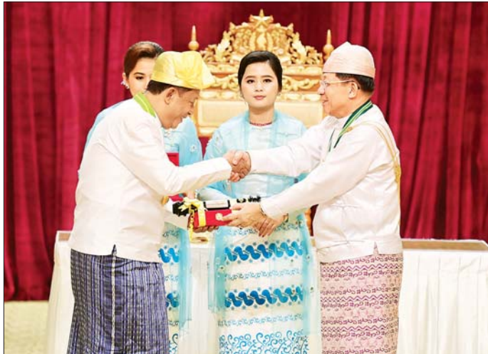
နိုင်ငံတော်စီမံအုပ်ချုပ်ရေးကောင်စီဥက္ကဋ္ဌ နိုင်ငံတော်ဝန်ကြီးချုပ် ဗိုလ်ချုပ်မှူးကြီး သတိုးမဟာသရေစည်သူ သတိုးသိရီသုဓမ္မ မင်းအောင်လှိုင် ဝဏ္ဏကျော်ထင်ဘွဲ့ရရှိသူ နိုင်ငံတော်စွမ်းပုံအခြေခံဥပဒေဆိုင်ရာ နှံ့ရုံးအဖွဲ့ဝင် ဦးခင်မောင်ဦး အား ဂုဏ်ထူးဆောင်ဘွဲ့ ချီးမြှင့်အပ်နှင်းစဉ်။