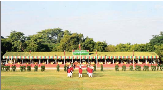
ရွှင်ပွဲ အားကစားပြိုင်ပွဲများကို ကျင်းပပြီး အားကစား ပြိုင်ပွဲများအလိုက် ဆုရရှိသူများအား တိုင်းမှူးများနှင့် တာဝန်ရှိသူများက ဆုများ ပေးအပ်ခဲ့ကြောင်း သတင်းစဉ်

ထို့နောက် (၇၇) နှစ်မြောက် လွတ်လပ်ရေးနေ့အထိမ်းအမှတ် ပျော်ပွဲရွှင်ပွဲ အားကစားပြိုင်ပွဲများကို ကျင်းပပြီး အားကစားနည်းများအလိုက် ဆုရရှိသူများအား ကာကွယ်ရေးဦးစီးချုပ်ရုံး(ကြည်း)မှ စခန်းမှူးနှင့် တာဝန်ရှိသူများက ဆုများပေးအပ်ချီးမြှင့်ခဲ့ကြောင်း သိရသည်။ အလားတူ (၇၇)နှစ်မြောက် လွတ်လပ်ရေးနေ့ စစ်ရေးပြအခမ်းအနားများကို တိုင်းစစ်ဌာနချုပ်များအလိုက် ကျင်းပကြရာ တိုင်းဒေသကြီးနှင့် ပြည်နယ်များမှ ဝန်ကြီးချုပ်များ၊ သက်ဆိုင်ရာတိုင်းစစ်ဌာနချုပ်အသီးသီးမှ တိုင်းမှူးများ၊ တပ်မတော်အရာရှိကြီးများ၊ တပ်ရင်း/တပ်ဖွဲ့မှူးများနှင့် အရာရှိ၊ စစ်သည်များ တက်ရောက်ကြပြီး စစ်ရေးပြအစီအစဉ်အတိုင်း ကျင်းပကြသည်။ ထို့ပြင် တိုင်းစစ်ဌာနချုပ်များအလိုက် (၇၇)နှစ်မြောက် လွတ်လပ်ရေးနေ့အထိမ်းအမှတ် ပျော်ပွဲ