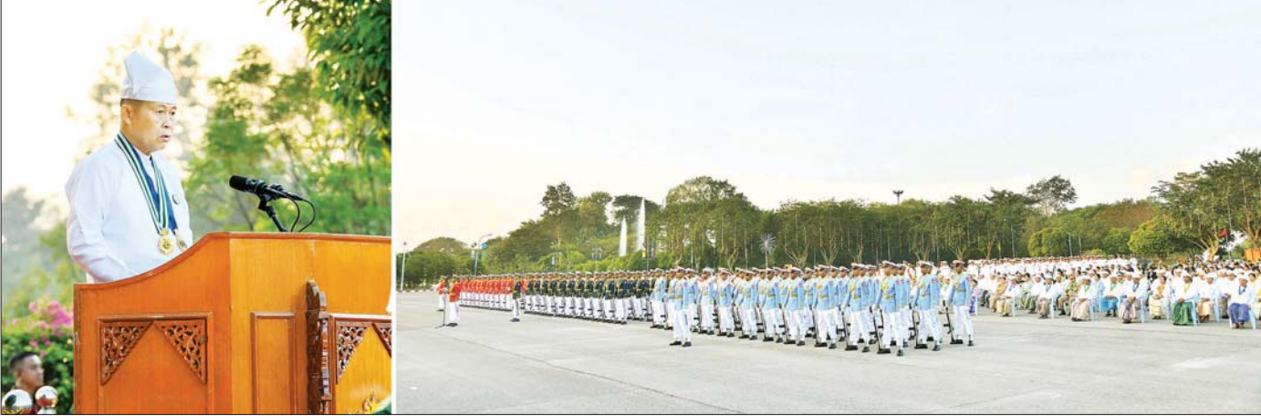
နိုင်ငံတော်စီမံအုပ်ချုပ်ရေးကောင်စီ ဒုတိယဥက္ကဋ္ဌ ဒုတိယဝန်ကြီးချုပ် ဒုတိယဗိုလ်ချုပ်မှူးကြီး သီရိပျံချီ မဟာသရေစည်သူ စိုးဝင်းက နိုင်ငံတော်စီမံအုပ်ချုပ်ရေးကောင်စီ ဥက္ကဋ္ဌ နိုင်ငံတော်ဝန်ကြီးချုပ် ဗိုလ်ချုပ်မှူးကြီး သတိုးမဟာသရေစည်သူ သတိုးသီရိသုဓမ္မ မင်းအောင်လှိုင်ထံမှ (၇၇) နှစ်မြောက် လွတ်လပ်ရေးနေ့အခမ်းအနားသို့ပေးပို့သည့် သဝဏ်လွှာကို ဖတ်ကြားစဉ်။