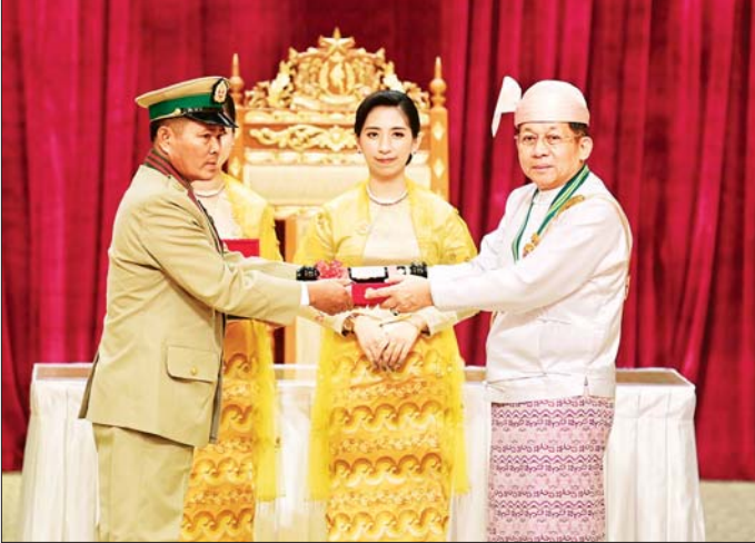
နိုင်ငံတော်စီမံအုပ်ချုပ်ရေးကောင်စီဥက္ကဋ္ဌ နိုင်ငံတော်ဝန်ကြီးချုပ် ဗိုလ်ချုပ်မှူးကြီး သတိုးမဟာသရေစည်သူ သတိုးသီရိသုဓမ္မ မင်းအောင်လှိုင် တပ်မတော်စွမ်းရည်သတ္တိဆိုင်ရာဘွဲ့ဖြစ်သည့် သူရဘွဲ့ရရှိသူ ဗိုလ်မှူးဌေးအောင်အား ဂုဏ်ထူးဆောင်ဘွဲ့ ချီးမြှင့်အပ်နှင်းစဉ်။