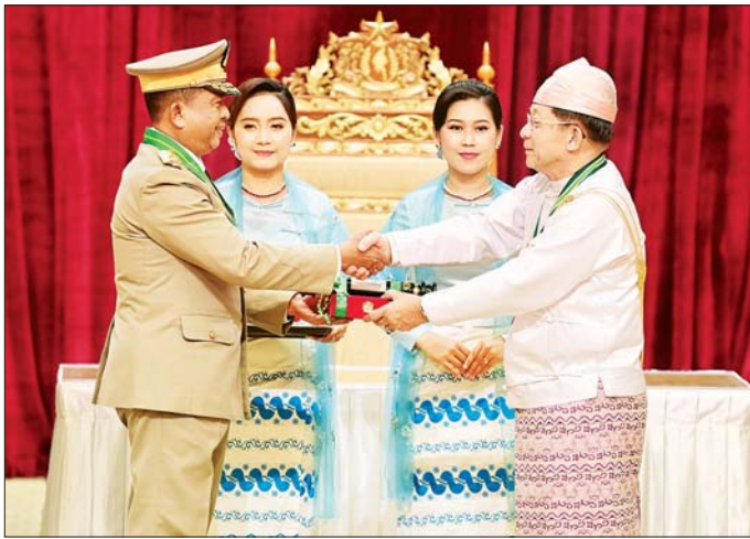
နိုင်ငံတော်စီမံအုပ်ချုပ်ရေးကောင်စီဥက္ကဋ္ဌ နိုင်ငံတော်ဝန်ကြီးချုပ် ဗိုလ်ချုပ်မှူးကြီး သတိုးမဟာသရေစည်သူ သတိုးသီရိသုဓမ္မ မင်းအောင်လှိုင် ဇေယျကျော်ထင်ဘွဲ့ရရှိသူ ဗိုလ်ချုပ် ခင်ဇော် (အငြိမ်းစား) အား ဂုဏ်ထူးဆောင်ဘွဲ့ ချီးမြှင့်အပ်နှင်းစဉ်။