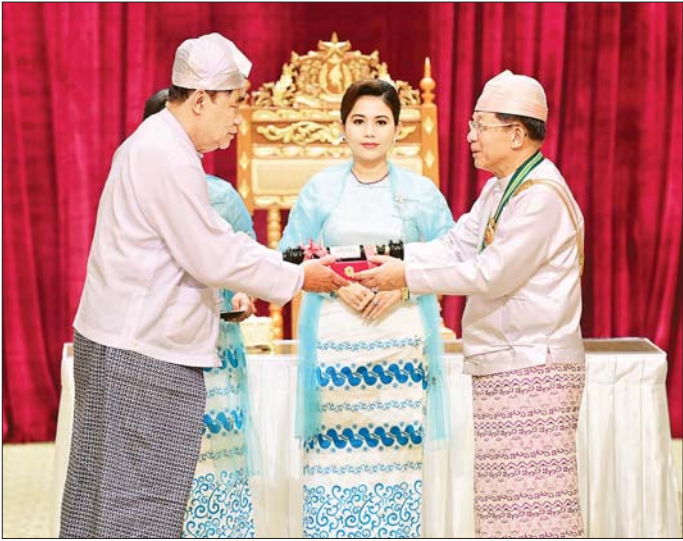
နိုင်ငံတော်စီမံအုပ်ချုပ်ရေးကောင်စီဥက္ကဋ္ဌ နိုင်ငံတော်ဝန်ကြီးချုပ် ဗိုလ်ချုပ်မှူးကြီး သတိုးမဟာသရေစည်သူ သတိုးသီရိသုဓမ္မ မင်းအောင်လှိုင် တပ်မတော်စွမ်းရည်သတ္တိဆိုင်ရာဘွဲ့ ဖြစ်သည့် သူရဲဘွဲ့ ရရှိသူ ဗိုလ်မှူးကြီး ငြိမ်းချမ်း (ကိုယ်စား) ဖခင် ဦးတင်ဝေဦးအား ဂုဏ်ထူးဆောင်ဘွဲ့ ချီးမြှင့်အပ်နှင်းစဉ်။