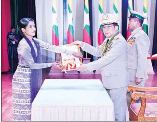
နိုင်ငံတော်စီမံအုပ်ချုပ်ရေးကောင်စီဥက္ကဋ္ဌ တပ်မတော်ကာကွယ်ရေးဦးစီးချုပ် ဗိုလ်ချုပ်မှူးကြီး သတိုးမဟာသရေစည်သူ သတိုးသီရိသုဓမ္မ မင်းအောင်လှိုင် တပ်မတော်စွမ်းရည်သတ္တိဆိုင်ရာ ဂုဏ်ထူးဆောင်တံဆိပ် ရရှိသူများအား ဆုတံဆိပ်ပေးအပ်ချီးမြှင့်ခြင်းဖြစ်သည်။

ထို့နောက် နိုင်ငံတော်စီမံအုပ်ချုပ်ရေးကောင်စီဥက္ကဋ္ဌ တပ်မတော်ကာကွယ်ရေးဦးစီးချုပ်နှင့် အဖွဲ့ဝင်များသည် တပ်မတော်စွမ်းရည်သတ္တိဆိုင်ရာ ဂုဏ်ထူးဆောင်တံဆိပ်များ ရရှိခဲ့သည့် အရာရှိ စစ်သည်များ၊ အမွေခံများနှင့်အတူ အမှတ်တရပေးပို့ပေးခြင်းအားလုံး ပြုလုပ်ခဲ့ကြောင်း သိရသည်။