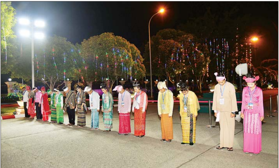
တက်ရောက်လာကြသည့် တိုင်းရင်းသား၊ တိုင်းရင်းသူများ နိုင်ငံတော်အလံကို အလေးပြုကြစဉ်။

ဌာနဆိုင်ရာ အကြီးအကဲများနှင့် ဝန်ထမ်းများ၊ တိုင်းရင်းသား၊ တိုင်းရင်းသူများ၊ မိဘပြည်သူများ သည် နိုင်ငံတော်အလံ အလေးပြုပွဲ အခမ်းအနားကျင်းပမည့် မြို့တော်ခန်းမရှေ့ ရင်ပြင်သို့ ဝင်ရောက်နေရာယူကြသည်။ ချီတက်နေရာယူ ယင်းနောက် နံနက် ၇ နာရီတွင် ၂၀၂၅ ခုနှစ် (၇၇)နှစ်မြောက် လွတ်လပ်ရေးနေ့ နိုင်ငံတော်အလံ အလေးပြုပွဲ အခမ်းအနားကို ကျင်းပရာ တပ်မတော် (ကြည်း၊ ရေ၊ လေ) ဂုဏ်ပြုတပ်ဖွဲ့က မြို့တော်ခန်းမရှေ့ ရင်ပြင်သို့ ချီတက်နေရာယူကြသည်။ ဆက်လက်၍ (၇၇) နှစ်မြောက် လွတ်လပ်ရေးနေ့ ကျင်းပရေး ဗဟိုကော်မတီဥက္ကဋ္ဌ၊ နိုင်ငံတော်စီမံအုပ်ချုပ်ရေးကောင်စီ ဒုတိယဥက္ကဋ္ဌ ဒုတိယဝန်ကြီးချုပ် ဒုတိယဗိုလ်ချုပ်မှူးကြီး သီရိပျံချီ မဟာသရေစည်သူ စိုးဝင်းက အလေးပြုခံစင်မြင့်သို့ ရောက်ရှိပြီး ဂုဏ်ပြုတပ်ဖွဲ့၏ အလေးပြုခြင်းကို ခံယူသည်။ နိုင်ငံတော်အလံကို အလေးပြု ထို့နောက် နိုင်ငံတော်စီမံအုပ်ချုပ်ရေးကောင်စီ ဒုတိယဥက္ကဋ္ဌ ဒုတိယဝန်ကြီးချုပ်နှင့်