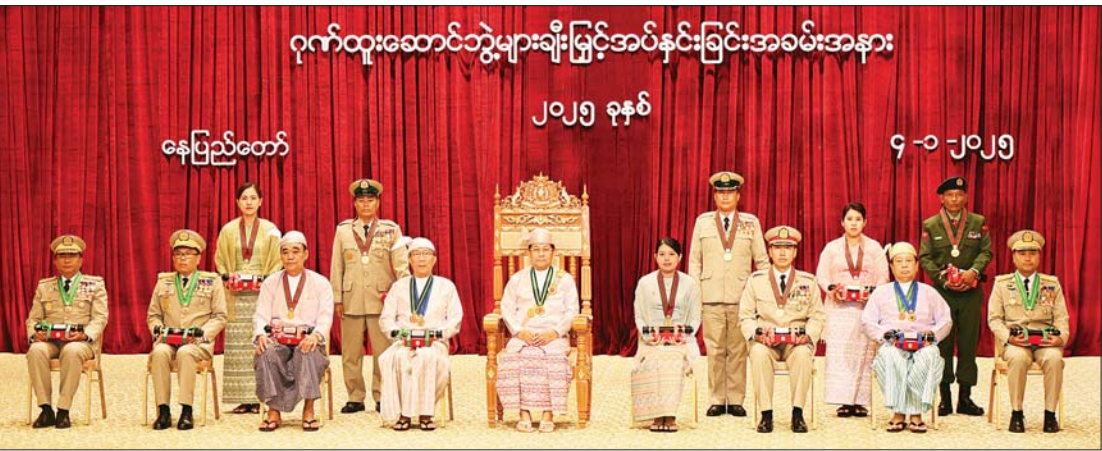
နိုင်ငံတော်စီမံအုပ်ချုပ်ရေးကောင်စီဥက္ကဋ္ဌ နိုင်ငံတော်ဝန်ကြီးချုပ် ဗိုလ်ချုပ်မှူးကြီး သတိုးမဟာသရေစည်သူ သတိုးသိရီသုဓမ္မ မင်းအောင်လှိုင် ဂုဏ်ထူးဆောင်ဘွဲ့၊ ရရှိသူများ နှင့်အတူ မှတ်တမ်းတင် စုပေါင်းဓာတ်ပုံရိုက်စဉ်။

နိုင်ငံတော်အတွက် ထူးထူးချွန်ချွန် ဆောင်ရွက်ခဲ့ကြသူများ၊ စွန့်လွှတ်စွန့်စား မှု အနစ်နာခံမှုတို့ဖြင့် တာဝန်ကျေခဲ့ကြသူ များကို နိုင်ငံတော်အစိုးရအနေဖြင့် ကျေးဇူးတင်ရှိသည်ကို ထပ်လောင်း ပြောကြားလိုကြောင်း၊ ယခုကဲ့သို့ ဂုဏ်ပြု ချီးမြှင့်ပေးခြင်းကို ဝမ်းသာဂုဏ်ယူပါ ကြောင်းနှင့် ဆက်လက်၍လည်း ဂုဏ်ပြု သင့်သူများကို မှတ်တမ်းတင် ဂုဏ်ပြုချီးမြှင့် သွားမည်ဖြစ်ကြောင်း ပြောကြားသည်။ ထို့နောက် နိုင်ငံတော်စီမံအုပ်ချုပ်ရေး ကောင်စီဥက္ကဋ္ဌ နိုင်ငံတော်ဝန်ကြီးချုပ် ဗိုလ်ချုပ်မှူးကြီး သတိုးမဟာသရေစည်သူ သတိုးသိရီသုဓမ္မ မင်းအောင်လှိုင်က ပြည်ထောင်စု စည်သူသင်္ဂဟဘွဲ့များဖြစ် ကြသည့် စည်သူဘွဲ့၊ ရရှိသူ ၃ ဦး၊ တပ်မတော်စွမ်းရည်သတ္တိဆိုင်ရာဘွဲ့ ဖြစ် သည့် သူရဲဘွဲ့၊ ရရှိသူ ၈ ဦး၊ စွမ်းဆောင်မှု ဆိုင်ရာ ဂုဏ်ထူးဆောင်ဘွဲ့များ ဖြစ်ကြ သည့် သီရိပျံချီဘွဲ့၊ ရရှိသူ ၃ ဦး၊ ဝေယျာ ကျော်ထင်ဘွဲ့၊ ရရှိသူ ၃ ဦး၊ ဝေယျာကျော်ထင် ဘွဲ့၊ ရရှိသူ ၈ ဦး၊ အလင်္ကာကျော်စွာဘွဲ့၊ ရရှိ