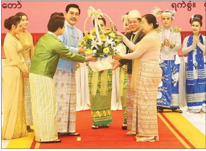
နိုင်ငံတော်စီမံအုပ်ချုပ်ရေးကောင်စီဥက္ကဋ္ဌ နိုင်ငံတော်ဝန်ကြီးချုပ် ဗိုလ်ချုပ်မှူးကြီး သတိုးမဟာသရေစည်သူ သတိုးသိရီသုဓမ္မ မင်းအောင်လှိုင်နှင့်ဇနီး ဒေါ်ကြူကြူလှတို့ အနုပညာရှင်များအား ဂုဏ်ပြုပန်းခြင်းပေးအပ်စဉ်။

အဆိုပါ (၇၇) နှစ်မြောက် လွတ်လပ်ရေးနေ့အထိမ်းအမှတ် ဂုဏ်ပြုညစာစားပွဲ အခမ်းအနားသို့ နိုင်ငံတော်စီမံအုပ်ချုပ်ရေးကောင်စီ ဒုတိယဥက္ကဋ္ဌ ဒုတိယဝန်ကြီးချုပ် ဒုတိယဗိုလ်ချုပ်မှူးကြီး သိရီပျံချီ မဟာသရေစည်သူ စိုးဝင်းနှင့်ဇနီး ဒေါ်သန်းသန်းနွယ်၊ နိုင်ငံတော်စီမံအုပ်ချုပ်ရေးကောင်စီ အတွင်းရေးမှူးနှင့်ဇနီး၊ ကောင်စီဝင်များနှင့်ဇနီးများ၊ ပြည်ထောင်စုအဆင့်ပုဂ္ဂိုလ်များနှင့် ဇနီးများ၊ နိုင်ငံတော်စီမံအုပ်ချုပ်ရေး