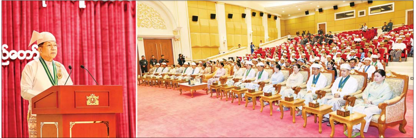
နိုင်ငံတော်စီမံအုပ်ချုပ်ရေးကောင်စီဥက္ကဋ္ဌ နိုင်ငံတော်ဝန်ကြီးချုပ် ဗိုလ်ချုပ်မှူးကြီး သတိုးမဟာသရေစည်သူ သတိုးသီရိသုဓမ္မ မင်းအောင်လှိုင် (၇၇) နှစ်မြောက် လွတ်လပ်ရေးနေ့အထိမ်းအမှတ် ဂုဏ်ထူးဆောင်ဘွဲ့များ ချီးမြှင့်အပ်နှင်းခြင်းအခမ်းအနားတွင် အမှာစကားပြောကြားစဉ်။