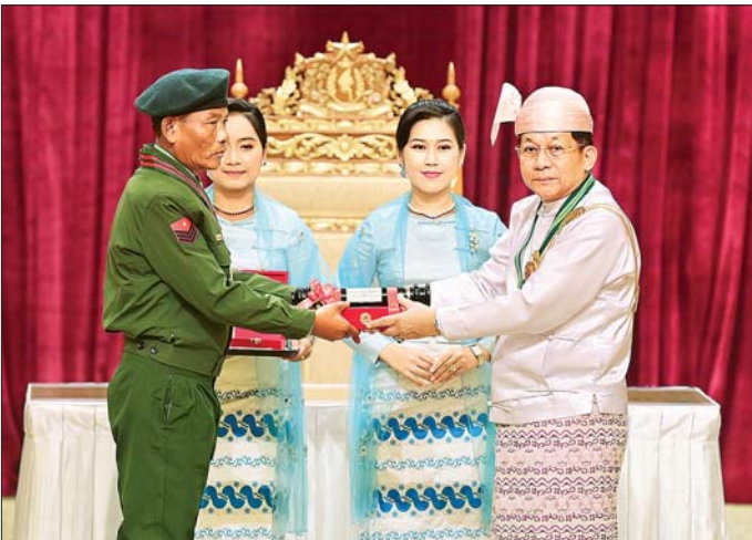
နိုင်ငံတော်စီမံအုပ်ချုပ်ရေးကောင်စီဥက္ကဋ္ဌ နိုင်ငံတော်ဝန်ကြီးချုပ် ဗိုလ်ချုပ်မှူးကြီး သတိုးမဟာသရေစည်သူ သတိုးသီရိသုဓမ္မ မင်းအောင်လှိုင် တပ်မတော်စွမ်းရည်သတ္တိဆိုင်ရာဘွဲ့ဖြစ်သည့် သူရဘွဲ့ရရှိသူ တပ်ခွဲတပ်ကြပ်ကြီး ညွန့်ဝင်းအား ဂုဏ်ထူးဆောင်ဘွဲ့ ချီးမြှင့်အပ်နှင်းစဉ်။