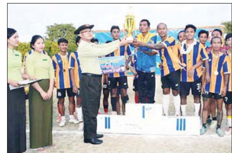
အဆိုပါ ဘောလုံးပြိုင်ပွဲ ပိုလ်လှပွဲကို ကျင်းပရာ ကန်တောင်အသင်း၊ တတိယဆုရ ကန်တောင်အသင်း(ခ) အသင်းတို့မှ အားကစားသမားများအား တစ်ဦးချင်း ဆုတံဆိပ်များကို လည်းကောင်း၊ ပွဲစဉ်တစ်လျှောက် အကောင်းဆုံး ကစားသမားဆုရရှိသူနှင့် နေရာအလိုက် အကောင်းဆုံး အားကစားသမား ဆုရရှိသူများထံသို့ ဆုကလပ်များကိုလည်း နှင့်အဖွဲ့ဝင်များက ပေးအပ်ချီးမြှင့်ခဲ့သည်။ ချမ်းသာ (မိတ္ထီလာ)

မိတ္ထီလာ ဇန်နဝါရီ ၄ မန္တလေးတိုင်းဒေသကြီး မိတ္ထီလာမြို့၌ (၇၇) နှစ်မြောက် လွတ်လပ်ရေးနေ့ အထိမ်းအမှတ် အမျိုးသား (အလွတ်တန်း) ဘောလုံးပြိုင်ပွဲ ပိုလ်လှပွဲနှင့် ဆုချီးမြှင့်ပွဲအခမ်းအနားကို ယမန်နေ့ ညနေ ၃ နာရီက ပေါက်ချောင်းရပ်ကွက်ရှိ မြို့နယ်ဘောလုံးကွင်း၌ ကျင်းပသည်။