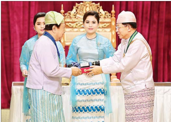
နိုင်ငံတော်စီမံအုပ်ချုပ်ရေးကောင်စီဥက္ကဋ္ဌ နိုင်ငံတော်ဝန်ကြီးချုပ် ဗိုလ်ချုပ်မှူးကြီး သတိုးမဟာသရေစည်သူ သတိုးသီရိသုဓမ္မ မင်းအောင်လှိုင် စွမ်းဆောင်မှုဆိုင်ရာဂုဏ်ထူးဆောင်ဘွဲ့ဖြစ်သည့် သီရိပျံချီဘွဲ့ရရှိသူ ပြည်ထောင်စုဝန်ကြီး (အငြိမ်းစား) ဦးအေးမြင့်အား ဂုဏ်ထူးဆောင်ဘွဲ့ ချီးမြှင့်အပ်နှင်းစဉ်။