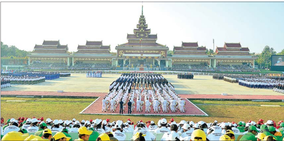
၂၀၂၃ ခုနှစ် (၇၅) နှစ်မြောက် စိန်ရတုလွတ်လပ်ရေးနေ့အခမ်းအနားကို နေပြည်တော်၌ ကျင်းပစဉ်။

အထူးသဖြင့် မြန်မာနိုင်ငံတွင် ယခင် က မရှိခဲ့ဖူးသည့်၊ ရှိခဲ့ဖူးလျှင်လည်း ပေါ်ပေါ်ထင်ထင် လုပ်ခွင့်ရခဲ့သည့်