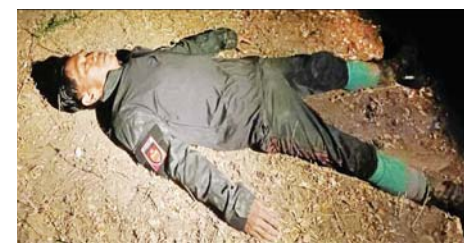
PDF အမည်ခံအကြမ်းဖက်သမားများ ခိုအောင်းနေထိုင်လျက်ရှိသည့် ငါးစွန်မြို့နယ် ကုလားကျေးရွာအတွင်း ဝင်ရောက်ရှင်းလင်းစဉ် ဖော်ထုတ်ဖမ်းဆီးရမိသည့် အကြမ်းဖက်သမား၏ အလောင်းအား တွေ့ရစဉ်။

သမားများနှင့် လက်နက်၊ ခဲယမ်းများကို ယခုကဲ့သို့ အချိန်မီ ဖော်ထုတ် ဖမ်းဆီးနိုင်ခဲ့ခြင်းဖြစ်ကြောင်းနှင့် ဆက်လက်၍လည်း အကြမ်းဖက်အဖွဲ့များ၏ လှုပ်ရှားမှုသတင်းများရရှိပါက နီးစပ်ရာ လုံခြုံရေး တပ်ဖွဲ့ဝင်များထံသို့ လျှို့ဝှက်စွာ သတင်းပေးပို့ခြင်းဖြင့် ရွာတည်ငြိမ်အေးချမ်းအတွက် ပြည်သူ့တစ်ရပ်လုံး ပိုင်းစနစ်ပူးပေါင်းဆောင်ရွက်ကြရန် လိုအပ်မည်ဖြစ်ကြောင်း သတင်းရရှိသည်။