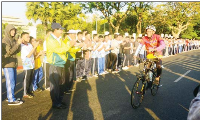
ရန်ကုန်တိုင်းဒေသကြီး ဝန်ကြီးချုပ် ဦးစိုးသိန်း အမျိုးသားသက်ကြီးတန်း စက်ဘီးပြိုင်ပွဲတွင် ပန်းဝင်လာသော အသက် ၈၄ နှစ် ဦးလှိုင်ကို ကြိုဆိုကြစဉ်။