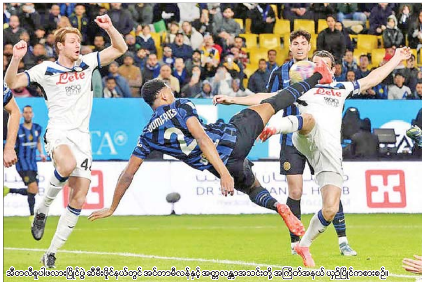
အီတလီစူပါဖလားပြိုင်ပွဲ ဆီမီးဖိုင်နယ်တွင် အင်တာမီလန်နှင့် အတ္တလန္တာအသင်းတို့ အကြိတ်အနယ် ယှဉ်ပြိုင်ကစားစဉ်။