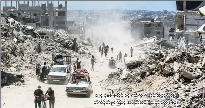
၂၀၂၄ ခုနှစ် ဇူလိုင် ၁၄ ရက်က ဂါဇာ၌ အစွဲရေးတို့၏ တိုက်ခိုက်မှုကြောင့် အပျက်အစီးများကို တွေ့ရစဉ်။

အဆိုပါ အတွေးအခေါ် အယူအဆ များ၊ စကားလုံး ဝေါဟာရများ၊ အပြော အဆိုများက ဗဟုသုတ မပြည့်စုံ မကြွယ်ဝ သူ၊ မြန်မာသမိုင်းကို ကောင်းမွန်စွာ မသင်ကြားခဲ့ရသူ စာစုံအောင် မဖတ်သူတို့ အတွက် တွေဝေစရာ၊ လှုံ့ဆော်စရာ၊ ယိမ်းယိုင်စရာများဖြစ်သည်။ သမိုင်း ပါမောက္ခ ဆရာကြီးခေါက်တာသန်းထွန်း ပြောကြားခဲ့သော “သမိုင်းကိုသင်တာ မအောင်လို့” ဟူသော စာပေနယ်တွင် ထင်ရှားသည့် စကားတစ်ခွန်းကို ကိုးကား ၍ဆိုရလျှင် မအေ အောင် သမိုင်းကို လေ့လာကြစေချင်သည်။ ယနေ့ဖြစ်ရပ် များသည် အတိတ်သမိုင်းနှင့် ဆက်စပ်၍ ဖြစ်ပေါ်နေခြင်းဖြစ်ရာ ရာဇဝင်ကို အဖောက်၍ လိုရာဆွဲပြောကြလျှင် လွဲချော် မည်ဖြစ်သည်။ အခြေခံပညာကျောင်းများ တွင် သမိုင်းဘာသာကို ဆရာမ သို့မဟုတ်