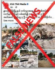
ဖောက်ခွဲခြင်း စသည့်အကြမ်းဖက် လုပ်ရပ်များကိုဖွဲ့ကွယ်ပြီး လုံခြုံရေးတပ်ဖွဲ့ဝင်များအပေါ် အထင် အမြင်လွဲမှားစေရန်အတွက် ဝါဒ ဖြန့်ဝေနေခြင်းသာ ဖြစ်ကြောင်း သတင်းရရှိသည်။

နွားထိုးကြီးမြို့နယ် ဝက်လူးအရှေ့ကျေးရွာကို လုံခြုံရေးတပ်ဖွဲ့ဝင်များက လက်နက်ကြီးပစ်ခတ်မှုကြောင့် ပြည်သူများထိခိုက်သေဆုံးခဲ့ရသည်ဟု သတင်းတူ၊ သတင်းအမှားများ မဟုတ်မမှန်ရေးသားဖြန့်ဝေ နေပြည်တော် ဇန်နဝါရီ ၃ ရသည်။ နေပြည်တော် ဇန်နဝါရီ ၃ ရသည်။ မန္တလေးတိုင်းဒေသကြီး နွားထိုး အဆိုပါသတင်းနှင့် ပတ်သက် ကြီးမြို့နယ် ဝက်လူးအရှေ့ကျေးရွာ ၌ လုံခြုံရေးတပ်ဖွဲ့ဝင်များ၏ ကို ဒီဇင်ဘာ ၃၁ ရက်က လုံခြုံရေး ပြောကြားချက်အရ ဝက်လူးအရှေ့ တပ်ဖွဲ့ဝင်များက လက်နက်ကြီး ကျေးရွာကို လုံခြုံရေးတပ်ဖွဲ့ဝင် ပစ်ခတ်ခဲ့ကြောင်း ကလေးငယ် များက လက်နက်ကြီးဖြင့် ပစ်ခတ် သုံးဦးအပါအဝင် ဒေသခံပြည်သူ ခုနစ်ဦး သေဆုံးခဲ့ကာ ၁၀ ဦး ထိခိုက်ဒဏ်ရာများ ရရှိခဲ့သည်ဟု တရားမဝင် ပြည်ပျက်မီဒီယာများ က တစ်ဖက်သတ်လုပ်ကြံရေးသား ထားသည့် သတင်းတူ၊ သတင်း အမှားများဖြင့် မဟုတ်မမှန် ရေးသားဖြန့်ဝေနေသည်ကိုတွေ့ရှိ