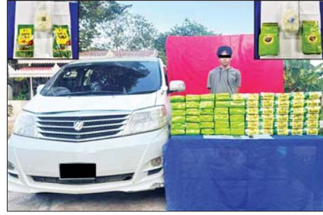
ရှမ်းပြည်နယ်(အရှေ့ပိုင်း) ကျိုင်းတုံမြို့နယ်၌ ငွေကုပ်သိန်း ၄၈၀၀ တန်ဖိုးရှိ အိုက်စ(မက်သ်အဖက်တမင်း) ၆၀ ကီလို ဖမ်းဆီးရမိ

အကြမ်းဖက်အုပ်စုအဖြစ် ကြေညာထားသော CRPH ၊ NUG နှင့် ၎င်းတို့၏ လက်ဝေခံများ၏ လှုံ့ဆော်၊ ဝါဒဖြန့်ခြင်းများအား လိုက်ပါလုပ်ဆောင်ခြင်း၊ အားပေးကူညီခြင်းများ ပြုလုပ်ခဲ့သူများအား ဖော်ထုတ်အရေးယူ နေပြည်တော် ဇန်နဝါရီ ၃ အကြမ်းဖက်အုပ်စုအဖြစ်ကြေညာထားသည့် CRPH ၊ NUG နှင့် ယင်းတို့၏ လက်ဝေခံအဖွဲ့အစည်းများ၊ ယင်းတို့နှင့် ဆက်သွယ်နေသောအဖွဲ့အစည်းများ၊ လူပုဂ္ဂိုလ်များသည် နိုင်ငံတော်တည်ငြိမ်အေးချမ်းရေးကို ပျက်ပြားစေရန်နှင့် အစိုးရယန္တရားများ ပျက်ပြားစေရန် ရည်ရွယ်လျက် လှုံ့ဆော်ခြင်း၊ ဝါဒဖြန့်ခြင်းများ ပြုလုပ်ခဲ့မှုအပေါ် ဥပဒေနှင့်အညီ ထိရောက်စွာ အရေးယူသွားမည်ဖြစ်ကြောင်းနှင့် ထိုသို့ လှုံ့ဆော်သူ၊ ဝါဒဖြန့်သူများအား ဆက်လက်ဖော်ထုတ်အရေးယူသွားမည်ဖြစ်ကြောင်း မိဘပြည်သူများ သိရှိနိုင်ရေး အသိပေးသတင်းထုတ်ပြန်ပြီး ဖြစ်သည်။