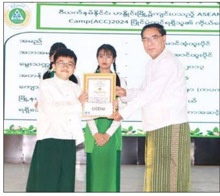
ဒေသ ထွက်ကုန်ပြခန်းများကို ကြောင်း သိရသည်။ လှည့်လည် ကြည့်ရှုအားပေးခဲ့ တိုင်းဒေသကြီး (ပြန်/ဆက်)

တရားသူကြီးချုပ်နှင့် တာဝန်ရှိသူ များက ဗဟိုအဆင့် စာပေ၊ ဂီတ၊ အနုပညာပြိုင်ပွဲများတွင် ဆုရရှိ ခဲ့ကြသူများအား ဆုများ ပေးအပ် ချီးမြှင့်ကြသည်။ (ယာဉ်) ယင်းနောက် တိုင်းဒေသကြီး ဝန်ကြီးချုပ်၊ တရားသူကြီးချုပ်နှင့် တာဝန်ရှိသူများသည် ကျောင်း သား ကျောင်းသူများ၏ ပဲခူးခရိုင်၊ ပညောင်လေးဝင်ခရိုင်၊ တောင်ငူ ခရိုင်၊ ပြည်ခရိုင်၊ နတ်တလင်း ခရိုင်နှင့် သာယာဝတီခရိုင်တို့မှ ဘာသာရပ်အလိုက် လက်တွေ့ သရုပ်ပြသမှု ပညာရေးပြခန်းများ၊