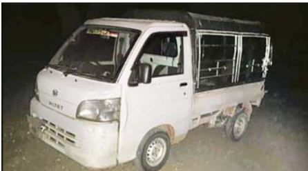
PDF အမည်ခံအကြမ်းဖက်သမားများ ခိုအောင်းနေထိုင်လျက်ရှိသည့် ငါးစွန်မြို့နယ် ကုလားကျေးရွာအတွင်း ဝင်ရောက်ရှင်းလင်းစဉ် ဖော်ထုတ်ဖမ်းဆီးရမိသည့် ၎င်းတို့အသုံးပြုလျက်ရှိသော မော်တော်ယာဉ်များအား တွေ့ရစဉ်။

သမားများနှင့် လက်နက်၊ ခဲယမ်းများကို ယခုကဲ့သို့ အချိန်မီ ဖော်ထုတ် ဖမ်းဆီးနိုင်ခဲ့ခြင်းဖြစ်ကြောင်းနှင့် ဆက်လက်၍လည်း အကြမ်းဖက်အဖွဲ့များ၏ လှုပ်ရှားမှုသတင်းများရရှိပါက နီးစပ်ရာ လုံခြုံရေး တပ်ဖွဲ့ဝင်များထံသို့ လျှို့ဝှက်စွာ သတင်းပေးပို့ခြင်းဖြင့် ရွာတည်ငြိမ်အေးချမ်းအတွက် ပြည်သူ့တစ်ရပ်လုံး ပိုင်းစနစ်ပူးပေါင်းဆောင်ရွက်ကြရန် လိုအပ်မည်ဖြစ်ကြောင်း သတင်းရရှိသည်။