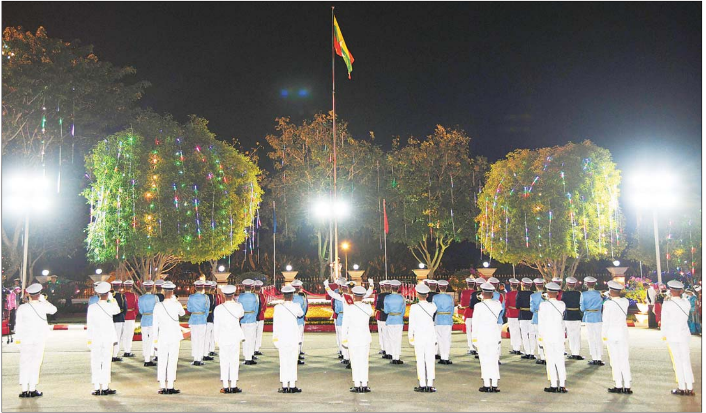
၂၀၂၄ ခုနှစ် (၇၆) နှစ်မြောက် လွတ်လပ်ရေးနေ့ နိုင်ငံတော်အလံတင်အခမ်းအနား ကျင်းပစဉ်။