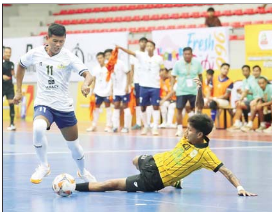
Gold Dream အသင်းနှင့် ရွှေပြည်သာယူနိုက်တက်အသင်း ယှဉ်ပြိုင်နေစဉ်။

အသင်းကို သုံးဂိုး-တစ်ဂိုး၊ Pacific Sun Far အသင်းက 7 Brother အသင်းကို လေးဂိုး-ဂိုးမရှိ၊ 7 Drangon အသင်းက TG United အသင်းကို နှစ်ဂိုး-တစ်ဂိုးဖြင့် အနိုင်ရပြီး YCDC Marga Youth အသင်းနှင့် KKY အသင်းတို့ တစ်ဂိုးစီသာရကျခဲ့သည်။ ပွဲစဉ် (၁) တွင် အနိုင်ရထားသည့် အသင်းများအနက် Pacific Sun Far အသင်းနှင့် JZ Yangon အသင်းတို့သာ စာမျက်နှာ ၁၆ ကော်လံ ၅