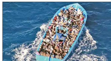
အဓိကလမ်းကြောင်းဖြစ်ပြီး ကရိနှင့်စပိန်တို့သည်လည်း ၎င်းတို့အတွက် သွားရောက်ရာနေရာများ ဖြစ်နေခဲ့သည်။ ဆင်ယွာ

ညွှန်ကြားရေးမှူး ရီဂျီနာ ဒီဒိုမနစ်က ပြောသည်။ ဥရောပတွင် လုံခြုံရာ လာရောက်ရာနေ့သည့်ကလေးများကို ဦးစားပေး အကာအကွယ်ပေးကြ ရန် အစိုးရများကို ၎င်းက တိုက်တွန်းခဲ့သည်။ ၂၀၂၄ ခုနှစ်အတွင်း မြေထဲပင်လယ်နှင့် အနောက်မြောက်ပိုင်း အာဖရိကပင်လယ်ရေကြောင်း လမ်းကြောင်းတွင် သေဆုံး သို့မဟုတ် ပျောက်ဆုံးသွားသည့် လူပေါင်း ၂၂၀၀ ဦး ရှိသည်ဟု ကုလသမဂ္ဂဒုက္ခသည် များဆိုင်ရာ မဟာမင်းကြီးရုံး၏ အစောပိုင်းအချက်အလက်များက ဖော်ပြထားသည်။ ဒီဇင်ဘာ ၂၀ ရက်အထိ ဥရောပသို့ ရောက်ရှိလာသည့် ဒုက္ခသည် ၁၉၃၄၈ ဦး ရှိသည်ဟု ကုလသမဂ္ဂဒုက္ခသည်များဆိုင်ရာ မဟာမင်းကြီးရုံးက သတင်းထုတ်ပြန်သည်။ အီတလီသည် ဒုက္ခသည်များနှင့် ရွှေ့ပြောင်းနေထိုင်သူများအတွက်