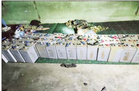
PDF အမည်ခံအကြမ်းဖက်သမားများ ခိုအောင်းနေထိုင်လျက်ရှိသည့် ငါးစွန်မြို့နယ် ကုလားကျေးရွာအတွင်း ဝင်ရောက်ရှင်းလင်းစဉ် ဖော်ထုတ်ဖမ်းဆီးရမိသည့် ဖောက်ခွဲဖျက်ဆီးရေးပစ္စည်းများအား တွေ့ရစဉ်။