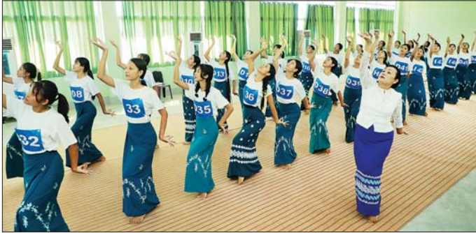
လှပစွာ တင်ဆက်ဖျော်ဖြေနိုင်ရေးအတွက် သဘင်ပညာဌာနမှ ဆရာမများ ကြီးကြပ်၍ ဆောင်ရွက်လျက်ရှိကြောင်း သိရသည်။ (အပေါ်ပုံ) သတင်းစဉ်

ရန်ကုန် နိုဝင်ဘာ ၂၂ ပဉ္စမအကြိမ် အမျိုးသားအားကစားပွဲတော်ကို ဒီဇင်ဘာ ၉ ရက်မှ ၂၀ ရက်အထိ ကျင်းပမည်ဖြစ်ရာ ဖွင့်ပွဲအခမ်းအနား အစီအစဉ်တွင် သာသနာရေးနှင့် ယဉ်ကျေးမှု ဝန်ကြီးဌာနမှ ဖျော်ဖြေတင်ဆက်မည့် “ခေတ် ၆ ခေတ်” ယိမ်းအက အစီအစဉ်၌ အမျိုးသားယဉ်ကျေးမှုနှင့် အနုပညာတက္ကသိုလ် (ရန်ကုန်) မှ တာဝန်ယူဆောင်ရွက်မည့် ကုန်းဘောင်ခေတ်နှင့် အင်းဝခေတ်အကများကို မြန်မာ့ရိုးရာ ယဉ်ကျေးမှုနှင့်အညီ ခမ်းနား