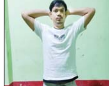
M2 နိကြိုဆိုင်ပိုင်ရှင် တရားမဝင် ဖြတ်မင်းသူ(၃၀) နှစ်

စာရွက်စာတမ်းများ အတုပြုလုပ်ရာတွင် အသုံးပြုသည့်သက်သေခံပစ္စည်းများနှင့်အတူ ဖမ်းဆီးရမိခဲ့သည်။