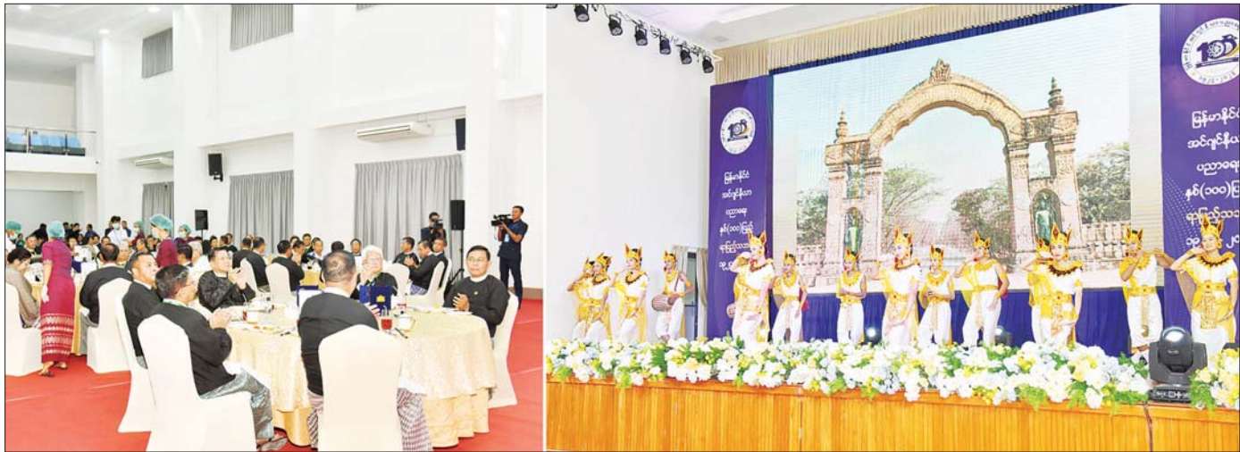
နိုင်ငံတော်စီမံအုပ်ချုပ်ရေးကောင်စီဥက္ကဋ္ဌ နိုင်ငံတော်ဝန်ကြီးချုပ် ဗိုလ်ချုပ်မှူးကြီး မင်းအောင်လှိုင်နှင့် အခမ်းအနားတက်ရောက်လာကြသူများ အနုပညာရှင်များ၏ သီဆိုကပြဖျော်ဖြေတင်ဆက်မှုကို ကြည့်ရှုအားပေးကြစဉ်။

( ၃-၉-၂၀၂၄ ရက်နေ့တွင် နိုင်ငံတော်စီမံအုပ်ချုပ်ရေးကောင်စီဥက္ကဋ္ဌ နိုင်ငံတော်ဝန်ကြီးချုပ် ဗိုလ်ချုပ်မှူးကြီး မင်းအောင်လှိုင် ရှမ်းပြည်နယ်အစိုးရအဖွဲ့ဝင်များ၊ ပြည်နယ်နှင့် ခရိုင်အဆင့်ဌာနဆိုင်ရာတာဝန်ရှိသူများအား ပြောကြားသည့် အမှာစကားမှ ကောက်နုတ်ချက် )