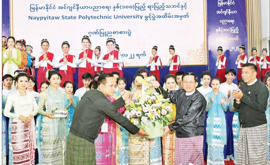
နိုင်ငံတော်စီမံအုပ်ချုပ်ရေးကောင်စီဥက္ကဋ္ဌ နိုင်ငံတော်ဝန်ကြီးချုပ် ဗိုလ်ချုပ်မှူးကြီး မင်းအောင်လှိုင် မြန်မာနိုင်ငံအင်ဂျင်နီယာပညာရေး နှစ်(၁၀၀) ပြည့် ရာပြည့်သဘင်နှင့် Naypyitaw State Polytechnic University ဖွင့်ပွဲအထိမ်းအမှတ် ဂုဏ်ပြုဉာဏစားပွဲအခမ်းအနားတွင် သီဆိုကပြဖျော်ဖြေခဲ့ကြသည့် ကျောင်းသား ကျောင်းသူများနှင့် အနုပညာရှင်များအား ဂုဏ်ပြုပန်းခြင်းပေးအပ်စဉ်။

သား ကျောင်းသူများ၊ သာသနာရေးနှင့် ယဉ်ကျေးမှုဝန်ကြီးဌာန အနုပညာဦးစီးဌာနမှ အနုပညာရှင်များ၊ ပြန်ကြားရေးဝန်ကြီးဌာန မြန်မာ့အသံနှင့်ရုပ်မြင်သံကြားမှ အနုပညာရှင်များနှင့် ပြည်သူ့ဆက်ဆံရေးနှင့် စိတ်ဓာတ်စစ်ဆင်ရေးညွှန်ကြားရေးမှူးရုံး ကွပ်ကဲမှုအောက် မြဝတီတေးဂီတအဖွဲ့မှ အနုပညာရှင်များက တေးသီချင်းများ သရုပ်ဖော်အကများ တိုင်းရင်းသားယဉ်ကျေးမှု အကအလှများဖြင့် သီဆိုကပြဖျော်ဖြေကြသည်။ ရင်းရင်းနှီးနှီးနှုတ်ဆက်ထိုအခန်းက နိုင်ငံတော်စီမံအုပ်ချုပ်ရေးကောင်စီဥက္ကဋ္ဌ နိုင်ငံတော်ဝန်ကြီးချုပ်က သီဆိုကပြဖျော်ဖြေခဲ့ကြသည့် ကျောင်းသားကျောင်းသူများနှင့် အနုပညာရှင်များအား ဂုဏ်ပြုပန်းခြင်းနှင့် ပေးအပ်ပြီး ရင်းရင်းနှီးနှီး နှုတ်ဆက်ခဲ့ကြောင်း သတင်းရရှိသည်။ သတင်းစဉ်