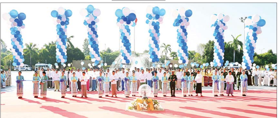
ပြည်ထောင်စုဝန်ကြီး ပါမောက္ခ ဒေါက်တာ သက်ခိုင်ဝင်း၊ ဒုတိယဝန်ကြီး ပါမောက္ခ ဒေါက်တာအေးထွန်း၊ နေပြည်တော်ကောင်စီဝင် ဗိုလ်မှူးကြီး ရဲမိုး၊ တိုင်းရင်းဆေးပညာ ဦးစီးဌာန ညွှန်ကြားရေးမှူးချုပ် ဒေါက်တာ စုစုဒွေး၊ မြန်မာနိုင်ငံ တိုင်းရင်းဆေးကောင်စီဥက္ကဋ္ဌ ဦးမြင့်ဦး၊ တိုင်းရင်းဆေးပညာရပ်ဆိုင်ရာ အကြံပေးအဖွဲ့ဥက္ကဋ္ဌ ပါမောက္ခ ဒေါက်တာ ဦးမိတ်နှင့် မြန်မာနိုင်ငံ တိုင်းရင်းဆေးဆရာအသင်းဗဟိုဥက္ကဋ္ဌ ဦးသိန်းဝင်းတို့ (၂၃) ကြိမ်မြောက် မြန်မာ့တိုင်းရင်းဆေးပညာသင်တန်းတော်များညီလာခံနှင့် မြန်မာ့ တိုင်းရင်းဆေးပညာ နှီးနှောဖလှယ်ပွဲ ဖွင့်ပွဲအခမ်းအနားကို ဖဲကြိုးဖြတ်ဖွင့်လှစ်ပေးစဉ်။

အခမ်းအနားသို့ (၂၃) ကြိမ်မြောက် မြန်မာ့တိုင်းရင်းဆေး ပညာသင်တန်းတော်များ ညီလာခံနှင့် မြန်မာ့တိုင်းရင်းဆေးပညာ နှီးနှောဖလှယ်ပွဲ ကျင်းပရေးဦးစီးကော်မတီ နာယက နိုင်ငံတော်စီမံအုပ်ချုပ်ရေး ကောင်စီ ဒုတိယဥက္ကဋ္ဌ ဒုတိယဝန်ကြီးချုပ် ဒုတိယ ဗိုလ်ချုပ်မှူးကြီး စိုးဝင်းနှင့်အတူ နိုင်ငံတော်စီမံအုပ်ချုပ်ရေး ကောင်စီဝင် များ၊ ပြည်ထောင်စုဝန်ကြီးများ၊ ဒုတိယ ဝန်ကြီးများ၊ တပ်မတော်မှအရာရှိကြီးများ၊ နေပြည်တော်ကောင်စီဝင်များ၊ ဌာန ဆိုင်ရာအကြီးအကဲများ၊ မြန်မာနိုင်ငံဆိုင်ရာ နိုင်ငံခြားသံရုံးများမှ သံအမတ်ကြီးများ နှင့် သံရုံးတာဝန်ခံများ မြန်မာနိုင်ငံ ဆေးကောင်စီဥက္ကဋ္ဌ တိုင်းရင်းဆေးပညာရပ် ဆိုင်ရာအကြံပေးအဖွဲ့ဝင်များ၊ ကုလသမဂ္ဂ လက်အောက်ခံအဖွဲ့အစည်းများမှ ဌာန ကိုယ်စားလှယ်များ၊ အစိုးရမဟုတ်သော အသင်း/အဖွဲ့များ၊ တိုင်းရင်းဆေးကောင်စီ ဝင်များ၊ မြန်မာနိုင်ငံ တိုင်းရင်းဆေးဆရာ အသင်းကြီးနှင့် မြန်မာနိုင်ငံအနှံ့အပြားမှ