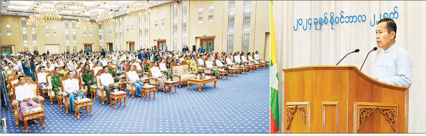
နိုင်ငံတော်စီမံအုပ်ချုပ်ရေးကောင်စီ ဒုတိယဥက္ကဋ္ဌ ဒုတိယဝန်ကြီးချုပ် ဒုတိယဗိုလ်ချုပ်မှူးကြီး စိုးဝင်း (၂၃) ကြိမ်မြောက် မြန်မာ့တိုင်းရင်းဆေးသမားတော်များညီလာခံနှင့် မြန်မာ့တိုင်းရင်းဆေးပညာနိုးနှောဖလှယ်ပွဲ ဖွင့်ပွဲအခမ်းအနားတွင် အမှာစကားပြောကြားစဉ်။

နေပြည်တော် နိုဝင်ဘာ ၂၂ (၂၃) ကြိမ်မြောက် မြန်မာ့တိုင်းရင်းဆေးသမားတော်များညီလာခံနှင့် မြန်မာ့တိုင်းရင်းဆေးပညာနိုးနှောဖလှယ်ပွဲ ဖွင့်ပွဲအခမ်းအနားကို ယနေ့နံနက်ပိုင်းတွင် နေပြည်တော်ရှိ မြန်မာအပြည်ပြည်ဆိုင်ရာ ကွန်ဗင်းရှင်းဗဟိုဌာန(၂)၌ ကျင်းပသည်။