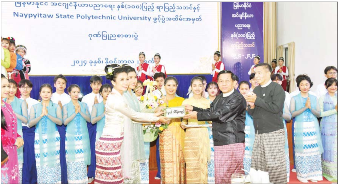
နိုင်ငံတော်စီမံအုပ်ချုပ်ရေးကောင်စီဥက္ကဋ္ဌ နိုင်ငံတော်ဝန်ကြီးချုပ် ဗိုလ်ချုပ်မှူးကြီး မင်းအောင်လှိုင် မြန်မာနိုင်ငံ အင်ဂျင်နီယာပညာရေး နှစ် (၁၀၀) ပြည့် ရာပြည့်သဘင်နှင့် Naypyitaw State Polytechnic University ဖွင့်ပွဲအထိမ်းအမှတ် ဂုဏ်ပြုညစာစားပွဲ အခမ်းအနားတွင် သီဆိုကပြဖော်ပြခြင်းဖြင့် ကျောင်းသား ကျောင်းသူများနှင့် အနုပညာရှင်များအား ဂုဏ်ပြုဆုများ ပေးအပ်စဉ်။

နေပြည်တော် နိုဝင်ဘာ ၂၂ မြန်မာနိုင်ငံ အင်ဂျင်နီယာပညာရေး နှစ်(၁၀၀) ပြည့် ရာပြည့်သဘင်နှင့် Naypyitaw State Polytechnic University ဖွင့်ပွဲအထိမ်းအမှတ် ဂုဏ်ပြုညစာစားပွဲအခမ်းအနားကို ယနေ့ညနေပိုင်းတွင် အဆိုပါတက္ကသိုလ်၌ ကျင်းပပြုလုပ်ရာ နိုင်ငံတော်စီမံအုပ်ချုပ်ရေးကောင်စီဥက္ကဋ္ဌ နိုင်ငံတော်ဝန်ကြီးချုပ် ဗိုလ်ချုပ်မှူးကြီး မင်းအောင်လှိုင် တက်ရောက်ချီးမြှင့်သည်။ အခမ်းအနားသို့ ကောင်စီတွဲဖက်အတွင်းရေးမှူး ဗိုလ်ချုပ်ကြီး ရဲဝင်းဦး၊ ကောင်စီအဖွဲ့ဝင်များ၊ ပြည်ထောင်စုဝန်ကြီးများနှင့် ပြည်ထောင်စုအဆင့်ပုဂ္ဂိုလ်များ၊ နေပြည်တော်ကောင်စီ ဥက္ကဋ္ဌ၊ ကာကွယ်ရေးဦးစီးချုပ်ရုံးမှ အဆင့်မြင့် တပ်မတော်အရာရှိကြီးများ၊ နေပြည်တော်တိုင်း စစ်ဌာနချုပ်တိုင်းမှူး၊ ဒုတိယဝန်ကြီးများ၊ တက္ကသိုလ်အသီးသီးမှ ပါမောက္ခချုပ်၊ ဒုတိယပါမောက္ခချုပ်များ စာမျက်နှာ ၃ ကော်လံ ၁ ၀