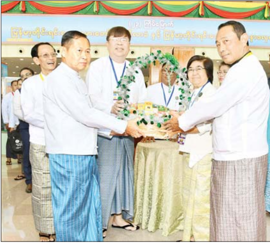
နိုင်ငံတော်စီမံအုပ်ချုပ်ရေးကောင်စီ ဒုတိယဥက္ကဋ္ဌ ဒုတိယဝန်ကြီးချုပ် ဒုတိယဗိုလ်ချုပ်မှူးကြီး စိုးဝင်းထံ မြန်မာနိုင်ငံ တိုင်းရင်းဆေးဝါးထုတ်လုပ်သူများနှင့် ဆေးပစ္စည်းလုပ်ငန်းရှင်အသင်းဥက္ကဋ္ဌနှင့် အဖွဲ့ဝင်များက တိုင်းရင်းဆေးခြင်းအား ဂါရဝပြုပေးအပ်စဉ်။

နိုင်ငံတော်က တိုင်းရင်းဆေးပညာကဏ္ဍကို မြှင့်တင်ပေးလျက်ရှိ နိုင်ငံတော်က တိုင်းရင်းဆေးပညာကဏ္ဍကို မြှင့်တင်ပေးလျက်ရှိကြောင်း၊ ၁၉၈၉ ခုနှစ်၊ ဩဂုတ်လ ၃ ရက်နေ့တွင် တိုင်းရင်းဆေးပညာ ဦးစီးဌာနအဖြစ် သီးခြားဖွဲ့စည်းတိုးမြှင့်ပေးသည့်အတွက် တိုင်းရင်းဆေးပညာ ဖွံ့ဖြိုးတိုးတက်ရေးလုပ်ငန်းများတွင် ပိုမိုလှုပ်မြန်လာခဲ့ကြောင်း၊ ၂၀၁၀ ခုနှစ်က မန္တလေးမြို့တွင် တိုင်းရင်းဆေးတက္ကသိုလ် ဖွင့်လှစ်ခဲ့ပြီး မျိုးဆက်သစ်များကို မြန်မာ့တိုင်းရင်းဆေးပညာဘွဲ့၊ မြန်မာ့တိုင်းရင်းဆေးပညာမဟာဘွဲ့များ အပ်နှင်းနိုင်ခဲ့ကြောင်း၊