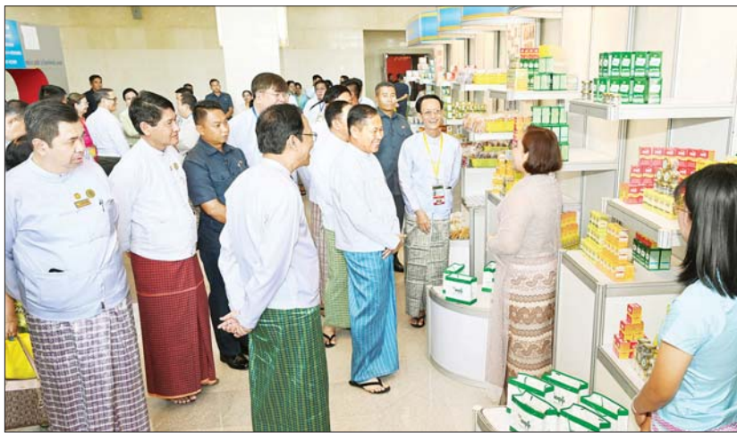
နိုင်ငံတော်စီမံအုပ်ချုပ်ရေးကောင်စီ ဒုတိယဥက္ကဋ္ဌ ဒုတိယဝန်ကြီးချုပ် ဒုတိယဗိုလ်ချုပ်မှူးကြီး စိုးဝင်း တာဝန်ရှိသူများနှင့်အတူ တိုင်းရင်းဆေးပညာဦးစီးဌာန ပြခန်းနှင့် ခင်းကျင်းပြသထားသည့် ဆေးဝါးပြခန်းများကို ကြည့်ရှုအေးပေးစဉ်။

တိုင်းရင်းဆေးသမားတော်ကိုယ်စားလှယ် များ၊ တိုင်းရင်းဆေးပညာရပ်ဆိုင်ရာ အကြံပေးအဖွဲ့ဝင်များ၊ မြန်မာနိုင်ငံ တိုင်းရင်းဆေးဝါး ထုတ်လုပ်သူများ၊ ဆေးပစ္စည်းလုပ်ငန်းရှင်များ၊ တိုင်းရင်း ဆေးရုံများ၊ တိုင်းရင်းဆေးတာဝန်ရှိသူများ များမှ ဆရာ၊ ဆရာမများနှင့် ကျောင်းသား၊ ကျောင်းသူများ တက်ရောက်ကြသည်။ ဦးစွာ (၂၃) ကြိမ်မြောက် မြန်မာ့ တိုင်းရင်းဆေးသမားတော်များ ညီလာခံ