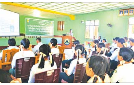
နိုင်ငံတစ်ဝန်း စိမ်းလန်းဖို၊ သစ်ပင်စိုက်ပျိုး ထိန်းသိမ်းစို့

မော်လမြိုင် နိုဝင်ဘာ ၂၂ မော်လမြိုင်မြို့နယ် သစ်တောဦးစီးဌာနနှင့် အခြေခံပညာဦးစီးဌာနတို့ ပူးပေါင်း၍ မီးခိုးမြူငွေ့လျှော့ချရေးနှင့် သဘာဝဘေးအန္တရာယ်ကြိုတင်ကာကွယ်ရေးနှင့် လျော့နည်းစေရေးအသိပညာပေး ဟောပြောပွဲကို အမှတ် (၁) အခြေခံပညာအထက်တန်းကျောင်း၌ နိုဝင်ဘာ ၂၀ ရက်က ကျင်းပသည်။ ဟောပြောပွဲသို့ အမှတ်(၁) အခြေခံပညာအထက်တန်းကျောင်းမှ ကျောင်းအုပ်ကြီးနှင့်တာဝန်ရှိသူ ဆရာ ဆရာမများ၊ ကျောင်းသားကျောင်းသူများ၊ သစ်တောဦးစီးဌာနမှ တာဝန်ရှိသူများ စုစုပေါင်း ၁၅၀ တက်ရောက်ခဲ့ကြပြီး အဆိုပါဟောပြောပွဲတွင် မြို့နယ်သစ်တောဦးစီးဌာန ဦးစီးအရာရှိ ဦးအောင်စိန်က ရာသီဥတုပြောင်းလဲခြင်းကြောင့် သဘာဝဘေးအန္တရာယ်များ ဖြစ်ပေါ်လာခြင်း၊ လျော့ချရမည့် နည်းလမ်းများ၊ ရာသီဥတုကောင်းမွန်လာစေခြင်း၊ မြန်မာနိုင်ငံ ဒီမိုကရေစီများ၊ ဒီမိုကရေစီနှင့် ကမ်းရိုးတန်းဂေဟစနစ်ဝန်ဆောင်မှုများကိုလည်း ကောင်း၊ တောအုပ်ကြီး ဦးအောင်စိန်လက်က မီးခိုးမြူငွေ့ ဖြစ်ပေါ်လာသည့်အချက်များနှင့် ဆိုးကျိုးများ၊ ကာကွယ်နိုင်သည့် နည်းလမ်းများနှင့် Fire Hotspot များ၏ အကြောင်းရင်းများကို ဟောပြောခဲ့ကြပြီး တက်ရောက်လာသူများက သိရှိလိုသည့် မေးမြန်းချက်များအပေါ် ပြန်လည်ဖြေကြားဆောင်ရွက်ခဲ့ကြောင်း သိရသည်။