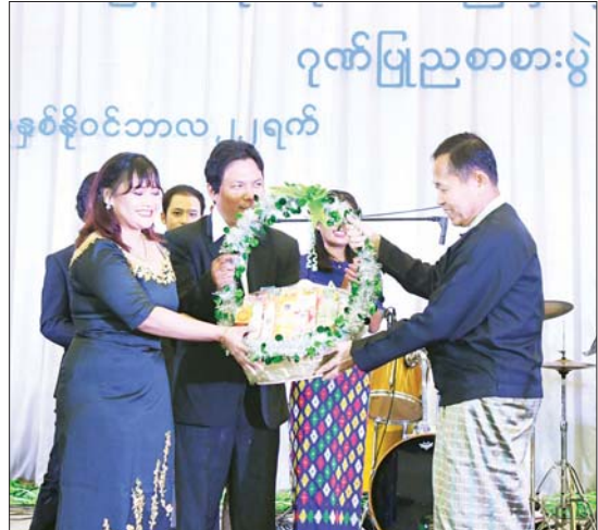
နိုင်ငံတော်စီမံအုပ်ချုပ်ရေးကောင်စီ ဒုတိယဥက္ကဋ္ဌ ဒုတိယဝန်ကြီးချုပ် ဒုတိယဗိုလ်ချုပ်မှူးကြီး စိုးဝင်း သီဆိုဖျော်ဖြေကြသည့် အနုပညာရှင်များအား ဂုဏ်ပြုပေးခြင်း ပေးအပ်စဉ်။

အားပေးဆောင်ရွက်လျက်ရှိကြောင်း။ နိုင်ငံတော်အစိုးရက တိုင်းရင်းဆေးအခန်းကဏ္ဍကို အလေးအနက်ထားပြီး အားပေးချီးမြှောက်ပေးလျက်ရှိနေသလို တိုင်းရင်းဆေးပညာရှင်များကလည်း ကြိုးစားအားထုတ်နေသည်ကို တွေ့ရသည့်အတွက် ဝမ်းမြောက်မိကြောင်း၊ ထိုသို့ ကြိုးစားအားထုတ်ကြရာတွင် ကျင့်ဝတ်နှင့်အညီ စည်းကမ်းတကျ ဖြစ်စေရန် တိုင်းရင်းဆေးကောင်စီဥပဒေ၊ တိုင်းရင်းဆေးဝါး ဥပဒေများနှင့်အညီ စနစ်တကျ ဆောင်ရွက်ကြရန် မှာကြားလိုကြောင်း။ ၂၀၂၅ ခုနှစ် ပညာသင်နှစ်ကစတင်ပြီး ပါရဂူသင်တန်းများကို ဖွင့်လှစ်နိုင်တော့မည့် ယခုအခါတွင် တိုင်းရင်းဆေးတက္ကသိုလ်က မြန်မာ့တိုင်းရင်းဆေးပညာရှင်များကို ဒီပလိုမာအဆင့်၊ ဘွဲ့ရအဆင့်၊ အထိလေ့ကျင့်မွေးထုတ်ပေးနေပြီဖြစ်သလို နိုင်ငံတော်အစိုးရ၏ ချီးမြှောက်ပံ့ပိုးမှုနှင့် မြန်မာ့တိုင်းရင်းဆေးပညာ ပါရဂူဘွဲ့အထိ ပေးအပ်နိုင်ရန်အတွက် ၂၀၂၅ ခုနှစ် ပညာသင်နှစ်ကစတင်ပြီး ပါရဂူသင်တန်းများကို ဖွင့်လှစ်နိုင်တော့မည်ဖြစ်ကြောင်း။ တိုင်းရင်းဆေးညီလာခံကြီး ကျင်းပခြင်းသည် အမျိုးသားယဉ်ကျေးမှုအမွေအနှစ်ဖြစ်သည့် မြန်မာ့တိုင်းရင်းဆေးပညာ