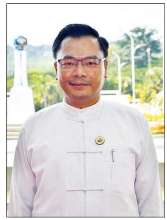
ဒုတိယဝန်ကြီး ဒေါက်တာအောင်ဇေယျ

ဖြေ ။ ။ ရာပြည့်အခမ်းအနားနဲ့အတူ တက္ကသိုလ်စတင်ဖွင့်လှစ်နိုင်ခဲ့မှုက ထူးခြားမှု