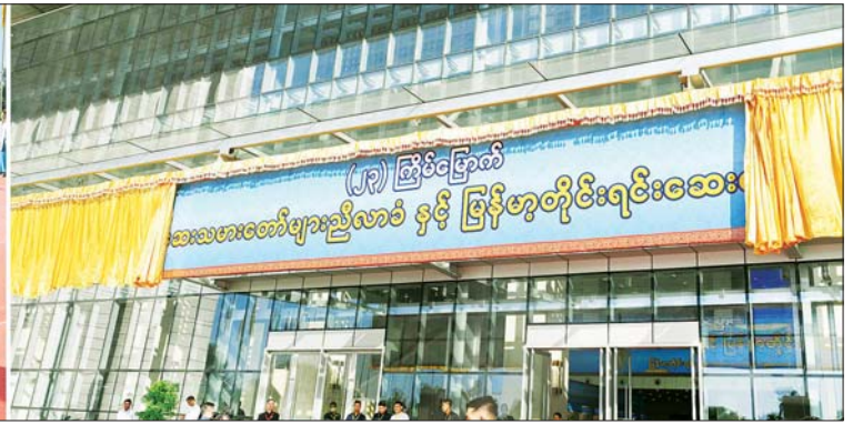
နိုင်ငံတော်စီမံအုပ်ချုပ်ရေးကောင်စီ ဒုတိယဥက္ကဋ္ဌ ဒုတိယဝန်ကြီးချုပ် ဒုတိယဗိုလ်ချုပ်မှူးကြီး စိုးဝင်း (၂၃)ကြိမ်မြောက် မြန်မာ့တိုင်းရင်းဆေးပညာသင်တန်းတော်များညီလာခံနှင့် မြန်မာ့တိုင်းရင်းဆေးပညာ နှီးနှောဖလှယ်ပွဲ အခမ်းအနားကို စက်ခလုတ်နှိပ်ဖွင့်လှစ်စဉ်။