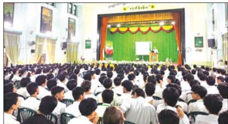
လက်ရှိ လုပ်ငန်းဆောင်ရွက်နေမှု ပတ်သက်သည့် အသိပညာပေး အခြေအနေများ အစရှိသည်များ ဗီဒီယိုကလစ်ကို ကျောင်းသား ကို အသိပညာပေး ဟောပြော ကျောင်းသူများအား ပြသခြင်းတို့ ဆောင်ရွက်ခဲ့ကြောင်း သိရသည်။ အောင်မြင်(ပြန်/ဆက်)

ညစ်ညမ်းမှုတွင် ပါဝင်သော လေထုညစ်ညမ်းစေသော အရာ များ၊ မီးခိုးမြူငွေဖြစ်ပေါ်စေသော အဓိက အကြောင်းရင်းများ၊ မီးခိုးမြူငွေ ညစ်ညမ်းမှု၏ ဆိုးကျိုး သက်ရောက်မှုများ၊ လူသားတို့တွင် ဖြစ်ပေါ်စေနိုင် သောရောဂါများ၊ ကြိုတင် ကာကွယ်ရမည့်နည်းလမ်း၊ မြန်မာ နိုင်ငံ မီးခိုးမြူငွေညစ်ညမ်းမှု ဆိုင်ရာအခြေအနေ၊ ရန်ကုန်တိုင်း ဒေသကြီး မီးခိုးမြူငွေညစ်ညမ်းမှု ဆိုင်ရာ အခြေအနေ၊ မီးခိုးမြူငွေ ညစ်ညမ်းမှု လျှော့ချရေးအတွက်