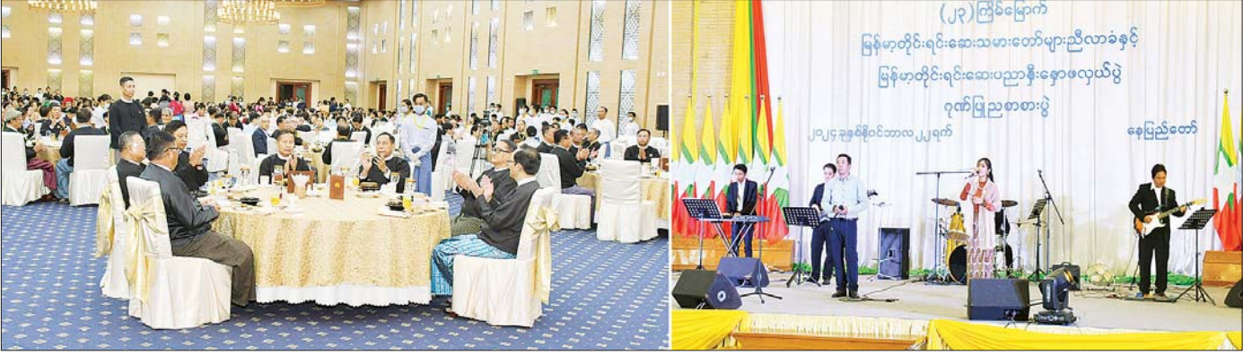
နိုင်ငံတော်စီမံအုပ်ချုပ်ရေးကောင်စီ ဒုတိယဥက္ကဋ္ဌ ဒုတိယဝန်ကြီးချုပ် ဒုတိယဗိုလ်ချုပ်မှူးကြီး စိုးဝင်း (၂၃)ကြိမ်မြောက် မြန်မာ့တိုင်းရင်းဆေးသမားတော်များညီလာခံနှင့် မြန်မာ့တိုင်းရင်းဆေးပညာနှီးနှောဖလှယ်ပွဲ ဂုဏ်ပြုညစားပွဲ အနုပညာရှင်များက တေးသံသဘာများဖြင့် သီဆိုဖျော်ဖြေနေမှုကို ကြည့်ရှုအားပေးစဉ်။