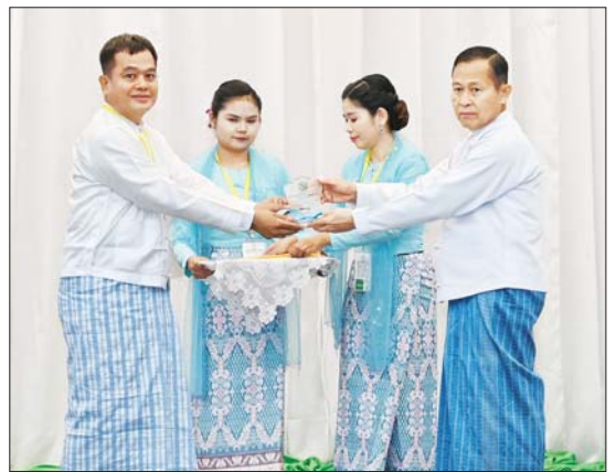
နိုင်ငံတော်စီမံအုပ်ချုပ်ရေးကောင်စီ ဒုတိယဥက္ကဋ္ဌ ဒုတိယဝန်ကြီးချုပ် ဒုတိယဗိုလ်ချုပ်မှူးကြီး စိုးဝင်း ပထမဆရာရှိသည့် ခုတင် ၅၀ ဆုံ တိုင်းရင်းဆေးရုံ (ပဲခူး)ကို လုပ်ငန်းစွမ်းဆောင်ရည်ဆု ပေးအပ်ချီးမြှင့်စဉ်။

ဥက္ကဋ္ဌ ဦးမြင့်ဦး၊ တိုင်းရင်းဆေးပညာရပ် ဆိုင်ရာ အကြံပေးအဖွဲ့ဥက္ကဋ္ဌ ပါမောက္ခ ဒေါက်တာ ဦးမိတ်နှင့် မြန်မာနိုင်ငံ တိုင်းရင်းဆေးဆရာအသင်း ဗဟိုဥက္ကဋ္ဌ ဦးသိန်းဝင်းတို့က ဖဲကြိုးဖြတ်ဖွင့်လှစ်ပေး ကြသည်။ စက်ခလုတ်နှိပ်ဖွင့်လှစ် ထို့နောက် ကျင်းပရေးဦးစီးကော်မတီ နာယက နိုင်ငံတော်စီမံအုပ်ချုပ်ရေး ကောင်စီ ဒုတိယဥက္ကဋ္ဌ ဒုတိယဝန်ကြီးချုပ်