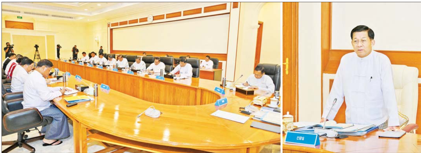
နိုင်ငံတော်စီမံအုပ်ချုပ်ရေးကောင်စီဥက္ကဋ္ဌ နိုင်ငံတော်ဝန်ကြီးချုပ် ဗိုလ်ချုပ်မှူးကြီး မင်းအောင်လှိုင် နိုင်ငံတော်စီမံအုပ်ချုပ်ရေးကောင်စီအစည်းအဝေးတွင် အမှာစကားပြောကြားစဉ်။

နိုင်ငံတော်စီမံအုပ်ချုပ်ရေးကောင်စီဥက္ကဋ္ဌ နိုင်ငံတော်ဝန်ကြီးချုပ် ဗိုလ်ချုပ်မှူးကြီး မင်းအောင်လှိုင် နိုင်ငံတော်စီမံအုပ်ချုပ်ရေးကောင်စီအစည်းအဝေးသို့ တက်ရောက်အမှာစကားပြောကြား လာမည့်ရွေးကောက်ပွဲတွင် မဲစာရင်းများယွင်းမှုမရှိစေရေး၊ မဲစာရင်းများမှန်ကန်မှုရှိစေရေး အဓိကဆောင်ရွက် ကောင်စီဝင်များအနေဖြင့် မဲစာရင်းများ မှန်ကန်မှုရှိစေရေး တာဝန်ခွဲဝေ၍ ဆောင်ရွက်ရမည်