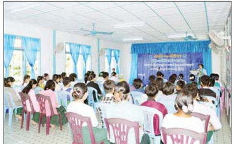
ခရိုင်(ပြန်/ဆက်)

များ၊ ဟောပြောဆွေးနွေးပြီး ကျပန်းစကားပြောပြိုင်ပွဲကို ကျင်းပရာ တောင်ငူမြို့နယ်အတွင်းရှိ အမှတ်(၇) အခြေခံပညာအထက်တန်း ကျောင်းနှင့် စီးပင်သာအခြေခံပညာအထက်တန်းကျောင်း(၃) တို့မှ အထက်တန်းအဆင့် ကျောင်းသား ကျောင်းသူများက ဝင်ရောက် ယှဉ်ပြိုင်ကြသည်။ ထို့နောက် ပြိုင်ပွဲတွင် ဆုရရှိသူများအား တာဝန်ရှိသူများက ဆုများ ပေးအပ်ချီးမြှင့်ခဲ့ကြောင်း သိရသည်။