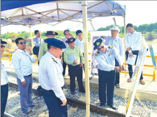
မြန်မာပြည် ဦးစိုင်းသော်လင်းကလည်းကောင်း၊ စမ့်မြစ်ကူးမီးရထားတံတား၊ မြစ်ကွေးဖြတ်တူးမြောင်း ဖောက်လုပ်

မန္တလေး နိုဝင်ဘာ ၁၉ ရန်ကုန်-မန္တလေး ရထားလမ်းပိုင်း၊ စမ့်မြစ်ကူးမီးရထား တံတားအမှတ် ၆၉၁ မှ ရေတိုက်စားခံရသည့် ကမ်းခိုနေရာများ ပြုပြင်ဆောင်ရွက်လျက်ရှိသည့် လုပ်ငန်းများကို နိုဝင်ဘာ ၁၉ ရက်က မန္တလေးတိုင်းဒေသကြီး လမ်းပန်းဆက်သွယ်ရေးဝန်ကြီး ဦးအောင်ဇော်ဦးနှင့် တာဝန်ရှိသူများသည် သွားရောက်ကြည့်ရှုစစ်ဆေးသည်။