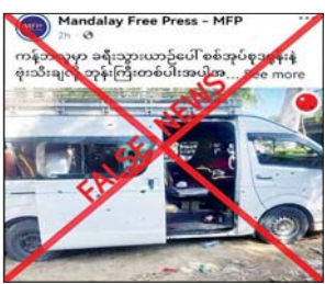
ကြီး ကသာမြို့မှ မန္တလေးမြို့သို့ မောင်းနှင်ထွက်ခွာလာစဉ် ကန်ဘလူမြို့နယ် ပေကြီးကျေးရွာအနီးအရောက် PDF အမည်ခံ အကြမ်းဖက်အဖွဲ့က ဒရုန်းအသုံးပြု၍ Drop Bomb များဖြင့် ပစ်ချတိုက်ခိုက်ခဲ့ရာ မော်တော်ယာဉ်အနီးသို့ Drop Bomb တစ်လုံးကျရောက်

နေပြည်တော် နိုဝင်ဘာ ၁၉ စစ်ကိုင်းတိုင်းဒေသကြီး ကန်ဘလူမြို့နယ် ရွှေဘို-မြစ်ကြီးနား ကားလမ်းခရီးသွားယာဉ်ပေါ် လုံခြုံရေးတပ်ဖွဲ့ဝင်များက ဒရုန်းဖြင့် ပစ်ခတ်၍ ဘုန်းကြီးတစ်ပါး အပါအဝင် ပြည်သူလေးဦး သေဆုံးသည်ဟု တရားမဝင် ပြည်ပျက်မီဒီယာများက သတင်းအမှားများ မဟုတ်မမှန် ရေးသားဖြန့်ဝေလျက် ရှိကြောင်း တွေ့ရှိရသည်။