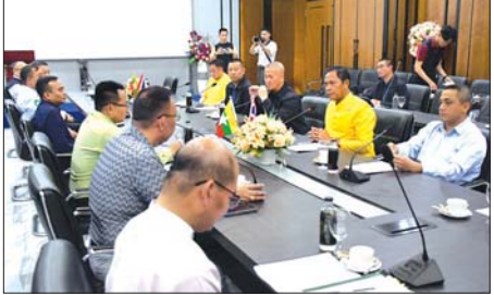
အတွက် နှစ်နိုင်ငံ ပူးပေါင်းကာ မယ်ဆိုင်ချောင်းအတွင်း ဆားပေးတိုင်းတာခြင်း၊ အမှတ်(၁) ချစ်ကြည်တံတားအနီး မြန်မာနိုင်ငံဘက်တွင် ရေထိန်းနံရံပြုလုပ်မည့်ကိစ္စနှင့် ယခုနှစ် မိုးရာသီကာလအတွင်း ရေကြီး ရေလျှံမှုများကြောင့် မယ်ဆိုင်ချောင်းနှင့် မယ်ဟောက်ချောင်းအတွင်း တင်ကျန်ရစ်သောနန်းများ ဆယ်ယူတူးဖော်ခြင်းလုပ်ငန်းကို နှစ်နိုင်ငံ ပူးပေါင်း၍ နိုဝင်ဘာ ၁၉ ရက်မှ ၂၃ ရက်အထိ ငါးရက်အကြာ ဆောင်ရွက်သွားမည့်ကိစ္စတို့နှင့်