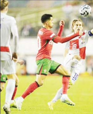
ခရီးအေးရှား အသင်းသည်