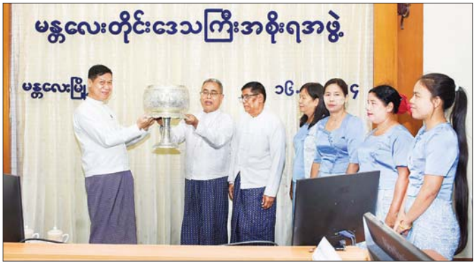
အမရရွှေပြည်ရက်ကန်းအဖွဲ့မှ အသင်းအုပ်ချုပ်သူ အမရရွှေပြည် ရက်ကန်းအဖွဲ့ကို ဂုဏ်ပြုငွေကျပုများက ပထမဆုရရှိခဲ့သည့် ဆုပေးလားအား ပေးအပ်သည့်အခမ်းအနားတွင် တိုင်းဒေသကြီးဝန်ကြီးချုပ်က သတင်းစဉ်

ဝမ်းမြောက်မိပါကြောင်း၊ ကြိုတင်ပြင်ဆင်ကြိုးစားခဲ့မှု၊ အသင်းအဖွဲ့စိတ်ဓာတ်အပြည့်ဖြင့် ဟန်ချက်ညီလုပ်ဆောင်ခဲ့မှု၊ ပြိုင်ပွဲစည်းကမ်းများနှင့်အညီ ယှဉ်ပြိုင်ရက်လုပ်ခဲ့မှုတို့ကြောင့် အောင်မြင်မှုပန်းတိုင်ကို စိုက်ထူနိုင်ခဲ့ပါကြောင်း၊ နောင်ပြိုင်ပွဲများတွင်လည်း တိုင်းဒေသကြီးဂုဏ်ကို ဆက်လက်ဆောင်နိုင်အောင်၊ ရိုးရာအမွေအနှစ် မတစ်ကောမပျောက်ပျက်သွားအောင် မျိုးဆက်သစ်လူငယ်များအား ပညာအမွေများ လက်ဆင့်ကမ်းလှမ်းရင်း စဉ်ဆက်မပြတ်ကြိုးစားလုပ်ဆောင်နေကြရမည်ဖြစ်ပါကြောင်း ပြောကြားသည်။ ပြိုင်ပွဲအတွေ့အကြုံများတင်ပြ ယင်းနောက် တိုင်းဒေသကြီးဝန်ကြီးများက ဂုဏ်ပြုစကားများပြောကြားပြီး အသင်းအုပ်ချုပ်သူများက ပြိုင်ပွဲအတွေ့အကြုံများနှင့် ပတ်သက်၍ ရှင်းလင်းတင်ပြကြသည်။ ဆက်လက်၍ တိုင်းဒေသကြီးဝန်ကြီးချုပ်ထံ