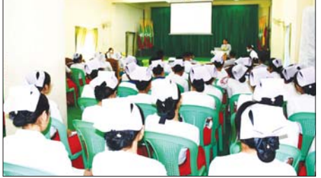
မုံရွာမြို့၌ မီးခိုး မြူငွေညစ်ညမ်းထိန်းချုပ်ရေးနှင့် ပတ်ဝန်းကျင်ထိန်းသိမ်းရေးဆိုင်ရာ အသိပညာပေး

စံပြုကျေးရွာရှိ အဆိုပါ ကျေးရွာတွင်း ကွန်ကရစ်လမ်း သည် အရှည်ပေ ၆၂၀၊ အကျယ် ရှစ်ပေ၊ ၃ ခြောက်လက်မရှိပြီး ကျေးရွာ ဖွံ့ဖြိုးတိုးတက်ရေး လုပ်ငန်းစီမံကိန်း ပံ့ပိုးရန်ပုံငွေကျပ် သိန်း ၁၅၀၊ ပြည်သူထည့်ဝင်ငွေ ကျပ်သိန်း ၃၀ စုစုပေါင်းရန်ပုံငွေ ကျပ်သိန်း ၁၈၀ ကို အသုံးပြုကာ ဦးစီးဌာနဝန်ထမ်းများ၏ နည်း ပညာပံ့ပိုးမှု၊ ကြီးကြပ်မှုတို့ဖြင့် ကျေးရွာသူ ကျေးရွာသားများ ကိုယ်တိုင် အောက်တိုဘာစတုတ္ထ အပတ်မှ စတင်အကောင်အထည် ဖော်ဆောင်ခဲ့ရာ ယခုအခါ လုပ်ငန်းများအားလုံး၏ ၉၀ ရာခိုင်နှုန်းခန့် ဆောင်ရွက်ပြီးစီးပြီ ဖြစ်ကြောင်း သိရသည်။