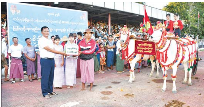
တပ်ကုန်းမြို့နယ် မြန်မာ့ရိုးရာလှည်းယဉ်ကြော့၊ နွားလှည်းနှင့် နွားအလှပြိုင်ပွဲ ဆုချီးမြှင့်ပွဲကျင်းပစဉ်။

မြို့ မြို့နယ်ပြည်သူ့အားကစားအလားတူ ရန်ကုန်တိုင်းကွင်း၌ ကျင်းပရာ လာရောက်ဒေသကြီးအစိုးရအဖွဲ့က စီစဉ်ကြည့်ရှုသူများဖြင့် စည်ကားလျက်ရှိသည်။ စည်ကားသိုက်မြိုက်စွာကျင်းပထို့အတူ ပဲခူးတိုင်းဒေသကြီးအစိုးရအဖွဲ့ကကြီးမှူးပြီး မြန်မာ့ရိုးရာ တန်ဆောင်တိုင်မီးထွန်းပွဲတော် မီးပုံးပျံလွှတ်တင်ပူဇော်ပွဲနှင့် MSME ဈေးရောင်းပွဲတော်ကို ယမန်နေ့ညပိုင်းက ပဲခူးမြို့ ဆုတောင်းပြည့် ရွှေမော်မောစေတီတော်မြတ်ကြီး ဘုရားလမ်းနှင့် ယာဉ်ရပ်နားကွင်းတို့တွင် စည်ကားသိုက်မြိုက်စွာ ကျင်းပပြုလုပ်ခဲ့ရာ လာရောက်လည်ပတ်ကြည့်ရှုသူများဖြင့် အထူးစည်ကားကြောင်း သတင်းရရှိသည်။ သတင်းစဉ်