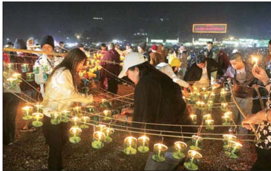
တောင်ကြီးမြို့၌ ကျင်းပသည့် တန်ဆောင်တိုင်မီးထွန်းပွဲ။

လျက်ရှိ၏။ မာရစ်ဇယဗုဒ္ဓရုပ်ပွားတော်မြတ်ကြီး တန်ဆောင်တိုင်မီးထွန်းပွဲတော် မီးပုံးပျံလွှတ်တင်ပူဇော်ပွဲပွဲနှင့် မသိုးရွှေကြာသက်နှိန်းရက်လုပ်ပူဇော်ပွဲပွဲ ဆုချီးမြှင့်ပွဲအခမ်းအနားကို လပြည့်နေ့၏ ညဦးပိုင်းတွင်ကျင်းပသည်။ နိုင်ငံတော်အကြီးအကဲနှင့် ဇနီး၊ တာဝန်ရှိပုဂ္ဂိုလ်များအပြင် ချစ်ကြည်ရေးခရီး ရောက်ရှိနေသည့် ရုရှားဖက်ဒရေးရှင်းနိုင်ငံ ဘုရားတီးရားပြည်နယ်အကြီးအကဲ၊ ဘုရားတီးရားပြည်နယ်အစိုးရဥက္ကဋ္ဌနှင့် ချစ်ကြည်ရေးကိုယ်စားလှယ်အဖွဲ့ဝင်များပါ စုလှုံစုံစွာ တက်ရောက်ကြသည်ကို တွေ့ရသည်။ ထူးခြားလေးနက်သော မြန်မာ့ယဉ်ကျေးမှု ပွဲတော်တစ်ရပ်ကို ကိုယ်တိုင်ကိုယ်ကျပါဝင်ဆင်နွှဲခွင့်ရသည့်အတွက် နှစ်သက်ဝမ်းမြောက်နေပုံမှာ ဧည့်သည်တော်