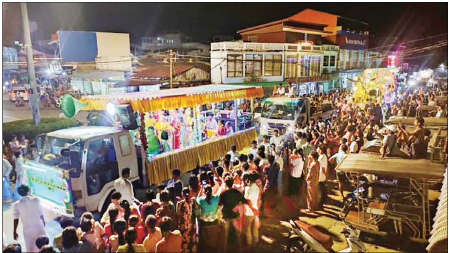
ကျင်းပခြင်းဖြစ်ကာ နှစ်ဆယ့်ရှစ်ဆူသော ဘုရားဆင်းတုတော်များ ဘုရားပွဲကို စည်ကားသိုက်မြိုက်စွာ ကျင်းပသွားမည်ဖြစ်ကြောင်း သိရကိန်းဝပ်စံပယ်တော်မူသည့် ပြည်တော်အေးစေတီတော်မြတ်ကြီးတွင် တန်ဆောင်မုန်းလပြည့်နေ့မှစတင်ကာ လှည့်လည်ကျော် ၈ ရက်အထိ သည်။

အဆိုပါနှစ်ကျိပ်ရှစ်ဆူပုဒ္ဒပ္ပန်နိယဘုရားပွဲတော်သည် ကျေးသောင်းမြို့၏ အစည်ကားဆုံးပွဲတော်တစ်ခုဖြစ်ပြီး ယခုနှစ်သည် (၅၂) ကြိမ်မြောက်