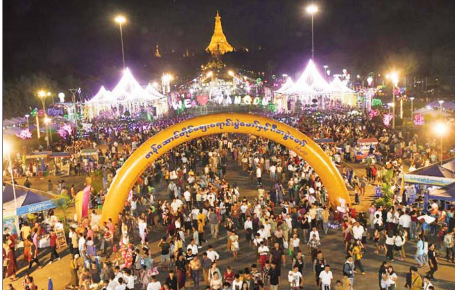
ရန်ကုန်တိုင်းဒေသကြီး မြန်မာ့ရိုးရာတန်ဆောင်တိုင်မီးထွန်းပွဲတော် စည်ကားသိုက်မြိုက်စွာကျင်းပမှုကို တွေ့ရစဉ်။