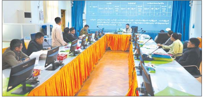
ကြပြီး ပြည်နယ်ဝန်ကြီးချုပ်က လိုအပ်ချက်များ ဆက်လက်ညှိနှိုင်းဆောင်ရွက်ရမည့် အမှုတွဲများကို ပေါင်းစပ်ညှိနှိုင်းပေးကာ ပိတ်သိမ်းရမည့်အမှုတွဲနှင့် ဆုံးဖြတ်ကြကြောင်း သိရသည်။ ခရိုင် (ပြန်/ဆက်)

ပြည်နယ်လယ်ယာမြေနှင့် အခြားမြေများ သိမ်းဆည်းခြင်းခံရမှုများ ပြန်လည်စိစစ်ရေး ကော်မတီ တွဲဖက်အတွင်းရေးမှူး ပြည်နယ်မြေစာရင်း ဦးစီးဌာနမှူးက စိစစ်ရန် တိုင်ကြားသည့် အမှုတွဲ ခုနစ်တွဲအား တစ်ခုချင်းအလိုက် စိစစ်ဆောင်ရွက် ထားရှိမှုအခြေအနေကို ရှင်းလင်းတင်ပြသည်။ ထို့နောက် ကော်မတီဒုတိယဥက္ကဋ္ဌ လုံခြုံရေးနှင့် နယ်စပ်ရေးရာဝန်ကြီးနှင့် ပြည်နယ်အဆင့် ဌာန ဆိုင်ရာတာဝန်ရှိသူများက ထပ်မံဖြည့်စွက် ဆွေးနွေး