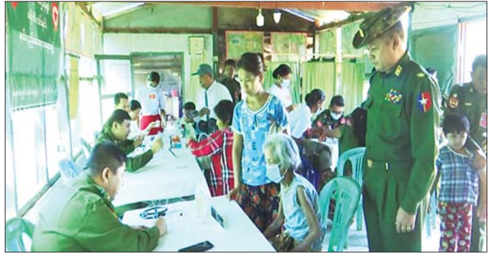
ကုသမှုဆိုင်ရာရောဂါ၊ ကလေးရောဂါ၊ အထွေထွေရောဂါတို့နှင့်ပတ်သက်၍ လိုအပ်သည့် ကျန်းမာရေး စစ်ဆေးကုသပေးခြင်းများ ဆောင်ရွက်ပေးပြီး ကျန်းမာရေးအသိပညာပေးခြင်းများ ဟောပြော ဆွေးနွေးကာ ဆေးရုံတက်ရောက်ကုသရန် လိုအပ်သည့်လူနာများအား နယ်မြေခံတပ်မတော်ဆေးရုံသို့ တက်ရောက်ကုသနိုင်ရေး စီစဉ်ဆောင်ရွက်ပေးခဲ့ကြောင်း သိရသည်။ သတင်းစဉ်

လိုအပ်သည့်ကျန်းမာရေး စစ်ဆေးကုသပေးခြင်းများ ဆောင်ရွက်ပေးသည်။ အလားတူ မန္တလေးတိုင်းဒေသကြီး ပုသိမ်ကြီးမြို့နယ် စစ်မှုထမ်းဟောင်းအိမ်ရာရှိ သံဃာတော်များနှင့် ဒေသခံပြည်သူများအား ယနေ့နံနက်ပိုင်းတွင် အလယ်ပိုင်းတိုင်းစစ်ဌာနချုပ်၊ နယ်လှည့်ဆေးကုသရေးအဖွဲ့က အဆိုပါအိမ်ရာ၌ ကျန်းမာရေးစောင့်ရှောက်မှုလုပ်ငန်းများ ဆောင်ရွက်ပေးသည်။ ထိုသို့ ဆောင်ရွက်ပေးရာတွင် ဆေးကုသရေးအဖွဲ့က သံဃာတော် ၃ ခုစီပါးနှင့် ဒေသခံပြည်သူ ၁၅၅ ဦးတို့ကို သွေးတိုးရောဂါ၊ အဆစ်အမြက်ရောင်ရောဂါ၊ ဆီးချိုရောဂါ၊ အသက်ရှူလမ်းကြောင်းဆိုင်ရာရောဂါ၊ မျက်စိရောဂါ၊ သွားနှင့်ခံတွင်းရောဂါ၊ ခွဲစိတ်