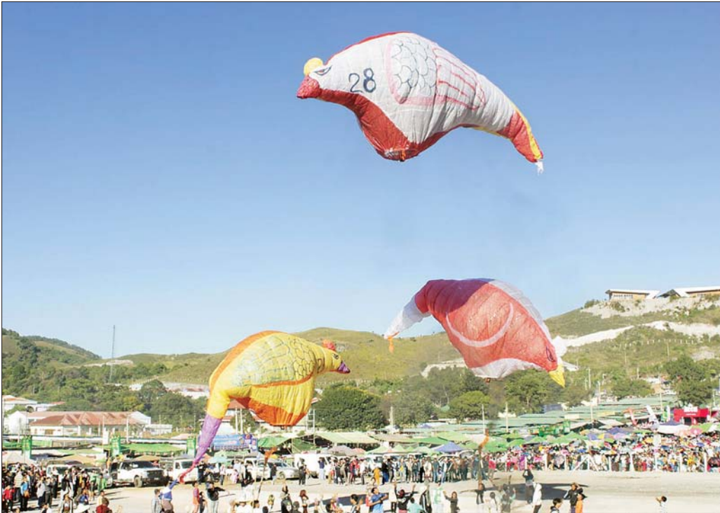
တောင်ကြီးတန်ဆောင်တိုင်မီးပုံးပျံပွဲတော် ပဉ္စမနေ့တွင် နေ့လွှတ်အရပ်မီးပုံးပျံများ လွှတ်တင်ယှဉ်ပြိုင်ပြီး စည်ကားသိုက်မြိုက်စွာ ကျင်းပစဉ်။

တောင်ကြီး နိုဝင်ဘာ ၁၆ တောင်ကြီးမြို့၌ ၂၀၂၄ ခုနှစ် (၇၄) ကြိမ်မြောက် တန်ဆောင်တိုင် မီးပုံးပျံလွှတ်တင်ပူဇော်ပွဲကို ရှမ်းပြည်နယ်အစိုးရအဖွဲ့၏ ကြီးကြပ်မှုဖြင့် အဝေယာ ကုန်းသာယာကွင်း၌ နိုဝင်ဘာ ၁၁ ရက်မှ ၁၇ ရက်အထိ နေ့ဉာဏ်ပုံးပျံပွဲများ၊ မီးပေးသော လှည့်လည်ပြိုင်ပွဲ၊ မသိုးသင်္ကန်းရက်လုပ်ပြိုင်ပွဲ၊ ဈေးပွဲတော်များ၊ အရောင်းမြှင့်တင်ရေးပွဲတော်များ၊ တေးဂီတဖျော်ဖြေပွဲများဖြင့် စည်ကားသိုက်မြိုက်စွာ ဆက်လက်ကျင်းပလျက်ရှိသည်။ တောင်ကြီးမြို့ တန်ဆောင်တိုင်မီးပုံးပျံပွဲတော် သည် မြန်မာ့သက္ကရာဇ် ၁၃၀၂ ခုနှစ် ခရစ်နှစ် သက္ကရာဇ် ၁၉၄၁ ခုနှစ် တန်ဆောင်မုန်းလတွင် ကုန်းသာကောင်းဆရာတော်မှဦးစီး၍ အချင်းပေ ၅၀ ခန့်ရှိသည့် မီးပုံးပျံကြီးကို ပြုလုပ်လွှတ်တင်ခြင်းမှ စတင်ခဲ့ပြီး ၁၉၅၀ ပြည့်နှစ်တွင် ပထမဆုံး မီးပုံးပျံ ပြိုင်ပွဲအဖြစ် ဆုများရွေးချယ်ချီးမြှင့်ကာ ပြိုင်ပွဲအသွင် ဖြင့် နှစ်စဉ်ကျင်းပလာခဲ့ကြောင်း သိရသည်။ ထိုသို့ ကျင်းပလျက်ရှိရာတွင် နိုဝင်ဘာ ၁၁ ရက်မှ ၁၇ ရက်အထိ ငါးရက်တာ ကာလအတွင်း စိန်နားပန်မီးပုံးပျံ ၁၆ လုံး၊ ညမီးကြီး မီးပုံးပျံ ၁၇ လုံး၊ နေ့လွှတ်အရပ်မီးပုံးပျံ ၁၃၉ လုံး စုစုပေါင်း မီးပုံးပျံ ၁၇၂ လုံး လွှတ်တင်ပူဇော်ယှဉ်ပြိုင်ခဲ့ပြီး ကျန်ရှိသည့် စိန်နားပန်မီးပုံးပျံ ခြောက်လုံး၊ ညမီးကြီး မီးပုံးပျံ ကိုးလုံး၊ နေ့လွှတ်အရပ်မီးပုံးပျံအလုံး ၇၀ စုစုပေါင်း မီးပုံးပျံ ၈၅ လုံးကို နိုဝင်ဘာ ၁၇ ရက်အထိ လွှတ်တင်ပူဇော် ယှဉ်ပြိုင်သွားမည်ဖြစ်ကြောင်း သိရသည်။ ပြည်နယ်(ပြန်/ဆက်)