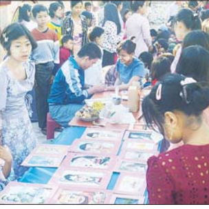
ပြည်သူများ လေ့လာဆောင်ရွက်နိုင်စေရန်နှင့် ပန်းချီပညာရပ် ဖွံ့ဖြိုးတိုးတက်စေရန်တို့ကို ရည်ရွယ်၍ ဆောင်ရွက်ပေးခြင်းဖြစ်သည်။ ကိုဇွဲ (အညာမြေ)

ဆိပ်ဖြူ နိုဝင်ဘာ ၁၆ မကွေးတိုင်းဒေသကြီး ဆိပ်ဖြူမြို့နယ်၌ မြို့နယ်ပြန်ကြားရေးနှင့် ပြည်သူ့ဆက်ဆံရေးဦးစီးဌာနနှင့် ပန်းချီဝါသနာ့ရှင် ဆရာများ ပူးပေါင်းဖွင့်လှစ်လေ့ကျင့်သင်ကြားပေးသည့် ကျောင်းသားကျောင်းသူလေးများ ရေးဆွဲသည့် ဆေးရောင်စုံပန်းချီပြပွဲကို နိုဝင်ဘာလ ၁၄ ရက်နှင့် နိုဝင်ဘာ ၁၅ ရက် နံနက်ပိုင်းတွင် ဆိပ်ဖြူမြို့၊ ရွှေမင်းဝန်စေတီတော်မြတ် ဗုဒ္ဓဓမ္မနိယပုံတော်၌ ဘုရားပွဲတော်လာ ပြည်သူများအား ခင်းကျင်းပြသသည်။ အဆိုပါ ပန်းချီပြပွဲကို ကျောင်းသားကျောင်းသူလေးများ၏ ပန်းချီပညာရပ်ကို ဝါသနာအရင်းခံကြိုးပမ်းဆည်းပူးရေးဆွဲနေမှု ကျောင်းသားကျောင်းသူလေးများ ရေးဆွဲထားသော ပန်းချီကားများကို မိဘ