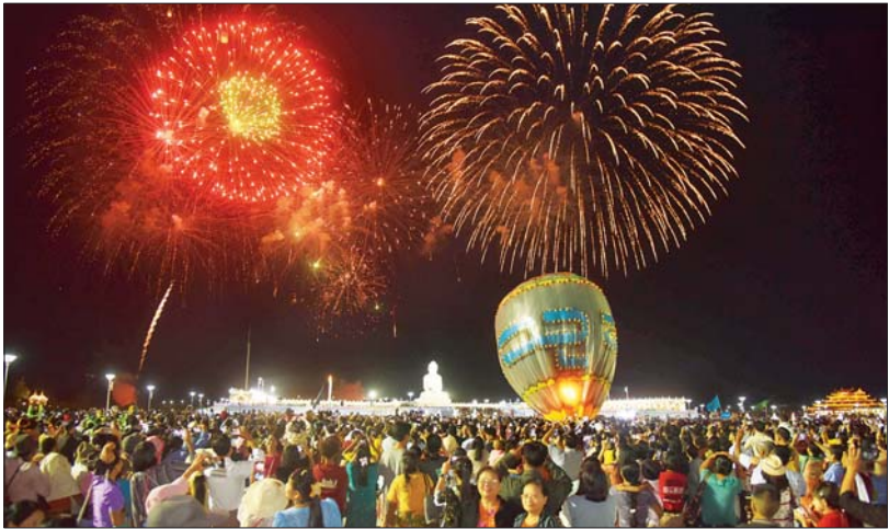
မာရဝိဇယဗုဒ္ဓရုပ်ပွားတော်မြတ်ကြီး တန်ဆောင်တိုင်မီးထွန်းပွဲတော် စည်ကားသိုက်မြိုက်စွာ ကျင်းပမှုကို တွေ့ရစဉ်။

နောက်ထပ်ထူးခြားချက်တစ်ရပ်မှာ ပြီးခဲ့သည့်နှစ်မှစ၍ မာရဝိဇယဗုဒ္ဓရုပ်ပွား တော်မြတ်ကြီး တန်ဆောင်တိုင်မီးထွန်း