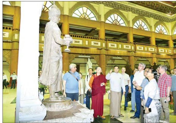
ရုရှားဖက်ဒရေးရှင်းနိုင်ငံ ဘူရားတီးရားပြည်နယ် အကြီးအကဲ H.E. Mr. Alexey Sambuevich Tsydenov ဦးဆောင်သော ကိုယ်စားလှယ်အဖွဲ့ ပုဂံရှေးဟောင်းသုတေသနပြုတိုက်၌ ကြည့်ရှုလေ့လာစဉ်။