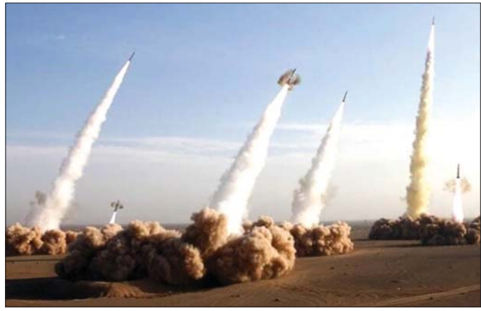
ပဋိပက္ခဖြစ်ပွားမှုအခြေအနေ ပိုပြီးတင်းမာလာ

ပစ်မှတ်ထားရှင်းလင်းရေးတွေ လုပ်ဆောင် ဧပြီ ၁၃ ရက်မှာ ဟစ်စ်ဘိုလာအဖွဲ့က အစ္စရေး မြောက်ပိုင်းကို ချီးကျည် ၄၀ ခန့် ပစ်လွှတ်တိုက်ခိုက်ခဲ့ပါတယ်။ ဟစ်စ်ဘိုလာတို့က ဟားမားစ်တွေနဲ့အတူ ရပ်တည်ကြောင်း ပြသဖို့အတွက် ယင်းတိုက်ခိုက်မှုကို လုပ်ဆောင်ခြင်းဖြစ်တယ်လို့ ဆိုပါတယ်။ အကျိုးဆက်အနေနဲ့ အစ္စရေးက လက်ဘနွန်မှာရှိတဲ့ ဟစ်စ်ဘိုလာတွေကို အဓိက ပစ်မှတ်ထားပြီး သုတ်သင်ရှင်းလင်းရေးတွေ လုပ်ဆောင်ခဲ့ပါတယ်။