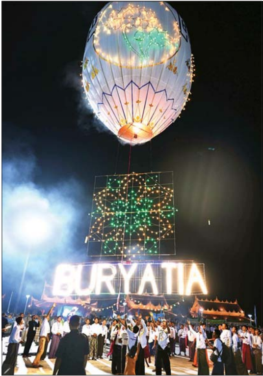
ရုရှား- မြန်မာ ချစ်ကြည်ရေးအထိမ်းအမှတ် မြတ်ရောင်ခြည်စိန်နားပန်း မီးပုံးပျံ လွှတ်တင်မှုကို တွေ့ရစဉ်။