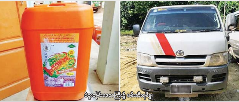
ဗိုလ်ချုပ်မှူးကြီး ဖမ်းဆီးရမိမှု။

နေပြည်တော် နိုဝင်ဘာ ၁၆ တရားမဝင် ကုန်သွယ်မှု တိုက်ဖျက်ရေးဦးဆောင်ကော်မတီ၏ ကြိုးကြပ်ကွပ်ကဲမှုဖြင့် တရားမဝင် ကုန်သွယ်မှုများကို ဥပဒေနှင့်အညီ ထိရောက်စွာ တားဆီးအရေးယူနိုင်ရေး ဆောင်ရွက်လျက်ရှိသည်။ နိုဝင်ဘာ ၁၄ ရက်တွင် အကောက်ခွန်ဦးစီးဌာန၏ စီမံခန့်ခွဲမှုဖြင့် တာဝန်ကျပူးပေါင်း စာမျက်နှာ ၁၅ ကော်လံ ၁၂