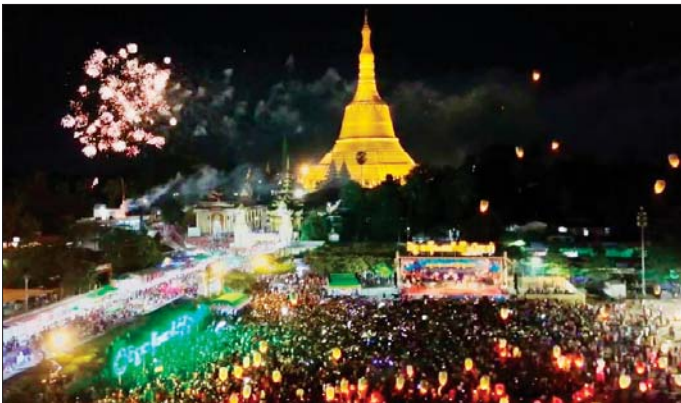
ပြည်သူများ၏ စည်းကမ်းရှိမှု၊ တည်ငြိမ်အေးချမ်း စိမ်းပျံ့ပွဲတော်သည် အေးချမ်းအောင်မြင်စွာ ကျင်းပပြီးလျှင် နေရာပေါင်းစုံမှ ပူးပေါင်းပါဝင် ဆောင်ရွက်နိုင်ခဲ့ကြောင်း သိရသည်။ ဆောင်ရွက်ပေးခဲ့မှုကြောင့် ပဲခူးတန်ဆောင်တိုင်ပွဲ တိုင်းဒေသကြီး(ပြန်/ဆက်)

တန်ဆောင်တိုင်ပွဲတော်ကာလ နိုဝင်ဘာ ၁၄ ရက်နှင့် ၁၅ ရက်တွင် နေ့အရပ် ၂၂ လုံး၊ အထိမ်းအမှတ်ရုပ်ပုံပါ စိန်နားပန်းမီးပုံးပျံအကြီး ၁၁ လုံးနှင့် မီးပုံးပျံအသေးအလုံး ၃၈၅၀ တို့ကို အလှည့်ကျစည်ကားသိုက်မြိုက်စွာ လွှတ်တင်ပူဇော်နိုင်ခဲ့ပြီး ဒေသခံ