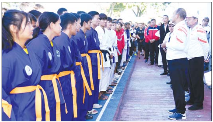
ရှမ်းပြည်နယ်ဝန်ကြီးချုပ် ဦးအောင်အောင် အားကစားသမားများအား တွေ့ဆုံအားပေးစကား ပြောကြားစဉ်။

ရှမ်းပြည်နယ်ကိုယ်စားပြု သွားရောက်ယှဉ်ပြိုင်ရ သည့်အတွက် အောင်မြင်မှုရရှိနိုင်အောင် အသိစိတ် များထားရှိရန်၊ အားကစားသမားများ၊ နည်းပြများ၊ အသင်းအုပ်ချုပ်ကြီးကြပ်သူများကလည်း အရေးကြီး ကြောင်း၊ အားကစားစိတ်ဓာတ်ဖြင့် အောင်နိုင်လို စိတ်ထားရှိရန် လိုအပ်ကြောင်း၊ အားကစားသမား များသည် ကျန်းမာရေး၊ အိပ်ချိန်၊ အစားအသောက်နှင့် လေ့ကျင့်မှုများကို ဂရုစိုက်ကြရန် လိုအပ်ကြောင်း၊ အောင်နိုင်လိုစိတ်ထားရှိပြီးကြီးစားကြရန် ပြောကြား သည်။ ထို့နောက် အားကစားသမားများအတွက် ပြည်နယ်အစိုးရအဖွဲ့၏ ထောက်ပံ့ငွေကျပ်သိန်း ၁၀၀ ကို ပြည်နယ်ဝန်ကြီးချုပ်က ပေးအပ်ရာ အားကစားသမားများက လက်ခံရယူကြကြောင်း သိရသည်။ မောင်မောင်သန်း(တောင်ကြီး)