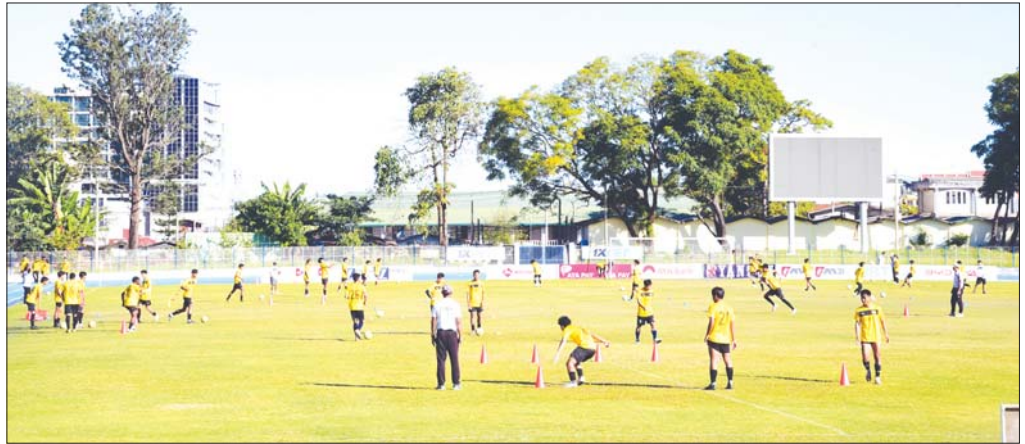
ပဉ္စမအကြိမ် အမျိုးသားအားကစားပွဲတော်တွင် ဝင်ရောက်ယှဉ်ပြိုင်မည့် ရှမ်းပြည်နယ်ကိုယ်စားပြုအားကစားသမားများ လေ့ကျင့်နေမှုကို တွေ့ရစဉ်။

ကျွန်တော် ဖြတ်သန်းခဲ့သော ဘဝတစ်လျှောက်တွင် ပြည်တွင်း၊ ပြည်ပ အားကစားပြိုင်ပွဲအမျိုးမျိုးကို ကြုံတွေ့ခဲ့ဖူး၊ အားပေးခဲ့ဖူးပါသည်။ အားကစားကဏ္ဍအသီးသီးမှ နိုင်ငံ့ဂုဏ်ဆောင် အောင်မြင်မှုအမှတ်တရများနှင့် တစ်တိုင်းတစ်ပြည်လုံး ပြည်သူလူထုတစ်ရပ်လုံး တစ်ခဲနက်အားပေးမှုများကို ရင်ထဲအသည့်ထဲ လှိုက်လှိုက်လှဲလှဲနှင့် ကြုံခဲ့ဖူးပါသည်။ အားကစားအောင်မြင်မှုများသည် နိုင်ငံတော်နှင့် ပြည်သူလူထုတစ်ရပ်လုံးအတွက် ဝမ်းမြောက်ဂုဏ်ယူစရာများပင်ဖြစ်ပါသည်။ အားကစားပြိုင်ပွဲများကို စိတ်ရောက်ရှိပါက ကိုယ်တိုင်ကိုယ်ကျ သွားရောက်အားပေးချီးမြှောက်ခဲ့ကြသည့် ပြည်သူများကို အသိအမှတ်ပြုရမည်ဖြစ်ပါသည်။ ကျွန်တော်အနေဖြင့် အားကစားဝါသနာအိုး မဟုတ်သော်လည်း နေပြည်တော်တွင် နိုင်ငံ့တာဝန်ထမ်းဆောင်စဉ်က ၂၀၁၃ (၂၇) ကြိမ်မြောက် အရှေ့တောင်အာရှအားကစားပြိုင်ပွဲ၊ ၂၀၁၄ အာဆီယံမသန်စွမ်း