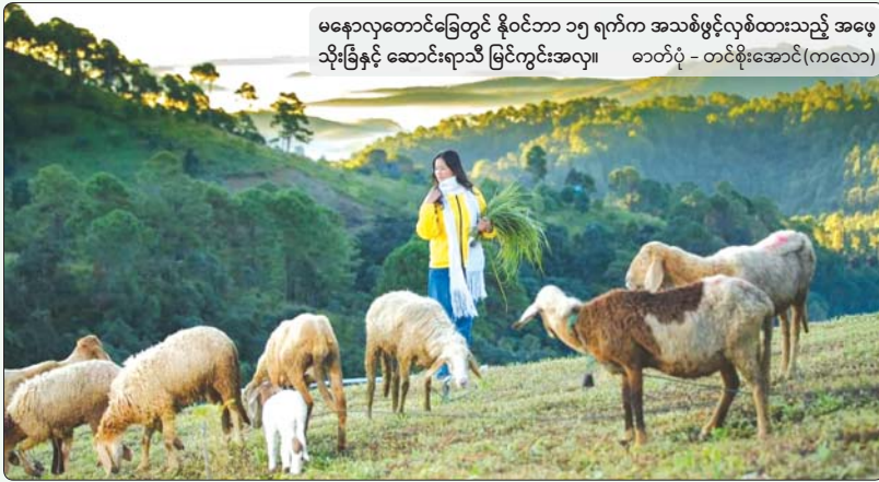
မနောလှတောင်ခြေတွင် နိုဝင်ဘာ ၁၅ ရက်က အသစ်ဖွင့်လှစ်ထားသည့် အဖေ့ သိုးခြံနှင့် ဆောင်းရာသီ မြင်ကွင်းအလှ။

“ကလောမှာဆိုရင် မနောလှတောင်က မသိတဲ့သူ မရှိ သလောက်ပါပဲ။ ဒီနေရာလေးက သွားလာရတာ အချက် အချာလည်းကျတယ်။ အိုးစည်တောင် အနောက်ဘက် လမ်းကနေလာရင် အဖေ့ခြံကိုရောက်တယ်။ အိုးစည် တောင်ပေါ်ကနေလည်း ကြည့်လို့မြင်ရတယ်။ ဒီထဲမှာ စတော်ဘယ်ရီစိုက်ခင်းတွေလည်း အများကြီး။ ဆောင်းတွင်းနဲ့ နွေရာသီဆို အဖေ့ခြံက ပိုပြီးလှတယ်”