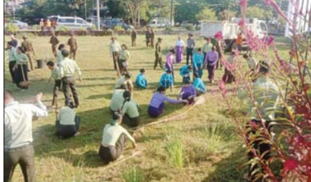
ခရိုင်၊ မြို့နယ်အထွေထွေအုပ်ချုပ်ရေးဦးစီးဌာန ဝန်ထမ်းများ၊ ရပ်/ကျေး အုပ်ချုပ်ရေးမှူးများ၊ တပ်မတော်သားများ၊ မြန်မာနိုင်ငံရဲတပ်ဖွဲ့ဝင်များ၊ ပြည်သူ့လုံခြုံရေးနှင့် အကြမ်းဖက်နှိမ်နင်းရေး(မြို့ပြ)အဖွဲ့များ၊ ပရဟိတအဖွဲ့များ စုစုပေါင်းအင်အား ၂၅၀ တို့က စေတီတော်မြတ်ကြီး ရင်ပြင်တော်သန့်ရှင်းရေး အညစ်အကြေးများ ဆေးကြောခြင်း၊ တံမြက်စည်းလှည်းခြင်း၊ အရံစေတီများနှင့် အာရုံခံဝတ်များရှိ ရုပ်ပွားတော်များ ရောင်တော်ဖွင့်ခြင်း၊ ပန်း၊ ရေချမ်း၊ ဆီမီးများ ကပ်လှူပူဇော်ခြင်း စသည့် စေတီတော်မြတ်ကြီးအား သန့်ရှင်းသဖွယ် ကြည့်ညိုစွာ အဖူးမြော်ခံနိုင်ရေး စုပေါင်းလုပ်အားဒါန ပြုလုပ်ခဲ့ကြောင်း သိရသည်။ မြို့နယ်(ပြန်/ဆက်)

လူမျိုး၊ ကိုးကွယ်ရာဘာသာ၊ ကျား/မ(သို့မဟုတ်) မည်သူမည်ဝါဖြစ်သည် ဆိုသည့် အကြောင်းအရာတို့အပေါ် အခြေပြု၍ လူပုဂ္ဂိုလ်တစ်ဦး(သို့မဟုတ်) လူအုပ်စုတစ်စုကို မျှတမှုမရှိစွာ ဝေဖန်သည့် (သို့မဟုတ်) မလိုမုန်းထားမှုကို ဖော်ပြသည့်ဆက်ဆံမှု တစ်မျိုးမျိုးကို ရည်ညွှန်းပြီး အကြမ်းဖက်ရန် လှုံ့ဆော်ခြင်းသည် အမုန်းစကားပင် ဖြစ်သည်။ အမုန်းစကားပြန့်ပွားခြင်းသည် လူ့အဖွဲ့အစည်းအတွင်း ခွဲခြားဆက်ဆံမှုနှင့် အကြမ်းဖက်မှုကို ဖြစ်ပေါ်စေပြီး ဂုဏ်သိက္ခာရှိစွာနေထိုင်ရန်နှင့် ငြိမ်းချမ်းပြီး ညီညွတ်သည့် လူ့အဖွဲ့အစည်းတည်ဆောက်ရန် မျှော်မှန်းချက်တို့ကို ထိခိုက်စေသည့်အပြင် အကျင့်စာရိတ္တကိုလည်း ထိပါးစေသည်။ သို့ဖြစ်၍ ပြည်သူများအနေဖြင့် အမုန်းစကားများကို ရှုတ်ချရန်နှင့်တားဆီးရန် စီမံဆောင်ရွက်ရမည်။ အမုန်းစကားဆန့်ကျင်သည့် လှုပ်ရှားမှုများတွင် အားလုံးပါဝင်ရန်နှင့် ပံ့ပိုးအားပေးရမည်။