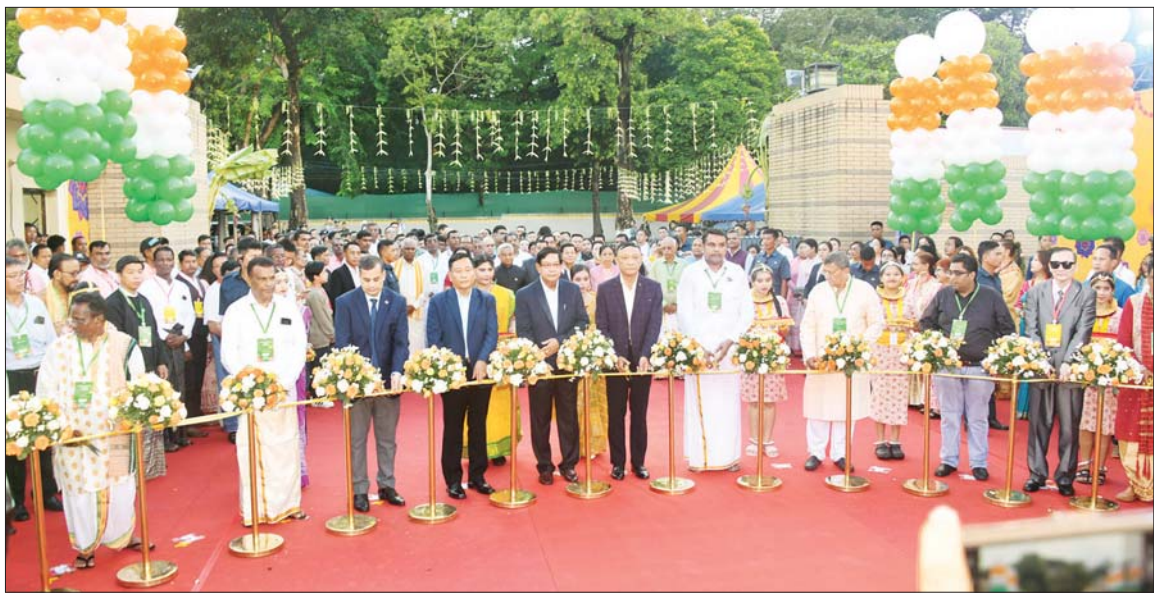
ဟိန္ဒူရိုးရာ ဒီပဲလီအထိမ်းအမှတ်အခမ်းအနား မင်္ဂလာမုခ်ဦးကို တာဝန်ရှိသူများက ဖဲကြိုးဖြတ်ဖွင့်လှစ်ပေးကြစဉ်။

ပြီး တက်ရောက်လာကြသူများနှင့်အတူ စုပေါင်းမှတ်တမ်းတင်ဓာတ်ပုံရိုက်ကြသည်။ ပြခန်းများ လှည့်လည်ကြည့်ရှု ယင်းနောက် နိုင်ငံတော်စီမံအုပ်ချုပ်ရေးကောင်စီဥက္ကဋ္ဌ နိုင်ငံတော်ဝန်ကြီးချုပ်နှင့် ဇနီး၊ အဖွဲ့ဝင်များသည် ဟိန္ဒူအသင်းအဖွဲ့ပြခန်းများ၊ ဟိန္ဒူမျိုးနွယ်စုပြခန်းများကို ပြခန်းတစ်ခုချင်းစီအလိုက် လှည့်လည်ကြည့်ရှုကြသည်။ ထို့နောက် အခမ်းအနားအစီအစဉ်ဒုတိယပိုင်းကို ပြဇာတ်ခန်းမဌာနပေါ်တွင် နိုင်ငံတော်စီမံအုပ်ချုပ်ရေးကောင်စီဥက္ကဋ္ဌ နိုင်ငံတော်ဝန်ကြီးချုပ်နှင့် ဇနီး၊ မြန်မာနိုင်ငံဆိုင်ရာ အိန္ဒိယနိုင်ငံ သံအမတ်ကြီးနှင့် ဇနီး၊ တာဝန်ရှိသူများက ဒီပဲလီအထိမ်းအမှတ် ဆီမီးထွန်းညှိပေးကြပြီး စာမျက်နှာ ၄ သို့