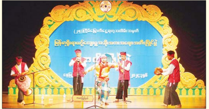
အိုးစည် (အတီး)

ဆိုင်းတစ်ဦးချင်း အတီးပြိုင်ပွဲ ဝါသနာရှင် ဒုတိယတန်းအဆင့် (အမျိုးသမီး) ၌ ပထမဆုရရှိသည့် စစ်ကိုင်းတိုင်းဒေသကြီးမှ ချစ်ဆုဝေစတင်း “မော်တင်လယ်” (ပတ်ပျိုး) သီချင်းဖြင့် တီးခတ်ယှဉ်ပြိုင်စဉ်။