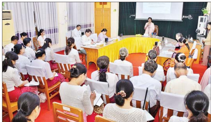
လုပ်ငန်းဆောင်ရွက်နေမှုအခြေအနေကို ရှင်းလင်း ယနေ့နံနက်ပိုင်းကလည်း မိတ္ထီလာခရိုင် စာရင်းစစ် တင်ပြရာ ပြည်ထောင်စုစာရင်းစစ်ချုပ်က လိုအပ် ရုံး၌ ခရိုင်/မြို့နယ် စာရင်းစစ်ရုံးဝန်ထမ်းများနှင့် သည်များကို ပေါင်းစပ်ညှိနှိုင်းဆောင်ရွက်ပေးသည်။ တွေ့ဆုံခဲ့ကြောင်း သိရသည်။ ထို့အတူ ပြည်ထောင်စုစာရင်းစစ်ချုပ်သည် သတင်းစဉ်

ဝိုင်းဝန်းဆောင်ရွက် သွားကြရမည်ဖြစ်ကြောင်း၊ ထို့အတူ နည်းပညာအသုံးပြု၍ IT Audit စစ်ဆေး ခြင်းကို ကျယ်ပြန့်စွာဆောင်ရွက်နိုင်ရေးအတွက် ကွန်ပျူတာအခြေခံမှစ၍ အဆင့်မြင့်ပညာအထိ တတ်မြောက်နိုင်ရေး စီမံဆောင်ရွက်ပေးရမည် ဖြစ်ပြီး သတင်းအချက်အလက်လုံခြုံရေးကိုလည်း ဂရုပြုဆောင်ရွက်သွားရမည်ဖြစ်ကြောင်း ပြောကြား သည်။ ထို့နောက် မန္တလေးတိုင်းဒေသကြီး စာရင်းစစ် ချုပ်ရုံးမှ တာဝန်ရှိသူများက ဝန်ထမ်းအင်အားနှင့်