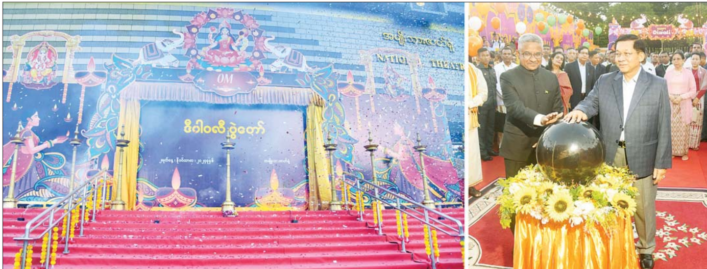
နိုင်ငံတော်စီမံအုပ်ချုပ်ရေးကောင်စီဥက္ကဋ္ဌ နိုင်ငံတော်ဝန်ကြီးချုပ် ဗိုလ်ချုပ်မှူးကြီး မင်းအောင်လှိုင်နှင့် မြန်မာနိုင်ငံဆိုင်ရာ အိန္ဒိယနိုင်ငံ သံအမတ်ကြီးတို့ ဒီပါဝလီအထိမ်းအမှတ်အခမ်းအနားကို စက်ဝလုတ်နှိပ် ဖွင့်လှစ်ပေးကြစဉ်။