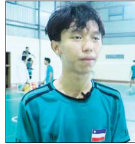
မောင်ခိုင်ခန့်ကြည်