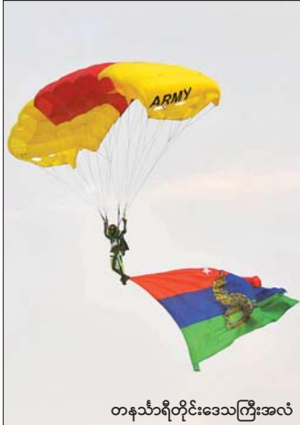
တနင်္သာရီတိုင်းဒေသကြီးအလံ