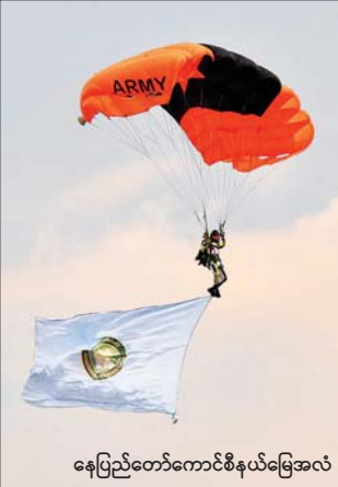
နေပြည်တော်ကောင်စီနယ်မြေအလံ