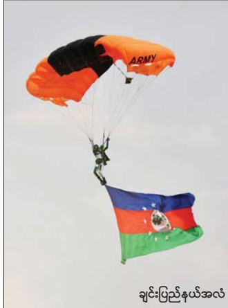
ချင်းပြည်နယ်အလံ