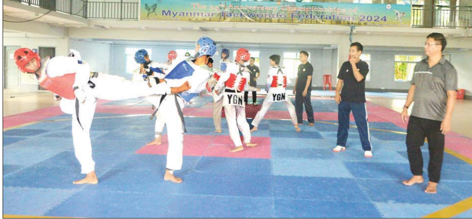
ရန်ကုန်တိုင်းဒေသကြီးကိုယ်စားပြု တိုက်ကွမ်ဒိုအားကစားသမားများ လေ့ကျင့်မှုကိုတွေ့ရစဉ်။

ချက်ဖြင့် နိုင်ငံတော်စီမံအုပ်ချုပ်ရေးကောင်စီလက်ထက် ပဉ္စမအကြိမ် အမျိုးသားအားကစားပွဲတော်ကို ၂၀၂၄ ခုနှစ် ဒီဇင်ဘာ ၉ ရက်မှ ၂၀ ရက်အထိနေပြည်တော်၌ ကျင်းပသွားမည်ဖြစ်သည်။ အဆိုပါပဉ္စမအကြိမ်အမျိုးသားအားကစားပွဲတော်တွင် ဝန်ကြီးဌာန အားကစားနည်း ခြောက်နည်း၊ ပြည်နယ်နှင့်တိုင်းဒေသကြီးအဆင့်အားကစားနည်း ၂၃ မျိုးနှင့် မသန်စွမ်း အားကစားနည်း ထည့်သွင်းသွားမည်ဖြစ်ပြီး ဆုတံဆိပ် ၂၀၀ ကျော် ပေးသွားမည်ဖြစ်ကြောင်း သိရသည်။ အဆင့်အတန်း ပြန်လည်မြှင့်တင်ရန် ရည်ရွယ်