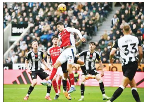
စာမျက်နှာ ၁၅ ကော်လံ ၃

ပရီမီယာလိဂ်ပွဲစဉ် (၁၀) မှ နိုဝင်ဘာ ၂ ရက် ည ၇ နာရီက ယှဉ်ပြိုင်ကစားခဲ့သည့် နယူးကာဆယ်နှင့် အာဆင်နယ်အသင်းတို့ အသုံးမချနိုင်ခဲ့သည့်အတွက် ရှုံးပွဲပွဲစဉ်တွင် နယူးကာဆယ်အသင်းက အကြိတ်အနယ်ကစားပြီး ပွဲချိန် ၁၂ မိနစ်တွင် ရရှိခဲ့သော အီဆတ်၏ တစ်လုံးတည်းသောသွင်းဂိုးဖြင့် အနိုင်ရရှိခဲ့သည်။ အာဆင်နယ်အသင်းသည် နယူးကာဆယ်အသင်းကို ဘောလုံးပိုင်ဆိုင်မှု