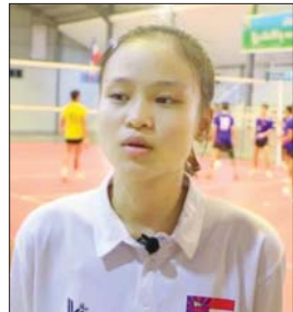
နန်းနင်းဝေ