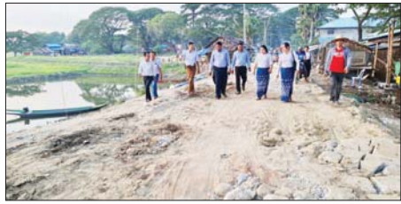
ဦးစီးရေးနှင့်အရည်အသွေးပြည့်မီစေရေး အလေးထားဆောင်ရွက်သွားရန်နှင့် လိုအပ်သည်များ မှာကြားခဲ့ကြောင်း သိရသည်။ မြို့နယ် (ပြန်/ဆက်)

ဌာနမှ ၂၀၂၄-၂၀၂၅ ဘဏ္ဍာနှစ် တိုင်းဒေသကြီး/ပြည်ထောင်စု ငွေလုံးငွေရင်းခွင့်ပြုရန်ပုံငွေဖြင့် အကောင်အထည်ဖော်ဆောင်ရွက်လျက်ရှိသော ပန်းတနော်-ဂုံမင်းလမ်းသို့ဆက်သည့်လမ်း ကွန်ကရစ်ခင်းခြင်းလုပ်ငန်းအား သွားရောက်ကွင်းဆင်းကြည့်ရှုစစ်ဆေးရာ မအူပင်ခရိုင် လက်ထောက်ညွှန်ကြားရေးမှူး (မြို့ပြ)နှင့် ပန်းတနော်မြို့နယ်ဦးစီးအရာရှိ(မြို့ပြ)(တာဝန်)မှ လုပ်ငန်းဆောင်ရွက်ထားရှိမှုအခြေအနေနှင့် ဆက်လက်ဆောင်ရွက်သွားမည့်လုပ်ငန်းစဉ်များကို ရှင်းလင်းတင်ပြသည်။ ထို့နောက် အင်ဂျင်နီယာချုပ် (မြို့ပြ)က လုပ်ငန်းများ အချိန်မီ