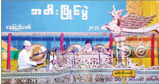
ဆိုင်း (အတီး)

၂၀၂၄ ခုနှစ် (၂၅) ကြိမ်မြောက် ငွေရတုအထိမ်းအမှတ် မြန်မာ့ရိုးရာယဉ်ကျေးမှု ဆို၊ က၊ ရေး၊ အတီးပြိုင်ပွဲကြီးကို အောက်တိုဘာ ၁၄ ရက်မှ အောက်တိုဘာ ၂၃ ရက်အထိ နေပြည်တော်ရှိ သတ်မှတ်နေရာ အသီးသီး၌ ကျင်းပခဲ့ရာ ပထမဆုရပြိုင်ပွဲဝင်များ၏ ယှဉ်ပြိုင်ခဲ့မှု မြင်ကွင်းပုံရိပ်များကို စုစည်းဖော်ပြလိုက်ပါသည်။