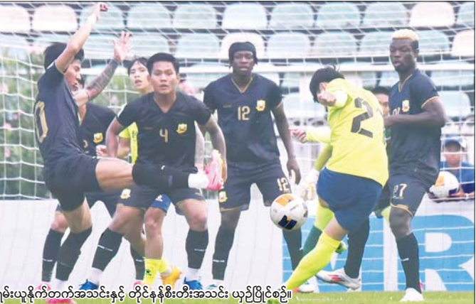
ရှမ်းယူနိုက်တက်အသင်းနှင့် တိုင်နန်စီးတီးအသင်း ယှဉ်ပြိုင်စဉ်။

ရန်ကုန် နိုဝင်ဘာ ၂ ၂၀၂၄-၂၀၂၅ ရာသီ AFC Challenge League ပြိုင်ပွဲအုပ်စု (D) နောက်ဆုံးနေ့အဖြစ် မြန်မာကလပ်ရှမ်းယူနိုက်တက်အသင်းနှင့် တရုတ်(တိုင်ပေ)ကလပ်တိုင်နန်စီးတီးအသင်းတို့ နိုဝင်ဘာ ၂ ရက်က သုဝဏ္ဏတွင်း၌ ယှဉ်ပြိုင်ကစားရာ နှစ်ဂိုးစီသရေကျခဲ့သည်။ မြန်မာကလပ် ရှမ်းယူနိုက်တက်အသင်းသည် ယခုပြိုင်ပွဲတွင် ပုံစံကောင်းပြသကာ အုပ်စုနောက်ဆုံးပွဲတွင် တရုတ်(တိုင်ပေ)ကလပ်ကို သရေကစားပြီး အုပ်စုပထမနေရာရယူနိုင်ခဲ့သည်။ နှစ်သင်းစလုံး ယခုပွဲစတင်မီကတည်းက နောက်တစ်ဆင့်တက်ရောက်ပြီးဖြစ်သော်လည်း အုပ်စုပထမနေရာအတွက် အားကုန်ထုတ်ကစားခဲ့ပြီး အပြန်အလှန်သွင်းဂိုးများဖြင့် ပွဲကောင်းတစ်ပွဲဖြစ်ခဲ့သည်။ စာမျက်နှာ ၂၅ ကော်လံ ၁ ၀