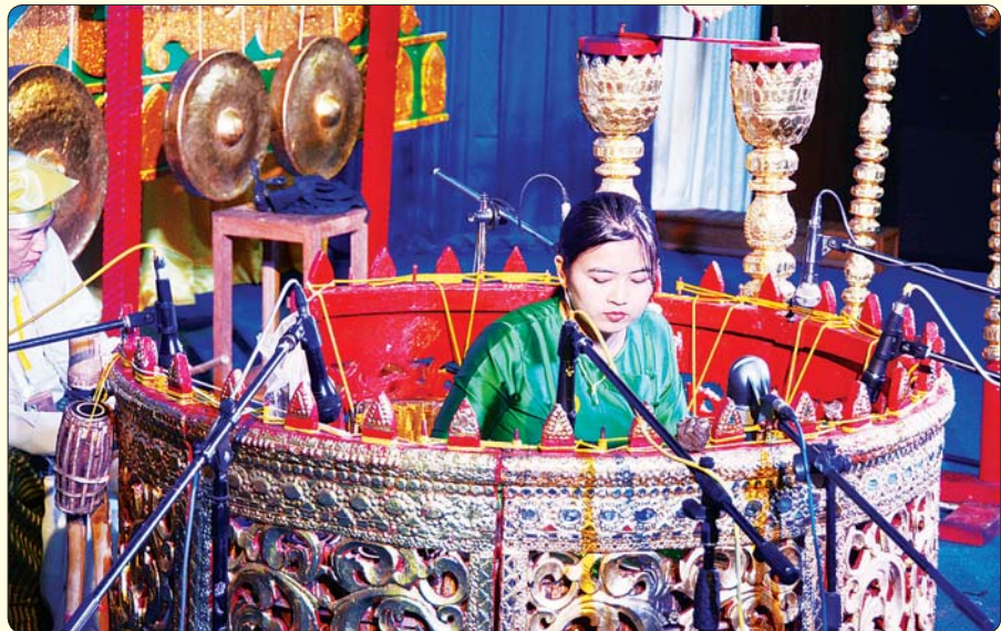
ဆိုင်း (အတီး)

အမျိုးဂုဏ်၊ ဇာတိဂုဏ်ဖြင့်တင်ရေးတေး အဆိုပြိုင်ပွဲ အဆင့်မြင့်ပညာ (အမျိုးသား) ၌ ပထမဆုရရှိသည့် ရန်ကုန်တိုင်းဒေသကြီးမှ မောင်စိုးပြည့်ငြိမ်း “ကျေးရွာဝါဒ” သီချင်းဖြင့် သီဆိုယှဉ်ပြိုင်စဉ်။