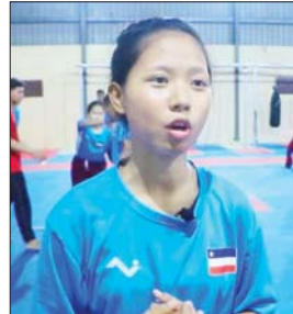
မထက်ဝေဝေအောင်