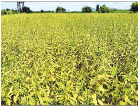
စိုက်ပျိုးရေးဆိုင်ရာ နည်းပညာ များ၊ သွင်းအားစုများ၊ သီးနှံမျိုးစေ့ များ ကူညီထောက်ပံ့ခြင်းများကို တိုင်းဒေသကြီး စိုက်ပျိုးရေး ဦးစီးဌာန၏ ညွှန်ကြားမှုဖြင့် သက်ဆိုင်ရာ ခရိုင် မြို့နယ် စိုက်ပျိုး

မုံရွာ နိုဝင်ဘာ ၂ စစ်ကိုင်းတိုင်းဒေသကြီး ဘုတလင် မြို့နယ်၌ မိုးသီးနှံ နှမ်း ၅၃၁၀၂ ဧက စိုက်ပျိုးပြီးစီး၍ လျာထား ကေထက် ၁၀၃၂ ဧက ကျော်လွန် စိုက်ပျိုးနိုင်ခဲ့ကြောင်း သိရသည်။ မိုးနှမ်းများ စိုက်ပျိုးရာတွင် ဆင်းရဲတနာ- ၃၊ သိပ္ပံနှမ်းနက်၊ ရိုးစိမ်း၊ ရုပ်ကလေးမျိုးများကို အထွက်နှုန်း ကောင်းမွန်ရေး၊ မျိုးကောင်း မျိုးသန့်ရရှိရေးကို အတွက် စံကွက်များ၊ စမ်းသပ် ကွက်များကို စိုက်ပျိုးထားရှိပြီး တောင်သူများ မိုးနှမ်းစိုက်ပျိုး ရာသီတွင် သီးနှံများ အောင်မြင် ဖြစ်ထွန်းရေးအတွက် လိုအပ်သော