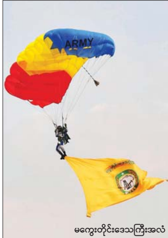
မကွေးတိုင်းဒေသကြီးအလံ