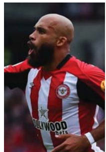
အစ်ဗျူဇို ဘရန့်ဖွဲ့ဒ် (တိုက်စစ်) ၉ ပွဲကစား၊ ၈ ဂိုးသွင်း