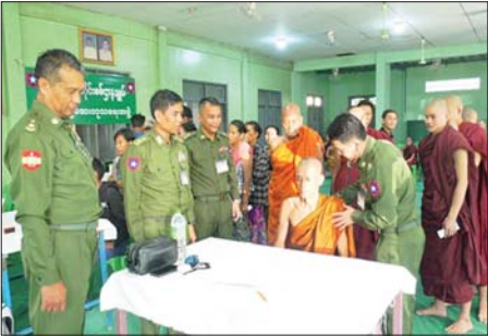
အောင်မြေသာစံမြို့နယ် ညောင်ကွဲရပ်ကွက်ရှိ သံဃာတော်များ၊ သာသနာ့ဇွယ်ဝင် သီလရှင်များနှင့် ဒေသခံပြည်သူများအား ကျန်းမာရေးစောင့်ရှောက်မှု လုပ်ငန်းများ ဆောင်ရွက်

ယင်းနောက်တိုင်းမှူးနှင့် တက်ရောက်လာကြသူများက ကျောင်းသား ကျောင်းသူများ၏ “ဇာတိမာန်” သီချင်းဖြင့် သီဆိုဖျော်ဖြေမှုများကို ကြည့်ရှုအားပေးကြပြီး ရင်းရင်းနှီးနှီး လိုက်လံနှုတ်ဆက်ခဲ့ကြောင်း သတင်းရရှိသည်။