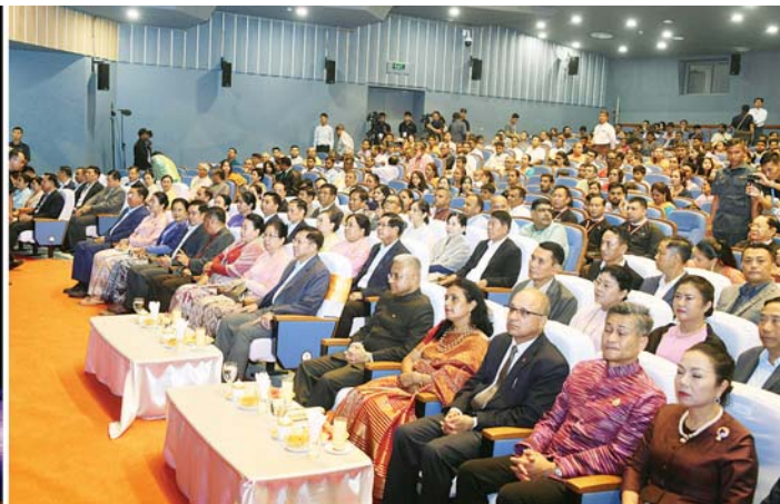
နိုင်ငံတော်စီမံအုပ်ချုပ်ရေးကောင်စီဥက္ကဋ္ဌ နိုင်ငံတော်ဝန်ကြီးချုပ် ဗိုလ်ချုပ်မှူးကြီး မင်းအောင်လှိုင်၊ ဇနီး ဒေါ်ကြူကြူလှနှင့် အခမ်းအနားတက်ရောက်လာကြသူများ ဆီမီးခွက်အကပြိုင် ဖျော်ဖြေတင်ဆက်မှုကို ကြည့်ရှုအားပေးကြစဉ်။