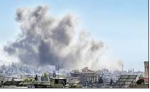
နိုင်ငံတကာသတင်း စာ ၁၃

လက်ဘနွန်တောင်ပိုင်းနှင့် အရှေ့ပိုင်းတို့တွင် အစွဲရေးလေကြောင်းတိုက်ခိုက်မှုကြောင့် ၆၉ ဦး သေဆုံး၊ ၁၂၆ ဦး ဒဏ်ရာရ