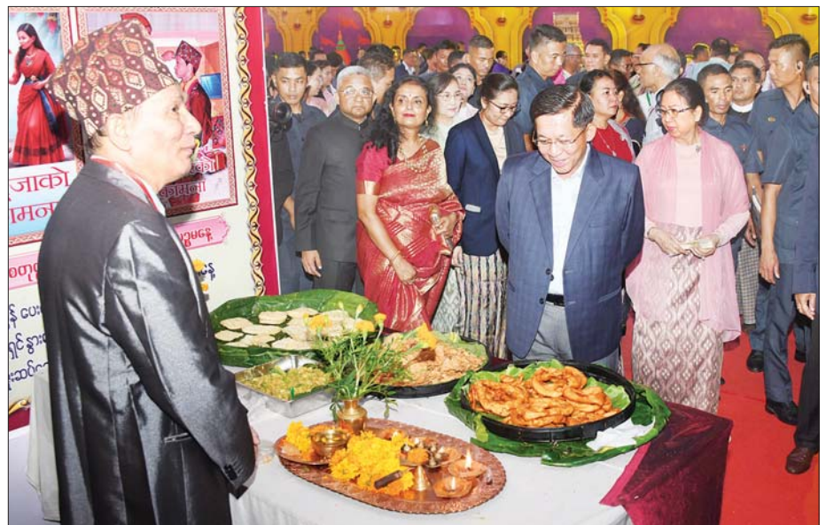
နိုင်ငံတော်စီမံအုပ်ချုပ်ရေးကောင်စီဥက္ကဋ္ဌ နိုင်ငံတော်ဝန်ကြီးချုပ် ဗိုလ်ချုပ်မှူးကြီး မင်းအောင်လှိုင်၊ ဇနီး ဒေါ်ကြူကြူလှနှင့်အဖွဲ့ဝင်များ ဟိန္ဒူအသင်းအဖွဲ့ ပြခန်းများကို လှည့်လည်ကြည့်ရှုကြစဉ်။

ဦးစွာ နိုင်ငံတော်စီမံအုပ်ချုပ်ရေးကောင်စီဥက္ကဋ္ဌ နိုင်ငံတော်ဝန်ကြီးချုပ်နှင့် ဇနီး၊ အဖွဲ့ဝင်များအား တာဝန်ရှိသူများက ကြိုဆိုနှုတ်ဆက်ကြသည်။ ယင်းနောက် ဟိန္ဒူရိုးရာ ဒီပဲလီအထိမ်းအမှတ်အခမ်းအနား မင်္ဂလာမုခ်ဦးကို တာဝန်ရှိသူများက ဖဲကြိုးဖြတ်ဖွင့်လှစ်ပေးကြပြီး ဟိန္ဒူရိုးရာကဘားများ ဖွတ်ခြင်း၊ မိုးပျံပူဖောင်းများ လွှတ်တင်ခြင်းများကို ဆောင်ရွက်ကြသည်။ စက်ခလုတ်နှိပ်ဖွင့်လှစ်ထိုနောက် နိုင်ငံတော်စီမံအုပ်ချုပ်ရေးကောင်စီဥက္ကဋ္ဌ နိုင်ငံတော်ဝန်ကြီးချုပ်နှင့် ဇနီးတို့အား ဟိန္ဒူရိုးရာဆီခံနံ့သာဖြင့် ကြိုဆိုကြသည်။ ဆက်လက်၍ နိုင်ငံတော် စီမံအုပ်ချုပ်ရေးကောင်စီဥက္ကဋ္ဌ နိုင်ငံတော်ဝန်ကြီးချုပ်နှင့် မြန်မာနိုင်ငံဆိုင်ရာ အိန္ဒိယနိုင်ငံ သံအမတ်ကြီးတို့က ဒီပဲလီအထိမ်းအမှတ် အခမ်းအနားကို စက်ခလုတ်နှိပ် ဖွင့်လှစ်ပေးကြ