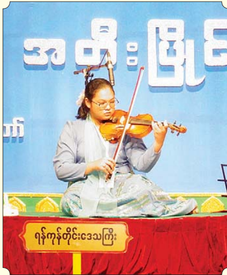
တယော (အတီး)

ပလွေအတီးပြိုင်ပွဲ အဆင့်မြင့်ပညာ (အမျိုးသား) ၌ ပထမဆုရရှိသည့် ရန်ကုန်တိုင်းဒေသကြီးမှ မောင်စောငြိမ်းစစ်မင်း “ကျွန်းကျွန်းပိုင်သ” (ကြိုး) သီချင်းဖြင့် ယှဉ်ပြိုင်စဉ်။