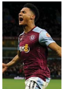
ဝတ်ကင်စ် ဗီလာ (တိုက်စစ်) ၉ ပွဲကစား၊ ၅ ဂိုးသွင်း