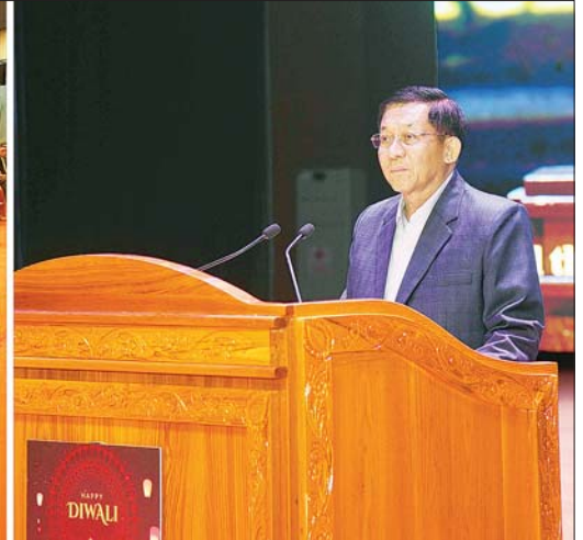
နိုင်ငံတော်စီမံအုပ်ချုပ်ရေးကောင်စီဥက္ကဋ္ဌ နိုင်ငံတော်ဝန်ကြီးချုပ် ဗိုလ်ချုပ်မှူးကြီး မင်းအောင်လှိုင် ဒီပဲလီအထိမ်းအမှတ်အခမ်းအနားတွင် ဆန္ဒပြုဆုဖွဲ့နှံကောင်း စကားပြောကြားစဉ်။

◆ ရှေ့ဖွဲ့မှ အဆိုပါ အခမ်းအနားသို့ နိုင်ငံတော် စီမံအုပ်ချုပ်ရေးကောင်စီဥက္ကဋ္ဌ နိုင်ငံတော်ဝန်ကြီးချုပ် ဗိုလ်ချုပ်မှူးကြီး မင်းအောင်လှိုင်နှင့်အတူ ဇနီး ဒေါ်ကြူကြူလှ၊ ကောင်စီတွဲဖက်အတွင်းရေးမှူး ဗိုလ်ချုပ်ကြီး ရဲဝင်းဦးနှင့် ဇနီး၊ ကောင်စီဝင် ဗိုလ်ချုပ်ကြီး ညိုစောနှင့် ဇနီး၊ ပြည်ထောင်စုဝန်ကြီးများနှင့်ဇနီးများ၊ ရန်ကုန်တိုင်းဒေသကြီး ဝန်ကြီးချုပ်၊ မြန်မာနိုင်ငံဆိုင်ရာ နိုင်ငံတကာသံရုံးများမှ သံအမတ်ကြီးများနှင့် သံရုံးအကြီးအကဲများ၊ ကာကွယ်ရေးဦးစီးချုပ်ရုံးမှ အဆင့်မြင့်တပ်မတော်အရာရှိကြီးများနှင့် ဇနီးများ၊ ရန်ကုန်တိုင်း စစ်ဌာနချုပ်တိုင်းမှူး၊ အသင်းအဖွဲ့များမှ တာဝန်ရှိသူများ၊ ဟိန္ဒူမျိုးနွယ်စုများ၊ ဟိန္ဒူရိုးရာယဉ်ကျေးမှုအဖွဲ့များနှင့် ဖိတ်ကြားထားသည့် ဧည့်သည်တော်ကြီးများ တက်ရောက်ကြသည်။