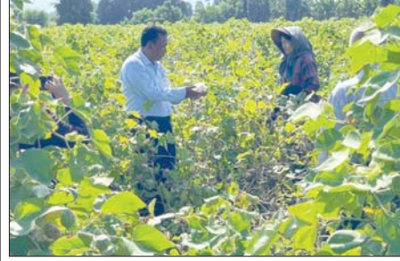
သစ်ပင်စိုက်မှု အရိပ်ရ၏ ရိပ်ခိုနားနေအပန်းပြေ၏