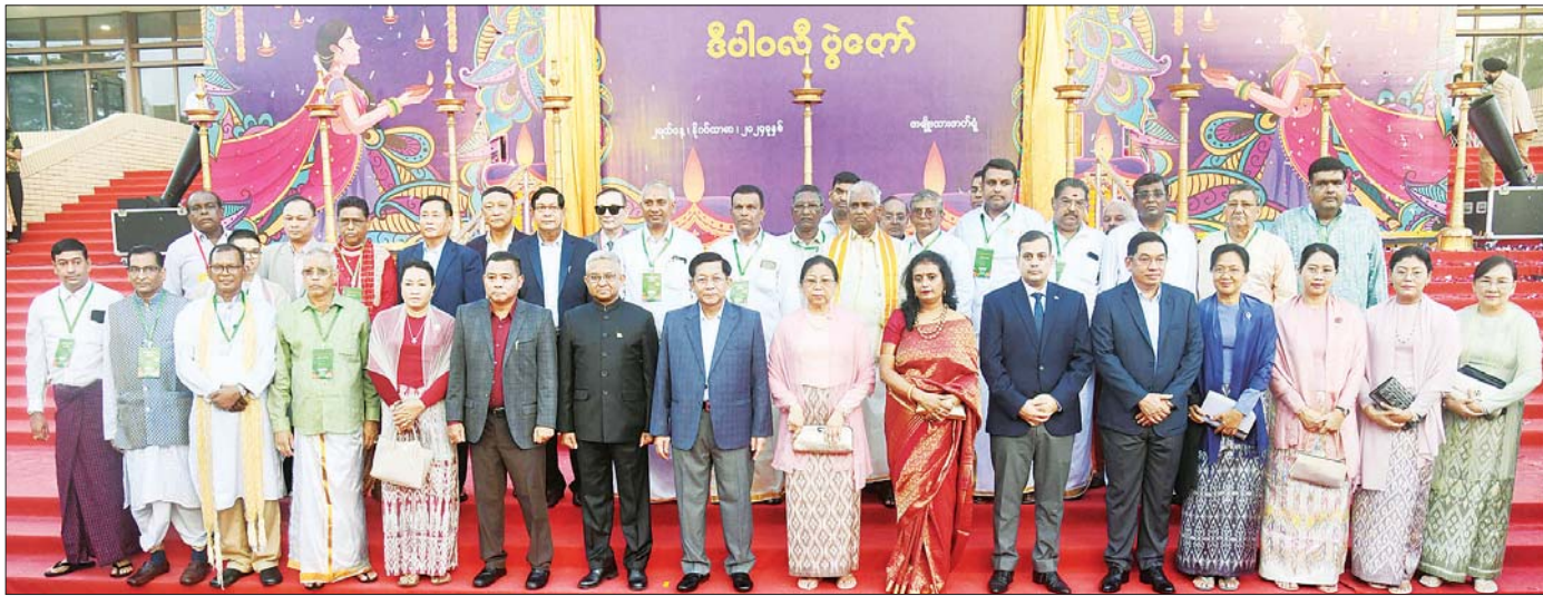
နိုင်ငံတော်စီမံအုပ်ချုပ်ရေးကောင်စီဥက္ကဋ္ဌ နိုင်ငံတော်ဝန်ကြီးချုပ် ဗိုလ်ချုပ်မှူးကြီး မင်းအောင်လှိုင်၊ ဇနီး ဒေါ်ကြူကြူလှနှင့် အခမ်းအနားတက်ရောက်လာကြသူများ ဒီပဲခေါင်အထိမ်းအမှတ်အခမ်းအနားတွင် စုပေါင်း မှတ်တမ်းတင်ဓာတ်ပုံရိုက်စဉ်။

( ၃-၉-၂၀၂၄ ရက်နေ့တွင် နိုင်ငံတော်စီမံအုပ်ချုပ်ရေးကောင်စီဥက္ကဋ္ဌ နိုင်ငံတော်ဝန်ကြီးချုပ် ဗိုလ်ချုပ်မှူးကြီး မင်းအောင်လှိုင် ရှမ်းပြည်နယ်အစိုးရအဖွဲ့ဝင်များ၊ ပြည်နယ်နှင့် ခရိုင်အဆင့်ဌာနဆိုင်ရာတာဝန်ရှိသူများအား ပြောကြားသည့် အမှာစကားမှ ကောက်နုတ်ချက် )