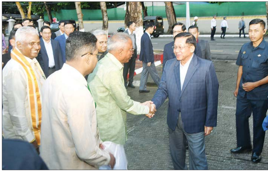
နိုင်ငံတော်စီမံအုပ်ချုပ်ရေးကောင်စီဥက္ကဋ္ဌ နိုင်ငံတော်ဝန်ကြီးချုပ် ဗိုလ်ချုပ်မှူးကြီး မင်းအောင်လှိုင် ဒီပဲခေါင်အထိမ်းအမှတ်အခမ်းအနား တက်ရောက်လာကြသည့် ဟိန္ဒူမျိုးနွယ်စုများ၊ ဟိန္ဒူရောယဉ်ကျေးမှုအဖွဲ့များအား ရင်းရင်းနှီးနှီး နှုတ်ဆက်စဉ်။

သည့် လမ်းကြောင်းပေါ်အမြန်ဆုံး ပြန်လည်ရောက်ရှိစေရေး ဝိုင်းဝန်း ဆောင်ရွက်ပေးကြရန်လိုကြောင်း။ လိုအပ်ချက်များကို ဖြည့်ဆည်းဆောင်ရွက်ပေး မိမိတို့နိုင်ငံတွင် မတူညီမှုများ ကွဲပြားမှုများရှိနေသည့် မှန်သော် လည်း အဆိုပါမတူကွဲပြားမှုများကို စုစည်းစည်း ရုံးနိုင်ခြင်းကသာ အင်အားကို ဖြစ်စေပါကြောင်း၊ ထိုကဲ့သို့ စုစည်းသည့်အင်အား ရရှိစေရေး မိမိတို့တိုင်တိုင်ဆောင် ပြီး ဆောင်ရွက်လျက်ရှိပါကြောင်း၊ မိမိအနေဖြင့် မြန်မာပြည်ဖွား အိန္ဒိယလူမျိုးစုအဖွဲ့အစည်းများ၊ တရုတ်လူမျိုးစုအဖွဲ့အစည်းများ နှင့် မိမိ၏ ကိုယ်စားလှယ်များ တွေ့ဆုံစေခဲ့ကြောင်း၊ အဆိုပါအဖွဲ့ အစည်းများ၏ လိုအပ်ချက်များ ကို မေးမြန်းပြီး ဖြည့်ဆည်း ဆောင်ရွက်ပေးခဲ့သည့်အပြင် ၎င်း တို့၏ သုံးသပ်ချက်များအပေါ် အဖြေရှာ ဆောင်ရွက်ပေးခဲ့ ကြောင်း၊ စာမျက်နှာ ၆ သို့