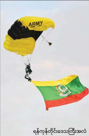
ရန်ကုန်တိုင်းဒေသကြီးအလံ