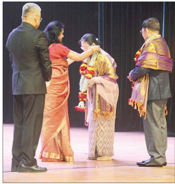
နိုင်ငံတော်စီမံအုပ်ချုပ်ရေးကောင်စီဥက္ကဋ္ဌ နိုင်ငံတော်ဝန်ကြီးချုပ် ဗိုလ်ချုပ်မှူးကြီး မင်းအောင်လှိုင်နှင့် ဇနီး ဒေါ်ကြူကြူလှတို့အား မြန်မာနိုင်ငံဆိုင်ရာ အိန္ဒိယနိုင်ငံ သံအမတ်ကြီးနှင့် ဇနီးတို့က မင်္ဂလာဂုဏ်ပြုပဝါနှင့် ပန်းကုံးကို ဂါရဝပြုဆင်မြန်းပေးစဉ်။

□ ယခုနှစ်ကျင်းပသည့် ဒီပဲလီလီနုအထိမ်းအမှတ်အခမ်းအနားသည်လည်း ယခင်နှစ်များနှင့်မတူဘဲ မြန်မာနိုင်ငံအတွင်း၌ရှိသည့် ဟိန္ဒူဘာသာရေးအဖွဲ့အစည်းများအပါအဝင် လူမှုရေးအဖွဲ့အစည်းများ အားလုံးနှင့် ဘာသာဝင်များ၊ အခြားသောဘာသာဝင်များ စုပေါင်းပြီး စည်ကားသိုက်မြိုက်စွာ ကျင်းပဆောင်ရွက်သွားခြင်းဖြစ်ကြောင်း၊ ယင်းသည် မိမိတို့နိုင်ငံအတွင်း၌ရှိသည့် မတူကွဲပြားသည့် ဘာသာဝင်များအကြား သင့်မြတ်ညီညွတ်မှုကို ပြသနေခြင်းဖြစ်သည်ဟု ယုံကြည်ပါကြောင်း၊ ဟိန္ဒူဘာသာဝင်များအားလုံး စုစည်းစည်း ပါဝင်ဆင်နွှဲခြင်းသည် မှတ်တိုင်တစ်ခုဖြစ်သည့်အတွက် မိမိအနေဖြင့် အထူးပင်ဝမ်းမြောက်ဂုဏ်ယူပါကြောင်းကို ပြောကြားလို