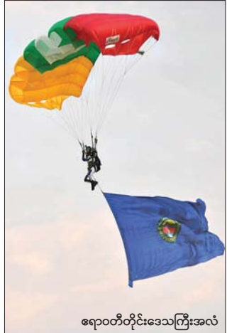
ဧရာဝတီတိုင်းဒေသကြီးအလံ