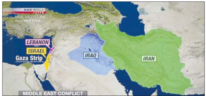
လိုက်သည်။ ယင်းနေ့တွင်ပင် အစ္စရေးဝန်ကြီးချုပ် သည့် စွမ်းဆောင်ရည်ရှိကြောင်း ပြောကြားကာ ဘင်ဂျမင်နေတန်ယာဟုက အစ္စရေးနိုင်ငံတွင် အီရန် သတိပေးချက် ထုတ်ပြန်ခဲ့သည်။ နိုင်ငံ၏ မည်သည့်နေရာဒေသကိုမဆို ရောက်ရှိနိုင် အင်န်အိတ်ချ်ကေ

ခြေရှိကြောင်း အီရန်တာဝန်ရှိသူများ၏ ပြောကြားချက်ကို နယူးယောက်တိုင်းခံက ကိုးကားဖော်ပြသည်။ ယင်းတိုက်ခိုက်မှုမှာ ပြီးခဲ့သည့်သီတင်းပတ်က အီရန်စစ်ဘက်ဆိုင်ရာ အဆောက်အအုံများ တိုက်ခိုက်ခံရမှုနှင့်ပတ်သက်ပြီး အစ္စရေးလေကြောင်း တိုက်ခိုက်မှုကို လက်တွဲပြန်တိုက်ခိုက်ခြင်း ဖြစ်နိုင်သည်ဟု ဆိုသည်။ ယင်းတိုက်ခိုက်မှု မတိုင်မီ အောက်တိုဘာ ၁ ရက်တွင် အီရန်က အစ္စရေးကို အကြီးစား ခုံးကျည်ဖြင့် ပစ်ခတ်တိုက်ခိုက်မှုများ လုပ်ဆောင်ခဲ့သည်။ အစ္စလာမစ်တော်လှန်ရေး အစောင့်တပ်စစ်ဦးစီးချုပ် ဗိုလ်ချုပ် ဟောဆိန်းဆလာဗီသည် အောက်တိုဘာ ၃၁ ရက်က ၎င်း၏ မိန့်ခွန်းတွင် အစ္စရေးအနေဖြင့် မမျှော်မှန်းထားလောက်သော တုံ့ပြန်မှုမျိုးကို ကြုံတွေ့ရလိမ့်မည်ဟု ပြောကြား