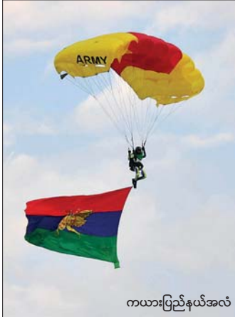
ကယားပြည်နယ်အလံ