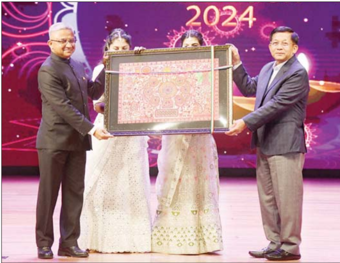
နိုင်ငံတော်စီမံအုပ်ချုပ်ရေးကောင်စီဥက္ကဋ္ဌ နိုင်ငံတော်ဝန်ကြီးချုပ် ဗိုလ်ချုပ်မှူးကြီး မင်းအောင်လှိုင်နှင့် မြန်မာ နိုင်ငံဆိုင်ရာအိန္ဒိယနိုင်ငံ သံအမတ်ကြီးတို့ အမှတ်တရလက်ဆောင်ပစ္စည်းများ အပြန်အလှန်ပေးအပ်ကြစဉ်။

ထို့ကြောင့် ယခုကဲ့သို့ ဟိန္ဒူ ဘာသာဝင်များ၏မင်္ဂလာအပေါင်း နှင့်ပြည့်စုံသည့် ဆိမ်းထွန်းညှိ ပူဇော်ခြင်းပွဲတော်ကာလမှစပြီး မိမိတို့ နိုင်ငံသားအားလုံးက တစ်ဦးအပေါ်တစ်ဦး ချစ်ခင် လေးစားမှု၊ နားလည်ခွင့်လွှတ်မှု