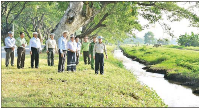
အပိုင်း(၂) တည်ဆောက်ရေးလုပ်ငန်း ဆောင်ရွက် နေပြည်တော်ကောင်စီဥက္ကဋ္ဌက လုပ်ငန်းများ နေ့မှနေ့အခြေအနေများကို သွားရောက်ကြည့်ရှုစစ်ဆေး ဆောင်ရွက်ရာတွင် သတ်မှတ်စီမံချိန်စံညွှန်းပြည့်မီ ရာ တာဝန်ရှိသူများက လုပ်ငန်းများဆောင်ရွက် ရေး၊ သတ်မှတ်ကာလအတွင်းပြီးစီးရေးနှင့် လိုအပ်နေမှုအခြေအနေများကို ရှင်းလင်းတင်ပြကြပြီး သည့်များမှာကြားခဲ့ကြောင်း သိရသည်။ သတင်းစဉ်

ထပ်တိုးရယူရန် အကောင်အထည်ဖော်တည်ဆောက်မည့် စီမံကိန်းလုပ်ငန်း လျာထားမှုများကို ကြည့်ရှုစစ်ဆေးပြီး နေပြည်တော်ကောင်စီဥက္ကဋ္ဌက လုပ်ငန်းအစီအမံများကို ရေရှည်မျှော်မှန်းပြီး စနစ်တကျ ရေးဆွဲဆောင်ရွက်ထားရှိရန်နှင့် ယခုတိုးချဲ့ရေးပေးရေးစီမံကိန်းသည် စိုက်ပျိုးရေးအတွက် အဓိကတည်ဆောက်ထားသော ချောင်းမငယ်ဆည်မှ ရေကို မျှဝေသုံးစွဲရသည့်အတွက် မိုးနည်းပါးသည့်နှစ်များတွင် သောက်သုံးရေပြတ်လပ်မှုမရှိစေရေး သက်ဆိုင်ရာဌာနများနှင့် ကြိုတင်ညှိနှိုင်းဆောင်ရွက်ထားရန် မှာကြားသည်။ ယင်းနောက် နေပြည်တော် ဇေယျာသီရိမြို့နယ် သုခသိဒ္ဓိရပ်ကွက် သုခတော်ဝင်အိမ်ရာစီမံကိန်း