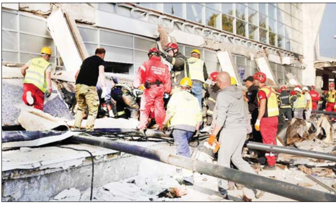
ရထားဘူတာရုံခေါင်မိုးပြိုကျရာနေရာ၌ ကယ်ဆယ်ရေးလုပ်သားများကို တွေ့ရစဉ်။

ဘယ်လ်ဂျီယံ နိုဝင်ဘာ ၂ ဆားဘီးယားနိုင်ငံ နိုမီဆတ်ဒ် ရထားဘူတာရုံ၌ နိုဝင်ဘာ ၁ ရက်က အမှီးပြိုကျမှုဖြစ်ပွားခဲ့ရာ ၁၃ ဦးထက်မနည်း သေဆုံးခဲ့သည်ဟု ဆားဘီးယားပြည်ထဲရေး ဝန်ကြီး အင်ဗစ်ဆာဒါဆစ်က ပြည်တွင်း မီဒီယာတွင် ကြေညာချက်ထုတ်ပြန်ခဲ့သည်။ အဆိုပါ ဖြစ်ရပ်မှ သုံးဦးကို ကယ်တင်နိုင်ခဲ့ပြီး ဆေးရုံသို့ ပို့ဆောင်ခဲ့ကြောင်း ၎င်းက ပြောသည်။ အမျိုးသမီး နှစ်ဦးမှာ အပျက်အစီးများ အောက်တွင် ပိတ်မိနေကြောင်း ကယ်ဆယ်ရေးသမားများနှင့် အဆက်အသွယ်ရရှိပြီးဖြစ်ကြောင်း သိရသည်။ အရေးပေါ် ကယ်ဆယ်ရေး လုပ်သားများမှာ မိနစ်အနည်းငယ်အတွင်း အခင်းဖြစ်ပွားရာနေရာသို့ ရောက်ရှိခဲ့ပြီး ဖြိုပေါင်းများစွာမှ