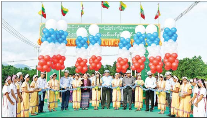
ဖဲကြိုးဖြတ်ဖွင့်လှစ်ပေးကြပြီး (အပေါ်ပုံ) မိမိမွေးမြူရေးဇုန်အတွင်း ကျောက်ချောလမ်းသစ်များကို လိုက်လံကြည့်ရှုစစ်ဆေးခဲ့ကြသည်။

ဘားအံ နိုဝင်ဘာ ၂ (၆၉)နှစ်မြောက် ကရင်ပြည်နယ်နေ့ကို ကြိုဆိုဂုဏ်ပြုသောအားဖြင့် သမဝါယမနှင့် ကျေးလက်ဖွံ့ဖြိုးရေး ဝန်ကြီးဌာန ကရင်ပြည်နယ်ကျေးလက်လမ်းဖွံ့ဖြိုးရေးဦးစီးဌာန မိမိမွေးမြူရေးဇုန် ကျောက်ချောလမ်းသစ်များဖွင့်ပွဲကို နိုဝင်ဘာ ၂ ရက်က အဆိုပါ ကျောက်ချောလမ်းသစ်များဖွင့်ပွဲ နှိုင်းပညာသည်။ ဦးစွာ ကရင်ပြည်နယ်ဝန်ကြီးချုပ် ဦးစောမြင့်ဦး၊ ပြည်နယ်တရားလွှတ်တော် တရားသူကြီးချုပ် ဒေါ်ခင်ဆွေထွန်း၊ ပြည်နယ်အစိုးရအဖွဲ့ဝင်များက ၂၀၂၄-၂၀၂၅ ဘဏ္ဍာနှစ် ပြည်နယ်ငွေလုံးငွေရင်းရန်ပုံငွေကျပ် ၅၇၀ ဒသမ ၄၅၂ သန်းဖြင့် ဇွဲကပင် မေမေကုမ္ပဏီ၊ ငွေကမ္ဘာအောင်ကုမ္ပဏီ၊ သပြေသုကုမ္ပဏီ၊ ကောင်းမြတ်အောင်ကျော်ကုမ္ပဏီတို့က တာဝန်ယူဆောင်ရွက်သော မိမိမွေးမြူရေးဇုန်ပင်မ အဝင်လမ်း၊ ဇုန်အတွင်းလမ်း၊ ဇုန်ပတ်လမ်း ကျောက်ချောလမ်းသစ်များ ၄ မိုင် ၅ ဒသမ ၄ ဖာလုံနှင့် ကွန်ကရစ်တံတားတစ်စင်း အကျယ်ချဲ့ခြင်းတို့ကို