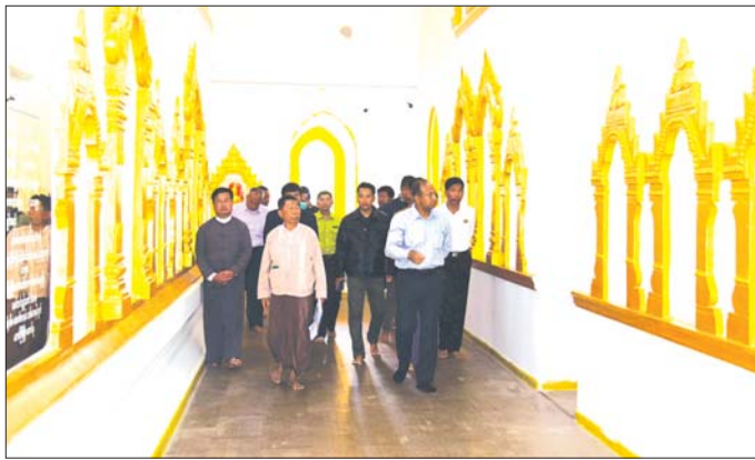
မည်နေရာကို ကြည့်ရှုစစ်ဆေးခဲ့ကြောင်းနှင့် ကျင်းပမည့် အဝေရာမီးပွဲကျင်းပမှုကို သက်ဆိုင်ရာ လာမည့် တနင်္လာနေ့တွင် စုဋ္ဌာမုနိလောကချမ်းသာ ဘုရားရင်ပြင်အား မီးသတ်တပ်ဖွဲ့က သန့်ရှင်းရေး ဆောင်ရွက်ပေးသွားမည်ဖြစ်ကြောင်း သိရသည်။ ယင်းနောက် ပြည်နယ်ဝန်ကြီးချုပ်နှင့် အဖွဲ့သည် ၂၀၂၄ ခုနှစ် တောင်ကြီးတန်ဆောင်တိုင်ပွဲတော်

သည်တောင်ကြီးမြို့၊ စုဋ္ဌာမုနိလောကချမ်းသာဘုရား အတက်လမ်းဘေးရှိ အများပြည်သူအပန်းဖြေလေ့ကျင့်ခန်းဆောင်ရွက်သည့်နေရာကို ကြည့်ရှုစစ်ဆေးရာ သန့်ရှင်းမှုရှိစေရန်နှင့် အပန်းဖြေနေသည့်နေရာ၌ သစ်ကိုင်းသစ်ခက်မလွတ်မှုကို ရှင်းလင်းဆောင်ရွက်ရန်နှင့် ရွှေရောင်အေးလမ်းဘေးရှိ အသုံးမပြုသည့် လျှပ်စစ်မီးတိုင်များ စနစ်တကျ ရှင်းလင်းဆောင်ရွက်ထားရှိရန် သက်ဆိုင်ရာဌာနများအား မှာကြားခဲ့သည်။ ထို့နောက် ပြည်နယ်ဝန်ကြီးချုပ်နှင့် အဖွဲ့သည် တောင်ကြီးမြို့၊ စုဋ္ဌာမုနိလောကချမ်းသာဘုရားသို့ သွားရောက်၍ ပန်း၊ ရေချမ်းဆက်ကပ်ပစ္စည်းဖြေကြည်ညိုပြီး စုဋ္ဌာမုနိဘုရားအတွင်း၊ အပြင်ဘက်စုံမွမ်းမံပြုပြင်ဆောင်ရွက်နေမှုကို ကြည့်ရှုစစ်ဆေးရာ (ယာယုံ) ပြည်နယ်ဝန်ကြီးချုပ်က မကြာမီ ၂၀၂၄ ခုနှစ်တောင်ကြီးတန်ဆောင်တိုင်ပွဲတော် ကျင်းပမည့် ဖြစ်၍ ပွဲတော်အမိပြီးစီးနိုင်ရန်နှင့် ဘုရားအပြင်ဘက်ရှိ အုတ်တိုင်တိုင်းနံရံ အဖြူရောင်အောက်ခြေအား ညစ်ပေခြင်းမရှိစေရန် အညီရောင်ကတတ်ဆေးသတ် ဆောင်ရွက်နိုင်ရန် တာဝန်ရှိသူများအား မှာကြားပြီး မသုံးသန့်ရက်လုပ်ပြိုင်ပွဲ ဆောင်ရွက်