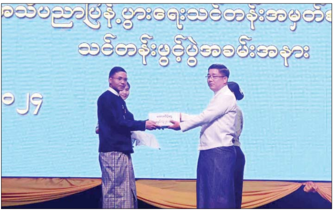
အတွက် ထောက်ပံ့ပေးပေးအပ်ရာ ပြည်နယ်ဥပဒေအရာရှိ ဦးသိန်းထွန်းက လက်ခံရယူပြီး(အပေါ်ပုံ) ပြည်နယ်ဥပဒေအရာရှိက သင်တန်းဖွင့်ပွဲအခမ်းအနားနှင့်စပ်လျဉ်း၍ ရှင်းလင်းတင်ပြသည်။ သင်တန်းတွင် ပြည်နယ်အတွင်း ဌာနဆိုင်ရာ အရာထမ်း ၁၀၀ တက်ရောက်ပြီး သင်တန်းကာလမှာ သုံးရက်တာ ကြာမြင့်မည်ဖြစ်ကာ ဥပဒေ ၁၇ မျိုးကို ပို့ချသွားမည်ဖြစ်သည်။

လှိုင်ကော် နိုဝင်ဘာ ၂ ကယားပြည်နယ်အစိုးရအဖွဲ့ ကြီးကြပ်မှုဖြင့် ကယားပြည်နယ်ဥပဒေအသိပညာ ပြန့်ပွားရေးသင်တန်းအမှတ်စဉ်(၂/၂၀၂၄) ဖွင့်ပွဲအခမ်းအနားကို ယနေ့နံနက်ပိုင်းက လှိုင်ကော်မြို့ ပြည်နယ်ခန့်မှန်းမဏ္ဍိုင်ကျင်းပရာ ပြည်နယ်ဝန်ကြီးချုပ် ဦးဇော်မျိုးတင်၊ ဒေသတွင်းအဖွဲ့အစည်းများ၊ ပြည်နယ်အစိုးရအဖွဲ့ဝင်များ၊ ဌာနဆိုင်ရာများနှင့် သင်တန်းသားသင်တန်းသူများ တက်ရောက်သည်။ ဦးစွာ ပြည်နယ်ဝန်ကြီးချုပ်က ဌာနဆိုင်ရာအဖွဲ့အစည်းများအနေဖြင့် နိုင်ငံတော်နှင့် ပြည်နယ်အစိုးရအဖွဲ့၏ အားထားရသည့်ဌာနအဖွဲ့အစည်းများအဖြစ် ရပ်တည်နိုင်ရေး ကြိုးပမ်းဆောင်ရွက်သွားရန်၊ သင်တန်းသား သင်တန်းသူများအနေဖြင့်လည်း သင်တန်းတွင် ပို့ချလိုက်သော ဥပဒေအသိပညာများကို လုပ်ငန်းခွင်တွင် လက်တွေ့အသုံးပြုနိုင်ရေး ကြိုးစားလေ့လာမှတ်သားကြရန် တိုက်တွန်းလိုကြောင်း ပြောကြားသည်။ ယင်းနောက် ပြည်နယ်ဝန်ကြီးချုပ်က သင်တန်း