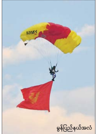
မွန်ပြည်နယ်အလံ