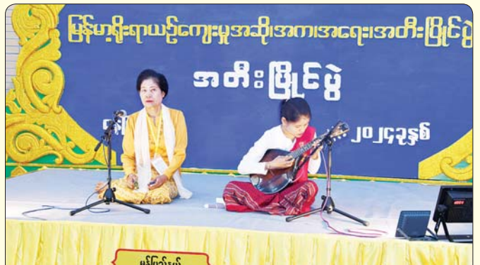
မယ်ဒလင် (အတီး)

ဂီတာအတီးပြိုင်ပွဲ အခြေခံပညာ (အမျိုးသမီး အသက် ၁၅ နှစ်မှ ၂၀ နှစ်အတွင်း) ၌ ပထမဆုရရှိသည့် မကွေးတိုင်းဒေသကြီးမှ မအိမိဆည်းဆာ (ခ) သွန်းဆည်းဆာ “စံရာတောင်ကျွန်း” (ကြိုး) သီချင်းဖြင့် တီးခတ်ယှဉ်ပြိုင်စဉ်။