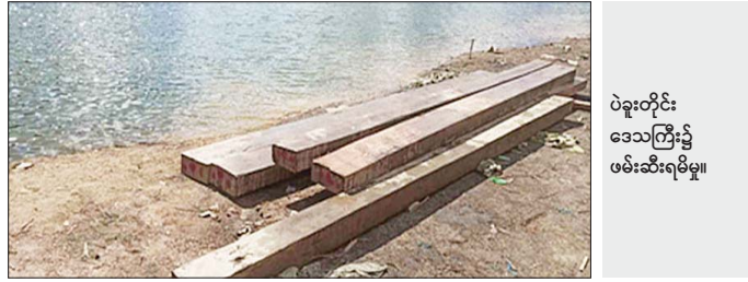
ပဲခူးတိုင်း ဒေသကြီး၌ ဖမ်းဆီးရမိမှု။