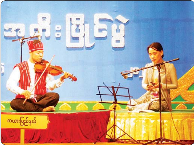
တယော(အတီး)

နံအတီးပြိုင်ပွဲ ဝါသနာရှင် အဆင့်မြင့်ပညာ (အမျိုးသား)၌ ပထမဆုရရှိသည့် မန္တလေးတိုင်းဒေသကြီးမှ မောင်ကောင်းခန့်ဇော် “မိုင်းရိပ်ကယ်တည့်” (ကြိုး) သီချင်းဖြင့် ယှဉ်ပြိုင်စဉ်။