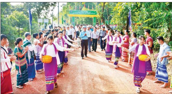
ထိုနေ့က ပြည်နယ်ဝန်ကြီးချုပ်၊ ပြည်နယ်တရားလွှတ်တော် တရားသူကြီးချုပ်၊ ပြည်နယ် အစိုးရအဖွဲ့ဝင်များက ခွင့်ပြုရန်ပုံငွေကျပ် ၃၂၆ သန်းဖြင့် Box Culvert ရှစ်စင်း ပါဝင်သော ကန်ပတ်လမ်းအရှည် ၁ မိုင် ၄ ဖာလုံအား ဖဲကြိုးဖြတ်ဖွင့်လှစ်ပေးပြီး ကန်ပတ်လမ်းသစ်ကို ဖြတ်သန်း ကြည့်ရှုစစ်ဆေး သည်။(အပေါ်ပုံ) ယခုကဲ့သို့ ရသဝေါအင်း ကန်ပတ်လမ်းသစ်ကို အဆင့် မြင့်တင် ဆောင်ရွက်နိုင်ခဲ့သည့် အတွက် အနီးပတ်ဝန်းကျင်ရှိ ကျေးရွာများမှ စိုက်ပျိုးထောင်သူ များအတွက် ထုတ်ကုန်များ သယ်ယူရာတွင် လျင်မြန်ချောမွေ့ စွာ သယ်ယူပို့ဆောင်နိုင်မည်ဖြစ် ပြီး ဒေသခံနှင့်ခရီးသွားပြည်သူများ အနေဖြင့် ရသဝေါကန်၏ သဘာဝ အလှများကို ကြည့်ရှုခံစား အပန်းဖြေနိုင်သည့် နေရာတစ်ခု ဖြစ်လာပြီး ဒေသထုတ်ကုန်များ ရောင်းဝယ်ခြင်းဖြင့် ဒေသဖွံ့ဖြိုး

ရေးအတွက်လည်း များစွာ အထောက်အကူပြုနိုင်မည် ဖြစ်ကြောင်း သိရသည်။ ဆက်လက်၍ ပြည်နယ် ဝန်ကြီးချုပ်နှင့် အဖွဲ့သည် ပြည်နယ် ပြည်သူ့ဆေးရုံကြီး (ဘားအံ) ရောဂါဗေဒဌာန၌ (၃၆) နှစ်မြောက် အထွေထွေ ခရိုင်(ပြန်/ဆက်)