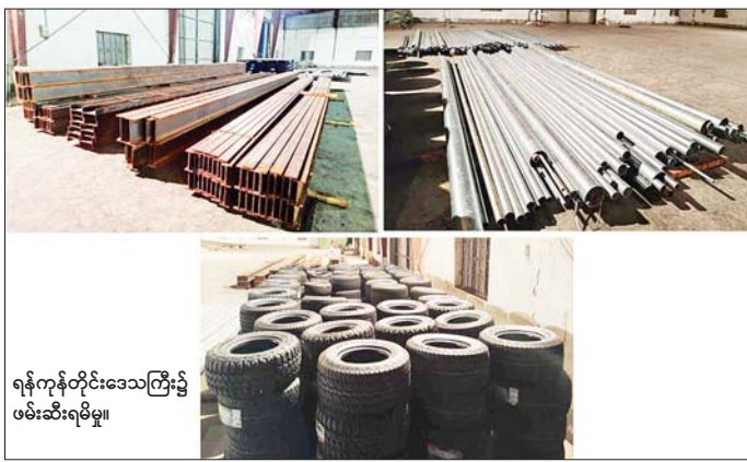
ရန်ကုန်တိုင်းဒေသကြီး၌ ဖမ်းဆီးရမိမှု။

အေးရှားဝေါလ်ကုန်သေတ္တာ စစ်ဆေးရေးစခန်း၌ ကုန်သေတ္တာ ၁၉ လုံးအတွင်းမှ တရားဝင်စာရွက်စာတမ်းအထောက်အထား တင်ပြနိုင်ခြင်းမရှိသည့် လုပ်ငန်းသုံးပစ္စည်း ငါးမျိုး၊ လူသုံးကုန်ပစ္စည်း နှစ်မျိုး (ခန့်မှန်းတန်ဖိုးငွေကျပ် ၁၀၈၆၁၈၇၂၆၉)ကို လည်းကောင်း၊ မြန်မာ့စက်မှုဆိပ်ကမ်း၌ ကုန်သေတ္တာတစ်လုံးအတွင်းမှ တရားဝင်စာရွက်စာတမ်းအထောက်အထား တင်ပြနိုင်ခြင်းမရှိသည့် လုပ်ငန်းသုံးပစ္စည်းတစ်မျိုး (ခန့်မှန်းတန်ဖိုးငွေကျပ် ၆၈၀၄၀၀၀)ကိုလည်းကောင်း၊ ရန်ကုန်အပြည်ပြည်ဆိုင်ရာလေဆိပ်၌ တရားဝင်စာရွက်စာတမ်းအထောက်အထားတင်ပြနိုင်ခြင်းမရှိသည့် လုပ်ငန်းသုံးပစ္စည်း