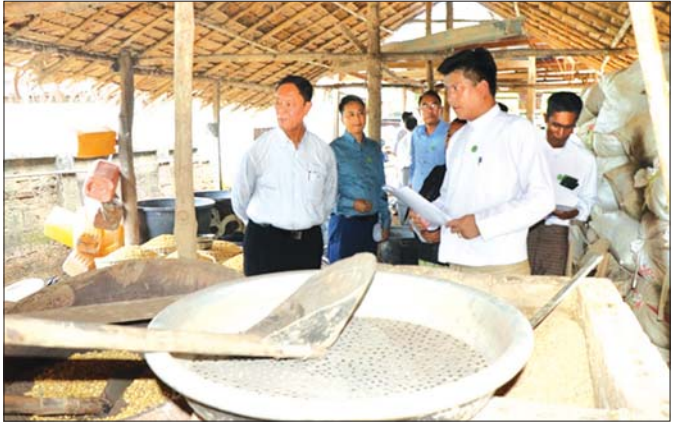
ပြည်ထောင်စုဝန်ကြီး ဦးလှမိုး ကျွန်းဦးစံပြကျေးရွာရှိ ပဲလှော်ဖို၌ လုပ်ငန်းပြန်လည် လည်ပတ်နေမှုကို ကွင်းဆင်းစစ်ဆေးစဉ်။

ဌာနဆိုင်ရာအားလုံးရဲ့ ပူးပေါင်းဆောင်ရွက်မှု၊ နေပြည်တော်ကောင်စီရုံးကြီးကြပ်မှု၊ ကျေးရွာသူ ကျေးရွာသားတွေရဲ့ ကြံကြံခံတုံ့ပြန်ဆောင်ရွက်မှု တွေကြောင့် ခေတ်မိစံပြကျေးရွာဖြစ်တဲ့ ကျွန်းဦး ကျေးရွာဟာ ပြန်လည်နိုးထလာခဲ့ပါပြီ။ ပေါင်းစည်း ညီညွတ်မှု၊ ကျေးရွာရဲ့ပူးပေါင်းပါဝင်မှုတွေရဲ့ အမြင် သာဆုံးသော အကျိုးရလဒ်ဖြစ်ပါတယ်။ ကျွန် ရေးသားသူ့ ကျေးရွာတွေလည်း အမျိုးသားသာမန် ဘေးအန္တရာယ်ဆိုင်ရာ စီမံခန့်ခွဲမှုကော်မတီရဲ့ ဦးဆောင်မှုနဲ့ များမကြာမီအချိန်အတွင်းမှာ အင်တိုက်အားတိုက်ဆိုသလို နိုးထလာကြတော့မှာ မလွဲစကန်ဖြစ်ပါကြောင်း ရေးသားတင်ပြလိုက်ရ ပါတယ်။ ။