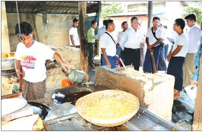
ပြည်ထောင်စုဝန်ကြီး ဦးလှမိုး ကျွန်းဦးစံပြကျေးရွာရှိ ပဲလှော်ဖို၌ လုပ်ငန်းပြန်လည် လည်ပတ်နေမှုကို ကွင်းဆင်းစစ်ဆေးစဉ်။

၁၈-၉-၂၀၂၄ ရက်နေ့မှာ ရေဘေးကယ်ဆယ် ရေးအတွက် ပြည်ထောင်စုဝန်ကြီး ကွင်းဆင်းခရီး စဉ်နဲ့ ကျွန်းဦးကျေးရွာကိုရောက်တော့ အကြော်ဖို အားလုံး ရေကြီးနစ်မြုပ်ခဲ့ပြီး ကုန်ကြမ်းတွေအားလုံး ရေမြုပ်ပျက်စီးခဲ့ကြောင်း၊ အသေးစားလုပ်ငန်းတွေ ဖြစ်တဲ့ ပဲလှော်ဖိုတွေ ပြန်လည်လည်ပတ်နိုင်ရေး အတွက် ပြန်လည်ပြင်ဆင်ဖို့နဲ့ ကုန်ကြမ်းအတွက် အရင်းအနှီးတွေ လိုအပ်ကြောင်း ကျေးရွာက တင်ပြ ကြပါတယ်။ အသက်စမ်းကျောင်း ပြန်လည် ထူထောင်ရေးကော်မတီဥက္ကဋ္ဌလည်း ဖြစ်တဲ့ ပြည်ထောင်စုဝန်ကြီးက ပဲလှော်ဖိုတွေ ပြန်လည် ပြင်ဆင်လည်ပတ်နိုင်ရေးအတွက် သမဝါယမပုံစံ အသင်းအဖွဲ့တွေ ဖွဲ့စည်းပြီး ဆောင်ရွက်မယ်ဆိုပါက