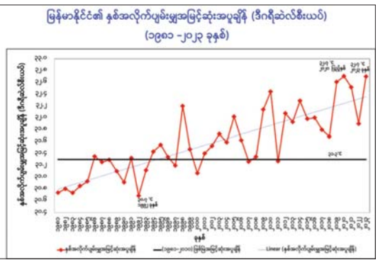
မြန်မာနိုင်ငံ၏ နှစ်အလိုက် ပျမ်းမျှအမြင့်ဆုံး အပူချိန် (ဒီဂရီဆဲလ်စီးယပ်) (၁၉၈၁-၂၀၂၃)

မြန်မာနိုင်ငံလူဦးရေ၏ ၇၀ ရာခိုင်နှုန်းသည် လယ်ယာထွက်ကုန်၊ မွေးမြူရေးနှင့် ရေထွက်ပစ္စည်းလုပ်ငန်းများ အပေါ်တွင် မှီခိုနေသောကြောင့် ၎င်းတို့၏ စားဝတ်နေရေး ဖူလုံကြွယ်ဝမှုသည် သင့်တင့်မျှတသော ရာသီဥတုအခြေအနေပေါ်တွင် များစွာမူတည်လျက်ရှိပါသည်။ တစ်နည်းဆိုရသော် အစွန့်ရောက်ရာသီဥတုဖြစ်စဉ်များနှင့် သဘာဝဘေးဒဏ်များသည် မြန်မာ့စီးပွားရေး၊ ဖွံ့ဖြိုးတိုးတက်ရေးတို့အပေါ် ထိခိုက်လွယ်ပြီး သက်ရောက်မှုများစွာ ရှိစေပါသည်။