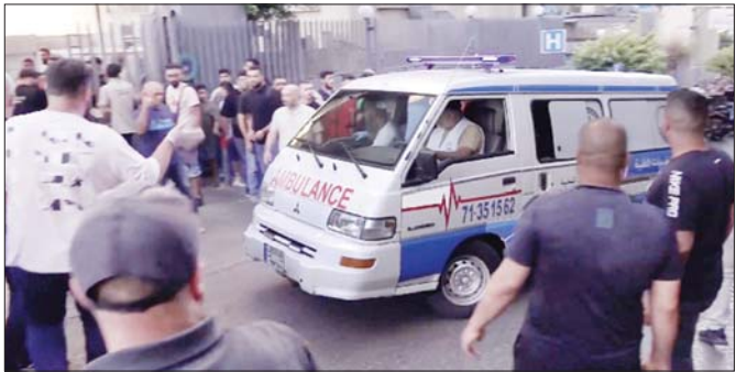
လာရသူဖြစ်သည်။ အဆိုပါအမျိုးသားမှာ ခိုလှုံရာနေရာ၌ ကူညီရေးအဖွဲ့အစည်းတစ်ခု၏ အထောက်အပံ့ဖြင့် နေထိုင်နေသူလည်းဖြစ်သည်။ သမီးဖြစ်သူ၏ အခြေအနေ ပို၍ဆိုးရွားလာမည်ကို စိုးရိမ်နေရသည်ဟု အဆိုပါအမျိုးသားက ပြောသည်။ ဆင်ဟွာ

အချို့သောလူနာများမှာ ၎င်းတို့လိုအပ်သည့် ကုသမှုများကို မရရှိကြကြောင်း၊ အသက်နှစ်လအရွယ်ကလေးမှာ ဖျားနာမှုကြောင့် ဆေးရုံတက်နေရသော်လည်း မည်သည့်ကုသမှုမှ ခံယူရခြင်း မရှိသေးကြောင်း ၎င်း၏ဖခင်က ပြောသည်။ ဖခင်ဖြစ်သူမှာလည်း တိုက်ပွဲများကြောင့် နေရပ်စွန့်ခွာ