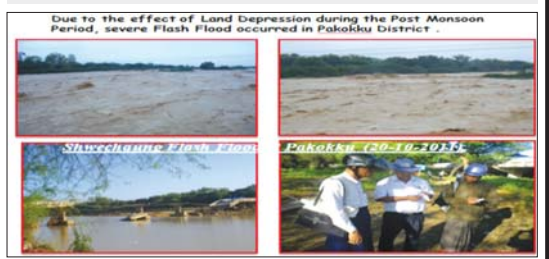
၂၀၁၁ ခုနှစ် အောက်တိုဘာလတွင် မုန်တိုင်းငယ်တစ်ခု မြန်မာနိုင်ငံအတွင်းသို့ ဖြတ်ကျော်ဝင်ရောက်ခဲ့ရာမှတစ်ဆင့် တောင်ကျချောင်းရေများကြောင့် ပခုက္ကူ မြို့နယ်အတွင်း လျှပ်တစ်ပြက် ရေကြီးရေလျှံမှုများဖြစ်ပွားခဲ့ပုံ။