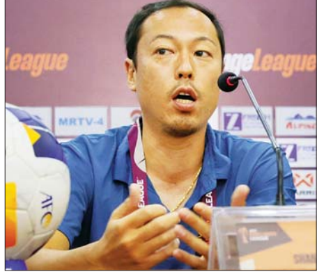
ရှမ်းယူနိုက်တက်အသင်းနည်းပြချုပ် ဟိရိုရှီ

ကွာတားဖိုင်နယ် တက်ရောက်ခွင့်ရ ရှမ်းယူနိုက်တက်အသင်းနှင့် တိုင်နန်စီးစီးအသင်းသည် နိုဝင်ဘာ ၂ ရက် ညနေ ၄ နာရီတွင် သုဝဏ္ဏကွင်း၌ ယှဉ်ပြိုင်ကစားမည်ဖြစ်သည်။ အုပ်စု (D)တွင် ရှမ်းယူနိုက်တက်နှင့် တိုင်နန်စီးစီးအသင်းသည် သုံးမှတ်စီရထားပြီး ထိပ်တိုက်မတွေ့ဆုံစိကတည်းက ကွာတားဖိုင်နယ် တက်ရောက်ခွင့်ရထားကာ ယခုတွေ့ဆုံမည့်ပွဲတွင် အုပ်စုပထမနေရာ အတွက်သာ ကစားရမည်ဖြစ်သည်။ ရိုးကွဲခြားချက်အသွေးရထားသည့် ရှမ်းယူနိုက်တက်အသင်းသည် အနိမ့်ဆုံးသရေစာမင်းနိုင်ရုံဖြင့် အုပ်စု ပထမနေရာ ရယူနိုင်မည်ဖြစ်သည်။