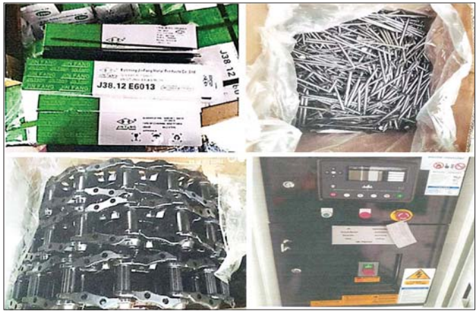
အေးရှားဝေါလ်ကုန်သေတ္တာစစ်ဆေးရေးစခန်း၌ ဖမ်းဆီးရမိမှု။

ထို့အတူ ပဲခူးတိုင်းဒေသကြီး တရားမဝင်ကုန်သွယ်မှုတိုက်ဖျက်ရေးအဖွဲ့၏ စီမံခန့်ခွဲမှုဖြင့် တာဝန်ကျပူးပေါင်းအဖွဲ့များက စစ်ဆေးမှုများဆောင်ရွက်ခဲ့ရာ ဘုရားကြီးမြို့ ရွှေသံလွင်တိုးဂိတ်အနီး၌ ဘားအံမြို့မှ ရန်ကုန်မြို့သို့ သွားရောက်မည့် မော်တော်ယာဉ်နှစ်စီးပေါ်မှ တရားဝင်စာရွက်စာတမ်းအထောက်အထား တင်ပြနိုင်ခြင်းမရှိသည့် စားသောက်ကုန်ပစ္စည်းသုံးမျိုး၊ လူသုံးကုန်ပစ္စည်းတစ်မျိုး