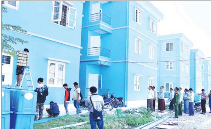
ကယားပြည်နယ်ဝန်ကြီးချုပ် ဦးစော်မျိုးတင် ဝန်ထမ်းအိမ်ရာတွင် ပြုပြင်ဆောင်ရွက်နေမှုကို ကြည့်ရှု စစ်ဆေးစဉ်။

လှိုင်ကော် နိုဝင်ဘာ ၁ လှိုင်ကော်မြို့ နောင်ယား(က) နှင့် ခေါ်ညူရပ်ကွက်ရှိ စုပေါင်းဝန်ထမ်းအိမ်ရာများ ပြင်ဆင်နေမှုများ၊ ဒေါင်းကူးရပ်ကွက်နှင့် နှစ်ကွတ်ရပ်ကွက်အတွင်း ရေပြန်လည်ကျဆင်းချိန် ကျန်ရှိသော အနိမ့်ပိုင်း နေရာများတွင် ရေစုပ်ထုတ်ခြင်း၊ ရေဖောက်ထုတ်ခြင်း ဆောင်ရွက်မှုအခြေအနေများကို အောက်တိုဘာ ၃၁ ရက်တွင် ပြည်နယ်ဝန်ကြီးချုပ် ဦးစော်မျိုးတင်နှင့် တာဝန်ရှိသူများက ကြည့်ရှုစစ်ဆေးသည်။