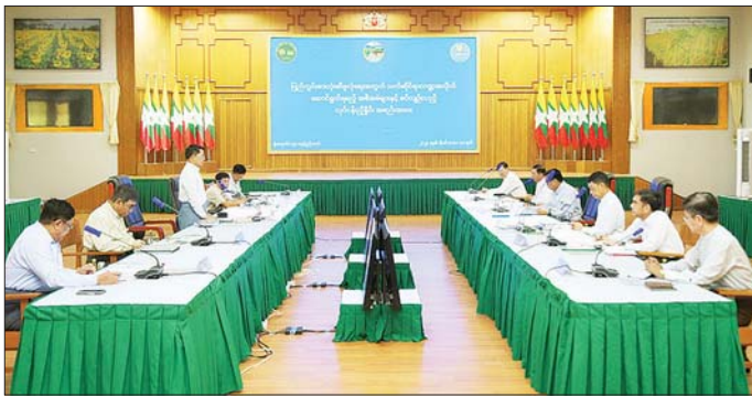
“ရာဂီ” တိုင်းဖွန်းမုန့်တိုင်းကြောင့် ဆွေးနွေးခဲ့ကြပြီး သက်ဆိုင်ရာ စားသုံးဆီတင်သွင်းမှု လျှော့ချနိုင် တိုင်းဒေသကြီး၊ ပြည်နယ်များ ပူးပေါင်းပါဝင်သည့် ရေးလုပ်ငန်းများကို ဆက်လက် တွင် သီးနှံများ ရေကြီးနစ်မြုပ် လုပ်ငန်းအဖွဲ့များဖြင့် ပြည်တွင်း ဆောင်ရွက်သွားမည်ဖြစ်ကြောင်း ပျက်စီးခဲ့မှု အခြေအနေများကို စားသုံးဆီပုံလုပ်ရေးနှင့် ပြည်ပမှ သိရသည်။ သတင်းစဉ်

ကျွမ်းကျင်သူများက သက်ဆိုင်ရာကဏ္ဍများအလိုက် တင်ပြဆွေးနွေးခဲ့ကြသည်။ ထိုသို့ ဆွေးနွေးရာတွင် ၂၀၂၄ - ၂၀၂၅ ခုနှစ် စိုက်ပျိုးရာသီတွင် ဆီထွက်သီးနှံများ စိုက်ပျိုး ထုတ်လုပ်ရန် လျာထားချက်နှင့် ယနေ့အထိ ဆီထွက် သီးနှံများစိုက်ပျိုးပြီးစီးမှု၊ တိုင်းဒေသကြီး၊ ပြည်နယ် အလိုက် မိုးမြေပဲ၊ မိုးနှမ်း၊ မိုးနေကြာသီးနှံများ စိုက်ပျိုး ထားရှိမှုအခြေအနေနှင့် ယခင်နှစ် ကာလတူနှင့် နှိုင်းယှဉ်ချက်၊ စက်မှုကြီးကြပ်ရေးနှင့် စစ်ဆေးရေး ဦးစီးဌာနမှ စာရင်းကောက်ယူရရှိသည့် တစ်နှစ် ကုန်ကြမ်းလိုအပ်ချက်အပေါ် ၂၀၂၃-၂၀၂၄ ခုနှစ် ဆီ ထွက်သီးနှံစိုက်ပျိုးထုတ်လုပ်မှုမှ ဒေသအလိုက် လအလိုက် ကုန်ကြမ်းပံ့ပိုးနိုင်မည့်အခြေအနေ၊