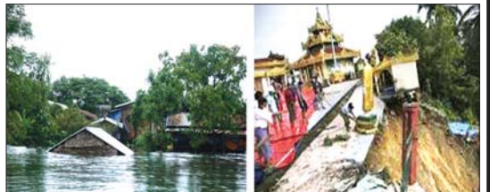
၂၀၁၈ ခုနှစ် ဇွန်လအတွင်း မြန်မာနိုင်ငံတောင်ပိုင်းဒေသများတွင် မိုးသည်းထန်စွာ ရွာသွန်းပြီး ရေကြီးမှုများနှင့် မော်လမြိုင်မြို့ ကျိုက်လတ်လှိုင်စေတီ မြေပြိုမှု ဖြစ်ပွားပုံ။