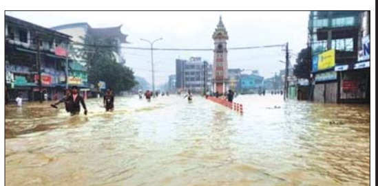
၂၀၂၃ ခုနှစ် အောက်တိုဘာလ ၈ ရက်နေ့တွင် မိုးရေချိန် ၇ ဒသမ ၈၇ လက်မရွာသွန်း ခဲ့ခြင်းနှင့် ဒီရေတိုးဝင်ခြင်းတို့ကြောင့် ပဲခူးမြို့တွင် ရေကြီးရေလျှံမှုများ ဖြစ်ပွားပုံ။

ရာသီဥတုဖောက်ပြန်ခဲ့ပြီး တစ်ဖန် ယခုနှစ် ၂၀၂၄ ခုနှစ်တွင် မိုးသည်းထန်စွာ ရွာသွန်းခဲ့မှုကြောင့် အင်းလေးကန် အတွင်း ရေများ အဆမတန်စီးဝင်ကာ ရေကြီးရေလျှံမှုဖြစ်ပွားပြီး အင်းလေးကန် ပတ်ဝန်းကျင်ရှိကျေးရွာများ၊ မြန်မာ့ရိုးရာ ရက်ကန်းစင်များ ရေနစ်မြုပ်ခဲ့ရပါသည်။ ထိုသို့ မိုးလေဝသနှင့် ဇလဗေဒဆိုင်ရာ အစွန်းရောက်ဖြစ်စဉ်များ နှစ်စဉ်ကြုံတွေ့ ခံစားနေရသည့်ရာသီဥတုပြောင်းလဲခြင်း ၏ ဆိုးကျိုးပြုလျက်များပင် ဖြစ်ပါသည်။