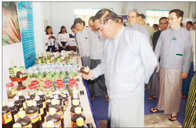
ပဲခူးတိုင်းဒေသကြီး ဝန်ကြီးချုပ် ဦးမျိုးဆွေဝင်း ခင်းကျင်းပြသထားသည့် ရေထွက်ကုန်ပစ္စည်းများအား လှည့်လည်ကြည့်ရှုစဉ်။

ထို့နောက် စိုက်ပျိုးရေး၊ မွေးမြူရေးနှင့် ဆည်မြောင်းဝန်ကြီးဌာန ငါးလုပ်ငန်းဦးစီးဌာန ဒုတိယညွှန်ကြားရေးမှူးချုပ် ဦးမြင့်စင်ထူးက နှုတ်ခွန်းဆက်အမှာစကားပြောကြားပြီး စီမံကိန်း တာဝန်ခံ ညွှန်ကြားရေးမှူး ဦးညွှန်ဝင်းက စီမံကိန်း