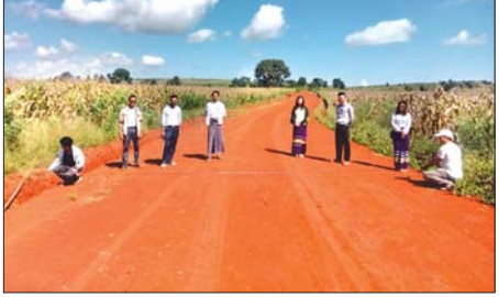
၃ မိုင် ၂ ဖာလုံ၊ အကျယ် ၁၂ ဝေ၊ မြေဩဒား ၂ ဝေ၊ သံမြန်၊ ထု ကိုးလက်မ ကျေးလက်ကုန်ထုတ်လမ်း ဖောက်လုပ်ခြင်း၊ တံတားနှင့် ဆက်စပ်လုပ်ငန်းများ ဆောင်ရွက်နေမှုတို့ကို ကျေးလက်

နမ့်စန် နိုဝင်ဘာ ၁ ရမ်းပြည်နယ် (တောင်ပိုင်း)နမ့်စန်မြို့နယ် ကျေးလက်ဒေသ ဖွံ့ဖြိုးတိုးတက်ရေးဦးစီးဌာနက ကျေးလက်နေ ပြည်သူများ၏ လယ်ယာဧကများမှ ထွက်ရှိသည့် စိုက်ပျိုးသီးနှံများ ဈေးကွက်အတွင်းသို့ ကုန်ကျစရိတ် သက်သာစွာဖြင့် သယ်ယူပို့ဆောင်နိုင်ရန်ရည်ရွယ်၍ ကျေးလက်ကုန်ထုတ် လမ်း၊ တံတားများ ဖောက်လုပ်လျက်ရှိသည်။ လွယ်ဆိုင်းကျေးရွာ၌ အရည်