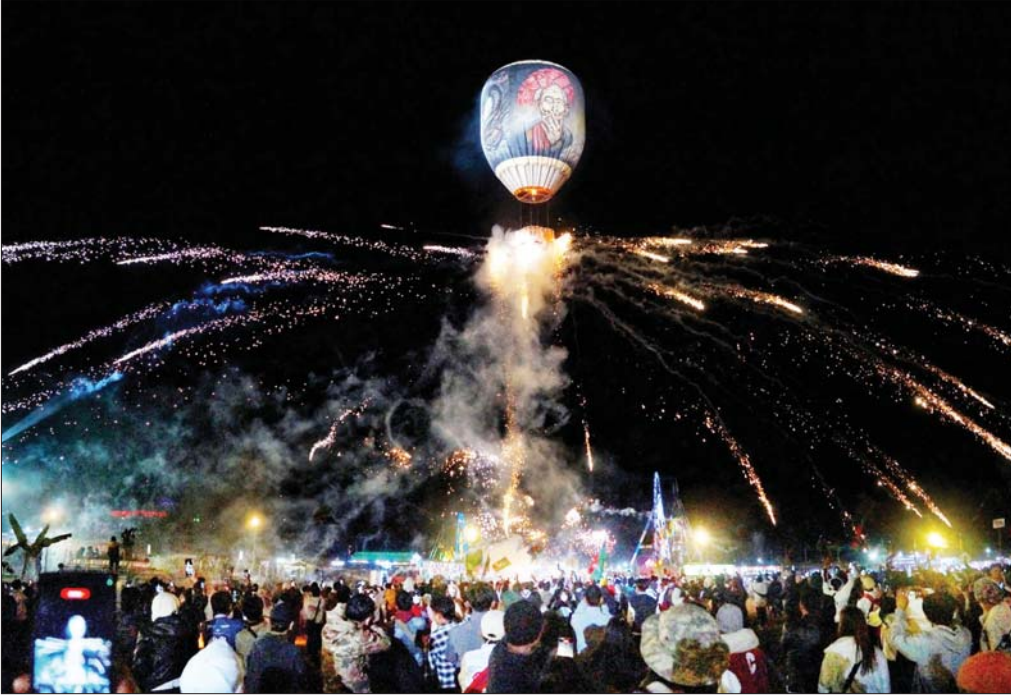
ယမန်နှစ်က ကျင်းပခဲ့သည့် တောင်ကြီးမြို့ တန်ဆောင်တိုင်မီးပွဲပွဲတော်ကို တွေ့ရစဉ်။

နေပြည်တော် နိုဝင်ဘာ ၁ ပြည်ထောင်စုသမ္မတမြန်မာနိုင်ငံတော်အစိုးရ သာသနာရေးနှင့်ယဉ်ကျေးမှုဝန်ကြီးဌာန၊ သာသနာရေး ဦးစီးဌာနက ကြီးမှူးကျင်းပမည့် (၇၇)ကြိမ်မြောက် တိပိဋကဓရတိပိဋကကော်မီဒီရွေးချယ်ရေး စာမေးပွဲကြီးကို ၂၀၂၄ ခုနှစ် ဇူလိုင်လ ၂၄ ရက်မှ ၂၀၂၅ ခုနှစ် ဇန်နဝါရီ ၂၅ ရက်အထိ ၃၃ ရက်တိုင်တိုင် ရန်ကုန်မြို့၊ သီရိမင်္ဂလာကမ္ဘာအေးကုန်းမြေ ဆဋ္ဌသင်္ဂါယနာမဟာပါသဏာ လိုဏ်ဂူသိမ်တော်ကြီးတွင် ကျင်းပမည် ဖြစ်သည်။ အဆိုပါစာမေးပွဲ ဖွင့်ပွဲအခမ်းအနားကို ၂၀၂၄ ခုနှစ် ဇူလိုင်လ ၂၄ ရက် (အင်္ဂါနေ့) နံနက် ၈ နာရီခွဲတွင် ရန်ကုန်မြို့၊ သီရိမင်္ဂလာကမ္ဘာအေးကုန်းမြေရှိ ဝိဇယမင်္ဂလာဓမ္မသာသနာ့ ညည်းကောင်း၊ စာပြန်ပွဲကို မဟာပါသဏာလိုဏ်ဂူသိမ်တော်ကြီး၌ လည်းကောင်း၊ ဆွမ်းဆက်ကပ်ခြင်းကို သုံးထပ်ဆွမ်းစားဆောင်တွင်လည်းကောင်း ၃၃ ရက်တိုင်တိုင် ကျင်းပမည်ဖြစ်ပါ၍ လှူဒါန်းလိုသော အလှူရှင်များအနေဖြင့် သာသနာရေးဦးစီးဌာန၊ စာမေးပွဲဌာန၊ ကမ္ဘာအေးကုန်းမြေ၊ ရန်ကုန်မြို့၊ ၀၉-၄၃၀၆၇၀၆၊ ၀၉၄၄၃၀၉၀၉၃ တို့သို့ ဆက်သွယ်၍ ထာဝရကုသိုလ်ရင်များအဖြစ် စိုက်ထူလှူဒါန်းနိုင်ကြောင်း သိရသည်။ စာမျက်နှာ ၄ ကော်လံ ၁ □