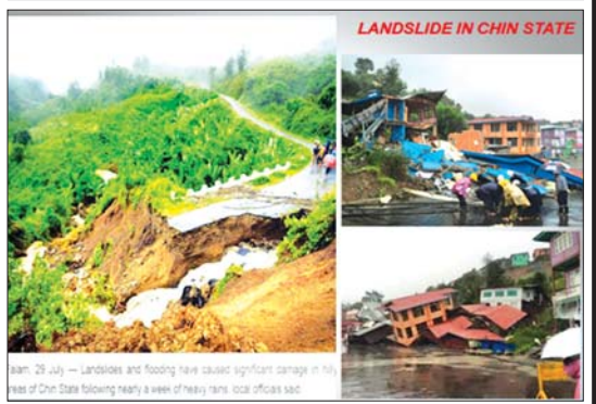
၂၀၁၅ ခုနှစ် မိုးသည်းထန်စွာ ရွာသွန်းမှုကြောင့် တောင်တန်းဒေသတစ်ခုဖြစ်သည့် ချင်းပြည်နယ်တွင် မြေပြိုမှုများဖြစ်ပွားပုံ။