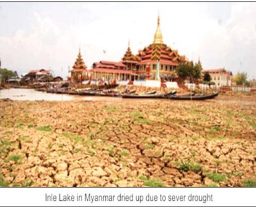
Inle Lake in Myanmar dried up due to severe drought

မြန်မာနိုင်ငံလူဦးရေ၏ ၇၀ ရာခိုင်နှုန်းသည် လယ်ယာထွက်ကုန်၊ မွေးမြူရေးနှင့် ရေထွက်ပစ္စည်းလုပ်ငန်းများ အပေါ်တွင် မှီခိုနေသောကြောင့် ၎င်းတို့၏ စားဝတ်နေရေး ဖူလုံကြွယ်ဝမှုသည် သင့်တင့်မျှတသော ရာသီဥတုအခြေအနေပေါ်တွင် များစွာမူတည်လျက်ရှိပါသည်။ တစ်နည်းဆိုရသော် အစွန့်ရောက်ရာသီဥတုဖြစ်စဉ်များနှင့် သဘာဝဘေးဒဏ်များသည် မြန်မာ့စီးပွားရေး၊ ဖွံ့ဖြိုးတိုးတက်ရေးတို့အပေါ် ထိခိုက်လွယ်ပြီး သက်ရောက်မှုများစွာ ရှိစေပါသည်။