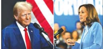
နိုင်ငံတကာရေးရာ စာ ၁၄

တပြည်းပြည်းနီးကပ်လာပြီဖြစ်တဲ့ အမေရိကန်သမ္မတရွေးကောက်ပွဲ