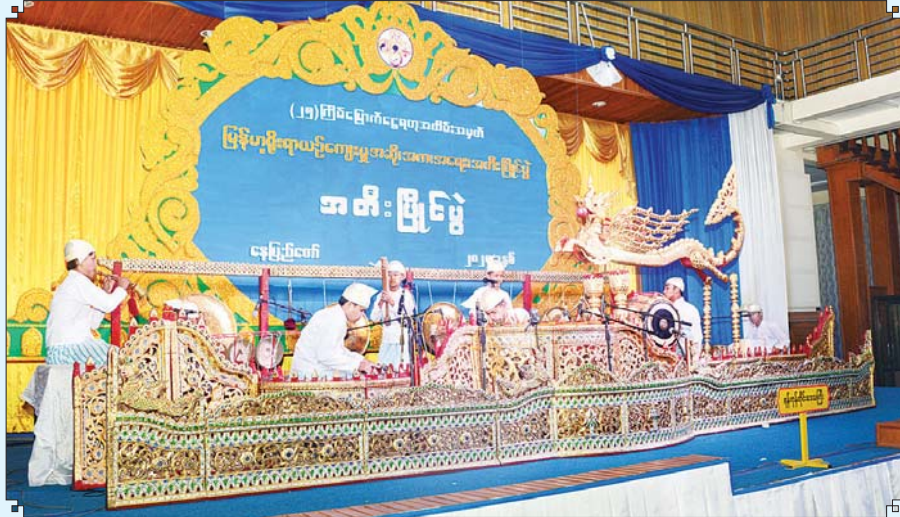
ဆိုင်းအဖွဲ့လိုက်(အတီး)

၂၀၂၄ ခုနှစ် (၂၅) ကြိမ်မြောက် ငွေရတုအထိမ်းအမှတ် မြန်မာ့ရိုးရာယဉ်ကျေးမှု ဆို၊ က၊ ရေး၊ တီးပြိုင်ပွဲကြီးကို အောက်တိုဘာ ၁၄ ရက်မှ အောက်တိုဘာ ၂၃ ရက်အထိ နေပြည်တော်ရှိ သတ်မှတ်နေရာ အသီးသီး၌ ကျင်းပခဲ့ရာ ပထမဆုရပြိုင်ပွဲဝင်များ၏ ယှဉ်ပြိုင်ခဲ့မှု မြင်ကွင်းပုံရိပ်များကို စုစည်းဖော်ပြလိုက်ပါသည်။