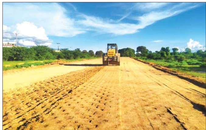
စက်မှုဇုန်အဝင်လမ်း (ညောင်ပင်နှင့် ကတ္တရာလမ်းကြား) ကျောက်ရောမြေထပ်ပိုးလွှာ တစ်ပေထုခင်းကြိုက်ခြင်း။

စာမျက်နှာ ၁၆ မှ လက်ရှိတွင် စက်မှုဇုန်ဖွံ့ဖြိုးရေးအတွက် အခြေခံလိုအပ်ချက်ဖြစ်သည့် မကျေး-တောင်တွင်း ကားလမ်းမကြီးမှ စက်မှုဇုန်အတွင်းသို့ ပေ ၁၀၀ အကျယ် လမ်းမကြီးဖောက်လုပ်ခြင်း၊ စက်မှုဇုန် အပြင်ပတ်လမ်း (ရထားလမ်းနှင့်အပြိုင်) နှင့် စက်မှုဇုန်အတွင်းလမ်းပိုင်းကို ပေ ၈၀ လမ်းနှင့် အတွင်းလမ်းများကို ပေ ၆၀ လမ်းများ ဖောက်လုပ်ခြင်းလုပ်ငန်းများကို စတင်နေပြီဖြစ်ကြောင်း မကျေးတိုင်းဒေသကြီးအစိုးရအဖွဲ့မှ သိရသည်။ စက်မှုဇုန်အတွင်း လမ်းပိုင်းများ ဆောင်ရွက်ရာ တွင် ထုတ်ကုန်များ သယ်ယူရာတွင် Container Box များ၊ တန်ချိန် (၅၀၊ ၆၀) ဝန်ပါ တွဲကားကြီးများ ဝင်ထွက်သွားလာနိုင်သည့် လမ်းများအဖြစ် ဖောက်လုပ်လျက်ရှိကြောင်း သိရသည်။ “လက်ရှိမှာ မြေသားလုပ်ငန်း ဆောင်ရွက်နေဆဲ ဖြစ်ပါတယ်။ ပြီးရင် ကွန်ကရစ်လမ်းလုပ်ငန်းကို စတင်မှာ ဖြစ်ပါတယ်။ စီမံကိန်းလုပ်ငန်းရပ်တွေမှာ လမ်း၊ ရေမြောင်း၊ မီးသတ်အဆောက်အအုံ၊ မုခ်ဦး၊ ပန်းခြံ၊ လမ်းအရိပ်ရသစ်ပင်တွေ ပါဝင်ပါတယ်။ မီးရရှိရေးက လျှပ်စစ်ဓာတ်အားလိုင်း စီမံကိန်းနဲ့ ဆိုလာစီမံကိန်း နှစ်ခုပါဝင်ပါတယ်။ အဓိကက ၂၄ နာရီ စီးရီရီအောင် ဆောင်ရွက်မယ့်လုပ်ငန်းစဉ် ဖြစ်ပါတယ်။ ပြီးတော့ စုစုပေါင်း၊ စီမံခန့်ခွဲရေး ကော်မတီရဲ့၊ လုံခြုံရေးအဆောက်အအုံ၊ CCTV လုံခြုံရေးကင်မရာ တပ်ဆင်တာတွေ၊ အမှိုက်ကားနဲ့ အမှိုက်ကန်တို့စနစ် အားလုံးပါဝင်ပါတယ်။ ကျန်တော့တို့အနေနဲ့ စက်မှုဇုန်မှာ ခုနက အခြေခံ