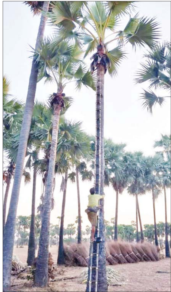
ရေနံချောင်းဒေသ ထန်းတောတစ်ခုခုကို တွေ့ရစဉ်။

ရေနံချောင်း အောက်တိုဘာ ၂၈ အညာဒေသ မကွေးတိုင်းဒေသကြီး ရေနံချောင်းမြို့နယ်၌ ထန်းတောများသည် အညာ၏အိုအေစစ်တစ်ခုဖြစ်ပြီး နှစ်ရှည်ပင်ဖြစ်သည့် ထန်းပင်ကို တစ်ကြိမ်တည်း စိုက်ပျိုးခြင်းဖြင့် ရေလောင်းစရာ မလိုဘဲ ရှင်သန်ပြီး အောင်မြင်မြစ်ထွန်းစေသည့်အပြင် ရာသီဥတုကို ကောင်းမွန်စေသောကြောင့် တောင်သူများ စိုက်ပျိုးကြသည်။ “အခုနှစ် ထန်းလျက်ဈေးက တောင်သူတွေ မျှော်လင့်သလို ဈေးကောင်းရပါတယ်။ တစ်နှစ်လုံး ဈေးကောင်းခဲ့တာကိုကြည့်ပြီး အခု လာမယ့်နှစ်မှာ ထန်းတက်သူများနိုင်တယ်။ ကုန်ကျစရိတ်တွေရှိပေမယ့် အခုလက်ရှိပေါက်ဈေးအရ တွက်ခြေကိုက်တဲ့အတွက် ထန်းလုပ်ငန်းလုပ်ကိုင်သူတွေ ပြန်လည်တိုးလာပါတယ်” ဟု ထန်းတောင်သူတစ်ဦးက ပြောသည်။ စားသောက်ကုန်များတွင် အသုံးပြုနိုင်သော ထန်းလျက်အပြင် ထန်းပင်ကနေ ထန်းရွက်၊ ထန်းလက်၊ ထန်းလျှော်၊ ထန်းသားတို့သည် လူတို့၏ အဆောက်အအုံများ၌ အမိုး၊ အကာအဖြစ်လည်းကောင်း၊ ထန်းလက်ကို ကုလားထိုင်၊ စားပွဲနှင့် ထန်းသားကို အသုံးအဆောင်အဖြစ်လည်းကောင်း အသုံးပြုခြင်းဖြင့် ထန်းပင်ကနေ အကျိုးအမြတ် ရရှိသည်။ စာမျက်နှာ ၅ ကော်လံ ၁ ၀