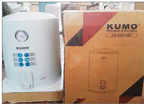
ရှမ်းပြည်နယ်၌ ဖမ်းဆီးရမိမှု။