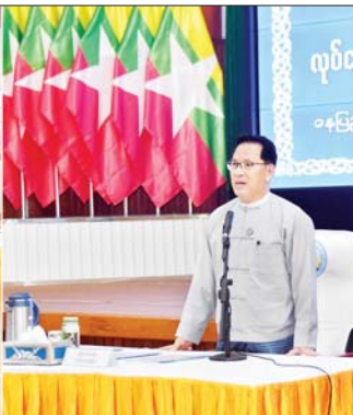
ပြည်ထောင်စုဝန်ကြီး ဦးမောင်မောင်အုန်း ပြန်ကြားရေးနှင့် ပြည်သူ့ဆက်ဆံရေးဦးစီးဌာန လုပ်ငန်းစွမ်းဆောင်ရည် မြှင့်တင်ရေးသင်တန်း (၂/၂၀၂၄) ဖွင့်ပွဲတွင် အမှာစကား ပြောကြားစဉ်။

ဌာန၏လုပ်ငန်းများ ထိထိရောက်ရောက်ဆောင်ရွက် ဆက်လက်၍ ပြည်ထောင်စုဝန်ကြီး ကပြည်သူလူထုနှင့်ထိတွေ့နေရသည့်ဌာန ဖြစ်သည့်အတွက် ဝန်ထမ်းများကိုယ်တိုင် အတွေးအခေါ် အယူအဆ ရင့်သန်ရန်နှင့် စိတ်ဓာတ်ကောင်းမွန်ရန် လိုအပ်ကြောင်း၊ ဌာန၏လုပ်ငန်းများ အမှန်တကယ် ထိထိ