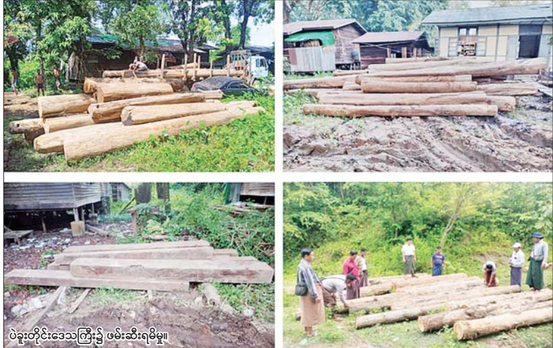
ပဲခူးတိုင်းဒေသကြီး၌ ဖမ်းဆီးရမိမှု။

နေပြည်တော် အောက်တိုဘာ ၂၈ တရားမဝင်ကုန်သွယ်မှုတိုက်ဖျက်ရေး ဦးဆောင်ကော်မတီ၏ ကြီးကြပ်ကွပ်ကဲမှုဖြင့် တရားမဝင်ကုန်သွယ်မှုများကို ဥပဒေနှင့်အညီ ထိရောက်စွာ တားဆီးအရေးယူနိုင်ရေး ဆောင်ရွက်လျက်ရှိရာ အကောက်ခွန်ဦးစီးဌာန၏ စီမံခန့်ခွဲမှုဖြင့် တာဝန်ကျပေးပေါင်း အဖွဲ့က စစ်ဆေးမှုများ ဆောင်ရွက်ခဲ့ရာ အောက်တိုဘာ ၂၇ ရက်တွင် အေးရှားဝေါလ်ကုန်သေတ္တာ စစ်ဆေးရေးစခန်း၌ ကုန်သေတ္တာ ၂၅ လုံးအတွင်းမှ တရားဝင်စာရွက်စာတမ်းအထောက်အထား တင်ပြနိုင်ခြင်းမရှိသည့် လုပ်ငန်းသုံးပစ္စည်းနှစ်မျိုး၊ လူသုံးကုန်ပစ္စည်း စာမျက်နှာ ၁၅ ကော်လံ ၅ *