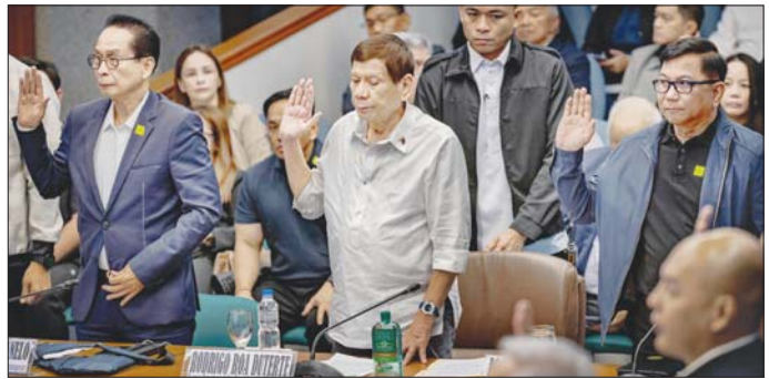
အပြည်ပြည်ဆိုင်ရာ ရာဇဝတ်တရားရုံးသည် မဟုတ်ကြောင်း ဖိလစ်ပိုင်အစိုးရက ပြောကြားလိုက် ဖိလစ်ပိုင်နိုင်ငံ၏အချုပ်အခြာအာဏာကို ခြိမ်းခြောက်သည်။ ၂၀၁၉ ခုနှစ်တွင် ဖိလစ်ပိုင်နိုင်ငံသည် အဆိုပါ လျက်ရှိပြီး စုံစမ်းစစ်ဆေးရေးကို ကူညီနိုင်မည် တရားရုံးမှ နုတ်ထွက်ခဲ့သည်။ အင်န်အိတ်ချ်က

အထက်လွှတ်တော်အပြင်ဘက်တွင် ဖြိုခွင်းမှုအတွင်း သေဆုံးခဲ့သူများ၏ ဆွေမျိုးများနှင့် မိသားစုများ စုရုံးပြီး တရားမျှတမှုကို တောင်းဆိုခဲ့ကြသည်။ အပြည်ပြည်ဆိုင်ရာ ရာဇဝတ်တရားရုံးက ဒူတာတေး၏ မူးယစ်ဆေးဝါးဆန့်ကျင်တိုက်ဖျက်ရေးလှုပ်ရှားမှုကို လူသားမျိုးနွယ်အပေါ် ကျူးလွန်နိုင်သည် ဟု ဝန်ခံပြောကြားခဲ့ခြင်း စုံစမ်းစစ်ဆေးလျက်ရှိသည်။