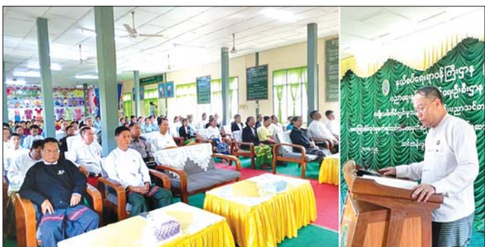
ကရင်ပြည်နယ်ဝန်ကြီးချုပ် ဦးစောမြင့်ဦး အမျိုးသမီးအိမ်တွင်းမှု သက်မွေးလုပ်ငန်း ပညာသင်တန်းကျောင်း တားအံ သင်တန်းဖွင့်ပွဲ၌ အမှာစကားပြောကြားစဉ်။

နေပြည်တော် အောက်တိုဘာ ၂၈ နယ်စပ်ရေးရာဝန်ကြီးဌာန ပညာ ရေးနှင့် လေ့ကျင့်ရေးဦးစီးဌာန ကွပ်ကဲမှုအောက်ရှိ အမျိုးသမီး အိမ်တွင်းမှု သက်မွေးလုပ်ငန်း ပညာသင်တန်းကျောင်း ၁၅ ကျောင်းတွင် နယ်စပ်ဒေသ အပါအဝင် အလုပ်အကိုင်အခွင့်အလမ်း နည်းပါးသောဒေသများမှ အမျိုး သမီးငယ်များအား အဆင့်မြင့် စက်ချုပ်ပညာရပ်များ သင်ကြား တတ်မြောက်စေခြင်းဖြင့် လူမှု စီးပွားဘဝ ဖွံ့ဖြိုးတိုးတက်ပြီး မိသားစုအပိုဝင်ငွေ ရရှိနိုင်စေရေး၊ အသက်မွေးဝမ်းကျောင်းလုပ်ငန်း အဖြစ် အထည်ချုပ်စက်ရုံများတွင် ဝင်ရောက် လုပ်ကိုင်နိုင်ရေးနှင့် ကိုယ်ပိုင်စက်ချုပ်ဆိုင်များ ဖွင့်လှစ် လုပ်ကိုင်နိုင်စေရေး ရည်ရွယ်၍ အဆင့်မြင့်အိမ်တွင်းမှု စက်ချုပ် သင်တန်း၊ ရိုးရာဂျာဗတ်သင်တန်း၊ အခြေခံလက်ရက်ကန်းသင်တန်း၊ ဟိုတယ်ဝန်ဆောင်မှု ဆိုင်ရာ သင်တန်းများကို ယနေ့နံနက်ပိုင်း က ဖွင့်လှစ်သည်။