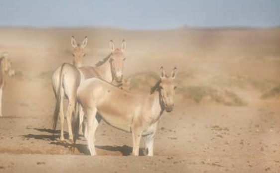
မွန်ဂိုလီးယားနိုင်ငံ ဂိုဘီဒေသ၌ တောမြည်းရိုင်းအချို့ကို တွေ့ရစဉ်။

မွန်ဂိုလီးယား တောမြည်းရိုင်းများသည် ကောင်ရေများစွာ