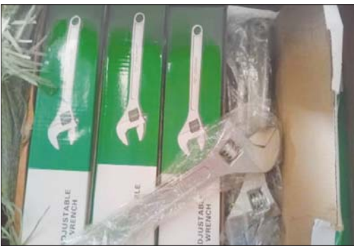
မြန်မာ့စက်မှုသိပ်ကမ်း၌ ဖမ်းဆီးရမိမှု။