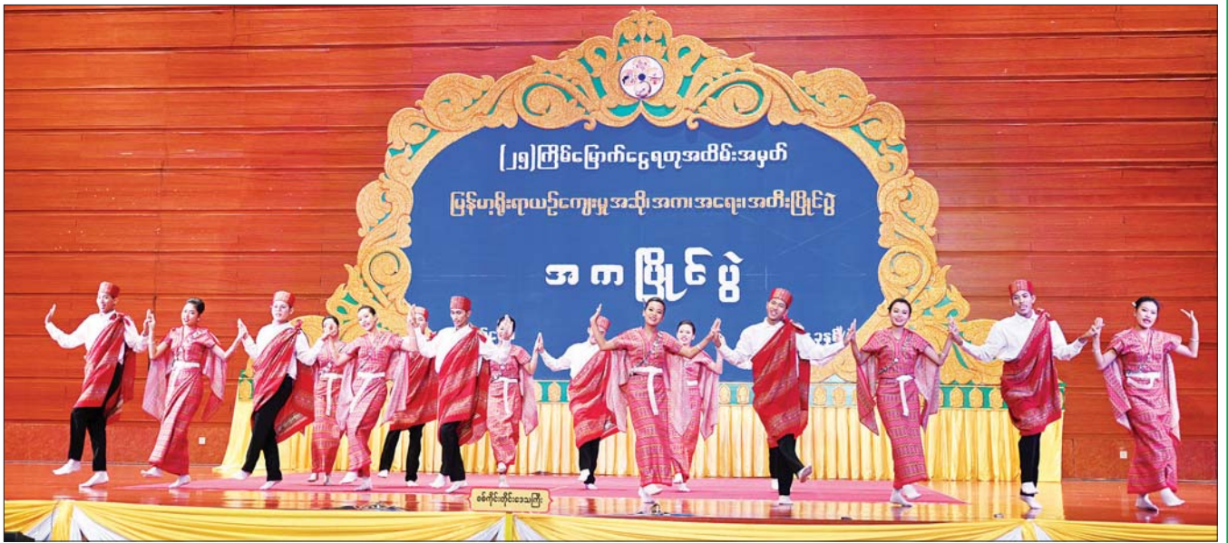
ချင်းတိုင်းရင်းသားရိုးရာ အလွတ်တန်းအဆင့် အကပြိုင်ပွဲတွင် စစ်ကိုင်းတိုင်းဒေသကြီး ကိုယ်စားပြု ပြိုင်ပွဲဝင်အဖွဲ့က ချင်းတိုင်းရင်းသားရိုးရာ ကကြီး၊ ကကွက်များကို ချင်း အလှ၊ ချင်း ဟန်တို့ဖြင့် ပေါင်းစပ်ကာ ကပြယှဉ်ပြိုင်စဉ်။