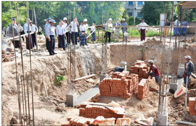
အနေများကို လှည့်လည်ကြည့်ရှုစစ်ဆေးရာ တာဝန်ရှိသူများက လုပ်ငန်းဆောင်ရွက်နေမှုအခြေအနေများကို ရှင်းလင်းတင်ပြကြပြီး နေပြည်တော်ကောင်စီဥက္ကဋ္ဌက ရေရှည်ခိုင်ခံ့ရေး၊ အရည်အသွေးကောင်းမွန်ရေး၊ သတ်မှတ်စံချိန်စံညွှန်း ပြည့်မီရေး၊ သတ်မှတ်ကာလအတွင်းပြီးစီးရေးတို့ကို အလေးထားဆောင်ရွက်ရမည်ဖြစ်ကြောင်းနှင့် လိုအပ်သည်များကို တာဝန်ရှိသူများအား မှာကြားသည်။

နေပြည်တော် အောက်တိုဘာ ၂၀ - နေပြည်တော်ကောင်စီဥက္ကဋ္ဌ ဦးသန်းထွန်းဦးသည် နေပြည်တော်ကောင်စီဝင်များ၊ ဌာနဆိုင်ရာ တာဝန်ရှိသူများနှင့်အတူ ယနေ့နံနက်ပိုင်းတွင် ဇေယျသီရိမြို့နယ်အတွင်း နေပြည်တော်ကောင်စီ၏ ၂၀၂၄-၂၀၂၅ ဘဏ္ဍာနှစ် ငွေလုံးငွေရင်းရန်ပုံငွေဖြင့် တည်ဆောက်နေသည့် အမှုထမ်းအိမ်ရာများနှင့် အပျိုဆောင်၊ လူပျိုဆောင်များ ဆောက်လုပ်ရေးလုပ်ငန်းခွင်များသို့ သွားရောက် ကြည့်ရှုစစ်ဆေးသည်။