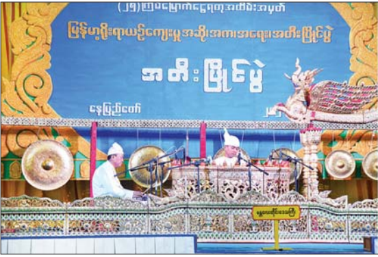
ပြည်ထောင်စုဝန်ကြီး ဦးမျိုးသန့်နှင့်ဇနီး၊ တာဝန်ရှိသူများ အခြေခံပညာအဆင့် (အသက် ၁၅ နှစ်မှ ၂၀ နှစ်အတွင်း) အမျိုးသား ဆိုင်းတစ်ဦးချင်း အတီးပြိုင်ပွဲတွင် မန္တလေး တိုင်းဒေသကြီးမှ တီးခတ်ယှဉ်ပြိုင်စဉ်။

နေပြည်တော် အောက်တိုဘာ ၂၀ ၂၀၂၄ ခုနှစ် (၂၅) ကြိမ်မြောက် ငွေရတု အထိမ်းအမှတ် မြန်မာ့ရိုးရာယဉ်ကျေးမှု အဆို၊ အက၊ အရေး၊ အတီး (ဗဟိုအဆင့်) ပြိုင်ပွဲ ယဉ်ကျေးမှုအဖွဲ့က ယနေ့နံနက်ပိုင်းတွင် ပြည်ထောင်စုနယ်မြေ နေပြည်တော်ရှိ သတ်မှတ်နေရာ အသီးသီးတွင် စည်ကား သိုက်မြိုက်စွာ ဆက်လက်ကျင်းပသည်။ ယနေ့တွင် “အမျိုးဂုဏ်၊ ဇာတိဂုဏ် မြှင့်တင်ရေး” တေးသီချင်း အဆိုပြိုင်ပွဲကို မြန်မာအပြည်ပြည်ဆိုင်ရာ ကွန်စာဗ်ရှင်း ဗဟိုဌာန (၂) Banquet Hall ဌာနတွင် ပရဝါသနာရှင်အဆင့် (ဒုတိယတန်း) အမျိုးသားပြိုင်ပွဲတွင် ရခိုင်ပြည်နယ်၊ တနင်္သာရီတိုင်းဒေသကြီး၊ မန္တလေးတိုင်း ဒေသကြီး၊ ချင်းပြည်နယ်၊ ကချင်ပြည်နယ်၊ ဧရာဝတီတိုင်းဒေသကြီး၊ မကွေးတိုင်း ဒေသကြီး၊ ရန်ကုန်တိုင်းဒေသကြီး၊ ပဲခူး တိုင်းဒေသကြီး၊ ရှမ်းပြည်နယ်နှင့် ကရင် ပြည်နယ်တို့မှ ပြိုင်ပွဲဝင်များက “ဥမက္ခေ သိုက်မပျက်” သီချင်းဖြင့်လည်းကောင်း၊ အဆင့်မြင့်ပညာအဆင့် အမျိုးသမီးပြိုင်ပွဲ တွင် မကွေးတိုင်းဒေသကြီး၊ ရခိုင်ပြည်နယ်၊ ချင်းပြည်နယ်၊ ရန်ကုန်တိုင်းဒေသကြီး၊ ပဲခူးတိုင်းဒေသကြီး၊ ကချင်ပြည်နယ်၊ ကရင်ပြည်နယ်၊ မွန်ပြည်နယ်၊ မန္တလေး တိုင်းဒေသကြီး၊ ကယားပြည်နယ်၊ စစ်ကိုင်း တိုင်းဒေသကြီး၊ ရှမ်းပြည်နယ်၊ တနင်္သာရီ တိုင်းဒေသကြီးနှင့် ဧရာဝတီတိုင်းဒေသ ကြီးတို့မှ ပြိုင်ပွဲဝင်များက “မြန်မာပြည် ခရီးစဉ်” သီချင်းဖြင့်လည်းကောင်း သီဆိုယှဉ်ပြိုင်ကြသည်။