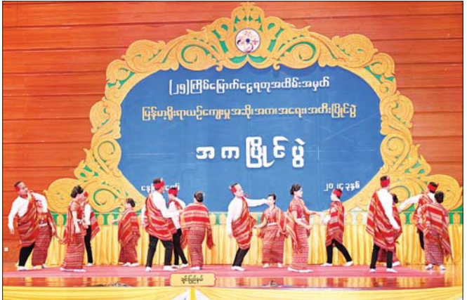
နိုင်ငံတော်စီမံအုပ်ချုပ်ရေးကောင်စီဥက္ကဋ္ဌ နိုင်ငံတော်ဝန်ကြီးချုပ် ဗိုလ်ချုပ်မှူးကြီး မင်းအောင်လှိုင်နှင့် ဇနီးဒေါ်ကြူကြူလှ ချင်းတိုင်းရင်းသားရိုးရာ အလွတ်တန်းအဆင့် အကပြိုင်ပွဲတွင် ချင်းပြည်နယ်ကိုယ်စားပြု ပြိုင်ပွဲဝင်အဖွဲ့က ချင်းတိုင်းရင်းသားရိုးရာ ကကြိုး၊ ကကွက်များကို ချင်း အလှ၊ ချင်း ဟန်တို့ဖြင့် ပေါင်းစပ်ကာ ကပြယှဉ်ပြိုင်မှုကို ကြည့်ရှုအားပေးစဉ်။