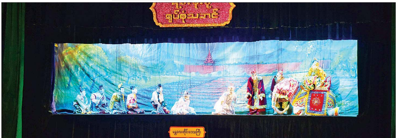
ဝါသနာရှင်အဆင့် (ပထမတန်း)ပြိုင်ပွဲတွင် “ဝေဿန္တရာ” ဇာတ်တော်ကြီးဖြင့် မန္တလေးတိုင်းဒေသကြီးကိုယ်စားပြု ရတနာပုံရုပ်စုံသဘင်အဖွဲ့က အကအလှများ၊ စကားပြောများဖြင့် သရုပ်ဖော်ယှဉ်ပြိုင်ပွဲကို တွေ့ရစဉ်။

အချိန်ကာလအတိုင်းအတာတစ်ခုအထိ တိမ်မြုပ် ပျောက်ကွယ်နေခဲ့သည့် ရုပ်သေးပညာပြန်လည်ပြီး တစ်ခေတ်ဆန်းသစ်လာခဲ့ကြောင်း၊ အကြောင်းကြောင်း ကြောင့် ကျင်းပခြင်းမပြုနိုင်ခဲ့သည့် အဆို၊ အက၊ အရေး၊ အတီးပြိုင်ပွဲကြီးနှင့်အတူ ရုပ်သေးအနုပညာ ရုပ်သည့် တိမ်မြုပ်ပျောက်ကွယ်သကဲ့သို့ ဖြစ်နေခဲ့ရ ခြင်းကြောင့် (၂၃) ကြိမ်မြောက်ကျင်းပသည့် မြန်မာ့ ရိုးရာယဉ်ကျေးမှု အဆို၊ အက၊ အရေး၊ အတီး ပြိုင်ပွဲမှ စတင်၍ မြန်မာ့ရိုးရာယဉ်ကျေးမှုအမွေအနှစ်များ ထိန်းသိမ်းနိုင်ရန်နှင့် မြန်မာ့ရုပ်သေးပညာရပ်၊ မြန်မာ့ရုပ်စုံပညာရပ်များ ပြန်လည်ဖော်ထုတ်နိုင်ရန် ဖြစ်ကြောင်းနှင့် “ဝေဿန္တရာ” ဇာတ်တော်ကြီးကို အလောင်းတော် ဝေဿန္တရာမင်းကြီး ဖြည့်ဆည်း ကျင့်ကြံခဲ့သော ဒါနပါရမီ၏ မြင့်မြတ်နက်ရှိုင်းမှုကို ကြည့်ညိုသဒ္ဓါပွားများနိုင်စေရန်၊ ဒါနပါရမီ အထွက် တက်လျက် အခြံအရံပါရမီများအကြောင်းကို သိရှိ နာယူကျင့်သုံးနိုင်စေရန်နှင့် ဗုဒ္ဓဝင်ဆိုင်ရာ သုတ၊ ကိုယ်ကျင့်တရား ပိုမိုမြင့်မားလာစေရန် စသည့် ဦးတည်ချက်များဖြင့် ထည့်သွင်းကျင်းပခဲ့ခြင်းဖြစ် ကြောင်း သတင်းရရှိသည်။ သတင်းစဉ်