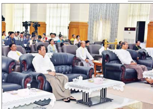
ပြည်ထောင်စုဝန်ကြီး ဒုတိယဗိုလ်ချုပ်ကြီး ထွန်းထွန်းနောင် ဝါသနာရှင်အဆင့် (ဒုတိယတန်း) ဆိုင်းတစ်ဦးချင်း အမျိုးသမီးပြိုင်ပွဲတွင် ရန်ကုန်တိုင်းဒေသကြီးမှ ပြိုင်ပွဲဝင် တစ်ဦး၏ တီးခတ်ယှဉ်ပြိုင်နေမှုကို ကြည့်ရှုအားပေးစဉ်။

မယ်ဒလင်အတီးပြိုင်ပွဲကို မြန်မာ အပြည်ပြည်ဆိုင်ရာ ကွန်ဗင်းရှင်းဗဟို ဌာန (J) News Briefing Room ဌာနတွင်းပ ရာ ဝါသနာရှင်အဆင့် (ဒုတိယတန်း) အမျိုးသားပြိုင်ပွဲတွင် ကယားပြည်နယ်၊ ချင်းပြည်နယ်၊ မွန်ပြည်နယ်၊ မကွေးတိုင်း ဒေသကြီး၊ စစ်ကိုင်းတိုင်းဒေသကြီး၊ မန္တလေးတိုင်းဒေသကြီး၊ ရန်ကုန်တိုင်း ဒေသကြီး၊ ဧရာဝတီတိုင်းဒေသကြီးနှင့် ပဲခူးတိုင်းဒေသကြီးတို့မှ ပြိုင်ပွဲဝင်များက “အတိုင်းမသိ” (ဘွဲ့) သီချင်းဖြင့်လည်းကောင်း၊ ဝါသနာရှင်အဆင့် (ဒုတိယတန်း) အမျိုးသမီးပြိုင်ပွဲတွင် မွန်ပြည်နယ်နှင့် ရန်ကုန်တိုင်းဒေသကြီးတို့မှ ပြိုင်ပွဲဝင် များက “ပန်းဟောနံ” (ယိုးဒယား) သီချင်း ဖြင့်လည်းကောင်း၊ အဆင့်မြင့်ပညာ အဆင့် အမျိုးသားပြိုင်ပွဲတွင် ဧရာဝတီ တိုင်းဒေသကြီး၊ ရန်ကုန်တိုင်းဒေသကြီး၊ ပဲခူးတိုင်းဒေသကြီးနှင့် မန္တလေးတိုင်းဒေသ ကြီးတို့မှ ပြိုင်ပွဲဝင်များက “ဆန်းနေဦး” (ယိုးဒယား) သီချင်းဖြင့်လည်းကောင်း၊ အဆင့်မြင့်ပညာအဆင့် အမျိုးသမီးပြိုင်ပွဲ တွင် ရန်ကုန်တိုင်းဒေသကြီး၊ မန္တလေး တိုင်းဒေသကြီး၊ ပဲခူးတိုင်းဒေသကြီးနှင့် မွန်ပြည်နယ်တို့မှ ပြိုင်ပွဲဝင်များက