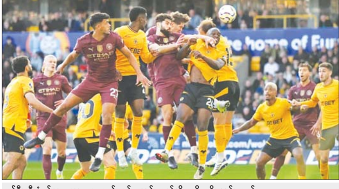
မန်စီးတီးခံစစ်ကစားသမား စတုန်း ပုလဲအသင်းဘက်သို့ ဒုတိယဂိုး သွင်းယူစဉ်။

ဂီဘဒီယိုလ်က သွင်းယူပေးခဲ့သည်။ တစ်ဖက်တစ်ဂိုးစီ သရေကျပြီးနောက် မန်စီးတီးအသင်းက ထိုးဖောက်တိုက်စစ်ဆင်မှုများနှင့်အတူ အိမ်ရှင်ပုလဲအသင်းကို တစ်ဖက်သတ်ဖိအားပေးကစားနိုင်ခဲ့သည်။ ပုလဲအသင်းသည် ပွဲချိန်တစ်လျှောက် ပြိုင်ဘက် မန်စီးတီးအသင်းကို အကောင်းဆုံးတုံ့ပြန်ကစားနိုင်ခဲ့သော်လည်း ပွဲချိန်ပြည့်ခါနီးတွင် နှင်ပြပေးခဲ့ရသော သွင်းဂိုးကြောင့် ရုံးပွဲကြိုတွေ့ခဲ့ရသည်။ အဆိုပါ ရုံးပွဲကြောင့် ပုလဲအသင်းသည် ပရီမီယာလိဂ် ပွဲစဉ် (၈) အပြီးတွင် နိုင်ပွဲရရှိထားခြင်း မရှိသေးဘဲ ရုံးပွဲ ခုနစ်ပွဲအထိရှိပြီ ဖြစ်သည်။ မန်စီးတီးအသင်းက ယခုအနိုင်ပွဲကြောင့် နိုင်ပွဲခြောက်ပွဲအထိရှိလာကာ ရမှတ် ၂၀ ဖြင့် အမှတ်ပေးဇယား ဦးဆောင်သူ လီဗာပူးအသင်းကို အနီးကပ်ဖိအားပေးလျက်ရှိသည်။ ပရီမီယာလိဂ်ပွဲစဉ် (၈) မှ စိတ်ဝင်စားဖွယ်ရာ