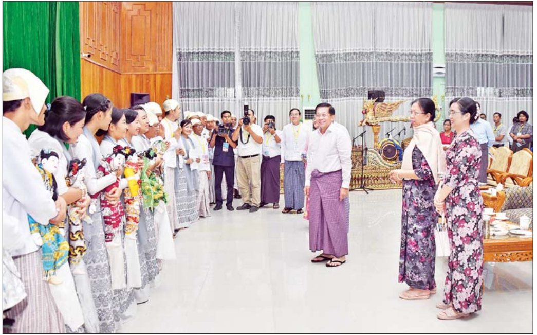
နိုင်ငံတော်စီမံအုပ်ချုပ်ရေးကောင်စီဥက္ကဋ္ဌ နိုင်ငံတော်ဝန်ကြီးချုပ် ဗိုလ်ချုပ်မှူးကြီး မင်းအောင်လှိုင်နှင့် ဇနီးဒေါ်ကြူကြူလှ ရုပ်စုံသဘင်အဖွဲ့လိုက် အကဖြတ်ပွဲအဖွဲ့ဝင်များနှင့် ပြိုင်ပွဲဝင်များအား ရင်းရင်းနှီးနှီးနှုတ်ဆက်စဉ်။

ဦးတည်ချက်များဖြင့် ထည့်သွင်းကျင်းပ မြန်မာ့ရိုးရာယဉ်ကျေးမှု အဆို၊ အက၊ အရေး၊ အတီး ပြိုင်ပွဲကို ၁၉၉၃ ခုနှစ်မှ စတင်ကျင်းပခဲ့ပြီး ၁၉၉၈ ခုနှစ်ပြိုင်ပွဲတွင် ရုပ်စုံသဘင်ပြိုင်ပွဲအဖြစ် “စိရရ” ဇာတ်တော်ကြီးဖြင့် စတင်ယှဉ်ပြိုင်ခဲ့ကြောင်း၊