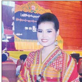
မာမမင်းသူ