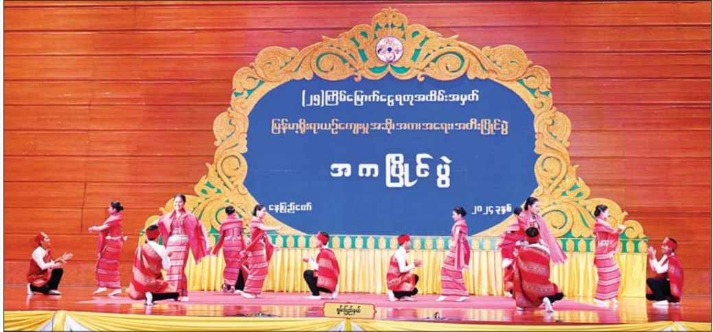
ချင်းတိုင်းရင်းသားရိုးရာ အလှူတန်ခိုးအဆင့် အကပြိုင်ပွဲတွင် ရှမ်းပြည်နယ်ကိုယ်စားပြု ပြိုင်ပွဲဝင်အဖွဲ့က ချင်းတိုင်းရင်းသားရိုးရာ ကကြိုး၊ ကတွက်များကို ချင်းအလှ၊ ချင်းဟန်တို့ဖြင့် ပေါင်းစပ်ကာ ကပြယှဉ်ပြိုင်စဉ်။

နိုင်ငံတော်ဝန်ကြီးချုပ် ဗိုလ်ချုပ်မှူးကြီး မင်းအောင်လှိုင် နှင့် ဇနီး ဒေါ်ကြူကြူလှနှင့် အဖွဲ့ဝင်များသည် Plenary Hall ၌ကျင်းပသည့် ချင်းတိုင်းရင်းသား ရိုးရာအလှူတန်ခိုးအဆင့် အကပြိုင်ပွဲတွင် တိုင်း ဒေသကြီးနှင့်ပြည်နယ်အလိုက် ပြိုင်ပွဲဝင်အကအဖွဲ့ တစ်ဖွဲ့ချင်းစီက ချင်းပြည်နယ်၏ သဘာဝအလှတရား များ၊ ရိုးရာယဉ်ကျေးမှု ဓလေ့ထုံးတမ်းများကို ဖော်ကျူးထားသည့် “ချင်းတောင်တန်းမှ ကြိုဆို လျက်” ချင်းရိုးရာတေးသီချင်းနောက်ခံဖြင့် လှပ ကျော့ရှင်းသည့် ချင်းတိုင်းရင်းသားရိုးရာ ကကြိုး၊ ကတွက်များကို ချင်း အလှ၊ ချင်း ဟန်တို့ဖြင့် ပေါင်းစပ် ကာ ကပြယှဉ်ပြိုင်မှုများကို ကြည့်ရှုအားပေးကြသည်။ ယှဉ်ပြိုင်ကပြမှုများအပြီးတွင် နိုင်ငံတော်စီမံ အုပ်ချုပ်ရေးကောင်စီဥက္ကဋ္ဌ နိုင်ငံတော်ဝန်ကြီးချုပ်နှင့် ဇနီးတို့သည် ပြိုင်ပွဲအဆင့်အလိုက် အကဖြတ် ဆောင်ရွက်ပေးနေသည့် အက်ဖြတ်ပညာရှင်များနှင့် ပြိုင်ပွဲဝင်များအား ရင်းရင်းနှီးနှီးနှုတ်ဆက်ကြသည်။ ယင်းနောက် ညပိုင်းတွင် နိုင်ငံတော်စီမံအုပ်ချုပ် ရေးကောင်စီဥက္ကဋ္ဌ နိုင်ငံတော်ဝန်ကြီးချုပ် ဗိုလ်ချုပ် မှူးကြီး မင်းအောင်လှိုင်နှင့် ဇနီး ဒေါ်ကြူကြူလှတို့ သည် ပြိုင်ပွဲများသို့ တက်ရောက်လာကြသူများနှင့် အတူ သာသနာရေးနှင့် ယဉ်ကျေးမှုဝန်ကြီးဌာနရှိ ယဉ်ကျေးမှုရတနာခန်းမ၌ ကျင်းပလျက်ရှိသည့် (၂၅) ကြိမ်မြောက် ငွေရတုအထိမ်းအမှတ် မြန်မာ့ရိုးရာ ယဉ်ကျေးမှု စာမျက်နှာ ၄ သို့