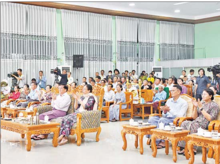
နိုင်ငံတော်စီမံအုပ်ချုပ်ရေးကောင်စီဥက္ကဋ္ဌ နိုင်ငံတော်ဝန်ကြီးချုပ် ဗိုလ်ချုပ်မှူးကြီး မင်းအောင်လှိုင်နှင့် ဇနီးဒေါ်ကြူကြူလှ ပါသောရှင်အဆင့် (ပထမတန်း) ပြိုင်ပွဲတွင် “ဝေသာန္တရာ” ဇာတ်တော်ကြီးဖြင့် မန္တလေး တိုင်းဒေသကြီးကိုယ်စားပြု ရတနာပုံရုပ်စုံသဘင်အဖွဲ့က အကအလှများ၊ စကားပြောများဖြင့် သရုပ်ဖော်ယှဉ်ပြိုင်မှုများကို ကြည့်ရှုအားပေးစဉ်။