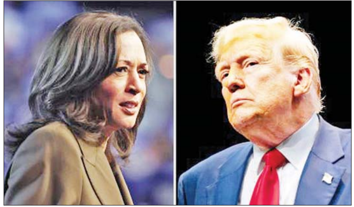
ဒုတိယသမ္မတ ကာမလာဟားရစ်နှင့် သမ္မတဟောင်း ဒေါ်နယ်ထရမ်။

သို့သော်လည်း ပြီးခဲ့သည့် ၂၀၂၀ ပြည့်နှစ် ရွေးကောက်ပွဲတွင်မူ ဂျိုးဘိုင်ဒင်က ဒေါ်နယ်ထရမ်ကို မဲရလဒ်အနည်းငယ်အသာဖြင့် အနိုင်ရရှိခဲ့သည်။ ၂၈ နှစ်တာကာလအတွင်း ဒီမိုကရက်တို့၏ ပထမဦး