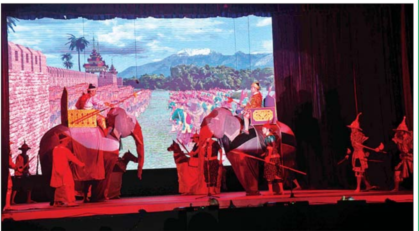
ဇာတ်တော်ကြီးအဖွဲ့လိုက် ဝါသနာရှင်အဆင့် (ပထမတန်း)ပြိုင်ပွဲ မဟာဇနကဇာတ်တော်ကြီးဖြင့် စစ်ကိုင်းတိုင်းဒေသကြီး ကိုယ်စားပြု သီရိဇေယျာဇာတ်တော်ကြီးအဖွဲ့က မြန်မာ့ဇာတ်သဘင်၏ အနုပညာရသမြောက်စွာ ယှဉ်ပြိုင်နေမှုကို တွေ့ရစဉ်။