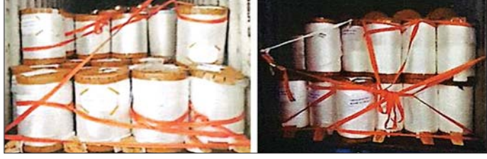
အေးရှားဝေါလ်ကုန်သေတ္တာ စစ်ဆေးရေးစခန်း၌ ဖမ်းဆီးရမိမှု။