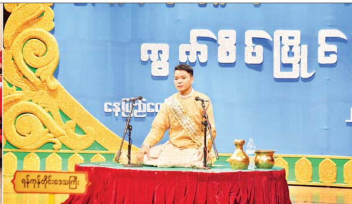
ပြည်ထောင်စုတရားသူကြီးချုပ် ဦးသာဌေးနှင့် တာဝန်ရှိသူများ ဝါသနာရှင်အဆင့် (ဒုတိယတန်း) ကွက်စိပ်ပြိုင်ပွဲတွင် ရန်ကုန်တိုင်းဒေသကြီးမှ ပြိုင်ပွဲဝင်တစ်ဦး၏ “သမုဒ္ဒဝါဏီဇေတိတော်” အနုစိတ်ကဏ္ဍ ဦးတည်ချက် ပေါ်လွင်အောင် နှုတ်မှုစွမ်းရည် ပြသဟောပြောယှဉ်ပြိုင်နေမှုကို ကြည့်ရှုအားပေးစဉ်။