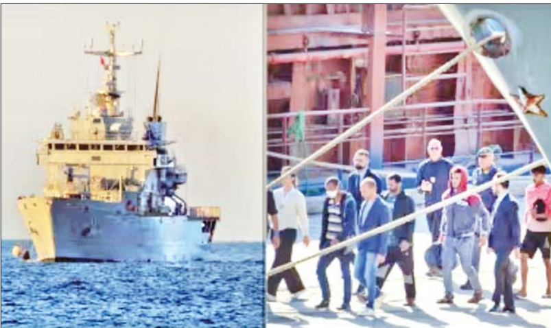
အယ်လ်ဘေးနီးယားသို့ ပို့ဆောင်ခံရမည့် ရွှေ့ပြောင်းနေထိုင်သူများကို သယ်ဆောင်လာသည့် သင်္ဘောကို တွေ့ရစဉ်။

ဥရောပသမဂ္ဂ အဖွဲ့ကြီးအနေနဲ့ အယ်လ်ဘေးနီးယားအစိုးရနဲ့ သဘောတူညီမှုရယူနိုင်ခဲ့တဲ့ အီတလီဝန်ကြီးချုပ်ဆီကနေ သင်ယူသင့်တယ်လို့ ဥရောပကော်မရှင်ဥက္ကဋ္ဌက ပြောပါတယ်။ အခုဆိုရင် အယ်လ်ဘေးနီးယားမှာ ခိုလှုံခွင့်တောင်းခံသူတွေကို ထားရှိမယ့် စင်တာနှစ်ခု တည်ဆောက်ခဲ့ပြီး