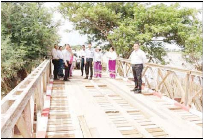
ပျဉ်းမနားမြို့ ပေါစိန်ခေါ်-သစ်စိမ့်ပင်တံတား ပျက်စီးမှုနှင့် ပြုပြင်ဆောင်ရွက်နေမှုများအား သမဝါယမနှင့် ကျေးလက်ဖွံ့ဖြိုးရေးဝန်ကြီးဌာန ဒုတိယဝန်ကြီး ကွင်းဆင်းစစ်ဆေးစဉ်။

ရာဂီမုန့်တိုင်းကြောင့် ပျက်စီးဆုံးရှုံးခဲ့တဲ့ ဒေသတွေအတွက် ကူညီကယ်ဆယ်ရေးနှင့် ပြန်လည် ထူထောင်ရေးလုပ်ငန်းစဉ်တွေ ဆောင်ရွက်ဖို့အတွက် နိုင်ငံအတွင်းရှိ ပုဂ္ဂလိကလုပ်ငန်းရှင်တွေ၊ စေတနာရှင်တွေကလည်း ပထမအကြိမ် အလှူငွေ ၃၂ ဒသမ ၂ ဘီလီယံကျော်၊ ဒုတိယအကြိမ် ၁၀ ဒသမ ၅ ဘီလီယံကျော်၊ နိုင်ငံတော်ဝန်ကြီးချုပ်ထံ ပေးအပ်လှူဒါန်းခဲ့ပြီး စုစုပေါင်း ၄၂ ဒသမ ၇ ဘီလီယံ ကျော် ရရှိခဲ့ပါတယ်။ မြန်မာတို့ရဲ့ သဒ္ဓါတရား၊ စာနာ ဖေးမတတ်မှုတွေက အားရစရာပါ။ စက်တင်ဘာ ၁၆ ရက်က ပြုလုပ်ခဲ့တဲ့