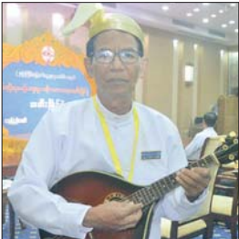
ဦးမြေဌေး

နိုင်ငံတော်စီမံအုပ်ချုပ်ရေးကောင်စီ လက်ထက်မှာ မြန်မာ့ရိုးရာယဉ်ကျေးမှု အဆို၊ အက၊ အရေး၊ အတီးဆိုတဲ့ အနုပညာအမွေအနှစ်တွေ မပျောက်ပျက်အောင်ထိန်းသိမ်းတဲ့အနေနဲ့ ဒီပြိုင်ပွဲကြီးကို ပြန်လည်ကျင်းပပေးခဲ့တဲ့အတွက် ကျွန်တော်တို့ အလွန်ပဲဝမ်းသာကြည်နူးပါတယ်။ ကျေးဇူးလည်း အများကြီးတင်ပါတယ်။ မနှစ်ကထက်စာရင် ဇာတ်ညွှန်းရေးတာတို့၊ ပြောကြား၊ ဟောကြားတာတို့ ပိုကောင်းလာတယ်။ ဆိုင်းရဲ့ပုံပိုမိုတွေ့ကာလည်း အဆင့်အတန်းမြင့်မားပါတယ်။