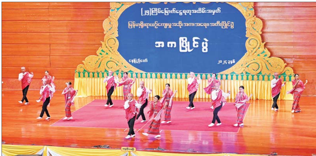
ချင်းတိုင်းရင်းသားရိုးရာ အလွတ်တန်းအဆင့် အကပြိုင်ပွဲတွင် မကွေးတိုင်းဒေသကြီးကိုယ်စားပြု ပြိုင်ပွဲဝင်အဖွဲ့က ချင်းတိုင်းရင်းသားရိုးရာ ကကြီး၊ ကကွက်များကို ချင်း အလှ၊ ချင်း ဟန်တို့ဖြင့် ပေါင်းစပ်ကာ ကပြယှဉ်ပြိုင်စဉ်။

အချိန်ကာလအတိုင်းအတာတစ်ခုအထိ တိမ်မြုပ် ပျောက်ကွယ်နေခဲ့သည့် ရုပ်သေးပညာပြန်လည်ပြီး တစ်ခေတ်ဆန်းသစ်လာခဲ့ကြောင်း၊ အကြောင်းကြောင်း ကြောင့် ကျင်းပခြင်းမပြုနိုင်ခဲ့သည့် အဆို၊ အက၊ အရေး၊ အတီးပြိုင်ပွဲကြီးနှင့်အတူ ရုပ်သေးအနုပညာ ရုပ်သည့် တိမ်မြုပ်ပျောက်ကွယ်သကဲ့သို့ ဖြစ်နေခဲ့ရ ခြင်းကြောင့် (၂၃) ကြိမ်မြောက်ကျင်းပသည့် မြန်မာ့ ရိုးရာယဉ်ကျေးမှု အဆို၊ အက၊ အရေး၊ အတီး ပြိုင်ပွဲမှ စတင်၍ မြန်မာ့ရိုးရာယဉ်ကျေးမှုအမွေအနှစ်များ ထိန်းသိမ်းနိုင်ရန်နှင့် မြန်မာ့ရုပ်သေးပညာရပ်၊ မြန်မာ့ရုပ်စုံပညာရပ်များ ပြန်လည်ဖော်ထုတ်နိုင်ရန် ဖြစ်ကြောင်းနှင့် “ဝေဿန္တရာ” ဇာတ်တော်ကြီးကို အလောင်းတော် ဝေဿန္တရာမင်းကြီး ဖြည့်ဆည်း ကျင့်ကြံခဲ့သော ဒါနပါရမီ၏ မြင့်မြတ်နက်ရှိုင်းမှုကို ကြည့်ညိုသဒ္ဓါပွားများနိုင်စေရန်၊ ဒါနပါရမီ အထွက် တက်လျက် အခြံအရံပါရမီများအကြောင်းကို သိရှိ နာယူကျင့်သုံးနိုင်စေရန်နှင့် ဗုဒ္ဓဝင်ဆိုင်ရာ သုတ၊ ကိုယ်ကျင့်တရား ပိုမိုမြင့်မားလာစေရန် စသည့် ဦးတည်ချက်များဖြင့် ထည့်သွင်းကျင်းပခဲ့ခြင်းဖြစ် ကြောင်း သတင်းရရှိသည်။ သတင်းစဉ်