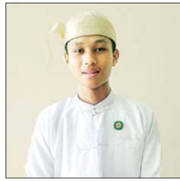
မောင်ညီမင်းအောင်