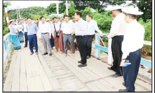
တပ်ကုန်းမြို့နယ် ရွှေမြို့ရွာ ဆင်သေချောင်းကူးတံတား ပျက်စီးမှုအား သမဝါယမနှင့် ကျေးလက်ဖွံ့ဖြိုးရေးဝန်ကြီးဌာန ပြည်ထောင်စုဝန်ကြီး ဦးလှဦး ကွင်းဆင်းစစ်ဆေးစဉ်။

တိုင်းဖွန်းမုန်တိုင်းရာဂါဟာ တောင်တရုတ်ပင်လယ် အတွင်း ဩဂုတ် ၃၁ ရက်တွင် စတင်အစပျိုးခဲ့ပြီး ယင်းမှတစ်ဆင့် အားကောင်းသော တိုင်းဖွန်းမုန်တိုင်း အသွင် ကူးပြောင်းသွားခဲ့ကာ စက်တင်ဘာ ၆ ရက်တွင် တရုတ်နိုင်ငံ၊ စက်တင်ဘာ ၇ ရက်တွင် ဗီယက်နမ်နိုင်ငံတို့ကို လေတိုက်နှုန်းပြင်းအား တစ်နာရီလျှင် မိုင် ၁၆၀ နှုန်းဖြင့် ဝင်ရောက် တိုက်ခတ်ခဲ့ပြီး ပျက်စီးမှုများစွာရှိခဲ့သလို သိရပါ တယ်။ စက်တင်ဘာ ၆ ရက်တွင် ရာဂါမုန်တိုင်း ဝင်ရောက်တိုက်ခတ်ခဲ့မှုကြောင့် တရုတ်နိုင်ငံ၌ သေဆုံးသူ ၁၆ ဦး၊ ပျောက်ဆုံး ၁၇ ဦး၊ ဒုက္ခသည်ပေါင်း ၂၇၀ နှင့် နိုင်ငံမြောက်ပိုင်းနဲ့ အလယ်ပိုင်း ပြည်နယ်အချို့ရှိ လူပေါင်း နှစ်ထောင်ခန့် မုန်တိုင်း ဒဏ်ခံစားခဲ့ရပြီး ယွမ် ၃၂ ဒသမ ၇ ဘီလီယံခန့် အမေရိကန်ဒေါ်လာ (၄ ဒသမ ၆) ဘီလီယံခန့် ဆုံးရှုံးခဲ့ရပါသည်။ စက်တင်ဘာ ၂၈ ရက် စာရင်း အရ ဗီယက်နမ်နိုင်ငံမှာတော့ မုန်တိုင်းကြောင့် ပျက်စီးဆုံးရှုံးမှုများအနေဖြင့် သေဆုံးသူ ၂၉၉ ဦး၊ ပျောက်ဆုံးသူ ၃၄ ဦး၊ အိုးအိမ်၊ စက်ရုံအလုပ်ရုံ လမ်း၊ တံတားနှင့် စိုက်ပျိုးမြေများစွာ ပျက်စီးဆုံးရှုံးခဲ့ပြီး ဗီယက်နမ်နိုင်ငံ ၁၃ ဒသမ ၅ ထရီလီယံ (အမေရိကန် ဒေါ်လာ ၄ ဒသမ ၂ ဘီလီယံ ခန့်) ဆုံးရှုံးခဲ့သလို သိရပါသည်။ ထိုင်းနိုင်ငံမှာတော့ ပြည်နယ်ခုနစ်ခု မှာ သေဆုံးသူ ၄၂ ဦး (ရေကြီးမကြောင့် ၁၉ ဦး၊ မြေပြိုမကြောင့် ၂၃ ဦး)၊ ထိခိုက်ဒဏ်ရာရရှိသူ ၂၄ ဦး၊ အိမ်ထောင်စုပေါင်း ၂၈၀၀၀ ကျော် ပျက်စီးခဲ့ပြီး ကလေးငယ်ပေါင်း ၆၈၀၀၀ ခန့် မုန်တိုင်းဒဏ်ခံစား ခဲ့ရပါသည်။