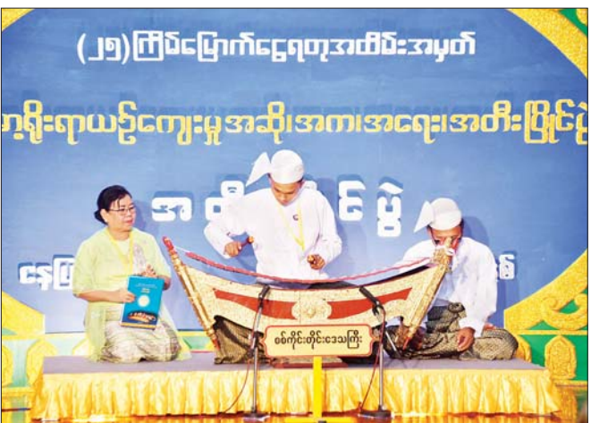
အခြေခံပညာအဆင့် (အသက် ၁၅ နှစ်မှ ၂၀ နှစ်အတွင်း) အမျိုးသား ပတ္တလားအတီးပြိုင်ပွဲတွင် စစ်ကိုင်းတိုင်းဒေသကြီးမှ မောင်ကောင်းဆက်သူ ယှဉ်ပြိုင်တီးခတ်မှု။