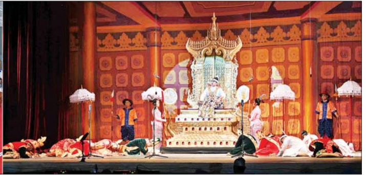
နိုင်ငံတော်စီမံအုပ်ချုပ်ရေးကောင်စီအဖွဲ့ဝင်များနှင့် တာဝန်ရှိသူများ စာတော်ကြီးအဖွဲ့လိုက် ဝါသနာရှင်အဆင့် (ပထမတန်း)ပြိုင်ပွဲ မဟာဇနကဇာတ်တော် ကြီးဖြင့် စစ်ကိုင်းတိုင်းဒေသကြီးကိုယ်စားပြု သီရိဇေယျာ ဇာတ်တော်ကြီးအဖွဲ့က မြန်မာ့ဇာတ်သဘင်၏ အနုပညာရသမြောက်စွာ ယှဉ်ပြိုင်နေမှုကို ကြည့်ရှုအားပေးစဉ်။