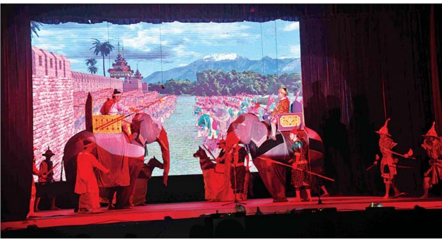
ဇာတ်တော်ကြီးအဖွဲ့လိုက် ဝါသနာရှင်အဆင့် (ပထမတန်း)ပြိုင်ပွဲ မဟာဇနကဇာတ်တော်ကြီးဖြင့် စစ်ကိုင်းတိုင်းဒေသကြီးကိုယ်စားပြု သီရိဇေယျာဇာတ်တော်ကြီးအဖွဲ့က မြန်မာ့ဇာတ်သဘင်၏ အနုပညာရသမြောက်စွာ ယှဉ်ပြိုင်နေမှု။