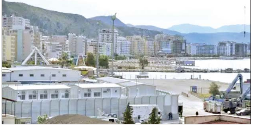
အယ်လ်ဘေးနီးယားအနောက်မြောက်ပိုင်းရှိ ရွှေ့ပြောင်းနေထိုင်သူများ လက်ခံရေးစင်တာကို တွေ့ရစဉ်။

ဖိုးရိမ်နေကြရ ဒါဟာ ဘာကြောင့်လဲဆိုရင် ရွှေ့ပြောင်းနေထိုင်မှုဆိုင်ရာ တရားဝင်လမ်းကြောင်းတွေကို လစ်လျူရှုပြီး မူဝါဒတွေနောက်ကိုလည်း လိုက်နေလို့ ဖြစ်တယ်လို့ သူကဆက်ပြောပါတယ်။ အီတလီကတော့ အယ်လ်ဘေးနီးယားမှာ ရွှေ့ပြောင်းနေထိုင်သူတွေ ထားရှိဖို့ စင်တာတွေ တည်ဆောက်ထားပါတယ်။ ဥရောပသမဂ္ဂပြင်ပမှာ အဲဒီလို အဆောက်အအုံများ တည်ဆောက်ထားရှိခြင်းဖြင့် ဥရောပသမဂ္ဂ အဖွဲ့ဝင်နိုင်ငံများဆီကို တရားမဝင်ခိုးဝင်နေထိုင်ဖို့ ကြိုးပမ်းသူများကို အဟန့်အတား ဖြစ်စေမယ်လို့ အီတလီဝန်ကြီးချုပ်က ပြောပါတယ်။ ဒါပေမယ့် ရွှေ့ပြောင်းနေထိုင်သူများ အခွင့်အရေးအတွက် အာမခံချက် လုံလုံလောက်လောက် မပေးနိုင်လို့ လူ့အခွင့်အရေးအုပ်စုများက ဖိုးရိမ်နေကြရပါတယ်။ ကိုးကား - သည်ဂါဒီးယန်း