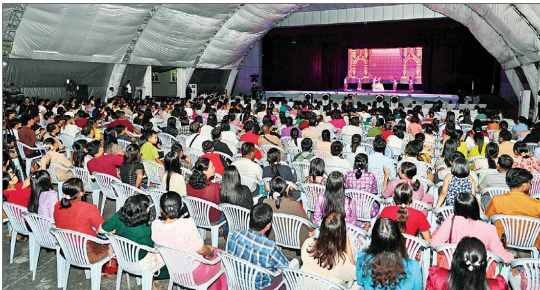
ဇာတ်တော်ကြီးအဖွဲ့လိုက် ဝါသနာရှင်အဆင့် (ပထမတန်း) ပြိုင်ပွဲ မဟာဇနကဇာတ်တော် ကြီးဖြင့် စစ်ကိုင်းတိုင်းဒေသကြီးကိုယ်စားပြု သီရိဇယျာ ဇာတ်တော်ကြီးအဖွဲ့က မြန်မာ့ဇာတ်သဘင်၏ အနုပညာရသမြောက်စွာ ယှဉ်ပြိုင်နေမှုကို တွေ့ရစဉ်။

ရန်ကုန်တိုင်းဒေသကြီး၊ ဧရာဝတီတိုင်း ဒေသကြီးနှင့် မန္တလေးတိုင်းဒေသကြီး တို့မှ ပြိုင်ပွဲဝင်များက “မြဲမန်းဂီရီ” (ယိုးဒယား) သီချင်းဖြင့်လည်းကောင်း၊ အခြေခံပညာအဆင့် (အသက် ၁၀ နှစ်မှ ၁၅ နှစ်အတွင်း) အမျိုးသမီးပြိုင်ပွဲတွင် စစ်ကိုင်းတိုင်းဒေသကြီး၊ ရန်ကုန်တိုင်း ဒေသကြီး၊ မကွေးတိုင်းဒေသကြီး၊ ပဲခူး တိုင်းဒေသကြီးနှင့် ဧရာဝတီတိုင်းဒေသ ကြီးတို့မှ ပြိုင်ပွဲဝင်များက “မင်္ဂလာ ဆယ့်နှစ်ပါး” (ကာလပေါ) သီချင်းဖြင့် လည်းကောင်း တီးခတ်ယှဉ်ပြိုင်ကြသည်။