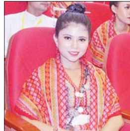
မခင်လပြည့်