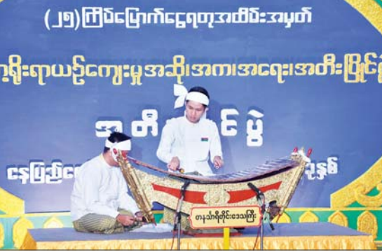
ဒုတိယဗိုလ်ချုပ်ကြီး ဖုန်းမြတ်နှင့် တာဝန်ရှိသူများ အဆင့်မြင့်ပညာအဆင့် ပတ္တလားအမျိုးသားပြိုင်ပွဲတွင် တနင်္သာရီတိုင်းဒေသကြီးမှ ပြိုင်ပွဲဝင်တစ်ဦးက ငြိမ်ညောင်းသာယာ စွာ တီးခတ်ယှဉ်ပြိုင်နေမှုကို ကြည့်ရှုအားပေးစဉ်။

အရေးပြိုင်ပွဲကို သာသနာရေးနှင့် ယဉ်ကျေးမှုဝန်ကြီးဌာနရှိ ယဉ်ကျေးမှု ရတနာခန်းမ၌ကျင်းပရာ အဆင့်မြင့်ပညာ အဆင့်မြင့်ပွဲတွင် မန္တလေးတိုင်းဒေသကြီး၊ ပဲခူးတိုင်းဒေသကြီး၊ မကွေးတိုင်းဒေသ ကြီး၊ ရန်ကုန်တိုင်းဒေသကြီး၊ ဧရာဝတီ တိုင်းဒေသကြီး၊ စစ်ကိုင်းတိုင်းဒေသကြီး နှင့် ကရင်ပြည်နယ်တို့မှ ပြိုင်ပွဲဝင်များက “ထံတျာတေအစ မဟာဂီတ” ခေါင်းစဉ် ဖြင့် ဂီတရသစုံလင်စွာ ဖော်ကျူးတေးဖွဲ့ ယှဉ်ပြိုင်ကြသည်။ စာမျက်နှာ ၆ သို့