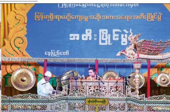
ပြည်ထောင်စုဝန်ကြီး ဒုတိယဗိုလ်ချုပ်ကြီး ထွန်းထွန်းနောင် ဝါသနာရှင်အဆင့် (ဒုတိယတန်း) ဆိုင်းတစ်ဦးချင်း အမျိုးသမီးပြိုင်ပွဲတွင် ရန်ကုန်တိုင်းဒေသကြီးမှ ပြိုင်ပွဲဝင် တစ်ဦး၏ တီးခတ်ယှဉ်ပြိုင်နေမှုကို ကြည့်ရှုအားပေးစဉ်။

“ဂုဏ်တော်ဖွင့်” (ကာလပေါ) သီချင်းဖြင့် လည်းကောင်း၊ အခြေခံပညာအဆင့် (အသက် ၁၅ နှစ်မှ ၂၀ နှစ်အတွင်း) အမျိုးသားပြိုင်ပွဲတွင် ရန်ကုန်တိုင်းဒေသ ကြီး၊ ဧရာဝတီတိုင်းဒေသကြီးနှင့် ပဲခူး တိုင်းဒေသကြီးတို့မှ ပြိုင်ပွဲဝင်များက “သည်ဆောင်းဟောမန်” (ဘွဲ့) သီချင်းဖြင့် လည်းကောင်း၊ အခြေခံပညာအဆင့် (အသက် ၁၅ နှစ်မှ ၂၀ နှစ်အတွင်း) အမျိုးသမီးပြိုင်ပွဲတွင် ဧရာဝတီတိုင်း