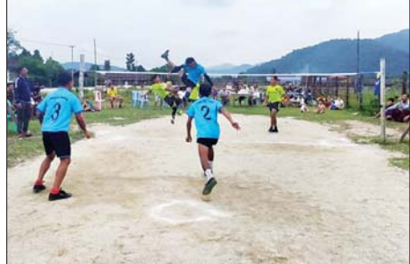
ရဲရင့်လွင် ဓာတ်ပုံ-MNL