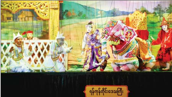
ပြည်ထောင်စုဝန်ကြီး ဦးတင်ဦးလွင် ရုပ်စုံသဘင်အဖွဲ့လိုက်ပြိုင်ပွဲတွင် ဝေယျာဓိရာဇာတော်တော်ကြီးဖြင့် ရန်ကုန်တိုင်းဒေသကြီးကိုယ်စားပြု တော်ဝင်ရုပ်စုံအဖြင့်သဘင်အဖွဲ့ တင်ဆက်ကပြယှဉ်ပြိုင်မှုကို ကြည့်ရှုအားပေးစဉ်။

ပြည်နယ်၊ ချင်းပြည်နယ်နှင့် ကယား ပြည်နယ်တို့မှ ပြိုင်ပွဲဝင်များက စုံလင်စွာဖြင့် ယှဉ်ပြိုင်ကြသည်။ အရေးပြိုင်ပွဲ (သီချင်းသံစဉ် ထည့်သွင်းလေ့ကျင့် သီဆိုခြင်း) ကို သာသနာရေးနှင့် ယဉ်ကျေးမှု ဝန်ကြီးဌာနရှိ ယဉ်ကျေးမှုရတနာ ခန်းမ၌ကျင်းပရာ အခြေခံပညာ အဆင့် (အသက် ၁၅ နှစ်မှ ၂၀ နှစ် အတွင်း) ပြိုင်ပွဲတွင် ကချင် ပြည်နယ်၊ ကယားပြည်နယ်၊