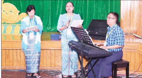
စန္ဒရားအတီးပြိုင်ပွဲ အခြေခံပညာအဆင့် (အသက် ၁၀ နှစ်မှ ၁၅ နှစ်အတွင်း) အမျိုးသား ပြိုင်ပွဲတွင် တနင်္သာရီတိုင်းဒေသကြီးမှ ပြိုင်ပွဲဝင်၏ တီးခတ်ယှဉ်ပြိုင်မှုကို တွေ့ရစဉ်။