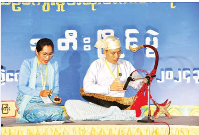
စောင်းအတီးပြိုင်ပွဲ ဝါသနာရှင် (ဒုတိယတန်း) အမျိုးသားပြိုင်ပွဲတွင် ရန်ကုန်တိုင်းဒေသကြီးမှ မောင်မျိုးကို တီးခတ်ယှဉ်ပြိုင်နေမှုကို တွေ့ရစဉ်။