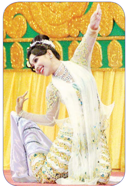
အကပြိုင်ပွဲ အဆင့်မြင့်ပညာအဆင့် (အမျိုးသမီး) တွင် ရန်ကုန်တိုင်းဒေသကြီးမှ ပြိုင်ပွဲဝင်၏ ကပြယှဉ်ပြိုင်မှု။