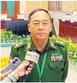
ဗိုလ်မှူးကြီး ဝဏ္ဏအောင်

ဆွေးနွေးတဲ့ အကြောင်းအရာတွေက ဒေသတည်ငြိမ်အေးချမ်းရေး၊ နယ်မြေဒေသရှိ ပြည်သူများ၏ လူ့ခွင့်ပေးတာဝန် ဖွံ့ဖြိုးတိုးတက်ရေး၊ အကြမ်းဖက်လုပ်ရပ်များအား အားပေးကူညီမှုမပြုရေး၊ မူးယစ်ဆေးဝါး၊ လက်နက်/ခဲယမ်းနဲ့ တရားမဝင်