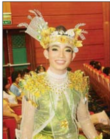
မောင်ဇေယျာ