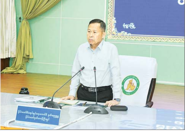
နိုင်ငံတော်စီမံအုပ်ချုပ်ရေးကောင်စီဒုတိယဥက္ကဋ္ဌ ဒုတိယဝန်ကြီးချုပ် ဒုတိယဗိုလ်ချုပ်မှူးကြီး စိုးဝင်း စစ်ကိုင်းတိုင်းဒေသကြီးအစိုးရအဖွဲ့မှ တာဝန်ရှိသူများအား တွေ့ဆုံ၍ နယ်မြေတည်ငြိမ်အေးချမ်းရေးနှင့် လုံခြုံရေးဆိုင်ရာ ကိစ္စရပ်များနှင့်ပတ်သက်ပြီး အမှာစကားပြောကြားစဉ်။

ကျောမိုးမှ ဦးစွာ တိုင်းဒေသကြီးဝန်ကြီးချုပ် ဦးမြတ်ကျော်နှင့် တိုင်းဒေသကြီးအစိုးရအဖွဲ့ဝင် ဝန်ကြီးများက တိုင်းဒေသကြီးအတွင်းရှိ အုပ်ချုပ်ရေး၊ စီးပွားရေး၊ လူမှုရေးဆိုင်ရာကိစ္စရပ်များ၊ နိုင်ငံစီးပွားမြှင့်တင်ရေးရန်ပုံငွေမှ ဒေသတွင်းစိုက်ပျိုးမွေးမြူရေးနှင့် MSME လုပ်ငန်းများအတွက် ချေးငွေများ ထုတ်ချေးထားမှု၊ ပညာရေး၊ ကျန်းမာရေး စသည့်ကဏ္ဍအလိုက် ဒေသဆိုင်ရာအချက်အလက်များ၊ နယ်မြေဒေသတည်ငြိမ်အေးချမ်းရေးနှင့် လုံခြုံရေးအတွက် ပြည်သူ့လုံခြုံရေးနှင့် အကြမ်းဖက်နှိမ်နင်းရေးအဖွဲ့များ ဖွဲ့စည်းထားရှိမှု၊ လူဦးရေနှင့်အိမ်အကြောင်းအရာသန်းခေါင်စာရင်းကောက်ယူရေးလုပ်ငန်းများတွင် ဌာနဆိုင်ရာအဖွဲ့ဝင်များနှင့်အတူ ပူးပေါင်းပါဝင် ဆောင်ရွက်ပေးလျက်ရှိမှု၊ နယ်မြေဒေသတည်ငြိမ်အေးချမ်းရေးအတွက် လုံခြုံရေးဆိုင်ရာ တာဝန်ရှိသူများ၊ ဌာနဆိုင်ရာတာဝန်ရှိသူများက အတူတကွ ပိုင်းဝန်းဆောင်ရွက်လျက်ရှိမှု အခြေအနေများနှင့် အခြားဆောင်ရွက်နေမှုများကို သက်ဆိုင်ရာကဏ္ဍများအလိုက် ရှင်းလင်းတင်ပြသည်။