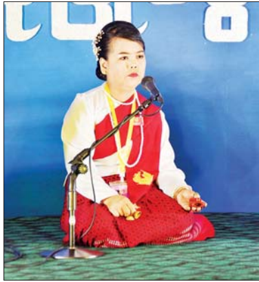
မဟာဂီတ တေးသီချင်းအဆိုပြိုင်ပွဲ ဝါသနာရှင်အဆင့် (ခုတိယတန်း) အမျိုးသမီးပြိုင်ပွဲတွင် မွန်ပြည်နယ်မှ ပြိုင်ပွဲဝင်တစ်ဦး သီဆိုယှဉ်ပြိုင်စဉ်။