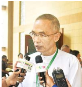
ဒုတိယဗိုလ်ချုပ်ကြီး စိန်ဝင်း(ငြိမ်း)