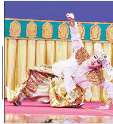
အကပြိုင်ပွဲ ဝါသနာရှင်အဆင့် (ခုတိယတန်း) အမျိုးသား ပြိုင်ပွဲတွင် ကယားပြည်နယ်မှ ပြိုင်ပွဲဝင်တစ်ဦး ကပြ ယှဉ်ပြိုင်စဉ်။

ကရင်ပြည်နယ်၊ တနင်္သာရီတိုင်း ဒေသကြီး၊ မကွေးတိုင်းဒေသကြီး၊ မန္တလေးတိုင်းဒေသကြီး၊ ရန်ကုန် တိုင်းဒေသကြီးနှင့် ဧရာဝတီတိုင်း ဒေသကြီးတို့မှ ပြိုင်ပွဲဝင်များက “လူငယ်အားမာန် အမြှူငှာသန် နိုင်ငံပြည်ကျိုး ဆောင်သယ်ပိုး” ခေါင်းစဉ်ဖြင့် လည်းကောင်း၊ ဝါသနာရှင်အဆင့် (ခုတိယတန်း) ပြိုင်ပွဲတွင် ကချင်ပြည်နယ်၊ ချင်း ပြည်နယ်၊ မွန်ပြည်နယ်၊ ရခိုင် ပြည်နယ်၊ ရှမ်းပြည်နယ်၊ စစ်ကိုင်း တိုင်းဒေသကြီး၊ တနင်္သာရီတိုင်း ဒေသကြီး၊ ပဲခူးတိုင်းဒေသကြီး၊ မကွေးတိုင်းဒေသကြီး၊ မန္တလေး တိုင်းဒေသကြီး၊ ရန်ကုန်တိုင်းဒေသ ကြီးနှင့် ဧရာဝတီတိုင်းဒေသကြီး တို့မှ စာမျက်နှာ ၁၂ သို့