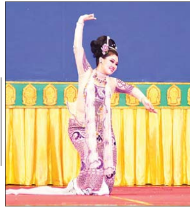
အကပြိုင်ပွဲ အဆင့်မြင့်ပညာအဆင့် အမျိုးသမီးပြိုင်ပွဲတွင် ပဲခူးတိုင်းဒေသကြီးမှ ပြိုင်ပွဲဝင်တစ်ဦး ကပြယှဉ်ပြိုင်စဉ်။