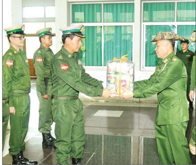
နိုင်ငံတော်စီမံအုပ်ချုပ်ရေးကောင်စီဒုတိယဥက္ကဋ္ဌ ဒုတိယဝန်ကြီးချုပ်မှူးကြီး စိုးဝင်း ဖွဲ့စည်းပြီး နယ်မြေတည်ငြိမ်အေးချမ်းရေးနှင့် လုံခြုံရေးဆိုင်ရာ ကိစ္စရပ်များနှင့်ပတ်သက်ပြီး အမှာစကားပြောကြားစဉ်။