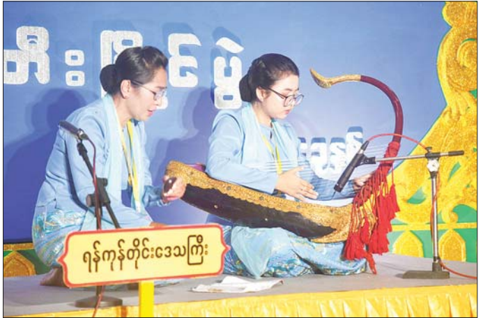
စောင်းအတီးပြိုင်ပွဲ ဝါသနာရှင်အဆင့် (ဒုတိယတန်း) အမျိုးသမီးပြိုင်ပွဲတွင် ရန်ကုန်တိုင်းဒေသကြီးမှ ပြိုင်ပွဲဝင်တစ်ဦး တီးခတ်ယှဉ်ပြိုင်စဉ်။

ဒေသကြီးနှင့် စစ်ကိုင်းတိုင်းဒေသကြီးတို့မှ ပြိုင်ပွဲဝင်များက လည်းကောင်း၊ ဝါသနာရှင်အဆင့် (ပထမတန်း) အမျိုးသားပြိုင်ပွဲတွင် ရန်ကုန်တိုင်းဒေသကြီး၊ ချင်းပြည်နယ်၊ ဧရာဝတီတိုင်းဒေသကြီး၊ ကရင်ပြည်နယ်၊ ပဲခူးတိုင်းဒေသကြီး၊ စစ်ကိုင်းတိုင်းဒေသကြီးနှင့် မန္တလေးတိုင်းဒေသကြီးတို့မှ ပြိုင်ပွဲဝင်များက လည်းကောင်း၊ မြူးကြွမြူးဆိုင်ဆိုင် တီးခတ်ယှဉ်ပြိုင်ကြသည်။ ရုပ်စုံသဘင် အဖွဲ့လိုက်ပြိုင်ပွဲကို သာသနာရေးနှင့် ယဉ်ကျေးမှုဝန်ကြီးဌာနရှိ ယဉ်ကျေးမှုရတနာခန်းမ၌ ကျင်းပရာ ရုပ်စုံသဘင်အဖွဲ့လိုက် ဝါသနာရှင်အဆင့် (ပထမတန်း) ပြိုင်ပွဲတွင် “ဝေသန္တရာ” ဇာတ်တော်ကြီးဖြင့်