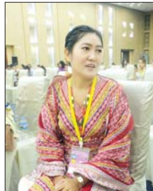
မစမ်းသီတာအေး