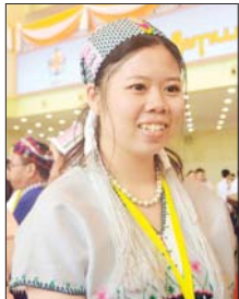
မယ်မင်းမြတ်