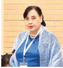
စောမြရာဇာလင်း