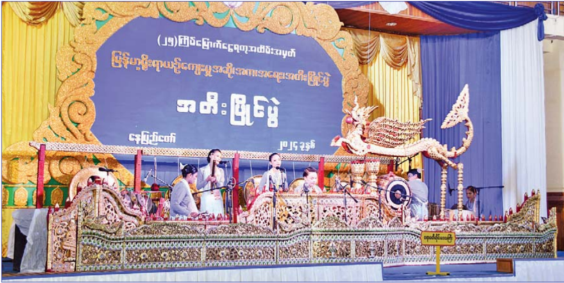
ဆိုင်းဝိုင်းကြီး အဖွဲ့လိုက်ပြိုင်ပွဲ ဝါသနာရှင် (ဒုတိယတန်း) (အမျိုးသမီး) ပြိုင်ပွဲတွင် ရောဝတီတိုင်းဒေသကြီးမှ အေးဆုသန့်စင်နှင့်အဖွဲ့၏ မြိုင်မြိုင်ဆိုင်ဆိုင် တီးခတ်ယှဉ်ပြိုင်မှုကို တွေ့ရစဉ်။