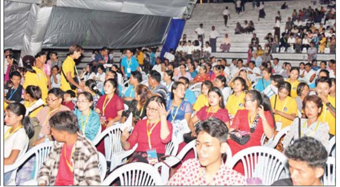
မဟာဇနကဇာတ်တော်ကြီးပြိုင်ပွဲ ဝါသနာရှင်အဆင့် (ပထမတန်း) ပြိုင်ပွဲတွင် မကွေးတိုင်းဒေသကြီး ကိုယ်စားပြု ဖန်ခါးမြေဇာတ်တော်ကြီးအဖွဲ့၏ ဆိုင်ပြော ပညာရှင်များဖြင့် ယှဉ်ပြိုင်နေမှုနှင့် ကြည့်ရှုအားပေးကြသည့် ပရိသတ်များ။