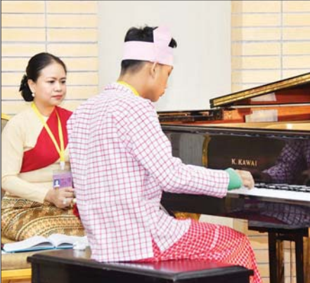
စန္ဒရားတီးပြိုင်ပွဲ အခြေခံပညာအဆင့် (၁၀ - ၁၅ နှစ်အတွင်း) အမျိုးသားပြိုင်ပွဲတွင် မွန်ပြည်နယ်မှ ပြိုင်ပွဲဝင်တစ်ဦး တီးခတ်ယှဉ်ပြိုင်စဉ်။

များ၊ သဘင်ကိုချစ်မြတ်နိုးကြသည့် မိဘပြည်သူများနှင့် ပြိုင်ပွဲဝင်များ၏ အပီတိခံအားများ၊ မိဘများက ပြိုင်ပွဲနေရာအသီးသီး၌ လာရောက်ကြည့်ရှု အားပေးခဲ့ကြသည်။ (၂၅) ကြိမ်မြောက် ငွေရတုအထိမ်းအမှတ် မြန်မာ့ရိုးရာယဉ်ကျေးမှု အဆို၊ အက၊ အရေး၊ အတီး (ဗဟိုအဆင့်) ပြိုင်ပွဲကြီးတွင် ပြိုင်ပွဲဝင်များအတွက် အဆင့်သတ်မှတ်ချက်အနေဖြင့် ဝါသနာရှင်အဆင့် (ပထမတန်း)၊ ဝါသနာရှင်အဆင့် (ဒုတိယတန်း)၊ အဆင့်မြင့်