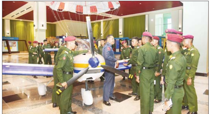
ပုဇွန်သည့် ကမ္ဘာပေါ်ရှိ ထိုင်တော် ဖြစ်သည့် မာရစ်ဗယဗုဒ္ဓရုပ်ပွား သွားရောက်လေ့လာ ဖူးမြော် မှု ကျောက်ဆစ်ဗုဒ္ဓရုပ်ပွားတော် တော်မြတ်ကြီးနှင့် ဥပျာတသန္တ ကြည့်ညိခဲ့ကြကြောင်း သတင်း စေတီတော်ကို လည်းကောင်း ရရှိသည်။ သတင်းစဉ်

စစ်သမိုင်းပြတိုက်နှင့် တပ်မတော် ဆေးရုံများသို့လည်းကောင်း သွား ရောက်လေ့လာခဲ့ကြရာ တာဝန်ရှိ သူများက ဗိုလ်လောင်းများ၏ သိရှိ လိုသည့် မေးမြန်းချက်များအပေါ် ရှင်းလင်းပြောကြားသည်။ အဆိုပါဗိုလ်လောင်းအဖွဲ့ များ သည်လေ့လာရေးကာလအတွင်း၌ မိတ္ထီလာမြို့ရှိ တန်ခိုးကြီးဘုရား၊ ဓေတီပုထိုးများကို လည်းကောင်း၊ နေပြည်တော်ကောင်စီနယ်မြေ ဒက္ခိဏသီရိမြို့နယ်ရှိ ဗုဒ္ဓဥပျာဉ် ဝတ္ထုကတော်တွင် တည်ထား