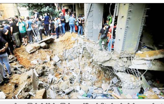
အစ္စရေးတို့ လေကြောင်းတိုက်ခိုက်မှုကြောင့် ဘေရွတ်မြို့ ဆင်ခြေဖုံးရပ်ကွက်တစ်ခု၌ အဆောက်အအုံများ ပျက်စီးမှုကို တွေ့ရစဉ်။

ဟစ်တီဘိုလာ -အစ္စရေး ပဋိပက္ခကြောင့် မိသားစုဝင်များနှင့် ကလေးငယ်များ ကြောက်မက်ဖွယ် အခြေအနေများနှင့် ရင်ဆိုင်နေရသည်ကို မျက်မြင်ကိုယ်တွေ့တွေ့ရှိရပြီးနောက် လက်ဘနွန်နိုင်ငံ၌ အပစ်အခတ်ရပ်စဲမှုများ ချက်ချင်းပြုလုပ်ရန် ကုလသမဂ္ဂအဆင့်မြင့်အရာရှိကြီး နှစ်ဦးက အောက်တိုဘာ ၁၅ ရက်တွင် တောင်းဆိုခဲ့သည်ဟု ကုလသမဂ္ဂကလေးများရန်ပုံငွေအဖွဲ့ (ယူနီဆက်မ်) ၏ ထုတ်ပြန်ချက် အရ သိရသည်။