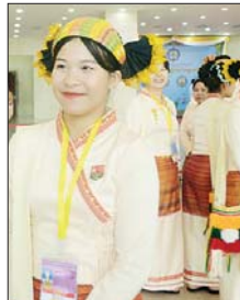
မသွန်းသက်ဗျူး