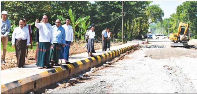
ကရင်ပြည်နယ်ဝန်ကြီးချုပ် ဦးစောမြင့်ဦး ဘားအံမြို့ပတ်လမ်းသစ် အဆင့်မြှင့်တင်ဖောက်လုပ်နေမှုအား ကြည့်ရှုစစ်ဆေးစဉ်။

ဘားအံ အောက်တိုဘာ ၁၅ ကရင်ပြည်နယ် ဘားအံမြို့တွင်း ရပ်ကွက်များ ဖြစ်သော အမှတ်(၄၆၊၇)ရပ်ကွက်များရှိ ချိတ်ဆက်ထားသည့် ဘားအံမြို့ပတ်လမ်းသစ်အား ပြည်နယ်စည်ပင်သာယာရေးအဖွဲ့မှ ဖောက်လုပ်အဆင့်မြှင့်တင်ဆောင်ရွက်လျက်ရှိရာ အောက်တိုဘာ ၁၄ ရက်က ပြည်နယ်ဝန်ကြီးချုပ် ဦးစောမြင့်ဦးနှင့် တာဝန်ရှိသူများ သွားရောက်ကြည့်ရှုစစ်ဆေးသည်။