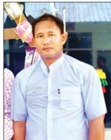
ပြည့်ဖြိုးမော်

(၂၅) ကြိမ်မြောက် ငွေရတုအထိမ်းအမှတ် မြန်မာ့ရိုးရာယဉ်ကျေးမှု အဆို အက၊ အရေး၊ အတီးဖြင့်ပွဲကို နေပြည်တော်၌ ခမ်းနားသိုက်မြိုက်စွာဖြင့် ကျင်းပလျက်ရှိရာ ပြိုင်ပွဲသို့ ဝင်ရောက်ယှဉ်ပြိုင်ကြသည့် တိုင်းဒေသကြီးနှင့် ပြည်နယ်များမှ ပြိုင်ပွဲဝင်များ၊ အုပ်ချုပ်သူများ၏ ရင်တွင်းခံစားချက် စကားသံများကို စုစည်းဖော်ပြလိုက်ပါသည်။