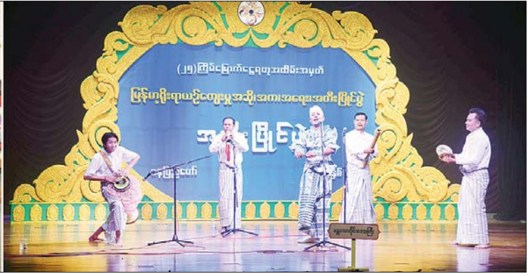
ပြည်ထောင်စုဝန်ကြီး ဝန်ထမ်းများ ပြုစုပေးသည့် ဝါသနာရှင်အဆင့် (ပထမတန်း) ပြိုင်ပွဲတွင် မန္တလေးတိုင်းဒေသကြီး ပြိုင်ပွဲဝင်များ ယှဉ်ပြိုင်မှုကို ကြည့်ရှုအားပေးစဉ်။

စာမျက်နှာ ၁၁ မှ ပြိုင်ပွဲဝင်များက “ဂီတဖြင့် ပြည်အလှဆင်မည်” ခေါင်းစဉ်ဖြင့် လည်းကောင်း၊ ရာသီဥတုသစ်စဉ်ထည့်သွင်း လေ့ကျင့်သီချင်းကြသည်။ စန္ဒရားအတီးပြိုင်ပွဲကို မြန်မာ အပြည်ပြည်ဆိုင်ရာ ကွန်ပဏီလီမိတက် (ပတ်ဝန်းကျင်) News Briefing Room ဌာနက ဝါသနာရှင်အဆင့် (ဒုတိယတန်း) အမျိုးသမီး ပြိုင်ပွဲတွင် ရန်ကုန်တိုင်းဒေသကြီးနှင့် တနင်္သာရီတိုင်းဒေသကြီးတို့မှ ပြိုင်ပွဲဝင်များက “မွှေးလွန်းသည့် ပန်း” (ကာလပေါ) သီချင်းဖြင့် လည်းကောင်း၊ ဝါသနာရှင်အဆင့် (ဒုတိယတန်း) အမျိုးသားပြိုင်ပွဲတွင် စစ်ကိုင်းတိုင်းဒေသကြီး၊ မန္တလေးတိုင်းဒေသကြီး၊ ကချင်ပြည်နယ်၊ တနင်္သာရီတိုင်းဒေသကြီး၊ ကယားပြည်နယ်၊ ဧရာဝတီတိုင်းဒေသကြီး၊ ပဲခူးတိုင်းဒေသကြီး၊ ရန်ကုန်တိုင်းဒေသကြီး၊ ချင်းပြည်နယ်၊ ကရင်ပြည်နယ်နှင့် မွန်ပြည်နယ်တို့မှ ပြိုင်ပွဲဝင်များက “ပန်းပေါက်” (ယိုးဒယား) သီချင်းဖြင့်လည်းကောင်း၊ အခြေခံပညာအဆင့် (အသက် ၁၀ နှစ်မှ ၁၅ နှစ်အတွင်း) အမျိုးသားပြိုင်ပွဲတွင် မကွေးတိုင်းဒေသကြီး၊ ကယားပြည်နယ်၊ ကရင်ပြည်နယ်၊ မန္တလေးတိုင်းဒေသကြီး၊ ကချင်ပြည်နယ်၊ ရန်ကုန်တိုင်းဒေသကြီး၊ ပဲခူးတိုင်းဒေသကြီး၊ ဧရာဝတီတိုင်းဒေသကြီး၊ ရှမ်းပြည်နယ်၊ တနင်္သာရီတိုင်းဒေသကြီး၊