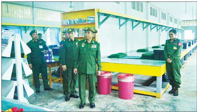
ထို့နောက် ကာကွယ်ရေး နှင့်အဖွဲ့ဝင်များသည် သင်တန်း စစ်ဆေးခဲ့ပြီး လိုအပ်သည်များ ဦးစီးချုပ်ရုံး (ကြည်း) မှ ဒုတိယ သားများ၏ အိမ်ဆောင်နှင့်စားရိပ် ဗိုလ်ချုပ်ကြီး ဖုန်းမြတ် တိုင်းမှူး သာခန်းမအား လှည့်လည်ကြည့်ရှု သတင်းရရှိသည်။ သတင်းစဉ်

ဆောင်ရွက်နေမှု အခြေအနေများ ကို ယနေ့ မွန်းလွဲပိုင်းတွင် ကာကွယ်ရေးဦးစီးချုပ်ရုံး(ကြည်း) မှ ဒုတိယဗိုလ်ချုပ်ကြီး ဖုန်းမြတ်၊ နေပြည်တော်တိုင်းစစ်ဌာနချုပ် တိုင်းမှူး ဗိုလ်ချုပ် စိုးမင်းနှင့် တာဝန်ရှိသူများက သွားရောက်၍ တက္ကသိုလ်လေ့ကျင့်ရေးတပ်ဖွဲ့ဝင် ဆရာ ဆရာမများနှင့် ကျောင်းသား ကျောင်းသူများ လက်နက်ငယ် ဘာသာရပ် လေ့ကျင့်သင်ကြား ပေးနေမှုအား ကြည့်ရှုအားပေး ခဲ့ပြီး တက္ကသိုလ်လေ့ကျင့်ရေး တပ်ဖွဲ့ဝင် ဆရာ ဆရာမများနှင့် ကျောင်းသား ကျောင်းသူများ အတွက် စားသောက်ဖွယ်ရာ များထောက်ပံ့ပေးအပ်သည်။