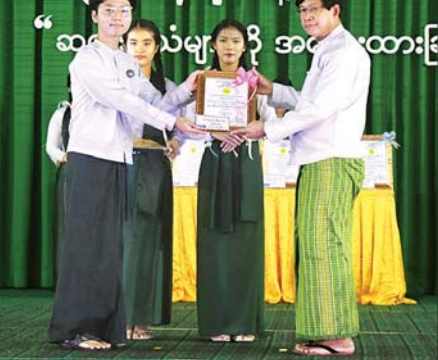
ကမ္ဘာ့ဆရာများနေ့အထိမ်းအမှတ်အခမ်းအနားတွင် ဆုရရှိသူများကို ဂုဏ်ပြုမှတ်တမ်းလွှာနှင့် ဂုဏ်ပြုဆုငွေများ ပေးအပ်ခြင်းဖြစ်သည်။