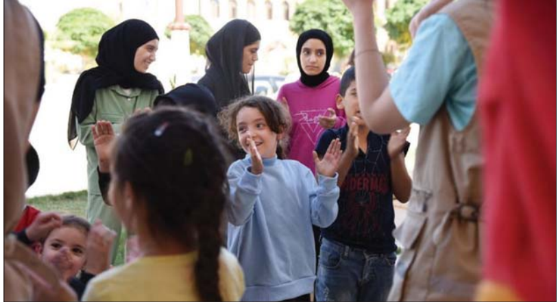
ဆီးရီးယားနိုင်ငံ ဟွမ်းပြည်နယ်ရှိ ခိုလှုံရာနေရာ၌ လက်ဘနွန်ဒုက္ခသည်များကို အောက်တိုဘာ ၂ ရက်က တွေ့ရစဉ်။