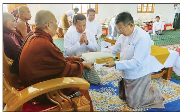
နှင့် သီလရှင်ကျောင်းစုစုပေါင်း ၁၇၆ ကျောင်းအတွက် ဝတ္ထုငွေကျပ် ၄၀၃ သိန်း၊ သင်တန်း ၁၃၁၃ စုံ၊ ပန်းပေါင်း စုံ ဗုဒ္ဓရုပ်ပွားတော် ၇၀၂ ဆူ၊ ဆန်၊ ဆီ၊ စားသောက် ဖွယ်ရာများ၊ သွားတိုက်ဆေး၊ သွားတိုက်တံ၊ တဘက်၊ ဆပ်ပြာမှုန့် စသည်ပစ္စည်းများကို လှူဒါန်းခဲ့ပြီး ဖြစ်ကြောင်း သတင်းရရှိသည်။ သတင်းစဉ်

ကြပြီး ပြည်ထောင်စုဝန်ကြီး၊ ဒုတိယဝန်ကြီးနှင့် တာဝန်ရှိသူများက ရေဘေးရှောင်ကျောင်းတိုက်များမှ ဆရာတော်ကြီးများကို သင်တန်း၊ လှူဖွယ်ပစ္စည်းများ နှင့် အရှင်ဂဝမ္မတိမထေရ်စာအုပ်များကို ဆက်ကပ် လှူဒါန်းကြသည်။ အနုမောဒနာတရားနာကြား ထို့နောက် လယ်ဝေးမြို့ သရက်တောပရိယတ္တိ စာသင်တိုက်ပဓာနနာယကဆရာတော်ထံမှ အနုမော ဒနာတရားနာကြား၍ လှူဒါန်းမှုအစုစုတို့အတွက် ရေစက်သွန်းချ အမျှပေးကြသည်။ ယနေ့အခမ်းအနားတွင် သာသနာရေးနှင့် ယဉ်ကျေးမှုဝန်ကြီးဌာနနှင့် စေတနာရှင် ရဟန်းရှင် လူများက နေပြည်တော်ကောင်စီနယ်မြေ လယ်ဝေး မြို့နယ်အတွင်းရှိ သရက်တော ပရိယတ္တိစာသင်တိုက် နှင့် ရေဘေးရှောင်ဘုန်းတော်ကြီးကျောင်း ၂၆ ကျောင်း အတွက် သင်တန်းနှင့် လှူဖွယ်ပစ္စည်းများ ၅၆ သိန်း ၅ သောင်း ထောက်ပံ့လှူဒါန်းခဲ့ကြောင်းနှင့် ယနေ့ အချိန်အထိ ရေဘေးရှောင်ဘုန်းတော်ကြီးကျောင်း