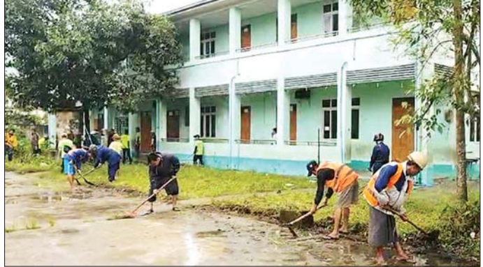
ဖမ်းမော်မြို့၌ ၂၀၂၄ ခုနှစ် ကမ္ဘာ့ဆရာများနေ့ အထိမ်းအမှတ် အခမ်းအနားကျင်းပ

ကောင်စီနယ်မြေ ဇေယျာသီရိမြို့နယ်ရှိ တပ်မတော်ဆေးရုံကြီး (ခုတင် - ၁၀၀၀)၊ ရန်ကုန်တိုင်းဒေသကြီး လှိုင်မြို့နယ်ရှိ ပြည်သူ့ဆေးရုံနှင့် လှည်းကူးမြို့နယ် ဒါးပိန်တိုက်နယ် ဆေးရုံတို့၌ နယ်မြေခံတပ်မတော်သားများက မြန်မာနိုင်ငံရဲတပ်ဖွဲ့ဝင်များ၊ ဌာနဆိုင်ရာဝန်ထမ်းများ၊ ဒေသခံပြည်သူများနှင့်အတူ ဆေးရုံဝင်းအတွင်း၊ အပြင်ရှိ ချုံနွယ်ပေါင်းမြက်များ ခုတ်ထွင်ရှင်းလင်းခြင်း၊ အမှိုက်များရှင်းလင်းခြင်း၊ ခြင်ဆေးဖျန်းပေးခြင်း၊ ကျန်းမာရေးအသိပညာပေး လက်ကမ်းစာစောင်များ ဖြန့်ဝေပေးခြင်းနှင့် ရေစီးရေလာကောင်းမွန်စေရေး ရေနုတ်မြောင်းများ တူးဖော်ပေးခြင်းများကို စုပေါင်းဆောင်ရွက်ပေးကြသည်။