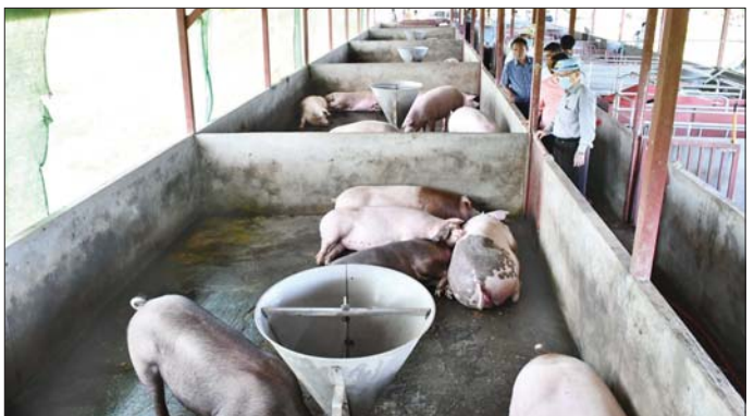
ယခုအခါ ဝက်အကောင် ၁၈၈၈၀ ဆိတ်အကောင် ၉၄၀ မွေးမြူထားရှိကာ ၂၀၂၄ ခုနှစ် ဧပြီလမှ ယခုအထိ ဝက်သား ၅၅၄၅၅ ပိဿာ၊ ဆိတ်သား ၁၄၆၅၅ ကောင်၊ ဥစားကြက်အကောင် ၆၅၀၀၊ ဒေသကြက် အကောင် ၂၅၇၀၊ သိုးအကောင် ၁၁၀ တို့ကို မွေးမြူထားရှိကာ ၂၀၂၄ ခုနှစ်အတွင်း

ဥနှင့် နို့ ထုတ်လုပ်မှု၊ ဇုန်ပတ်လမ်း၊ ဇုန်တွင်းလမ်းများ ဆောင်ရွက်ပြီးစီးမှုနှင့် ဆက်လက်ဆောင်ရွက်မည့် အစီအမံများကို ရှင်းလင်းတင်ပြကြပြီး ပြည်နယ်ဝန်ကြီးချုပ်က ကောင်းမွန်သော မွေးမြူရေးနည်းစနစ်၊ ကျင့်စဉ်များကို တိကျသေချာစွာလိုက်နာ၍ မျိုးကောင်းမျိုးသန့်၊ ပြည့်ဝသော အစာအာဟာရများကို ကျွေးမွေးကာ ရွဲ လုံလုံ ပီရိုယများ စိုက်ထုတ်ကြီးပမ်းခြင်းဖြင့် စွမ်းအားပြည့် မွေးမြူထုတ်လုပ်ကြစေ လိုကြောင်း ပြောကြားသည်။ ထို့နောက် မွေးမြူရေး တောင်သူများက မွေးမြူထုတ်လုပ်ရာတွင် ကြုံတွေ့ရသည့် အခက်အခဲများ၊ လိုအပ်ချက်များကို ဆွေးနွေးတင်ပြကြရာ ပြည်နယ်ဝန်ကြီးချုပ်က သက်ဆိုင်ရာဌာနဆိုင်ရာများနှင့် ပေါင်းစပ်ညှိနှိုင်း