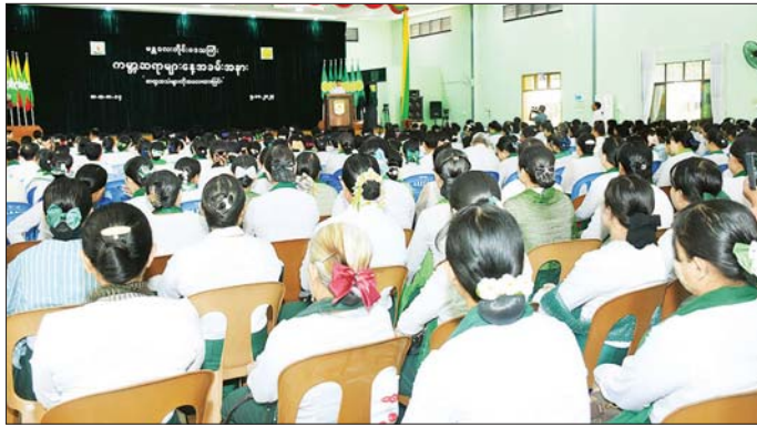
ဖွင့်လှစ်ပေးသည်။ အခမ်းအနားတွင် နိုင်ငံတော်စီမံအုပ်ချုပ်ရေးကောင်စီဥက္ကဋ္ဌ နိုင်ငံတော်ဝန်ကြီးချုပ် ဗိုလ်ချုပ်မှူးကြီး သတိုးမဟာသရေစည်သူ၊ သတိုးသီရိသုဓမ္မ

မန္တလေး အောက်တိုဘာ ၅ မန္တလေးတိုင်းဒေသကြီး ၂၀၂၄ ခုနှစ် ကမ္ဘာ့ဆရာများနေ့ အထိမ်းအမှတ်အခမ်းအနားကို ယနေ့နံနက်ပိုင်းက ချမ်းအေးသာစံမြို့နယ်ရှိ အမှတ်(၁၄) အခြေခံပညာအထက်တန်းကျောင်း ပန်းမျိုးတစ်ရာခန်းမ၌ ကျင်းပရာ မန္တလေးတိုင်းဒေသကြီး ဝန်ကြီးချုပ်ဦးမျိုးအောင်၊ တိုင်းဒေသကြီး တရားလွှတ်တော်တရားသူကြီးချုပ် ဒေါ်ခင်သင်းဝေ၊ တိုင်းဒေသကြီးဝန်ကြီးများနှင့် တာဝန်ရှိသူများ၊ တိုင်းဒေသကြီးပညာရေးမှူး၊ ဒုတိယညွှန်ကြားရေးမှူးချုပ်နှင့် တာဝန်ရှိသူများ၊ အခြေခံပညာအထက်တန်း၊ အလယ်တန်းနှင့် မူလတန်းကျောင်းများမှ ကျောင်းအုပ်ကြီးများနှင့် ဆရာ ဆရာမများ၊ ဘုန်းတော်ကြီးသင်ကျောင်းများနှင့် ကိုယ်ပိုင်ကျောင်းများမှ ကျောင်းအုပ်ကြီးများ၊ တည်ထောင်သူများ၊ ဆရာ၊ ဆရာမများနှင့် ကျောင်းသား ကျောင်းသူများ တက်ရောက်ကြပြီး ကျောင်းသား ကျောင်းသူများက မြတ်ဆရာသီချင်းဖြင့် သီဆိုဂုဏ်ပြု၍ အခမ်းအနားကို