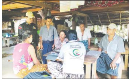
မကွေးတိုင်းဒေသကြီး ကမြို့နယ်၌ ၂၀၂၄ ခုနှစ် လူဦးရေနှင့်အိမ်အကြောင်းအရာ သန်းခေါင်စာရင်း ကောက်ယူခြင်းလုပ်ငန်းကို အောက်တိုဘာ ၅ ရက်က မြို့ပေါ်ရပ်ကွက်များနှင့် ကျေးရွာအုပ်စုတို့၌ စာရင်းကောက် စာရင်းစစ်အဖွဲ့များက ဆက်လက်ကောက်ယူစဉ်။ ကျော်ဇေယျဝင်း(ကမ)

အကြမ်းဖက်လုပ်ငန်းများဆောင်ရွက်နေသည့် PDF အဖွဲ့များအား တစ်ဖက်တစ်လမ်းမှ ထောက်ပံ့ပံ့ပိုးမှုများကို လှူဒါန်းစေရန်၊ လူငယ်လူရွယ်များ၏ မသိစိတ်များအတွင်း တပ်မတော်အပေါ် အထင်အမြင်လွဲမှားစေရန်နှင့် တော်လှန်လိုစိတ်တိုးပွားလာစေရန် စသည့်ရည်ရွယ်ချက်များဖြင့် NUG, CRPH လက်အောက်ခံ အကြမ်းဖက်အဖွဲ့အစည်းများက PDF Game Application များ တီထွင်ဖန်တီး အသုံးပြုလျက်ရှိကြောင်း စိစစ်တွေ့ရှိရသည့်အတွက် PDF Game ဆော့ကစားခြင်းသည် အကြမ်းဖက်အဖွဲ့အား ထောက်ပံ့ခြင်းဖြစ်၍ ဥပဒေအရ အရေးယူခံရနိုင်ကြောင်း အသိပေးအပ်ပါသည်။