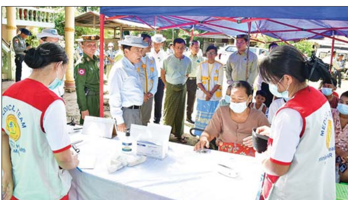
လိုအပ်သည့် သွင်းအားစုများ ဆောင်ရွက်ပေးနေမှု၊ ထိခိုက် ပျက်စီးခဲ့သည့် လယ်ယာမြေ မလျော့ကျစေရေး များ အပြန်စိုက်ပျိုးလုပ်ကိုင်နိုင် ရေး မြေပြုပြင်ပေးခြင်း၊ မျိုးစေ့ များ ထောက်ပံ့ပေးခြင်းနှင့် သွင်းအားစုများ လက်ဝယ်

နေပြည်တော် အောက်တိုဘာ ၅ နေပြည်တော် လယ်ဝေးမြို့နယ် တွင် ရေကြီးနှစ်မြုပ်မှုကြောင့် ထိခိုက်ခဲ့သည့် စပါးခင်းများအား ပြန်လည်ကုစားရန် သွင်းအားစု များ ထည့်သွင်းခြင်း ကွင်းသရုပ် ပြုစုမှု ယနေ့ နံနက်ပိုင်းက လယ်ဝေးမြို့နယ် ဝိတောက်ကချင် ကျေးရွာအုပ်စု ကွမ်းခြံကျေးရွာ ကွင်းအမှတ် (၁၇၃၂) စိုက်ခင်း၌ ကျင်းပသည်။ အဆိုပါသရုပ်ပြုမှု နေပြည် တော်ကောင်စီဥက္ကဋ္ဌ ဦးသန်း ထွန်းဦး တက်ရောက်ကြည့်ရှု အားပေးပြီး စပါးခင်းများ ပြန်လည်ကုစားရန်အတွက် နိုင်ငံ တော်မှ တောင်သူများအတွက်