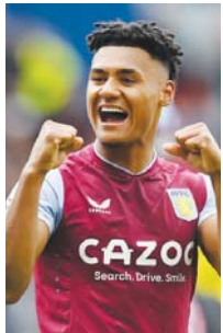
ဝက်ကင်စ် ဗီလာ (တိုက်စစ်) ၆ ပွဲကစား၊ ၄ ရိုးသွင်း