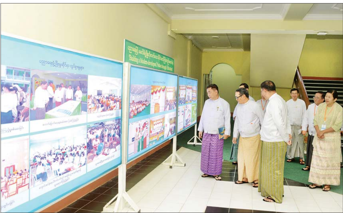
နိုင်ငံတော်စီမံအုပ်ချုပ်ရေးကောင်စီအဖွဲ့ဝင်များနှင့် တက်ရောက်လာကြသူများ ၂၀၂၄ ခုနှစ် ကမ္ဘာ့ဆရာများနေ့ အထိမ်းအမှတ်ပြခန်းများကို လှည့်လည်ကြည့်ရှုကြစဉ်။

နေပြည်တော် အောက်တိုဘာ ၅ ၂၀၂၄ ခုနှစ် ကမ္ဘာ့ဆရာများနေ့ အထိမ်းအမှတ် အခမ်းအနားကို ယနေ့ နံနက်ပိုင်းက နေပြည်တော်ရှိ ပညာရေး ဝန်ကြီးဌာန၌ ကျင်းပသည်။ အခမ်းအနားသို့ နိုင်ငံတော်စီမံ အုပ်ချုပ်ရေးကောင်စီအဖွဲ့ဝင် ဒေါက်တာ မှုထန်နှင့် ဒေါက်တာဘရွှေ ပြည်ထောင်စု ဝန်ကြီးများ၊ ဒုတိယဝန်ကြီးများ၊ ညွှန်ကြား ရေးမှုချုပ်များနှင့် တာဝန်ရှိသူများ၊ ဂုဏ်ထူးဆောင်ပုဂ္ဂိုလ်ကြီးများနှင့် ထူးချွန် ဆရာ ဆရာမများ၊ ဖြည့်ပွဲများတွင် ဆုများ ရရှိခဲ့ကြသည့် ဆရာ ဆရာမများနှင့် ကျောင်းသား ကျောင်းသူများ တက် ရောက်ကြသည်။ သဝဏ်လွှာဖတ်ကြား အခမ်းအနားတွင် နိုင်ငံတော်စီမံ အုပ်ချုပ်ရေးကောင်စီဥက္ကဋ္ဌ နိုင်ငံတော် ဝန်ကြီးချုပ် ဗိုလ်ချုပ်မှူးကြီး မင်းအောင်လှိုင်ထံမှ ကမ္ဘာ့ဆရာများနေ့ အခမ်းအနားသို့ပေးပို့သည့် သဝဏ်လွှာ ကို ပညာရေးဝန်ကြီးဌာန ပြည်ထောင်စု ဝန်ကြီး ဒေါက်တာညွန့်ဖေက ဖတ်ကြား သည်။ စာမျက်နှာ ၃ ကော်လံ ၁ ၀