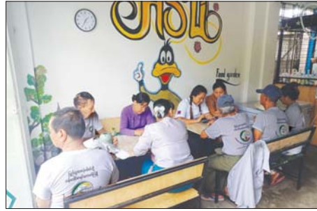
မန္တလေးတိုင်းဒေသကြီး စဉ့်ကိုင်မြို့နယ်၌ အောက်တိုဘာ ၅ ရက်က ၂၀၂၄ ခုနှစ် လူဦးရေနှင့်အိမ်အကြောင်းအရာ သန်းခေါင်စာရင်း ကောက်ယူနေမှုကို တွေ့ရစဉ်။ မြို့နယ်(ပြန်/ဆက်)