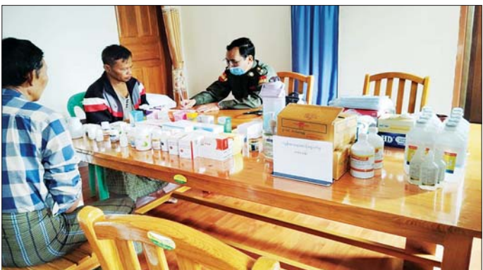
လူမှုဝန်ထမ်းကယ်ဆယ်ရေးအဖွဲ့များက ဒေသခံ ပြည်သူများနှင့်ပူးပေါင်း၍ တက်ကြွစွာ ဆောင်ရွက် ပေးလျက်ရှိသည်။

နေပြည်တော် အောက်တိုဘာ ၅ နေပြည်တော်ကောင်စီနယ်မြေအပိုင် တိုင်း ဒေသကြီးနှင့် ပြည်နယ်များရှိ ရေကြီးရေလျှံမှု ဖြစ်ပေါ်ခဲ့သည့် ရပ်ကွက်/ ကျေးရွာများတွင် ကူညီ ကယ်ဆယ်ရေးလုပ်ငန်းများနှင့် ပြန်လည်ထူထောင် ရေးလုပ်ငန်းများကို အင်တိုက်အားတိုက် တက်ကြွစွာ ပူးပေါင်းဆောင်ရွက်ပေးလျက်ရှိရာ ယနေ့တွင် လည်း နေပြည်တော်ကောင်စီနယ်မြေအတွင်းတွင် လည်းကောင်း၊ ကယားပြည်နယ်၊ လွိုင်ကော်မြို့နယ် တွင်လည်းကောင်း စာသင်ကျောင်းများ၊ ဆေးရုံ၊ ဆေးခန်းများ၊ ဌာနဆိုင်ရာအဆောက်အအုံများတွင် လိုအပ်သည့်ပစ္စည်းများ ကူညီပေးခြင်းနှင့် သန့်ရှင်းရေးလုပ်ငန်းများ ဆောင်ရွက်ပေးခြင်း၊ လမ်း၊ တံတားများ၊ ရပ်ကွက်၊ ကျေးရွာများအတွင်း၌ တင်ကျန်ခဲ့သည့် နွန့်များ၊ သစ်ပင်သစ်ကိုင်းများ ဖယ်ရှားပေးခြင်းအပိုင် အခြားလိုအပ်သည့်ပစ္စည်း ကို တပ်မတော်သားများ၊ မြန်မာနိုင်ငံရဲတပ်ဖွဲ့ဝင်များ၊ မီးသတ်တပ်ဖွဲ့ဝင်များ၊ ကြက်ခြေနီတပ်ဖွဲ့ဝင်များနှင့်