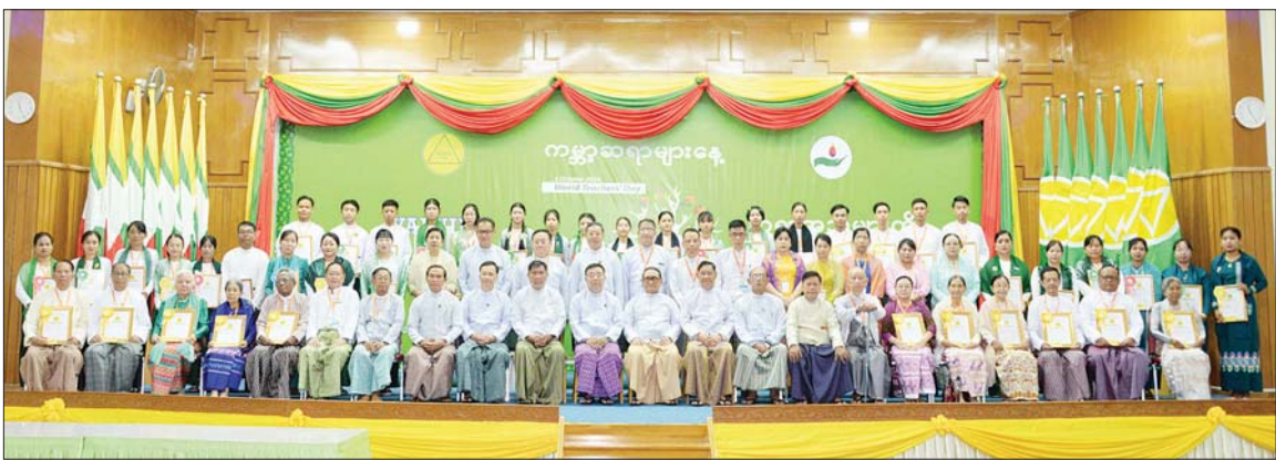
ကမ္ဘာ့ဆရာများနေ့ ဂုဏ်ထူးဆောင်ပုဂ္ဂိုလ်ကြီးများ၊ ထူးချွန်ဆရာ ဆရာမများ၊ ၂၀၂၄ ခုနှစ် ကမ္ဘာ့ဆရာများနေ့ အထိမ်းအမှတ်ဆောင်းပါးပြိုင်ပွဲ၊ စာစီစာကုံးနှင့် ကဗျာပြိုင်ပွဲတို့တွင် ဆုရရှိခဲ့ကြသည့် ဆရာ ဆရာမများနှင့် ကျောင်းသား ကျောင်းသူများကို ဂုဏ်ပြုမှတ်တမ်းလွှာနှင့် ဂုဏ်ပြုဆုငွေများ ပေးအပ်ချီးမြှင့်ကြသည်။

ယင်းနောက် နိုင်ငံတော်စီမံအုပ်ချုပ်ရေးကောင်စီ အဖွဲ့ဝင်များ၊ ပြည်ထောင်စုဝန်ကြီးများနှင့် တာဝန်ရှိသူများက ၂၀၂၄ ခုနှစ်