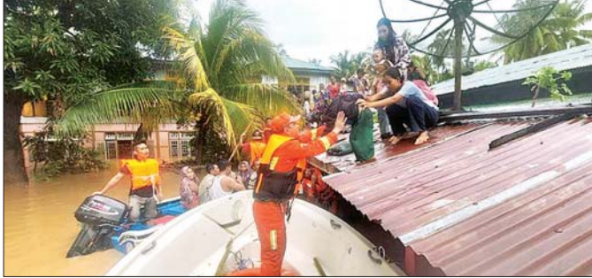
စက်တင်ဘာ ၁၁ ရက်က နေပြည်တော်ကောင်စီနယ်မြေ တပ်ကုန်းမြို့နယ်အတွင်း ရေကြီးနစ်မြုပ်မှု ဖြစ်ပွားသည့် ကျေးရွာများမှ ရေဘေးသင့်ပြည်သူများအား မြန်မာနိုင်ငံမီးသတ်တပ်ဖွဲ့နှင့် လူမှုကူညီရေး အသင်းအဖွဲ့များက ခဲရာခဲဆစ် ကူညီကယ်ဆယ်ရေးဆောင်ရွက်မှုကို တွေ့ရစဉ်။

သဘာဝဘေးဆိုတာ မထင်မှတ်တဲ့နေရာ၊ အချိန်တွေမှာ ကျရောက်နိုင်တယ်ဆိုပေမယ့် မိုးလေ ဝသနဲ့ ဇလဗေဒညွှန်ကြားမှုဦးစီးဌာနရဲ့ သတိပေး ချက်တွေကို သိရှိလိုက်နာ ဆောင်ရွက်နေထိုင်မယ် ဆိုရင် ဘေးအန္တရာယ်ဖြစ်ပေါ်မှုအပေါ်မူတည်ပြီး အနည်းနဲ့အများတော့ ဆုံးရှုံးမှုတွေ လျော့နည်းစေမှာ ဖြစ်ပါတယ်။ မြစ်ချောင်းအင်းအိုင်နဲ့ နီးတဲ့ဒေသ တွေမှာ အန္တရာယ်ဖြစ်ပေါ်နိုင်မှုနည်း ရာခိုင်နှုန်း ပိုများ တဲ့အတွက် ဧရာဝတီတိုင်းဒေသကြီးလို မြစ်ကမ်းနဲ့ နီးတဲ့ဒေသတွေကသာ မြစ်ရေသတိပေးချက်