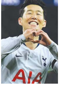
ဆွန်ဟောင်မင် စပါး (တိုက်စစ်) ၅ ပွဲကစား၊ ၂ ရိုးသွင်း

□ ကျောဖုံးမှ တိုက်စစ်၊ ခံစစ်သာလွန်မှုရှိသည့် လီဗာပူးအသင်းက ခရစ္စတယ် ပဲလွေစ်အသင်းကို ပွဲချိန်တစ်ပျောက် တစ်ဖက်သတ် ဖိအားပေး ကစား နိုင်ခဲ့သည်။ ပြိုင်ဘက်ပဲလွေစ်အသင်း၏ ထိုးဖောက်တိုက်စစ်ဆင်မှု များကလည်း ထိရောက်မှုရှိခဲ့ပြီး လီဗာပူးအသင်းခံစစ်နှင့် ရိုးသမားတို့ အတွက် အခက်တွေ့စေခဲ့သည်။ ဦးဆောင်ရိုးခွင့်ပြုပေးလိုက်ရ လီဗာပူးအသင်းအတွက် တစ်လုံးတည်းသော အနိုင်ရိုးကို ပွဲချိန် ကိုးမိနစ်တွင် ရရှိခဲ့ပြီး တိုက်စစ်ကစားသမား ဂျီတာက သွင်းယူပေးခဲ့ သည်။ ခရစ္စတယ်ပဲလွေစ်အသင်းသည် ဦးဆောင်ရိုးခွင့်ပြုပေးလိုက် ရပြီးနောက် လူစားပြောင်းလဲမှုများ ပြုလုပ်ကာ ချေပဂိုးရရှိရေး ကြိုးပမ်းလာသော်လည်း ပြိုင်ဘက်အသင်းခံစစ်နှင့် ရိုးသမားတို့ကို ကျော်ဖြတ်နိုင်ခြင်း မရှိခဲ့ချေ။ လီဗာပူးအသင်းသည် ယခုပွဲစဉ် နိုင်ပွဲရရှိခဲ့သည့်အတွက် ပရီမီယာ လိဂ်ပွဲစဉ် (၇) အပြီးတွင် ရမှတ် ၁၈ မှတ်ဖြင့် အမှတ်ပေးဇယားကို ဆက်လက်ဦးဆောင်နိုင်ခဲ့သည်။ ပြိုင်ဘက်ခရစ္စတယ်ပဲလွေစ်အသင်းက ယခုပွဲစဉ် ရှုံးနိမ့်ခဲ့သည့်အတွက် သရေသုံးပွဲနှင့် ရှုံးပွဲ လေးပွဲအထိ ရှိလာပြီ ဖြစ်သည်။ အခြားပွဲစဉ်ရလဒ်များ အခြားပွဲစဉ်များတွင် အာဆင်နယ်က ဆောက်သစ်တန်ကို သုံးရိုး- တစ်ရိုး၊ လက်စတာက ဘန်းဗောက်ကို တစ်ရိုး-ရိုးမရှိ၊ မန်စီးတီးက ဖူလ်ဟမ်ကို သုံးရိုး-နှစ်ရိုးဖြင့် အနိုင်ရသည်။ ဘရန်ဖွဲ့နှင့် ဝုလ်ဟော်ပွဲမှာ အပြိုင်အဆိုင်သွင်းပြီး ဘရန်ဖွဲ့က ဝုလ်ကို ငါးရိုး-သုံးရိုးဖြင့် အနိုင်ရခဲ့သည်။ ဝက်စ်ဟမ်းကလည်း အစ်ဆွစ်ချ်ကို လေးရိုး-တစ်ရိုးဖြင့် အနိုင်ရသည်။