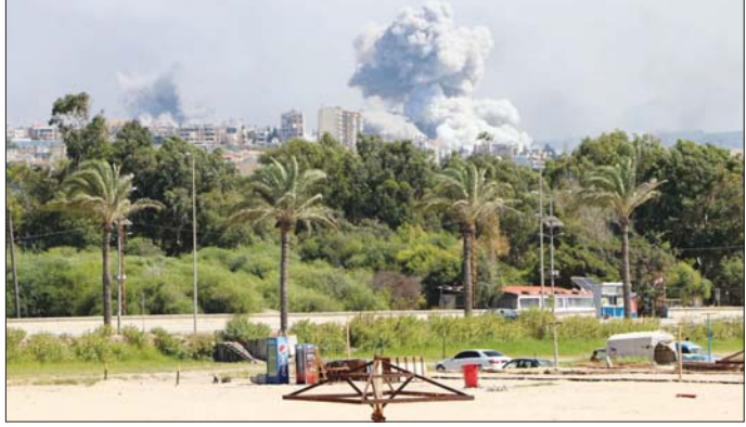
လက်ဘနွန်တောင်ပိုင်း Burj el-Shmall ကျေးရွာ၌ အစ္စရေး ပစ်မှတ်ထားသော နေရာမှ မီးခိုးလုံးကြီးများ လွင့်တက်လာမှုကို တွေ့ရစဉ်။

အီလွန်မတ်စ်ပိုင်ဆိုင်သော ဆိုရှယ်မီဒီယာကုမ္ပဏီကြီးက ဘရာဇီးတရားရုံးချုပ် တရားသူကြီး အဲလက်ဇန်ဒါး ဒီမိုရော့စ်က ချမှတ်သည့် ဒဏ်ကြေးငွေပေးချေမှု အထောက်အထားကို တင်ပြခဲ့ကြောင်း ဆိုရှယ်မီဒီယာ X ၏ ရှေ့နေများထံမှ သိရသည်။ မဟုတ်မမှန် လုပ်ကြံ လှုံ့ဆော်မှုများနှင့် အငြင်းပွားမှုများကို ပြေငြိမ်းရန်အတွက် ကုမ္ပဏီမှ တရားဝင်ကွယ်စားလှယ်တစ်ဦး ခန့်အပ်ရန် ပျက်ကွက်မှုကြောင့် ဩဂုတ်လက ဘရာဇီးနိုင်ငံတွင် ဆိုရှယ်မီဒီယာ X အသုံးပြုခွင့်ကို ဒီမိုရော့စ်က ဆိုင်းငံ့ခဲ့သည်။ ယင်းနောက် အီလွန်မတ်စ်က ၎င်း၏ ပြိုဟုတ်အင်တာနက် ကုမ္ပဏီစတားလင်ဒ်၏ ဘရာဇီးနိုင်ငံအတွင်း လုပ်ငန်းလည်ပတ်မှု အခက်အခဲများနှင့် ရင်ဆိုင်ခဲ့ရပြီး X ၏ လည်ပတ်မှုကို ပြန်လည်စတင်ရန် ဆုံးဖြတ်ခဲ့ခြင်းဖြစ်သည်။ ဆင်ဟွာ