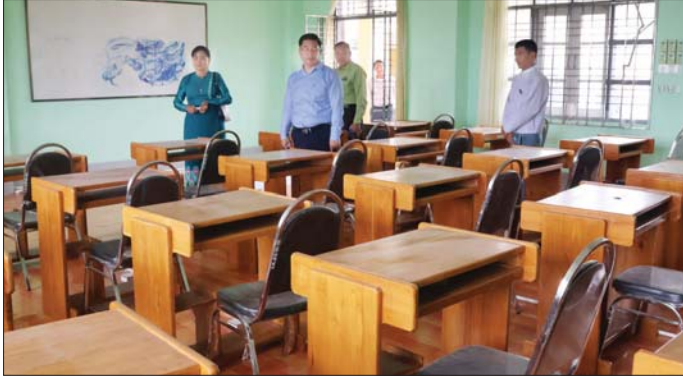
ဖြစ်၍ ကျောင်းအတွင်း အားပေးပြီး ပါဝင်ဆောင်ရွက်သူ ထို့နောက် သင်ဆောင်စုပေါင်းသန့်ရှင်းရေး ဆောင်ရွက်ရန်များ လှည့်လည်ကြည့်ရှု

လွိုင်ကော် အောက်တိုဘာ ၅ ကယားပြည်နယ် အစိုးရအဖွဲ့ အနေဖြင့် ဌာနဆိုင်ရာဝန်ထမ်းများ၊ ဒေသခံပြည်သူများနှင့် လက်တွဲကာ ပြန်လည်ထူထောင်ရေးလုပ်ငန်းများကို စဉ်ဆက်မပြတ် ဆောင်ရွက်လျက်ရှိပြီး ဒေသအခြေအနေအရ ယာယီပိတ်ထားခဲ့ရသော ကျောင်းများ၊ ရုံးများ ပြန်လည်ဖွင့်လှစ်နိုင်ရေးကိုလည်း ဆောင်ရွက်လျက်ရှိသည်။ ကယားပြည်နယ်ဝန်ကြီးချုပ် ဦးစော်မျိုးတင်နှင့် တာဝန်ရှိသူများသည် ယနေ့နံနက်က လွိုင်ကော်ပညာရေးဒီဂရီကောလိပ်သို့ရောက်ရှိကာ ယခုလ ၁၅ ရက်မှစ၍ ကျောင်းများ ပြန်လည်ဖွင့်လှစ်မည့်