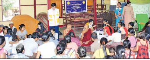
တောင်ငူ အောက်တိုဘာ ၅ ရေဘေးသင့်ပြည်သူများအား နယ်လှည့်ကွင်းဆင်း အသိပညာပေး အခမဲ့ကျန်းမာရေးစောင့်ရှောက်မှုများဆောင်ရွက်

တောင်ငူ အောက်တိုဘာ ၅ ပဲခူးတိုင်းဒေသကြီး တောင်ငူမြို့ ဝမ်းနည်းပင်ကျေးရွာအုပ်စု ဇီးဖြူပင်ရွာ ဇီးဖြူပင်ကျောင်း သာသနာ့ရုံသို့ ယနေ့နံနက်ပိုင်းက ရေဘေးသင့်ပြည်သူများကို ပဲခူးတိုင်းဒေသကြီး ပြည်သူ့ကျန်းမာရေးနှင့် ကုသရေးဦးစီးဌာနမှူးနှင့် ပြည်သူ့ဆေးရုံကြီး(တောင်ငူ)မှ အထူးကုဆရာဝန်ကြီးများနှင့် ကျန်းမာရေးဝန်ထမ်းများက နယ်လှည့်ကွင်းဆင်း၍ အသိပညာပေးဟောပြောခြင်းနှင့် ကျန်းမာရေးစောင့်ရှောက်မှုလုပ်ငန်းများ အခမဲ့ဆောင်ရွက်ပေးကြသည်။