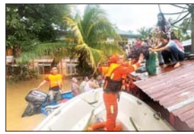
ဆောင်းပါး စာ ၂၄