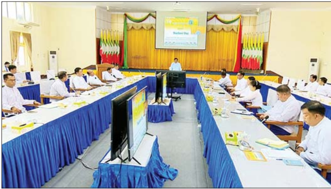
ဖြစ်စေရေး အစီအမံများ ကြိုတင် ဆောင်ရွက်ရန် ကိစ္စရပ်များကို ရှင်းလင်းပြောကြားသည်။ ထို့နောက် တာဝန်ရှိသူများက ရေဘေးသင့်ဝန်ထမ်း ၄၅ ဦး သိန်း ၉၀ ကို ထောက်ပံ့ပေးအပ် ကြသည်။

နေပြည်တော် အောက်တိုဘာ ၅ စက္ကူစက်ရုံ(ရေနံ) ရေဘေးသင့် ဝန်ထမ်းများအား ထောက်ပံ့ငွေ ပေးအပ်ပွဲ အခမ်းအနားကို ယနေ့ နံနက်ပိုင်းက ပဲခူးတိုင်းဒေသကြီး စက္ကူစက်ရုံ(ရေနံ)၌ ကျင်းပရာ စက်မှုဝန်ကြီးဌာန ပြည်ထောင်စု ဝန်ကြီး ဒေါက်တာချာလီသန်း တက်ရောက်ပြီး စာနာနားလည် စိတ်၊ ကူညီရင်းပင်းစိတ်၊ လူမှု တာဝန်သိစိတ်တို့ဖြင့် ထောက်ပံ့ ပေးအပ်သည့်အတွက် ကျေးဇူး တင်ရှိကြောင်းနှင့် စက်ရုံမှ ကုန်ထုတ်လုပ်မှု လုပ်ငန်းများ တိုးမြှင့် ဆောင်ရွက်နိုင်ရေး၊ သဘာဝဘေး အန္တရာယ်များ ကြုံတွေ့ရပါက ဆုံးရှုံးမှုအနည်းဆုံး