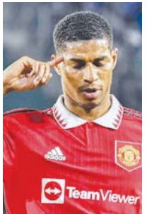
ရက်မို့ဒ် မန်ယူ (တိုက်စစ်) ၆ ပွဲကစား၊ ၁ ရိုးသွင်း