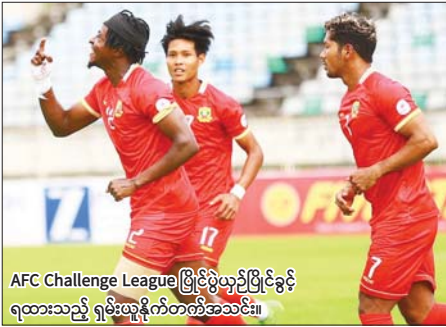
AFC Challenge League ဖြိုင်ပွဲယှဉ်ပြိုင်ခွင့် ရထားသည့် ရှမ်းယူနိုက်တက်တစ်အသင်း။

ရန်ကုန် အောက်တိုဘာ ၂ ၂၀၂၄ ရာသီ မြန်မာအမျိုးသမီး လိဂ်ပြိုင်ပွဲ ပွဲစဉ် (၁၉) ကို အောက်တိုဘာ ၂ ရက်က ကွင်းသုံး ကွင်း၌ တစ်ပြိုင်တည်းကျင်းပရ အား/ကာသိပွဲအသင်းက ဂိုးပြတ် နိုင်ပွဲရယူပြီး လက်ကျန်နှစ်ပွဲအလို တွင် ချန်ပီယံဆု ဆွတ်ခူးရရှိခဲ့ သည်။ စလင်းကွင်း၌ ကျင်းပသည့် ပွဲတွင် အား/ကာ သိပွဲအသင်းက ပြီးခဲ့သည့် ရာသီချန်ပီယံ မြဝတီ အသင်းကို ခုနစ်ဂိုး - တစ်ဂိုးဖြင့် အနိုင်ရရှိသည်။ ချန်ပီယံဆု နှစ်ကြိမ် ရရှိဖူးသည့် အား/ကာ သိပွဲအသင်းသည် ယခုရာသီတွင် ပုံစံကောင်းပြသကာ ချန်ပီယံဆုကို စာမျက်နှာ ၁၅ ကော်လံ ၅ ❖