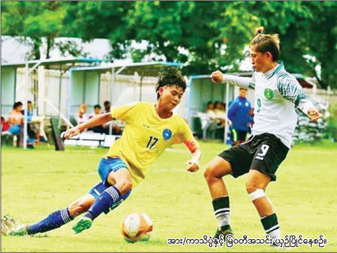
အား/ကာသိပွဲနှင့် မြဝတီအသင်း ယှဉ်ပြိုင်နေစဉ်။

ရန်ကုန် အောက်တိုဘာ ၂ ၂၀၂၄ ရာသီ မြန်မာအမျိုးသမီး လိဂ်ပြိုင်ပွဲ ပွဲစဉ် (၁၉) ကို အောက်တိုဘာ ၂ ရက်က ကွင်းသုံး ကွင်း၌ တစ်ပြိုင်တည်းကျင်းပရ အား/ကာသိပွဲအသင်းက ဂိုးပြတ် နိုင်ပွဲရယူပြီး လက်ကျန်နှစ်ပွဲအလို တွင် ချန်ပီယံဆု ဆွတ်ခူးရရှိခဲ့ သည်။ စလင်းကွင်း၌ ကျင်းပသည့် ပွဲတွင် အား/ကာ သိပွဲအသင်းက ပြီးခဲ့သည့် ရာသီချန်ပီယံ မြဝတီ အသင်းကို ခုနစ်ဂိုး - တစ်ဂိုးဖြင့် အနိုင်ရရှိသည်။ ချန်ပီယံဆု နှစ်ကြိမ် ရရှိဖူးသည့် အား/ကာ သိပွဲအသင်းသည် ယခုရာသီတွင် ပုံစံကောင်းပြသကာ ချန်ပီယံဆုကို စာမျက်နှာ ၁၅ ကော်လံ ၅ ❖