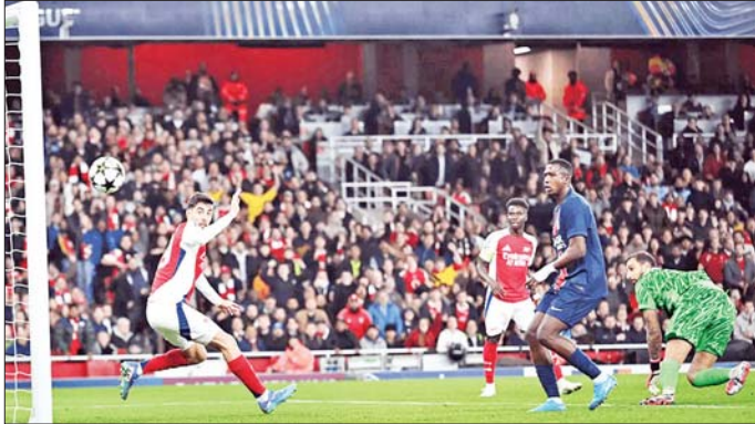
ပီအက်စ်ဂျီအသင်းဘက်သို့ အာဆင်နယ်တိုက်စစ်ကစားသမား ဟာပက်စ် အဖွင့်ဂိုးသွင်းယူစဉ်။

ချန်ပီယံလိဂ်ပြိုင်ပွဲ အုပ်စု ပွဲစဉ် (၂) တွင် အာဆင်နယ်က နာမည်ကြီး ပီအက်စ်ဂျီကို ဂိုးပြတ်နိုင် ယူအီးအက်စ်အေ ချန်ပီယံလိဂ် ပြိုင်ပွဲ အုပ်စုအဆင့် ပွဲစဉ် (၂) မှ အောက်တိုဘာ ၂ ရက် နံနက် ၁ နာရီခွဲက ယှဉ်ပြိုင်ကစားခဲ့သည့် အာဆင်နယ်နှင့် ပီအက်စ်ဂျီအသင်း ပွဲစဉ်တွင် အာဆင်နယ်အသင်းက အကြိတ်အနယ်ကစားပြီး နှစ်ဂိုး ပြတ် နိုင်ပွဲရရှိခဲ့သည်။ ယင်းပွဲစဉ် ကို အာဆင်နယ်အသင်းအိမ်ကွင်း ၌ လက်ခံယှဉ်ပြိုင်ကစားခဲ့ ပြီး ပရိသတ် ၆၀၀၀ ကျော် လာရောက်ကြည့်ရှုခဲ့သည်။ အာဆင်နယ် အသင်းသည် ပုံစံသစ်ဖြင့် ကျင်းပသည့် စာမျက်နှာ ၁၅ ကော်လံ ၁ ❖