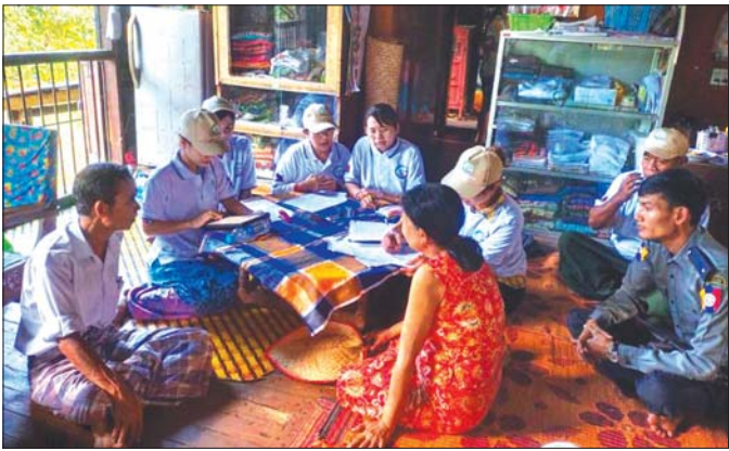
အိမ်အကြောင်းအရာ သန်းခေါင်စာရင်းကောက်ယူ ပြီးလျှင် အတိအကျသိရှိနိုင်မည်ဖြစ်သည်။