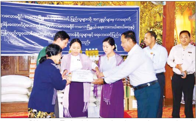
ချေးငွေများ၊ မြစ်မီးရောင်(နေကြာဆီထွက်သီးနှံ) စီမံကိန်းမှ ချေးငွေများ ပံ့ပိုးဆောင်ရွက်လျက်ရှိကြောင်း ပြောကြားပြီး ဒေသခံတောင်သူများ၏ တင်ပြချက်များကို ပေါင်းစပ်ဖြည့်ဆည်းဆောင်ရွက်ပေးသည်။ ယင်းနောက် ပြည်ထောင်စုဝန်ကြီးနှင့် ပြည်နယ်ဝန်ကြီးချုပ်တို့က တောင်ကြီးမြို့နယ်အတွင်း နေကြာစိုက်သမဝါယမအသင်း ငါးသင်း အသင်းသားတောင်သူ ၅၀၀ ဦးတို့၏ စိုက်ပျိုးမြေစေ့ ၃၇၀၀ အတွက် ရေဆင်းစပ်မျိုး-၁ နေကြာမျိုးစေ့များ၊ သွင်းအားစုဓာတ်မြေဩဇာများ၊ ရှာရှားသဘာဝရွက်ဖုန်းဆေးရည်

နေပြည်တော် အောက်တိုဘာ ၂ အသက်မွေးဝမ်းကျောင်းလုပ်ငန်းများ ပြန်လည်ထူထောင်ရေးလုပ်ငန်းကော်မတီဥက္ကဋ္ဌ သမဝါယမနှင့် ကျေးလက်ဖွံ့ဖြိုးရေးဝန်ကြီးဌာန ပြည်ထောင်စုဝန်ကြီး ဦးလှစိုးသည် ရှမ်းပြည်နယ် ဝန်ကြီးချုပ် ဦးအောင်အောင်၊ တာဝန်ရှိသူများနှင့်အတူ ယနေ့နံနက်ပိုင်းက ရှမ်းပြည်နယ်(တောင်ပိုင်း) ပြန်လည်ထူထောင်ရေးလုပ်ငန်းများ ဆောင်ရွက်နေမှုနှင့် ဆီထွက်သီးနှံစိုက်ပျိုးရေးလုပ်ငန်းများ ပိုမိုအောင်မြင်ရေးကွင်းဆင်းကြည့်ရှုစစ်ဆေးသည်။ ဦးစွာ ပြည်ထောင်စုဝန်ကြီး၊ ပြည်နယ်ဝန်ကြီးချုပ်နှင့်အဖွဲ့သည် ကလေးမြို့ မြို့မရိယတ္တီ စသင်တိုက်သို့ရောက်ရှိပြီး ကလေးမြို့နယ်အတွင်းရှိ ရေဘေးသင့်ပြည်သူများနှင့် တွေ့ဆုံ အေးပေးစကားပြောကြားကာ ဆီနှင့် စားသောက်ကုန်ပစ္စည်းများ ထောက်ပံ့ပေးအပ်သည်။(အပေါ်ယာပုံ)