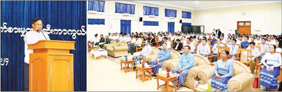
နိုင်ငံတော်စီမံအုပ်ချုပ်ရေးကောင်စီအဖွဲ့ဝင်၊ ဒုတိယဝန်ကြီးချုပ်နှင့် ကာကွယ်ရေးဝန်ကြီးဌာန ပြည်ထောင်စုဝန်ကြီး ဗိုလ်ချုပ်ကြီး တင်အောင်စန်၊ ကာကွယ်ရေးဝန်ကြီးဌာနနှင့် အဂတိလိုက်စားမှုတိုက်ဖျက်ရေးကော်မရှင်တို့ပူးပေါင်း၍ အဂတိလိုက်စားမှုတားဆီးကာကွယ်ရေးဆိုင်ရာ အသိပညာပေးရှင်းလင်းဆွေးနွေးပွဲတွင် အမှာစကားပြောကြားစဉ်။

နေပြည်တော် အောက်တိုဘာ ၂ နိုင်ငံဝန်ထမ်းများ အဂတိလိုက်စားမှု တားဆီးကာကွယ်ရေးဆိုင်ရာ အသိပညာများ တိုးပွားလာစေရန် ရည်ရွယ်၍ ကာကွယ်ရေးဝန်ကြီးဌာနနှင့် အဂတိလိုက်စားမှုတိုက်ဖျက်ရေး ကော်မရှင်တို့ ပူးပေါင်း၍ အဂတိလိုက်စားမှုတားဆီးကာကွယ်ရေးဆိုင်ရာ အသိပညာပေး ရှင်းလင်းဆွေးနွေးပွဲကို ယနေ့နံနက်ပိုင်းတွင် နေပြည်တော်ရှိ ကာကွယ်ရေးဝန်ကြီးဌာန အစည်းအဝေးခန်းမ၌ ကျင်းပသည်။ ဆွေးနွေးပွဲသို့ နိုင်ငံတော်စီမံအုပ်ချုပ်ရေးကောင်စီ အဖွဲ့ဝင် ဒုတိယဝန်ကြီးချုပ်နှင့် ကာကွယ်ရေးဝန်ကြီးဌာန ပြည်ထောင်စုဝန်ကြီး ဗိုလ်ချုပ်ကြီး တင်အောင်စန်၊ အဂတိလိုက်စားမှု တိုက်ဖျက်ရေးကော်မရှင်ဥက္ကဋ္ဌ ဦးစစ်အေးနှင့် တာဝန်ရှိသူများ၊ ဒုတိယဝန်ကြီးနှင့် ဌာနဆိုင်ရာ အကြီးအကဲများ၊ အရာထမ်း၊ အမှုထမ်းများ တက်ရောက်ကြသည်။ စုံစမ်းစစ်ဆေးအရေးယူ ဆွေးနွေးပွဲတွင် နိုင်ငံတော်စီမံအုပ်ချုပ်ရေးကောင်စီအဖွဲ့ဝင်၊ ဒုတိယဝန်ကြီးချုပ်နှင့် ကာကွယ်ရေးဝန်ကြီးဌာန ပြည်ထောင်စုဝန်ကြီးက မိမိတို့နိုင်ငံတွင် အဂတိလိုက်စားမှုတိုက်ဖျက်ရေး မဟာဗျူဟာစီမံချက် (၂၀၂၂-၂၀၂၅) ကို ရေးဆွဲချမှတ်ပြီး အကောင်အထည်ဖော် ဆောင်ရွက်လျက်ရှိကြောင်း၊ မဟာဗျူဟာ စီမံချက်တွင် တားဆီးကာကွယ်ခြင်း၊ အသိပညာပေးခြင်းနှင့် စုံစမ်းစစ်ဆေးအရေးယူခြင်း လုပ်ငန်းစဉ်များ ပါဝင်ပါကြောင်း။ နိုင်ငံတော်စီမံအုပ်ချုပ်ရေးကောင်စီဥက္ကဋ္ဌ နိုင်ငံတော်ဝန်ကြီးချုပ်က ၂၀၂၂ ခုနှစ် အပြည်ပြည်ဆိုင်ရာ အဂတိ