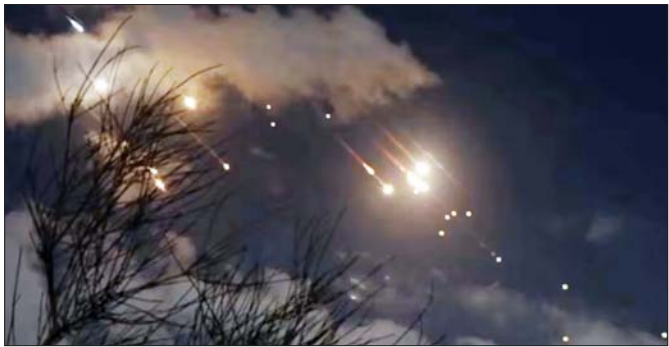
ဂျေရုဆလင်မြို့ပေါ်၌ ဒုံးကျည်များအား ကြားဖြတ်ပစ်ချဟန်တားနေမှုကို အောက်တိုဘာ ၁ ရက်က ဝေ့ရစဉ်။

နိုင်ငံတွင် သတ်ဖြတ်ခံခဲ့ရသည်။ ထို့အပြင် ဟားမားစ်နိုင်ငံရေးခေါင်းဆောင် အစ္စမေးလ် ဟာနီယေးသည်လည်း ဇူလိုင်လတွင် တီဟီရန်မြို့၌ လုပ်ကြံသတ်ဖြတ်ခံခဲ့ရသည်။ သို့သော်လည်း အစ္စရေးဝန်ကြီးချုပ် နေတန် ယာဟုက ၎င်းတို့၏ လက်တုံ့ပြန်မှုသည် မအောင်မြင်ခဲ့ကြောင်း ပြောသည်။ ထို့ပြင် အီရန်နိုင်ငံသည် ယနေ့ညတွင် အမှားကြီးတစ်ခုပြုလုပ်ခဲ့ကြောင်း၊ ယင်းအတွက် ပြန်လည်ပေးဆပ်ရမည်ဖြစ်ကြောင်း ၎င်းက ပြောသည်။ အမေရိကန် ရေတပ်ဖျက်သင်္ဘောများက ဒုံးကျည်များကို ကြားဖြတ်ပစ်ခတ်ပြီး ကူညီခဲ့ကြောင်း ဝါရှင်တန်က ပြောသည်။ အမေရိကန်သည် အစ္စရေး ကာကွယ်ရေးကို ထောက်ခံကြောင်း၊ ထိခိုက်မှုများ နှင့်ပတ်သက်ပြီး ချင့်တွက်လျက်ရှိနေသေးကြောင်း၊ သို့သော်လည်း လက်တလောသိထားရသည့်အတိုင်း ဆိုလျှင် တိုက်ခိုက်မှုသည် မအောင်မြင်ဖြစ်ပြီး ထိရောက်မှုရှိပုံမပေါ်ကြောင်း သမ္မတဘုရားဘိုင်ခင်က ပြောသည်။ အီရန်နိုင်ငံခြားရေးဝန်ကြီး အစ္စအရာဂျီက ဗြိတိန်၊ ဂျာမနီနှင့်ပြင်သစ်နိုင်ငံခြားရေးဝန်ကြီးများ