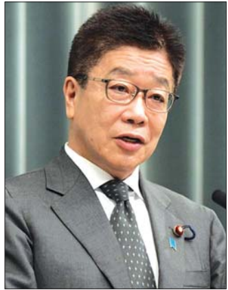
အစိုးရအဖွဲ့ အတွင်းရေးမှူးချုပ်ဟောင်း ကာဆုနိုဘူ ကာတို။

ယိုရှိမာဆာ ဟာယာရှိဟာ တိုကျိုတက္ကသိုလ်၊ Harvard Kennedy School တို့မှာ ပညာသင်ကြား ခဲ့ပြီး ၁၉၉၅ ခုနှစ်မှာ အယ်လီဒီပီပါတီကနေ အထက် လွှတ်တော်အမတ်အဖြစ် ရွေးချယ်ခံရပြီး နိုင်ငံရေး လောကထဲ စတင်ဝင်ရောက်ခဲ့ပါတယ်။ ဝန်ကြီးချုပ် တာရှိအာဆိုလက်ထက် ၂၀၀၈ ခုနှစ်မှာ ကာကွယ်ရေး