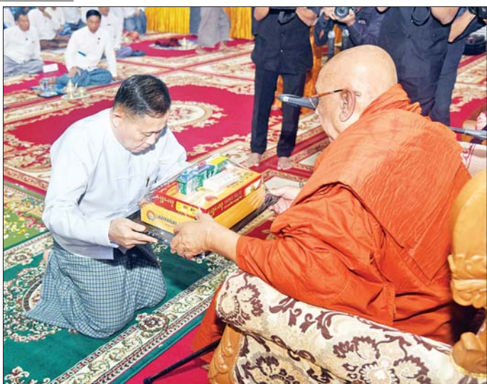
နိုင်ငံတော်စီမံအုပ်ချုပ်ရေးကောင်စီ ဒုတိယဥက္ကဋ္ဌ ဒုတိယဝန်ကြီးချုပ် ဒုတိယဗိုလ်ချုပ်မှူးကြီး စိုးဝင်းကွန်ရက်မှူးကုမ္ပဏီမိသားစုက လှူဒါန်းသည့် အလှူတော်ငွေကျပ်သိန်း ၁၀၀၀ ကို လက်ခံရယူစဉ်။