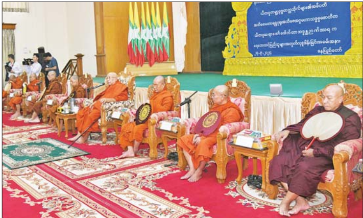
နိုင်ငံတော်စီမံအုပ်ချုပ်ရေးကောင်စီ ဒုတိယဥက္ကဋ္ဌ ဒုတိယဝန်ကြီးချုပ် ဒုတိယဗိုလ်ချုပ်မှူးကြီး စိုးဝင်းနှင့် အခမ်းအနားတက်ရောက်လာကြသူများက သီတဂူဆရာတော်ကြီးထံမှ ငါးပါးသီလခံယူဆောင်တည်ကြစဉ်။