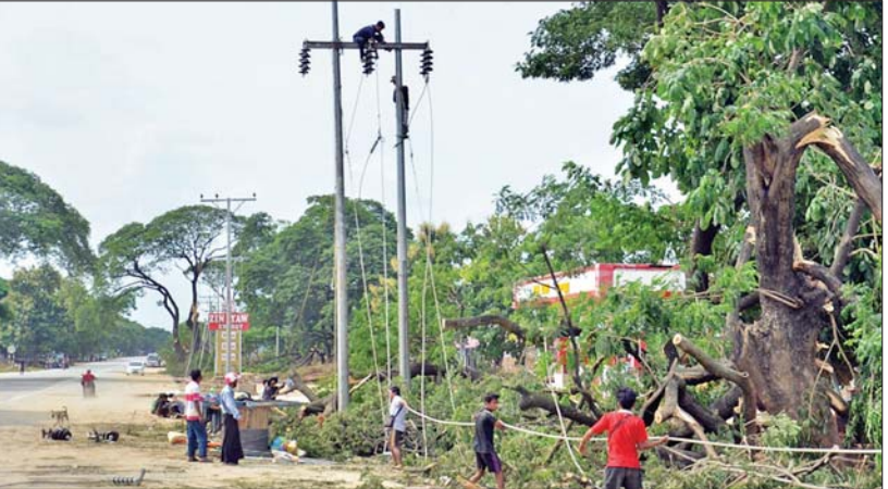
ပြည်သူများ လျှပ်စစ်ဓာတ်အား အမြန်ဆုံးပြန်လည်သုံးစွဲနိုင်ရေးအတွက် လျှပ်စစ်စွမ်းအားဝန်ကြီးဌာနမှ ဝန်ထမ်းများ ကြိုးပမ်းဆောင်ရွက်နေမှုကို တွေ့ရစဉ်။

စက်တင်ဘာလ ၁၈ ရက်မှာ၊ ရမည်းသင်းမြို့နယ်ကို စက်တင်ဘာလ ၁၉ ရက်မှာ အသီးသီး လျှပ်စစ်ဓာတ်အားပြန်လည်ပို့လွှတ်ပြီးဖြစ်ပါတယ်။ မန္တလေးတိုင်းဒေသကြီးတစ်ခုလုံးမှာ ယုတ်စီးခဲ့တဲ့ ဓာတ်အားလိုင်းတွေ ပြန်လည်ပြုပြင်ခြင်းလုပ်ငန်းရဲ့ ၃၀ ရာခိုင်နှုန်း ပြီးစီးပြီးဖြစ်ပါတယ်။ ရှမ်းပြည်နယ်(တောင်ပိုင်း) ကလေးမြို့မှာ ၁၁ ကေပီမြို့တွင်းဓာတ်အားလိုင်းချို့ယွင်းပျက်စီးမှုကို ပြန်လည်ပြုပြင်ပြီး တော့ စက်တင်ဘာလ ၁၅ ရက် ညနေ ၄ နာရီမှာ၊ ရေပေးဝေရေး ဓာတ်အားလိုင်းတွေကို စက်တင်ဘာလ ၁၈ ရက်မှာ ဓာတ်အားပြန်ဖြူးပေးနိုင်ခဲ့တဲ့အတွက် ကလေးမြို့ပေါ် မီးသုံးစွဲသူ ၈၅ ရာခိုင်နှုန်းကို ဓာတ်အားပြန်လည်ဖြန့်ဖြူးပေးနိုင်ခဲ့ပြီးဖြစ်ပါတယ်။ တောင်တော်ကွင်း နေရောင်ခြည်သုံး ဓာတ်အားပေးစက်ရုံက ထုတ်လုပ်တဲ့ ဓာတ်အားကို ပို့လွှတ်ပေးလျက်ရှိတဲ့အပြင် ၃၃ ကေပီ တောင်တော်ကွင်းစက်ရုံ- တောင်တော်ကွင်းခွဲရုံ ဓာတ်အားလိုင်းကိုလည်း မဟာဓာတ်အားလိုင်းမှူးရုံး သာစည်၊ အုန်းတော၊ ရွှေစာရုံရှိ လိုင်းဝန်ထမ်း ၇၀ တို့က စက်တင်ဘာလ ၁၁ ရက်မှာ စတင်ဆောင်ရွက်ခဲ့ပြီးတော့ ပြုပြင်ခြင်းလုပ်ငန်းတွေ ဆောင်ရွက်ပြီးစီးခဲ့တဲ့အတွက် စက်တင်ဘာလ ၁၄ ရက်မှာ ဓာတ်အားပုံမှန်ပြန်လည်ဖြန့်ဖြူးပေး