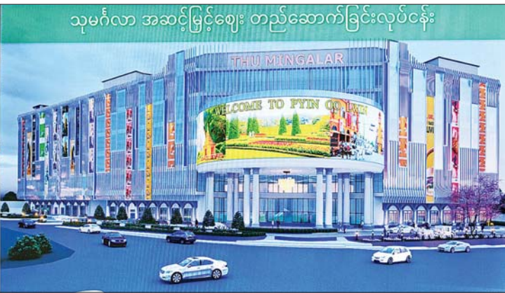
နိုင်ငံတော်စီမံအုပ်ချုပ်ရေးကောင်စီဥက္ကဋ္ဌ တပ်မတော်ကာကွယ်ရေးဦးစီးချုပ် ဗိုလ်ချုပ်မှူးကြီး မင်းအောင်လှိုင်နှင့်အဖွဲ့ဝင်များအား မန္တလေးတိုင်းဒေသကြီး ဝန်ကြီးချုပ် ဦးမျိုးအောင်က ပြင်ဦးလွင်မြို့ သုမင်္ဂလာဈေး (ညံ့တောဈေး) ခြောက်ထပ်အဆင့်မြင့်ဈေးသစ် တည်ဆောက်ရေးစီမံကိန်းနှင့်ပတ်သက်၍ ရှင်းလင်းတင်ပြစဉ်။

*ရှေ့စွဲမှ ဦးစွာ စစ်တက္ကသိုလ် နဝဒေးခန်းမ၌ တိုင်းမှူး ဗိုလ်ချုပ်မှူးကြီးကျော်ကိုထိုက်နှင့် ပြင်ဦးလွင်တပ်နယ်မှူး တို့က ပြင်ဦးလွင်တပ်နယ်အတွင်း လုံခြုံရေးနှင့် နယ်မြေတည်ငြိမ်အေးချမ်းရေးဆိုင်ရာလုပ်ငန်းများ ဆောင်ရွက်လျက်ရှိမှုအခြေအနေအရား၊ လုံခြုံရေး လုပ်ငန်းများ ဆောင်ရွက်စဉ် အကြမ်းဖက် သောင်းကျန်းသူများထံမှ လက်နက်ခဲယမ်းများ သိမ်းဆည်းရမိမှုအခြေအနေအရားကို ရှင်းလင်းတင်ပြ ကြသည်။ ရှင်းလင်းတင်ပြမှုများအပေါ် နိုင်ငံတော်စီမံ