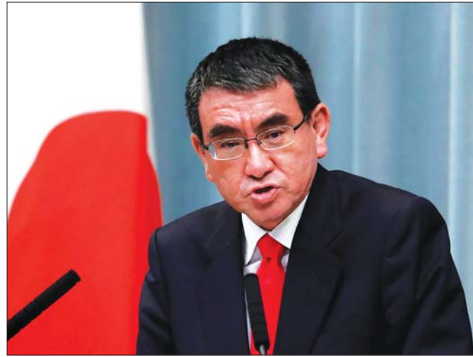
ဒစ်ဂျစ်တယ်အသွင်ကူးပြောင်းရေးဝန်ကြီး တာရို ကိုနို။

၂၀၂၂ ခုနှစ်မှာ အယ်လ်ဒီပီပါတီ အာဏာပြန်လည်ရရှိခဲ့ပြီး ရှင်ဇီအာဘေး အယ်လ်ဒီပီပါတီ