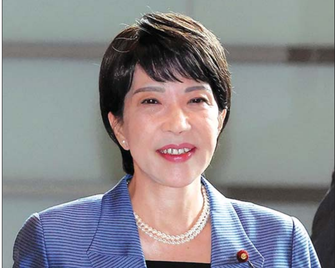
စီးပွားရေးလုံခြုံမှုရရှိရေးဝန်ကြီး တာကာချိ ဆာနာအဲ။

(၄) ဒစ်ဂျစ်တယ် အသွင်ကူးပြောင်းရေးဝန်ကြီး တာရို ကိုနို (Taro Kono) လက်ရှိဝန်ကြီးချုပ် ကိုရိုဒါဦးဆောင်တဲ့ အစိုးရအဖွဲ့မှာ ဒစ်ဂျစ်တယ်အသွင်ကူးပြောင်းရေးဝန်ကြီးအဖြစ် တာဝန်ထမ်းဆောင်နေတဲ့ တာရိုကိုနိုကလည်း အယ်လ်ဒီပီပါတီဥက္ကဋ္ဌ ရွေးချယ်ပွဲမှာ ပါဝင်ယှဉ်ပြိုင်သွားမယ်လို့ ဩဂုတ်လ ၂၆ ရက်နေ့က တရားဝင်ကြေညာခဲ့ပါတယ်။ ၁၉၆၃ ခုနှစ်မှာ မွေးဖွားခဲ့တဲ့ အတွက် အသက် ၆၁ နှစ် ရှိပြီဖြစ်တဲ့ တာရို ကိုနိုဟာ နိုင်ငံရေးမျိုးရိုးက ဆင်းသက်လာသူတစ်ဦး ဖြစ်ပါတယ်။ သူ့ရဲ့ ဖခင်ဖြစ်သူ Yohei Kono ဟာ ဂျပန်နိုင်ငံခြားရေးဝန်ကြီးအဖြစ် ၁၉၉၉ ခုနှစ်ကနေ ၂၀၀၁ ခုနှစ်အထိ ထမ်းဆောင်ခဲ့ပြီး အောက်လွှတ်တော် ဥက္ကဋ္ဌအဖြစ် ၂၀၀၃ ခုနှစ်ကနေ ၂၀၀၉ ခုနှစ်အထိ ထမ်းဆောင်ခဲ့သူ ဖြစ်ပါတယ်။ တာရို ကိုနိုဟာ အမေရိကန်နိုင်ငံ ကျော့ချီတောင်းတက္ကသိုလ်မှာ ဥက္ကဋ္ဌနဲ့ ဝန်ကြီးချုပ်ဖြစ်လာတဲ့အချိန်မှာ တာရို ကိုနိုကို အစိုးရအဖွဲ့အတွင်းမှာ ဝန်ကြီးအဖြစ် ခန့်အပ်တာဝန်ပေးအပ်ခဲ့ပါတယ်။ ၂၀၁၅ ခုနှစ်မှာ အုပ်ချုပ်မှုစနစ် ပြုပြင်ပြောင်းလဲရေးဝန်ကြီး (Minister in charge of Administrative Reform)၊ ၂၀၁၇ ခုနှစ်မှာ နိုင်ငံခြားရေးဝန်ကြီး၊ ၂၀၁၉ ခုနှစ်မှာ ကာကွယ်ရေးဝန်ကြီးအဖြစ် အသီးသီးတာဝန်ပေးအပ်ခဲ့ပါတယ်။ ၂၀၂၀ ပြည့်နှစ်မှာ ရှင်ဇီအာဘေး ဝန်ကြီးချုပ် ရာထူးမှအနားယူပြီး ယိုရိုဟိဒေးဆုဂ် ဝန်ကြီးချုပ် ဖြစ်လာချိန်မှာလည်း တာရိုကိုနိုကို အုပ်ချုပ်မှုစနစ် ပြုပြင်ပြောင်းလဲရေးဝန်ကြီးအဖြစ် တာဝန်ပေး ခန့်အပ်ခဲ့ပါတယ်။ ဒါ့အပြင် ကိုဗစ်-၁၉ ကူးစက် ရောဂါ ကာကွယ်ဆေးတွေပေါ်လာတော့ ဂျပန်နိုင်ငံ တစ်ဝန်းမှာ ကာကွယ်ဆေးတွေ ထိုးနှံနိုင်ဖို့ တာဝန်ခံ အဖြစ်လည်း တာဝန်ပေးခံခဲ့ရပါတယ်။ တာရို ကိုနိုဟာ ၂၀၂၁ ခုနှစ် စာမျက်နှာ ၁၇ သို့