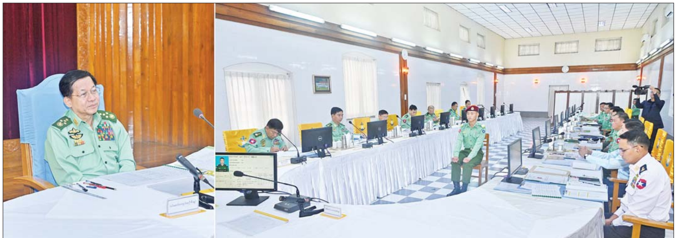
နိုင်ငံတော်စီမံအုပ်ချုပ်ရေးကောင်စီဥက္ကဋ္ဌ တပ်မတော်ကာကွယ်ရေးဦးစီးချုပ် ဗိုလ်ချုပ်မှူးကြီး မင်းအောင်လှိုင် စစ်တက္ကသိုလ်ဗိုလ်လောင်းသင်တန်းအမှတ်စဉ်(၆၇)မှ ဗိုလ်လောင်းများအား တစ်ဦးချင်းစီ တွေ့ဆုံမေးမြန်းစဉ်။