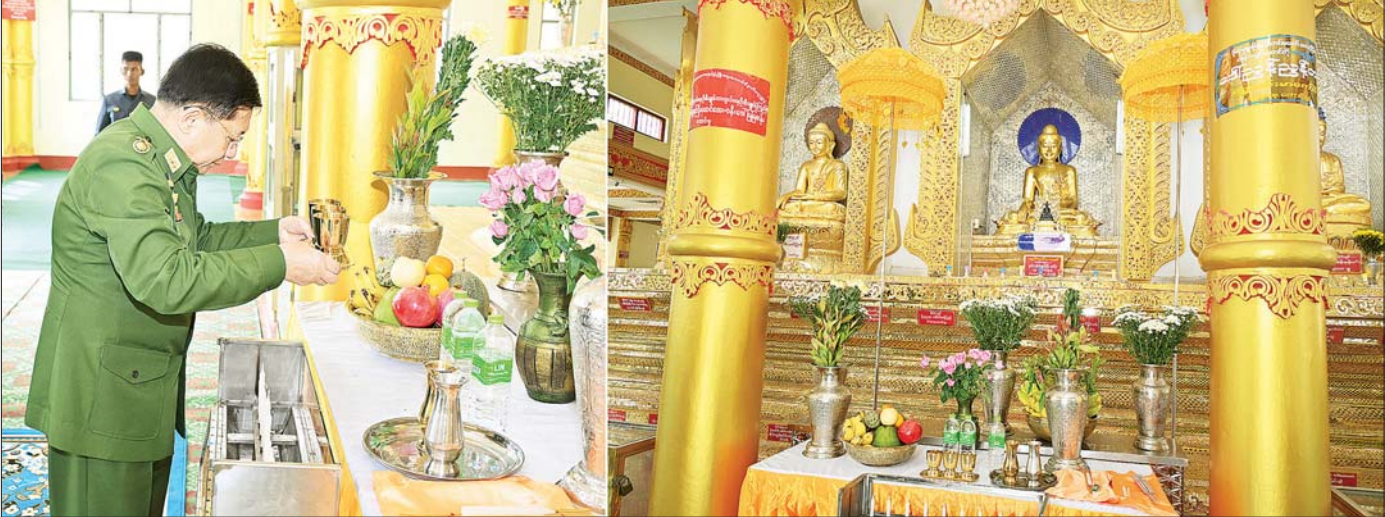
နိုင်ငံတော်စီမံအုပ်ချုပ်ရေးကောင်စီဥက္ကဋ္ဌ တပ်မတော်ကာကွယ်ရေးဦးစီးချုပ် ဗိုလ်ချုပ်မှူးကြီး မင်းအောင်လှိုင် ပြင်ဦးလွင်မြို့ရှိ သမိုင်းဝင် မဟာရွှေမြင်တင်စေတီတော်ကြီးရှိ ဗုဒ္ဓရုပ်ပွားတော်မြတ်အား ပန်း၊ ရေချမ်းများ ကပ်လှူပူဇော်စဉ်။