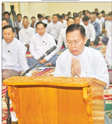
နိုင်ငံတော်စီမံအုပ်ချုပ်ရေးကောင်စီ ဒုတိယဥက္ကဋ္ဌ ဒုတိယဝန်ကြီးချုပ် ဒုတိယဗိုလ်ချုပ်မှူးကြီး စိုးဝင်း အလှူငွေများ ပေးအပ်လှူဒါန်းမှုအပေါ် ကျေးဇူးတင်ဝမ်းမြောက်စကား လျှောက်ထားစဉ်။

❖ နိုင်ငံတော်အစိုးရအနေဖြင့် ရေဘေးကူညီကယ်ဆယ်ရေးနှင့် ပြန်လည်ထူထောင်ရေးလုပ်ငန်းများအတွက် ငွေကျပ် ဘီလီယံ ၃၀ သတ်မှတ်ဆောင်ရွက်လျက်ရှိပါကြောင်း၊ ထို့ပြင် စက်တင်ဘာ ၂၁ ရက်တွင် ကျင်းပပြုလုပ်ခဲ့သော အလှူငွေပေးအပ်ပွဲတွင် စေတနာရှင် အလှူရှင်များက ငွေကျပ် ၃၂ ဒသမ ၂ ဘီလီယံကျော်ကို ပေးအပ်လှူဒါန်းခဲ့ကြသဖြင့် လက်ခံရရှိခဲ့ကြောင်း၊ ထိုသို့ လှူဒါန်းမှုသည် နိုင်ငံတော်အတွင်းတွင်ရှိကြသည့် စေတနာရှင်၊ အလှူရှင်များနှင့် စီးပွားရေးလုပ်ငန်းရှင်များ၏ သဒ္ဓါတရားထက်သန်မှုကို တွေ့မြင်ရပါကြောင်း၊ အဆိုပါအလှူငွေများကိုလည်း သဘာဝဘေးဒဏ်များဖြစ်ပေါ်ခဲ့သည့်နေရာများ၌ အမြန်ဆုံးပြန်လည်ထူထောင်ရေးလုပ်ငန်းများကို ဆက်လက်ဆောင်ရွက်သွားမည်ဖြစ်ပါကြောင်း