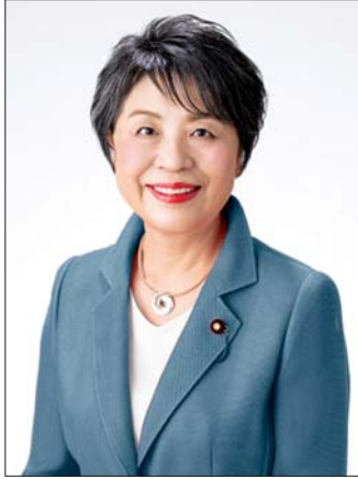
နိုင်ငံခြားရေးဝန်ကြီး ယိုကို ကာမီကာဝါ။