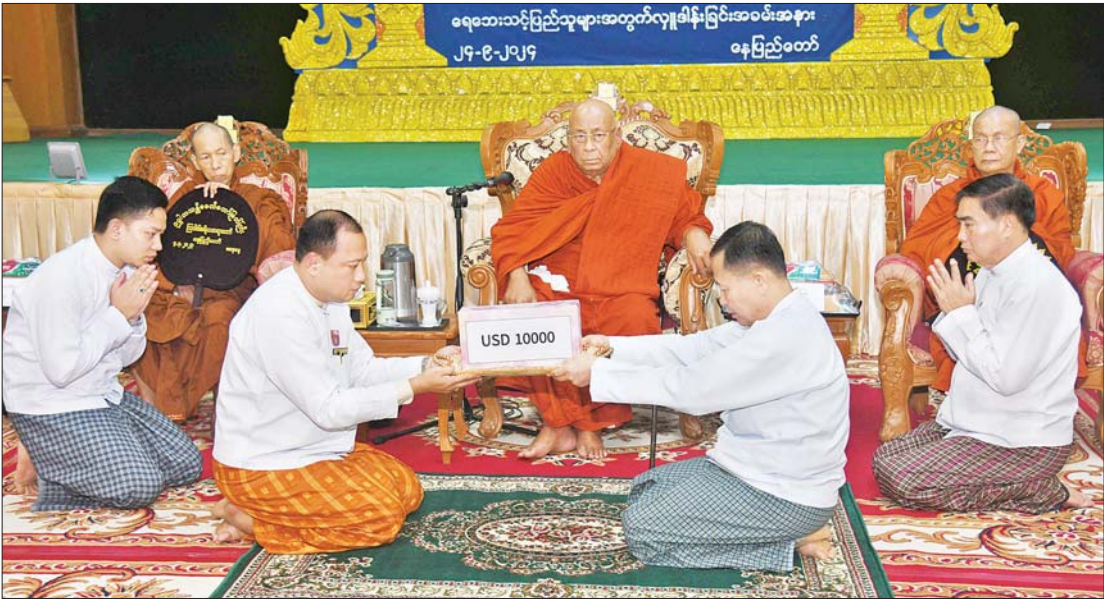
သီတဂူဆရာတော်ကြီးလှူဒါန်းသည့် အမေရိကန်ဒေါ်လာ ၁၀၀၀၀ ကို ဆရာတော်ဘုရားကိုယ်စား ကပွဲယကာရကမှ မေးအပ်လှူဒါန်းရာ နိုင်ငံတော်စီမံအုပ်ချုပ်ရေးကောင်စီ ဒုတိယဥက္ကဋ္ဌ ဒုတိယဝန်ကြီးချုပ် ဒုတိယဗိုလ်ချုပ်မှူးကြီး စိုးဝင်း လက်ခံရယူစဉ်။

နေပြည်တော် စက်တင်ဘာ ၂၄ နိုင်ငံတော်ဩဝါဒါစရိယ၊ ရွှေကျင်နိကာယ ဥက္ကဋ္ဌ ဂဏာဓိပတိသောဠသမ္မ ရွှေကျင် သာသနာပိုင်၊ သီတဂူကမ္ဘာ့ဗုဒ္ဓတက္ကသိုလ် များနှင့် သီတဂူဆေးရုံတော်များ၏ အဓိပတိ၊ အဘိဓဇမဟာရဋ္ဌဂုရု၊ အဘိဓဇ အဂ္ဂမဟာသဒ္ဓမ္မဇောတိက၊ မဟာဓမ္မ ကထိက ဗဟုဇနဟိတဓရ သီတဂူဆရာ တော် ဒေါက်တာ ဘဒ္ဒန္တဉာဏိဿရနှင့် အလှူရှင်တို့က ရာဂီတိုင်ဖွန်းမုန့်တိုင်း တိုက်ခတ်မှုကြောင့် ရေဘေးဒဏ်သင့်ခဲ့ရ သည့်ဒေသများ၌ ကူညီကယ်ဆယ်ရေး နှင့် ပြန်လည်ထူထောင်ရေးလုပ်ငန်းများ ဆောင်ရွက်ရန် ကရုဏာအလှူတော်ငွေ များ ပေးအပ်လှူဒါန်းပွဲအခမ်းအနားကို ယနေ့မုန့်လွဲပိုင်းတွင် နေပြည်တော်ရှိ သာသနာရေးနှင့် ယဉ်ကျေးမှုဝန်ကြီး ဌာန အစည်းအဝေးခန်းမ၌ ကျင်းပသည်။ အခမ်းအနားသို့ သီတဂူဆရာတော် ဒေါက်တာ ဘဒ္ဒန္တဉာဏိဿရ အမျိုးပြု သော ဆရာတော်ကြီးများ ကြွရောက် ချီးမြှင့်တော်မူကြပြီး အမျိုးသားသဘာဝ ဘေးအန္တရာယ်ဆိုင်ရာ စီမံခန့်ခွဲမှု စာမျက်နှာ ၈ ကော်လံ ၁ ❖