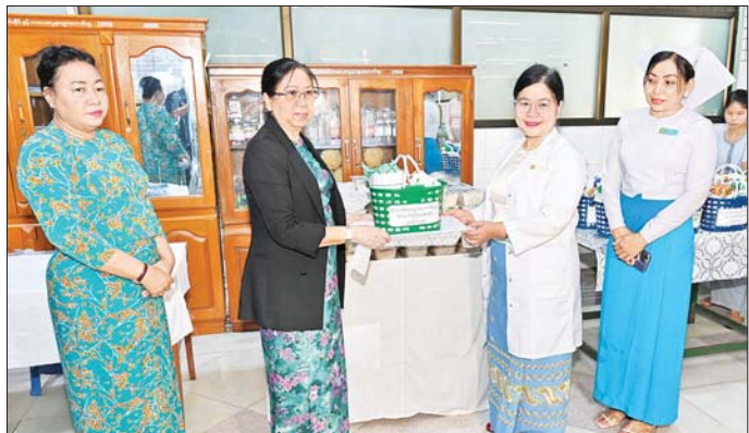
နိုင်ငံတော်စီမံအုပ်ချုပ်ရေးကောင်စီဥက္ကဋ္ဌ တပ်မတော်ကာကွယ်ရေးဦးစီးချုပ်၏ ဇနီး ဒေါ်ကြူကြူလှ ပြင်ဦးလွင်မြို့ ပြည်သူ့ဆေးရုံ၌ ဆေးကုသမှုခံယူလျက်ရှိသည့် ဒေသခံပြည်သူများအတွက် နေ့လယ်စာအဟာရနှင့် ဆေးရုံအတွက် အလှူငွေများ ပေးအပ်စဉ်။

အမျိုးသားသဘာဝဘေးအန္တရာယ်ဆိုင်ရာစီမံခန့်ခွဲမှုကော်မတီ