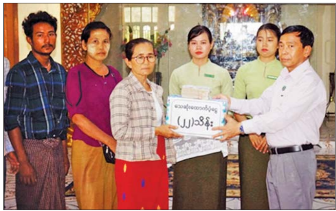
ပုဗ္ဗသီရိမြို့နယ်မှ သေဆုံးသူ ၁၁ ဦးအတွက် နေပြည်တော်ကောင်စီမှ တစ်ဦးလျှင် ငွေကျပ်နှစ်သိန်းကို မိသားစုဝင်များထံ ထောက်ပံ့ပေးအပ်စဉ်။

ဌာနများနှင့် အလှူရှင်များက ထောက်ပံ့ငွေများ ထောက်ပံ့ပေးအပ်လျက်ရှိရာ ယနေ့တွင် နေပြည်တော်ကောင်စီ နယ်မြေအတွင်း မုန့်တိုင်းဒေသဆက်တွဲ ဒဏ်ကြောင့်သေဆုံးခဲ့သည့်သူများအနက် ပုဗ္ဗသီရိမြို့နယ်မှ သေဆုံးသူ ၁၁ ဦး၊ ပျဉ်းမနားမြို့နယ်မှ သေဆုံးသူ ၃ ခုနှစ်ဦး၊ ဇေယျာသီရိမြို့နယ်မှ သေဆုံးသူလေးဦးတို့ကို အမျိုးသားသဘာဝဘေးအန္တရာယ်ဆိုင်ရာ စီမံခန့်ခွဲမှုကော်မတီမှ ဆိုင်ရာ စီမံခန့်ခွဲမှုကော်မတီမှ ထောက်ပံ့ငွေများ ပြန်လည်နေရာချထားရေး ဝန်ကြီးဌာနမှ ထောက်ပံ့သုံးသိန်းနှင့် နေပြည်တော်ကောင်စီမှ ငွေကျပ်နှစ်သိန်း စုစုပေါင်း သေဆုံးသူတစ်ဦးလျှင် ငွေကျပ် ၁၀ သိန်းနှုန်းဖြင့် ၂၂ ဦး