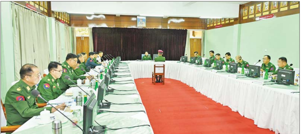
နိုင်ငံတော်စီမံအုပ်ချုပ်ရေးကောင်စီဥက္ကဋ္ဌ တပ်မတော်ကာကွယ်ရေးဦးစီးချုပ် ဗိုလ်ချုပ်မှူးကြီး မင်းအောင်လှိုင် တပ်မတော်နည်းပညာတက္ကသိုလ် ဗိုလ်လောင်းသင်တန်းအမှတ်စဉ်(၂၇)မှ ဗိုလ်လောင်းများအား တစ်ဦးချင်းစီ တွေ့ဆုံမေးမြန်းစဉ်။

နေပြည်တော် စက်တင်ဘာ ၂၄ နိုင်ငံတော်စီမံအုပ်ချုပ်ရေးကောင်စီဥက္ကဋ္ဌ တပ်မတော်ကာကွယ်ရေးဦးစီးချုပ်ဗိုလ်ချုပ်မှူးကြီး မင်းအောင်လှိုင်သည် စက်တင်ဘာ ၂၃ ရက်နှင့် ယနေ့တို့တွင် စစ်တက္ကသိုလ်ဗိုလ်လောင်းသင်တန်းအမှတ်စဉ်(၆၇) စစ်လက်ရုံးရွေးချယ်ပွဲနှင့် တပ်မတော်နည်းပညာတက္ကသိုလ် ဗိုလ်လောင်းသင်တန်းအမှတ်စဉ်(၂၇) စစ်လက်ရုံးရွေးချယ်ပွဲတို့သို့ သီးခြားစီ တက်ရောက်စိစစ်ရွေးချယ်သည်။ အဆိုပါ စစ်လက်ရုံးရွေးချယ်ပွဲများသို့ နိုင်ငံတော်စီမံအုပ်ချုပ်ရေးကောင်စီဥက္ကဋ္ဌ တပ်မတော်ကာကွယ်ရေးဦးစီးချုပ်နှင့်အတူ ညှိနှိုင်းကွပ်ကဲရေးမှူး (ကြည်း၊ ရေ၊ လေ) ဗိုလ်ချုပ်ကြီး မောင်မောင်အေး၊ ကာကွယ်ရေးဦးစီးချုပ် (ရေ) ဒုတိယဗိုလ်ချုပ်ကြီး ထိန်ဝင်း၊ ကာကွယ်ရေးဦးစီးချုပ်ရုံးမှ အဆင့်မြင့် တပ်မတော်အရာရှိကြီးများ၊ အလယ်ပိုင်းတိုင်း စစ်ဌာနချုပ်တိုင်းမှူး၊ စစ်တက္ကသိုလ်ကျောင်းအုပ်ကြီး၊ တပ်မတော်နည်းပညာတက္ကသိုလ် ကျောင်းအုပ်ကြီးနှင့် တာဝန်ရှိသူများ စာမျက်နှာ ၇ သို့