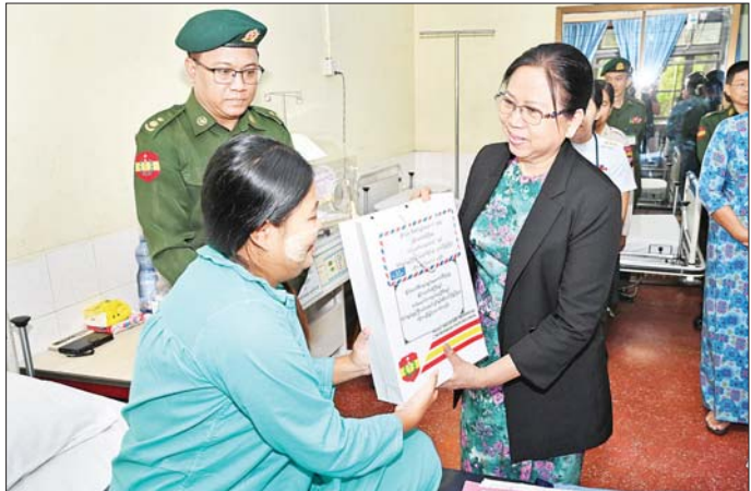
နိုင်ငံတော်စီမံအုပ်ချုပ်ရေးကောင်စီဥက္ကဋ္ဌ တပ်မတော်ကာကွယ်ရေးဦးစီးချုပ်၏ ဇနီး ဒေါ်ကြူကြူလှ ပြင်ဦးလွင်မြို့ နယ်မြေခံတပ်မတော်ဆေးရုံ၌ တက်ရောက်ဆေးကုသမှုခံယူလျက်ရှိသည့် အရာရှိ၊ စစ်သည်၊ မိသားစုဝင်များအား စားသောက်ဖွယ်ရာပစ္စည်းများ ပေးအပ်စဉ်။

ယင်းနောက် နိုင်ငံတော်စီမံအုပ်ချုပ်ရေးကောင်စီဥက္ကဋ္ဌ တပ်မတော်ကာကွယ်ရေးဦးစီးချုပ်နှင့် အဖွဲ့ဝင်များသည် ပြင်ဦးလွင်တပ်နယ်အတွင်းရှိ တပ်ရင်း၊ တပ်ဖွဲ့များ၊ သင်တန်းကျောင်းများအတွင်း မော်တော်ယာဉ်များဖြင့် လှည့်လည်ကြည့်ရှုစစ်ဆေးခဲ့သည်။ ယနေ့နံနက်ပိုင်းတွင်လည်း နိုင်ငံတော်စီမံအုပ်ချုပ်ရေးကောင်စီဥက္ကဋ္ဌ တပ်မတော်ကာကွယ်ရေးဦးစီးချုပ်၏ ဇနီးနှင့် အဖွဲ့ဝင်များသည် ပြင်ဦးလွင်မြို့ နယ်မြေခံ တပ်မတော်ဆေးရုံသို့ရောက်ရှိပြီး သားဖွားမီးယပ်နှင့် ကလေးကုသဆောင်ရှိ ဆေးရုံတက်ရောက်ကုသမှုခံယူနေသူများအား ရင်းရင်းနှီးနှီး မေးမြန်းအားပေးစကားပြောကြားကာ စားသောက်ဖွယ်ရာပစ္စည်းများ ပေးအပ်သည်။ ထို့နောက် နိုင်ငံတော်စီမံအုပ်ချုပ်ရေးကောင်စီဥက္ကဋ္ဌ တပ်မတော်ကာကွယ်ရေးဦးစီးချုပ်၏ ဇနီးက ဆေးရုံ၌ တက်ရောက်ဆေးကုသမှုခံယူလျက်ရှိသည့် အရာရှိ၊ စစ်သည်၊ မိသားစုဝင်များအတွက် နေ့လယ်စာအဟာရနှင့် ဆေးရုံအတွက် လှူဒါန်းငွေများကို ပေးအပ်ရာ ဆေးရုံအုပ်ကြီးက လက်ခံရယူခဲ့ကြောင်းနှင့် အဟာရဌာန၌ အရာရှိ၊ စစ်သည်များ၏ နေ့လယ်စာအဟာရ သုံးဆောင်နေမှုအား လိုက်လံကြည့်ရှုစစ်ဆေးခဲ့ကြောင်း သတင်းရရှိသည်။ သတင်းစဉ်