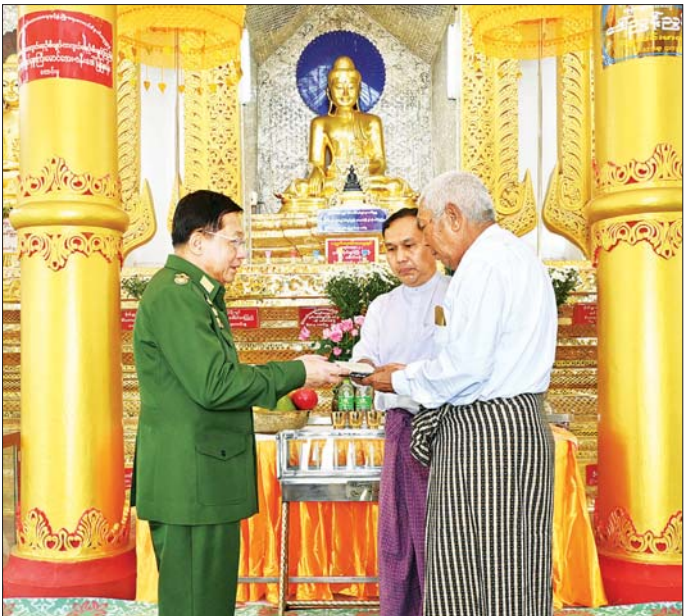
နိုင်ငံတော်စီမံအုပ်ချုပ်ရေးကောင်စီဥက္ကဋ္ဌ တပ်မတော်ကာကွယ်ရေးဦးစီးချုပ် ဗိုလ်ချုပ်မှူးကြီး မင်းအောင်လှိုင် စေတီတော်မြတ်ကြီးအတွက် ဘက်စုံအလှူငွေများ ပေးအပ်လှူဒါန်းစဉ်။