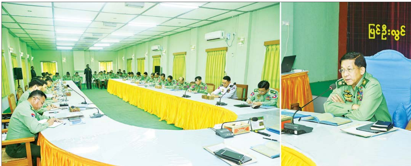
နိုင်ငံတော်စီမံအုပ်ချုပ်ရေးကောင်စီဥက္ကဋ္ဌ တပ်မတော်ကာကွယ်ရေးဦးစီးချုပ် ဗိုလ်ချုပ်မှူးကြီး မင်းအောင်လှိုင် ပြင်ဦးလွင်တပ်နယ်အတွင်း လုံခြုံရေးနှင့် နယ်မြေတည်ငြိမ်အေးချမ်းရေးဆိုင်ရာလုပ်ငန်းများ ဆောင်ရွက်လျက်ရှိမှုအခြေအနေများနှင့်ပတ်သက်၍ မှာကြားစဉ်။

နိုင်ငံတော်စီမံအုပ်ချုပ်ရေးကောင်စီဥက္ကဋ္ဌ တပ်မတော်ကာကွယ်ရေးဦးစီးချုပ် ဗိုလ်ချုပ်မှူးကြီး မင်းအောင်လှိုင် အလယ်ပိုင်းတိုင်းစစ်ဌာနချုပ် ပြင်ဦးလွင်တပ်နယ်အတွင်း နယ်မြေတည်ငြိမ်အေးချမ်းရေးဆိုင်ရာ ဆောင်ရွက်ထားရှိမှုနှင့် မြို့ပြဖွံ့ဖြိုးတိုးတက်ရေးဖော်ဆောင်နေမှုတို့အား ကြည့်ရှုစစ်ဆေး