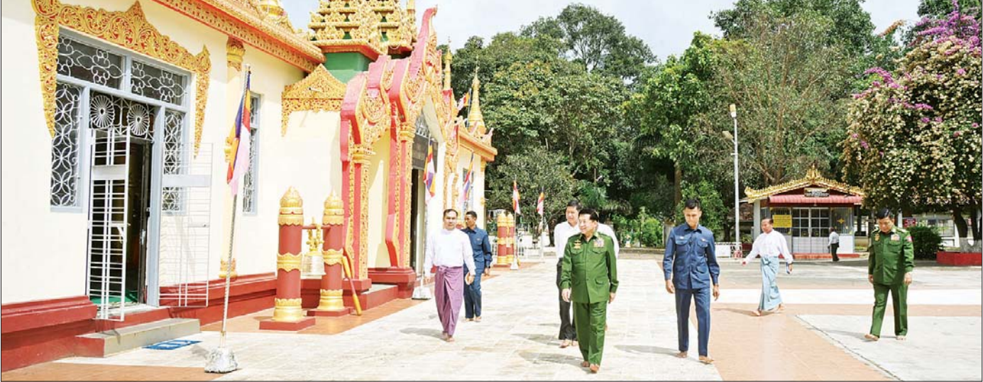
နိုင်ငံတော်စီမံအုပ်ချုပ်ရေးကောင်စီဥက္ကဋ္ဌ တပ်မတော်ကာကွယ်ရေးဦးစီးချုပ် ဗိုလ်ချုပ်မှူးကြီး မင်းအောင်လှိုင်နှင့်အဖွဲ့ဝင်များ စေတီတော်မြတ်ကြီးအား လက်ယာရစ်လှည့်လည် ဖူးမြော်ကြည့်ညိစဉ်။