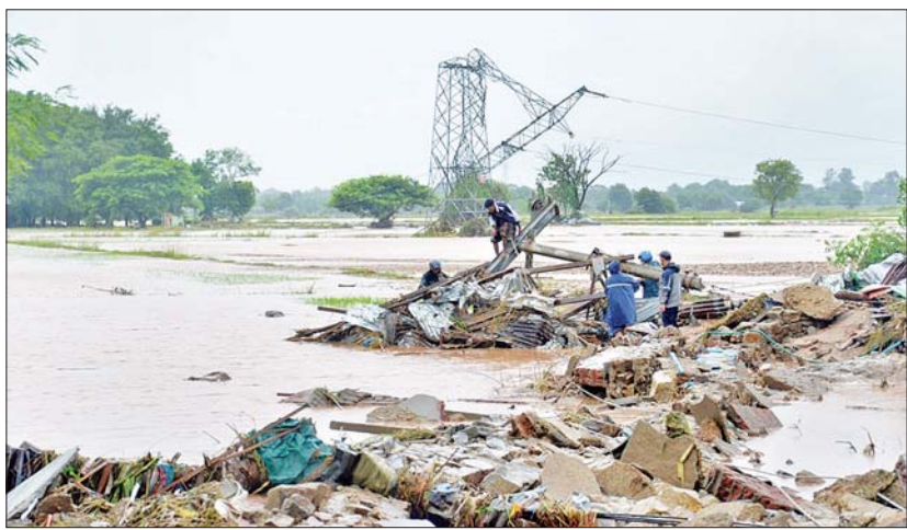
ရေကြီးရေလျှံမှုကြောင့် ပြိုလဲပျက်စီးသွားသည့် ဓာတ်အားလှိုင်းပြန်လည်ပြုပြင်ခြင်းလုပ်ငန်းများ ဆောင်ရွက်နေမှုကို တွေ့ရစဉ်။