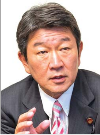
အယ်လ်ဒီပီပါတီ အထွေထွေအတွင်းရေးမှူး ရှိဂရို မိုတေဂီ။