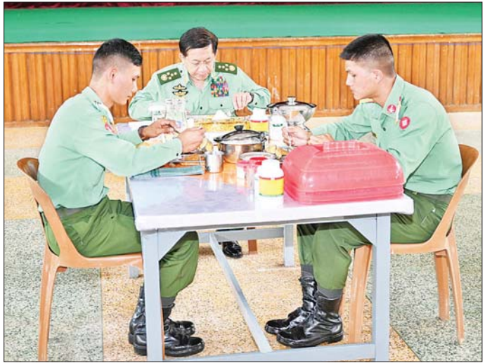
နိုင်ငံတော်စီမံအုပ်ချုပ်ရေးကောင်စီဥက္ကဋ္ဌ တပ်မတော်ကာကွယ်ရေးဦးစီးချုပ် ဗိုလ်ချုပ်မှူးကြီး မင်းအောင်လှိုင် ဗိုလ်လောင်းများနှင့်အတူ နေ့လယ်စာ အတူတကွသုံးဆောင်စဉ်။