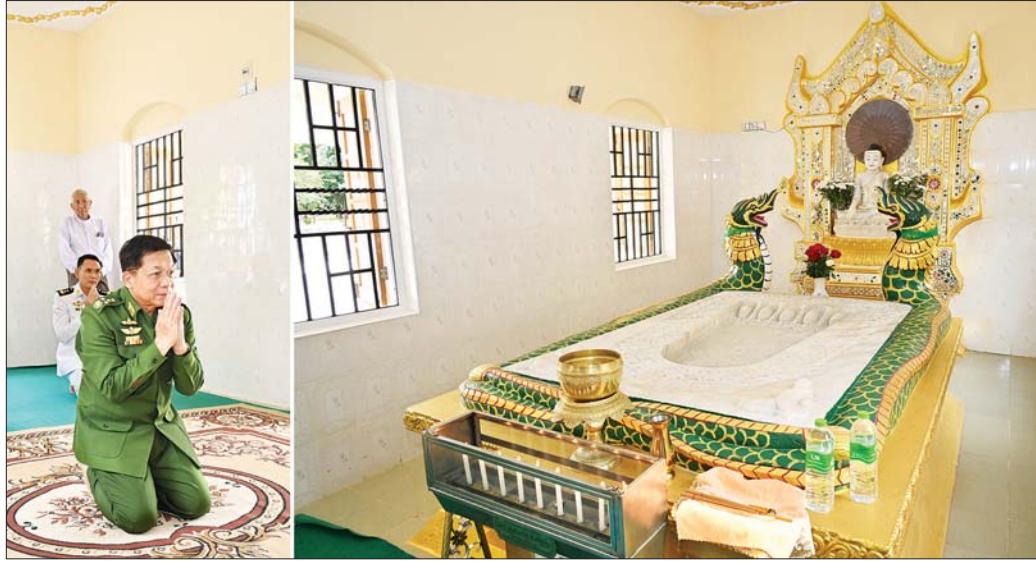
နိုင်ငံတော်စီမံအုပ်ချုပ်ရေးကောင်စီဥက္ကဋ္ဌ တပ်မတော်ကာကွယ်ရေးဦးစီးချုပ် ဗိုလ်ချုပ်မှူးကြီး မင်းအောင်လှိုင် မြတ်စွာဘုရားရှင်၏ ပါဒခြေတော်ရာဆောင် ရှိ ဗုဒ္ဓရုပ်ပွားတော်မြတ်အား ဖူးမြော်ကြည့်လိုစဉ်။

ထို့နောက် နိုင်ငံတော်စီမံအုပ်ချုပ်ရေးကောင်စီ ဥက္ကဋ္ဌ တပ်မတော်ကာကွယ်ရေးဦးစီးချုပ်နှင့် အဖွဲ့ဝင် များသည် မြတ်စွာဘုရားရှင်၏ ပါဒခြေတော်ရာဆောင် ရှိ ဗုဒ္ဓရုပ်ပွားတော်မြတ်အား ဖူးမြော်ကြည့်လိုပြီး စေတီတော်မြတ်ကြီးအား လက်ယာရစ်လှည့်လည် ဖူးမြော်ကြည့်လိုခဲ့ကြကြောင်း သတင်းရရှိသည်။ သတင်းစဉ်