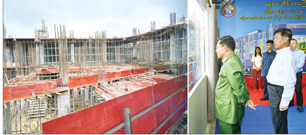
နိုင်ငံတော်စီမံအုပ်ချုပ်ရေးကောင်စီဥက္ကဋ္ဌ တပ်မတော်ကာကွယ်ရေးဦးစီးချုပ် ဗိုလ်ချုပ်မှူးကြီး မင်းအောင်လှိုင် သုမင်္ဂလာဈေး(ညံ့တောဈေး) ခြောက်ထပ် အဆင့်မြင့် ဈေးသစ်တည်ဆောက်ရေးစီမံကိန်းအတွင်း လုပ်ငန်းဆောင်ရွက်နေမှုအခြေအနေအရားကို ကြည့်ရှုစစ်ဆေးစဉ်။

“ ယခုအဆင့်မြင့်ဈေးသစ် တည် ဆောက်စေခြင်းသည် ပြင်ဦးလွင် မြို့၏ လူနေမှုထူထပ်လာမှုများ၊ ခရီးသွားလာမှု များပြားလာမှုများနှင့် ကိုက်ညီသည့် အဆင့်မီဈေးတစ်ခု ဖြစ်ပေါ်လာစေရန်နှင့် ဒေသထွက် နှင့် အခြေခံသုံးကုန်ပစ္စည်းများကို တစ်နေရာတည်းတွင် တစ်စုတစ်စည်း တည်းရရှိနိုင်စေရန် ရည်ရွယ် ဆောင်ရွက်စေခြင်းဖြစ် ”