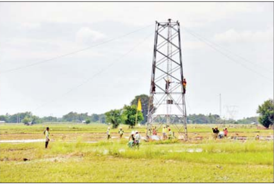
ပြည်ထောင်စုဝန်ကြီး ဦးညွှန်ထွန်း ရေကြီးရေလျှံမှုကြောင့် ပြိုလဲပျက်စီးသွားသည့် ဓာတ်အားလှိုင်းပြန်လည်ပြုပြင်ခြင်းလုပ်ငန်းများကို ကွင်းဆင်းကြည့်ရှုစဉ်။