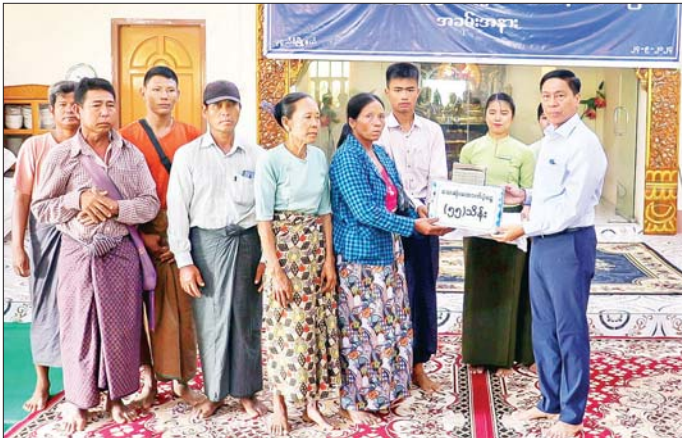
နိုင်ငံတော်ကတတ်နိုင်သမျှ ဆက်လက်ပံ့ပိုးကူညီမည့် အခြေအနေတို့ကို ရှင်းလင်း၍ အားပေးစကားပြောကြားသည်။

နေပြည်တော် စက်တင်ဘာ ၂၄ အမျိုးသားသဘာဝဘေးအန္တရာယ်ဆိုင်ရာစီမံခန့်ခွဲမှုကော်မတီဒုတိယဥက္ကဋ္ဌ (၂) လူမှုဝန်ထမ်း၊ ကယ်ဆယ်ရေးနှင့် ပြန်လည်နေရာချထားရေးဝန်ကြီးဌာန ပြည်ထောင်စုဝန်ကြီး ဒေါက်တာစိုးဝင်းသည် နေပြည်တော်ကောင်စီဥက္ကဋ္ဌ ဦးသန်းထွန်းဦး၊ နေပြည်တော်ကောင်စီဝင်များ၊ ဌာနဆိုင်ရာတာဝန်ရှိသူများနှင့်အတူ ယနေ့နံနက်ပိုင်းတွင် ဇေယျာသီရိမြို့နယ် စိမ်းစားပင်ကျေးရွာ အောင်မြေရတနာဘုန်းတော်ကြီးကျောင်းနှင့် ပုဗ္ဗသီရိမြို့နယ် ခြေမင်္ဂလာပေါက်တော ဘုန်းတော်ကြီးကျောင်းတို့ရှိ ရေဘေးရှောင်ပြည်သူများအား သွားရောက်တွေ့ဆုံ အားပေးထောက်ပံ့သည်။