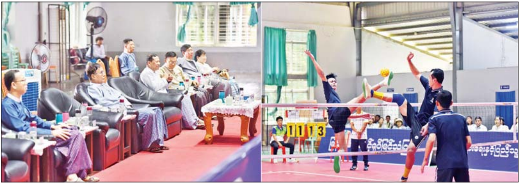
ဒုတိယဝန်ကြီး ဦးရဲတင်၊ ဌာနဆိုင်ရာအကြီးအကဲများ၊ ဝန်ထမ်းများနှင့် အားကစားဝါသနာရှင်များ ၂၀၂၄ ခုနှစ် ပြန်ကြားရေးဝန်ကြီးဌာန ပြည်ထောင်စုဝန်ကြီးဗလား အမျိုးသားပိုက်ကျော်ခြင်းပြိုင်ပွဲ ဆီမီးဖိုင်နယ်ပွဲစဉ် ကြည့်ရှုအားပေးစဉ်။

နေပြည်တော် စက်တင်ဘာ ၂၄ ၂၀၂၄ ခုနှစ် ပြန်ကြားရေးဝန်ကြီးဌာန ပြည်ထောင်စုဝန်ကြီးဗလား အမျိုးသား ပိုက်ကျော်ခြင်းပြိုင်ပွဲ ဆီမီးဖိုင်နယ်ပွဲစဉ်များကို ယနေ့ မွန်းလွဲပိုင်းတွင် ပြည်ထောင်စုနယ်မြေ နေပြည်တော်ရှိ ဝဏ္ဏသိဒ္ဓိ အားကစားကွင်း၌ ဆက်လက်ကျင်းပရာ ပြန်ကြားရေးဝန်ကြီးဌာန ဒုတိယဝန်ကြီး ဦးရဲတင်၊ ဌာနဆိုင်ရာ အကြီးအကဲများ၊ ဝန်ထမ်းများနှင့် အားကစားဝါသနာရှင်များ တက်ရောက်ကြည့်ရှု အားပေးကြသည်။ ယနေ့ အမျိုးသားပိုက်ကျော်ခြင်းပြိုင်ပွဲ ဆီမီးဖိုင်နယ်ပွဲစဉ်များအဖြစ် ယှဉ်ပြိုင်ကစားကြရာ ပြန်ကြားရေးနှင့် ပြည်သူ့ဆက်ဆံရေးဦးစီးဌာန အသင်းက သတင်းနှင့် စာနယ်ဇင်းလုပ်ငန်းအသင်းကို နှစ်ပွဲပြတ်ဖြင့်လည်းကောင်း၊ မြန်မာ့အသင်းနှင့် ရုပ်မြင်သံကြားအသင်းက မီဒီယာဖွံ့ဖြိုးတိုးတက်ရေးဦးစီးဌာနအသင်းကို နှစ်ပွဲပြတ်ဖြင့်လည်းကောင်း ယှဉ်ပြိုင်အနိုင်ရရှိကြသည်။ အဆိုပါ ပြိုင်ပွဲကို ဝန်ထမ်းများ ကျန်းမာကြံ့ခိုင်စေရန် စည်းလုံးညီညွတ်စေရန်၊ အားကစားစိတ်ဓာတ်ဖြင့် သန်သန်ရှင်းရှင်း ယှဉ်ပြိုင်နိုင်စေရန်နှင့် နိုင်ငံ