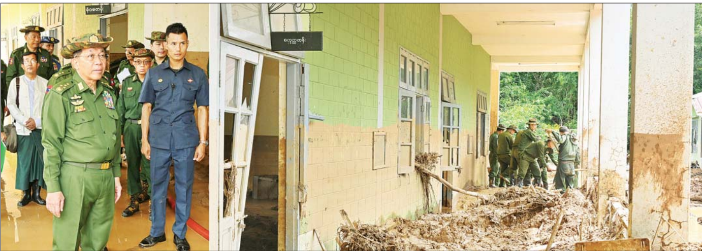
နိုင်ငံတော်စီမံအုပ်ချုပ်ရေးကောင်စီဥက္ကဋ္ဌ တပ်မတော်ကာကွယ်ရေးဦးစီးချုပ် ဗိုလ်ချုပ်မှူးကြီး မင်းအောင်လှိုင် တပ်ကုန်းတပ်နယ်အတွင်းရှိ အထက်တန်းကျောင်း၌ တပ်မတော်သားများ နန်းများဖယ်ရှား ရှင်းလင်းခြင်းနှင့် သန့်ရှင်းရေးလုပ်ငန်းဆောင်ရွက်နေမှုကို ကြည့်ရှုစစ်ဆေးစဉ်။