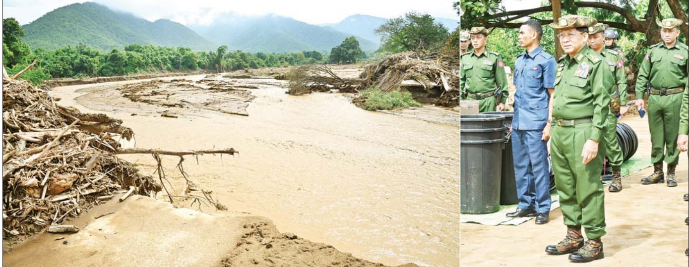
နိုင်ငံတော်စီမံအုပ်ချုပ်ရေးကောင်စီဥက္ကဋ္ဌ တပ်မတော်ကာကွယ်ရေးဦးစီးချုပ် ဗိုလ်ချုပ်မှူးကြီး မင်းအောင်လှိုင် တောင်ကျချောင်းရေများ အလုံးအရင်းဖြင့် စီးဆင်းခဲ့မှုကြောင့် ကျီးကျုပျက်စီးခဲ့သည့် မုန့်ချောင်းကူး ကွန်ကရစ်တံတား ပျက်စီးမှုများကို သွားရောက်ကြည့်ရှုစစ်ဆေးစဉ်။

စာမျက်နှာ ၃ မှ ယင်းနောက် နိုင်ငံတော်စီမံအုပ်ချုပ်ရေးကောင်စီဥက္ကဋ္ဌ တပ်မတော်ကာကွယ်ရေးဦးစီးချုပ်သည် မိုးသည်းထန်စွာရွာသွန်းမှုကြောင့် ရုတ်တရက် ရေကြီးရေလျှံမှုဖြစ်ပေါ်ခဲ့စဉ် ထိခိုက်ဒဏ်ရာရရှိခဲ့ပြီး နယ်မြေခံတပ်ဌာနချုပ်ဆေးခန်း၌ ဆေးကုသမှုခံယူ လျက်ရှိသည့် စစ်သည်များအား သွားရောက်ကြည့်ရှု၍ ရင်းရင်းနှီးနှီး အားပေးစကား ပြောကြားကာ စားသောက်ဖွယ်ရာပစ္စည်းများ ပေးအပ်သည်။ ဆက်လက်၍ တောင်ကျချောင်းရေများ အလုံးအရင်းဖြင့် စီးဆင်းခဲ့မှုကြောင့် ကျီးကျုပျက်စီးခဲ့သည့် မုန့်ချောင်းကူးကွန်ကရစ်တံတား ပျက်စီးမှုများကို သွားရောက် ကြည့်ရှုစစ်ဆေးရာ တာဝန်ရှိသူများက ရေစီးကြောင်းနှင့်အတူ သစ်ပင်သစ်လုံးကြီးများ၊ ကျောက်တုံးများ မျောပါခဲ့ပြီး အရှိန်အဟုန်ဖြင့် ရိုက်ခတ်ခဲ့မှုကြောင့် တံတားပျက်စီးခဲ့မှုများကို တင်ပြကြသည်။ တင်ပြချက်များအပေါ် နိုင်ငံတော်စီမံအုပ်ချုပ်ရေးကောင်စီဥက္ကဋ္ဌ တပ်မတော်ကာကွယ်ရေးဦးစီးချုပ်က လိုအပ်သည်များ မှာကြားကာ ကူညီကယ်ဆယ်ရေးလုပ်ငန်း ဆောင်ရွက်နေမှုများကို ကြည့်ရှုသည်။