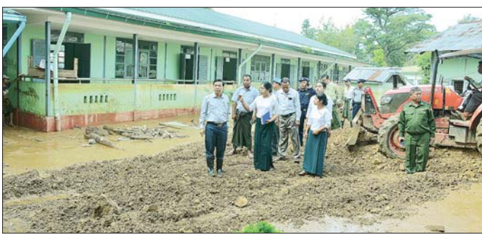
ဧည့်သည်အဖွဲ့ဝင်များ စစ်ဆေးနေကြောင်း တွေ့ရှိရပါသည်။

နေပြည်တော် စက်တင်ဘာ ၁၈ နေပြည်တော်ကောင်စီ ဥက္ကဋ္ဌ ဦးသန်းထွန်းဦးသည် နေပြည် တော်ကောင်စီဝင်များ၊ နေပြည် တော် စည်ပင်သာယာရေး ကော်မတီဝင်များ၊ ဌာနဆိုင်ရာ တာဝန်ရှိသူများနှင့်အတူ ယနေ့ နံနက်ပိုင်းတွင် လယ်ဝေးမြို့နယ် အောင်ကုန်းကျေးရွာ ဘုန်းတော် ကြီးကျောင်း၌ ဖွင့်လှစ်ထားသည့် ယာယီ ကယ်ဆယ်ရေးစခန်းသို့ သွားရောက်၍ ကျောင်းထိုင်ဆရာ တော်အား ဖူးမြော်ကြည့်ညို၍ လှူဖွယ်ပစ္စည်းများ ဆက်ကပ် လှူဒါန်းပြီး ရေဘေးသင့်ပြည်သူ များအတွက် စားသောက်ဖွယ်ရာ ဖွင့် ထောက်ပံ့ပေးပေး အပ် သည်။ ဆက်လက်၍ နေပြည်တော် ကောင်စီဥက္ကဋ္ဌနှင့် အဖွဲ့သည်