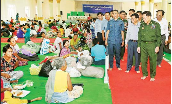
နိုင်ငံတော်စီမံအုပ်ချုပ်ရေးကောင်စီဥက္ကဋ္ဌ တပ်မတော်ကာကွယ်ရေးဦးစီးချုပ် ဗိုလ်ချုပ်မှူးကြီး မင်းအောင်လှိုင် ပျဉ်းမနားမြို့နယ် မင်္ဂလာဗျူဟာသာသနာ့ဗိမာန် ရေဘေးရှောင်ကယ်ဆယ်ရေးစခန်းရှိ ပြည်သူများအား ရင်းရင်းနှီးနှီး နှုတ်ဆက်စဉ်။

❑ သဘာဝဘေးအန္တရာယ်ဆိုသည်မှာ ရှောင်ရှား၍မရသော်လည်း ကြိုတင်ကာကွယ်မှု ကိစ္စရပ် များကို လုပ်ဆောင်နိုင်သကဲ့သို့ သဘာဝဘေးအန္တရာယ်ကျရောက်ပြီးပါက ကယ်ဆယ်ရေး လုပ်ငန်းများဖြင့် မူလအခြေအနေများ ပြန်ရောက်စေရန်နှင့် ပိုမိုကောင်းမွန်စေရန် မိမိတို့ အားလုံး၏ လုံ့လ၊ စိရိယများဖြင့် ကြိုးပမ်းဆောင်ရွက်သွားကြရမည်၊ စိတ်ဓာတ်ကျနေ၍မရဘဲ မူလအခြေအနေ ပြန်လည်ရရှိအောင် ကြိုးပမ်းဆောင်ရွက်သွားရမည်။ ပျက်စီးဆုံးရှုံးခဲ့သည့် နေရာများကို ပြန်လည်ထူထောင်ရေးလုပ်ငန်းများအတွက် နိုင်ငံတော်မှ ဦးဆောင်၍ ဆောင်ရွက်ပေးသွားမည်