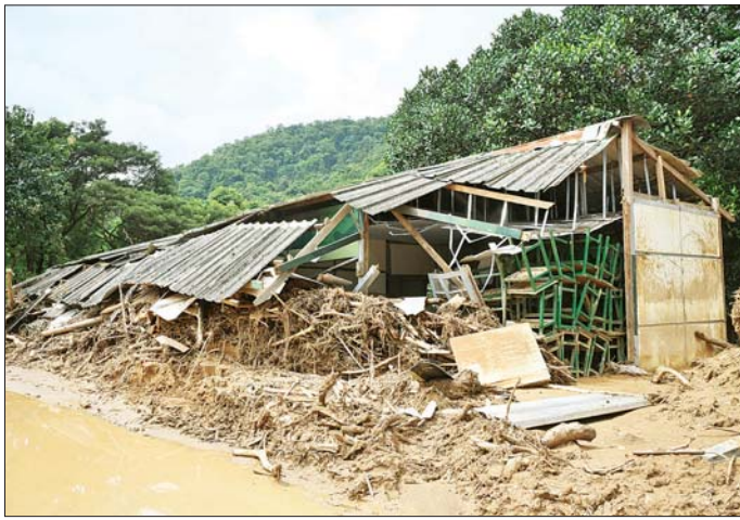
တောင်ကျချောင်းရေဝင်ရောက်မှုကြောင့် တပ်ကုန်းတပ်နယ်အတွင်းရှိ အထက်တန်းကျောင်းနှင့် အဆောက်အအုံများ ပျက်စီးခဲ့မှုကို တွေ့ရစဉ်။