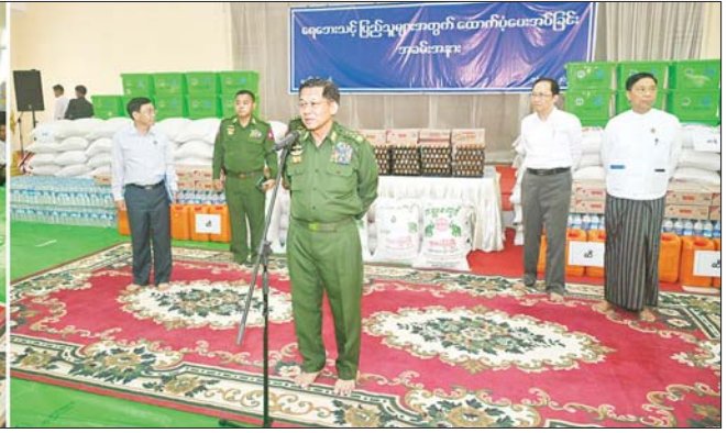
နိုင်ငံတော်စီမံအုပ်ချုပ်ရေးကောင်စီဥက္ကဋ္ဌ တပ်မတော်ကာကွယ်ရေးဦးစီးချုပ် ဗိုလ်ချုပ်မှူးကြီး မင်းအောင်လှိုင် ပျဉ်းမနားမြို့နယ် မင်္ဂလာဗျူဟာသာသနာ့ဗိမာန် ရေဘေးရှောင်ကယ်ဆယ်ရေးစခန်းရှိ ရေဘေးရှောင် ပြည်သူများအား အားပေးစကားပြောကြားစဉ်။