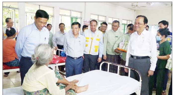
အစားအစာနှင့် ပူပူနွေးနွေး ချက်ပြုတ်ထားသော အစားအစာ ကိုသာ စားသုံးရန်၊ ရက်ကျော်နှင့် အချိန်ကျော် သိမ်းထားသော အစားအစာများကို စားသုံးခြင်း မပြုရန်၊ တစ်ကိုယ်ရေ သန့်ရှင်း ရေး ဂရုပြုဆောင်ရွက်ရန်၊ မိမိတို့ နေအိမ်ရှိသောက်စေ့များကို ရေသန့်ဆေးပြီး ထည့်ပြီးမှသာ အသုံးပြုရန်နှင့် နေအိမ်များသို့ ပြန်ရောက်သည့်အခါ ကျန်းမာရေး ဝန်ကြီးဌာနက ထုတ်ပြန်ထားသော နေအိမ်များသို့ ပြန်လည် သွား ရောက်နေထိုင်ချိန်တွင် သတိပြု လိုက်နာဆောင်ရွက်ရန် အချက် များကို လိုက်နာဆောင်ရွက်ကြ ရန်တို့ကို မှာကြားခဲ့ကြောင်း သတင်းရရှိသည်။ သတင်းစဉ်

ပေးအပ်သည်။ ပြည်သူ့ဆေးရုံ တပ်ကုန်း မြို့သို့ တက်ရောက်ကုသခဲ့သော အတွင်းလူနာ ၅၆ ဦးအနက် ၃၅ ဦးမှာ ကျန်းမာရေးကောင်းမွန်၍ သက်သာလာသဖြင့် ဆေးရုံမှ ဆင်းခွင့်ရရှိခဲ့ပြီး ကျန်ရှိနေသော လူနာ ၂၁ ဦးကို ပြည်ထောင်စု ဝန်ကြီးများနှင့် တာဝန်ရှိသူများ သွားရောက်ကြည့်ရှု၍ အားပေး စကားပြောကြားကာလက်ဆောင် ပစ္စည်းများနှင့် ထောက်ပံ့ငွေများ ပေးအပ်ပြီး လူနာများအား သေချာ စွာ စောင့်ကြပ်ကြည့်ရှုကုသရန် မှာကြားသည်။ ထို့နောက် ပြည်ထောင်စု ဝန်ကြီးသည် ဆေးရုံတက်ရောက် ကုသနေသော လူနာများအား ရင်းရင်းနှီးနှီး လည်လည်ကြည့်ရှု ပြီး(အပေါ်ယာ)လတ်ဆတ်သော