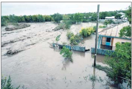
ရိုမေးနီးယားနိုင်ငံ ဒေသတစ်ခု၌ ရေကြီးရေလျှံမှု ဖြစ်ပွားစဉ်။

ပါဆော စက်တင်ဘာ ၁၈ မိုးသည်းထန်စွာ ရွာသွန်းမှုများကြောင့် ဥရောပအလယ်ပိုင်းနှင့် အရှေ့ပိုင်းဒေသများတွင် ဆိုးရွားသည့် ပျက်စီးဆုံးရှုံးမှုများ ဖြစ်ပေါ်လျက်ရှိသည်။ ထို့ပြင် ယင်းဖြစ်ရပ်ကြောင့် လူပေါင်း ၂၀ ကျော် သေဆုံးမှု ဖြစ်ပွားကြောင်းလည်း သိရသည်။