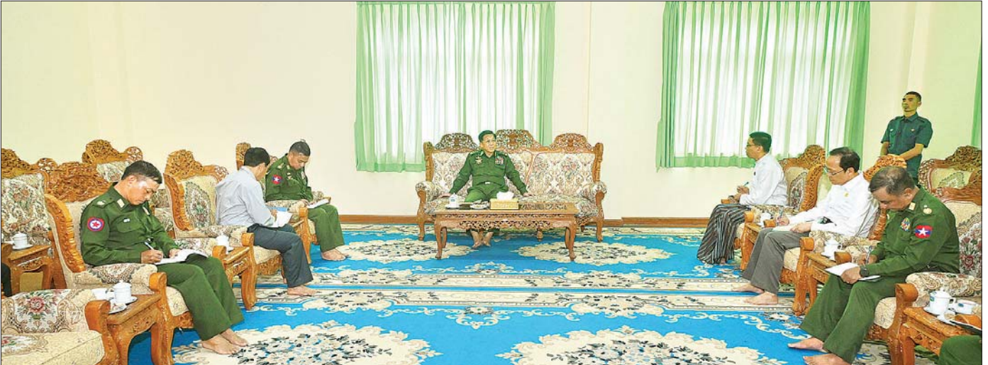
နိုင်ငံတော်စီမံအုပ်ချုပ်ရေးကောင်စီဥက္ကဋ္ဌ တပ်မတော်ကာကွယ်ရေးဦးစီးချုပ် ဗိုလ်ချုပ်မှူးကြီး မင်းအောင်လှိုင် မင်္ဂလာဗျူဟာ သာသနာ့ဗိမာန်ဧည့်ခန်းမဆောင်၌ တာဝန်ရှိသူများအား တွေ့ဆုံမှာကြားသည်။