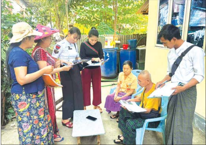
ရန်ကုန်တိုင်းဒေသကြီး မင်္ဂလာဒုံမြို့နယ်တွင် ၂၀၂၄ ခုနှစ် လူဦးရေနှင့်အိမ်အကြောင်းအရာ သန်းခေါင်စာရင်း အောင်မြင်စွာ ကောက်ယူနိုင်ရေး ရပ်ကွက်၊ ကျေးရွာများ၌ လူဦးရေနှင့်အိမ်အကြောင်းအရာ သန်းခေါင်စာရင်း ကောက်ယူရေးကော်မတီဥက္ကဋ္ဌနှင့်အဖွဲ့ဝင်များက သက်ဆိုင်ရာမြို့ပေါ်ရပ်ကွက်များသို့ တစ်အိမ်တက်တစ်အိမ်ဆင်း တွင်းဆင်းဆောင်ရွက်စဉ်။ (၂၄-၁-၂၀၂၄)

သန်းခေါင်စာရင်းကရရှိလာသည့် အချက်အလက်များကို လေ့လာဆန်းစစ်အသုံးပြုနိုင်မည့် အလားတူ ပတ်ဝန်းကျင်ထိန်းသိမ်းရေး၊ သဘာဝဘေးအန္တရာယ်ကျရှောင်သူများ ကယ်ဆယ်ရေး၊