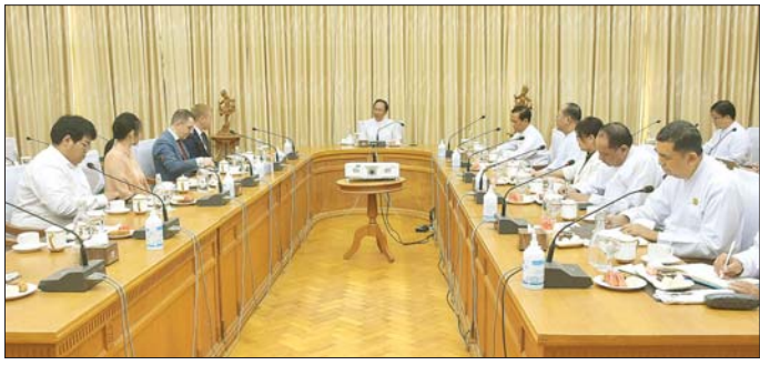
တာဝန်ရှိသူများတက်ရောက် ဆွေးနွေးပွဲသို့ ကျန်းမာရေးဝန်ကြီးဌာန ဒုတိယ ဝန်ကြီးနှင့် ညွှန်ကြားရေးမှူးချုပ်များ မြန်မာနိုင်ငံ ဆိုင်ရာ ရုရှားကုန်သွယ်မှု ကိုယ်စားလှယ်အဖွဲ့ ကိုယ်စားလှယ်များနှင့် တာဝန်ရှိသူများ တက်ရောက် သတင်းစဉ်

လုပ်ငန်းများ ပူးပေါင်းဆောင်ရွက်ရေး နားလည်မှု စာချုပ် (MoU) လက်မှတ်ရေးထိုးခဲ့ပြီး ဆက်လက် ပူးပေါင်းဆောင်ရွက်မည့် ကိစ္စရပ်များ၊ ရုရှားနိုင်ငံ ဆေးနှင့် ဆေးပစ္စည်းကုမ္ပဏီများမှ စက်မှုဝန်ကြီးဌာန BPI ဆေးဝါးစက်ရုံနှင့်ပူးပေါင်း၍ ပြည်တွင်း၌ ဆေးနှင့် ဆေးပစ္စည်းများ ထုတ်လုပ်ရေးကိစ္စ၊ ရုရှား နိုင်ငံမှထုတ်လုပ်သည့် ရောဂါရှာဖွေရေးဆာတ်ခွဲ စမ်းသပ်မှုပစ္စည်းများ (Rapid Diagnostic Test kit) ဈေးနှုန်းချိုသာစွာဖြင့် ပြည်တွင်း၌ ဝယ်ယူရရှိ နိုင်ရေးကိစ္စ၊ ရုရှားနိုင်ငံမှ ထုတ်လုပ်သည့် ဆေးနှင့် ဆေးပစ္စည်းများကို မြန်မာနိုင်ငံ FDA အသိအမှတ်ပြု မှတ်ပုံတင်ရရှိရေးကိစ္စနှင့် နှစ်နိုင်ငံ ဆေးကုသမှု လုပ်ငန်းများ ဆက်လက် ပူးပေါင်းဆောင်ရွက် ရေး ကိစ္စရပ်များကို အမြင်ချင်းဖလှယ် ဆွေးနွေး ကြသည်။