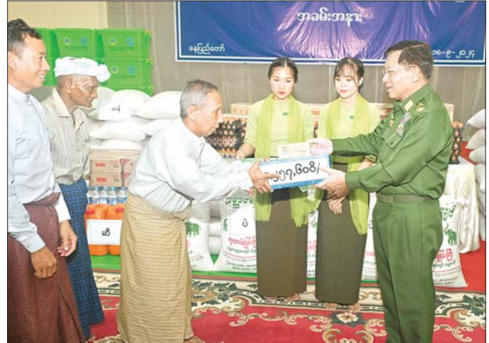
နိုင်ငံတော်စီမံအုပ်ချုပ်ရေးကောင်စီဥက္ကဋ္ဌ တပ်မတော်ကာကွယ်ရေးဦးစီးချုပ် ဗိုလ်ချုပ်မှူးကြီး မင်းအောင်လှိုင် ရေဘေးသင့်ပြည်သူများအတွက် ထောက်ပံ့ရေးနှင့် စားသောက်ဖွယ်ရာပစ္စည်းများ ပေးအပ်စဉ်။

အရင်းလိုက်ဖြင့် စီးဆင်းခဲ့မှုကြောင့် ထိခိုက်ပျက်စီး ဆုံးရှုံးမှုများစွာ ဖြစ်ပေါ်ခဲ့ကြောင်း။ မိမိအနေဖြင့် သဘာဝဘေးအန္တရာယ်ကျရောက် မှုကြောင့် အသက်အိုးအိမ်စည်းစိမ်များ ပျက်စီးဆုံးရှုံး ခဲ့ရမှုအပေါ် များစွာစိတ်မကောင်းဖြစ်ရပါကြောင်း။ သဘာဝဘေးအန္တရာယ်ဆိုသည်မှာ ရှောင်ရှား၍ မရသော်လည်း ကြိုတင်ကာကွယ်မှုကိစ္စရပ်များကို လုပ်ဆောင်နိုင်သကဲ့သို့ သဘာဝဘေးအန္တရာယ် ကျရောက်ပြီးပါက ကယ်ဆယ်ရေးလုပ်ငန်းများဖြင့် မူလအခြေအနေများ ပြန်ရောက်စေရန်နှင့် ပိုမို ကောင်းမွန်စေရန် မိမိတို့အားလုံး၏ လုံ့လ၊ စိရိယ များဖြင့် ကြိုးပမ်းဆောင်ရွက်သွားကြရမည်ဖြစ်ကြောင်း၊ စိတ်ဓာတ်ကျနေ၍မရဘဲ မူလအခြေအနေပြန်လည် ရရှိအောင် ကြိုးပမ်းဆောင်ရွက်သွားရမည်ဖြစ် ကြောင်း၊ ပျက်စီးဆုံးရှုံးခဲ့သည့်နေရာများကို ပြန်လည် ထူထောင်ရေးလုပ်ငန်းများအတွက် နိုင်ငံတော်မှ ဦးဆောင်၍ ဆောင်ရွက်ပေးသွားမည်ဖြစ်ကြောင်း၊ ပျက်စီးဆုံးရှုံးခဲ့သည့် ရပ်ကွက်၊ ကျေးရွာများသို့ သွားရောက်နိုင်ရေး လမ်းပန်းဆက်သွယ်ရေးများ ကောင်းမွန်စေရန်အတွက် တာဝန်ရှိသူများက ဆောင်ရွက်ပေးလျက်ရှိကြောင်း၊ အချိန်ကာလအား ဖြင့် အများဆုံး ခြောက်လတာကာလအတွင်း မူလ အခြေအနေ ပြန်လည်ရောက်ရှိအောင် ဆောင်ရွက်နိုင် ရန် ပြောကြားထားပြီးဖြစ်ကြောင်း။