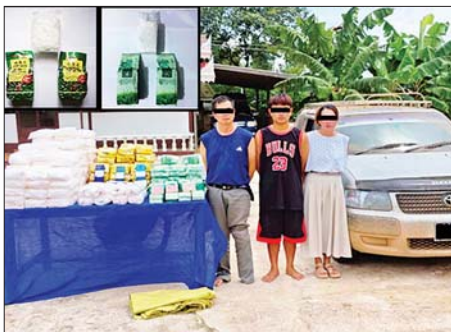
မြစ်မှုကျူးလွန်သူများနှင့် သိမ်းဆည်းရမိသည့် သက်သေခံပစ္စည်းများနှင့်အတူ တွေ့ရစဉ်။

သိမ်းဆည်းရမိခဲ့ကြောင်း၊ စစ်ဆေးဖော်ထုတ်ချက်များအရ သိမ်းဆည်းရမိ စိတ်ပြောင်းဆေးဝါးများကို ကျိုင်းတုံမြို့နယ်မှ မိုင်းဖြတ်မြို့နယ်သို့ သယ်ဆောင်ရေးဝယ်ခြင်းဖြစ်ကြောင်း သိရှိရသဖြင့် ယင်းတို့အား ဥပဒေအရ အရေးယူထားရှိပြီး ကွင်းဆက်ဖြစ်မှု ကျူးလွန်သူများအား စစ်ဆေးဖော်ထုတ်လျက်ရှိကြောင်း သတင်းရရှိသည်။ သတင်းစဉ်