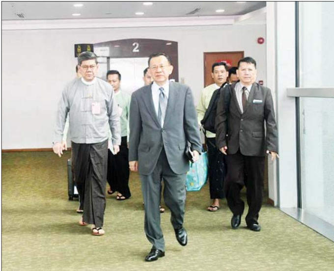
လေဆိပ်၌ ပို့ဆောင်မှုတံဆိပ်ဆက်ကြမ်းဆောင်သော မြန်မာကိုယ်စားလှယ်အဖွဲ့တွင် နိုင်ငံခြားစီးပွားရေးမှူးချုပ်နှင့် အဆင့်မြင့်အရာရှိများ အဖွဲ့ဝင်အဖြစ် လိုက်ပါသွားကြကြောင်း သိရသည်။ သတင်းစဉ်

နေပြည်တော် စက်တင်ဘာ ၁၅ ရင်းနှီးမြုပ်နှံမှုနှင့် နိုင်ငံခြားစီးပွား ဆက်သွယ်ရေး ဝန်ကြီးဌာန ပြည်ထောင်စုဝန်ကြီး ဒေါက်တာကံဇော် ဦးဆောင်သော မြန်မာကိုယ်စားလှယ် အဖွဲ့သည် လာအိုနိုင်ငံ ဗီယင်ကျွန်းမြို့၌ စက်တင်ဘာ ၁၅ ရက်မှ ၂၃ ရက် အထိ ကျင်းပမည့် (၅၆) ကြိမ်မြောက် အာဆီယံစီးပွားရေး ဝန်ကြီးများ အစည်းအဝေးနှင့် ဆက်စပ် အစည်းအဝေးများသို့ တက်ရောက်ရန် ယနေ့ နံနက်ပိုင်းတွင် လေကြောင်းခရီးဖြင့် ရန်ကုန် မြို့မှ လာအိုနိုင်ငံသို့ ထွက်ခွာ သွားသည်။