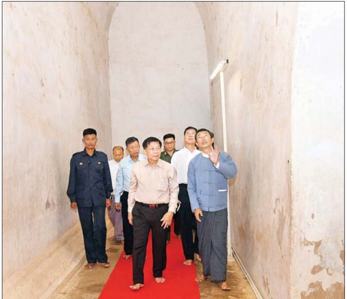
နိုင်ငံတော်စီမံအုပ်ချုပ်ရေးကောင်စီဥက္ကဋ္ဌ နိုင်ငံတော်ဝန်ကြီးချုပ် ဗိုလ်ချုပ်မှူးကြီး မင်းအောင်လှိုင် သဗ္ဗညုဘုရားကြီး လိုဏ်ပတ်လမ်းအတွင်း လှည့်လည်ကြည့်ရှုစဉ်။

ထို့နောက် နိုင်ငံတော်စီမံအုပ်ချုပ်ရေးကောင်စီ ဥက္ကဋ္ဌ နိုင်ငံတော်ဝန်ကြီးချုပ်နှင့် အဖွဲ့ဝင်များသည် ပုဂံမြို့သစ်ရှိ ကမ္ဘာ့အမွေအနှစ်စာရင်းဝင် ၁၀၄၂ ဆင်ကအုတ်တိုက်နေရာသို့ ရောက်ရှိကြပြီး မိုးသည်း ထန်စွာရွာသွန်းစဉ် နံရံနှစ်ဖက်နှင့် ပေါင်းကူးအမိုးတို့ ပြိုကျပျက်စီးခဲ့မှုအခြေအနေများကို ကြည့်ရှုစစ်ဆေး ရာ တာဝန်ရှိသူများက ရှင်းလင်းတင်ပြကြသည်။ ရှင်းလင်းတင်ပြမှုများအပေါ် နိုင်ငံတော်စီမံ