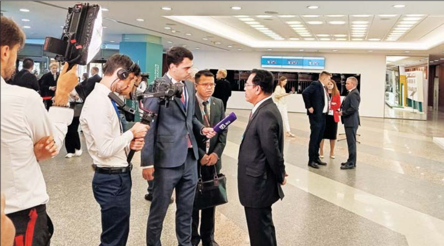
ပြည်ထောင်စုဝန်ကြီး ဦးမောင်မောင်အုန်း TASS သတင်းစာမှ သတင်းထောက်၏ မေးမြန်းမှုများကို ဖြေကြားစဉ်။

ပြန်ချိရေးအတွက် ကြိုးပမ်းနေကြရခြင်း ဖြစ်ပါကြောင်း။ BRICS Media Summit ကို ကျင်းပလာခဲ့သည်မှာ ယခုနှစ် ဆိုလျှင် (၇)ကြိမ်မြောက်ရှိပြီဖြစ်ပါကြောင်း၊ ယနေ့တွင် မိမိတို့ ကမ္ဘာကြီးပြောင်းလဲလာပြီး ဝင်ရိုးတန်း တစ်ခုတည်း ချုပ်ကိုင်သော ကမ္ဘာကြီး မဟုတ်တော့ဘဲ Multipolar ခေါ် ဝင်ရိုးစုံ ဖြစ်လာစေမည့် အပြုသဘောသည့် ကမ္ဘာကြီးဖြစ်နေပြီဖြစ်ပါကြောင်း၊ ယနေ့ကမ္ဘာကြီးတွင် အုပ်စုတစ်စု၊ နိုင်ငံတစ်နိုင်ငံတည်းက ကမ္ဘာ့ရေးရာတွေကို ပုံဖော်နေသည့်အဖြစ်မှ အုပ်စုများစွာ၊ နိုင်ငံများစွာက ပြောဆိုဆွေးနွေးခွင့်၊ ညှိနှိုင်းပုံဖော်ခွင့်များ ရရှိလာနေပြီဖြစ်ပါကြောင်း၊ ကမ္ဘာ့နိုင်ငံအချင်းချင်းဆက်သွယ်မှုတွင် နောက်ဆုံးပေါ် နည်းပညာများကြောင့် ပေါ်ထွန်းလာသည့် New Media သည် နယ်နိမိတ်ဆိုင်ရာ အဟန့်အတားများကို ကျော်ဖြတ်ကာ စက္ကန့်ပိုင်းအတွင်း သတင်းစကားများကို ဖြန့်ဝေပေးနိုင်ပါကြောင်း။ ထို့ကြောင့် ကမ္ဘာ့နိုင်ငံများအကြား ချစ်ကြည်ရင်းနှီးမှုကို ဖော်ဆောင်နိုင်မည့် သတင်းစကားများ၊ နားလည်သဘောပေါက်မှုကို ဖန်တီးပေးမည့် အပြုသဘောဆောင်သော သတင်းပေးပို့ချက်များ ဖလှယ်နိုင်ရန် ကြိုးစားကြရမည်ဖြစ်ပါကြောင်း၊ ကမ္ဘာတစ်လွှားဖြစ်ပေါ်နေသည့် ရာသီဥတုပြောင်းလဲမှု၊ လေထုညစ်ညမ်းမှု၊ သစ်တောပြုန်းတီးမှု စသည့် သမားရိုးကျမဟုတ်သော စိန်ခေါ်မှုများကို ဖြေရှင်းရာတွင် နိုင်ငံအချင်းချင်း ပူးပေါင်းဆောင်ရွက်မှုမှာ စာမျက်နှာ ၉ သို့