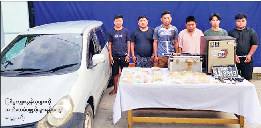
ဖြစ်မှုကျူးလွန်သူများကို သက်သေခံပစ္စည်းများနှင့်အတူ တွေ့ရစဉ်။