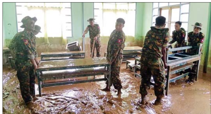
ရေကြီးရေလျှံမှုဖြစ်ပွားသည့် ရပ်ကွက်/ကျေးရွာများမှ ကူညီရွှေ့ပြောင်းရန် လိုအပ်နေသူများကို ရွှေ့ပြောင်းပေးစဉ် (ဝဲဘက်) နှင့် ရေပြန်လည်ကျဆင်းသွားသည့်နေရာများ၌ စုပေါင်းသန့်ရှင်းရေးဆောင်ရွက်စဉ်။