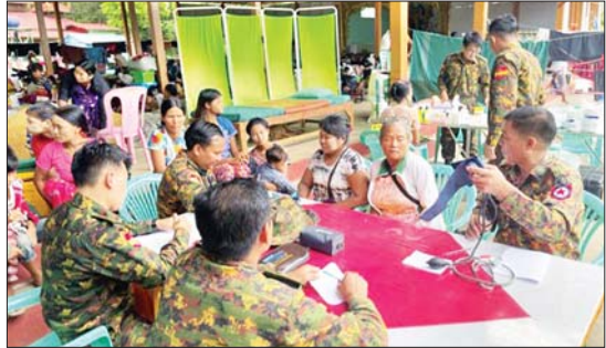
ရေဘေးရောင်ယာယီစခန်းများ၌ နယ်မြေခံတပ်မတော်ဆေးရုံမှ ဖွင့်လှစ်ပေးထားသော ဆေးခန်းများတွင် ရေဘေးသင့်ပြည်သူများအား ကျန်းမာရေးစစ်ဆေးပေးစဉ်။

ရာများပေးအပ်၍ ရင်းရင်းနှီးနှီး အားပေးစကားပြောကြားကာ လိုအပ်သည့် များ ပေါင်းစပ်ညှိနှိုင်း ဆောင်ရွက်ပေးခဲ့ကြသည်။ နေပြည်တော် ကောင်စီနယ်မြေအပါအဝင် ကရင်ပြည်နယ်၊ ပဲခူးတိုင်းဒေသကြီး၊ မန္တလေးတိုင်းဒေသကြီး၊ မွန်ပြည်နယ်၊ ရှမ်းပြည်နယ်(တောင်ပိုင်း) နှင့် (အရှေ့ပိုင်း) နှင့် ဧရာဝတီတိုင်းဒေသကြီးမှ ရပ်ကွက်၊ ကျေးရွာ ၅၃၁ ရွာတို့တွင် ရေကြီးရေလျှံမှု ဖြစ်ပေါ်ခဲ့ပြီး စက်တင်ဘာ ၁၀ ရက်မှ ၁၄ ရက် ညပိုင်းအထိရှိသောစာရင်းများအရ ပြည်သူ ၁၁၃ ဦး သေဆုံးခဲ့ပြီး ၁၂၀ ပျောက်ဆုံးလျက်ရှိကြောင်းနှင့် တာဝန်ရှိသူများက ကယ်ဆယ်ရေးလုပ်ငန်းများကို အင်တိုက်အားတိုက် တိုးမြှင့်ဆောင်ရွက်လျက်ရှိကြောင်းသိရှိရသည်။ ထို့ပြင် အထက်ပါ ရပ်ကွက်၊ ကျေးရွာများအတွင်း ရေကြီးရေလျှံမှုကြောင့် တံတား ၂၅ စင်း၊ စာသင်ကျောင်း ၃၇၅ ကျောင်း၊ ဘုန်းကြီးကျောင်းတစ်ကျောင်း၊ ဆည်/တစ် ငါးခု၊ ဘုရားစေတီလေးဆူနှင့် လူနေအိမ် ၇၉၇၄၄ လုံး ရောင်နှစ်မြုပ်ခြင်း၊ ထိခိုက်ပျက်စီးခြင်းများဖြစ်ပေါ်ခဲ့ပြီး မော်တော်ကားလမ်း၊ မီးရထားလမ်းနှင့် လျှပ်စစ်မီးတိုင်အချို့ ရေတိုက်စားမှုများကြောင့် ထိခိုက်ပျက်စီးမှုများ ဖြစ်ပေါ်ခဲ့ကြောင်း သိရှိရသည်။ သတင်းစဉ်