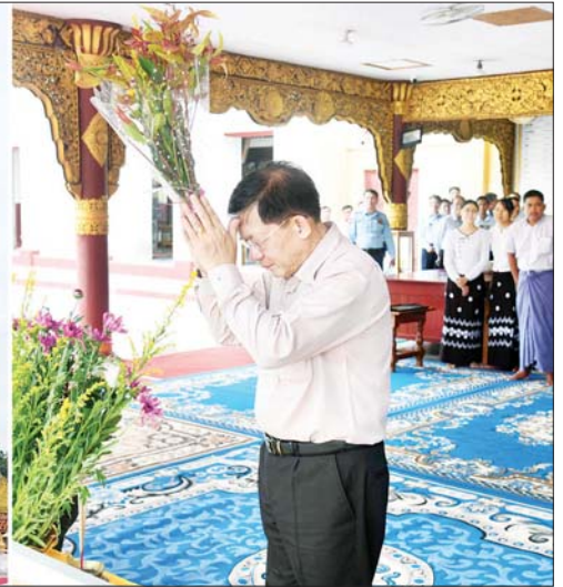
နိုင်ငံတော်စီမံအုပ်ချုပ်ရေးကောင်စီဥက္ကဋ္ဌ နိုင်ငံတော်ဝန်ကြီးချုပ် ဗိုလ်ချုပ်မှူးကြီး မင်းအောင်လှိုင် ရွှေစည်းခုံစေတီတော်မြတ်ကြီးအား ဖူးမြော်ကြည့်ည့်စဉ်။