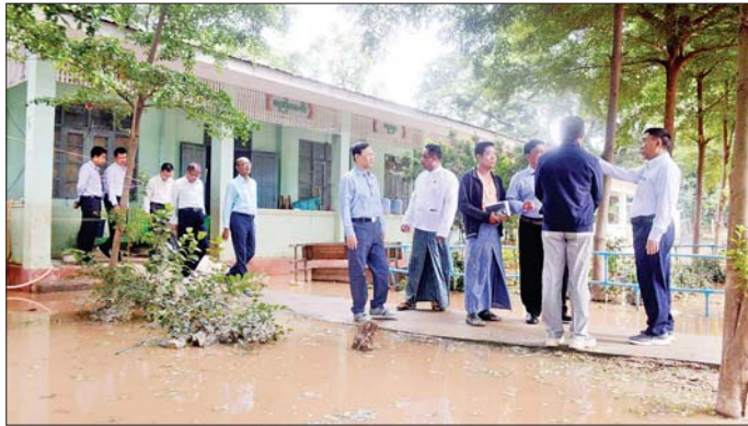
ပေါင်းစပ်ညှိနှိုင်း၍ ဖြည့်ဆည်းဆောင်ရွက်ပေးသည်။ ဆက်လက်၍ ပြည်ထောင်စုဝန်ကြီးသည် ဇေယျာသီရိမြို့နယ် အခြေခံပညာအထက်တန်း ကျောင်း(ကျောက်ချက်)၊ အခြေခံပညာမူလတန်းလွန် ကျောင်း (အိုင်စောက်)နှင့် လယ်ဝေးမြို့နယ် ပေါက်မြိုင်ရွာ အခြေခံပညာအလယ်တန်းကျောင်း

နေပြည်တော် စက်တင်ဘာ ၁၅ ပညာရေးဝန်ကြီးဌာန ပြည်ထောင်စုဝန်ကြီး ဒေါက်တာညွန့်ဖေသည် ဒုတိယဝန်ကြီး ဒေါက်တာ ဇော်မြင့်နှင့် ဒေါက်တာမိုးဇော်ထွန်း၊ တာဝန်ရှိသူများ နှင့်အတူ ယနေ့နံနက်ပိုင်းတွင် ရာဂီမုန်တိုင်းအရှိန် ကြောင့် မိုးကြီးကာ ရေနှစ်မြုပ်မှုများ ဖြစ်ပေါ်ခဲ့သည့် ပုဗ္ဗသီရိ၊ ဇေယျာသီရိနှင့် လယ်ဝေးမြို့နယ်တို့ရှိ အခြေခံပညာကျောင်းများသို့ သွားရောက်ကြည့်ရှု စစ်ဆေးသည်။ (ယာပုံ)