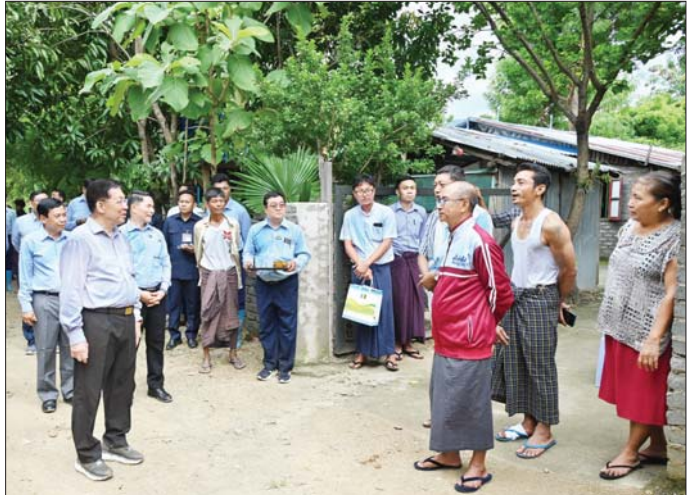
နိုင်ငံတော်စီမံအုပ်ချုပ်ရေးကောင်စီဥက္ကဋ္ဌ နိုင်ငံတော်ဝန်ကြီးချုပ် ဗိုလ်ချုပ်မှူးကြီး မင်းအောင်လှိုင် ၃ မိုင်ကျေးရွာရှိ ဒေသခံပြည်သူများအား ရင်းရင်းနှီးနှီးနုတ်ဆက်ကာ ရေကြီးရေလျှံမှုဖြစ်ပေါ်ခဲ့မှု အခြေအနေများကို မေးမြန်းအေးပေးစကားပြောကြားစဉ်။

ဒေသခံပြည်သူများအား ရင်းရင်းနှီးနှီးနုတ်ဆက်ကာ ရေကြီးရေလျှံမှုဖြစ်ပေါ်ခဲ့မှု အခြေအနေများကို မေးမြန်းအေးပေးစကားပြောကြားသည်။ ယင်းနောက် နိုင်ငံတော်စီမံအုပ်ချုပ်ရေးကောင်စီဥက္ကဋ္ဌ နိုင်ငံတော်ဝန်ကြီးချုပ်သည် ကင်းသာလမ်းခွဲနေရာ၌ ရေတိုက်စားမှုကြောင့် လမ်းကြောင်းပျက်စီးနေမှုအခြေအနေများကို ကြည့်ရှုစစ်ဆေးကာ အပျက်အစီးများဖယ်ရှားရှင်းလင်းခြင်းနှင့် ပြန်လည်ပြုပြင်ခြင်းလုပ်ငန်းများကို အမြန်ဆုံးဆောင်ရွက်သွားရန် လိုအပ်သည်များ လမ်းညွှန်မှာကြားသည်။ သိုက်ချောင်းတံတား (ဆင်သေချောင်းကူး)အား