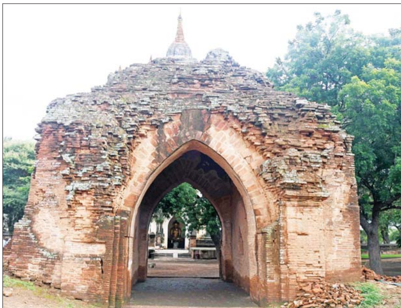
နိုင်ငံတော်စီမံအုပ်ချုပ်ရေးကောင်စီဥက္ကဋ္ဌ နိုင်ငံတော်ဝန်ကြီးချုပ် ဗိုလ်ချုပ်မှူးကြီး မင်းအောင်လှိုင် ယခုရက်ပိုင်းအတွင်း မိုးသည်းထန်စွာရွာသွန်းခဲ့စဉ် အနည်းငယ်ပြိုကျပျက်စီးခဲ့သည့် သဗ္ဗညုဘုရားကြီး မြောက်ဘက် အဝင်မုခ်ဦးနေရာအား ကြည့်ရှုစစ်ဆေးစဉ်။