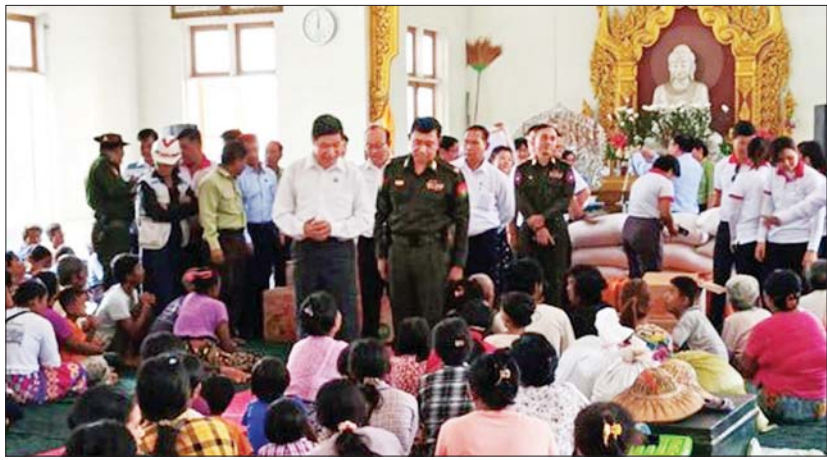
မန္တလေးတိုင်းဒေသကြီး ဝန်ကြီးချုပ်နှင့် တာဝန်ရှိသူများက ရေဘေးသင့်ပြည်သူများအား ရင်းရင်းနှီးနှီးအားပေးစကားပြောကြားစဉ်။

ရွှေ့ပြောင်းပေးခြင်းလုပ်ငန်းများ ဆောင်ရွက်ပေးခြင်းနှင့် ရေများ ပြန်လည်ကျဆင်းသွားသည့် နေရာများရှိ လမ်း၊ တံတားများ၊ ရပ်ကွက်၊ ကျေးရွာများအတွင်း၌တင်ကျန်ခဲ့သည့် နွန်းများ၊ သစ်ပင်သစ်ကိုင်းများ ဖယ်ရှားပေးခြင်းအပါအဝင် သန့်ရှင်းရေးလုပ်ငန်းများကို ဒေသခံပြည်သူများနှင့်ပူးပေါင်း၍ တက်ကြွစွာ ဆောင်ရွက်ပေးလျက်ရှိသည်။ ထို့ပြင် နေပြည်တော်ကောင်စီနယ်မြေ ဝေယျာသီရိမြို့နယ် ကျည်တောင်ကျေးရွာရှိ ကိုးခန်းကြီးမော့ရုံနှင့် လှေခင်းတောင် ပရဝဏ်အတွင်း သာသနိကအဆောက်အအုံများ၌ ဖွင့်လှစ်ထားရှိသော ရေဘေးရောင် ယာယီကယ်ဆယ်ရေးစခန်းရှိ ရေဘေးသင့်ပြည်သူများအတွက် ယနေ့တိုင် ကာကွယ်ရေးဦးစီးချုပ်ရုံး (ကြည်း)မှ ဒုတိယဗိုလ်ချုပ်ကြီးဖုန်းမြတ်၊ နေပြည်တော်တိုင်းစစ်ဌာနချုပ် တိုင်းမှူးဗိုလ်ချုပ်စိုးမင်းနှင့် တာဝန်ရှိသူများက သွားရောက်တွေ့ဆုံ အားပေးစကားပြောကြားပြီး ရေဘေးသင့်ပြည်သူများ စားသောက်ရေးအခင်ပြေစေရန်အတွက် ဆန်၊ ဆီ၊ ဆား၊ ကုလားပဲ၊ ငါးပိများနှင့် ထမင်းထုပ်များ ပေးအပ်လျှင်အားပေးသည့် ရေဘေးရောင် ယာယီစခန်းများ၌ နယ်မြေခံတပ်မတော်ဆေးရုံမှ ဖွင့်လှစ်ပေးထားသော ဆေးခန်းများတွင် ကျန်းမာရေး စစ်ဆေးပေးနေမှုများကို လှည့်လည်ကြည့်ရှုအားပေးသည်။ ရေကြီးမှုကြောင့် ပျက်စီးမှုများဖြစ်ပေါ်ခဲ့သည့် လမ်း/ တံတားများကိုလည်း လမ်းပန်းဆက်သွယ်ရေး အမြန်