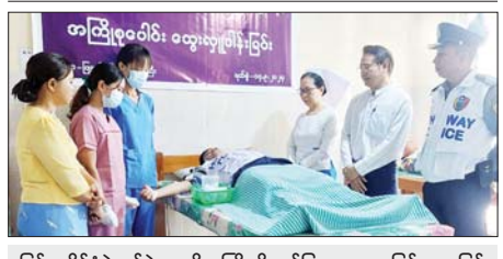
မြန်မာနိုင်ငံရဲတပ်ဖွဲ့ နေ့ကို ကြိုဆိုဂုဏ်ပြုသောအားဖြင့် အမြန် လမ်းမကြီး ရဲစခန်းမှ စခန်းမှူးနှင့် ရဲတပ်ဖွဲ့ ဝင်များ ယမန်နေ့က မြူးပြည်သူ့ဆေးရုံ သွေးလျာတက်၌ ပြည်သူ့အကျိုးပြု စုပေါင်း သွေးလှူဒါန်းခဲ့ပြီး သွေးလှူဒါန်းသူများအား ကြက်ဥ၊ အာဟာရ ဖြည့်စွဲစာများ၊ အားဆေးများ ပြန်လည်ပေးစဉ်။