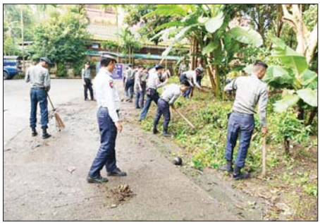
အောက်တိုဘာလ ၁ ရက်တွင် ကျရောက်မည့် နှစ် (၆၀) ပြည့်မြန်မာနိုင်ငံရဲ့တစ်ပွဲနေ့ကို ကြိုဆိုရုံအပြင် ပြည်ထောင်စုဝန်ကြီးဌာနမှ ရှေးဦးစေတီ၊ အမှတ် (၄၄) ယာဉ်ထိန်း တပ်ဖွဲ့ စုပေးမှု၊ စည်းစိမ်တိုးနှင့် တပ်ဖွဲ့ဝင်များ ရွှေတိဂုံဘုရားလမ်းရှိ အမှတ်(၁) အခြေခံပညာအထက်တန်းကျောင်းတွင် စက်တင်ဘာ ၁၅ ရက်က စုပေါင်းသန့်ရှင်းရေး ဆောင်ရွက်စဉ်။ ဥဗ္ဗာကျော်(ပြန်/ဆက်)

အဆိုပါ ကုန်ထုတ်လမ်း ဆောင်ရွက်ပြီးပါက အိမ်ခြေ ၂၃၇ အိမ်၊ လူဦးရေ ၁၇၈ ဦးတို့အား အကျိုးပြုမည့်အပြင် စိုက်ပျိုးဧက ၅၀၀ ခန့်ရှိ ထုတ်ကုန်များကို ဈေးကွက်သို့လွယ်ကူစွာ သယ်ယူပို့ဆောင်သွားနိုင်မည်ဖြစ်ကြောင်း သိရသည်။