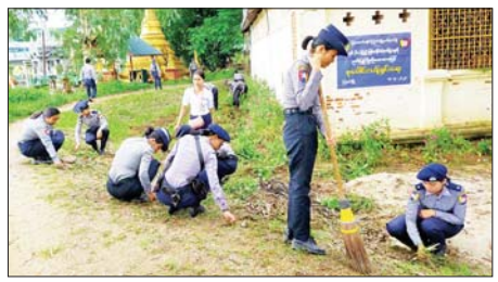
မြန်မာနိုင်ငံရဲတပ်ဖွဲ့ နေ့ကို ကြိုဆိုဂုဏ်ပြုသောအားဖြင့် ဧရာဝတီ တိုင်းဒေသကြီး ကြိုခင်းမြို့နယ် ရဲတပ်ဖွဲ့ (ကြီးကြပ်ကွပ်ကဲမှု) အောက်ရှိ ရဲစခန်း၊ ရဲကင်းဗိသားစုဝင်များ၊ မြို့နယ်ရဲတပ်ဖွဲ့ ဝင်များ စုပေါင်း၍ စက်တင်ဘာ ၁၄ ရက်က ဆရာဒကာကျောင်းတွင် လှူဖွယ်ဝတ္ထုများလှူဒါန်းခြင်းနှင့် ရွှေသာလျောင်းဘုရားဝင်းအတွင်း ရဲတပ်ဖွဲ့ ဝင်များ၊ ရဲဗိသားစုဝင်များ စုပေါင်းသန့်ရှင်းရေး ဆောင်ရွက်ကြစဉ်။

ဆက်သွယ်ဆောင်ရွက်ရေးဥပဒေပုဒ်မ ၃၃ (က)နှင့် တည်ဆဲဥပဒေ များအရ အရေးယူခံရမည့်အပြင် ဖြစ်မှုနှင့် သက်ဆိုင်သည့် ရွှေ့ပြောင်း နိုင်ငံသောပစ္စည်း၊ မရွှေ့ပြောင်းနိုင်သောပစ္စည်းများကို အကြမ်းဖက်မှု တိုက်ဖျက်ရေးဥပဒေအရ သိမ်းဆည်းခံရနိုင်ပြီး ဖြစ်မှုထင်ရှားစီရင်ခြင်း ခံရပါက နိုင်ငံတော်ဘဏ္ဍာအဖြစ် သိမ်းဆည်းခံရနိုင်ကြောင်း ၂၀၂၂ ခုနှစ်၊ ဇန်နဝါရီ ၂၅ ရက်တွင် နိုင်ငံပိုင်ဗီဒီယာများမှတစ်ဆင့် အသိပေး သတင်းထုတ်ပြန်ခဲ့ပြီး ဖြစ်သည်။