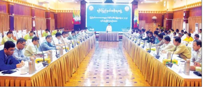
ပြည်နယ်ဝန်ကြီးချုပ် ဦးထိန်လင်း လုပ်ငန်းညှိနှိုင်းအစည်းအဝေးတွင် အမှာစကားပြောကြားစဉ်။

ထို့နောက် ပြည်နယ်အစိုးရအဖွဲ့ဝင်များ၊ ဌာနဆိုင်ရာများက သဘာဝဘေးအန္တရာယ် ဖြစ်ပေါ်နိုင်သည့် အခြေအနေများနှင့် ပတ်သက်၍ နေ့စဉ်သတင်းများ တင်ပြနေမှုကြိုတင်ကာကွယ်ရေး၊ ကူညီကယ်ဆယ်ရေးများ ဆောင်ရွက်နိုင်မည့် အခြေအနေများ၊ ပြည်သူများအား အသိပညာပေးဆောင်ရွက်နိုင်မည့် အခြေအနေများ၊ သဘာဝဘေးအန္တရာယ် ကျရောက်ပါက ကူညီဆောင်ရွက်နိုင်ရေး စီစဉ်ဆောင်ရွက်ထားရှိမှုနှင့် ဆက်လက်ဆောင်ရွက်မည့် အစီအမံများကို အကြံပြုဆွေးနွေးတင်ပြရာ ပြည်နယ်ဝန်ကြီးချုပ်က လိုအပ်သည်များ ဖြည့်စွက်မှာကြားခဲ့ကြောင်း သိရသည်။