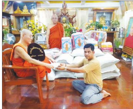
ကျိုင်းတုံမြို့နယ်၌ ရေဘေးကြောင့်ပျက်စီးသွားသည့် တံတားပြန်လည်ပြုပြင်၊ ရေဘေးသင့်ပြည်သူများအား ထောက်ပံ့ဆောင်ရွက်ပေးခြင်းဖြစ်ကြောင်း ပြသထားသည်။

ဆောင်ရွက်ပေးသည်။ ထို့နောက် ပြည်နယ်အစိုးရအဖွဲ့ချုပ်ရေးအဖွဲ့ခွဲ(ရှမ်းအရှေ့)ဥက္ကဋ္ဌနှင့်တာဝန်ရှိသူများသည် မိုးရွာသွန်းမှုကြောင့် ရေငတ်ရောက်မှုများဖြစ်ပွားခဲ့သည့် ကျိုင်းတုံမြို့နယ် နောင်ကုန်ရွာအဝင်လမ်း၊ မြို့တော်ခန်းမ၊ ဌာနဆိုင်ရာရုံးများ၊ မြို့ပေါ်ရပ်ကွက်များနှင့် ယာယီခိုလှုံရေးစခန်းရှိ ရေဘေးသင့်ပြည်သူများအား သွားရောက်ကြည့်ရှု၍ ထောက်ပံ့ပေးပေးအပ်သည်။ ထို့အပြင် ကျိုင်းတုံခရိုင် ဘေးအန္တရာယ်ဆိုင်ရာစီမံခန့်ခွဲမှုဦးစီးဌာနမှ ကျိုင်းတုံမြို့နယ်အတွင်း မိုးရွာသွန်းမှုကြောင့် ရေဘေးသင့်ခဲ့သည့် ပြည်သူ ၅၁၇ ဦးအတွက် ဆန်ရိက္ခာများ ထောက်ပံ့ပေးပြီး ရေဘေးသင့်ပြုကျပျက်စီးခဲ့သည့် နေအိမ်လေးလုံးအတွက် အိမ်ဆောက်ပစ္စည်းနှင့် ဆန်ရိက္ခာများ ထောက်ပံ့ပေးခဲ့သည်။