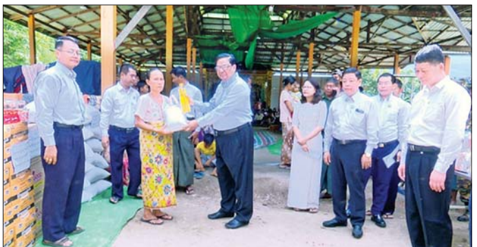
(နစ်ရာတစ်ဆယ့်သုံးသိန်းငါးသောင်း) တန်းဖိုးရှိ များအား အလှူရှင်များနှင့် ပရဟိတအသင်း၊ အဖွဲ့အဝတ်အထည်၊ စောင်၊ ဆန်၊ ဆီ၊ ဆေးဝါး၊ ဓာတ်ဆား၊ ထုပ်များ၊ အစားအသောက်များ၊ အသုံးအဆောင်ပစ္စည်းများကို ရေဘေးသင့်ပြည်သူများနှင့် တာဝန်ရှိသူများထံ ပေးအပ်လှူဒါန်းပြီး ရေဘေးသင့်ပြည်သူများအား အလှူရှင်များနှင့် ပရဟိတအသင်း၊ အဖွဲ့များ၏ ကူညီစောင့်ရှောက်ရေးလုပ်ငန်းများ ဆောင်ရွက်ပေးနေမှုကို ကြည့်ရှုအားပေးခဲ့ကြောင်း သတင်းရရှိသည်။ သတင်းစဉ်

ထို့နောက် ပြည်ထောင်စုဝန်ကြီးနှင့် အဖွဲ့သည် ရေဘေးသင့်ပြည်သူများ၏ အုပ်ချုပ်ဆိုင်ရာကိစ္စရပ်များကို ဆောင်ရွက်ပေးနေသည့် တာဝန်ရှိသူများနှင့် တွေ့ဆုံ၍ ရေဘေးသင့်ခဲ့သည့် ပြည်သူများ၏ ကျန်းမာရေးစောင့်ရှောက်မှုလုပ်ငန်းများကို ပိုမိုဆောင်ရွက်ပေးရေး၊ သောက်သုံးရေများ အပြည့်အဝရရှိရေး၊ ဝမ်းပျက်ဝမ်းလျှောနှင့် ကူးစက်ရောဂါများ မဖြစ်ပွားစေရေး၊ ပြန်လည်ထူထောင်ရေးကိစ္စရပ်များကို ဆွေးနွေးပြီး လိုအပ်ချက်များကိုလည်း ဆက်လက်ကူညီဆောင်ရွက်ပေးသွားမည်ဖြစ်ကြောင်း ပြောကြားသည်။ ဆက်လက်၍ ပြည်ထောင်စုဝန်ကြီးနှင့်အဖွဲ့သည် ရေဘေးသင့်ခဲ့သည့် ပြည်သူများအား စက်မှုဝန်ကြီးဌာန ဝန်ထမ်းမိသားစုများက ငွေကျပ် ၂၁၄၅၀၀၀၀