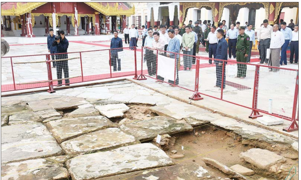
နိုင်ငံတော်စီမံအုပ်ချုပ်ရေးကောင်စီဥက္ကဋ္ဌ နိုင်ငံတော်ဝန်ကြီးချုပ် ဗိုလ်ချုပ်မှူးကြီး မင်းအောင်လှိုင် ရွှေစည်းခုံစေတီတော်မြတ်ကြီး ရင်ပြင်တော်ရှိ မူလသင်္ကျောက်ပြားများအား သုတေသနပြုဖော်ထုတ်ထားရှိမှုကို ကြည့်ရှုစစ်ဆေးစဉ်။

ဦးစွာ နိုင်ငံတော်စီမံအုပ်ချုပ်ရေးကောင်စီဥက္ကဋ္ဌ နိုင်ငံတော်ဝန်ကြီးချုပ်နှင့် အဖွဲ့ဝင်များသည် အနော်ရထာမင်းကြီးနှင့် ကျန်စစ်မင်းကြီးတို့ တည်ထားခဲ့သည့် ရွှေစည်းခုံစေတီတော်မြတ်ကြီးသို့ ရောက်ရှိကြပြီး ကြေးကုတိုက်များ ထိန်းသိမ်းထားရှိမှု၊ ရင်ပြင်တော်ရှိ မူလသင်္ကျောက်ပြားများအား သုတေသနပြုဖော်ထုတ်ထားရှိမှု၊ ယခုရက်ပိုင်းအတွင်း မိုးသည်းထန်စွာရွာသွန်းမှုကြောင့် တောင်ဘက်စောင်းတန်းရှိ ရှေးဟောင်းလက်ရာ အုတ်တံတိုင်းများ ရေစိမ့်ဝင်ပြိုကျပျက်စီးနေမှု၊ စောင်းတန်းများ ပြုပြင်ထိန်းသိမ်းလျက်ရှိမှု၊ ရှေးဟောင်းလက်ရာ သာသနာရေးဆိုင်ရာ အဆောက်အဦများ ထိန်းသိမ်းထားရှိမှု၊ ရင်ပြင်တော်၌ စကျင်ကျောက်ပြား ပတ်လမ်းဆောင်ရွက်ထားရှိမှု၊ စည်တော်ကြီးများ ထိန်းသိမ်းထားရှိမှု အခြေအနေများကို လှည့်လည်ကြည့်ရှုစစ်ဆေးရာ သာသနာရေးနှင့် ယဉ်ကျေးမှုဝန်ကြီးဌာန ပြည်ထောင်စုဝန်ကြီးဦးတင်ဦးလွင်နှင့် တာဝန်ရှိသူများက လိုက်လံရှင်းလင်းတင်ပြကြသည်။