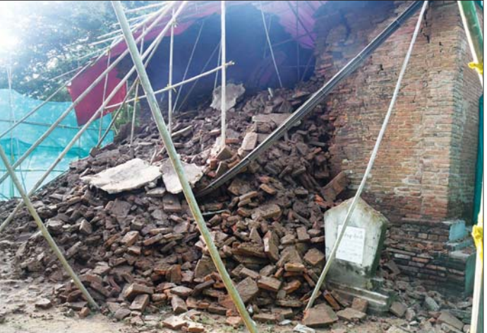
နိုင်ငံတော်စီမံအုပ်ချုပ်ရေးကောင်စီဥက္ကဋ္ဌ နိုင်ငံတော်ဝန်ကြီးချုပ် ဗိုလ်ချုပ်မှူးကြီး မင်းအောင်လှိုင် မိုးသည်းထန်စွာရွာသွန်းမှုကြောင့် ဆင်ကအုတ်တိုက် နံရံနှစ်ဖက်နှင့် ပေါင်းကူးအမိုးတို့ ပြိုကျပျက်စီးမှုအခြေအနေများ ကို ကြည့်ရှုစစ်ဆေးစဉ်။