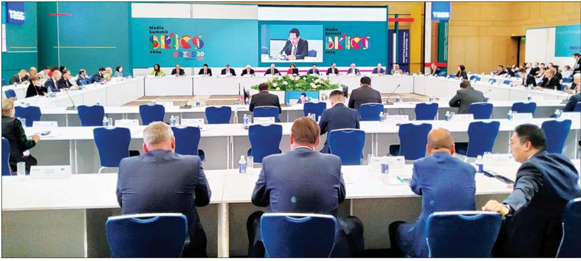
ပြည်ထောင်စုဝန်ကြီး ဦးမောင်မောင်အုန်း BRICS Media Summit တွင် ဆွေးနွေးပြောကြားစဉ်။

မော်စကို စက်တင်ဘာ ၁၅ BRICS Media Summit ကို စက်တင်ဘာ ၁၄ ရက်တွင် မော်စကို မြို့ရှိ World Trade Centre (WTC) ၌ ကျင်းပရာ ပြန်ကြားရေး ဝန်ကြီးဌာန ပြည်ထောင်စုဝန်ကြီး ဦးမောင်မောင်အုန်း၊ ရုရှား ဖက်ဒရေးရှင်းနိုင်ငံဆိုင်ရာ မြန်မာ သံအမတ်ကြီး ဦးသစ်လင်းအုန်း နှင့် မြန်မာကိုယ်စားလှယ်အဖွဲ့ဝင် များ တက်ရောက်ကြသည်။