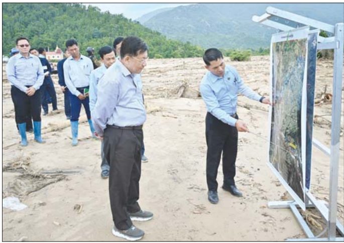
နိုင်ငံတော်စီမံအုပ်ချုပ်ရေးကောင်စီဥက္ကဋ္ဌ နိုင်ငံတော်ဝန်ကြီးချုပ် ဗိုလ်ချုပ်မှူးကြီး မင်းအောင်လှိုင်အား ကင်းသာရေထိန်းတံစီ၌ ပြည်ထောင်စုဝန်ကြီး ဦးမင်းနောင်က ရှင်းလင်းတင်ပြစဉ်။

ကင်းသာလမ်းခွဲမှတစ်ဆင့် ကင်းသာအုပ်စု၊ ၃ မိုင်ကျေးရွာအနီးရှိ ကင်းသာရေထိန်းတံစီသို့ သွားရောက်ကြည့်ရှုစစ်ဆေးရာ စိုက်ပျိုးရေး၊ မွေးမြူရေးနှင့် ဆည်မြောင်းဝန်ကြီးဌာန ပြည်ထောင်စုဝန်ကြီးဦးမင်းနောင်နှင့် တာဝန်ရှိသူများက မိုးအဆက်မပြတ်ရွာသွန်းမှုကြောင့် ကင်းသာချောင်းတစ်လျှောက် တောင်ကျချောင်းရေများ အရှိန်အဟုန်ဖြင့် စီးဆင်းခဲ့မှုနှင့် တစ်အပေါ်မှ ရေ ၃ ပေခန့်ကျော်ကျခဲ့မှု၊ သစ်တုံးကြီးများနှင့် နန်းအနှစ်များ၊ သဲများ တစ်အတွင်း အများအပြား ဝင်ရောက်၍ သောင်ထွန်းနေမှုအခြေအနေများကို ရှင်းလင်းတင်ပြသည်။ ယင်းနောက် နိုင်ငံတော်စီမံအုပ်ချုပ်ရေးကောင်စီဥက္ကဋ္ဌ နိုင်ငံတော်ဝန်ကြီးချုပ်သည် ကင်းသာတစ်အတွင်း သောင်ထွန်းနေမှု၊ တောင်ကျချောင်းရေများ အရှိန်အဟုန်ဖြင့် စီးဝင်ခဲ့မှုကြောင့် တစ်ကျိုးပေါက်နေမှု၊ သစ်ပင်သစ်တုံးကြီးများ တစ်အတွင်း ပိတ်ဆို့နေမှုအခြေအနေများကို လိုက်လံကြည့်ရှုစစ်ဆေးကာ ချောင်းအထက်ပိုင်း၌ သစ်ပင်များကို အများအပြားထုတ်ယူခြင်းကြောင့် ရေစီးဆင်းမှုနှုန်းကို ထိန်းသိမ်းနိုင်စွမ်းအားနည်းလာကာ ယခုကဲ့သို့ မိုးအဆက်မပြတ်ရွာသွန်းချိန်တွင် ရေအလုံးအရင်းဖြင့် စီးဆင်းခြင်းဖြစ်ကြောင်း၊ သစ်ပင်သစ်တုံးများကို ခုတ်ယူပြီး ချောင်းကမ်းနဖူးများတွင် စုပုံထားခြင်းကြောင့် ရေစီးနှင့်အတူမျောပါလာသည့် သစ်တုံးကြီးများ၏ ရိုက်ခတ်မှုများကြောင့် ရေလမ်းကြောင်းတစ်လျှောက်ထိခိုက်ပျက်စီးမှုများနှင့် တစ်ကျိုးပေါက်ခြင်းများဖြစ်ပေါ်ခဲ့ခြင်းဖြစ်ကြောင်း၊ ထို့ကြောင့် ရေလမ်းကြောင်းရှင်းလင်းခြင်းလုပ်ငန်းများ၊ တစ်