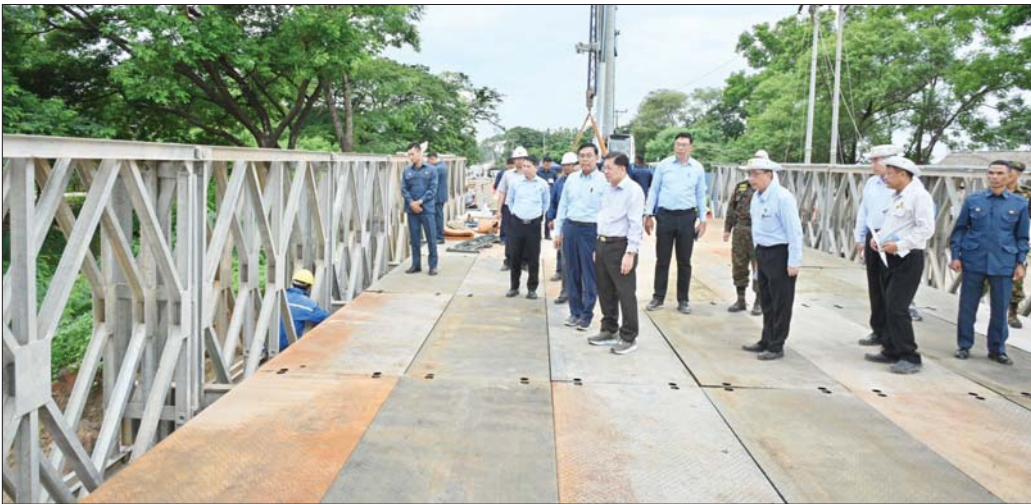
နိုင်ငံတော်စီမံအုပ်ချုပ်ရေးကောင်စီဥက္ကဋ္ဌ နိုင်ငံတော်ဝန်ကြီးချုပ် ဗိုလ်ချုပ်မှူးကြီး မင်းအောင်လှိုင် နဝင်းချောင်းတံတား(အဆုံ)၌ ရေတိုက်စားမှုကြောင့် ပြိုကျပျက်စီးခဲ့မှုအား ယာယီဘေးလိတ်တား တည်ဆောက်ပြုပြင်နေမှုအခြေအနေများကို ကြည့်ရှုစစ်ဆေးစဉ်။

နေပြည်တော် စက်တင်ဘာ ၁၅ နိုင်ငံတော်စီမံအုပ်ချုပ်ရေးကောင်စီဥက္ကဋ္ဌ နိုင်ငံတော်ဝန်ကြီးချုပ် ဗိုလ်ချုပ်မှူးကြီး မင်းအောင်လှိုင်သည် ယနေ့နံနက်ပိုင်းတွင် ကောင်စီတွဲဖက်အတွင်းရေးမှူး ဗိုလ်ချုပ်ကြီး ရဲဝင်းဦး၊ ပြည်ထောင်စုဝန်ကြီးများ ဖြစ်ကြသည့် ဦးမင်းနောင်၊ ဦးမျိုးသန့်၊ နေပြည်တော် ကောင်စီဥက္ကဋ္ဌ ဦးသန်းထွန်းဦး၊ ကာကွယ်ရေးဦးစီးချုပ်ရုံးမှ အဆင့်မြင့် တပ်မတော်အရာရှိကြီးများ၊ နေပြည်တော်တိုင်းစစ်ဌာနချုပ်တိုင်းမှူးနှင့် တာဝန်ရှိသူများ လိုက်ပါ၍ နေပြည်တော်ကောင်စီနယ်မြေအတွင်း မိုးအဆက်မပြတ် ရွာသွန်းမှုကြောင့် ပျက်စီးမှုများဖြစ်ပေါ်ခဲ့သည့် လမ်းတံတားများအား ပြန်လည်ပြုပြင်ဆောင်ရွက်နေမှုနှင့် ရေကြီးရေလျှံမှုဖြစ်ပေါ်ခဲ့မှုအခြေအနေများကို လိုက်လံကြည့်ရှုစစ်ဆေးသည်။