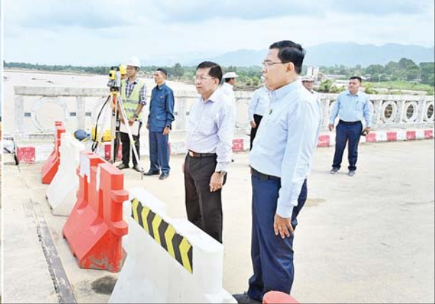
နိုင်ငံတော်စီမံအုပ်ချုပ်ရေးကောင်စီဥက္ကဋ္ဌ နိုင်ငံတော်ဝန်ကြီးချုပ် ဗိုလ်ချုပ်မှူးကြီး မင်းအောင်လှိုင် သိုက်ချောင်းတံတား (ဆင်သေချောင်းကူး)အား ယာယီဘေးလိတ်တားထိုးခြင်းလုပ်ငန်းဆောင်ရွက်ပြီးစီးမှု အခြေအနေများကို ကြည့်ရှုစစ်ဆေးစဉ်။