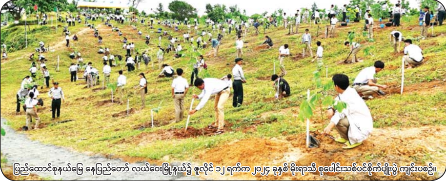
ဖြည့်ထောင်စနယ်မြေ နေပြည်တော် လယ်ဝေးမြို့နယ်၌ ဇူလိုင် ၁၂ ရက်က ၂၀၂၄ ခုနှစ် မိုးရာသီ စုပေါင်းသစ်ပင်စိုက်ပျိုးပွဲ ကျင်းပစဉ်။

လက်ရှိကမ္ဘာမှာ သဘာဝဘေးအန္တရာယ်တွေက ပုံစံမျိုးစုံ၊ နည်းမျိုးစုံ နဲ့ အကြိမ်ရေ ခပ်စိပ်စိပ် ဖြစ်ပေါ်နေတာပါ။ သဘာဝဘေးဆိုတာမျိုးက ဖြစ်လာပြီဆိုရင် ရဟန်းရှင်လူ ပြည်သူမရွေး၊ လူတန်းစားမရွေး၊ လူမျိုး မရွေး၊ နိုင်ငံမရွေး ထိခိုက်နိုင်တာပါ။ ဒါကြောင့်မို့လို့ နိုင်ငံတော်အစိုးရအနေ နဲ့ သဘာဝဘေးအန္တရာယ်ကာကွယ်ရေးဆိုင်ရာ ကြိုတင်အစီအမံတွေ ချမှတ်ခြင်းနဲ့ သစ်တောတွေ ပြန်လည်တည်ထောင်တဲ့ လုပ်ငန်းတွေကို အလေးထားဆောင်ရွက်လျက်ရှိရာမှာ ပြည်သူတွေရဲ့ ပူးပေါင်းပါဝင်မှု အခန်းကဏ္ဍဟာ အထူးအရေးကြီးပြီးတော့ လူထုအခြေပြု ဒီရေတော စိုက်ပျိုးခြင်း၊ ဒေသခံအစုအဖွဲ့ပိုင် သစ်တောတွေ တည်ထောင်ခြင်း၊ အစိမ်းရောင်တိုင်းတွေကို အောင်မြင်အောင် ဆောင်ရွက်နိုင်ဖို့အပြင် သစ်တော၊ သစ်ပင်တွေနဲ့ စိမ်းစိုလှပတဲ့ သဘာဝပတ်ဝန်းကျင်တွေ၊ ရာသီဥတု သမမျှတမှုတွေကို ပိုင်ဆိုင်တဲ့ အစိမ်းရောင် မြကမ္မလာ လွှမ်းခြုံတဲ့ နိုင်ငံတစ်နိုင်ငံဖြစ်လာစေဖို့ သစ်တော၊ သစ်ပင်တွေ ထူထောင်စိုက်ပျိုး ထိန်းသိမ်းကြပါစို့ဟု အလေးပေးတိုက်တွန်း လိုက်ရ ပါတယ်။