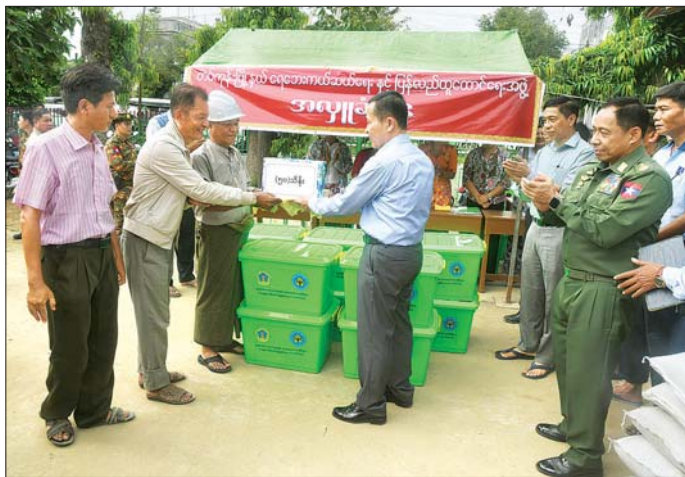
နိုင်ငံတော်စီမံအုပ်ချုပ်ရေးကောင်စီ ဒုတိယဥက္ကဋ္ဌ ဒုတိယဝန်ကြီးချုပ် ဒုတိယဗိုလ်ချုပ်မှူးကြီး စိုးဝင်း တပ်ကုန်းမြို့ အမှတ်(၁) အခြေစိုက်ပညာအထက်တန်းကျောင်းတွင် ရောက်ရှိနေသည့် ရေဘေးသင့်ပြည်သူများ အတွက် ထောက်ပံ့ပေး ဆေးပစ္စည်းများနှင့် စားသောက်ဖွယ်ရာများ ပေးအပ်စဉ်။

( ၃-၉-၂၀၂၄ ရက်နေ့တွင် နိုင်ငံတော်စီမံအုပ်ချုပ်ရေးကောင်စီဥက္ကဋ္ဌ နိုင်ငံတော်ဝန်ကြီးချုပ် ဗိုလ်ချုပ်မှူးကြီး မင်းအောင်လှိုင် ရှမ်းပြည်နယ်အစိုးရအဖွဲ့ဝင်များ၊ ပြည်နယ်နှင့် ခရိုင်အဆင့်ဌာနဆိုင်ရာတာဝန်ရှိသူများအား ပြောကြားသည့် အမှာစကားမှ ကောက်နုတ်ချက် )