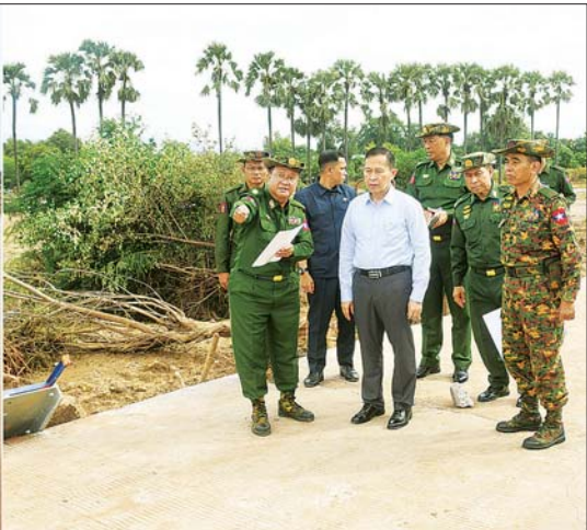
နိုင်ငံတော်စီမံအုပ်ချုပ်ရေးကောင်စီ ဒုတိယဥက္ကဋ္ဌ ဒုတိယဝန်ကြီးချုပ် ဒုတိယဗိုလ်ချုပ်မှူးကြီး စိုးဝင်း ရေတိုက်စားမှုကြောင့် ပျက်စီးသွားသည့် နဝင်းချောင်းတံတား (သာယာအေး)ကို ယာယီဘေးလိတ်တားအဖြစ် ပြန်လည်တည်ဆောက်နေမှုအား ကြည့်ရှုစစ်ဆေးစဉ်။

စာမျက်နှာ ၅ မှ ဆက်လက်၍ အမျိုးသားသာယာဝေးအန္တရာယ် ဆိုင်ရာ စီမံခန့်ခွဲမှုကော်မတီဥက္ကဋ္ဌ နိုင်ငံတော်စီမံ အုပ်ချုပ်ရေးကောင်စီ ဒုတိယဥက္ကဋ္ဌ ဒုတိယဝန်ကြီးချုပ် ဒုတိယဗိုလ်ချုပ်မှူးကြီး စိုးဝင်းနှင့်အဖွဲ့ဝင်များသည် ရေဝင်ရောက်မှုများဖြစ်ပေါ်ခဲ့သည့် တပ်ကုန်းမြို့ အထွေထွေရောဂါကုဆေးရုံကြီး (ခုတင်-၁၀၀)သို့ သွားရောက်၍ ပြန်လည်ပြင်ဆင်ရေးလုပ်ငန်းများ ဆောင်ရွက်နေမှုအခြေအနေများကို ကြည့်ရှုစစ်ဆေးပြီး တင်ပြချက်များအပေါ် လိုအပ်သည်များ ညှိနှိုင်းဆောင်ရွက်ပေးကာ ဆေးရုံတွင် တက်ရောက်ကုသ လျက်ရှိသော လူနာများအား လိုက်လံကြည့်ရှု၍ တစ်ဦးချင်း၏ ရောဂါဖြစ်ပွားမှု၊ ဆေးဝါးကုသပေး ထားမှုနှင့် ကျန်းမာရေးတိုးတက်ကောင်းမွန်မှုအခြေ အနေများအား ရင်းရင်းနှီးနှီး မေးမြန်းအားပေးစကား ပြောကြားကာ စားသောက်ဖွယ်ရာများ ထောက်ပံ့ ပေးအပ်သည်။