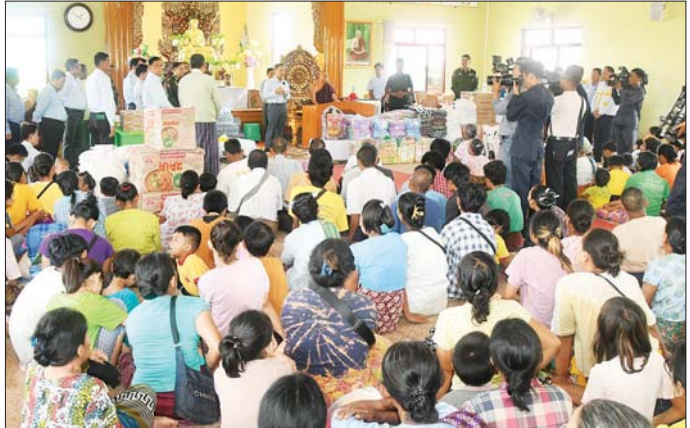
နိုင်ငံတော်စီမံအုပ်ချုပ်ရေးကောင်စီ ဒုတိယဥက္ကဋ္ဌ ဒုတိယဝန်ကြီးချုပ် ဒုတိယဗိုလ်ချုပ်မှူးကြီး စိုးဝင်း တပ်ကုန်းမြို့ ချမ်းမြေ့မြိုင်ရိပ်သာကျောင်းတိုက်တွင် ရောက်ရှိနေသည့် ရေဘေးသင့်ပြည်သူများအား ရင်းရင်းနှီးနှီး တွေ့ဆုံအားပေးစကားပြောကြားပြီး ထောက်ပံ့ငွေနှင့် စားသောက်ဖွယ်ရာများ ထောက်ပံ့ပေးအပ်စဉ်။