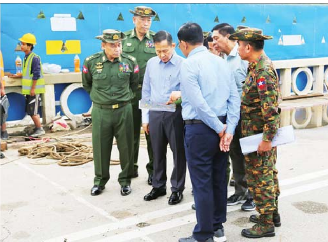
နိုင်ငံတော်စီမံအုပ်ချုပ်ရေးကောင်စီ ဒုတိယဥက္ကဋ္ဌ ဒုတိယဝန်ကြီးချုပ် ဒုတိယဗိုလ်ချုပ်မှူးကြီး စိုးဝင်း ရန်ကုန်-မန္တလေး ကားလမ်းဟောင်းပေါ်ရှိ နဝင်းချောင်းတံတားရေတိုက်စားမှုကြောင့် ပြိုကျပျက်စီးခဲ့မှုအခြေအနေ ကြည့်ရှုစစ်ဆေးစဉ်။

နိုင်ငံတော်စီမံအုပ်ချုပ်ရေးကောင်စီဒုတိယဥက္ကဋ္ဌ ဒုတိယဝန်ကြီးချုပ် ဒုတိယဗိုလ်ချုပ်မှူးကြီး စိုးဝင်း နေပြည်တော်ကောင်စီနယ်မြေအတွင်း ရေကြီးရေလျှံမှုများကြောင့် ပျက်စီးမှုများနှင့်ပတ်သက်၍ ပြန်လည်ထူထောင်ရေးလုပ်ငန်းများ ဆောင်ရွက်နိုင်ရန်အတွက် အမျိုးသားသဘာဝဘေးအန္တရာယ်ဆိုင်ရာ စီမံခန့်ခွဲမှုကော်မတီလုပ်ငန်းညှိနှိုင်းအစည်းအဝေးပြုလုပ် ရေကြီးရေလျှံခဲ့မှုကြောင့် ပျက်စီးဆုံးရှုံးခဲ့သည့်အခြေအနေများအား လိုက်လံကြည့်ရှုစစ်ဆေး