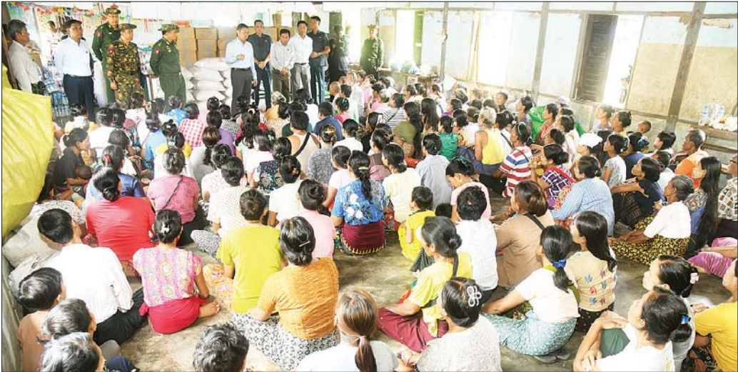
နိုင်ငံတော်စီမံအုပ်ချုပ်ရေးကောင်စီ ဒုတိယဥက္ကဋ္ဌ ဒုတိယဝန်ကြီးချုပ် ဒုတိယဗိုလ်ချုပ်မှူးကြီး စိုးဝင်း ပျဉ်းမနားမြို့နယ် နတ်သူရကျေးရွာရှိ အခြေခံပညာ အထက်တန်းကျောင်းတွင် ရောက်ရှိနေသော ရေဘေးသင့်ပြည်သူများအား တွေ့ဆုံအားပေးစကား ပြောကြားစဉ်။

အချို့ကျေးရွာများ၌ ယနေ့အချိန်အထိ တောင်ကျ ချောင်းရေများ ၁ ပေမှ ၂ ပေ အထိ ကျန်ရှိနေသေး၍ သန့်ရှင်းသောသောက်သုံးရေရရှိရေးသောကံရေသန့် စက်ယာဉ်များ စေလွှတ်ကူညီပေးခြင်း၊ လွယ်ကူ ပေါ့ပါးသည့် Life Straw ကဲ့သို့ တစ်ပိတ်တစ်နှိပ် သောက်ရေသန့်စက်များ အခက်အခဲရှိသည့်ကျေးရွာ များအလိုက် ဖြန့်ဝေခြင်း၊ Bleaching Powder နှင့် ရေသန့်ဆေးပြားများ ပံ့ပိုးပေးခြင်းစီစဉ်ဆောင်ရွက် ရန် လိုကြောင်း၊ ကျန်းမာရေးအရ ရေဘေးအန္တရာယ် နောက်ဆက်တွဲ ဝမ်းပျက်ဝမ်းလျှောနှင့် ရေဝပ်နေရာ များမှ ခြင်္သေ့၊ ယင်ပေါက်ပွားခြင်းကြောင့် ဖြစ်ပေါ်နိုင် သော နောက်ဆက်တွဲရောဂါများအပေါ်အထိ အထွေ ထွေကူးစက်ရောဂါများ မဖြစ်ပွားစေရေး ကယ်ဆယ် ရေးစခန်းအလိုက် နေပြည်တော်ကောင်စီနယ်မြေ အတွင်းရှိသော ဆေးရုံများ၊ တိုက်နယ်ဆေးရုံများ၊ ကျေးလက်ဆေးပေးစခန်းများနှင့် ကျေးရွာများရှိ သူနာပြုဝန်ထမ်းများက မိမိတို့တာဝန်ကျရာ ကျေးရွာ အလိုက် ကျန်းမာရေးနှင့်ပတ်သက်၍ အဆင့်ဆင့်