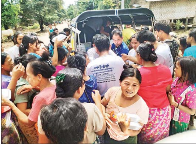
ကျေးရွာများမှ ရေဘေးသင့်ပြည်သူများအား တပ်မတော်သားများ၊ ရဲတပ်ဖွဲ့ဝင်များ၊ မီးသတ်တပ်ဖွဲ့ဝင်များ၊ ဌာနဆိုင်ရာများနှင့် လူမှုရေးအသင်းအဖွဲ့များက ကူညီကယ်ဆယ် ရွှေ့ပြောင်းပေးခြင်းနှင့် စားသောက်ဖွယ်ရာများ ဝေငှပေးမှုကို တွေ့ရစဉ်။

ဖြစ်ပေါ်နေသည့် လယ်ဝေးမြို့နယ်၊ ဖုန်းတော်စားမြို့နယ်၊ ဇေယျာသီရိမြို့နယ်နှင့် ပုဗ္ဗသီရိမြို့နယ်အတွင်းရှိ ရပ်ကွက်၊ ကျေးရွာများမှ ရေဘေးသင့် ပြည်သူများ