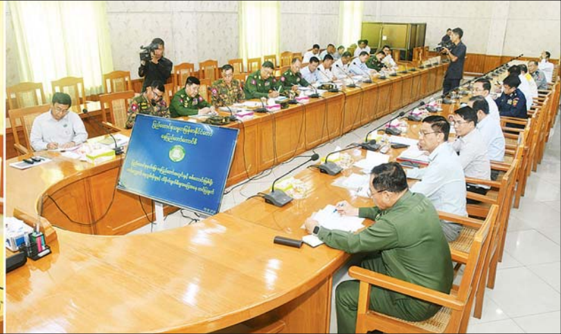
နိုင်ငံတော်စီမံအုပ်ချုပ်ရေးကောင်စီ ဒုတိယဥက္ကဋ္ဌ ဒုတိယဝန်ကြီးချုပ် ဒုတိယဗိုလ်ချုပ်မှူးကြီး စိုးဝင်း နေပြည်တော်ကောင်စီနယ်မြေအတွင်း ရေကြီးရေလျှံမှုများကြောင့် ပျက်စီးမှုများနှင့်ပတ်သက်၍ ပြန်လည်ထူထောင်ရေးလုပ်ငန်းများဆောင်ရွက်နိုင်ရန်အတွက် အမျိုးသားသဘာဝဘေးအန္တရာယ်ဆိုင်ရာ စီမံခန့်ခွဲမှုကော်မတီလုပ်ငန်းညှိနှိုင်းအစည်းအဝေးတွင် အမှာစကားပြောကြားစဉ်။

ဖွဲ့စည်းမှု အစည်းအဝေးသို့ အမျိုးသားသဘာဝဘေးအန္တရာယ်ဆိုင်ရာ စီမံခန့်ခွဲမှုကော်မတီဥက္ကဋ္ဌ နိုင်ငံတော်စီမံအုပ်ချုပ်ရေးကောင်စီ ဒုတိယဥက္ကဋ္ဌ ဒုတိယဝန်ကြီးချုပ် ဒုတိယဗိုလ်ချုပ်မှူးကြီး စိုးဝင်းနှင့်အတူ ပြည်ထောင်စုဝန်ကြီးများဖြစ်ကြသည့် ဒုတိယဗိုလ်ချုပ်ကြီး ရာပြည့်၊ ဦးမျိုးသန့်၊ ဒေါက်တာသက်ခိုင်ဝင်း၊ ဒေါက်တာစိုးဝင်း၊ ဦးမင်းနေဝင်း၊ နေပြည်တော်ကောင်စီဥက္ကဋ္ဌ၊ ကာကွယ်ရေးဦးစီးချုပ်ရုံးမှ တပ်မတော်အရာရှိကြီးများ၊ နေပြည်တော်တိုင်းစစ်ဌာနချုပ်တိုင်းမှူးနှင့် တာဝန်ရှိသူများ တက်ရောက်ကြသည်။