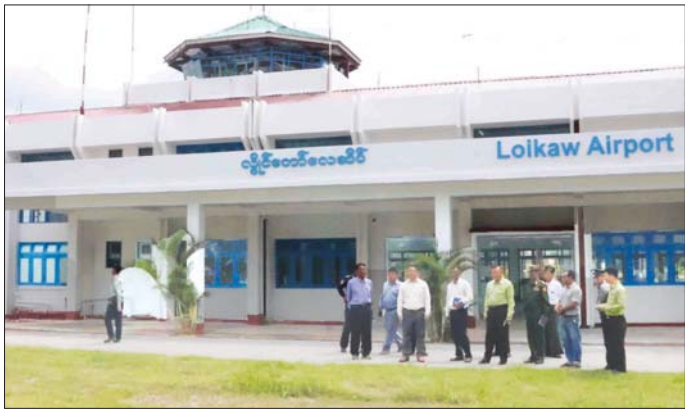
ဓမ္မာရုံအကျိုးတော်ဆောင်အဖွဲ့နှင့် ပေါင်းစပ်ညှိနှိုင်းဆောင်ရွက်ပေးသည်။

ဆက်လက်ပြီး ပြည်နယ်ဝန်ကြီးချုပ်နှင့်တာဝန်ရှိသူများသည် မြို့လယ်ဓမ္မာရုံ ပျက်စီးနေမှုကို သွားရောက်ကြည့်ရှုပြီး ပြည်သူများနှင့် ဘာသာရေးအခမ်းအနားများ ကျင်းပနိုင်ရေး စာရေးတံခံပွဲနှင့် စာပြန်ပွဲများ ပြန်လည်ကျင်းပပြုလုပ်နိုင်ရေး၊ အချိန်မီ ပြုပြင်ဆောင်ရွက်နိုင်ရေး လိုအပ်သည်များကို