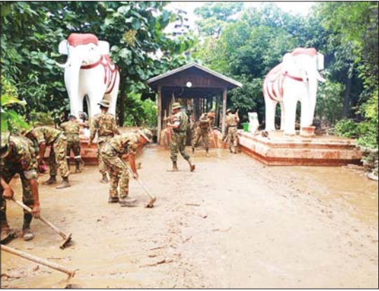
ရေများ ပြန်လည်ကျဆင်းသွား၍ တင်ကျန်ခဲ့သည့် နန်းများ၊ သစ်ပင်သစ်ကိုင်းများ၊ အမှိုက်များကို သန့်ရှင်းရေးဆောင်ရွက်စဉ်။

ထို့ပြင် ရေကြီးရေလျှံမှုဖြစ်ပေါ်ခဲ့သည့် နေပြည်တော် ကောင်စီနယ်မြေနှင့် သိုက်ချောင်းတိုင်းဒေသကြီးနှင့် ပြည်နယ် များအလိုက် ယာယီရေဘေးရောင်စခန်း များ ဖွင့်လှစ်ပေးထားပြီး လိုအပ်သည့် ကျန်းမာရေးစောင့်ရှောက်မှုလုပ်ငန်းများ ကို ဆောင်ရွက်ပေးလျက်ရှိကာ ရေဘေး သင့်ပြည်သူများ စားသောက်ရေးအခက် အခဲမှုရှိစေရေးအတွက် တပ်မတော်