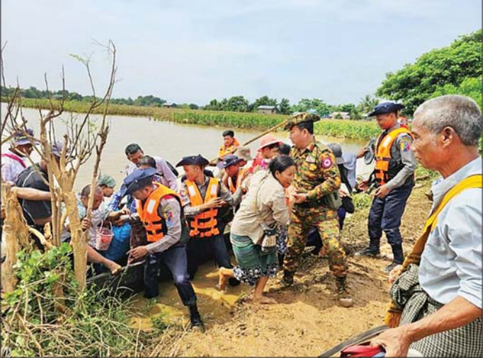
ကျေးရွာများမှ ရေဘေးသင့်ပြည်သူများအား တပ်မတော်သားများ၊ ရဲတပ်ဖွဲ့ဝင်များ၊ မီးသတ်တပ်ဖွဲ့ဝင်များ၊ ဌာနဆိုင်ရာများနှင့် လူမှုရေးအသင်းအဖွဲ့များက ကူညီကယ်ဆယ် ရွှေ့ပြောင်းပေးခြင်းနှင့် စားသောက်ဖွယ်ရာများ ဝေငှပေးမှုကို တွေ့ရစဉ်။