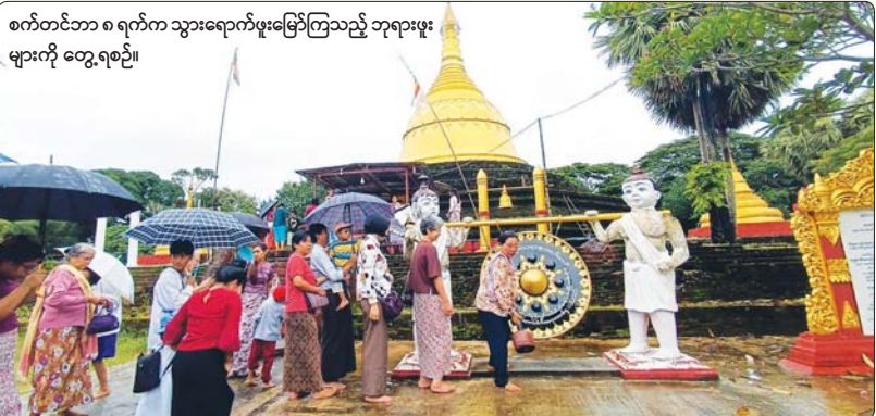
စက်တင်ဘာ ၈ ရက်က သွားရောက်ဖူးမြော်ကြသည့် ဘုရားဖူး များကို တွေ့ရစဉ်။

“တစ်လုံးတည်းသော ကျွန်းသစ်ကြီးကို လေးနှစ်ကြာထုဆစ်ပြီး ကောဇာသက္ကရာဇ် ၁၂၆၂ ခုနှစ်မှာ ညဏ်တော် ၁၈ တောင် ၂၇ ပေ အမြင့်ဆောင်တဲ့ ရပ်တော်မူဘုရားကြီးအဖြစ် တည်ထားကိုးကွယ်ခဲ့တာ အခုဆိုရင် နှစ်ပေါင်း ၁၀၀ ရှိပြီ ဖြစ်ပါ တယ်။ ဘုရားဖူးပြည်သူတွေကြားထဲမှာတော့ ကျိုက်လတ်မြို့က ရေဆန်ကျွန်းဘုရားလို့ ထင်ရှားလှပါတယ်”