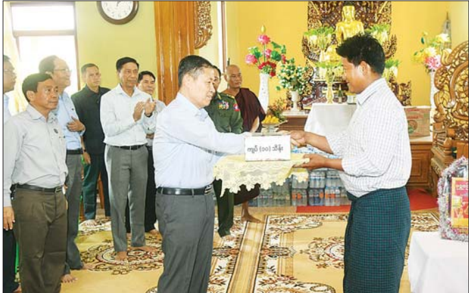
နိုင်ငံတော်စီမံအုပ်ချုပ်ရေးကောင်စီ ဒုတိယဥက္ကဋ္ဌ ဒုတိယဝန်ကြီးချုပ် ဒုတိယဗိုလ်ချုပ်မှူးကြီး စိုးဝင်း တပ်ကုန်းမြို့ ချမ်းမြေ့မြိုင်ရိပ်သာကျောင်းတိုက်တွင် ရောက်ရှိနေသည့် ရေဘေးသင့်ပြည်သူများအား ရင်းရင်းနှီးနှီး တွေ့ဆုံအားပေးစကားပြောကြားပြီး ထောက်ပံ့ငွေနှင့် စားသောက်ဖွယ်ရာများ ထောက်ပံ့ပေးအပ်စဉ်။