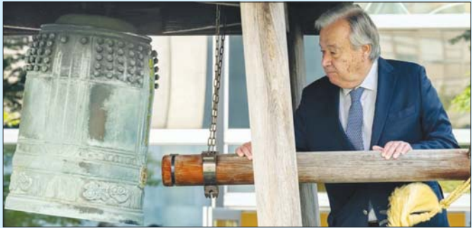
ငြိမ်းဖြစ်ကြောင်း ပြောသည်။ စစ်ပွဲခြိမ်းခြောက်မှုများ ကြီးပမ်းကြရမည်ဟု ၎င်းက ပြည်တွင်းပြော အကြိမ်ကြိမ်ရှိသောပြား လူသားများအနေဖြင့် သည်။ လက်မလျှော့ဘဲ ငြိမ်းချမ်းရေးရရှိရန် မဖြစ်မနေ အင်န်အိတ်ချီကေ

နာကာဂါဝါချိယိုဂျီက လှူဒါန်းထားခြင်းဖြစ်သည်။ အဆိုပါ ခေါင်းလောင်းကို နိုင်ငံပေါင်း ၆၀ ကျော်က ပေးအပ်သော ဒင်္ဂါးပြားများနှင့် သွန်းလုပ်ထားကြောင်း သိရသည်။ ယင်းအခမ်းအနားသို့ နာကာဂါဝါချိယိုဂျီ၏ သမီးဖြစ်သူ တာကာဆေးဆေးကို တက်ရောက်ခဲ့သည်။ ဂူတာရက်စံက “ဒီကုလသမဂ္ဂမှာ ငြိမ်းချမ်းရေးဆိုတာ ကျွန်ုပ်တို့ အသက်ရှင်ရပ်တည်မှုအတွက် ရည်ရွယ်ချက် သို့မဟုတ် အကြောင်းပြချက် ဖြစ်ပေမယ့် ငြိမ်းချမ်းရေးဟာ ခြိမ်းခြောက်ခံနေရပြီး စစ်ပွဲတွေဖြစ်ပွားလာနေတယ်” ဟု ပြောကြားသည်။ တာကာဆေးက ၎င်း၏ ဖခင်သည် ၎င်းကိုယ်တိုင် တွေ့ကြုံခဲ့ရသည့် စစ်ပွဲမှတစ်ဆင့် ကမ္ဘာကြီး ငြိမ်းချမ်းရမည်ဟု ယုံကြည်သောကြောင့် ခေါင်းလောင်းသွန်းလုပ်မှုကို ခွန်အားစိုက်ထုတ်ခဲ့