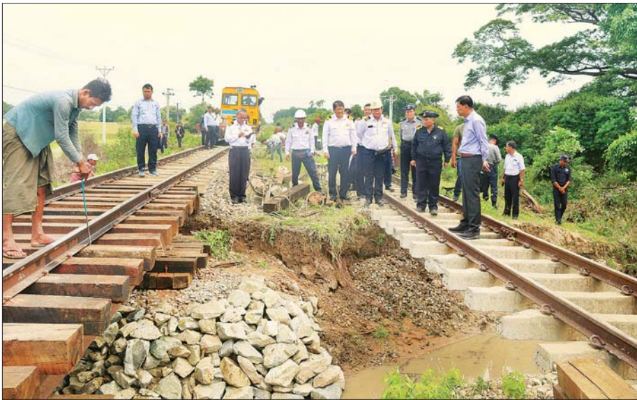
အခြေအနေကို ကြည့်ရှုစစ်ဆေး သည်။

နေပြည်တော် စက်တင်ဘာ ၁၄ နိုင်ငံတော်စီမံအုပ်ချုပ်ရေးကောင်စီ အဖွဲ့ဝင် ဒုတိယဝန်ကြီးချုပ်နှင့် ပို့ဆောင်ရေးနှင့် ဆက်သွယ်ရေး ဝန်ကြီးဌာန ပြည်ထောင်စုဝန်ကြီး ဗိုလ်ချုပ်ကြီး မြထွန်းဦးသည် ဝန်ကြီးဌာနနှင့် မြန်မာ့မီးရထားမှ တာဝန်ရှိသူများနှင့်အတူ ယနေ့ နံနက်ပိုင်းတွင် မြန်မာ့မီးရထား တိုင်းအမှတ် (၅)၊ မန္တလေးတိုင်း ဒေသကြီး ရမည်းသင်းမြို့နယ် နှင့် ပျော်ဘွယ်မြို့နယ်အတွင်းရှိ ရန်ကုန်-မန္တလေး ရထားလမ်း တစ်လျှောက်မကြာမီက မိုးသည်းထန်စွာ ရွာသွန်းခဲ့မှုကြောင့် ရေတိုက်စားပြီး ပျက်စီးချို့ယွင်းမှု အခြေအနေနှင့် အဆိုပါပျက်စီး ချို့ယွင်းသည့် နေရာများအား မြန်မာ့မီးရထားဝန်ထမ်းများက မွမ်းမံပြင်ဆင် ဆောင်ရွက်နေမှု အခြေအနေကို လိုက်လံကြည့်ရှု စစ်ဆေးသည်။