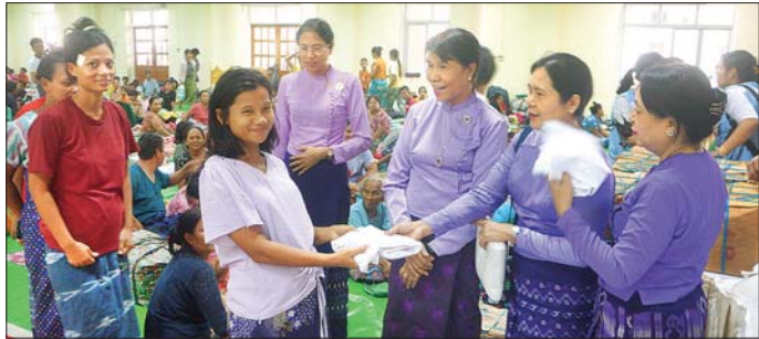
ဘင်္ဂလားပင်လယ်အော် အခြေအနေ

ဒေါက်တာစန်းစန်းမြင့် အောင်နှင့် ပဟိုအလုပ်အမှုဆောင် အဖွဲ့ဝင်များသည် ယမန်နေ့