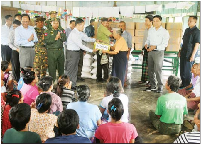
နိုင်ငံတော်စီမံအုပ်ချုပ်ရေးကောင်စီ ဒုတိယဥက္ကဋ္ဌ ဒုတိယဝန်ကြီးချုပ် ဒုတိယဗိုလ်ချုပ်မှူးကြီး စိုးဝင်း ပျဉ်းမနားမြို့နယ် နတ်သူရကျေးရွာရှိ အခြေခံပညာအထက်တန်းကျောင်းတွင် ရောက်ရှိနေသော ရေဘေးသင့်ပြည်သူများအား ထောက်ပံ့ငွေနှင့် စားသောက်ဖွယ်ရာများ ထောက်ပံ့ပေးအပ်စဉ်။

“ဘေးအန္တရာယ် စီမံခန့်ခွဲရေးရန်ပုံငွေနှင့် နေပြည်တော်ကောင်စီတို့မှ ဆန်၊ ဆီ၊ ကုလားပဲ၊ ဆား၊ ငပီ စသည့်အခြေခံ ၅ မျိုးအား ကယ်ဆယ်ရေးစခန်းအလိုက် အရေးပေါ်ထားရှိ၍ နီးစပ်ရာရပ်ရွာ လူမှုရေးအသင်းအဖွဲ့များမှ ချက်ပြုတ် ကျွေးမွေးနိုင်ရေးကိုလည်း စီမံပေး ရန်လို”