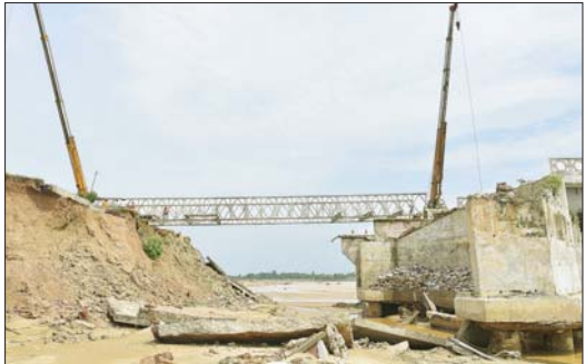
ပုဗ္ဗသီရိမြို့ပတ်လမ်းပေါ်ရှိ သိုက်ချောင်းတံတား (ဆင်သေချောင်းကူး) ပြင်ဆင်ဆောင်ရွက်ပြီးစီးမှုအခြေအနေကို တွေ့ရစဉ်။