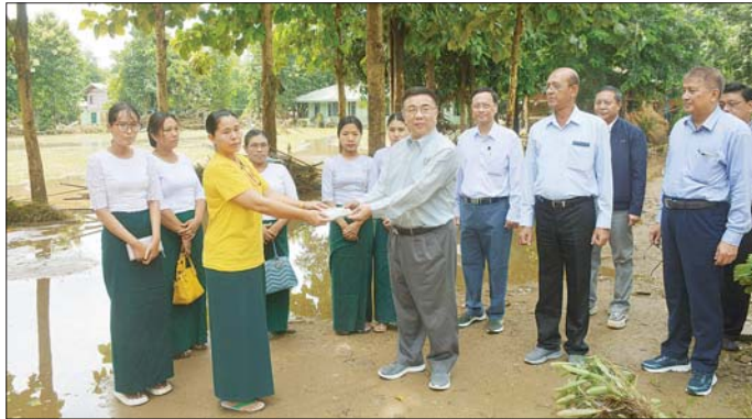
လိုအပ်သည်များကို ပေါင်းစပ်ညှိနှိုင်း၍ ဖြည့်ဆည်းဆောင်ရွက်ပေးသည်။ ထို့နောက် ပြည်ထောင်စုဝန်ကြီးသည် တပ်ကုန်း

နေပြည်တော် စက်တင်ဘာ ၁၄ ပညာရေးဝန်ကြီးဌာန ပြည်ထောင်စုဝန်ကြီး ဒေါက်တာညွန့်ဖေသည် ဒုတိယဝန်ကြီး ဒေါက်တာ စောမြင့်နှင့် ဒေါက်တာမိုးဇော်ထွန်း၊ ညွှန်ကြားရေးမှူးချုပ်များ၊ တာဝန်ရှိသူများနှင့်အတူ ယနေ့နံနက်ပိုင်းတွင် ရာဂီမုန်တိုင်းအရှိန်ကြောင့် မိုးကြီးကာ ရေနှစ်မြုပ်မှုများဖြစ်ပေါ်ခဲ့သည့် တပ်ကုန်းမြို့နယ်ရှိ အခြေခံပညာကျောင်းများသို့ သွားရောက်ကြည့်ရှုစစ်ဆေးသည်။ ဦးစွာ ပြည်ထောင်စုဝန်ကြီးသည် တပ်ကုန်းမြို့နယ် သူဌေးကုန်းရွာ အခြေခံပညာ အလယ်တန်းကျောင်း(ခ) ဌာ ခြံ ရေဘေးဒဏ်ကို ရင်ဆိုင်ကြုံတွေ့ခဲ့ရသော ကျောင်းအုပ် ဆရာမကြီး၊ ဆရာ ဆရာမများနှင့်တွေ့ဆုံ၍ ထောက်ပံ့ငွေများပေးအပ်ပြီး ပြန်လည်ပြုပြင်ထူထောင်ရေးလုပ်ငန်းများကို အမြန်ဆုံးဆောင်ရွက်ပြီး စာသင်ကြားရေးလုပ်ငန်းများ ပြန်လည်စတင်နိုင်ရေး ဆောင်ရွက်ရန် မှာကြားကာ