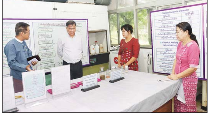
ရှိ ရေဘေးသင့် ဆရာ ဆရာမများ၊ ဝန်ထမ်းများ၊ ကျောင်းသားကျောင်းသူများထံသို့ နည်းပညာတက္ကသိုလ်(တောင်ငူ)နှင့် အစိုးရ

ဝန်ထမ်းများအနေဖြင့် ပြည်သူများအတွက် အလှူငွေများ ဆက်ကပ်လှူဒါန်းသည်။ တို့အတူ အမြဲတမ်းအတွင်းဝန် ဒေါက်တာစိုင်းကျော်နိုင်ဦး ခေါင်းဆောင်သည့် အဖွဲ့သည် ယနေ့နံနက်ပိုင်းတွင် ရေဘေးသင့်နေသော ကွန်ပျူတာတက္ကသိုလ် (တောင်ငူ) နှင့် အစိုးရနည်းပညာအထက်တန်းကျောင်း (တောင်ငူ) သို့ သွားရောက်၍ ဆရာ ဆရာမများ၊ ကျောင်းသား ကျောင်းသူများနှင့် ဝန်ထမ်းများအား တွေ့ဆုံပြီး အားပေးစကားပြောကြားကာ ထောက်ပံ့ပစ္စည်းများ ပေးအပ်သည်။ ကွန်ပျူတာ တက္ကသိုလ် (တောင်ငူ) နှင့် အစိုးရနည်းပညာအထက်တန်းကျောင်း (တောင်ငူ)