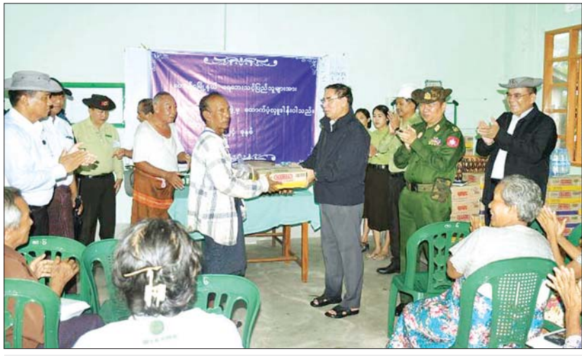
တောင်ငူမြို့နယ်မှ ရေဘေးသင့်ပြည်သူများအတွက် ပဲခူးတိုင်းဒေသကြီးဝန်ကြီးချုပ်က ထောက်ပံ့ပစ္စည်းများ ပေးအပ်စဉ်။

အား တပ်မတော်သားများ၊ မြန်မာနိုင်ငံရဲတပ်ဖွဲ့ဝင်များ၊ မီးသတ်တပ်ဖွဲ့ဝင်များ၊ ဌာနဆိုင်ရာ တာဝန်ရှိသူများနှင့်လူမှုဝန်ထမ်းကယ်ဆယ်ရေးအသင်း/အဖွဲ့များက လိုအပ်သည့်ကူညီကယ်ဆယ်ရေးအဖွဲ့များ ပေးခြင်းလုပ်ငန်းများ ဆောင်ရွက်ပေးခြင်း၊ စားသောက်ဖွယ်ရာများ လိုက်လံဝေငှပေးခြင်းများတက်ကြွစွာ ဆောင်ရွက်ပေးလျက်ရှိသည်။ သန့်ရှင်းရေးလုပ်ငန်းများဆောင်ရွက် ထိုအပြင် ရေများပြန်လည် ကူဆင်းသွားသည့် နေရာများရှိလမ်း၊ တံတားများ၊ ရပ်ကွက်၊ ကျေးရွာများအတွင်း၌ တင်ကျန်ခဲ့သည့် နန်းများ၊ သစ်ပင်သစ်ကိုင်းများအား ဖယ်ရှားပေးခြင်း အပါအဝင် ကူညီကယ်ဆယ်ရေးနှင့် သန့်ရှင်းရေးလုပ်ငန်းများကို အင်တိုက်အားတိုက် ဝိုင်းဝန်းဆောင်ရွက်ပေးလျက်ရှိသည်။ ရေကြီးမှုကြောင့် ပျက်စီးမှုများ ဖြစ်ပေါ်ခဲ့သည့် လမ်း/တံတားများကို