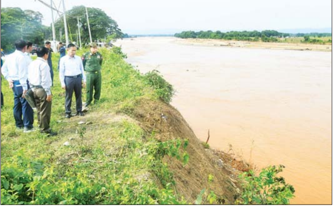
နိုင်ငံတော်စီမံအုပ်ချုပ်ရေးကောင်စီ ဒုတိယဥက္ကဋ္ဌ ဒုတိယဝန်ကြီးချုပ် ဒုတိယဗိုလ်ချုပ်မှူးကြီး စိုးဝင်း ရန်ကုန် - မန္တလေး ကားလမ်းဟောင်း ချောင်းရေတိုက်စားမှုကြောင့် ပျက်စီးမှုများကို ကြည့်ရှုစစ်ဆေးစဉ်။

နေပြည်တော်ကောင်စီနယ်မြေအတွင်း၌လည်း ရေဘေးသင့်ပြည်သူများကို အချို့သောအလှူရှင်များက တစ်နိုင်တစ်ပိုင်း မိမိအစီအစဉ်ဖြင့် လာရောက်လှူဒါန်းမှုပြုသည်ကိုလည်း တွေ့မြင်ကြားသိရ၍ ဝမ်းသာပါကြောင်း၊ အကြံပြုလိုသည်မှာ မိမိတို့တွင် သဘာဝဘေးအန္တရာယ်စီမံခန့်ခွဲမှု ကော်မတီ (Disaster Management Committee) ဖွဲ့စည်းထားရှိပြီး ၂၄ နာရီအရေးပေါ် ရုံးဖွင့်လှစ်ထားပြီးဖြစ်၍ မည်သည့်အလှူရှင်ကဖြစ်စေ မိမိတို့လှူဒါန်းလိုမှုအား ပိုမိုစနစ်တကျဖြစ်စေရေး၊ အညီအမျှအကူအညီရရှိစေရေး စိတ်ဆန္ဒရှိသည့်နေရာ (သို့မဟုတ်) စာမျက်နှာ ၄ သို့