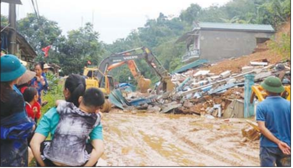
ဗီယက်နမ်နိုင်ငံ ဘတ်ကန်ပြည်နယ်တွင် တိုင်ဖွန်းရာဂီ တိုက်ခတ်ပြီးနောက် မြေပြိုမှု ဖြစ်ပေါ်စဉ်။

ဟနွိုင် စက်တင်ဘာ ၁၄ လွန်ခဲ့သည့်တစ်ပတ်က တိုင်ဖွန်းရာဂီ ဗီယက်နမ်နိုင်ငံကုန်းတွင်းပိုင်းသို့ ဝင်ရောက်ခဲ့ပြီး နောက် လူ ၂၅၄ ဦး သေဆုံးပြီး ၈၂ ဦး ပျောက်ဆုံးနေကြောင်း ဗီယက်နမ်နိုင်ငံပိုင် မီဒီယာက ဖော်ပြသည်။ အားပြင်းမုန်တိုင်းသည် နိုင်ငံမြောက်ဘက် ခြမ်းကို ရိုက်ခတ်ခဲ့ပြီး မြေပြိုမှုနှင့် ရေကြီးမှုများ ဖြစ်ပေါ်ခဲ့သဖြင့် ဗီယက်နမ်အစိုးရက ရေဘေးသင့်ပြည်သူများထံ ကယ်ဆယ်ရေး ဖွဲ့စည်းများကို ပို့ဆောင်ပေးလျက်ရှိသည်။ ဗီယက်နမ် အာဏာပိုင်များက ယင်းသည် နှစ်ပေါင်း ၆၀ အတွင်း အဆိုးရွားဆုံး မုန်တိုင်း ဖြစ်ကြောင်း ပြောကြားသည်။ လာအိုကိုပြည်နယ်တွင် အဆိုးရွားဆုံး ထိခိုက်ခဲ့ပြီး သေဆုံးသူ ၄၆ ဦးရှိကာ ၄၀ ကျော် ပျောက်ဆုံးနေဆဲဖြစ်၍ ရှာဖွေ ကယ်ဆယ်ရေးလုပ်ငန်းများ လုပ်ဆောင်နေဆဲဖြစ်သည်။ မြို့တော်ဟနွိုင်၏ အစိတ်အပိုင်း