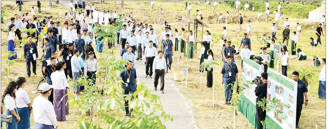
နိုင်ငံတော်စီမံအုပ်ချုပ်ရေးကောင်စီဥက္ကဋ္ဌ နိုင်ငံတော်ဝန်ကြီးချုပ် ဗိုလ်ချုပ်မှူးကြီး မင်းအောင်လှိုင် သစ်ပင်စိုက်ပျိုးပွဲ တက်ရောက်လာကြသူများက ပျိုးပင်များအား တပျော်တပါးစိုက်ပျိုးနေမှုကို လှည့်လည်ကြည့်ရှုအားပေးစဉ်။