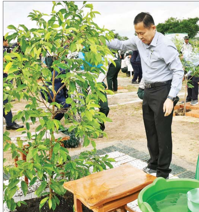
နိုင်ငံတော်စီမံအုပ်ချုပ်ရေးကောင်စီ ဒုတိယဥက္ကဋ္ဌ ဒုတိယဝန်ကြီးချုပ် ဒုတိယဗိုလ်ချုပ်မှူးကြီး စိုးဝင်း ပျိုးပင်ကို စိုက်ပျိုးစေစဉ်။

နိုင်ကြောင်း၊ ထို့ကြောင့် သဘာဝ ရေစစ်ကန်၊ ရေလှောင်ကန်များ သဖွယ် အကျိုးပြုလျက်ရှိပြီး စားရေရိက္ခာဖူလုံရေးနှင့် နိုင်ငံတော်ဖွံ့ဖြိုးရေးကို အထောက်အကူပြုလျက်ရှိကြောင်း။ ရေချိုအရင်းအမြစ်များ ဖြစ်သည့် မြစ်၊ ချောင်း၊ အင်း၊ အိုင်များနှင့် ဆည်တာဝန်များ ရေရှည် တည်တံ့စေရန် ရေဝေရေလဲဒေသရှိ သစ်ပင်သစ်တောများကို ထိန်းသိမ်းရန် လိုအပ်ကြောင်း၊ “ဆည်မြောင်းချောင်းကန် ရေပြည့်လျှို၊ သစ်ပင်ရံမှ သက္ကာန်လှပ မြိတာဝရ” ဆိုသည့်အတိုင်း သစ်ပင် သစ်တောများရှိမှသာ မြေတိုက်စားမှု၊ ရေတိုက်စားမှုများမှ ကာကွယ်ပြီး ဆည်များ ရေရှည်တည်တံ့စေမည် ဖြစ်ကြောင်း၊ လတ်တလော ကြုံတွေ့နေရသည့် ရေကြီးရေလျှံမှုများသည် စာမျက်နှာ ၄ သို့