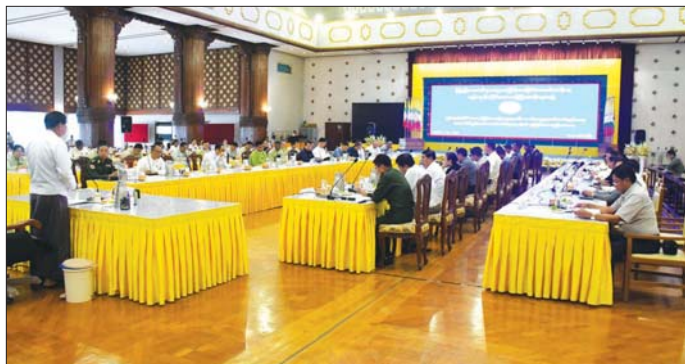
ရန်ကုန်တိုင်းဒေသကြီး ဝန်ကြီးချုပ် ဦးစိုးသိန်း ယာဉ်အန္တရာယ်၊ လမ်းအန္တရာယ်ကင်းရှင်းရေးကောင်စီနှင့် ဆပ်ကော်မတီ လေးခုတို့၏ ညှိနှိုင်းအစည်းအဝေးတွင် အမှာစကားပြောကြားစဉ်။

ဦးစွာ ရန်ကုန်တိုင်းဒေသကြီး ဝန်ကြီးချုပ် ဦးစိုးသိန်းက တိုင်းဒေသကြီးသည် လူဦးရေထူထပ်ပြီး မော်တော်ယာဉ်စီးရေ များပြားသည့်အတွက် ယာဉ်မတော်တရားဖြစ်ပွားမှုသည် အခြားတိုင်းဒေသကြီး/ပြည်နယ်များထက် ပိုမိုများပြားသော်လည်း နှစ်ချုပ်စီရင်ခံစာအရ ယာဉ်တိုက်ခိုက်မှု အဆင့်(၅) နေရာနှင့် လူသေဆုံးမှု အဆင့်(၇)နေရာတွင် ရှိကြောင်း၊ ၂၀၂၄ ခုနှစ် မေလမှ ဩဂုတ်လအထိ ယာဉ်တိုက်ခိုက်မှုစာရင်းများအရ ရန်ကုန်တိုင်းဒေသကြီးတွင် ယာဉ်တိုက်မှု ၂၅၉ မှု၊ ဒဏ်ရာရသူ ၃၀၁ ဦးနှင့် သေဆုံးသူ ၁၃၈ ဦးရှိသဖြင့် ယာဉ်တိုက်ခိုက်မှုများ လျော့ကျစေရေး ဘက်စုံကဏ္ဍစုံမှ ကြိုးစားဆောင်ရွက်ပေးရန် ပြောကြားသည်။ ထို့နောက် ရန်ကုန်တိုင်းဒေသကြီး ယာဉ်