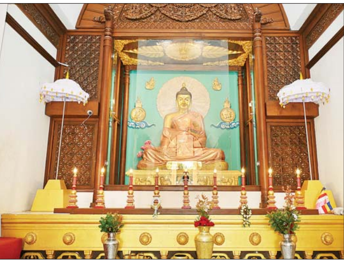
နိုင်ငံတော်စီမံအုပ်ချုပ်ရေးကောင်စီဥက္ကဋ္ဌ နိုင်ငံတော်ဝန်ကြီးချုပ် ဗိုလ်ချုပ်မှူးကြီး မင်းအောင်လှိုင် နေပြည်တော်ဗုဒ္ဓဂယာ သတ္တသတ္တယာ မဟာဗောဓိစေတီတော်မြတ်ကြီး အတွင်းရှိ ဗုဒ္ဓရုပ်ပွားတော်မြတ်အား ဖူးမြော်ကြည့်ညှိစဉ်။