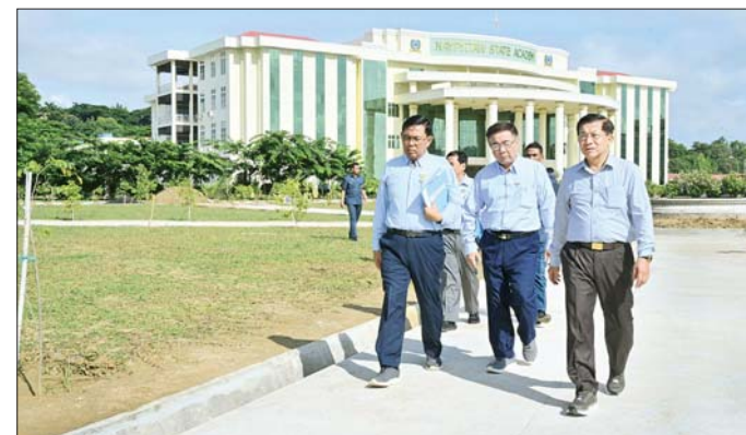
နိုင်ငံတော်စီမံအုပ်ချုပ်ရေးကောင်စီဥက္ကဋ္ဌ နိုင်ငံတော်ဝန်ကြီးချုပ် ဗိုလ်ချုပ်မှူးကြီး မင်းအောင်လှိုင် နေပြည်တော်ရှိ Naypyitaw State Academy တက္ကသိုလ်ပရဝဏ်အတွင်း ကြည့်ရှုစစ်ဆေးစဉ်။

Naypyitaw State Academy သို့ ရောက်ရှိကြပြီး တက္ကသိုလ် ပရဝဏ်အတွင်း ၂၀၂၄ ခုနှစ် ပထမ အကြိမ် မိုးရာသီသစ်ပင်စိုက်ပျိုးပွဲ တွင် စိုက်ပျိုးခဲ့သည့် သစ်ပင် များ ရှင်သန်ဖြစ်ထွန်းလျက်ရှိမှု တက္ကသိုလ်အတွင်း ဘွဲ့နှင်းသဘင် ခန်းမနှင့် စာသင်ဆောင်များ ဆောက်လုပ်လျက်ရှိမှု အခြေ အနေများကို ကြည့်ရှုစစ်ဆေးပြီး ကျောင်းသား ကျောင်းသူများ ပျော်ရွှင်အေးချမ်းစွာဖြင့် ပညာ သင်ကြားနိုင်ရေး တက္ကသိုလ် ပရဝဏ်အတွင်း သန့်ရှင်းသာယာ လှပစေရေး လိုအပ်သည်များကို လမ်းညွှန်မှာကြားသည်။ ထို့နောက် နိုင်ငံတော်စီမံ အုပ်ချုပ်ရေး ကောင်စီဥက္ကဋ္ဌ နိုင်ငံတော်ဝန်ကြီးချုပ်နှင့် အဖွဲ့ဝင် များသည် Naypyitaw State Polytechnic University သို့ ရောက်ရှိကြပြီး ၂၀၂၄ ခုနှစ် ဒုတိယ အကြိမ် မိုးရာသီသစ်ပင်စိုက်ပျိုး ပွဲတွင် စိုက်ပျိုးခဲ့သည့်သစ်ပင် လျက်ရှိမှုနှင့် ဘောလုံးကွင်း တည်ဆောက်နေမှု အခြေအနေ များ ရှင်သန်ဖြစ်ထွန်းလျက်ရှိမှု၊ အဆောက်အဦများ ဆောက်လုပ် များကို လှည့်လည်ကြည့်ရှုစစ်ဆေး