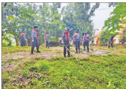
မြန်မာနိုင်ငံရဲတပ်ဖွဲ့နေ့ကို ကြိုဆိုရုတ်ပြုသောအားဖြင့် စက်တင်ဘာ ၇ ရက်က အမှတ်(၂) လုံခြုံရေးရဲတပ်ဖွဲ့၊ တပ်ဖွဲ့ခွဲများနှင့် တပ်ဖွဲ့ဝင်များက ကရင်ပြည်နယ် ဘားအံမြို့၊ မိန့်လှကုန်းကျေးရွာ ဝိဇ္ဇာလင်္ကာရဘုန်းတော်ကြီးကျောင်းဝင်းအတွင်း စုပေါင်းသန့်ရှင်းရေး ဆောင်ရွက်စဉ်။ ခရိုင်(ပြန်/ဆက်)

၂၀၂၄ ခုနှစ် ဝန်ကြီးဌာနပေါင်းစုံ တက္ကသိုလ်များ ဘောလုံးပြိုင်ပွဲ ဗိုလ်လုပွဲကို စက်တင်ဘာ ၉ ရက်ညနေပိုင်းတွင် နေပြည်တော် ဝဏ္ဏသိဒ္ဓိဘောလုံးကွင်း၌ ကျင်းပမည်ဖြစ်ပြီး ဗိုလ်လုပွဲစဉ်အဖြစ် နယ်စပ်ရေးရာဝန်ကြီးဌာန အသင်းနှင့် ပညာရေးဝန်ကြီးဌာနအသင်းတို့ ယှဉ်ပြိုင်ကစားကြမည်ဖြစ်ကြောင်း သိရသည်။ သတင်းစဉ်