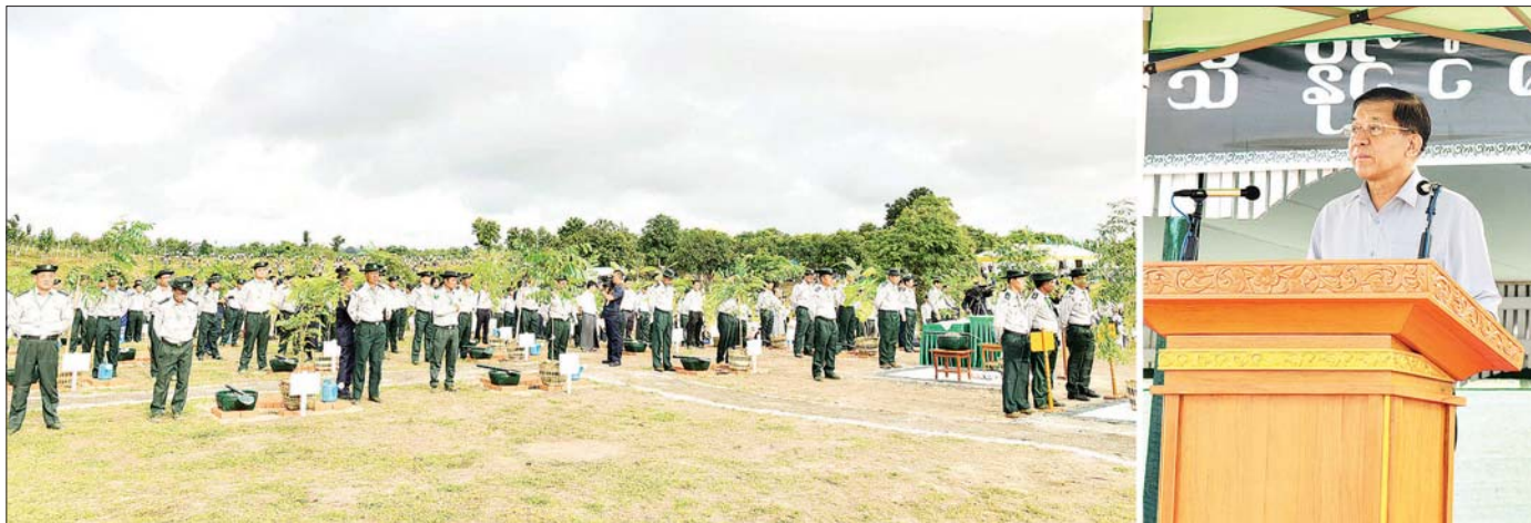
နိုင်ငံတော်စီမံအုပ်ချုပ်ရေးကောင်စီဥက္ကဋ္ဌ နိုင်ငံတော်ဝန်ကြီးချုပ် ဗိုလ်ချုပ်မှူးကြီး မင်းအောင်လှိုင် ပြည်ထောင်စုနယ်မြေ နေပြည်တော် ၂၀၂၄ ခုနှစ် တတိယအကြိမ် မိုးရာသီသစ်ပင်စိုက်ပျိုးပွဲအခမ်းအနားတွင် အမှာစကားပြောကြားစဉ်။

( ၃-၉-၂၀၂၄ ရက်နေ့တွင် နိုင်ငံတော်စီမံအုပ်ချုပ်ရေးကောင်စီဥက္ကဋ္ဌ နိုင်ငံတော်ဝန်ကြီးချုပ် ဗိုလ်ချုပ်မှူးကြီး မင်းအောင်လှိုင် ရှမ်းပြည်နယ်အစိုးရအဖွဲ့ဝင်များ၊ ပြည်နယ်နှင့် ခရိုင်အဆင့်ဌာနဆိုင်ရာတာဝန်ရှိသူများအား ပြောကြားသည့် အမှာစကားမှ ကောက်နုတ်ချက် )