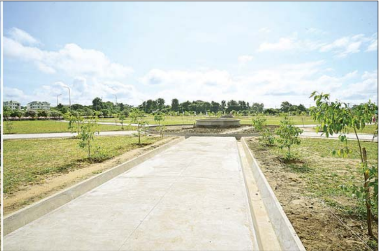
နိုင်ငံတော်စီမံအုပ်ချုပ်ရေးကောင်စီဥက္ကဋ္ဌ နိုင်ငံတော်ဝန်ကြီးချုပ် ဗိုလ်ချုပ်မှူးကြီး မင်းအောင်လှိုင် နေပြည်တော်ရှိ Naypyitaw State Academy တက္ကသိုလ်ပရဝဏ်အတွင်း သစ်ပင်များ ရှင်သန်ဖြစ်ထွန်းလျက် ရှိမှုကို ကြည့်ရှုစစ်ဆေးစဉ်။