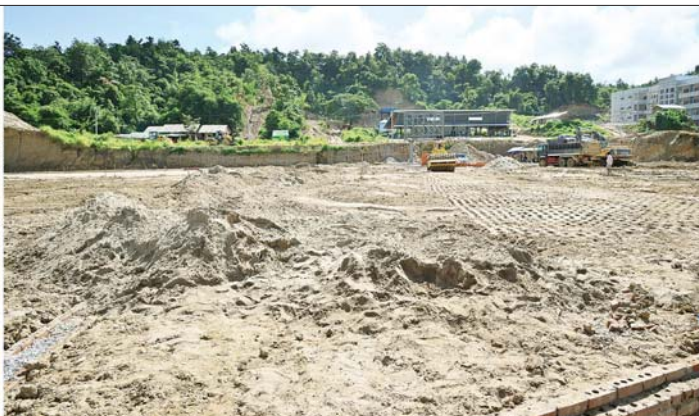
နိုင်ငံတော်စီမံအုပ်ချုပ်ရေးကောင်စီဥက္ကဋ္ဌ နိုင်ငံတော်ဝန်ကြီးချုပ် ဗိုလ်ချုပ်မှူးကြီး မင်းအောင်လှိုင် နေပြည်တော်ရှိ Naypyitaw State Polytechnic University ပရဝဏ်အတွင်း အဆောက်အဦများ ဆောက်လုပ်လျက်ရှိမှုနှင့် ဘောလုံးကွင်းတည်ဆောက်နေမှုအခြေအနေကို ကြည့်ရှုစစ်ဆေးစဉ်။