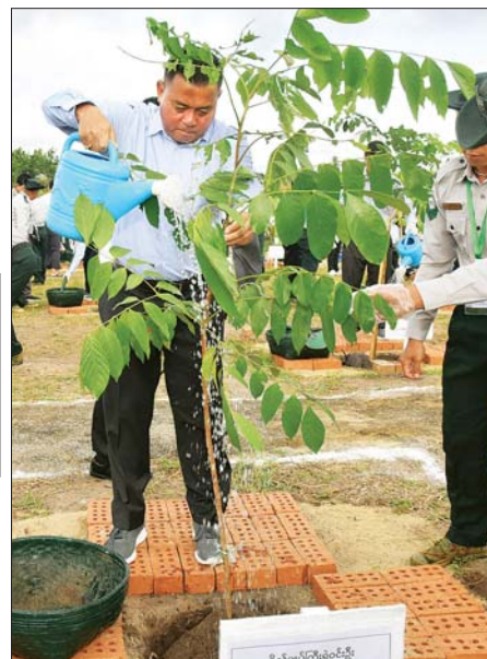
နိုင်ငံတော်စီမံအုပ်ချုပ်ရေးကောင်စီ တွဲဖက်အတွင်းရေးမှူး ဗိုလ်ချုပ်ကြီး ရဲဝင်းဦး ပျိုးပင်ကို စိုက်ပျိုးပေးစဉ်။

ကာလ၏ အမွေအနှစ်၊ ပစ္စုပ္ပန် အကျိုးစီးပွားနှင့် အနာဂတ်ဖွံ့ဖြိုး မှု” ဟု ဆိုသည့်အတိုင်း သဘာဝ သယံဇာတအမွေအနှစ်ဖြစ်သည့် သစ်တောများကို အားလုံးပိုင်းဝန်း ထိန်းသိမ်းပြုစုစောင့်ရှောက်မှုသာ နောင်သားစဉ် မြေးဆက်အတွက် စိမ်းလန်းစိုပြည်ပြီး သဘာဝအရင်း အမြစ်များက ကြွယ်ဝသည့် ပတ်ဝန်းကျင်ကောင်း တစ်ခုကို လက်ဆင့်ကမ်းပေးနိုင်မည် ဖြစ်ကြောင်း။