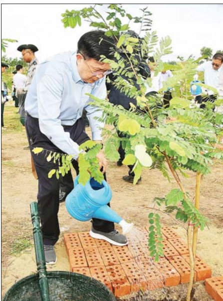
နိုင်ငံတော်စီမံအုပ်ချုပ်ရေးကောင်စီအတွင်းရေးမှူး ဗိုလ်ချုပ်ကြီး အောင်လင်းဌေး ပျိုးပင်ကို စိုက်ပျိုးပေးစဉ်။

❖ ယနေပြုလုပ်သည့် သစ်ပင်စိုက်ပျိုးပွဲတွင် သစ်မျိုး ၁၅ မျိုး၊ အပင်ပေါင်း ၃၀၀၀ ကို စိုက်ပျိုးခဲ့ခြင်းဖြစ်။ နိုင်ငံတော်စီမံအုပ်ချုပ်ရေးကောင်စီ တာဝန်ယူခဲ့သည့် ၂၀၂၂ ခုနှစ်မှ ယနေ့အထိ နိုင်ငံအဆင့် သစ်ပင်စိုက်ပွဲ တော် ၁၀ ကြိမ်၊ စိုက်ပင်ပေါင်း ၁၇၆၇၇ ပင်၊ နိုင်ငံနှင့် အဝန်း သစ်ပင်စိုက်ပွဲတော် ၁၅၀၀ ကြိမ်၊ စိုက်ပင်ပေါင်း ၁၅၆၇၇ ပင်၊ နိုင်ငံနှင့် အဝန်း သစ်ပင်ပေါင်း ၂၂ ဒသမ ၈၅၆ သန်းကို စိုက်ပျိုးတည်ထောင်နိုင်ခဲ့