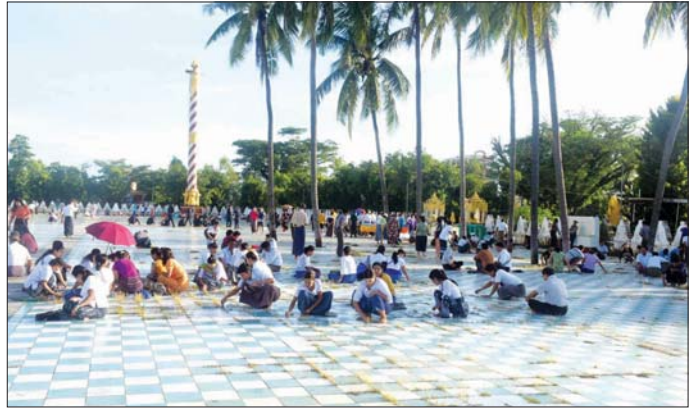
စေတီတော်ပတ်ဝန်းကျင် သန့်ရှင်းသယာဇာတရေးအတွက် စုပေါင်းသန့်ရှင်းရေး ဆောင်ရွက်ကြစဉ်။