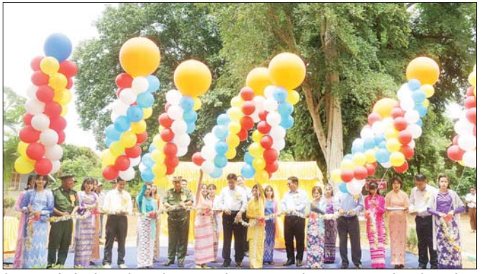
ရှိ သွေးသန့်စင်စင်ဆေးဝါးများကို စေတနာ့ရင်း ပေ ၂၀၀ နှင့် 200 KW ထရပ်စဖော်မာတစ်လုံး အလှူရှင်များက စုပေါင်းလှူဒါန်းခြင်းဖြစ်ပြီး မကွေး ငွေကျပ်အားဖြင့် ၇၉ ဒသမ ၁ သန်းကို ထောက်ပံ့ကူညီ တိုင်းဒေသကြီး အစိုးရအဖွဲ့က 11 KV ဓာတ်အားလိုင်း ပေးခဲ့ကြောင်း သိရသည်။ နောင်နောင်(ဗိသုဒ္ဓိ/မြေ)

ငှက်ပစ်တောင် ကျောက်ကပ်သွေးသန့်စင်စင်တာ နှင့်ပတ်သက်၍ ရှင်းလင်းတင်ပြသည်။ ထို့နောက် တိုင်းဒေသကြီး ဝန်ကြီးချုပ်နှင့် အဖွဲ့ဝင်များသည် ငှက်ပစ်တောင်ကျောင်းတိုက်အတွင်း ရှိ ဘိုးဘွားရိပ်သာသို့ရောက်ရှိပြီး သက်ကြီးဘိုးဘွားများအား အားပေးစကားပြောကြားကာ အလှူငွေများ လက်ဝယ်အရောက် ပေးအပ်လှူဒါန်းသည်။ ယနေ့ဖွင့်လှစ်သည့် ငှက်ပစ်တောင်ကျောက်ကပ်သွေးသန့်စင်စင်တာ ဆောက်လုပ်မည့် အလျား ၁၅၅ ပေ အနံပေ ၁၂၀ ရှိ မြေနေရာအား မကွေးတိုင်းဒေသကြီး သံဃနာယကအဖွဲ့ အကျိုးတော်ဆောင် ငှက်ပစ်တောင်ဆရာတော်ကြီးက လှူဒါန်းခြင်းဖြစ်ပြီး အလျား ၄၇ ပေ၊ အနံပေ ၄၀၊ အမြင့် ၁၃ ပေရှိ ကွန်ကရစ်အဆောက်အအုံကို ငွေကျပ်သိန်းပေါင်း ၉၀၀ ဖြင့်လည်းကောင်း၊ တစ်လုံးလျှင် ငွေကျပ်သိန်း ၃၅၀ တန်ဖိုးရှိ သွေးသန့်စင်စင်စင်စင်လုံး၊ ငွေကျပ်သိန်းပေါင်း ၅၆၀ တန်ဖိုးရှိ ရေသန့်စင်စင်၊ ငွေကျပ်သိန်း ၉၀၀ တန်ဖိုး