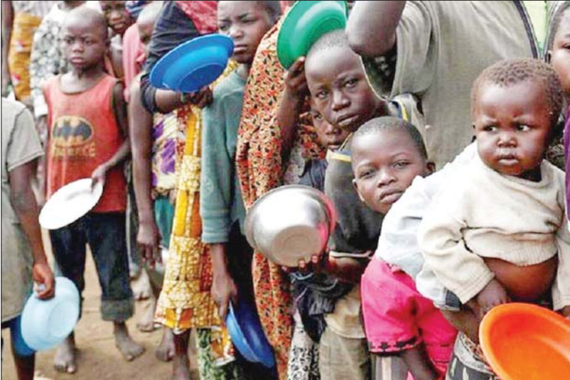
အစားအစာရရှိရေးအတွက် တနံးစီစောင့်ဆိုင်းနေသည့် ကလေးငယ်များ။

မိုး ခေါင်ခြင်း မြေအောက်ရေ ခန်းခြောက်လာခြင်း၊ မြေဆီလွှာ ခန်းခြောက်လာခြင်းတို့သာမက ရေကြီး ရေလျှံမှုတွေ ဖြစ်ပေါ်ခြင်း၊ ရေခဲမြစ်တွေ အရည်ပျော်ခြင်း၊ အင်အားပြင်းတဲ့ မုန်တိုင်းတွေ၊ ငလျင်တွေ ဖြစ်ပေါ်လာ ခြင်း၊ အပူချိန်မြင့်တက်ခြင်း၊ တောမီး လောင်ကျွမ်းခြင်း စတဲ့ရာသီဥတုတော် ပြန်ပြောင်းလဲမှုဖြစ်စဉ်တွေက လောက လူသားတွေအပေါ် ဆိုးကျိုးများစွာကို ဖြစ်ပေါ်စေပါတယ်။