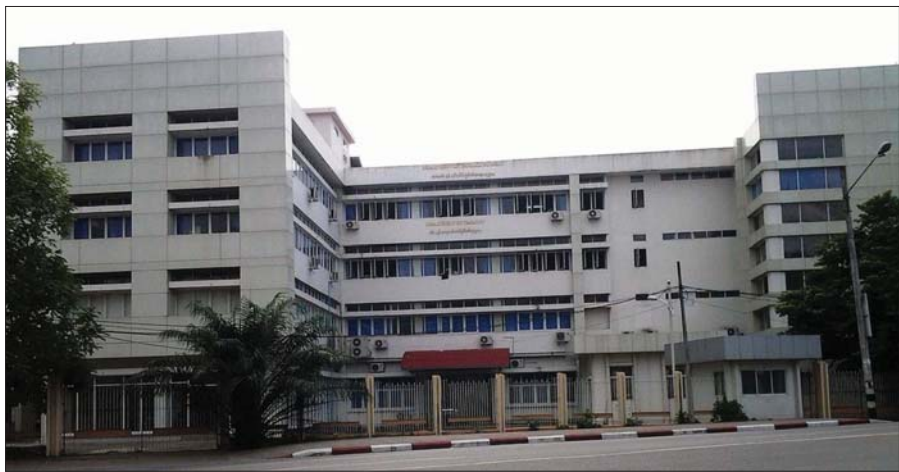
လမ်းမတော်မြို့နယ် မင်းရဲကျော်စွာလမ်းရှိ ခုတင်(၅၀၀) အထူးကုဆေးရုံကြီး(ရန်ကုန်)။

“ရှင်တို့က ကျွန်ုပ်တို့ကို အားမကင်းဘူးပေါ့” “အားကင်းပါတယ် ဆရာမရယ်” “ဒီလူနာကို အရင်က ကျွန်ုပ်တို့ဆေးရုံမှာပဲ ကုပေးခဲ့တာလေ။ ဘယ်လိုဖြစ်လို့ အပြင်ဆေးရုံရောက်သွားတာတုန်း။ ပိုက်ဆံတွေ တော်တော်ပေါ့တယ်ပေါ့” “မပေါ့ပါဘူး ဆရာမရယ်။ ချေးငွားပြီးတက်ရတာပါ။ အခုဒီဆေးရုံမှာပဲ ပြန်တက်ချင်လို့ပါ” “ကဲ၊ ကဲ။ ဆေးရုံတက်ဖို့ ကျွန်မ ဆေးစာရေးပေးလိုက်မယ်နော်” လူနာရှင်မိဘနှစ်ပါး၏ မျက်နှာများကား ဝင်းလက်သွားသည်။ သူတို့ကား ကျောက်ကပ်ဝေဒနာရှင် သမီးငယ်ကို ဆေးဝါးကုသရန် မကွေးမြို့ ရှာနီးချုပ်စစ်ကျေးရွာတစ်ရွာမှ လာရောက်ခဲ့ကြသူများ ဖြစ်သည်။ ရန်ကုန်မြို့ရှိ ဆေးရုံကြီးတစ်ခုသို့ ဘုန်းတော်ကြီးကျောင်းတွင် ခေတ္တတည်းခိုပြီး ပြင်ပအထူးကုဆေးရုံတစ်ရုံတွင် ဆေးရုံတက်ရောက် ကုသရာမှ နှစ်ပတ်ခန့်ကြာတော့ ငွေကြေးမတတ်နိုင်တော့၍ ယခု ခုတင်(၅၀၀) အထူးကုဆေးရုံကြီးသို့ တစ်ကျော့ပြန်ပြန်ခြင်း ဖြစ်ကြောင်း သိရသည်။ သို့ဖြင့် ဆေးရုံက သူတို့ကို ပြန်လက်မခံ မှာကို စိုးရိမ်ကြောင့်ကြနော့ရာမှ တာဝန်ကျဆရာဝန်မ၏ ရယ်ရယ် မောမော နောက်နောင်ပြောင်ပြောင်လို့ လိုက်လံပျံ့ငှာစွာ လက်ခံပေးမှု ကြောင့် စိတ်သက်သာရာ ရသွားခဲ့ကြလေသည်။