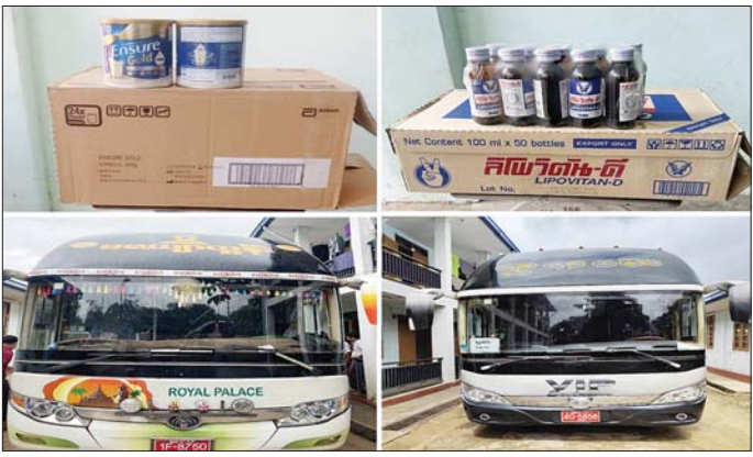
နိုင်ငံခြား မရှိသည့် ထိုင်းနိုင်ငံထုတ် Lipovitan-D အားဖြည့်အချိုရည် ပုလင်း ၅၂၀၀၀ ၊ Ensure Gold Vanilla ဘူး ၃၆၀ ၊ Feline Pro ကြော့ဇာ ၂၀ ကီလိုဂရမ်ပါ ၁၀ အိတ် အပါအဝင် ကုန်ပစ္စည်းခြောက်မျိုး (ခန့်မှန်းတန်ဖိုး ၂၆၀၀၀၀) နှင့် အဆိုပါပစ္စည်းများ တင်ဆောင်လာသည့် Yutong Bus နှစ်စီးနှင့် Scania Bus တစ်စီး (ခန့်မှန်းတန်ဖိုး ၂၂၀၀၀၀၀) ကို အကောက်ခွန်လုပ်ထုံးလုပ်နည်းများ အရလည်းကောင်း (အပေါ်ပုံ)၊ ပဲခူးခရိုင်နှင့် ပြည်ခရိုင်အတွင်း၌ တရားမဝင် ကျွန်းသစ် ၂ ဒဿမ ၀၅၈ တန်နှင့် သစ်မာ ၁ ဒဿမ ၀၇၂၆ တန်၊ အထူးအဖွဲ့၏ စီမံခန့်ခွဲမှုဖြင့် တာဝန်ကျပူးပေါင်းအဖွဲ့က စစ်ဆေးမှုများ ဆောင်ရွက်ခဲ့ရာ ဘုရားကြီးမြို့နယ်၊ မော်လမြိုင်မြို့မှ ရန်ကုန်မြို့သို့ မောင်းနှင်လာသည့် မော်တော်ယာဉ်တစ်စီး၊ ဘားအံမြို့မှ မန္တလေးမြို့သို့ မောင်းနှင်လာသော မော်တော်ယာဉ် တစ်စီးနှင့် မော်လမြိုင်မြို့မှ မန္တလေးမြို့သို့ မောင်းနှင်လာသော မော်တော်ယာဉ် တစ်စီးတို့ပေါ်မှ တရားမဝင်စာရွက်စာတမ်းအထောက်အထား တင်ပြနိုင်ခြင်း မရှိသည့် ထိုင်းနိုင်ငံထုတ် Mitsubish Fuso Truck တစ်စီး (ခန့်မှန်းတန်ဖိုး ၃၀၀၀၀၀) ကိုလည်းကောင်း၊ ကျွဲတပ်ဆုံစစ်ဆေးရေးစခန်း၌ တရားမဝင် စာရွက်စာတမ်းအထောက်အထား တင်ပြနိုင်ခြင်း မရှိသည့် အိန္ဒိယနိုင်ငံထုတ် ဆေးဝါး Merosafe Powder for Injection ပိုးသတ်ဆေး ဘူး ၁၃၃၈၀ အပါအဝင် ဆေးဝါး နှစ်မျိုး (ခန့်မှန်းတန်ဖိုး ၇၅၀၀၀) ကိုလည်းကောင်း စုစုပေါင်း ခန့်မှန်းတန်ဖိုး ၃၂၅၀၀၀ ကို ဖမ်းဆီးရမိခဲ့ပြီး အကောက်ခွန်လုပ်ထုံးလုပ်နည်းများနှင့်အညီ အရေးယူဆောင်ရွက်လျက်ရှိသည်။

နေပြည်တော် ဩဂုတ် ၁၇ တရားမဝင်ကုန်သွယ်မှု တိုက်ဖျက်ရေးဦးဆောင်ကော်မတီ၏ ကြီးကြပ်ကွပ်ကဲမှုဖြင့် တရားမဝင်ကုန်သွယ်မှုများကို ဥပဒေနှင့်အညီ ထိရောက်စွာ တားဆီးအရေးယူနိုင်ရေး ဆောင်ရွက်လျက်ရှိရာ ဩဂုတ် ၁၅ ရက်တွင် အကောက်ခွန်ဦးစီးဌာန၏ စီမံခန့်ခွဲမှုဖြင့် တာဝန်ကျပူးပေါင်းအဖွဲ့များက စစ်ဆေးမှုများ ဆောင်ရွက်ရာတွင် မရမ်းချောင်းမြို့နယ်၊ စစ်ဆေးရေးစခန်း၌ မော်လမြိုင်မြို့မှ ရန်ကုန်မြို့သို့ မောင်းနှင်လာသော မော်တော်ယာဉ် တစ်စီးပေါ်မှ တရားမဝင်စာရွက်စာတမ်းအထောက်အထား တင်ပြနိုင်ခြင်း မရှိသည့် ထိုင်းနိုင်ငံထုတ် Lipovitan-D အားဖြည့်အချိုရည် ပုလင်း ၅၂၅၀ (ခန့်မှန်းတန်ဖိုး ၄၅၀၀၀) နှင့် အဆိုပါပစ္စည်းများ တင်ဆောင်လာသည့် Sunlong Bus တစ်စီး (ခန့်မှန်းတန်ဖိုး ၄၅၀၀၀၀) ကိုလည်းကောင်း၊ ရန်ကုန်အပြည်ပြည်ဆိုင်ရာလေဆိပ်၌ ခရီးသည်တစ်ဦး၏ ဝန်ဆောင်ခအတွင်းမှ တရားမဝင်စာရွက်စာတမ်းအထောက်အထား တင်ပြနိုင်ခြင်း မရှိသည့် ရေခဲခွက်တစ်ခု ၂၅၀၀ လုံး အပါအဝင် ကုန်ပစ္စည်းသုံးမျိုး (ခန့်မှန်းတန်ဖိုး ၁၆၀၀၀၀) ကိုလည်းကောင်း စုစုပေါင်း ခန့်မှန်းတန်ဖိုး ၅၆၀၀၀၀ ကို ဖမ်းဆီးရမိခဲ့ပြီး အကောက်ခွန်လုပ်ထုံးလုပ်နည်းများနှင့်အညီ အရေးယူဆောင်ရွက်လျက်ရှိသည်။