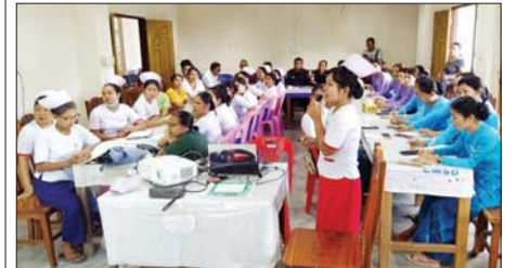
ဆေးတိုက်ကျွေးခြင်း

တနင်္သာရီတိုင်းဒေသကြီး ပြည်သူ့ကျန်းမာရေးဦးစီးဌာနက ကြီးမှူး၍ ၂၀၂၄ ပြည့်နှစ်တွင် မြန်မာတစ်နိုင်ငံလုံး ဆင်ခြေထောက်ရောဂါမှ ကင်းဝေးစေရန် ရည်ရွယ်လျက်ရှိကြောင်း မှတ်တမ်းတင် ကူးစက်ဖြစ်ပွားတတ်သည့် ဆင်ခြေထောက်ရောဂါ ကင်းဝေးစေရေး လူအားလုံး ဆေးတိုက်ကျွေးခြင်းလုပ်ငန်းကို မြို့နယ်ဆေးတိုက်အဖွဲ့ ၁၀ ဖွဲ့ဖြင့် ချောင်းကြီးရပ်ကွက်အတွင်း လိုက်လံဆေးတိုက်ကျွေးခြင်းကို ယမန်နေ့ ညနေပိုင်းက ဆောင်ရွက်သည်။ ထိုသို့ တိုက်ကျွေးစဉ်တွင် ဆင်ခြေထောက်ရောဂါ ကာကွယ်ဆေး သောက်ခြင်း၏အကျိုးကျေးဇူးနှင့် ဘေးထွက်ဆိုးကျိုးများအကြောင်းကို ပညာပေးဆွေးနွေးပေးကြပြီး တစ်ဖွဲ့လျှင် တစ်ရက် အိမ်ခြေ ၅၀ နှုန်းဖြင့် သုံးရက်ကြာ ဆေးတိုက်ကျွေးပေးကြမည်ဖြစ်ကြောင်း သိရသည်။ အဆိုပါဆေးတိုက်အဖွဲ့များအား ပြည်သူ့ကျန်းမာရေးဦးစီးဌာနမှူး ဒေါက်တာနွေးဟောမသင်းက ဆင်ခြေထောက်ဆေး တိုက်ကျွေးခြင်း လုပ်ငန်းဆိုင်ရာသင်တန်းကို ဖွင့်လှစ်ပို့ချပေးခဲ့ပြီး ဆေးတိုက်အဖွဲ့ ဖွဲ့စည်းခြင်းနှင့် ဆေးတိုက်ကျွေးခြင်းစာရင်း မှတ်တမ်းပုံစံပြည့်စွက်နည်းများကို ဆွေးနွေးပို့ချပေးပြီးဖြစ်ကြောင်း သိရသည်။ နန်းသာရီ-ထိန်ဝင်း(ပြန်/ဆက်)