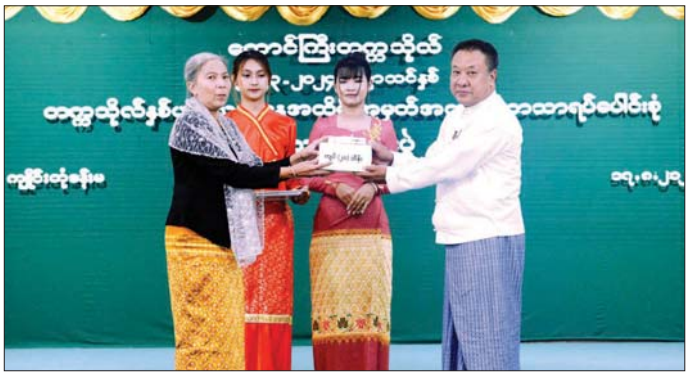
ဆောင်တွင် ကျောင်းသား ကျောင်းသူ ၂၈ ဦးက လှူဒါန်းပေးအား အာဟာရဖြည့်စွက်စာများ ထောက်ပံ့ပေးအပ်ခဲ့ကြောင်း သိရသည်။ အဖွဲ့က သွေးရောက်ကြည့်ရှုအေးပေးခဲ့ပြီး သွေးခရိုင်(ပြန်/ဆက်)

ဦးစွာ ပြည်နယ်စီးပွားရေးရာဝန်ကြီး ဦးခွန်သိန်း မောင်က သွေးလှူဒါန်းခြင်းသည် လူ့အသက်ပေါင်းများစွာကို ကယ်တင်နိုင်သည့် မွန်မြတ်သော အလှူဒါနတစ်ခုဖြစ်ကြောင်း၊ သွေးလှူဒါန်းခြင်းသည် သွေးလုံအပ်သော အခြားသူတစ်ယောက်အား ကူညီပေးရုံမက လှူဒါန်းသည့် သွေးအလှူရှင်များအတွက် ကျန်းမာရေးအကျိုးကျေးဇူးများလည်း ရရှိနိုင်သည့် အပြင် စိတ်ပိုင်းဆိုင်ရာ ကျန်းမာရေးကိုပါ အထောက်အကူပြုကြောင်း ပြောကြားပြီး ရှိပြီးပြည်နယ်အစိုးရအဖွဲ့က ပေးအပ်သည့် ထောက်ပံ့ချီးမြှင့်ငွေ ကျပ်သိန်း ၂၀ ကို ပေးအပ်လှူဒါန်းသည်။ (ယာပုံ)