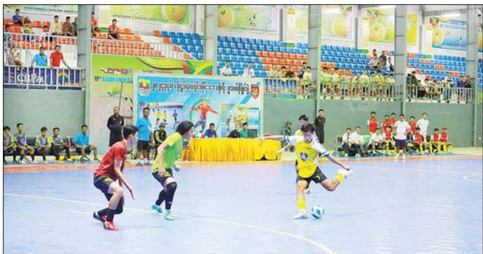
အဖြစ် ရန်ကုန်တိုင်းဒေသကြီးကချင်ပြည်နယ် အသင်းတို့ စိတ်ပါဝင်စားသည့် မည်သူမဆို အသင်းနှင့် ရှမ်းပြည်နယ်အသင်း ဆက်လက် ယှဉ်ပြိုင်ကစားသွား အခမဲ့လာရောက်ကြည့်ရှုအားပေးပဲခူးတိုင်းဒေသကြီးအသင်းနှင့် မည်ဖြစ်၍ ဖူဆယ်အားကစားကွင်း နိုင်ကြောင်း သိရသည်။ သတင်းစဉ်

နေပြည်တော် ဩဂုတ် ၁၇ ၂၀၂၄ ခုနှစ် ပြည်နယ်နှင့်တိုင်းဒေသကြီး ဖူဆယ် (အမျိုးသား/အမျိုးသမီး) ပြိုင်ပွဲ ကွာတားဗိုင်းနယ်ပွဲစဉ်များကို ယနေ့နံနက် ၈ နာရီမှ စတင်၍ ဝဏ္ဏသိဒ္ဓိ အားကစားကွင်းရှိ ဖူဆယ်အားကစားရုံ၌ ကျင်းပသည်။ ရှမ်းပြည်နယ်အသင်းက ရခိုင်ပြည်နယ်အသင်းကို သုံးဂိုး-တစ်ဂိုးဖြင့်လည်းကောင်း၊ ကချင်ပြည်နယ် အသင်းက ဝဏ္ဏသိဒ္ဓိ အသင်းကို ခြောက်ဂိုး-နှစ်ဂိုးဖြင့် လည်းကောင်း၊ (အမျိုးသမီး)ကွာတားဗိုင်းနယ်ပြိုင်ပွဲစဉ်တွင် စစ်ကိုင်းတိုင်းဒေသကြီးအသင်းက ပြည်ထောင်စုနယ်မြေ နေပြည်တော်အသင်းကို ခုနစ်ဂိုး-ခြောက်ဂိုးဖြင့်လည်းကောင်း၊ ရန်ကုန်တိုင်းဒေသကြီးအသင်းက တနင်္သာရီတိုင်းဒေသကြီးအသင်းကို ခြောက်ဂိုး-တစ်ဂိုးဖြင့် လည်းကောင်း၊ ရှမ်းပြည်နယ်အသင်းက တနင်္သာရီတိုင်းဒေသကြီးအသင်းကို ခြောက်ဂိုး-တစ်ဂိုးဖြင့် လည်းကောင်း၊