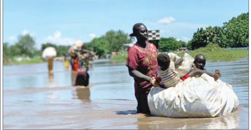
ရေကြီးရေလျှံမှုကြောင့် ဘေးလွတ်ရာသို့ ပြောင်းရွှေ့နေသူများကို တွေ့ရစဉ်။

ဆူဒန်နိုင်ငံမှာ ပဋိပက္ခဖြစ်ပွားတဲ့ ယမန်နှစ် ဧပြီလကတည်းက နေရပ်ပြန်နဲ့ ဒုက္ခသည်ပေါင်း ၇၇၀၀၀ ကျော်ဟာ နယ်စပ်ကို ဖြတ်ကျော်ကာ တောင်ဆူဒန် နိုင်ငံထဲသို့ ထွက်ပြေးလာကြတယ်လို့ လည်း အိုစီအိတ်ချ်အေက မှတ်ချက်ပြု ပြောကြားထားပါတယ်။ ကိုးကား - ဆင်ယူ