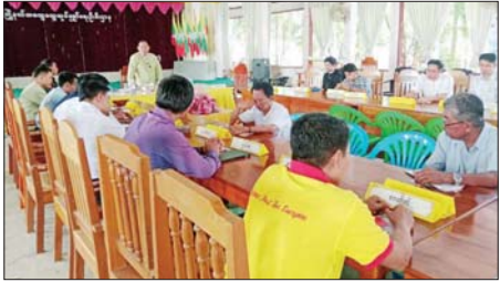
အစည်းအဝေးတွင် မြို့နယ်

တနင်္သာရီတိုင်းဒေသကြီး သရက်ချောင်းမြို့နယ်၌ (၂၅) ကြိမ်မြောက် ငွေရတုအထိမ်းအမှတ် မြန်မာ့ရိုးရာယဉ်ကျေးမှု အဆို၊ အက၊ အရေး၊ အတီး (မြို့နယ်အဆင့်) ပြိုင်ပွဲကျင်းပရေးဦးစီးကော်မတီနှင့် လုပ်ငန်းကော်မတီဝင် ဌာနဆိုင်ရာ တာဝန်ရှိသူများက လုပ်ငန်းညှိနှိုင်းအစည်းအဝေးကို ယမန်နေ့က မြို့နယ်အထွေထွေအုပ်ချုပ်ရေးဦးစီးဌာနအစည်းအဝေးခန်းမ၌ ကျင်းပသည်။ အစည်းအဝေးတွင် မြို့နယ်