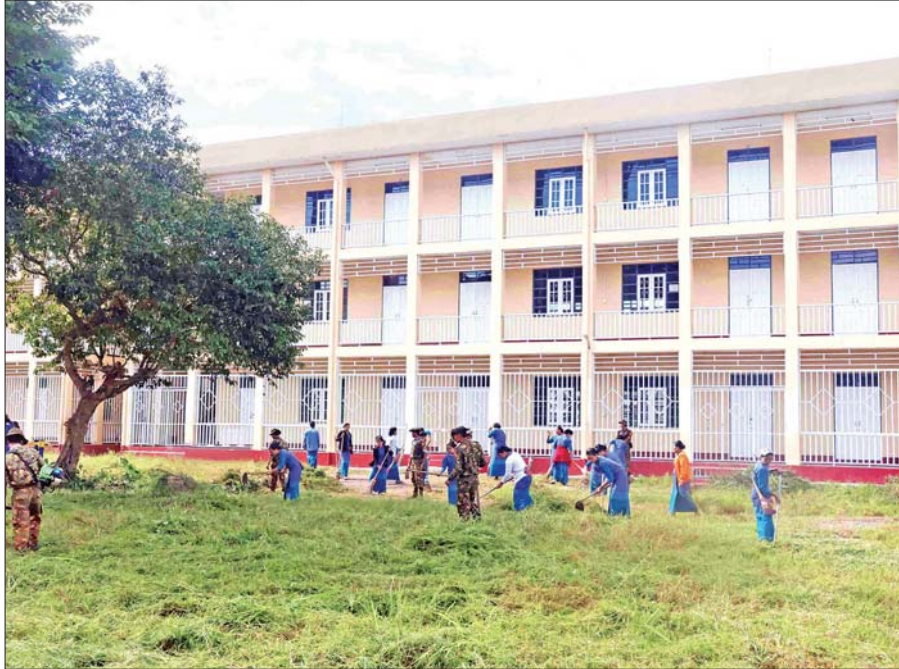
လွိုင်ကော်ပညာရေးဒီဂရီကောလိပ်ကျောင်းဝင်းအတွင်း သန့်ရှင်းသာယာလှပရေး စုပေါင်းသန့်ရှင်းရေးဆောင်ရွက်နေမှုကို တွေ့ရစဉ်။