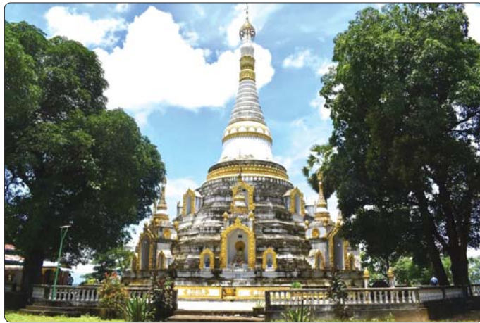
လှိုင်းဘွဲ့မြို့နယ် ကျောက်တောင်ကျေးရွာရှိ ဖောင်တော်ဦးစေတီတော်။

ဘားအံမြို့မှာ လည်ပတ်စရာနေရာတွေက များပြားလှပါတယ်။ အမျိုးအစားစုံလင်လှတဲ့ ခရီးစဉ်တွေရှိတာမို့ ကြိုက်နှစ်သက်ရာ ခရီးစဉ်တွေကို