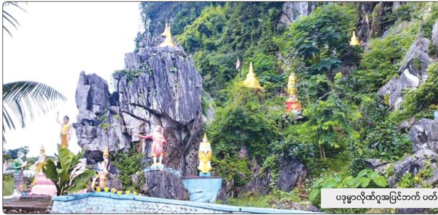
ပဒုမ္မာလိုဏ်ဂူအပြင်ဘက် ပတ်ဝန်းကျင်မှ ဘုရားစေတီများ။