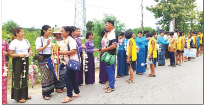
အဆိုပါ ကြိုဆိုခဲ့ကြသည်။ ထို့နောက် ပဲခူးတိုင်းဒေသကြီး ဝန်ကြီးချုပ်ဖလား အမျိုးသား အမျိုးသမီး ပြေးခုန်ပစ်ပြိုင်ပွဲတွင် ရွှေတောင် မြို့နယ်မှ ရွှေတံဆိပ်ဆု ၁၀ ဆု၊ ငွေတံဆိပ်ဆု ခြောက်ဆုနှင့် ကြေးတံဆိပ်ဆု တစ်ဆု၊ အမျိုးသား တံခွန်စိုက်ဆုဖလားနှင့် အမျိုးသမီး တံခွန်စိုက် ဒုတိယဆုရရှိခဲ့သဖြင့် ကျောင်းသား ကျောင်းသူများအား ခရိုင်စီမံအုပ်ချုပ်ရေးအဖွဲ့ဥက္ကဋ္ဌနှင့် မြို့နယ်စီမံအုပ်ချုပ်ရေးအဖွဲ့ဥက္ကဋ္ဌတို့က ဂုဏ်ပြုချီးမြှင့်ငွေများ ပေးအပ်ခဲ့ကြောင်း သိရသည်။ ကိုကိုမင်း(ပြန်/ဆက်)

ပဲခူးတိုင်းဒေသကြီး ပြည်ခရိုင် ရွှေတောင်မြို့နယ်၌ ၂၀၂၄ ခုနှစ် ပဲခူးတိုင်းဒေသကြီး ဝန်ကြီးချုပ်ဖလား ၂၈ မြို့နယ်နှင့် တက္ကသိုလ်များ၊ ပညာရေးဒီဂရီကောလိပ်များ၊ အသက် ၁၈ နှစ်အောက်နှင့် အသက် ၂၀ နှစ်အောက် အမျိုးသား အမျိုးသမီး ပြေးခုန်ပစ်ပြိုင်ပွဲတွင် ပြည်ခရိုင် ကိုယ်စားပြု ရွှေတောင်မြို့နယ်မှ ဆုရ ကျောင်းသား ကျောင်းသူများအား ယမန်နေ့ နေ့လယ်ပိုင်းက ဂုဏ်ပြုကြိုဆိုကြသည်။ (အောက်ပုံ)