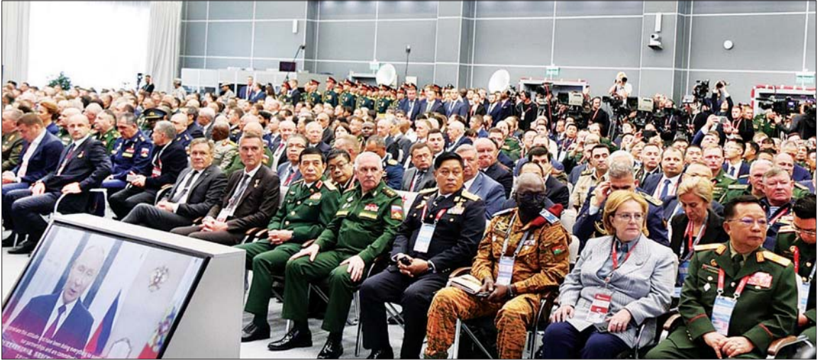
နိုင်ငံတော်စီမံအုပ်ချုပ်ရေးကောင်စီအဖွဲ့ဝင်၊ ဒုတိယဝန်ကြီးချုပ်နှင့် ပြည်ထောင်စုဝန်ကြီး ဗိုလ်ချုပ်ကြီး တင်အောင်စန်း နိုင်ငံတကာစစ်ဘက်နည်းပညာဖိုရမ် (International Military Technical Forum) (ARMY-2024) ဖွင့်ပွဲအခမ်းအနားနှင့် မျက်နှာစုံညီအစည်းအဝေးသို့ တက်ရောက်စဉ်။

နေပြည်တော် ဩဂုတ် ၁၇ နိုင်ငံတော်စီမံအုပ်ချုပ်ရေးကောင်စီ အဖွဲ့ဝင်၊ ဒုတိယဝန်ကြီးချုပ် နှင့် ကာကွယ်ရေးဝန်ကြီးဌာန ပြည်ထောင်စုဝန်ကြီး ဗိုလ်ချုပ်ကြီး တင်အောင်စန်း ဦးဆောင်သည့် ကိုယ်စားလှယ်အဖွဲ့သည် ရုရှား ဖက်ဒရေးရှင်းနိုင်ငံ မော်စကိုမြို့ ကျင်းပသော နိုင်ငံတကာ စစ်ဘက် နည်းပညာဖိုရမ် (International Military Technical Forum) (ARMY-2024) သို့ တက်ရောက်ခဲ့ပြီး ယမန်နေ့ ညပိုင်းတွင် ရုရှား ဖက်ဒရေးရှင်းနိုင်ငံမှ ရန်ကုန်မြို့သို့ လေကြောင်းခရီးဖြင့် ပြန်လည်ရောက်ရှိရာ ရန်ကုန်တိုင်းဒေသကြီး ဝန်ကြီးချုပ် ဦးစိုးသိန်း၊ ရန်ကုန်တိုင်း စစ်ဌာနချုပ်တိုင်းမှူး ဗိုလ်ချုပ် ဇော်ဟိန်း၊ တပ်မတော် အရာရှိကြီးများ၊ မြန်မာနိုင်ငံ