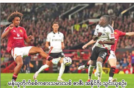
မန်ယူတိုက်စစ်ကစားသမားသစ် ဇာဇီး အနိုင်ရိုး သွင်းယူစဉ်။

ပရီမီယာလိဂ်ပွဲစဉ် (၁) မှ ဩဂုတ် ၁၇ ရက် ညနေ ၆ နာရီက တန်းတက် အစ်ဆွစ်အသင်းနှင့် လီဗာပူးအသင်းတို့ ယှဉ်ပြိုင်ကစားခဲ့ရာ လီဗာပူးအသင်းက နှစ်ဂိုးဖြတ်အနိုင်ရရှိခဲ့သည်။ လီဗာပူးအသင်းအတွက် သွင်းဂိုးများကို ဂျီတာနှင့် ဆာလာတို့က သွင်းယူပေးခဲ့သည်။ လီဗာပူးအသင်းသည် အစ်ဆွစ်အသင်းကို ဂိုးကန်သွင်းမှုအသားဖြင့် ခြေစွမ်းအသာဖြင့် ပွဲချိန်အများစု ဖိအားပေးကစားနိုင်ခဲ့သည်။ အစ်ဆွစ်အသင်းက စာမျက်နှာ ၁၅ ကော်လံ ၁ ❖