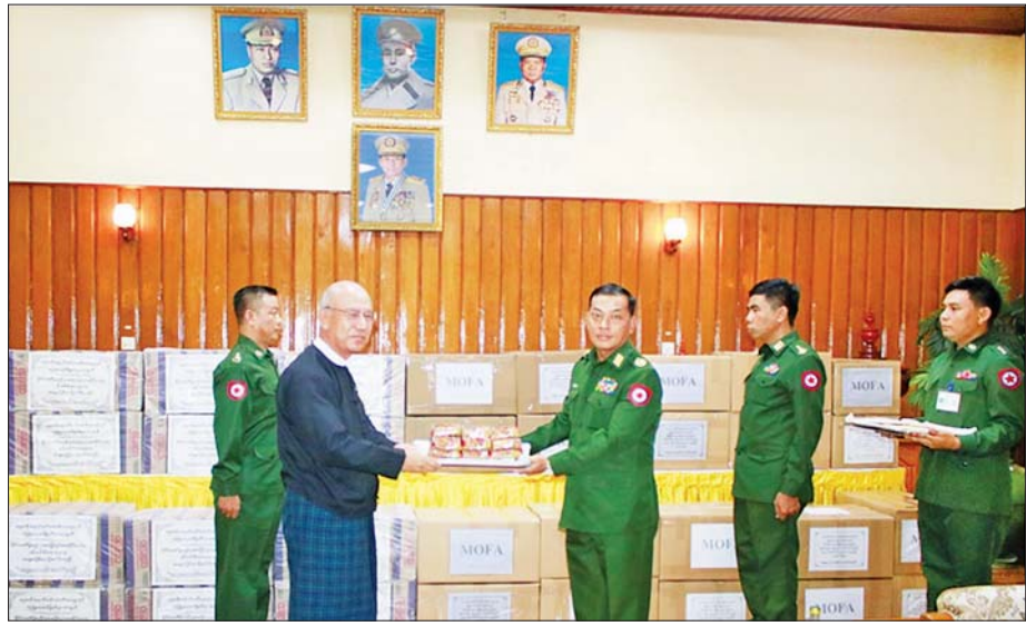
နိုင်ငံတော်ဖွဲ့စည်းပုံအခြေခံဥပဒေဆိုင်ရာခုံရုံးဥက္ကဋ္ဌက လုံခြုံရေးတပ်ဖွဲ့ဝင်များအတွက် အလှူငွေနှင့်စားသောက်ဖွယ်ရာများ ဂုဏ်ပြုပေးအပ်စဉ်။

ထိုသို့ ပေးအပ်လျက်ရှိရာ ဩဂုတ် ၁၅ ရက် မွန်းလွဲပိုင်းတွင် နိုင်ငံတော်ဖွဲ့စည်းပုံ အခြေခံ ဥပဒေဆိုင်ရာခုံရုံးနှင့် နိုင်ငံခြားရေး ဝန်ကြီးဌာန ဝန်ထမ်းမိသားစုများမှ ဂုဏ်ပြုချီးမြှင့်ငွေများနှင့် စားသောက်ဖွယ်ရာများ ဂုဏ်ပြုပေးအပ်ခြင်းကို နေပြည်တော် တိုင်းစစ်ဌာနချုပ်ရှိ ပေါင်းလောင်း ရိပ်သာ၌ ပြုလုပ်ရာ နိုင်ငံတော် ဖွဲ့စည်းပုံ အခြေခံဥပဒေဆိုင်ရာ ခုံရုံးဥက္ကဋ္ဌ ဦးအောင်ဇော်သိန်း၊ နေပြည်တော် တိုင်းစစ်ဌာနချုပ် တိုင်းမှူး ဗိုလ်ချုပ် စိုးမင်း၊ နိုင်ငံခြားရေးဝန်ကြီးဌာန ဒုတိယ ဝန်ကြီး ဦးလွင်ဦးနှင့် တာဝန်ရှိသူများ၊ စေတနာရှင် အလှူရှင်များ တက်ရောက်ကြသည်။ ထိုသို့ ပေးအပ်လှူဒါန်းရာတွင် နိုင်ငံတော်ဖွဲ့စည်းပုံအခြေခံဥပဒေ ဆိုင်ရာခုံရုံး ဝန်ထမ်းမိသားစုများ က ငွေကျပ်သုံးဆယ့်ငါးသိန်းကျော် နှင့် ငွေကျပ်တစ်ဆယ့်လေးသိန်း ကျော်တန်ဖိုးရှိစားသောက်ဖွယ်ရာ များကိုလည်းကောင်း၊ နိုင်ငံခြား ရေးဝန်ကြီးဌာန ဝန်ထမ်းမိသားစု များက ငွေကျပ်သိန်းနှစ်ရာ တန်ဖိုးရှိ စားသောက်ဖွယ်ရာများ ကိုလည်းကောင်း၊ နိုင်ငံတော် ဖွဲ့စည်းပုံအခြေခံဥပဒေဆိုင်ရာခုံ ရုံး ဥက္ကဋ္ဌနှင့် ဒုတိယဝန်ကြီးတို့က တိုင်းမှူးထံ အသီးသီးဂုဏ်ပြု