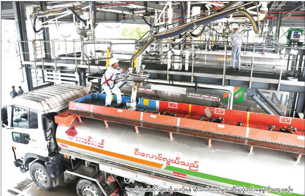
စက်ဆုံးဆီဆိုင်များသို့ ပေးပို့ရန် ဆီသယ်ယာခွဲများ ဆီဖြည့်တင်းနေမှုကို တွေ့ရစဉ်။

ပါလက်စတိုင်း၌ ပိုမို ဆိုးရွားလာသည့် အစား အသောက် အခြေအနေကို သက်သာရန် ဂျပန်က အကူအညီပေးမည် နိုင်ငံတကာသတင်း ၈ ၁၃