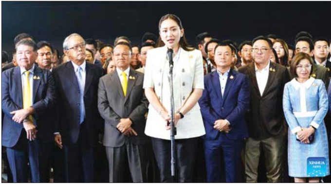
ထိုင်းနိုင်ငံ၏ဝန်ကြီးချုပ်သစ်အဖြစ် ရွေးချယ်တင်မြောက်ခံရသည့် ပေထုံတန်။

ဘန်ကောက် ဩဂုတ် ၁၆ ထိုင်းနိုင်ငံ၏ ဖျူထိုင်းပါတီ ဦးဆောင်သည့် ညွန့်ပေါင်းအဖွဲ့၏ ထောက်ခံမှုကို ရရှိထားသည့် ကိုယ်စားလှယ်လောင်း ပေထုံ တန် ရှင်နာဝတ်ထရာသည် ပါလီမန် ၌ မဲခွဲဆုံးဖြတ်ရာတွင် မဲအများစု အနိုင်ရပြီးနောက် ဩဂုတ် ၁၆ ရက်တွင် ထိုင်းနိုင်ငံ၏ ဝန်ကြီးချုပ် သစ်အဖြစ် ရွေးချယ်တင်မြောက် ခံခဲ့ရသည်။