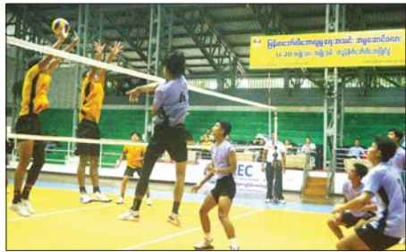
အမျိုးသားဘော်လီဘောပြိုင်ပွဲတွင် ရှမ်းလူငယ်အသင်းနှင့် ရန်ကုန်လူငယ်အသင်းတို့ ယှဉ်ပြိုင်စဉ်။

ရန်ကုန် ဩဂုတ် ၁၆ ၂၀၂၄ ခုနှစ် အပြည်ပြည်ဆိုင်ရာလူငယ်များနေ့အထိမ်းအမှတ် မြန်မာဘော်လီဘောလူမှုရေးအသင်း အမှုဆောင်ဖလား အသက်(၂၁)နှစ်အောက် အမျိုးသား/အမျိုးသမီး တံခွန်စိုက် ဘော်လီဘောကွာတားပြိုင်ပွဲများကို ယနေ့နံနက် ၁၀ နာရီက ရန်ကုန်မြို့ အောင်ဆန်းကွင်း မိုးလုံလေလုံအားကစားပြိုင်ပွဲရုံ၌ ဆက်လက်ကျင်းပသည်။ အဆိုပါပြိုင်ပွဲများသို့ မြန်မာဘော်လီဘောလူမှုရေးအသင်းဥက္ကဋ္ဌ ဦးရဲနိုင်နှင့် အမှုဆောင်များ၊ အားကစားဝါသနာရှင်များ၊ ပြည်သူများ ကြည့်ရှုအားပေးကြသည်။ အမျိုးသမီးတတိယနေရာလှပွဲကို ဩဂုတ် ၁၈ ရက်တွင် ဧရာဝတီအသင်းနှင့် အား/ကာသိပွဲ(မန္တလေး)အသင်း၊ အမျိုးသမီးဗိုလ်လှပွဲကို ဩဂုတ် ၁၉ ရက်တွင် ရန်ကုန်လူငယ်နှင့် Youth Camp အသင်းတို့ ယှဉ်ပြိုင်ကစားကြမည်ဖြစ်သည်။ ယင်းဘော်လီဘောပြိုင်ပွဲတွင် ပြည်နယ်နှင့် တိုင်းဒေသကြီး၊ အားကစားနှင့် ကာယပညာသိပ္ပံကျောင်းများမှ အားကစားသမား အမျိုးသားအသင်း ၁၄ သင်းနှင့် အမျိုးသမီးအသင်း ၁၃ သင်းမှ ကစားသမား ၂၅၀ ကျော် ယှဉ်ပြိုင်ကြပြီး ပြိုင်ပွဲကို ဩဂုတ် ၁၉ ရက်အထိ ကျင်းပမည်ဖြစ်ကြောင်း သိရသည်။ ပြိုင်ပွဲတွင် ဆုကြေးငွေအဖြစ် အမျိုးသား ပြိုင်ပွဲပထမဆု ငွေကျပ် သိန်း ၁၀၀၊ ဒုတိယဆု ငွေကျပ်သိန်း ၅၀၊ တတိယဆုငွေကျပ် ၂၅ သိန်း၊ စတုတ္ထဆုငွေကျပ် ၁၅ သိန်း၊ အကောင်းဆုံးဆုငွေကျပ် ၁၀ သိန်း၊ အမျိုးသမီး ပြိုင်ပွဲပထမဆု ငွေကျပ်သိန်း ၆၀၊ ဒုတိယဆုငွေကျပ်သိန်း ၃၀၊ တတိယဆုငွေကျပ် ၁၅ သိန်း၊ စတုတ္ထဆုငွေကျပ် ၁၀ သိန်းနှင့် အကောင်းဆုံးဆုငွေကျပ်ငါးသိန်း ချီးမြှင့်မည်ဖြစ်ကြောင်း သိရသည်။ အာကကဗို