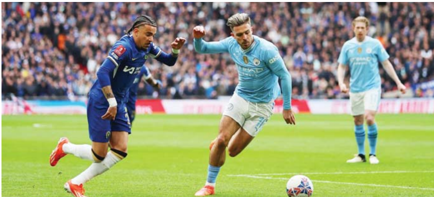
ချယ်ဆီးနှင့် မန်စီးတီးအသင်းတို့ ယမန်နှစ်ရာသီက အကြိတ်အနယ် ယှဉ်ပြိုင်ကစားစဉ်။