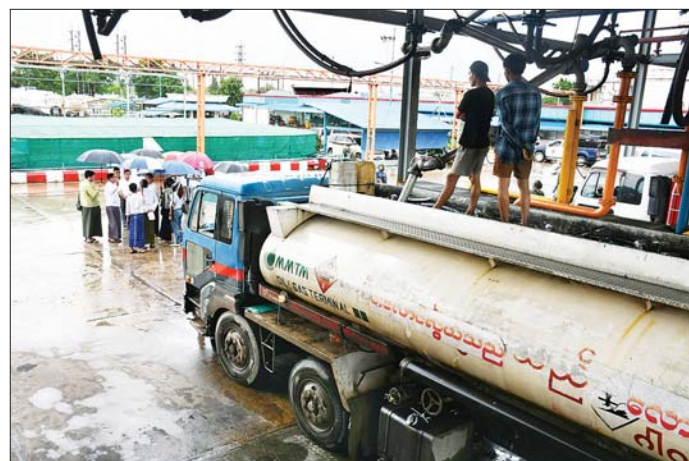
ရန်ကုန်တိုင်းဒေသကြီးဝန်ကြီးချုပ် ဦးစိုးသိန်း ဆီဆိုင်များသို့ ပေးပို့ရန် ဆီသယ်ယာဉ်များပေါ်သို့ ဆီပြည့်တင်းနေမှု အခြေအနေများကို လိုက်လံကြည့်ရှုစစ်ဆေးစဉ်။