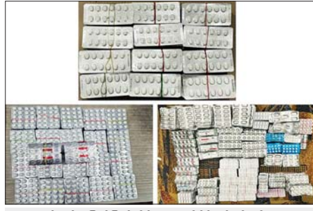
ရန်ကုန်အပြည်ပြည်ဆိုင်ရာဆေးခံရုံ၌ ဖမ်းဆီးရမိမှု။

ကုန်သွယ်မှုတိုက်ဖျက်ရေးအဖွဲ့အဖွဲ့၏ စီမံခန့်ခွဲမှုဖြင့် တာဝန်ကျ ပူးပေါင်းအဖွဲ့က စစ်ဆေးမှုများ ဆောင်ရွက်ခဲ့ရာ ဘုရားကြီးမြို့လမ်းဆုံအနီး၌ မော်လမြိုင်မြို့မှ ရန်ကုန်မြို့သို့ မောင်းနှင်လာသည့် မော်တော်ယာဉ်တစ်စီးပေါ်မှ တရားမဝင်စာရွက်စာတမ်းအထောက်အထား တင်ပြနိုင်ခြင်းမရှိသည့် ထိုင်းနိုင်ငံထုတ် ဟင်းသီးဟင်းရွက်ဆီ တစ်လီတာပါဘူး ၄၈၀ အပါအဝင် ကုန်ပစ္စည်းလေးမျိုး (ခန့်မှန်းတန်ဖိုးငွေကျပ် ၁၀၄၀၀၀၀)နှင့် အဆိုပါပစ္စည်းများ တင်ဆောင်လာသည့် Yutong Bus တစ်စီး (ခန့်မှန်းတန်ဖိုးငွေကျပ် ၄၀၀၀၀၀၀) စုစုပေါင်း ခန့်မှန်းတန်ဖိုးငွေကျပ် ၅၀၄၀၀၀၀၀ ကို ဖမ်းဆီးအရေးယူဆောင်ရွက်လျက်ရှိသည်။ ထို့အတူ ဩဂုတ် ၁၄ ရက်တွင် ဧရာဝတီတိုင်းဒေသကြီး တရားမဝင်ကုန်သွယ်မှုတိုက်ဖျက်ရေးအဖွဲ့အဖွဲ့၏ စီမံခန့်ခွဲမှုဖြင့် တာဝန်ကျ ပူးပေါင်းအဖွဲ့များက စစ်ဆေးမှုများ ဆောင်ရွက်ခဲ့ရာ မြန်အောင်ခရိုင်နှင့် ပုသိမ်ခရိုင်တို့အတွင်း၌ တရားမဝင် ကျွန်းသစ် ၀ ဒသမ ၅၅၂ တန်၊ အခြားသစ် ၅ ဒသမ ၇၂၀ တန် (ခန့်မှန်းတန်ဖိုးငွေကျပ် ၆၉၀၄၄၆၆)ကို သစ်တောဥပဒေအရလည်းကောင်း၊ ဟင်္သာတခရိုင်အတွင်း၌လိုင်စင်မဲ့ Honda Fit Shuttle မော်တော်ယာဉ်တစ်စီး (ခန့်မှန်းတန်ဖိုးငွေကျပ် ၉၀၀၀၀၀) ကို ပို့ကုန်သွင်းကုန်ဥပဒေအရလည်းကောင်း စုစုပေါင်း