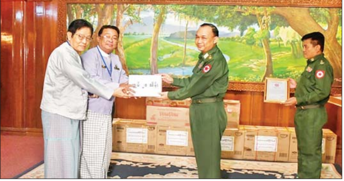
မြန်မာနိုင်ငံရပ်ရှင်အစည်းအရုံးက လုံခြုံရေးတပ်ဖွဲ့ဝင်များအတွက် အလှူငွေနှင့်စားသောက်ဖွယ်ရာများ ဂုဏ်ပြုပေးအပ်စဉ်။

ပေးအပ်သည်။ ယင်းနောက် တိုင်းမှူးက ဂုဏ်ပြုမှတ်တမ်းလွှာ များ ပြန်လည်ပေးအပ်ပြီး ကျေးဇူးတင်စကား ပြောကြား သည်။ အလားတူ နိုင်ငံတော် ကာကွယ်ရေးနှင့် လုံခြုံရေးတာဝန် များကို စွမ်းစွမ်းတမ်းထမ်းဆောင် လျက်ရှိသော လုံခြုံရေးတပ်ဖွဲ့ဝင် စားသောက်ဖွယ်ရာများ ဂုဏ်ပြု ပေးအပ်ခြင်းကို ယနေ့မွန်းလွဲပိုင်း တွင် ရန်ကုန်တိုင်းစစ်ဌာနချုပ် ဧည့်ရိပ်သာခန်းမ၌ ပြုလုပ်ရာ တိုင်းမှူး ဗိုလ်ချုပ် ဇော်ဟိန်နှင့် တာဝန်ရှိသူများ၊ စေတနာရှင် အလှူရှင်များနှင့် ဖိတ်ကြား ထားသူများ တက်ရောက်ကြ သည်။ ယင်းသို့ ပေးအပ်လှူဒါန်းရာ တွင် မြန်မာနိုင်ငံ ရပ်ရှင်အစည်း အရုံး၊ မြန်မာနိုင်ငံ ဂီတအစည်း အရုံး၊ မြန်မာနိုင်ငံသဘင်အစည်း အရုံးနှင့် စေတနာရှင် အလှူရှင် များက ဂုဏ်ပြုချီးမြှင့်ငွေကျပ် သိန်း သုံးရာကိုးဆယ့်ကိုးသိန်း ခြောက်သောင်းနှင့် သုံးဆယ့် ခြောက်သိန်း ခုနစ်သောင်းတန်ဖိုး ရှိ စားသောက်ဖွယ်ရာများကို ဂုဏ်ပြုပေးအပ်ရာ တိုင်းမှူးက လက်ခံရယူပြီး ဂုဏ်ပြုမှတ်တမ်း လွှာများ ပြန်လည်ပေးအပ်ကာ ကျေးဇူးတင်စကား ပြောကြား သည်။ အဆိုပါ ဂုဏ်ပြုချီးမြှင့်ငွေများ နှင့် စားသောက်ဖွယ်ရာများအား ရှေ့တန်းစစ်မျက်နှာအသီးသီးတွင် နိုင်ငံတော် ကာကွယ်ရေးနှင့်လုံခြုံ ရေးတာဝန်များကို ရွပ်ရွပ်ခွဲခွဲ တာဝန်ထမ်းဆောင်လျက်ရှိသည့် လုံခြုံရေး တပ်ဖွဲ့ဝင်များ၏ လက်ဝယ်အရောက် ဆက်လက် ပို့ဆောင်ပေးသွားမည်ဖြစ်ကြောင်း သတင်းရရှိသည်။ သတင်းစဉ်