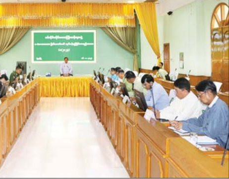
ရှင်းလင်းဆွေးနွေး တင်ပြကြသည်။ ထို့နောက် တိုင်းဒေသကြီး အစိုးရအဖွဲ့ဝင်များက တိုင်းဒေသ ကြီးအတွင်း e-Government စနစ် အကောင်အထည်ဖော်ရေး လုပ်ငန်းများ ဆောင်ရွက်နေမှုနှင့် လိုအပ်သည်များ ဖြည့်စွက် ဆွေးနွေး တင်ပြကြသည်။ ယင်းနောက် တိုင်းဒေသကြီး ဝန်ကြီးချုပ်က အကြံပြုဆွေးနွေး တင်ပြချက်များအပေါ် လိုအပ်သည် များကို တာဝန်ရှိသူများနှင့် ဖြည့် ဆည်း ပေါင်းစပ်ဆောင်ရွက် ပေးခဲ့ကြောင်း သိရသည်။ တိုင်းဒေသကြီး(ပြန်/ဆက်)

အလက်များကို ရယူ၍ အသုံးချ ခြင်းအားဖြင့် အချိန်နှင့် ငွေကြေး ကုန်ကျမှုများ လျော့နည်းသွားမည် ဖြစ်သည့်အပြင် ဘဏ်လုပ်ငန်း များ လည်ပတ်ဆောင်ရွက်မှု၊ ငွေကြေးဆိုင်ရာ အချက်အလက် များ အခွန်ကောက်ခံခြင်းကိစ္စရပ် များနှင့် Digital Payment များ အား ပိုမိုအသုံးပြုနိုင်မှုများ မြှင့်တင်နိုင်ခြင်းဖြင့် အဂတိ တိုက်ဖျက်ရေးကိုပါ အကောင် အထည်ဖော် ဆောင်ရွက်ရာ ရောက်မည်ဖြစ်ကြောင်း ပြော ကြားသည်။ (ယာပုံ) ထို့နောက် တိုင်းဒေသကြီး e-Government စနစ် အကောင် အထည်ဖော်ရေးလုပ်ငန်းကော်မတီ ဥက္ကဋ္ဌ တိုင်းဒေသကြီး လမ်းပန်း ဆက်သွယ်ရေးဝန်ကြီးက တိုင်း ဒေသကြီးအတွင်း e-Government စနစ် အကောင်အထည်ဖော်ရေး လုပ်ငန်းများ အောင်မြင်အောင် ဆောင်ရွက်နေ မှုများနှင့် ဆက်လက်ဆောင်ရွက် သွားမည့် လုပ်ငန်းအခြေအနေ များအား Power Point ဖြင့်