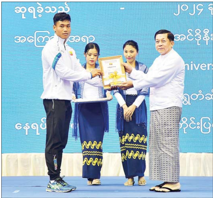
နိုင်ငံတော်စီမံအုပ်ချုပ်ရေးကောင်စီဥက္ကဋ္ဌ နိုင်ငံတော်ဝန်ကြီးချုပ် ဗိုလ်ချုပ်မှူးကြီး မင်းအောင်လှိုင် အင်ဒိုနီးရှားနိုင်ငံ၌ ကျင်းပခဲ့သည့် (၂၁) ကြိမ်မြောက် University Gam တွင် လှံတံဆိပ်အားကစားနည်း ဖြင့် ရွှေတံဆိပ်ဆုရရှိခဲ့သည့် မောင်နန်းထက်မောင်အား ဂုဏ်ပြုဆုပေးအပ်ချီးမြှင့်စဉ်။