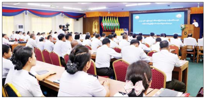
ရှင်းလင်းမှာကြားသည်။ (အပေါ်ပုံ) ထို့နောက် ဒုတိယဝန်ကြီးက သင်တန်းသား အရာရှိများကို တိုင်းဒေသကြီး/ပြည်နယ်အဆင့် နည်းပြခန့်အပ်လွှာများကို ပေးအပ်သည်။ အဆိုပါ ဗဟိုအဆင့် နည်းပြသင်တန်းကို ဩဂုတ် ၁ ရက်မှစ၍ သင်တန်းကာလ ၁၀ ရက်ကြာ သင်တန်းသားအရာရှိ ၅၅ ဦးဖြင့် ဖွင့်လှစ်ပို့ချခဲ့ပြီး သင်တန်းနည်းပြအရာရှိများက သက်ဆိုင်ရာ တိုင်းဒေသကြီး/ပြည်နယ်အလိုက် ဆင့်ပွားသင်တန်း များကို စီမံချက်အတိုင်း ဆက်လက်ဖွင့်လှစ် ဆောင်ရွက်သွားမည်ဖြစ်ကြောင်း သိရသည်။ သတင်းစဉ်

မျှဝေ၍ အဆင့်ဆင့်ကြီးကြပ် ကြပ်မတ်ဆောင်ရွက် ကြရန်လိုကြောင်း၊ ၂၀၂၄ ခုနှစ် လူဦးရေနှင့် အိမ် အကြောင်းအရာ သန်းခေါင်စာရင်း ကောက်ယူရန် တစ်လကျော်သာ လိုတော့သည့်အတွက် ဆင့်ပွား သင်တန်းများနှင့် စီမံချက်ပါ လုပ်ငန်းစဉ်များကို သတ်မှတ်ကာလအတွင်း ပြီးစီးအောင်မြင်ရေး အတွက် ဝိုင်းဝန်းကြိုးပမ်း ဆောင်ရွက်ကြရမည် ဖြစ်ပါကြောင်း၊ သန်းခေါင်စာရင်းကောက်ယူခြင်းမှ ရရှိလာသည့် အချက်အလက်များ မှန်ကန်မှသာ နိုင်ငံ၏ ကဏ္ဍအလိုက် ဖွံ့ဖြိုးတိုးတက်မှုလုပ်ငန်း များကို ထိထိရောက်ရောက် အကောင်အထည်ဖော် ဆောင်ရွက်နိုင်မည်ဖြစ်ပြီး မဲစာရင်းပြုစုရာတွင်လည်း အထောက်အကူပြုမည် ဝိကျသည့် အချက်အလက် များ ဖြစ်မည်ဖြစ်ပါကြောင်း၊ ယခုသင်တန်းသားများ သည် နည်းပြတာဝန်များကို မိမိတို့၏ အတွေ့အကြုံ များနှင့် သင်ခန်းစာ ပို့ချချက်များပေါင်းစပ်ကာ လုပ်ငန်းများ အောင်မြင်ရေးအတွက် တက်ညီလက်ညီ ကြိုးပမ်းဆောင်ရွက်ကြရန် တိုက်တွန်းပါကြောင်း