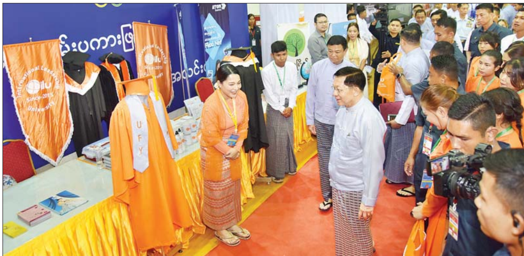
နိုင်ငံတော်စီမံအုပ်ချုပ်ရေးကောင်စီဥက္ကဋ္ဌ နိုင်ငံတော်ဝန်ကြီးချုပ် ဗိုလ်ချုပ်မှူးကြီး မင်းအောင်လှိုင်နှင့်အဖွဲ့ဝင်များ ၂၀၂၄ ခုနှစ်၊ အပြည်ပြည်ဆိုင်ရာလူငယ်များနေ့ အထိမ်းအမှတ်ပြခန်းအား စိတ်ပါဝင်စားစွာ ကြည့်ရှုစဉ်။

အခမ်းအနားအပြီးတွင် နိုင်ငံတော်စီမံအုပ်ချုပ်ရေး ကောင်စီဥက္ကဋ္ဌ နိုင်ငံတော်ဝန်ကြီးချုပ်နှင့် အခမ်း အနား တက်ရောက်လာကြသူများသည် ၂၀၂၄ ခုနှစ်၊ အပြည်ပြည်ဆိုင်ရာလူငယ်များနေ့ အထိမ်းအမှတ် မှတ်တမ်းဓာတ်ပုံပြခန်းများအား စိတ်ပါဝင်စားစွာ ဖြင့် လှည့်လည်ကြည့်ရှုခဲ့ကြကြောင်း သတင်းရရှိ သည်။ သတင်းစဉ်