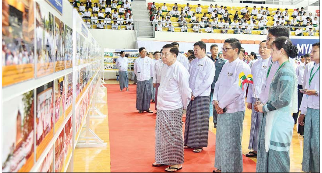
နိုင်ငံတော်စီမံအုပ်ချုပ်ရေးကောင်စီဥက္ကဋ္ဌ နိုင်ငံတော်ဝန်ကြီးချုပ် ဗိုလ်ချုပ်မှူးကြီး မင်းအောင်လှိုင်နှင့်အဖွဲ့ဝင်များ ၂၀၂၄ ခုနှစ်၊ အပြည်ပြည်ဆိုင်ရာလူငယ်များနေ့ အထိမ်းအမှတ် မှတ်တမ်းဓာတ်ပုံပြခန်းများအား စိတ်ပါဝင်စားစွာဖြင့် လှည့်လည်ကြည့်ရှုစဉ်။

ကော်မတီဥက္ကဋ္ဌ၊ အားကစားနှင့် လူငယ်ရေးရာဝန်ကြီး ဌာန ပြည်ထောင်စုဝန်ကြီးက ၂၀၂၄ ခုနှစ်၊ အပြည်ပြည်ဆိုင်ရာ လူငယ်များနေ့အတွက် ကုလသမဂ္ဂ အထွေထွေအတွင်းရေးမှူးချုပ်မှ ပေးပို့