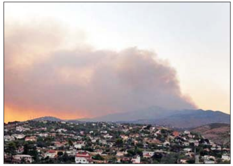
ဂရိနိုင်ငံ အေသင်မြို့မှ ၃၅ ကီလိုမီတာအကွာရှိ ဗာနာဗတ်တွင် လောင်ကျွမ်းနေသည့် တောမီးမှ ထွက်ပေါ်လာသည့် မီးခိုးငွေ့များ။

အေသင် ဩဂုတ် ၁၂ - ရာသီဥတုပြောင်းလဲခြင်း လေပြင်း တိုက်ခတ်မှုကြောင့် အေသင်မြို့ ပြင်တွင် တောမီးများ လျင်မြန်စွာ လောင်ကျွမ်း နေခြင်းကြောင့် အရှေ့မြောက်ပိုင်း အင်္ဂလိပ်က ဒေသရှိ မာရသွန်မြို့တွင် နေထိုင်သူ ၃၀၀၀၀ ကျော်ကို ဘေးလွတ်ရာသို့ ရွှေ့ပြောင်းရန် ဂရိအာဏာပိုင်များက ဩဂုတ် ၁၁ ရက်တွင် အမိန့်ထုတ်ပြန်သည်။ မာရသွန်အပြေးပြိုင်ပွဲ စတင်ပေါ်ပေါက်ခဲ့သည့် မာရသွန်ဒေသ၌ နေထိုင်သူများကို အနီးနားရှိ ကမ်းခြေမြို့ဖြစ်သော နေမာခရီသို့ ရွှေ့ပြောင်းရန် ရာသီဥတုအကျပ်အတည်းနှင့် မြို့ပြကာကွယ်ရေးဝန်ကြီးဌာနက အမိန့်ထုတ်ပြန်ခဲ့သည်။ ဩဂုတ် ၁၁ ရက် ဒေသစံတော်ချိန် ညနေ ၃ နာရီခန့်တွင် အေသင်မြို့မှ ၃၅ ကီလိုမီတာအကွာရှိ ဗာနာဗတ်တွင် ပူပြင်းခြောက်သွေ့ပြီး လေပြင်းတိုက်ခတ်နေခြင်းကြောင့် တောမီး လျင်မြန်စွာ ပျံ့နှံ့သွားခဲ့ပြီး မီးလောင်မှုမှ ထွက်ပေါ်လာသည့် မီးခိုးငွေ့များနှင့် အမူအမုန်းများက အေသင်မြို့၏ အစိတ်အပိုင်း အများအပြားကို ဖုံးလွှမ်းသွားခဲ့သည်။ စေတနာ့ဝန်ထမ်းအများအပြားက ရေသယ်ရဟတ်ယာဉ် ၂၉ စင်း၊ မီးသတ်ယာဉ် အစီးရေ ၁၁၀ အသုံးပြု လုပ်ဆောင်နေကြောင်း မီးသတ်တပ်ဖွဲ့ ပြောရေးဆိုခွင့်ရှိသူ ဗတ်စီလစ် ဗတ်သရာဂီဘန်နစ် က အေသင်မြို့တွင် ပြုလုပ်သည့် သတင်းစာရှင်းလင်းပွဲတွင် ပြောကြားသည်။ ဂရိနိုင်ငံ၌ ယခုနှစ်တွင် တောမီးကြောင့် လူနစ်ဦးအသက် ရှည်လျားသည့် တောမီးများကို ထိန်းချုပ်နိုင်ရန် မီးသတ်တပ်ဖွဲ့ဝင် ၄၀၀ ခန့်နှင့် တပ်မတော်သားများ၊ ဆင်ယာ