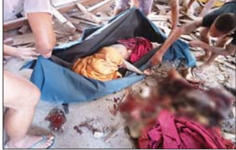
KIA နှင့် KPDF အကြမ်းဖက်သောင်းကျန်းသူများက ဗန်းမော်မြို့အတွင်းသို့ ရှော့တိုက်ခွဲဖြင့် ပစ်ခတ် တိုက်ခိုက်ခဲ့မှုကြောင့် သံဃာတော်များ ပျံလွန် တော်မူခဲ့မှုအား တွေ့ရစဉ်။

ကာကွယ်စောင့်ရှောက်ရေးအတွက် လိုအပ်သည့် နယ်မြေ လုံခြုံရေးလုပ်ငန်းများ တိုးမြှင့်ဆောင်ရွက် လျက်ရှိကြောင်း သတင်းရရှိသည်။