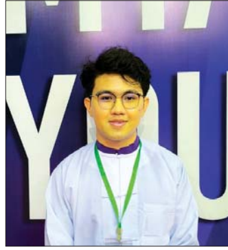
မောင်ဒယ်နီယယ်မျိုးထွန်း