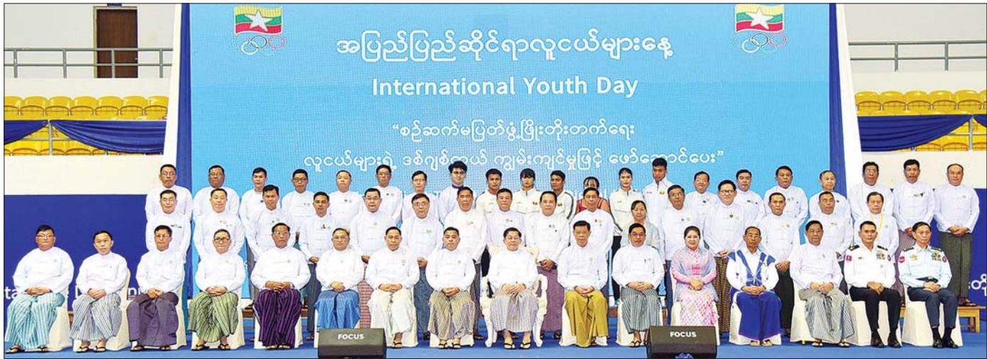
နိုင်ငံတော်စီမံအုပ်ချုပ်ရေးကောင်စီဥက္ကဋ္ဌ နိုင်ငံတော်ဝန်ကြီးချုပ် ဗိုလ်ချုပ်မှူးကြီး မင်းအောင်လှိုင်နှင့် အခမ်းအနားတက်ရောက်လာကြသူများ အပြည်ပြည်ဆိုင်ရာပြိုင်ပွဲများတွင် ရွှေတံဆိပ်ဆု ထူးချွန်လူငယ်များနှင့်အတူ စုပေါင်းမှတ်တမ်းတင် ဓာတ်ပုံရိုက်စဉ်။