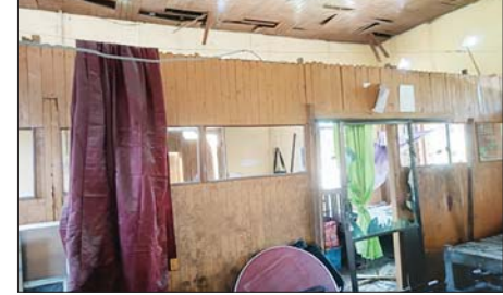
KIA နှင့် KPDF အကြမ်းဖက်သောင်းကျန်းသူများပစ်ခတ်လိုက်သည့် ရှော့တိုက်ခွဲ ကျရောက်ပေါက်ကွဲမှုကြောင့် ဓမ္မပါလလယ်ပေါ်ဘုန်းတော်ကြီးကျောင်းဝင်းအတွင်းရှိ မြနင်းဆီကျောင်းဆောင်ပျက်စီးမှုအား တွေ့ရစဉ်။