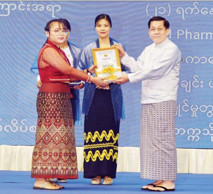
နိုင်ငံတော်စီမံအုပ်ချုပ်ရေးကောင်စီဥက္ကဋ္ဌ နိုင်ငံတော်ဝန်ကြီးချုပ် ဗိုလ်ချုပ်မှူးကြီး မင်းအောင်လှိုင်ထံ ဗီယက်နမ်နိုင်ငံ၌ ကျင်းပသည့် ၂၀၂၄ ခုနှစ် နိုင်ငံတကာဆေးဘက်ဆိုင်ရာ ဖီဝေဘုဗေဒပညာရပ်ပြိုင်ပွဲတွင် ရွှေတံဆိပ်ဆုရရှိခဲ့သည့် မကြယ်စင်လင်းလက်အား ဂုဏ်ပြုဆုပေးအပ်ချီးမြှင့်စဉ်။