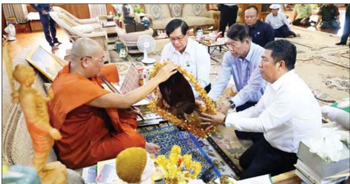
ရန် ကာဝန်ရှိသူများအား မှာကြားပြီး မြို့ဦးစေတီအတွင်း စီးသတ်တပ်ဖွဲ့ဝင်များ၊ ကြက်ခြေနီသူနာပြုတပ်ဖွဲ့ဝင်များ၊ ဒေသပြည်သူများ၊ စေတနာရှင်လူမှုအဖွဲ့အစည်းများမှ တာဝန်ရှိသူများက ကုသိုလ်ယူစုပေါင်းလှူဒါန်းပေးနေမှုများကို လှည့်လည်ကြည့်ရှုအားပေးကြသည်။ ထို့နောက် တိုင်းဒေသကြီး ဝန်ကြီးချုပ်နှင့်အဖွဲ့သည် ဒဂုံမြို့သစ် (မြောက်ပိုင်း) မြို့နယ် အမှတ် (၃၇) ဆန်ကျော်ဦး (ပြန်/ဆက်)

ဦးစွာ တိုင်းဒေသကြီး ဝန်ကြီးချုပ်နှင့် အစိုးရအဖွဲ့ဝင်များသည် ဒဂုံမြို့သစ် (မြောက်ပိုင်း) မြို့နယ် အမှတ် (၁၆) ရပ်ကွက်ရှိ မြို့ဦးစေတီဘူတာရုံ ဓမ္မရိပ်သာကျောင်းတိုက်ဆရာတော် ဘဒ္ဒန္တရေဝတအား ဖူးမြော်ကြည့်ည့်၍ လှူဖွယ်ပစ္စည်းများ၊ နတ်ကမ္ဘာအလှူငွေများ၊ ဆန်၊ ဆီများအား ဆက်ကပ်လှူဒါန်းကြပြီး ကျောင်းတိုက်အတွင်းရှိ ဆွမ်းစားဆောင်နှင့် ဥပသေနည်းများတွင် တရားပေး၊ တရားဟောသည့် ကျောင်းဆောင်တို့၏ အစိုးရများ ပြန်လည်ပြုပြင်ပေး