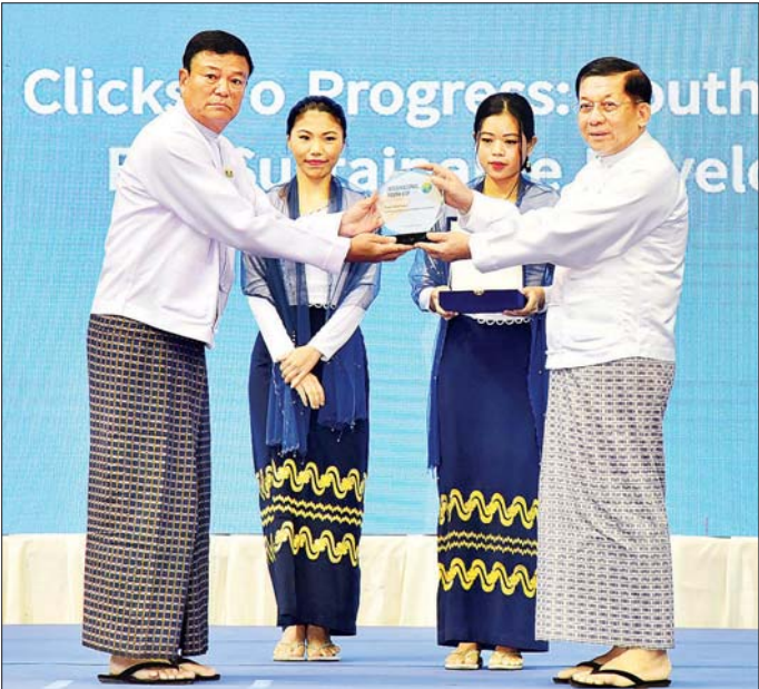
နိုင်ငံတော်စီမံအုပ်ချုပ်ရေးကောင်စီဥက္ကဋ္ဌ နိုင်ငံတော်ဝန်ကြီးချုပ် ဗိုလ်ချုပ်မှူးကြီး မင်းအောင်လှိုင်ထံ ပြည်ထောင်စုဝန်ကြီး ဦးမင်းသိန်းစိက အပြည်ပြည်ဆိုင်ရာ လူငယ်များနေ့ အထိမ်းအမှတ်လက်ဆောင်ကို ဂါရဝပြုပေးအပ်စဉ်။