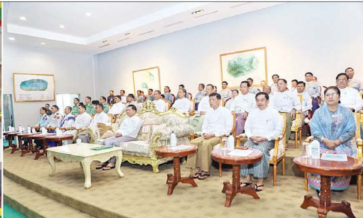
နိုင်ငံတော်စီမံအုပ်ချုပ်ရေးကောင်စီဥက္ကဋ္ဌ နိုင်ငံတော်ဝန်ကြီးချုပ် ဗိုလ်ချုပ်မှူးကြီး မင်းအောင်လှိုင်နှင့် အဖွဲ့ဝင်များ နိုင်ငံအလိုက် တောင်ပင်လယ်ပုလဲ ထုတ်လုပ်မှုဆိုင်ရာ အချက်အလက်များ၊ မြန်မာ့ပုလဲများထုတ်လုပ်မှု ရောင်းချနိုင်မှုနှင့် ၂၀၂၄ ခုနှစ်၊ (၁၄၂) ကြိမ်မြောက် မြန်မာ့တောင်ပင်လယ်ပုလဲရောင်းချပွဲအခမ်းအနားကျင်းပနိုင်ရေး ပြင်ဆင်ဆောင်ရွက်ခဲ့မှု စီဒီယိုမှတ်တမ်းကို ကြည့်ရှုစဉ်။