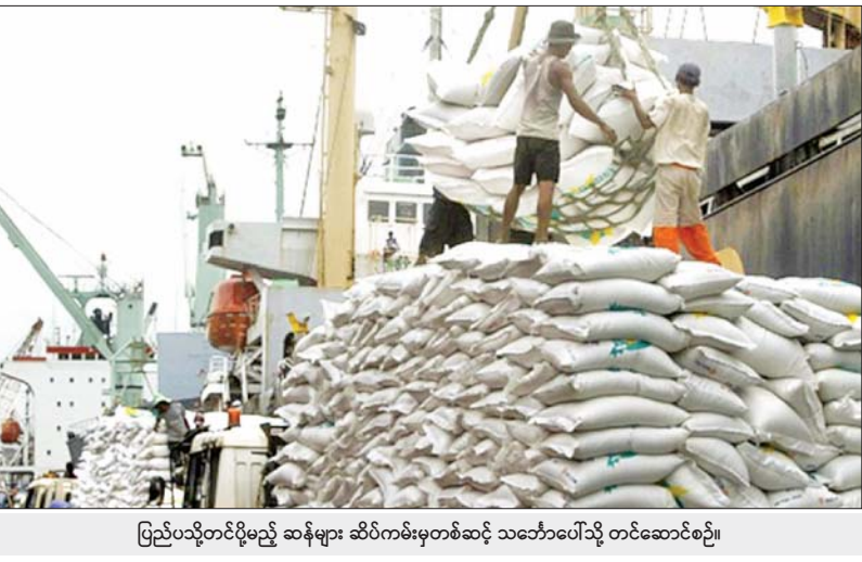
ပြည်ပသို့တင်ပို့မည့် ဆန်များ ဆိပ်ကမ်းမှတစ်ဆင့် သင်္ဘောပေါ်သို့ တင်ဆောင်စဉ်။

ရန်ကုန် ဩဂုတ် ၁၂ - ပြည်ပသို့ နှစ်စဉ် ဆန်နှင့်ဆန်ကွဲ တင်ပို့မှု ၂ သန်းခွဲခန့်အထိ တင်ပို့လျက်ရှိပြီး ယခုဘဏ္ဍာနှစ်အတွင်း ဆန်နှင့် ဆန်ကွဲ တင်ပို့မှုမှ အမေရိကန်ဒေါ်လာသန်း ၁၀၀၀ ကျော်ရရှိရန် မျှော်မှန်းထားကြောင်း မြန်မာနိုင်ငံ ဆန်စပါးအသင်းချုပ် ဥက္ကဋ္ဌ ဦးရဲမင်းအောင်က ပြောကြားသည်။ မြန်မာနိုင်ငံ ဆန်စပါးအသင်းချုပ်၏ လက်ရှိကာလ ဆောင်ရွက်လျက်ရှိသည့် လုပ်ငန်းအစီအစဉ်များ၊ ရှေ့ဆက်ဆောင်ရွက်မည့် အစီအစဉ်များနှင့် ပတ်သက်၍ ဩဂုတ် ၁၂ ရက်တွင် ပြုလုပ်သည့် မြန်မာနိုင်ငံ ဆန်စပါးအသင်းချုပ်၏ သတင်းပြန်ကြားစာမျက်နှာ ၁၇ ကော်လံ ၁ ၀