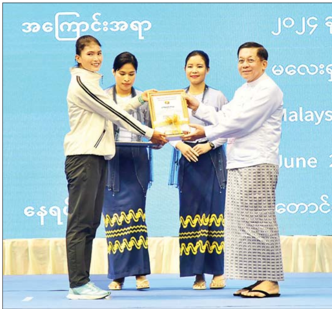
နိုင်ငံတော်စီမံအုပ်ချုပ်ရေးကောင်စီဥက္ကဋ္ဌ နိုင်ငံတော်ဝန်ကြီးချုပ် ဗိုလ်ချုပ်မှူးကြီး မင်းအောင်လှိုင် မလေးရှားနိုင်ငံ၌ ကျင်းပခဲ့သည့် CAHYA MATA Malaysian Open Championships 2024 (14 th -16 th ) June 20000 m Walk ရွှေတံဆိပ်ဆုရရှိခဲ့သည့် မဇင်မေထက်အား ဂုဏ်ပြုဆုပေးအပ်ချီးမြှင့်စဉ်။