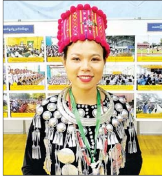
မမူမူစို