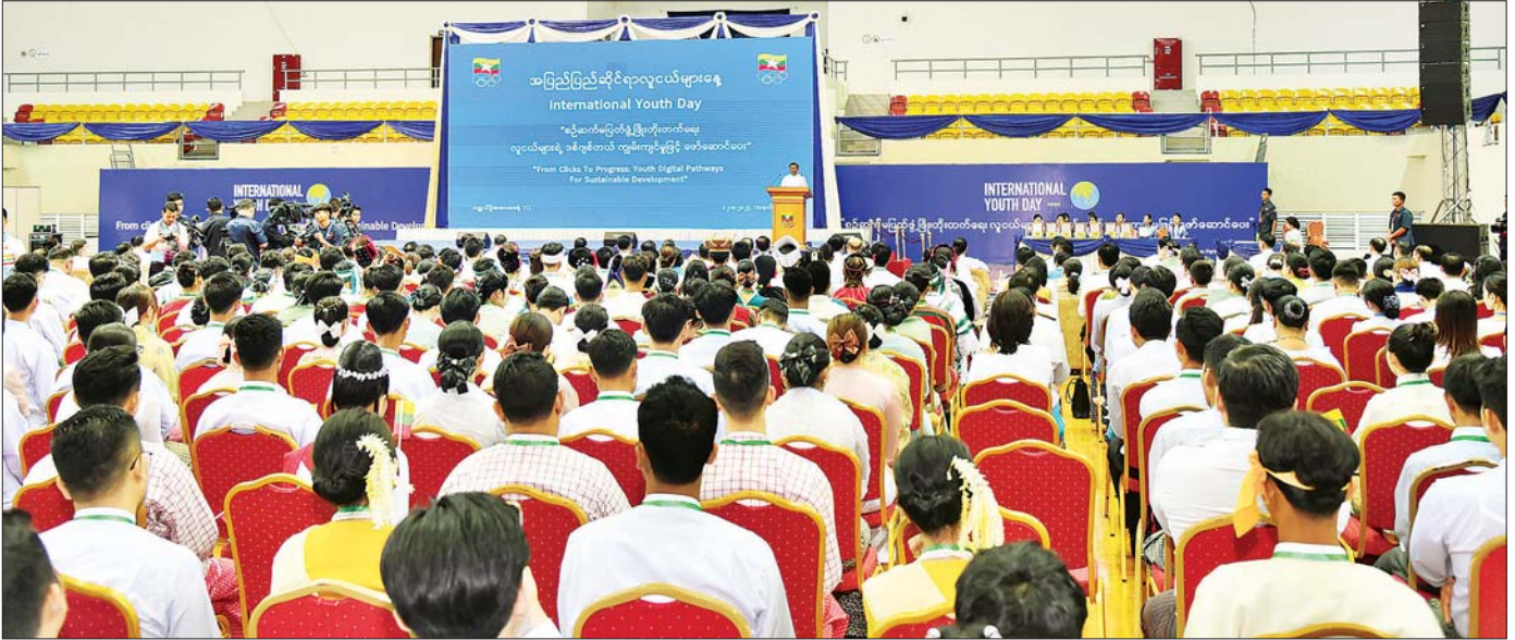
နိုင်ငံတော်စီမံအုပ်ချုပ်ရေးကောင်စီဥက္ကဋ္ဌ နိုင်ငံတော်ဝန်ကြီးချုပ် ဗိုလ်ချုပ်မှူးကြီး မင်းအောင်လှိုင် ၂၀၂၄ ခုနှစ်၊ အပြည်ပြည်ဆိုင်ရာလူငယ်များနေ့ အခမ်းအနားတွင် အမှာစကားပြောကြားစဉ်။

၂ ရှေ့မှ နိုင်ငံတော်ဖွံ့ဖြိုးတိုးတက်ရေးလုပ်ငန်းများ၌ လူငယ်များ ပိုမိုပူးပေါင်းပါဝင်လာစေရန်၊ အပြည်ပြည်ဆိုင်ရာလူငယ်များနေ့ကို လူငယ်လူရွယ်များ ပိုမိုသိရှိပြီး ပါဝင်ဆင်နွှဲလာကြစေရန်နှင့် လူငယ်များ၏ လိုလားချက်များကို ဖြည့်ဆည်းဆောင်ရွက်ပေးနိုင်ရန် ရည်ရွယ်ချက်များဖြင့် နှစ်စဉ်ကျင်းပပြုလုပ်ပေးလျက်ရှိကြောင်း။ အဓိကအခန်းကဏ္ဍမှ ပါဝင်လာစေရန်လို ကုလသမဂ္ဂအဖွဲ့က ၂၀၂၄ ခုနှစ်၊ အပြည်ပြည်ဆိုင်ရာလူငယ်များနေ့အတွက် ချမှတ်ပေးထားသည့် ဆောင်ပုဒ်မှာ “စဉ်ဆက်မပြတ် ဖွံ့ဖြိုးတိုးတက်ရေး၊ လူငယ်များရဲ့ ဒစ်ဂျစ်တယ်ကျွမ်းကျင်မှုဖြင့် ဖော်ဆောင်ပေး” (From Clicks to Progress: Youth Digital Pathways For Sustainable Development) ဖြစ်ကြောင်း။ ဒစ်ဂျစ်တယ်အသွင်ကူးပြောင်းခြင်းနှင့်အတူ စဉ်ဆက်မပြတ် ဖွံ့ဖြိုးတိုးတက်မှုပန်းတိုင်များ ပြည့်မီစေရေးအတွက် အရှိန်အဟုန်ဖြင့် ဆောင်ရွက်ရာတွင် လူငယ်များသည် အဓိကအခန်း