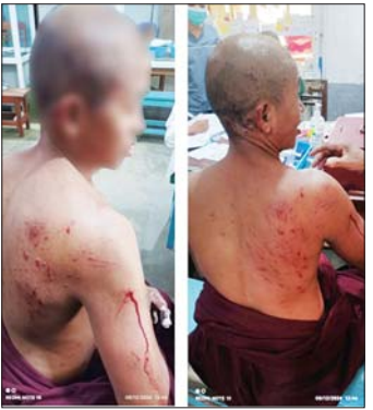
KIA နှင့် KPDF အကြမ်းဖက်သောင်းကျန်းသူများက ဗန်းမော်မြို့အတွင်းသို့ ရှော့တိုက်ခွဲဖြင့် ပစ်ခတ် တိုက်ခိုက်ခဲ့မှုကြောင့် သံဃာတော်များ ထိခိုက် ဒဏ်ရာရရှိမှုအား တွေ့ရစဉ်။

နေသော သံဃာတော်နှစ်ပါး စိုးထိမာန်ဒဏ်ရာများ ရရှိကာ ပျံလွန်တော်မူခဲ့ပြီး သံဃာတော် သုံးပါး၊ ကိုရင် သုံးပါးနှင့် အပြစ်မဲ့ပြည်သူသုံးဦးတို့ ထိခိုက် ဒဏ်ရာရရှိခဲ့သည်။ ထိခိုက်ဒဏ်ရာရရှိခဲ့သူများအား ဗန်းမော်မြို့ပြည်သူ့ဆေးရုံသို့ လူမှုကူညီရေးအသင်းမှ မော်တော်ယာဉ်ဖြင့် ပို့ဆောင်ဆေးကုသမှုခံယူစေ လျက်ရှိကြောင်း သိရသည်။ KIA နှင့် KPDF အကြမ်းဖက်သောင်းကျန်းသူ များသည် စစ်ရေးပစ်မှတ်မဟုတ်ဘဲ အေးချမ်းစွာ နေထိုင်လျက်ရှိသော မြို့ ရွာများအတွင်းသို့ လက်နက် ကြီးများ၊ ရှော့တိုက်ခွဲများဖြင့် ရက်စက်ယုတ်မာစွာ ပစ်ခတ်တိုက်ခိုက်ခြင်းနှင့် တိုက်ပွဲများ ဖော်ဆောင် ခြင်းများ လုပ်ဆောင်မှုများကြောင့် မြို့၊ ရွာများရှိ ဘာသာရေးအဆောက်အအုံများ၊ ဌာနဆိုင်ရာ အဆောက်အအုံများ၊ လူနေအိမ်များနှင့် စာသင်ကျောင်း များထိခိုက်ပျက်စီးမှုများ ဖြစ်ပေါ်လျက်ရှိကာ ပြည်သူ လူထု၏ အသက်အိုးအိမ်ကို ထိခိုက်ဆုံးရှုံးမှုများ ဖြစ်ပေါ်လျက်ရှိသဖြင့် ဒေသပြည်သူများက အကြမ်း ဖက်သောင်းကျန်းသူများ၏လုပ်ရပ်များကို ကန့်ကွက် ရှုတ်ချလျက်ရှိကြောင်း သိရသည်။ လုံခြုံရေးတပ်ဖွဲ့ဝင်များအနေဖြင့် နယ်မြေတည်ငြိမ် အေးချမ်းရေးနှင့် ပြည်သူ့အသက်အိုးအိမ်စည်းစိမ်