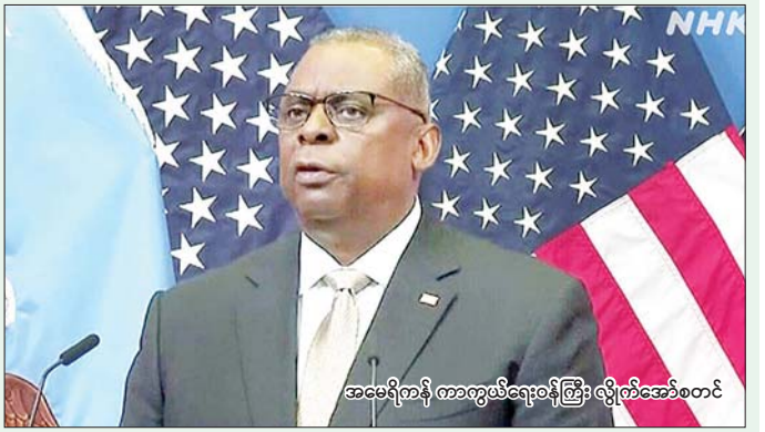
အမေရိကန် ကာကွယ်ရေးဝန်ကြီး လှိုင်အောင်စတင် ထပ်လောင်းအတည်ပြုခဲ့ပြီး လက်ဘနွန်အခြေစိုက် ခဲ့ကြောင်း ပင်တဂွန်စစ်ဌာနချုပ်၏ ထုတ်ပြန်ချက် ဟစ်စ်တိုလာနှင့်ဒေသတွင်းရှိ အခြားအီရန်မဟာမိတ် တွင် ဖော်ပြသည်။ အဖွဲ့များကို ဟန့်တားရန် ကြိုးပမ်းမှုများ ဆွေးနွေး အင်နီအိတ်ချ်ကေ

တိုကျို၊ ဩဂုတ် ၁၂ - အိန္ဒိယနိုင်ငံ အရှေ့အလယ်ပိုင်းဒေသသို့ အမေရိကန်ရေတပ်သင်္ဘောအုပ်စု အမြန်စေလွှတ်ရန်အတွက် အမေရိကန် ကာကွယ်ရေးဝန်ကြီး လှိုင်အောင်စတင်နှင့် အစွဲအမူကွယ်ရေးဝန်ကြီး ရိုဂျစ် ဂဲလန်တို့အကြား ဩဂုတ် ၁၁ ရက်က ဖုန်းဖြင့် ဆွေးနွေးခဲ့ကြောင်း ပင်တဂွန်စစ်ဌာနချုပ်က ထုတ်ပြန်သည်။ အင်္ဂါ - ၁၅ စီ တိုက်လေယာဉ်များ တင်ဆောင်ထားသည့် ယူအက်စ်အက်စ် အေဗရာဟမ် လင်ကွန်း လေယာဉ်တင်သင်္ဘောကို မူလစီစဉ်ထားသည့်ထက် ဆောလင်ဗွာ ရောက်ရှိရန် အမိန့်ပေးခဲ့ကြောင်း အော်စတင်က ဆိုသည်။ ထို့အတူ ယူအက်စ်အက်စ် ကိုလည်း အရှေ့အလယ်ပိုင်းသို့ ညွှန်ကြားထားကြောင်း အဆိုပါထုတ်ပြန်ချက်တွင် ဖော်ပြထားသည်။ ပြီးခဲ့သည့်လက တီဟီရန်တွင် ဟားမားစ် နိုင်ငံရေး ခေါင်းဆောင် အစွဲအမူလီဟာနီယေး သေဆုံးပြီးနောက် ပိုမိုကြီးမားသည့် ပဋိပက္ခများ ဖြစ်ပေါ်လာမည်ကို စိုးရိမ်မှုများ မြင့်တက်လာခဲ့သည်။ အီရန်က အစွဲအမူကို လက်တုံ့ပြန်မည်ဟုလည်း ပြောဆိုထားသည်။ အော်စတင်က အစွဲအမူကို ကာကွယ်ရန် ဝါရှင်တန်၏ ကတိကဝတ်ကို