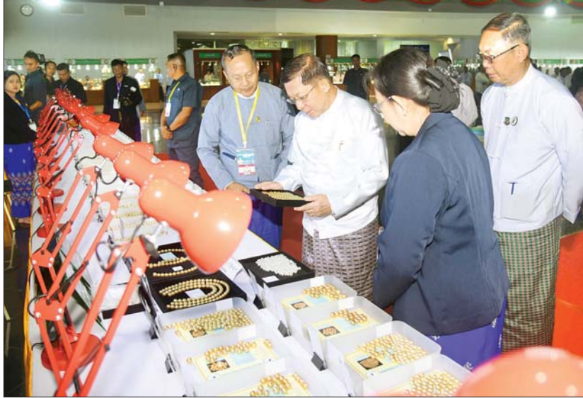
နိုင်ငံတော်စီမံအုပ်ချုပ်ရေးကောင်စီဥက္ကဋ္ဌ နိုင်ငံတော်ဝန်ကြီးချုပ် ဗိုလ်ချုပ်မှူးကြီး မင်းအောင်လှိုင် ခင်းကျင်းပြသထားသည့် ပုလဲအတွဲများနှင့် ပုဂ္ဂလိကကျောက်မျက်ရတနာ အချောထည်အရောင်းပြခန်းများ ဖွင့်လှစ်ရောင်းချနေမှုကို ကြည့်ရှုစဉ်။

မြောက် မြန်မာ့တောင်ပင်လယ်ပုလဲရောင်းချပွဲ၌ ရောင်းချရန် မဏိရတနာကျောက်စိမ်းခန်းမအတွင်း၌ ခင်းကျင်းပြသထားသည့် ပုလဲအတွဲများနှင့် ပုဂ္ဂလိက ကျောက်မျက်ရတနာအချောထည် အရောင်းပြခန်းများ ဖွင့်လှစ်ရောင်းချနေမှုကို လိုက်လံကြည့်ရှုကြရာ သယ်ဇာတနှင့် သဘာဝပတ်ဝန်းကျင် ထိန်းသိမ်းရေးဝန်ကြီးဌာန ပြည်ထောင်စုများက လိုက်လံရှင်းလင်းတင်ပြကြသည်။ ခင်းကျင်းပြသ (၁၄၂) ကြိမ်မြောက် မြန်မာ့တောင်ပင်လယ် ပုလဲရောင်းချပွဲကို ဩဂုတ် ၁၂ ရက်မှ ၁၅ ရက်အထိ တောင်ပင်လယ်ပုလဲ အလုံးပေါင်း ၁၇၅၀၀၀ အတွဲ ၇၀၀ ကို အိတ်ဖွင့်တင်ခံစနစ်ဖြင့် ခင်းကျင်းပြသရောင်းချပေးသွားမည်ဖြစ်သည်။ အဆိုပါ (၁၄၂) ကြိမ်မြောက် မြန်မာ့တောင်ပင်လယ် ပုလဲရောင်းချပွဲ၌ ဩဂုတ် ၁၃ ရက်တွင် တင်ခံအမှတ်(၁) ဖြစ်သည့် ပုလဲအတွဲအမှတ် (၀၀၁) မှ (၁၁၅) တွဲအထိ ပုလဲအတွဲ (၁၁၅) တွဲနှင့် တင်ခံအမှတ်(၂) ဖြစ်သည့် ပုလဲအတွဲအမှတ်(၁၁၆) မှ အတွဲ(၂၃၀) အထိ ပုလဲအတွဲ(၁၁၅) တွဲတို့ကို အိတ်ဖွင့်တင်ခံစနစ်ဖြင့်လည်းကောင်း၊ ဩဂုတ် ၁၄ ရက်တွင် တင်ခံအမှတ် (၃) ဖြစ်သည့် ပုလဲအတွဲအမှတ်(၂၃၁) မှ (၃၄၅) တွဲအထိ ပုလဲအတွဲ (၁၁၅) တွဲနှင့် တင်ခံအမှတ် (၄) ဖြစ်သည့် ပုလဲအတွဲအမှတ် (၃၄၆) မှ (၄၆၀) အထိ ပုလဲအတွဲ (၁၁၅) တွဲတို့ကို အိတ်ဖွင့်တင်ခံစနစ်ဖြင့်လည်းကောင်း၊ ဩဂုတ် ၁၅ ရက်တွင် တင်ခံအမှတ်(၅) ဖြစ်သည့် ပုလဲအတွဲအမှတ်(၄၆၁) မှ (၅၈၀) အထိ ပုလဲအတွဲ (၁၂၀) တွဲနှင့် တင်ခံအမှတ် (၆) ဖြစ်သည့် ပုလဲအတွဲအမှတ် (၅၈၁) မှ (၇၀၀) အထိ ပုလဲအတွဲ (၁၂၀) တို့ကို အိတ်ဖွင့်တင်ခံစနစ်ဖြင့် လည်းကောင်း ရောင်းချပေးသွားမည်ဖြစ်ကြောင်း သတင်းရရှိသည်။ အဆိုပါ (၁၄၂) ကြိမ်မြောက် မြန်မာ့တောင်ပင်လယ် ပုလဲရောင်းချပွဲ၌ သတင်းစဉ်