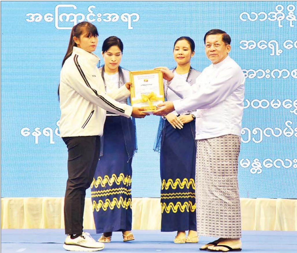
နိုင်ငံတော်စီမံအုပ်ချုပ်ရေးကောင်စီဥက္ကဋ္ဌ နိုင်ငံတော်ဝန်ကြီးချုပ် ဗိုလ်ချုပ်မှူးကြီး မင်းအောင်လှိုင် လာအိုနိုင်ငံ၌ ကျင်းပခဲ့သည့် (၁၈) ကြိမ်မြောက် အရှေ့တောင်အာရှ ကာယဗလနှင့် ကာယကြံ့ခိုင်မှု အားကစားပြိုင်ပွဲတွင် ရွှေတံဆိပ်ဆုရ မသံဝါအား ဂုဏ်ပြုဆုပေးအပ်ချီးမြှင့်စဉ်။

နေပြည်တော် ဩဂုတ် ၁၂ ၂၀၂၄ ခုနှစ်၊ အပြည်ပြည်ဆိုင်ရာ လူငယ်များနေ့ အခမ်းအနားကို ယနေ့ မွန်းလွဲပိုင်းတွင် နေပြည်တော် ရှိ ဝဏ္ဏသိဒ္ဓိအားကစားရုံ (C)၌ ကျင်းပပြုလုပ်ရာ နိုင်ငံတော်စီမံအုပ်ချုပ်ရေးကောင်စီဥက္ကဋ္ဌ နိုင်ငံတော် ဝန်ကြီးချုပ် ဗိုလ်ချုပ်မှူးကြီး မင်းအောင်လှိုင် တက်ရောက်အမှာစကားပြောကြားသည်။ အခမ်းအနားသို့ နိုင်ငံတော်စီမံအုပ်ချုပ်ရေး ကောင်စီဥက္ကဋ္ဌ နိုင်ငံတော်ဝန်ကြီးချုပ် ဗိုလ်ချုပ်မှူး ကြီး မင်းအောင်လှိုင်၊ ကောင်စီဝန်ထမ်းရေးမှူး ခုတိယဗိုလ်ချုပ်ကြီး ရဲဝင်းဦး၊ ကောင်စီဝင်များ၊ ပြည်ထောင်စုဝန်ကြီးများနှင့် ပြည်ထောင်စုအဆင့် ပုဂ္ဂိုလ်များ၊ နေပြည်တော်ကောင်စီဥက္ကဋ္ဌ၊ ကာကွယ် ရေးဦးစီးချုပ်ရုံးမှ အဆင့်မြင့်တပ်မတော်အရာရှိကြီး များ၊ နေပြည်တော်တိုင်းစစ်ဌာနချုပ်တိုင်းမှူး၊ ခုတိယ ဝန်ကြီးများ၊ ဝန်ကြီးဌာနများမှ တာဝန်ရှိသူများ၊ အပြည်ပြည်ဆိုင်ရာ ပြိုင်ပွဲများတွင် ရွှေတံဆိပ်ဆုရ ထူးချွန်လူငယ်များ၊ မသန်စွမ်းလွယ်ကိုယ်စားလှယ် များ၊ တိုင်းဒေသကြီးနှင့်ပြည်နယ်အသီးသီးမှ လူငယ်ကိုယ်စားလှယ်များ၊ ရေကြောင်းနှင့် လေကြောင်းလူငယ်များ၊ ကြက်ခြေနီနှင့် ကင်းထောက်လူငယ်များ၊ နေပြည်တော်ရှိ တက္ကသိုလ်၊ ကောလိပ်နှင့် သိပ္ပံကျောင်းများမှ ကျောင်းသား၊ ကျောင်းသူများ၊ လူငယ်ဖွံ့ဖြိုးရေး ဆောင်ရွက်နေသည့် အဖွဲ့အစည်းများနှင့် တာဝန်ရှိသူ များ တက်ရောက်ကြသည်။ ဦးစွာ နိုင်ငံတော်စီမံအုပ်ချုပ်ရေးကောင်စီဥက္ကဋ္ဌ နိုင်ငံတော်ဝန်ကြီးချုပ်က အမှာစကားပြောကြားရာတွင် အပြည်ပြည်ဆိုင်ရာ လူငယ်များနေ့ အခမ်းအနားကို ကမ္ဘာ့နိုင်ငံအသီးသီးတွင် နှစ်စဉ်နှစ်တိုင်း ဩဂုတ် ၁၂ ရက်တွင် ကျင်းပပြုလုပ်လျက်ရှိသကဲ့သို့ မိမိတို့ မြန်မာနိုင်ငံတွင်လည်း ရပ်ရွာအကျိုးပြုလုပ်ငန်းများ စာမျက်နှာ ၃ ကော်လံ ၁-၂