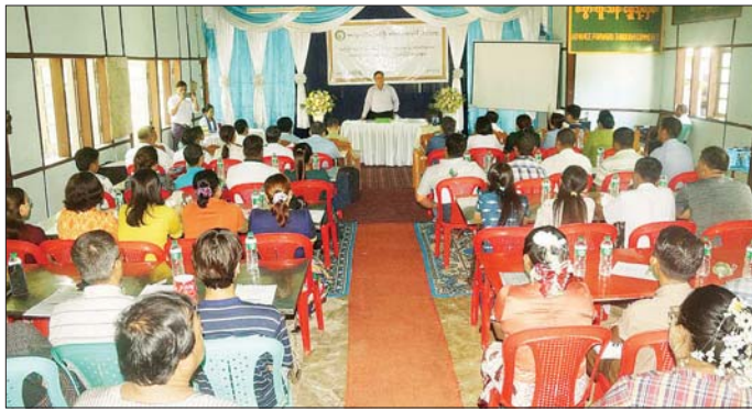
ပေး လုပ်ဆောင်ရမည့်လုပ်ငန်းကဏ္ဍပေါင်းများစွာ ရှိသည့်အနက် MSME လုပ်ငန်းများကို အားပေး မြှင့်တင်ခြင်းသည် အဓိကအခန်းကဏ္ဍတစ်ခုအဖြစ် ပါဝင်နေပါကြောင်း၊ MSME လုပ်ငန်းများသည် စီးပွား

တောင်တွင်းကြီး ဩဂုတ် ၉ မကွေးတိုင်းဒေသကြီး မကွေးခရိုင် တောင်တွင်းကြီး မြို့နယ် စားသုံးသူရေးရာဦးစီးဌာန အစည်းအဝေးခန်းမ၌ ပဲကြော်၊ ပဲလှော်လုပ်ငန်းရှင်များအတွက် စားသောက်ကုန်ထုပ်ပိုးမှုဆိုင်ရာ အသိပညာပေးခြင်းဆွေးနွေးပွဲကို ယနေ့နံနက်ပိုင်းက ကျင်းပရာ တိုင်းဒေသကြီးစီးပွားရေးရာဝန်ကြီး ဦးအောင်ချိန် တက်ရောက်သည်။