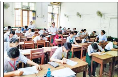
ရန်ကုန်တိုင်းဒေသကြီး အထက်(၁)ဒဂုံကျောင်း၌ ၂၀၂၄-၂၀၂၅ ပညာသင်နှစ် ကျောင်းကျန်းမာရေးသီတင်းပတ် အထိမ်းအမှတ် ကျောင်းတွင်းလှုပ်ရှားမှုအဖြစ် မူလတန်း၊ အလယ်တန်း၊ အထက်တန်းအဆင့် စာစီစာကုံး၊ ကဗျာနှင့် ပန်းချီပြိုင်ပွဲများကို ဩဂုတ် ၆ ရက်က ကျင်းပရာ ကျောင်းသား ကျောင်းသူပေါင်း ၁၄၀ ခန့် ပါဝင်ယှဉ်ပြိုင်ကြစဉ်။ မြို့နယ်(ပြန်/ဆက်)