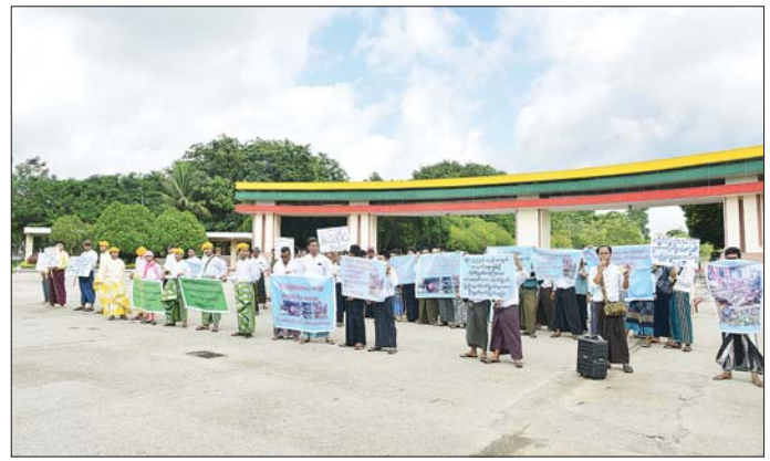
သည့်အကြမ်းဖက်များ အလိုမရှိ၊ အကြမ်းဖက်အဖွဲ့ ပြည်ပျက်စိတ္တော့ကို တိုက်ထုတ်ကြပါစို့” စသည့် များကို အမြစ်ဖြတ်နှိမ်နင်းဆောင်ရွက်ပေးရေး၊ ဦးညွှတ်ဂုဏ်ပြုပြီး ငြိမ်းချမ်းစွာ ဆန္ဒဖော်ထုတ်၍ ကန့်ကွက်ရှုတ်ချခြင်းကို ရက်သိမ်းခဲ့ကြောင်း သတင်းရရှိသည်။ သတင်းစဉ်

အပြုလိုက်သတ်ဖြတ်ခဲ့သော လူမဆန်သည့်လုပ်ရပ်အား ပြင်းထန်စွာကန့်ကွက်ရှုတ်ချသည်။” “တိုင်းပြည်နှင့်လူမျိုးအတွက် အသက်ခန္ဓာစွန့်၍ တိုက်ပွဲဝင်နေကြသော တပ်မတော်သား၊ မြန်မာနိုင်ငံရဲတပ်ဖွဲ့ဝင်၊ ပြည်သူ့စစ်တပ်ဖွဲ့ဝင်များအား ဦးညွှတ်ဂုဏ်ပြုပါသည်။” စသည့်စီနိုင်းများ ကိုင်ဆောင်၍ သတ်မှတ်နေရာအသီးသီးတွင် နေရာယူကြသည်။ ဆက်လက်၍ MNDAA အကြမ်းဖက်သောင်းကျန်းသူအဖွဲ့မှ လားရှိုးမြို့ တပ်မတော်ဆေးရုံရှိ ဆရာဝန်၊ သူနာပြုအရပ်သားပြည်သူများအပေါ် လူမဆန်သော လှတ်မာမှုများနှင့်ပတ်သက်၍ ရှင်းလင်းပြောကြားခြင်း၊ အကြမ်းဖက်နှိမ်နင်းရေး၊ အကြမ်းဖက်ဘေးအန္တရာယ်များနှင့်ပတ်သက်၍ ရှင်းလင်းပြောဆိုခြင်းများကို ဆောင်ရွက်ကြသည်။ ထို့နောက် “ MNDAA နှင့် ပူးပေါင်းအဖွဲ့များ၏ အကြမ်းဖက်လုပ်ရပ်များ ချက်ချင်းရပ်၊ အပြစ်မဲ့အရပ်သားပြည်သူများကို အစုလိုက်အပြုလိုက်သတ်ဖြတ်ခဲ့သော MNDAA အကြမ်းဖက်အဖွဲ့အား အလိုမရှိ၊ အပြစ်မဲ့ပြည်သူများစွာကို ရက်စက်စွာသတ်ဖြတ်နေ