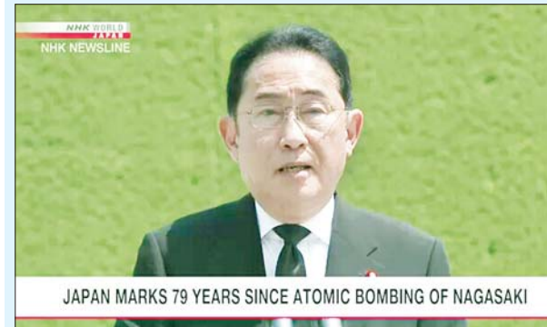
JAPAN MARKS 79 YEARS SINCE ATOMIC BOMBING OF NAGASAKI

မတ်မတ်ဖြင့် လက်တွေ့ကျကျ ကြိုးပမ်း အားထုတ်လျက်ရှိကြောင်း အထူးမြေပုံဆွဲဒဏ် ခံရသူများအသိုက်အဝန်းများအကြားတွင် ဖြစ်ပေါ်နေသည့် သဘောထားကွဲလွဲမှုများ၊ လုံခြုံရေးဆိုင်ရာ ပတ်ဝန်းကျင်အခြေအနေ များကြောင့် အထူးမြေပုံဆွဲဒဏ်ခံခဲ့ရသူများ အန္တရာယ်များ ပေါ်ပေါက်နေသည့်အတွက် ကမ္ဘာလူမှုအသိုက်အဝန်းကြားတွင် နာဂါဆာကီ မြို့သည်သာ အထူးမြေပုံဆွဲဒဏ်ခံခဲ့ရသည့် နောက်ဆုံးနေရာတစ်ခု ဖြစ်စေလိုကြောင်း ဝန်ကြီးချုပ် ကီရိုဒါက အလေးအနက် ပန်ကြား လိုက်သည်။