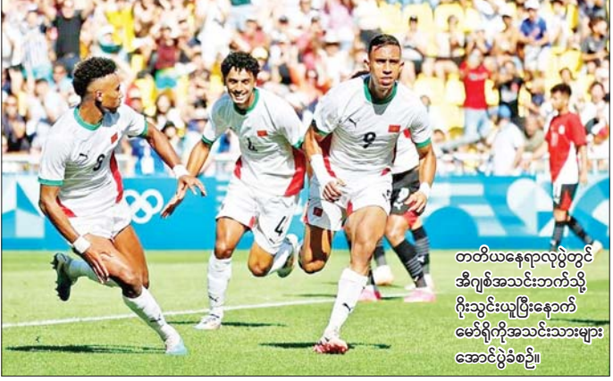
တတိယနေရာလှည့်တွင် အီဂျစ်အသင်းဘက်သို့ ဂိုးသွင်းယူပြီးနောက် မော်ရိုကိုအသင်းသားများ အောင်ပွဲခံစဉ်။

ပါရီအိုလံပစ် ၂၀၂၄ အမျိုးသား ယူ-၂၃ ဘောလုံးပြိုင်ပွဲ တတိယနေရာလှည့်မှ အီဂျစ် ယူ-၂၃ နှင့် မော်ရိုကို ယူ-၂၃ အသင်းပွဲစဉ်တွင် မော်ရိုကိုအသင်းက တိုက်စစ်ခြေစွမ်းပြကာ ခြောက်ဂိုးပြတ်နိုင်ပွဲရရှိပြီး တတိယနေရာရယူနိုင်ခဲ့သည်။ အဆိုပါ ပွဲစဉ်ကို ဩဂုတ် ၈ ရက် ည ၉ နာရီခွဲက ယှဉ်ပြိုင်ကစားခဲ့ပြီး ပရိသတ် ၂၇၀၀၀ ကျော် လာရောက်ကြည့်ရှုခဲ့သည်။ အီဂျစ်အသင်းသည် ခြေစွမ်းကောင်းအချို့ ပြသနိုင်ခဲ့သော်လည်း ပြိုင်ဘက်အသင်းခံစစ်နှင့် ဂိုးသမားတို့ကို ကျော်ဖြတ်နိုင်ခြင်းမရှိသည့်အတွက် တတိယနေရာရယူခွင့် လွှဲချော်ခဲ့ရသည်။ ပြိုင်ဘက် မော်ရိုကိုအသင်းက ရရှိလာသည့်အခွင့်အရေးကို အဓိအရ အသုံးပြုကာ ဂိုးအဖြစ်ပြောင်းလဲနိုင်သည့်အတွက် ခြောက်ဂိုးပြတ်နိုင်ပွဲကို ဖော်ဆောင်နိုင်ခဲ့ခြင်း ဖြစ်သည်။ စာမျက်နှာ ၁၂ ကော်လံ ၂ *