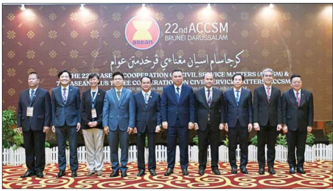
ချက်အပေါ် ဆွေးနွေးအတည်ပြုခြင်း၊ အာဆီယံနိုင်ငံဝန်ထမ်းဆိုင်ရာ ပူးပေါင်းဆောင်ရွက်ရေးကဏ္ဍ လုပ်ငန်းစီမံချက် (၂၀၂၅-၂၀၃၀) ရေးဆွဲရေးအတွက် လုပ်ငန်းစဉ်များတင်ပြခြင်း၊ ဘရူနိုင်းဒါရဆလမ်နိုင်ငံမှ ကမ္ဘာ့ဒီးယားနိုင်ငံသို့ (၂၃) ကြိမ်မြောက် (၂၀၂၄-၂၀၂၆) ကာလအတွင်း အာဆီယံ နိုင်ငံဝန်ထမ်းဆိုင်ရာ ပူးပေါင်းဆောင်ရွက်ရေး ကဏ္ဍ အတွက် အလှည့်ကျဥက္ကဋ္ဌတာဝန် လွှဲပြောင်းပေးအပ်သည့် အခမ်းအနားနှင့် ကမ္ဘာ့ဒီးယားနိုင်ငံ၏ နိုင်ငံဝန်ထမ်း အကြီးအကဲက

ပူးပေါင်း ဆောင်ရွက်ရေးကဏ္ဍ လုပ်ငန်းစီမံချက် (၂၀၂၁-၂၀၂၅) နှင့် အာဆီယံအပေါင်းသုံး နိုင်ငံဝန်ထမ်းဆိုင်ရာ ပူးပေါင်းဆောင်ရွက်ရေးကဏ္ဍ လုပ်ငန်းစီမံချက် (၂၀၂၁-၂၀၂၅) အတွက် အာဆီယံ အဖွဲ့ဝင်နိုင်ငံအလိုက် အကောင်အထည်ဖော် ဆောင်ရွက်နေသည့် လုပ်ငန်းစဉ်များနှင့် ပတ်သက်၍ ဆွေးနွေးအတည်ပြုခြင်း၊ အခြားဆက်စပ် အစည်းအဝေးများတွင် ACCSM ကဏ္ဍအတွက် အတည်ပြုချက်နှင့် ဆုံးဖြတ်ချက်များအပေါ် အလေးထားဆောင်ရွက်ခြင်း၊ ဘရူနိုင်းဒါရဆလမ်နိုင်ငံမှ အဆိုပြုထားသည့် နိုင်ငံဝန်ထမ်းကဏ္ဍတွင် အလုပ်နှင့်ဘဝ ဟန်ချက်ညီမှုရှိစေရေး၊ ဝန်ထမ်းများ၏ ကိုယ်စိတ်ကုန်းမာရေးအပေါ် အစိုးရ၏မဟာဗျူဟာများ ခိုင်မာအားကောင်းရေးဆိုင်ရာ အာဆီယံထုတ်ပြန်