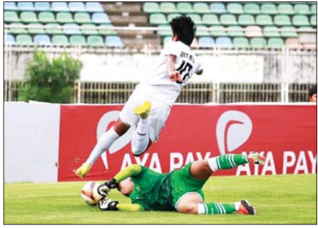
Dagon Port အသင်းနှင့် မြဝတီအသင်း ယှဉ်ပြိုင်စဉ်။

အတွက် နှစ်နာသည့်ပွဲဖြစ်ပြီး ဦးဆောင်ဂိုး မထိန်းနိုင်သဖြင့် အရှုံးနှင့် ရင်ဆိုင်ခဲ့ရခြင်း ဖြစ်သည်။ အမှတ်လိုနေသည့်နှစ်သင်း တွေ့ဆုံသောကြောင့် အမာခံကစားသမား အစုံအလင်အသုံးပြုကာ ပွဲထွက်ခဲ့သည်။ Dagon Port အသင်းသည် ပွဲစတင်ပွဲစတင်ကတည်းက တိုက်စစ် ဖွင့်ကစားသလို မြဝတီအသင်းကလည်း တန်ပြန်တိုက်စစ်ဖြင့် ကစားခဲ့သည်။ သို့သော် ပထမပိုင်းတွင် နှစ်သင်းစလုံး စာမျက်နှာ ၉ ကော်လံ ၅ *