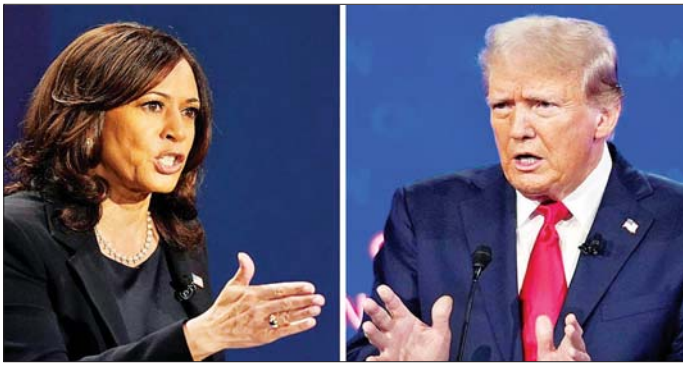
ဒုတိယသမ္မတ ကာမလာဟားရစ်နှင့် အမေရိကန်သမ္မတဟောင်း ဒေါ်နယ်ထရမ်။

ဝါရှင်တန် ဩဂုတ် ၉ အမေရိကန် ဒုတိယသမ္မတ ကာမလာဟားရစ်နှင့်အမေရိကန် သမ္မတဟောင်း ဒေါ်နယ်ထရမ်တို့ သည် လာမည့် အမေရိကန်သမ္မတ ရွေးကောက်ပွဲအတွက် ၎င်းတို့၏ ပထမအကြိမ် ရုပ်သံစကားစစ်ထိုး ပွဲကို စက်တင်ဘာ ၁၀ ရက်တွင် ပြုလုပ်မည်ဟု သဘောတူခဲ့သည်။ အမေရိကန် သမ္မတ ရွေးကောက်ပွဲ မဲဆွယ်ပွဲများတွင် ဒီမိုကရက်တစ်နှင့် ရီပတ်ဘလီ ကင် သမ္မတလောင်းများသည် ရုပ်မြင်သံကြားမှ စကားစစ်ထိုးပွဲ များပြုလုပ်လေ့ရှိသည်။ စက်တင်ဘာ ၄ ရက်၊ ၁၀ ရက် နှင့် ၂၅ ရက်တို့တွင် ဟားရစ်နှင့် စကားစစ်ထိုးရန် တီဗွီကွန်ရက်