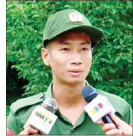
ပြည်သူ့စစ်မှုထမ်းသင်တန်း အမှတ်စဉ်(၄)မှ သင်တန်းသားများ။