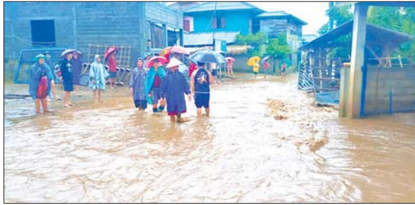
ဖြစ်ပေါ်ခဲ့သည်။ မြောက်မြောက်ဘက်ပိုင်းဝင်များက သွားရောက်ပြီး လိုအပ်သည်များ ကူညီဆောင်ရွက်ပေးကြသည်။ နိုင်းအောင်ဇော်လင်း(ပြန်/ဆက်)

မိုင်းယောင်း ဩဂုတ် ၅ ရက်နေ့ညပိုင်း (အရှေ့ပိုင်း) မိုင်းယောင်းမြို့နယ်၌ ဩဂုတ် ၅ ရက် နံနက် ၈ နာရီက မိုးသည်းထန်စွာ ရွာသွန်းပြီး တောင်ကျရေစီးဆင်းမှုကြောင့် နမ့်လျန်ချောင်းနှင့် နမ့်ဝမ်ချောင်း ရေကြီးမှုဖြစ်ပေါ်ကြောင်း သိရသည်။