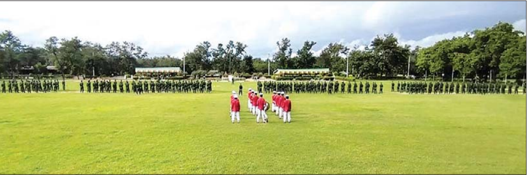
သင်တန်းကျောင်းတစ်ခု၌ ပြည်သူ့စစ်မှုထမ်း အမှတ်စဉ် (၄) ဖွင့်ပွဲ ကျင်းပစဉ်။

စာမျက်နှာ ၁၀ မှ နောက်ပြီးတော့ စနစ်တကျနဲ့ နေထိုင်နိုင်မယ်။ တပ်အပေါ်မှာ တချို့တွေဆိုရင် အမြင်မတူတာတွေရှိတယ်။ တပ်ဆိုတာက သူများတွေ အပြင်မှာ ပြောသလောက်မဆိုးပါဘူး။ အထဲမှာ အလွန်ကောင်းပါတယ်။ စည်းကမ်းတကျ နေထိုင်နိုင်အောင်လည်း ပြုပြင်ပေးနိုင်တဲ့ နေရာတစ်ခုပါလို့ ပြောချင်ပါတယ်။ နောက်ထပ်လာမယ့် ညီအစ်ကိုတွေကိုလည်း လာပါ။ တက်ကြပါလို့။ ဘာပဲပြောပြော နိုင်ငံအတွက် တစ်ထောင့်တစ်နေရာကနေ ကူညီပြီးတော့ တာဝန်ထမ်းဆောင်ကြပါလို့ ပြောချင်ပါတယ်။