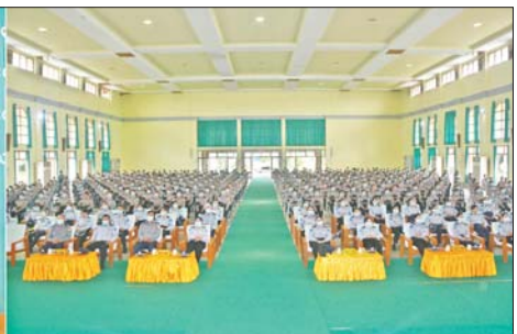
နိုင်ငံဝန်ထမ်းတက္ကသိုလ်(အောက်မြန်မာပြည်) အရာထမ်းငယ်သင်တန်းအမှတ်စဉ်(၁၃၀) သင်တန်းဖွင့်ပွဲ အခမ်းအနားကျင်းပ