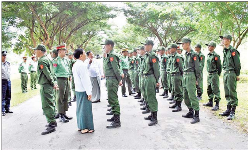
နေပြည်တော်ကောင်စီဥက္ကဋ္ဌ၊ တိုင်းဒေသကြီးဝန်ကြီးချုပ်နှင့် တိုင်းမှူးများက ပြည်သူ့စစ်မှုထမ်းသင်တန်းအမှတ်စဉ်(၄)မှ သင်တန်းသားများအား ရင်းရင်းနှီးနှီး လိုက်လံနှုတ်ဆက်အားပေးစဉ်။ (အပေါ်ပုံနှင့် အောက်ယာပုံ)

ရင်းရင်းနှီးနှီး နှုတ်ဆက်အားပေး အဆိုပါ သင်တန်းကျောင်းများသို့ နေပြည်တော်ကောင်စီဥက္ကဋ္ဌ တိုင်းဒေသကြီးနှင့် ပြည်နယ်ဝန်ကြီးချုပ်များ၊ တိုင်းမှူးများနှင့် တာဝန်ရှိသူများက သွားရောက်၍ပြည်သူ့စစ်မှုထမ်းသင်တန်းအမှတ်စဉ်(၄)မှ သင်တန်းသားများအား တွေ့ဆုံကာ သင်တန်းသားများအတွက် ဂုဏ်ပြုချီးမြှင့်ငွေများနှင့် ထောက်ပံ့ပစ္စည်းများ ပေးအပ်ကြပြီး သင်တန်းသားများအား ရင်းရင်းနှီးနှီး လိုက်လံနှုတ်ဆက်