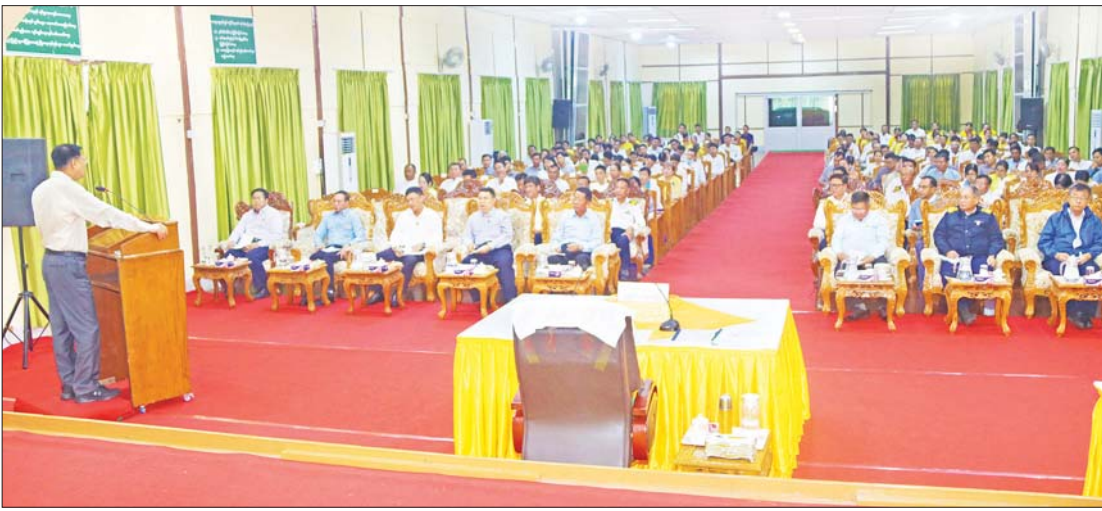
နိုင်ငံတော်စီမံအုပ်ချုပ်ရေးကောင်စီအဖွဲ့ဝင်၊ ဒုတိယဝန်ကြီးချုပ်နှင့် ပို့ဆောင်ရေးနှင့် ဆက်သွယ်ရေးဝန်ကြီးဌာန ပြည်ထောင်စုဝန်ကြီး ဗိုလ်ချုပ်ကြီး မြထွန်းဦး ပုသိမ်မြို့၌ တာဝန်ထမ်းဆောင်လျက်ရှိကြသော ဝန်ကြီးဌာနလက်အောက် ဌာနအဖွဲ့အစည်းများမှ တာဝန်ခံအရာရှိများ၊ ဝန်ထမ်းများအား တွေ့ဆုံအမှာစကားပြောကြားစဉ်။

နေပြည်တော် ဇူလိုင် ၁၅ နိုင်ငံတော်စီမံအုပ်ချုပ်ရေးကောင်စီအဖွဲ့ဝင်၊ ဒုတိယဝန်ကြီးချုပ်နှင့် ပို့ဆောင်ရေးနှင့် ဆက်သွယ်ရေးဝန်ကြီးဌာန ပြည်ထောင်စုဝန်ကြီး ဗိုလ်ချုပ်ကြီး မြထွန်းဦးသည် ရောဂါတိုင်းဒေသကြီး ဝန်ကြီးချုပ် ဦးတင်မောင်ဝင်း၊ ဒုတိယဝန်ကြီးဦးအောင်မြင်နှင့် တာဝန်ရှိသူများ လိုက်ပါ၍ ဇူလိုင် ၁၃ ရက် နံနက်ပိုင်းက ရောဂါတိုင်းဒေသကြီး ညောင်တန်းမြို့၊ ပန်းလှိုင်မြစ်ကမ်းပါး ရေတိုက်စားမှု ကာကွယ်ရေးလုပ်ငန်းများ ဆောင်ရွက်နေသည့်နေရာသို့ သွားရောက်ကြည့်ရှုစစ်ဆေးသည်။