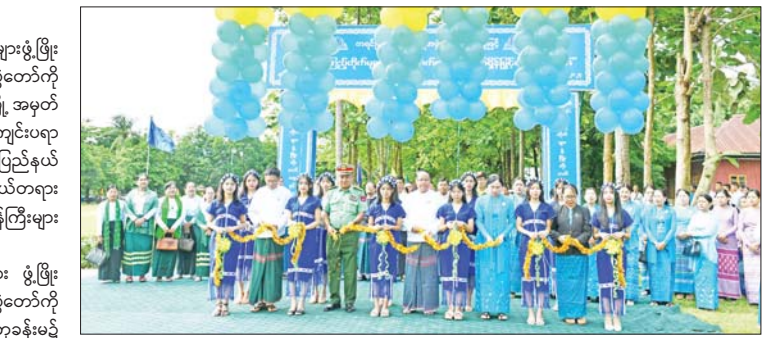
နိုင်မှသာ အသက်အရွယ်ကြီးရင့်လာချိန်တွင် စာဖတ် သည့် အလေ့အထများစွဲမြဲလာမည်ဖြစ်ပြီး သို့မှသာ စာကြည့်တိုက်ယဉ်ကျေးမှု ထွန်းကား၍ စာကြည့် တိုက်များ ရေရှည်ဖွံ့ဖြိုးတိုးတက်လာမည်ဖြစ် ကြောင်း ပြောကြားသည်။ ယင်းနောက် ပြည်နယ်ဝန်ကြီးချုပ်က ကရင်ပြည် နယ်အတွင်း ကျေးရွာစာကြည့်တိုက် အဆောက်အအုံ အသစ်ဆောက်လုပ်ရန်အတွက် ကျေးရွာစာကြည့် တိုက်တစ်တိုက်လျှင် ငွေကျပ်သိန်း ၁၅၀ နှုန်းဖြင့် ကျေးရွာစာကြည့်တိုက် ငါးတိုက်ကို လှူဒါန်းပေးခဲ့ ကြသောအလှူရှင်များအား ဂုဏ်ပြုမှတ်တမ်းလွှာများ ပြန်လည်ပေးအပ်ကာ ပြည်နယ်အမျိုးသမီးရေးရာ

ဘားအံ ဇူလိုင် ၁၅ ကရင်ပြည်နယ် ကျောင်းစာကြည့်တိုက်များဖွံ့ဖြိုး တိုးတက်ရေးနှင့် စာဖတ်ရိုက်နှိမ်ခြင်းတင်ရေးပွဲတော်ကို ဇူလိုင် ၁၅ ရက် နံနက် ၉ နာရီက ဘားအံမြို့ အမှတ် (၂) အခြေခံပညာအထက်တန်းကျောင်း၌ ကျင်းပရာ ကရင်ပြည်နယ်ဝန်ကြီးချုပ် ဦးစောမြင့်ဦး၊ ပြည်နယ် အမျိုးသမီးရေးရာအဖွဲ့ နာယက၊ ပြည်နယ်တရား လွှတ်တော်တရားသူကြီးချုပ်၊ ပြည်နယ်ဝန်ကြီးများ က ဖဲကြိုးဖြတ်ဖွင့်လှစ်ပေးသည်။ (ယာဝုံ) ထို့နောက် ကျောင်းစာကြည့်တိုက်များ ဖွံ့ဖြိုး တိုးတက်ရေးနှင့် စာဖတ်ရိုက်နှိမ်ခြင်းတင်ရေးပွဲတော်ကို အဆိုပါ အထက်တန်းကျောင်း ရွှေရတနာခန်းမ၌ ဆက်လက်ကျင်းပရာ ပြည်နယ်ဝန်ကြီးချုပ်က အသိပညာဗဟုသုတဉာဏ်ပညာကြွယ်ဝသူများဖြစ်ရန် အကောင်းဆုံးနှင့် အရိုးရှင်းဆုံးနည်းလမ်းမှာ စာပေ ဖတ်ရှုလေ့လာခြင်းပင်ဖြစ်ကြောင်း၊ စာကြည့်တိုက် များသို့ သွားရောက်စာဖတ်ကြည့်ရှုလေ့လာထိုင်ထွက် သွားလာသည့် အလေ့အကျင့်ကောင်းများကို မွေးမြူ