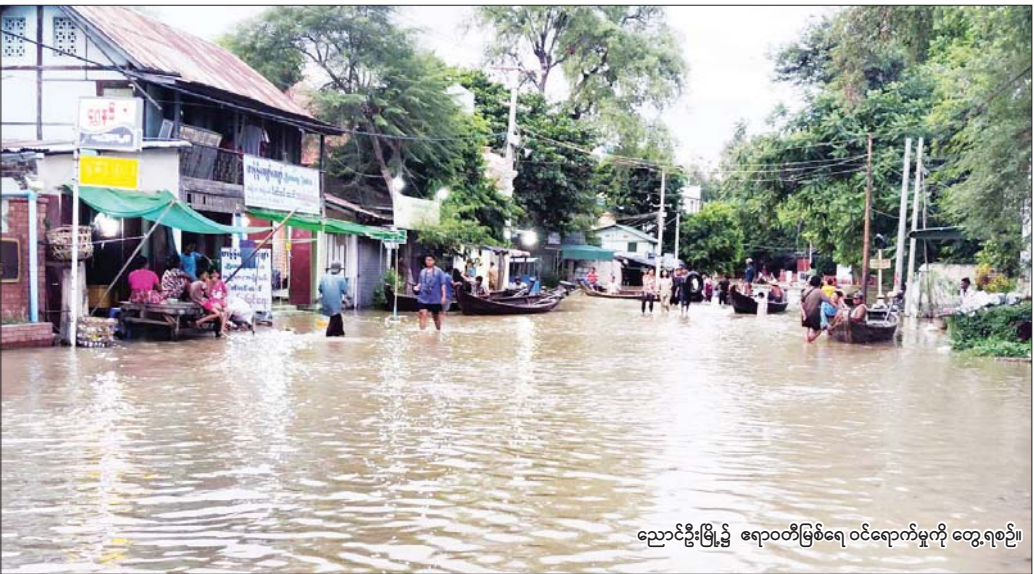
ညောင်ဦးမြို့၌ ရောဝတီမြစ်ရေ ဝင်ရောက်မှုကို တွေ့ရစဉ်။

သည်။ အပြန်အလှန်ဆွေးနွေးပွဲတွင် အထူးအစီရင်ခံစာတင်သွင်း သူသည် အဖျက်အမှောင်သတင်းမီဒီယာများ၊ တိုင်းရင်းသားလက်နက် ကိုင်သောင်းကျန်းသူအဖွဲ့များနှင့် NUG နှင့် ဆက်သွယ်သော အကြမ်း ဖက် PDF အဖွဲ့များ၏ စွပ်စွဲမှုများနှင့် ပုံဖော်ပြောဆို ဝါဒဖြန့်မှုများကို သာ သံယောင်လိုက် ပြောဆိုထားသည်။ အဆိုပါအကြမ်းဖက်အဖွဲ့ အစည်းများကြောင့် ၂၀၂၁ ခုနှစ်၊ ဖေဖော်ဝါရီလမှ ၂၀၂၄ ခုနှစ်၊ ဇူလိုင်လ အထိ အပြစ်မဲ့အရပ်သား ၇,၈၀၀ ကျော် အသက်ဆုံးရှုံးခဲ့ပြီးဖြစ်သည်။ အထူးအစီရင်ခံစာတင်သွင်းသူသည် တရားမဝင်အဖွဲ့အစည်းများ၏ အကြမ်းဖက်လုပ်ရပ်များနှင့် ရက်စက်ကြမ်းကြုတ်သော လုပ်ရပ်များ ကို ရှုတ်ချရမည့်အစား ယင်းအဖွဲ့အစည်းများနှင့် ထိတွေ့ဆောင်ရွက် ရန် နိုင်ငံတကာကို တိုက်တွန်းလျက်ရှိရာ၊ ပြည်သူ့အားလုံး၏ ငြိမ်းချမ်း ရေးနှင့် လုံခြုံရေးကို ထိန်းသိမ်းရန်အတွက် မြန်မာနိုင်ငံ၏ ကြိုးပမ်းမှု များကို အဟန့်အတားဖြစ်စေသည်။ အထူးအစီရင်ခံစာတင်သွင်းသူက ထုတ်ပြန်ထားသည့် တာဝန်မဲ့ သော အစည်းအဝေးစာရွက်စာတမ်းများတွင် တရားဝင်ဘက်လုပ်ငန်း များသည် စစ်ရေးလှုပ်ရှားမှုများကို ထောက်ပံ့နေသောသော လွှဲမှားစွာ ဖော်ပြထားရာ၊ အထင်အမြင်လွှဲမှားမှုများ နက်ရှိုင်းစွာဖြစ်ပေါ်စေသည်။ ယင်းစာရွက်စာတမ်းများတွင် မြန်မာပြည်သူများ၏ လူမှုစီးပွားဘဝ အပေါ် ပြင်းထန်သော သက်ရောက်မှုများ ဖြစ်ပေါ်လာစေနိုင်သည်ကို လျစ်လျူရှုလျက် မြန်မာနိုင်ငံအပေါ် တစ်ဖက်သတ်ပိတ်ဆို့အရေးယူ မှုများ ပြုလုပ်ရန် မျှတမှုကင်းမဲ့စွာ တောင်းဆိုထားသည်။ အိုအိုင်စီက မကြာသေးမီက တင်သွင်းခဲ့သည့် ဆုံးဖြတ်ချက်အဆို အပါအဝင် ယခင်လူ့အခွင့်အရေးကောင်စီအစည်းအဝေးများ၌ ချမှတ် ခဲ့သော စာမျက်နှာ ၃ ကော်လံ ၁