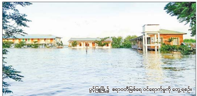
ပွင့်ဖြူမြို့၌ ဧရာဝတီမြစ်ရေ ဝင်ရောက်မှုကို တွေ့ရစဉ်။

ထားသည့် ရေဘေးကယ်ဆယ်ရေးစခန်းသို့ သွားရောက်အားပေးစကားပြောကြားပြီး ရေဘေးသင့်ပြည်သူ ၅၅ ဦးအတွက် တိုင်းဒေသကြီးအစိုးရအဖွဲ့ အစီအစဉ်ဖြင့် ဆန်၊ ဆီ၊ ကြက်ဥ၊ ခေါက်ဆွဲခြောက်၊ ကုလားပဲ၊ ဆားများနှင့် ဘေးအန္တရာယ်ဆိုင်ရာ စီမံခန့်ခွဲမှုဦးစီးဌာနမှ ထောက်ပံ့သည့် ဆန်ရိက္ခာဖိုး နှစ်ပတ်စာ ထောက်ပံ့ငွေကျပ် ၂၁၃၇၈၀၀ ကို ပေးအပ်ပြီး လူစုလူဝေးဖြင့် နေထိုင်သည့်အတွက် ဝမ်းရောဂါနှင့် အခြားကူးစက်ရောဂါဖြစ်ပွားမှုမရှိစေရေး တာဝန်ရှိသူများအား မှာကြားသည်။ ယင်းနောက် ရွှေမျက်မှန် ရုပ်ပွားတော်မြတ်အား သွားရောက်ဖူးမြော်ပြီး ဘက်စုံပြုပြင်မွမ်းမံနိုင်ရေး အလှူငွေများ လှူဒါန်းသည်။ ဆက်လက်၍ တိုင်းဒေသကြီးဝန်ကြီးချုပ်နှင့် အဖွဲ့သည် အန္တရာယ်ရှိသည့် နေရာများတွင် အမှတ်အသားများ ပြုလုပ်ထားရန်နှင့် လျှပ်စစ်မီးအန္တရာယ်ဖြစ်ပွားမှုမရှိစေရေး အလေးထား တာဝန်ရှိသူများ ဆောင်ရွက်ရန် မှာကြားကာ ဧရာဝတီမြစ်ရေလုံခြုံရေးများ ချထားရန်၊ ဝင်ရောက်သည့် ယွန်းတန်းတိုင်းဒေသကြီး(ပြန်/ဆက်)