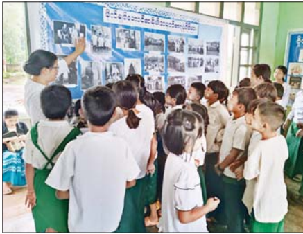
မိုင်းရှူး

ရမ်းပြည်နယ်(တောင်ပိုင်း) မိုင်းရှူးမြို့နယ် ကြူလွိုင်ကျေးရွာ အခြေခံ ပညာမူလတန်းကျောင်း၌ (၇၇) နှစ်မြောက် အာဇာနည်နေ့ အထိမ်းအမှတ် အကြိုဟောပြောပွဲကို ဇူလိုင် ၁၅ ရက်က ပြန်ကြားရေးနှင့် ပြည်သူ့ဆက်ဆံရေးဦးစီးဌာန မြို့နယ်ဦးစီးမှူးနှင့် ဝန်ထမ်းများက ကွင်းဆင်းဆောင်ရွက်ခဲ့သည်။