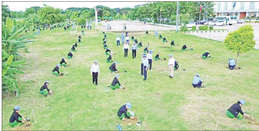
များကို စုပေါင်းစိုက်ပျိုးခဲ့ကြောင်းနှင့် နယ်စပ်ရေးရာဝန်ကြီးဌာန အနေဖြင့် ယနေ့ စိုက်ပျိုးခဲ့သည့် သစ်ပင်ပေါင်း ၉၉၅ ပင်နှင့် ပထမအကြိမ်စိုက်ပျိုးခဲ့ သည့် သစ်ပင်ပေါင်း ၁၂၀၀၀ အပါအဝင် စုစုပေါင်း ၂၂၆၅၅ ပင်တို့ကို စိုက်ပျိုးခဲ့ပြီး ရှင်သန်အောင်မြင် ဖြစ်ထွန်းရေးအတွက် ထိန်းသိမ်းပြုစု ဆောင်ရွက်လျက်ရှိ ကြောင်း သတင်းရရှိသည်။ သတင်းစဉ်

မန်ကျည်းပင် စုစုပေါင်းအပင် ၃၀၀ ကို စုပေါင်းစိုက်ပျိုးကြသည်။ ထို့နောက် ပြည်ထောင်စုဝန်ကြီးသည် ဝန်ထမ်းများ စုပေါင်းသစ်ပင်စိုက်ပျိုး နေမှုကို လှည့်လည်ကြည့်ရှု အားပေး ပြီး (ယာဝုံ) ယခုနှစ်၏ ပထမအကြိမ်နှင့် ယခင်နှစ်များက စိုက်ပျိုးထားရှိသည့် ရတနာတန်းဝင်ပင်၊ နှစ်ရည်ပင်၊ အရိပ်ရ လေကာပင်များ၏ ရှင်သန်ဖြစ်ထွန်းမှုနှင့် ပြန်လည်အစားထိုး စိုက်ပျိုးထားရှိမှုအခြေ အနေကို ကြည့်ရှုစစ်ဆေးသည်။ အလားတူ နယ်စပ်ရေးရာဝန်ကြီးဌာန ကွပ်ကဲမှုအောက်ရှိ တက္ကသိုလ်၊ ကောလိပ်၊ ရုံး၊ ကျောင်းများတွင်လည်း ၂၀၂၄ ခုနှစ် ဒုတိယအကြိမ် မိုးရာသီ သစ်ပင်စိုက်ပျိုး ပွဲများကို တစ်ပြိုင်တည်း ကျင်းပပြုလုပ်၍ ရတနာတန်းဝင်ပင်များ၊ နှစ်ရည်ပင်များ၊ အရိပ်ရ လေကာပင်များနှင့် သီးပင်စားပင်