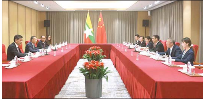
ပြည်ထောင်စုဝန်ကြီး ဒေါက်တာကဇော် ဦးဆောင်သော အဖွဲ့နှင့် တရုတ်နိုင်ငံ နိုင်ငံတကာ ဖွံ့ဖြိုးတိုးတက်ရေးနှင့် ပူးပေါင်းဆောင်ရွက်ရေးအေဂျင်စီ (CIDCA) ဥက္ကဋ္ဌ H.E. Mr. Luo Zhaohui တို့ ဆွေးနွေးစဉ်။