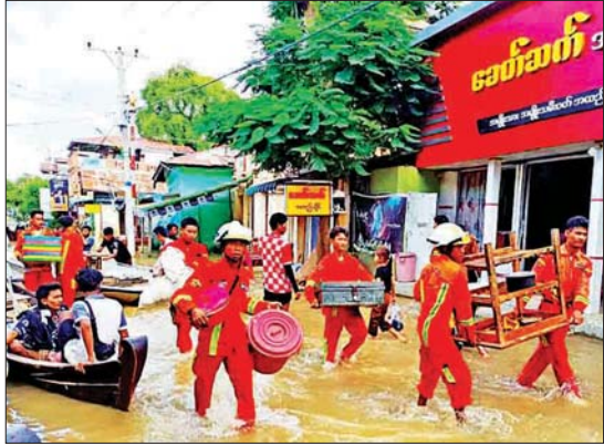
ရေဘေးသင့်ပြည်သူများ၏ အသုံးအဆောင်များကို ရွှေ့ပြောင်းပေးနေသော မီးသတ်တပ်ဖွဲ့ဝင်များ။