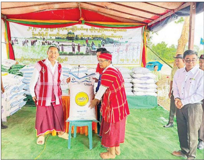
နိုင်ငံတော်စီမံအုပ်ချုပ်ရေးကောင်စီအဖွဲ့ဝင် မန်းငြိမ်းမောင် မိုးစပါးစိုက်တောင်သူများအား သွင်းအားစုပေးအပ်ပွဲအခမ်းအနားမှာ တက်ရောက်ပြီး ဆက်လက်၍ နိုင်ငံတော်စီမံအုပ်ချုပ်ရေးကောင်စီအဖွဲ့ဝင်များသည် ရော့ဝတီတိုင်းဒေသကြီး

ပုသိမ် ဇူလိုင် ၁၄ နိုင်ငံတော် စီမံအုပ်ချုပ်ရေးကောင်စီအဖွဲ့ဝင် မန်းငြိမ်းမောင်သည် ရော့ဝတီတိုင်းဒေသကြီး အစိုးရအဖွဲ့ဝင်များနှင့်အတူ ယနေ့နံနက်ပိုင်းတွင် မြောင်းမြမြို့နယ် မွေတော်ရမ်းစုကျေးရွာသို့ ရောက်ရှိပြီး တောင်သူဦးတင်ဖေ၏ လယ်မြေ ၈၀၀ ဧက ကို ကောက်စိုက်စက်ဖြင့် မိုးစပါး စိုက်ပျိုးနေမှုနှင့် ကောက်စိုက်သမ္မတ ငြိမ်းတန်းလက်စိုက် စိုက်ပျိုးနေမှုကိုလည်းကောင်း၊ တောင်သူ ဦးတင်ဖေ၏ လယ်မြေ၌ တတ်ယာသီးနှံ စပါးရိုက်သိမ်းနေမှုကို လည်းကောင်း၊ လှည့်လည်ကြည့်ရှုအားပေးကာ လိုအပ်သည်များ ဆွေးနွေးမှာကြားသည်။