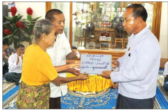
တာဝန်ရှိသူများနှင့် ဖြည့်ဆည်းပေးခြင်းစပ် ဆောင်ရွက်ပေးကာ ချင်းတွင်းမြစ်ရိုး တစ်လျှောက် ရေထိန်းတာပေါင်များ ကြိုခိုင်မှုရှိစေရေးတို့ကို လိုက်လံကြည့်ရှု စစ်ဆေးခဲ့ကြောင်း သိရသည်။ တိုင်းဒေသကြီး(ပြန်/ဆက်)

သည် အိမ်ဆောက်ပစ္စည်း၊ ဆန်ရိက္ခာဖိုးငွေကျပ် ၃၆၅၈၃၀၀နှင့် ကယ်ဆယ်ရေးပစ္စည်း ၁၆ မျိုးပါဝင်များအား မီးဘေးသင့်ပြည်သူများထံ ထောက်ပံ့ပေးအပ်ကြသည်။ ထို့နောက် တိုင်းဒေသကြီး ဝန်ကြီးချုပ်နှင့် တာဝန်ရှိသူများသည် မုံရွာမြို့အား ချင်းတွင်းမြစ်ရေ ဝင်ရောက်မှုအခြေအနေနှင့် မြစ်ရေဝင်ရောက်မှုမရှိစေရေးအတွက် ဌာနဆိုင်ရာများနှင့် ရပ်ကွက်နေပြည်သူများက ချင်းတွင်းမြစ်ရိုးတစ်လျှောက် ရေထိန်းတာပေါင်များကို အဆင့်မြှင့်တင် ဆောင်ရွက်နေမှုများနှင့် ရေစိမ့်ဝင်သည့်နေရာများကို သဲအိတ်များဖြင့် ကာရံနေမှုများအား လိုက်လံကြည့်ရှုစစ်ဆေးပြီး လိုအပ်သည်များကို