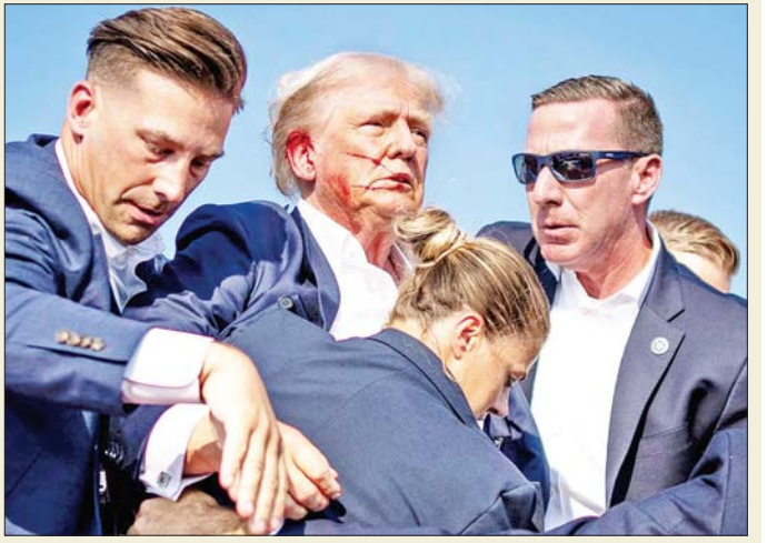
သေနတ်သံများထွက်ပေါ်လာပြီးနောက် ထောက်လှမ်းရေးဌာနမှ အရာရှိများက ထရမ်အား ပိုင်းခန်းကာကွယ်ထားသည်ကို တွေ့ရစဉ်။

ခဲ့ကြောင်း၊ သံသယရှိသူသည် အဆောက်အအုံခေါင်းပေါ်မှ ရိုင်ဖယ်သေနတ်ဖြင့် ရှစ်ချက်ခန့် ပစ်ခတ်ခဲ့ခြင်းဖြစ်ကြောင်း စုံစမ်းစစ်ဆေးရေးအာဏာပိုင်များ၏ ပြောကြားချက်ကို ကိုးကား၍ အေဘီစီသတင်းဌာနတွင် ဖော်ပြထားသည်။ ထရမ်ကလည်း ပစ်ခတ်ခံရမှုအပြီးတွင် လူမှုကွန်ရက်မီဒီယာပေါ်၌ ကြေညာချက်ထုတ်ပြန်ခဲ့သည်။ သေဆုံးသွားသူနှင့် ဒဏ်ရာရရှိခဲ့သူများ၏ မိသားစုဝင်များကို ဝမ်းနည်းကြောင်း ၎င်းက ပြောကြားခဲ့သည်။ ထရမ်က ၎င်းတို့ နိုင်ငံတွင် ယခုကဲ့သို့ အဖြစ်အပျက်မျိုးဖြစ်လာသည်မှာ ယုံကြည်ဖွယ်ရာမရှိကြောင်း၊ ပစ်ခတ်သူနှင့် ပတ်သက်၍ မည်သည့်အကြောင်းအရာမျှ မသိရသေးကြောင်း ပြောကြားခဲ့သည်။ အမေရိကန်သမ္မတ ဂျိုးဘိုင်းဒင်ကလည်း အဆိုပါ ဖြစ်ရပ်ကို ပြင်းပြင်းထန်ထန် ရှုတ်ချခဲ့သည်။ အမေရိကန်တွင် ယခုကဲ့သို့ အကြမ်းဖက်ဖြစ်ရပ်မျိုး အတွက် နေရာမရှိကြောင်း လူမှုကွန်ရက်မီဒီယာပေါ်တွင် ရှုတ်ချပြောဆိုခဲ့သည်။ အင်န်အိတ်ချ်က