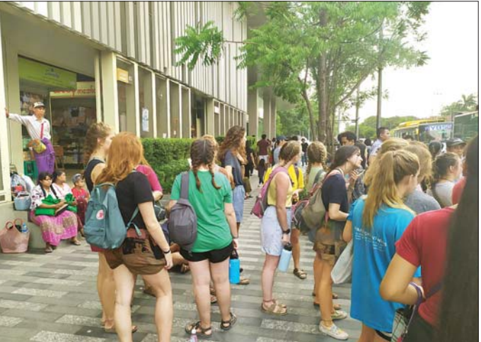
ပြည်တွင်းသို့ ဝင်ရောက်လည်ပတ်လာသည့် ပြည်ပခရီးသွားစဉ်အချို့ကို တွေ့ရစဉ်။

ရန်ကုန် ဇူလိုင် ၁၄ ပြီးခဲ့သည့် ခရီးသွားရာသီတွင် မြန်မာနိုင်ငံသို့ ပြည်ပခရီးသွားဝင်ရောက်မှု တိုးတက်မှုရှိခဲ့ရာ ခရီးစဉ်ဒေသများတိုးချဲ့၍ ဈေးကွက်ထဲ၌ Promote လုပ်ပေးပါက လာမည့်ခရီးသွားရာသီ၌ ပြည်ပခရီး သွား ဝင်ရောက်မှု ပိုများလာနိုင်ကြောင်း မြန်မာနိုင်ငံ ခရီးသွားလုပ်ငန်းရှင်များအသင်းမှ တာဝန်ရှိသူက သုံးသပ်ပြောကြားသည်။ “ခရီးသွားကဏ္ဍတိုးတက်ဖို့အတွက် လာမယ့် ခရီးသွားရာသီအတွင်း မြန်မာနိုင်ငံကို လာရောက် လည်ပတ်နေတဲ့ တရုတ်၊ ထိုင်းနိုင်ငံတွေက ခရီးသွား တွေ လာရောက်လည်ပတ်နိုင်ဖို့ သူတို့စိတ်ဝင်စားတဲ့ ခရီးစဉ်ဒေသတွေဖြစ်တဲ့ ဥပမာ တရုတ်လူမျိုးတွေ ဆိုရင် မန္တလေး၊ ထိုင်းလူမျိုးတွေဆိုရင် ရန်ကုန်၊ ပဲခူး၊ ကျိုက်ထီးရီး၊ ဒီလို့ခရီးစဉ်တွေကို စိတ်ဝင်စားကြတာ များတယ်။ အဲဒါတွေကို ကျွန်တော်တို့ဘက်က တိုးချဲ့ ပြီး လုံခြုံစိတ်ချအောင်လုပ်ပေးနိုင်ရင် ခရီးသွားတွေ က တိုးတက်နေအံ့မှာပါ။ နောက်တစ်ခါ ထိုင်းနဲ့ စာမျက်နှာ ၃ ကော်လံ ၁ *