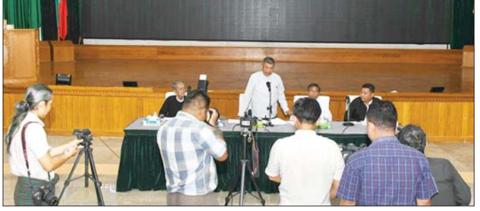
၀ ကျော့ဖိုးမှ အသင်းတို့ ပွဲချိန်အတွင်း နှစ်ရုံးစီသရေကျနေသဖြင့် ပယ်နယ်တိုင်းပြင် ဆုံးဖြတ်ရာ 7 Brother အသင်းက သုံးရိုး-ရိုးမရှိ၊ စုစုပေါင်း ငါးရိုး - နှစ်ရိုးဖြင့်လည်းကောင်း၊ ကြယ်စင်လင်းအသင်းနှင့် Sar Bal Gyi Doh အသင်းတို့ ပွဲချိန်အတွင်း လေးရိုးစီသရေကျနေသဖြင့် ပယ်နယ်တိုင်းပြင် ဆုံးဖြတ်ရာ Sar Bal Gyi Doh အသင်းက လေးရိုး-နှစ်ရိုး၊ စုစုပေါင်း ရှစ်ရိုး-ခြောက်ရိုးဖြင့်လည်းကောင်း အနိုင်ရရှိသည်။ ဆီမီးဖိုင်နယ်ပွဲစဉ်များကို ဇူလိုင် ၁၆ ရက်တွင် ဆက်လက်ကျင်းပမည်ဖြစ်ပြီး 7 Brother အသင်းနှင့် Marga အသင်း၊ Sar Bal Gyi Doh အသင်းနှင့် RPG အသင်းတို့ ယှဉ်ပြိုင်ကစားမည်ဖြစ်သည်။ ရဲရင့်လွင်၊ ဓာတ်ပုံ-MFF

စသည့် အကြမ်းဖက်လုပ်ရပ်များ လုပ်ဆောင်နေကြခြင်း အပေါ် နိုင်ငံရေးပါတီ (၂၃)ပါတီက ဇူလိုင် ၁၁ ရက်တွင် ပူးတွဲသဘောထား ထုတ်ပြန် ကြေညာချက်ကို ထုတ်ပြန်ခဲ့သည်။ အဆိုပါ ပူးတွဲသဘောထား ထုတ်ပြန် ကြေညာချက်နှင့် စပ်လျဉ်း၍ ပြည်ထောင်စု ကြံ့ခိုင်ရေးနှင့် ဖွံ့ဖြိုးရေးပါတီ၊ ဒီမိုကရက်တစ်ပါတီ၊ ပြည်ထောင်စု မြန်မာနိုင်ငံ အမျိုးသားနိုင်ငံရေးအဖွဲ့ချုပ်ပါတီနှင့် အမျိုးသားနိုင်ငံရေးမဟာမိတ်များအဖွဲ့ချုပ်ပါတီတို့မှ တာဝန်ရှိသူများက သတင်းစာရှင်းလင်းပွဲကို ယနေ့ သည့် နယ်မြေဒေသအတွင်း ဒက္ခိဏသီရိမြို့နယ်ရှိ ပြည်ထောင်စု ကြံ့ခိုင်ရေးနှင့် ဖွံ့ဖြိုးရေး ပါတီဌာနချုပ်ရုံး၌ ကျင်းပသည်။ သတင်းစာ ရှင်းလင်းပွဲတွင် ပြည်ထောင်စုကြံ့ခိုင်ရေးနှင့် ဖွံ့ဖြိုးရေးပါတီမှ ပြောရေးဆိုခွင့်ရှိသူ ဦးလှသန်းက လတ်တလောနိုင်ငံအတွင်းဖြစ်ပွားနေသည့် အကြမ်းဖက်မှုများ အမြန်ဆုံး ချုပ်ငြိမ်း၍ တိုင်းပြည်ဖွံ့ဖြိုး တိုးတက်ရေးအတွက် ဆောင်ရွက်သင့်သည်များကို ကြိုညှိသည့် ကျယ်ကျယ်ပြန့်ပြန့် သိရှိစေရန် ရှင်းလင်းပြောကြားပြီး တက်ရောက်လာကြသည့် ဒီမိုကရက်တစ်ပါတီသို့ သိရှိလိုသည်များကို မေးမြန်းကြရာ ပါတီများမှ တာဝန်ရှိသူများက ပြန်လည် ရှင်းလင်းကြေကြားကြသည်။ သတင်းစာ