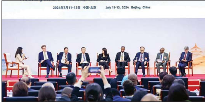
ပြည်ထောင်စုဝန်ကြီး ဒေါက်တာကဇော် ဖွံ့ဖြိုးမှုမူဝါဒအတွက် ကမ္ဘာလုံးဆိုင်ရာ ဆောင်ရွက်ချက်ဖိုရမ် ၏ ဒုတိယအကြိမ် အဆင့်မြင့်ညီလာခံ တက်ရောက်စဉ်။