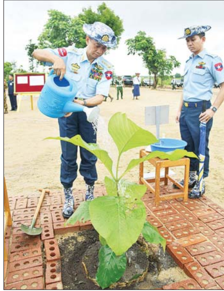
ကာကွယ်ရေးဦးစီးချုပ် (လေ) ဗိုလ်ချုပ်ကြီး ထွန်းအောင် ရတနာ တန်းဝင်ကျွန်းပင်ကို စိုက်ပျိုးပေးစဉ်။