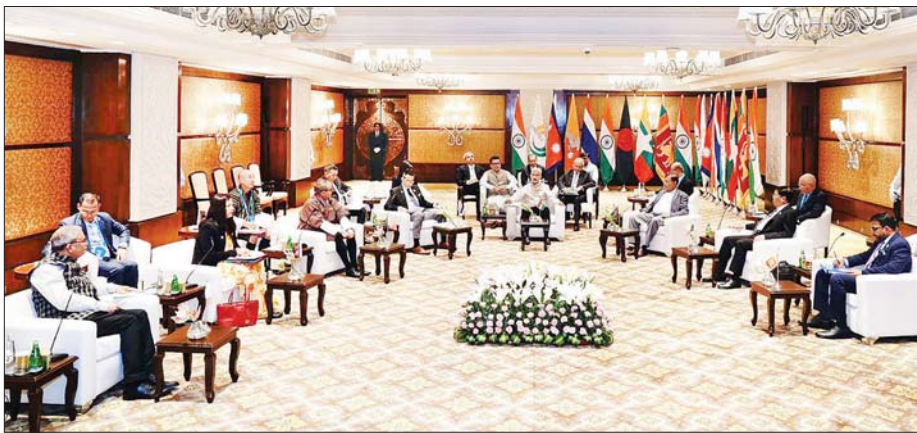
ဒုတိယအကြိမ် ဘင်းမိစတက် နိုင်ငံခြားရေးဝန်ကြီးများ၏ သီးသန့်အစည်းအဝေးကျင်းပစဉ်။

ဘင်းမိစတက်နိုင်ငံခြားရေး ဝန်ကြီးများ၏ သီးသန့်အစည်းအဝေးသို့ ဘင်းမိစတက် အဖွဲ့ဝင် နိုင်ငံများမှ ကိုယ်စားလှယ်အဖွဲ့ ခေါင်းဆောင်များ ဖြစ်ကြသည့် ဘင်္ဂလားဒေ့ရှ် နိုင်ငံခြားရေး ဝန်ကြီး ဒေါက်တာမိုဟာမတ်ဟာ ဆန်မာဟတ်၊ ဘူတန်နိုင်ငံခြားရေး နှင့် ကမ္ဘောဒီးယားနိုင်ငံခြားရေး ဝန်ကြီး ဝေလ်လင်းစွာ အမြင်ချင်း မစွတာဒီအန်ဒွန်ဂဲလ်၊ အိန္ဒိယ ပြည်ပရေးရာဝန်ကြီး ဒေါက်တာ အက်စ်ဂျိုင်ရှင်ကော၊ နီပေါနိုင်ငံခြားရေးအတွင်းဝန် မစ္စစီဝါလမ် ဆယ်လ်၊ သီရိလင်္ကာ နိုင်ငံခြားရေး