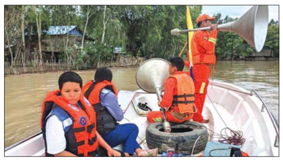
စိုးရိမ်ရေမှတ်သို့ရောက်ရှိရန် ၁၄၅ စင်တီ မီတာသာလိုတော့ကြောင်း၊ ယခု မြစ်ရေ ဝင်ရောက်သည့် ဒေသများမှာ မြစ်ကမ်း ဝန်းရံနေပြီး မြစ်ရေတက်ချိန်တွင် ပုံမှန်မြစ်ရေ

များနှင့် ကျေးရွာများတွင် နေထိုင်ကြ သော ဒေသခံပြည်သူများအား ယာယီ ကယ်ဆယ်ရေးစခန်းများနှင့် ရေဘေး လွတ်ရာနေရာများသို့ ကြိုတင်ပြောင်းရွှေ့ နေထိုင်ကြရန် ခရိုင်/မြို့နယ်မီးသတ် တပ်ဖွဲ့ဝင်များ၊ ခရိုင်ဘေးအန္တရာယ်ဆိုင်ရာ စီမံခန့်ခွဲမှုဦးစီးဌာန ဝန်ထမ်းများနှင့် ဌာနဆိုင်ရာ ပူးပေါင်းအဖွဲ့များက စီးသတ် ဦးစီးဌာနမှ စက်လှေဖြင့် လိုက်လံနူးဆော် ခြင်းများလည်း ဆောင်ရွက်လျက်ရှိသည်။