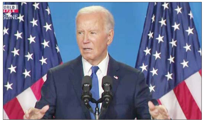
အမေရိကန် သမ္မတ ဂျိုးဘိုင်းဒင်။

သဘောတူညီချက်ကို ပြီးမြောက်အောင် လုပ်ဆောင်ပြီး စစ်ပွဲကို အဆုံးသတ်ရန် ဆုံးဖြတ်ထားကြောင်း ၎င်းက ပြောကြားသည်။ ဗဟို ထောက်လှမ်းရေး အေဂျင်စီညွှန်ကြားရေးမှူး ဘေးလ်ဘန်းနှင့် အခြားသောအမေရိကန် အရာရှိများသည် အပစ်အခတ်ရပ်စဲရေးဆွေးနွေးရန် ယခုသီတင်းပတ်အတွင်း အရှေ့အလယ်ပိုင်း ဒေသသို့ သွားရောက်ကာ ဒေသတွင်း အရာရှိကြီးများနှင့် တွေ့ဆုံခဲ့သည်ဟု သိရသည်။ အင်န်အိတ်ချီက