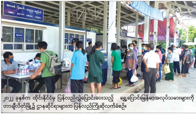
၂၀၂၂ ခုနှစ်က ထိုင်းနိုင်ငံမှ ပြန်လည်လွှဲပြောင်းပေးသည့် ရွှေ့ပြောင်းမြန်မာအလုပ်သမားများကို တာချီလိတ်မြို့၌ ဌာနဆိုင်ရာများက ပြန်လည်ကြိုဆိုလက်ခံစဉ်။

Safe Migration Facebook Page မှတစ်ဆင့် ပြည်ပအလုပ်အကိုင်အကျိုးဆောင် လိုင်စင်ရအကျဉ်းစာများမှ အလုပ်သမားတွေထုတ်ပေးလုပ်ငန်းစဉ်များ၊ အေဂျင်စီအစဉ်ဖြင့် စေလွှတ်သည့်