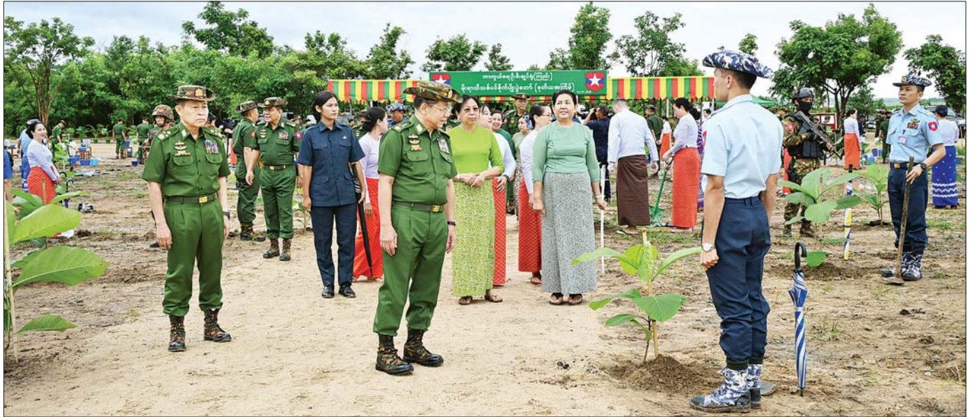
နိုင်ငံတော်စီမံအုပ်ချုပ်ရေးကောင်စီဥက္ကဋ္ဌ တပ်မတော်ကာကွယ်ရေးဦးစီးချုပ် ဗိုလ်ချုပ်မှူးကြီး မင်းအောင်လှိုင်၊ ဇနီး ဒေါ်ကြူကြူလှနှင့် အဖွဲ့ဝင်များ အရာရှိ၊ စစ်သည် မိသားစုများ၏ စုပေါင်းသစ်ပင်စိုက်ပျိုးရေးအား လှည့်လည်ကြည့်ရှုအားပေးကြစဉ်။