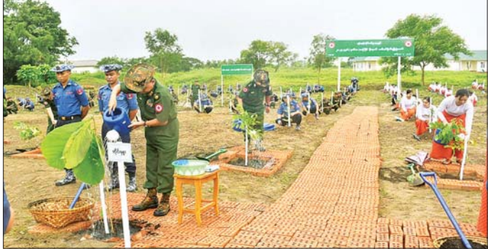
တိုင်းစစ်ဌာနချုပ် နယ်မြေများ၌ မိုးရာသီ သစ်ပင်စိုက်ပွဲများ ကျင်းပပြုလုပ်စဉ်။