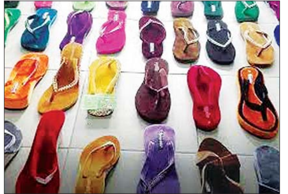
သုံးစွဲသူအကြိုက် ပြည်တွင်းထုတ် ဖိနပ်အမျိုးမျိုးကို တွေ့ရစဉ်။