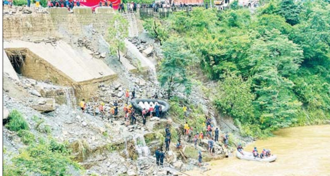
မြစ်အတွင်း ကျသွားသည့် ဘတ်စ်ကားပေါ်မှ အသက်ရှင်ကျန်ရစ်သူများကို ရှာဖွေနေသည့် ကယ်ဆယ်ရေးသမားများကို တွေ့ရစဉ်။

သည်။ ၎င်းတို့ကို ခြေရာခံလိုက်ရန် ကယ်ဆယ်ရေးအဖွဲ့များတွင် ရေငုပ်သမားများပါ ထည့်ထားခဲ့သည်ဟု ခရိုင်ရဲဌာန ပြောရေးဆိုခွင့်ရှိသူ ဘတ်စ်ရဲကူရီက ပြောသည်။ နောက်ထပ် ဖြစ်ရပ်တစ်ခုမှာ ချစ်ဝန်ခရိုင် အဝေးပြေးလမ်းတွင် ယာဉ်မောင်းနေစဉ် ယာဉ်ပေါ်သို့ ကျောက်တုံး လိမ်ကျခဲ့သည့် အတွက် ယာဉ်မောင်းသူ သေဆုံးခဲ့ရသည်။ နီပေါဝန်ကြီးချုပ် ပွတ်ရုံးပါး မခာလ်ဒဟာလ်က ကယ်ဆယ်ရေးလုပ်ငန်းများ အရှိန်မြှင့်တင်ဆောင်ရွက်ရန် လုံခြုံရေးတပ်ဖွဲ့များကို ညွှန်ကြားထားကြောင်း သိရသည်။ နီပေါနိုင်ငံတွင် မုတ်သုံရာသီဖြစ်သည့် ဇွန်လလယ်မှ အောက်တိုဘာ လဆန်းအတွင်း မိုးသည်းထန်စွာ ရွာသွန်းမှုကြောင့် ရေကြီးခြင်း၊ မြေပြိုခြင်းနှင့် ရွှံ့နှံ့များ စီးဆင်းလာခြင်းများ ဖြစ်ပေါ်လေ့ရှိသည်။ ဆင်ဟွာ