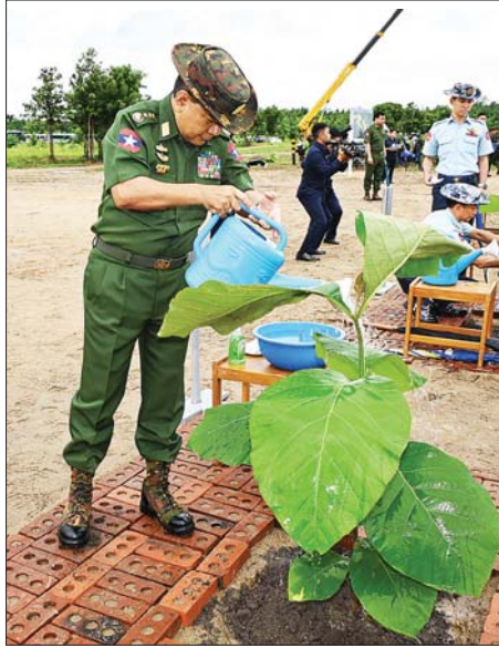
ညှိနှိုင်းကွပ်ကဲရေးမှူး (ကြည်း၊ ရေ လေ) ဗိုလ်ချုပ်ကြီး မောင်မောင် အေး ရတနာတန်းဝင်ကျွန်းပင်ကို စိုက်ပျိုးပေးစဉ်။