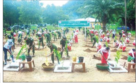
တိုင်းစစ်ဌာနချုပ် နယ်မြေများ၌ မိုးရာသီ သစ်ပင်စိုက်ပွဲများ ကျင်းပပြုလုပ်စဉ်။