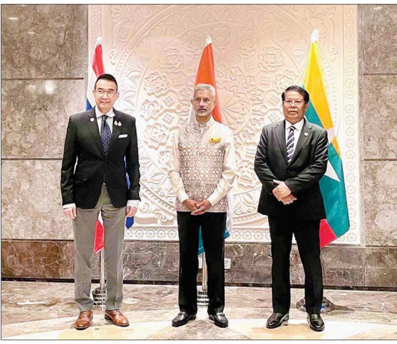
ဒုတိယဝန်ကြီးချုပ်နှင့် နိုင်ငံခြားရေးဝန်ကြီးဌာန ပြည်ထောင်စုဝန်ကြီး ဦးသန်းဆွေ အိန္ဒိယပြည်ပရေးရာဝန်ကြီး ဒေါက်တာအက်စ်ဂျိုင်ရှန်ကာ၊ ထိုင်းနိုင်ငံခြားရေးဝန်ကြီး မစ္စတာမာရစ် ဆတ်ယမ်ဖန်တို့နှင့် စုပေါင်းမှတ်တမ်းတင် ဓာတ်ပုံရိုက်စဉ်။

နေပြည်တော် ဇူလိုင် ၁၂ ဒုတိယအကြိမ် ဘင်းမိစတင်နိုင်ငံခြားရေးဝန်ကြီးများ၏ သီးသန့်အစည်းအဝေး တက်ရောက်ရန် နယူးဒေလီမြို့သို့ ရောက်ရှိနေသည့် ဒုတိယဝန်ကြီးချုပ်နှင့် နိုင်ငံခြားရေးဝန်ကြီးဌာန ပြည်ထောင်စုဝန်ကြီး ဦးသန်းဆွေသည် ဇူလိုင် ၁၁ ရက် ဒေသစံတော်ချိန် ညနေ ၅ နာရီခွဲတွင် နယူးဒေလီမြို့ရှိ တာဂျပ်လေ့စံဟိုတယ်၌ ကျင်းပပြုလုပ်ခဲ့သည့် “မြန်မာ-အိန္ဒိယ-ထိုင်း သုံးနိုင်ငံ အစည်းအဝေး” သို့ ပါဝင်တက်ရောက်ခဲ့သည်။ “မြန်မာ - အိန္ဒိယ - ထိုင်း သုံးနိုင်ငံ အစည်းအဝေး” သို့ အိန္ဒိယပြည်ပရေးရာဝန်ကြီး ဒေါက်တာအက်စ်ဂျိုင်ရှန်ကာနှင့် ထိုင်းနိုင်ငံခြားရေးဝန်ကြီး မစ္စတာမာရစ် ဆတ်ယမ်ဖန်တို့ တက်ရောက်ခဲ့ကြသည်။ ဘင်းမိစတင်နှင့် နိုင်ငံတကာ မျက်နှာစာတွင် ပိုမိုပူးပေါင်းရေး “မြန်မာ - အိန္ဒိယ - ထိုင်း သုံးနိုင်ငံ အစည်းအဝေး” ၌ ဝန်ကြီးများသည် ရိုရင်းခွဲ ချစ်ကြည်ရင်းနှီးမှုများ ပိုမို တိုးတက်ခိုင်မာစေရေး၊ ကုန်သွယ်ရေးနှင့် ရင်းနှီးမြှုပ်နှံမှုအပါအဝင် ကဏ္ဍစုံ၌ အပြန်အလှန် ပူးပေါင်းဆောင်ရွက်မှုများ မြှင့်တင်ရေး၊ ဘင်းမိစတင်နှင့် နိုင်ငံတကာမျက်နှာစာတွင် ပိုမိုနီးကပ်စွာ ပူးပေါင်းဆောင်ရွက်သွားရေး ကိစ္စရပ်များ အပေါ် ခင်မင်ရင်းနှီးစွာ အမြင်ချင်းဖလှယ်