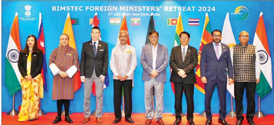
ဒုတိယအကြိမ် ဘင်းမိစတက် နိုင်ငံခြားရေးဝန်ကြီးများ၏ သီးသန့်အစည်းအဝေးတွင် ဘင်းမိစတက်အဖွဲ့ဝင် နိုင်ငံများမှ ကိုယ်စားလှယ်အဖွဲ့ ခေါင်းဆောင်များ စုပေါင်းမှတ်တမ်းတင်ပေးပုံရိပ်စဉ်။

ပညာရှင်များအဖွဲ့၏ လုပ်ငန်း ဆောင်ရွက်မှုများနှင့် ဘင်းမိစတက် နိုင်ငံခြားရေးဝန်ကြီးများ