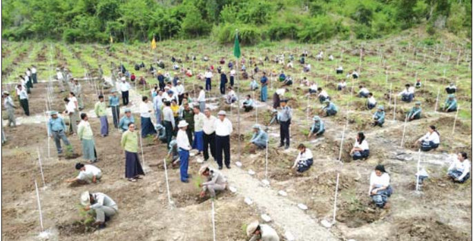
အပန်းဖြေဆင်စခန်းဧရိယာအတွင်း၌ သစ်ပင်စိုက်ပျိုးနေမှုများကို လှည့်လည်ကြည့်ရှုအားပေးသည်။ (အပေါ်ပုံ) ထို့နောက် ရွှေစက်တော်မန်းချောင်း အပန်းဖြေဆင်စခန်း ရှင်းလင်းဆောင်ရွက် မကွေးတိုင်းဒေသကြီး မြန်မာ့သစ်လုပ်ငန်းက ဒုတိယအထွေထွေ

မင်းဘူး ဇူလိုင် ၁၂ မကွေးတိုင်းဒေသကြီး မြန်မာ့သစ်လုပ်ငန်းက ၂၀၂၄ ခုနှစ် မိုးရာသီသစ်ပင်စိုက်ပျိုးပွဲအဖြစ် အရိပ်ရ မန်ကျည်းပင်ပေါင်း ၄၀၀၀ စိုက်ပျိုးပွဲကို ဇူလိုင် ၁၁ ရက်က မင်းဘူး(စကျ)မြို့နယ်ရှိ ရွှေစက်တော် မန်းချောင်းအပန်းဖြေဆင်စခန်း ဧရိယာအတွင်း၌ ပြုလုပ်သည်။ သစ်ပင်စိုက်ပျိုးပွဲတွင် မကွေးတိုင်းဒေသကြီး ဝန်ကြီးချုပ် ဦးတင်လွင်နှင့်အတူ တိုင်းဒေသကြီး အစိုးရအဖွဲ့ဝင်ဝန်ကြီးများ၊ တိုင်း၊ ခရိုင်၊ မြို့နယ် အဆင့်ဌာနဆိုင်ရာ တာဝန်ရှိသူများ၊ ကျောင်းသား ကျောင်းသူများ၊ ဒေသခံများနှင့် ဖိတ်ကြားထားသူ များက မကွေးတိုင်းဒေသကြီး မြန်မာ့သစ်လုပ်ငန်း၏ ၂၀၂၄ ခုနှစ် မိုးရာသီသစ်ပင်စိုက်ပျိုးပွဲအဖြစ် ဆင်များအတွက် အဓိကအထောက်အကူပြုစေမည့် အရိပ်ရ မန်ကျည်းပင်ပေါင်း ၄၀၀၀ ကို “ကမ္ဘာ့မြေဆီလွှာ ထိန်းသိမ်းဖို့ သစ်ပင်စိုက်ကြံ့ခိုင်” ဆောင်ပုဒ်နှင့်အညီ စုပေါင်းစိုက်ပျိုးခဲ့ကြပြီး တိုင်းဒေသကြီးဝန်ကြီးချုပ်နှင့် တာဝန်ရှိသူများက ရွှေစက်တော်မန်းချောင်း