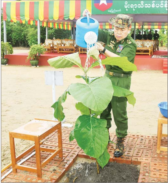
နိုင်ငံတော်စီမံအုပ်ချုပ်ရေးကောင်စီ ဒုတိယဥက္ကဋ္ဌ ဒုတိယတပ်မတော်ကာကွယ်ရေးဦးစီးချုပ် ကာကွယ်ရေး ဦးစီးချုပ် (ကြည်း) ဒုတိယဗိုလ်ချုပ်မှူးကြီး စိုးဝင်း ရတနာတန်းဝင် ကျွန်းပင်ကို စိုက်ပျိုးပေးစဉ်။