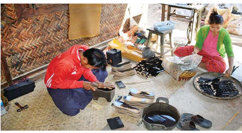
ပြည်တွင်းထွက် ရော်ဘာကုန်ကြမ်းဖြင့် ပြုလုပ်သည့် ဖိနပ်လုပ်ငန်းခွင်တစ်ခုကို တွေ့ရစဉ်။

နေ့၊ မိုး၊ ဆောင်း ဥတုသုံးလီ ကျား။ မလှကြီးလှငယ်မရွေး ဝတ်ဆင်ကြသည့် လူအသုံးအဆောင် အဆင်တန်ဆာတစ်ခု ကိုပြုပြင်လျှင် ဖိနပ်ကို ပြုပြင်ခြင်းဖြစ်သည်။ ဖိနပ်သည် လူတစ်ဦးချင်း၏ နေ့စဉ် တစ်ကိုယ်ရေ အသုံးအဆောင်အတွက် မရှိမဖြစ်လည်း ဖြစ်သည်။ ကမ္ဘာပေါ်ရှိ လူသားများသည် လွန်လေပြီးသော ရှေးနှစ်ပေါင်းများစွာ ကတည်းက နေဒဏ်၊ မိုးဒဏ်၊ ဆူးငြောင့် ခလုတ်တံသင်းဒဏ်မှ ကင်းဝေးစေရန် ၎င်းတို့ဝတ်ဆင်မည့် မြေခင်းဖိနပ်များကို နေထိုင်ရာ နေရာဒေသအပေါ်မူတည်၍ တိရစ္ဆာန်သားရေများ၊ ကောက်ရိုးများ၊ သစ်သားများဖြင့် ကိုယ်တိုင်တီထွင် ဝတ်ဆင်ခဲ့ကြသည်။