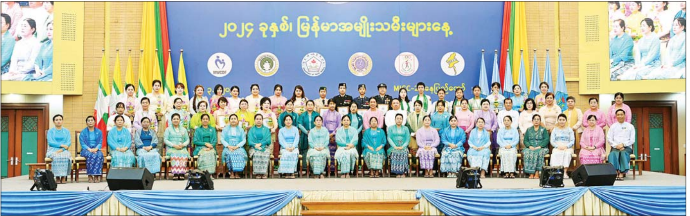
မြန်မာနိုင်ငံ အမျိုးသမီးရေးရာအဖွဲ့ချုပ် ဂုဏ်ထူးဆောင်နာယက နိုင်ငံတော်စီမံအုပ်ချုပ်ရေးကောင်စီဥက္ကဋ္ဌ နိုင်ငံတော်ဝန်ကြီးချုပ်၏ဇနီး ဒေါ်ကြူကြူလှနှင့် အခမ်းအနား တက်ရောက်လာကြသူများ ဆုရရှိသူများနှင့်အတူ စုပေါင်းမှတ်တမ်းတင် ဓာတ်ပုံရိုက်စဉ်။