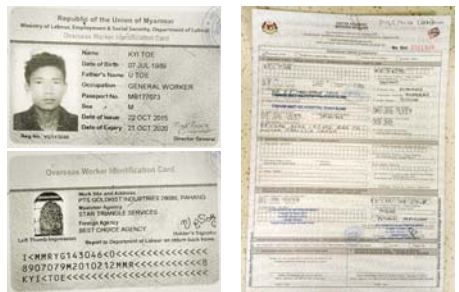
သေဆုံးသူ၏ OWIC သက်သေခံကတ်ပြားနှင့် သေမှုသေခင်းစာရွက်။

အုပ်စု (ဗ) ပွဲစဉ် (၃) မှ အခြားသောပွဲစဉ် အဖြစ်ကော်စတာရီကာနှင့် ပါရာဂွေးအသင်းတို့ ယှဉ်ပြိုင်ကစားခဲ့ရာ ကော်စတာရီကာ အသင်း က နှစ်ဂိုး-တစ်ဂိုးဖြင့် နိုင်ပွဲရရှိခဲ့သည်။