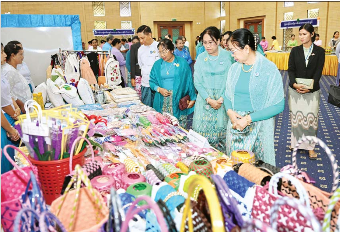
မြန်မာနိုင်ငံအမျိုးသမီးရေးရာအဖွဲ့ချုပ် ဂုဏ်ထူးဆောင်နာယက နိုင်ငံတော်စီမံအုပ်ချုပ်ရေးကောင်စီဥက္ကဋ္ဌ နိုင်ငံတော်ဝန်ကြီးချုပ်၏ဇနီး ဒေါ်ကြူကြူလှနှင့် အဖွဲ့ဝင်များ ၂၀၂၄ ခုနှစ် မြန်မာအမျိုးသမီးများနေ့ အထိမ်းအမှတ် ခင်းကျင်းပြသထားသည့် ထုတ်ကုန်ပစ္စည်းများကို ကြည့်ရှုအားပေးစဉ်။

နေပြည်တော် ဇူလိုင် ၃ ၂၀၂၄ ခုနှစ် မြန်မာအမျိုးသမီးများနေ့ အခမ်းအနားကို ယနေ့နံနက်ပိုင်းတွင် နေပြည်တော်ရှိ မြန်မာအပြည်ပြည်ဆိုင်ရာ ကုန်ဗိုလ်ရင်းမဟိဋ္ဌာန-၂ (MICC-II) ၌ ကျင်းပရာ မြန်မာနိုင်ငံ အမျိုးသမီးရေးရာ အဖွဲ့ချုပ် ဂုဏ်ထူးဆောင်နာယက နိုင်ငံတော်စီမံအုပ်ချုပ်ရေးကောင်စီဥက္ကဋ္ဌ နိုင်ငံတော်ဝန်ကြီးချုပ်၏ဇနီး ဒေါ်ကြူကြူလှ တက်ရောက်ချီးမြှင့်သည်။ အခမ်းအနားသို့ မြန်မာနိုင်ငံ အမျိုးသမီးရေးရာအဖွဲ့ချုပ် ဂုဏ်ထူးဆောင် နာယကများဖြစ်ကြသည့် ဒေါ်ခင်သက်ဌေး၊ ဒေါ်သန်းသန်းနွယ်၊ နိုင်ငံတော်စီမံအုပ်ချုပ်ရေးကောင်စီ အတွင်းရေးမှူး၏ဇနီး၊ တွဲဖက်အတွင်းရေးမှူး၏ ဇနီး၊ နိုင်ငံတော်စီမံအုပ်ချုပ်ရေးကောင်စီ အဖွဲ့ဝင် ဒေါ်ဒွဲတူနှင့် ကောင်စီအဖွဲ့ဝင်များ၏ဇနီးများ၊ ပြည်ထောင်စုအဆင့် ပုဂ္ဂိုလ်များ၊ ပြည်ထောင်စုဝန်ကြီးများနှင့် ဇနီးများ၊ ပြည်ထောင်စုစာရင်းစစ်ချုပ်၊ ပြည်ထောင်စုရာထူးဝန်အဖွဲ့ဥက္ကဋ္ဌ၏ ဇနီး၊ နေပြည်တော်ကောင်စီဥက္ကဋ္ဌ၏ ဇနီး၊ အဆင့်မြင့် တပ်မတော်အရာရှိကြီးများ၏ဇနီးများ၊ ပြည်ထောင်စုတရားလွှတ်တော်ချုပ် တရားသူကြီးများ၊ နိုင်ငံတော်ဖွဲ့စည်းပုံအခြေခံဥပဒေဆိုင်ရာ ခုံရုံးအဖွဲ့ဝင်များ၊ ဒုတိယဝန်ကြီးများနှင့် ဇနီးများ၊ စာမျက်နှာ ၄ ကော်လံ ၁ ၀