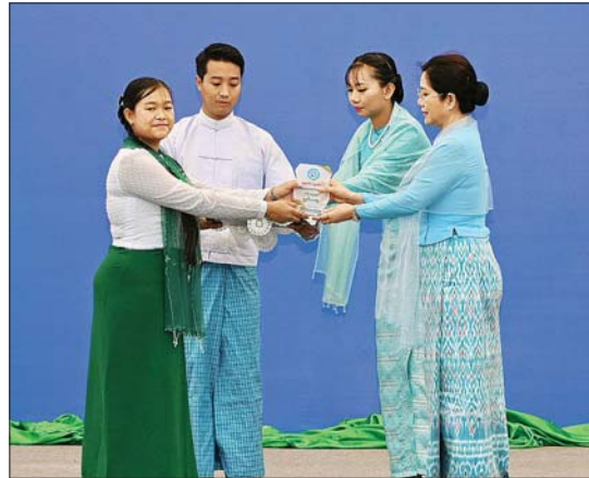
နိုင်ငံတော်စီမံအုပ်ချုပ်ရေးကောင်စီ အတွင်းရေးမှူး၏ ဇနီး ၂၀၂၄ ခုနှစ် မြန်မာအမျိုးသမီးများနေ့ အထိမ်းအမှတ် အခြေခံပညာ အထက်တန်းအဆင့် စာစီစာကုံး ပြိုင်ပွဲတွင် ဒုတိယဆုရရှိသူအား ဂုဏ်ပြုဆုတံဆိပ်၊ ဂုဏ်ပြုမှတ်တမ်းလွှာနှင့် ဂုဏ်ပြုဆုငွေများ ပေးအပ်ချီးမြှင့်စဉ်။