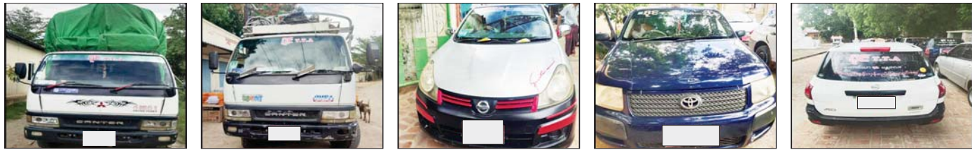
တောင်သာ-ရွားထိုးကြီး ကားလမ်းတွင် PDF အမည်ခံအကြမ်းဖက်သမားများက လုယက်ယူဆောင်သွားသည့် ပိုင် TTA ခရီးသည်နှင့်ကုန်စည်ပို့ဆောင်ရေးယာဉ်လှိုင်းမှ မော်တော်ယာဉ်များ။

ပြန်လည်ရရှိခဲ့သည်။ PDF အမည်ခံ အကြမ်းဖက်သမား များသည် အများပြည်သူ သွားလာလျက် ရှိသော လမ်းများပေါ်၌ ခရီးသွားပြည်သူ များအား တားဆီးစစ်ဆေးခြင်း၊ ဆက် ကြေးကောက်ခံခြင်း၊ ပစ္စည်းများ လုယက် ယူဆောင်ခြင်းနှင့် ၎င်းတို့အား ထောက်ခံ အားပေးမှုမရှိသည့် ခရီးသွားပြည်သူများ နှင့် ဒေသခံပြည်သူများအား ဖမ်းဆီး သတ်ဖြတ်ခြင်းများကို ကျူးလွန်လျက် ရှိပြီး အဆိုပါ အကြမ်းဖက်သမားများ အား ချေမှုန်းနိုင်ရေး လုံခြုံရေးတပ်ဖွဲ့ဝင် များက ပိတ်ဆို့ရှာဖွေ စစ်ဆေးခြင်းနှင့် ခရီးသွားပြည်သူများ ဘေးကင်းလုံခြုံစွာ သွားလာနိုင်ရေးအတွက် လုံခြုံရေးလုပ်ငန်း များကို တာဝန်ခံသိပြည်သူများနှင့် ပူးပေါင်း ၍ တိုးမြှင့်ဆောင်ရွက်လျက်ရှိကြောင်း သတင်းရရှိသည်။ သတင်းစဉ်