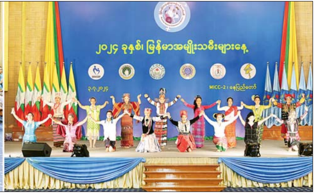
မြန်မာနိုင်ငံ အမျိုးသမီးရေးရာအဖွဲ့ချုပ် ဂုဏ်ထူးဆောင်နာယက နိုင်ငံတော်စီမံအုပ်ချုပ်ရေးကောင်စီဥက္ကဋ္ဌ နိုင်ငံတော်ဝန်ကြီးချုပ်၏ဇနီး ဒေါ်ကြူကြူလှနှင့် အဖွဲ့ဝင်များ ရွှေမြန်မာသာယာငြိမ်းချမ်း တေးသီချင်းနှင့်အတူ တိုင်းရင်းသားအကဖြင့် ဖျော်ဖြေတင်ဆက်မှုကို ကြည့်ရှုအားပေးစဉ်။