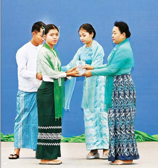
နိုင်ငံတော်စီမံအုပ်ချုပ်ရေးကောင်စီ တွဲဖက်အတွင်းရေးမှူး၏ ဇနီး ၂၀၂၄ ခုနှစ် မြန်မာအမျိုးသမီးများနေ့ အထိမ်းအမှတ် အခြေခံပညာ အထက်တန်းအဆင့် စာစီ စာကုံးပြိုင်ပွဲတွင် တတိယဆုရရှိသူအား ဂုဏ်ပြုဆုတံဆိပ်၊ ဂုဏ်ပြုမှတ်တမ်းလွှာနှင့် ဂုဏ်ပြုဆုငွေများပေးအပ်ချီးမြှင့်စဉ်။

ထုတ်ကုန်ပစ္စည်းများ ကြည့်ရှုလေ့လာ ယင်းနောက် မြန်မာနိုင်ငံ အမျိုးသမီး ရေးရာအဖွဲ့ချုပ် ဂုဏ်ထူးဆောင်နာယက နိုင်ငံတော်စီမံအုပ်ချုပ်ရေးကောင်စီဥက္ကဋ္ဌ နိုင်ငံတော်ဝန်ကြီးချုပ်၏ ဇနီးသည် အခမ်းအနားသို့ တက်ရောက်လာကြသူ များနှင့်အတူ စုပေါင်းမှတ်တမ်းတင် ဓာတ်ပုံရိုက်ပြီး ၂၀၂၄ ခုနှစ် မြန်မာအမျိုး သမီးများနေ့ အထိမ်းအမှတ် ခင်းကုင်း ပြသထားသည့် ထုတ်ကုန်ပစ္စည်းများကို ကြည့်ရှုလေ့လာ အားပေးခဲ့ကြောင်း သတင်းရရှိသည်။ သတင်းစဉ်