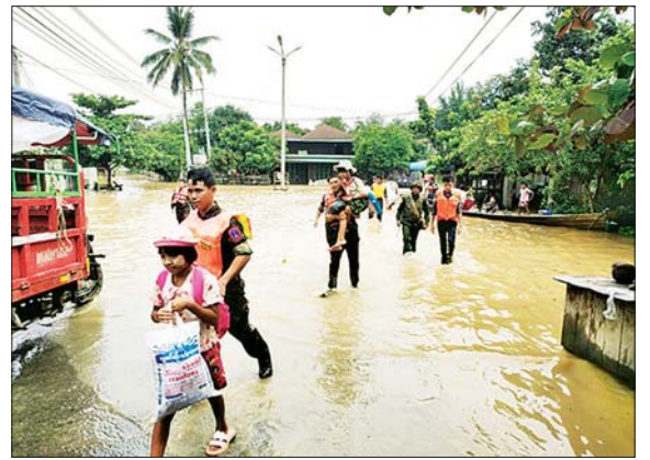
ရေဘေးသင့်ပြည်သူများအား ကူညီကယ်ဆယ်ရေးဆောင်ရွက်ပေးစဉ်။

၌လည်း ဇူလိုင် ၂ ရက်မှစ၍ မြစ်ရေဝင်ရောက်ခဲ့ရာ ဗန်းမော်မြို့၌ ဧရာဝတီမြစ်ရေသည် စိုးရိမ်ရေမှတ်ထက် ကျော်လွန်ခဲ့ကာ မြစ်ရေ ဝင်ရောက်လျက်ရှိသော အိမ်ထောင်စု ၄၃၉၉ စုခန့်၊ လူဦးရေ ၂၂၃၀၀ ဦးခန့်ကို လည်းကောင်း၊ ရွှေကူမြို့နယ်၌ ဇူလိုင် ၂ ရက်မှစ၍ ဧရာဝတီမြစ်ရေ စိုးရိမ်ရေမှတ်ထက် ကျော်လွန်ခဲ့သဖြင့် မြစ်ရေဝင်ရောက်လျက်ရှိသော အိမ်ထောင်စု ၁၁၀ ခန့်၊ လူဦးရေ ၄၉၂ ဦးခန့်တို့ကိုလည်း