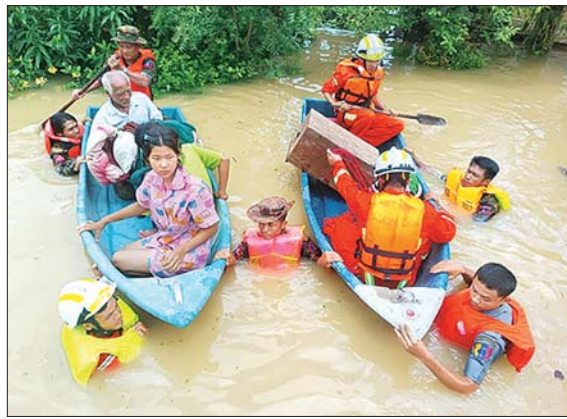
ရေဘေးသင့်ပြည်သူများအား ကူညီကယ်ဆယ်ရေးဆောင်ရွက်ပေးစဉ်။

နေပြည်တော် ဇူလိုင် ၃ - ကချင်ပြည်နယ်အတွင်း မိုးသည်းထန်စွာ ရွာသွန်းမှုများကြောင့် ဧရာဝတီမြစ်ရေ မြင့်တက်လာပြီး မြစ်ကြီးနားမြို့ပေါ်ရှိ ရပ်ကွက်များနှင့် ကျေးရွာများအတွင်းသို့ရေကြီးရေလျှံမှုများ ဖြစ်ပေါ်ခဲ့သည်။ စုပေါင်းသန့်ရှင်းဆောင်ရွက်ယနေ့မှန်းတည့် ၁၂ နာရီတွင် မြစ်ရေပြန်လည်ကျဆင်းခဲ့သဖြင့် မြို့တွင်းလမ်းများပေါ်၌ အပူခိုက်များ၊ ဒိုက်များ၊ နန်းများ တင်ကျန်လျက်ရှိရာ မြောက်ပိုင်းတိုင်းစစ်ဌာနချုပ်မှ နယ်မြေခံတပ်မတော်သားများ၊ မီးသတ်တပ်ဖွဲ့ဝင်များ၊ လူမှုကူညီရေးအသင်းအဖွဲ့များ၊ ဌာနဆိုင်ရာဝန်ထမ်းများက ရေဝင်ရောက်မှုများဖြစ်ပေါ်လျက်ရှိသည့် ရပ်ကွက်၊ ကျေးရွာများအတွင်း စုပေါင်းသန့်ရှင်းရေးလုပ်ငန်းများ ဆောင်ရွက်ပေးသည်။ ထိုသို့ ဆောင်ရွက်ပေးနေမှုများကို ကချင်ပြည်နယ် ဝန်ကြီးချုပ် ဦးခင်ထိန်နန်း၊ တိုင်းမှူးဗိုလ်မှူးချုပ် အောင်စေတီထွေးနှင့် တာဝန်ရှိသူများက သွားရောက်ကြည့်ရှုအားပေးပြီး လိုအပ်သည်များ ပေါင်းစပ်ညှိနှိုင်းဖြည့်ဆည်းဆောင်ရွက်ပေးသည်။ ကချင်ပြည်နယ် ဗန်းမော်မြို့