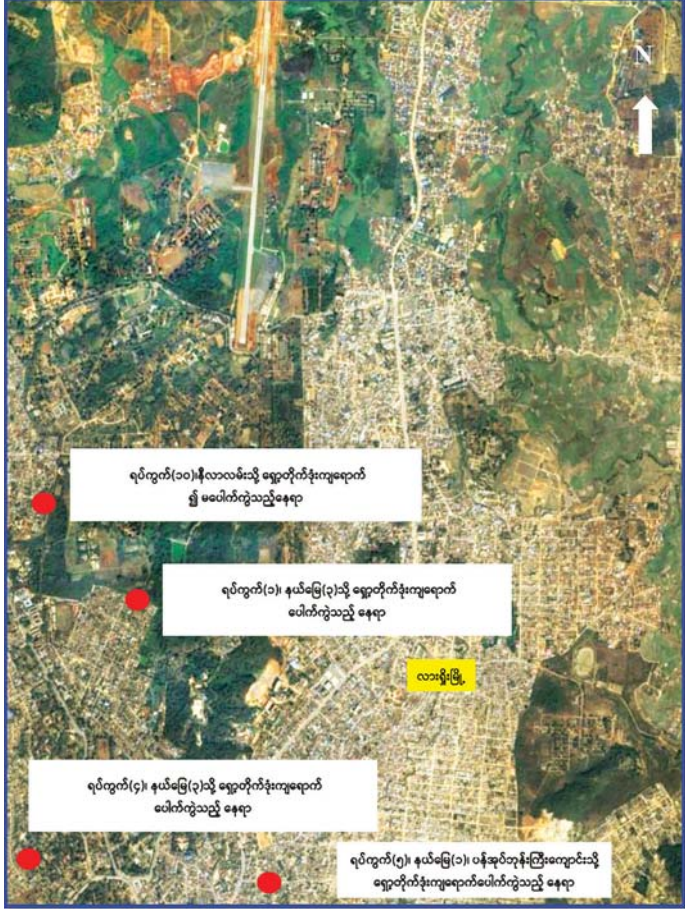
အကြမ်းဖက်သောင်းကျန်းသူများက လားရှိုးမြို့အတွင်းသို့ ရှေ့တိုက်ခွဲများဖြင့် ပစ်ခတ်တိုက်ခိုက်ခဲ့သည့် ဖြစ်စဉ်ပြမြေပုံ။

ကြောင်း သိရှိရသဖြင့် လုံခြုံရေး တပ်ဖွဲ့ဝင်များနှင့် ပရဟိတအသင်း အဖွဲ့များက ဆေးဝါးကုသမှုများ ခံယူရန်အတွက် လားရှိုးမြို့ ပြည်သူ့ဆေးရုံသို့ ပို့ဆောင်ပေးခဲ့ ကြောင်း သိရှိရသည်။ အကြမ်းဖက် သောင်းကျန်း သူများ၏ ယခုကဲ့သို့ စစ်ရေးနှင့် မသက်ဆိုင်ဘဲ အေးချမ်းစွာ နေထိုင်လျက်ရှိသည့် ဒေသခံ ပြည်သူများ၏ မြို့ရွာများအတွင်း သို့ အသက်အန္တရာယ် ထိခိုက် သေကျေသည့်အထိ စက်ဆုပ် ရွံရှာဖွယ် ပစ်ခတ်တိုက်ခိုက်ခဲ့မှု သည် စစ်ရာဇဝတ်မှု (War Crime) ကို ကျူးလွန်ခြင်း ဖြစ်ပြီး အဆိုပါ အကြမ်းဖက် သောင်းကျန်းသူများ အား ချေမှုန်းနိုင်ရေး လုံခြုံရေး တပ်ဖွဲ့ဝင်များက အကြမ်းဖက် ချေမှုန်းရေးစစ်ဆင်ရေး (Counter-Terrorism Operation) ကို ပြည်သူများနှင့်ပူးပေါင်း၍ တိုးမြှင့် ဆောင်ရွက်လျက် ရှိကြောင်း သတင်းရရှိသည်။ သတင်းစဉ်