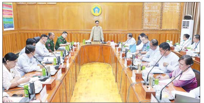
တိုင်းဒေသကြီး/ပြည်နယ်အလိုက် စီမံဆောင်ရွက်ထားရှိမှု အခြေအနေများ၊ ဒေသခံပြည်သူများနှင့်အစိုးရတာဝန်ရှိသူများအကြား ပေါင်းစည်းဆောင်ရွက်ရန် ကိစ္စရပ်များကို တင်ပြဆွေးနွေးကြပြီး မိုးလေဝသနှင့်ဓလပေဒဏ်ခံနိုင်မှု ဦးစီးဌာန ညွှန်ကြားရေးမှူးချုပ်က မြစ်ရေကြီးမှုအခြေအနေကို ဆွေးနွေးတင်ပြရာ ပြည်ထောင်စုဝန်ကြီးက လိုအပ်သည်များ ပေါင်းစပ်ညှိနှိုင်း ဆောင်ရွက်ပေးခဲ့ကြောင်း သတင်းရရှိသည်။ သတင်းစဉ်

ဆက်စပ် ဖြစ်ပွားလာနိုင်သည့် ရေကြီးရေလျှံမှုနှင့် မြေပြိုမှုများ၊ မုတ်သုံကာလအတွင်း လိုအပ်သည့် ကြိုတင်ပြင်ဆင်မှုများနှင့် ပေါင်းစပ်ညှိနှိုင်းရေးဆိုင်ရာများ ဆောင်ရွက်နိုင်ရန် ညှိနှိုင်းအစည်းအဝေး ခေါ်ယူခြင်းဖြစ်ကြောင်း၊ ကဏ္ဍအလိုက် ကြိုတင်စီမံထားရှိမှုများကို တင်ပြကြရန်နှင့် အချိန်နှင့်တစ်ပြေးညီ အချိတ်အဆက်မိမိ ဆောင်ရွက်နိုင်ရေးအတွက် လုပ်ထုံးလုပ်နည်းများနှင့် အညီပိုင်းဝန်းဆောင်ရွက်ကြရန် ပြောကြားသည်။ ထို့နောက် လုပ်ငန်းကော်မတီဒုတိယဥက္ကဋ္ဌနှင့်ကော်မတီဝင်များက သက်ဆိုင်ရာပြည်ထောင်စုဝန်ကြီးဌာန၊ အဖွဲ့အစည်းအလိုက်၊