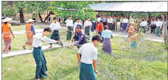
မန္တလေးတိုင်းဒေသကြီး ကျောက်ဆည်ခရိုင် စီမံအုပ်ချုပ်ရေးအဖွဲ့ ဦးဆောင်မှုဖြင့် ကျောက်ဆည်မြို့နယ်အတွင်း ကျောင်းသား ကျောင်းသူများ အေးချမ်းစွာပညာ သင်ကြားနိုင်ရေးနှင့် မြင်ကြောင့်ဖြစ်ပွားနိုင်သည့် ရောဂါများမဖြစ်ပွားစေရေးအတွက် ဇူလိုင် ၂ ရက်က အမှတ် (၁) အခြေခံပညာအထက်တန်းကျောင်းနှင့် ကျောင်းပတ်ဝန်းကျင် စုပေါင်းသန့်ရှင်းရေးလုပ်ငန်းများ ဆောင်ရွက်စဉ်။ ခရိုင်(ပြန်/ဆက်)

ထို့နောက် နေပြည်တော် ကောင်စီဒေသဆိုင်ရာ ခရီးသွား လုပ်ငန်းကော်မတီ ဒုတိယဥက္ကဋ္ဌ၊ နေပြည်တော် ကောင်စီဝင် ဦးဇေယျာလင်းက နေပြည်တော် အတွင်း ခရီးသွားလုပ်ငန်းဆိုင်ရာ ဆောင်ရွက်နေမှုများကို ရှင်းလင်း ဆွေးနွေးတင်ပြကြရာ နေပြည် တော်ကောင်စီဒေသဆိုင်ရာ ခရီး သွားလုပ်ငန်းကော်မတီဥက္ကဋ္ဌက ဖြည့်စွက်ဆွေးနွေးပြီး နိဂုံးချုပ် အမှာစကားပြောကြားခဲ့ကြောင်း သိရသည်။ သတင်းစဉ်