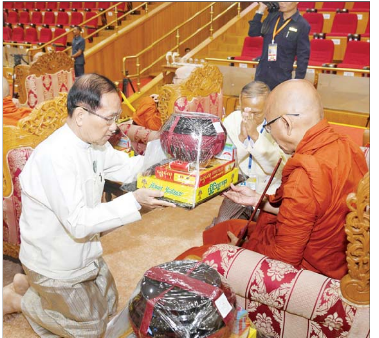
ပြည်ထောင်စု ရွေးကောက်ပွဲ ကော်မရှင်ဥက္ကဋ္ဌ ဦးကိုကို အဂ္ဂမဟာ ပဏ္ဍိတ ဘွဲ့တံဆိပ်တော်ရ ဆရာတော် တစ်ပါးထံ လှူဖွယ်ဝတ္ထုပစ္စည်းများ ဆက်ကပ်လှူဒါန်းစဉ်။ (သတင်း-ရှေ့ဖုံး)