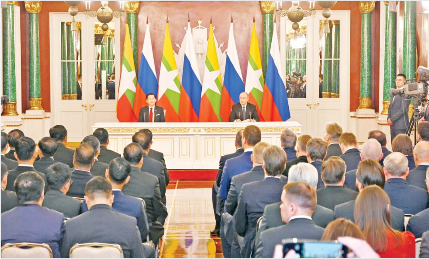
နိုင်ငံတော်စီမံအုပ်ချုပ်ရေးကောင်စီဥက္ကဋ္ဌ နိုင်ငံတော်ဝန်ကြီးချုပ် ဗိုလ်ချုပ်မှူးကြီးမင်းအောင်လှိုင်နှင့် ရုရှားဖက်ဒရေရှင်းနိုင်ငံသမ္မတ H.E. Vladimir Vladimirovich Putin တို့ မတ်လ ၄ ရက်က မီဒီယာများအား နှစ်နိုင်ငံ ပူးတွဲကြေညာချက်များ အပြန်အလှန်ပြောကြားစဉ်။

စာမျက်နှာ ၈ မှ ရုရှားဖက်ဒရေရှင်းနိုင်ငံသမ္မတ၏ နိုင်ငံခြားရေး မူဝါဒဆိုင်ရာ ပြည်ပဆက်ဆံရေးလက်ထောက် အရာရှိ၊ စက်မှုနှင့်ကုန်သွယ်ရေးဝန်ကြီးဌာနဝန်ကြီး၊ တာဝန်ရှိသူများနှင့် အစိုးရအဖွဲ့အကြီးအကဲများ တက်ရောက်ကြသည်။