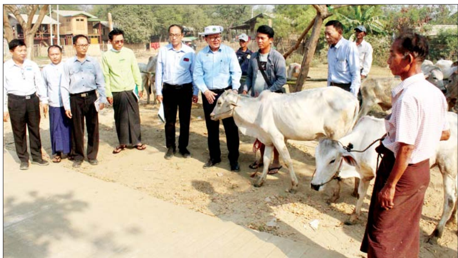
၅၅ဦးအတွက် ဒေသနွားအကောင် ၁၁၀ ကို ပေးအပ် ရပ်ကွက် အုပ်ချုပ်ရေးမှူးက ကျေးဇူးတင်စကား ကြပြီး မွေးမြူရေးတောင်သူများကိုယ်စား အနော်ရထာ ပြောကြားသည်။ သတင်းစဉ်

တိရစ္ဆာန်များ၊ ကောက်ပဲသီးနှံများ၊ အဆောက်အအုံ များကို ကဏ္ဍအလိုက် ပြန်လည်ဖြည့်ဆည်းပေးလျက် ရှိကြောင်း၊ ပြည်ထောင်စုနယ်မြေ(နေပြည်တော်) တွင် ဆုံးရှုံးရသည့် မွေးမြူရေးတိရစ္ဆာန်ကောင်ရေများ ပြည့်မီအောင် ဖြည့်ဆည်းပေးလျက်ရှိရာ ယနေ့တွင် တပ်ကုန်းမြို့နယ် အနော်ရထာရပ်ကွက်မှ မွေးမြူသူ ၅၅ဦးအတွက် ဒေသနွားအကောင် ၁၁၀ ကိုထောက်ပံ့ ပေးအပ်သွားမည်ဖြစ်ရာ မွေးမြူရေးတောင်သူများ အနေဖြင့်လည်း ပြန်လည်ရရှိသည့် မွေးမြူရေး တိရစ္ဆာန်များကို တိုးပွားလာစေရန်နှင့် မွေးမြူရေး အခြေခံကုန်ထုတ်လုပ်ငန်းများ တိုးတက်လာရေး ကြိုးပမ်းပေးကြရန် အားပေးပြောကြားသည်။