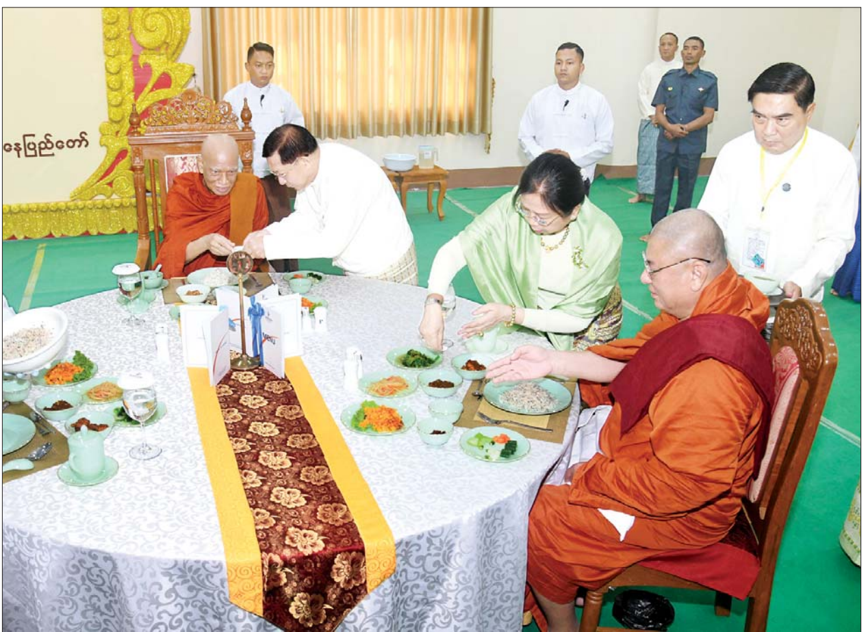
နိုင်ငံတော်စီမံအုပ်ချုပ်ရေးကောင်စီဥက္ကဋ္ဌ နိုင်ငံတော်ဝန်ကြီးချုပ် ဗိုလ်ချုပ်မှူးကြီးမင်းအောင်လှိုင်နှင့်ဇနီး ဒေါ်ကြူကြူလှတို့ နိုင်ငံတော် သံဃမဟာနာယကအဖွဲ့ဥက္ကဋ္ဌ သန့်လျင်မင်းကျောင်းဆရာတော်ကြီး အမျိုးပြုသော ဆရာတော်ကြီးများအား နေ့ဆွမ်း ဆက်ကပ်လှူဒါန်းကြစဉ်။

ဆက်ကပ်လှူဒါန်း ယင်းနောက် နိုင်ငံတော်စီမံအုပ်ချုပ်ရေးကောင်စီဥက္ကဋ္ဌ နိုင်ငံတော်ဝန်ကြီးချုပ်နှင့်ဇနီးတို့က နိုင်ငံတော် သံဃမဟာနာယကအဖွဲ့ဥက္ကဋ္ဌ သန့်လျင်မင်းကျောင်းဆရာတော်ကြီးထံသို့ လည်းကောင်း၊ ကောင်စီဒုတိယဥက္ကဋ္ဌ ဒုတိယဝန်ကြီးချုပ်နှင့် ဇနီးတို့က နိုင်ငံတော် သံဃမဟာနာယကအဖွဲ့အကျိုးတော်ဆောင် မန္တလေးမြို့ မစိုးရိမ်တိုက်သစ်မဟာနာယကဆရာတော်ကြီးထံသို့လည်းကောင်း၊ ကောင်စီအတွင်းရေးမှူးနှင့် ဇနီး၊ တွဲဖက်အတွင်းရေးမှူးနှင့် ဇနီး၊ ကောင်စီအဖွဲ့ဝင်များနှင့် ဇနီးများ၊ အခမ်းအနားသို့ တက်ရောက်လာသည့်အကြီးအကဲများကသာသနာတော်ဆိုင်ရာ ဘွဲ့တံဆိပ်တော် ဆက်ကပ်ခံယူမည့် ဆရာတော်ကြီးများထံသို့ လည်းကောင်း လှူဖွယ်ဝတ္ထုပစ္စည်းများကို ဆက်ကပ်လှူဒါန်းကြသည်။