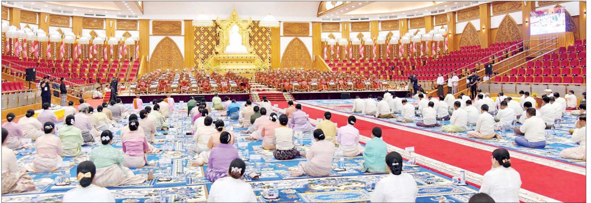
နိုင်ငံတော်စီမံအုပ်ချုပ်ရေးကောင်စီဥက္ကဋ္ဌ နိုင်ငံတော်ဝန်ကြီးချုပ် ဗိုလ်ချုပ်မှူးကြီးမင်းအောင်လှိုင်နှင့် ဇနီး ဒေါ်ကြူကြူလှ အမျိုးပြုသော ဧည့်ပရိသတ်များက နိုင်ငံတော်သံဃမဟာနာယကအဖွဲ့ဥက္ကဋ္ဌ သန်လျင်မင်းကျောင်းဆရာတော်ကြီးထံမှ ငါးပါးသီလခံယူဆောက်တည်ကြပြီး သံဃာတော်အရှင်သူမြတ်များ ရွတ်ပွားသရဇ္ဈာယ်တော်မူသော မေတ္တသုတ်ပရိတ်တရားတော်များကို နာယူကြည့်ကြစဉ်။