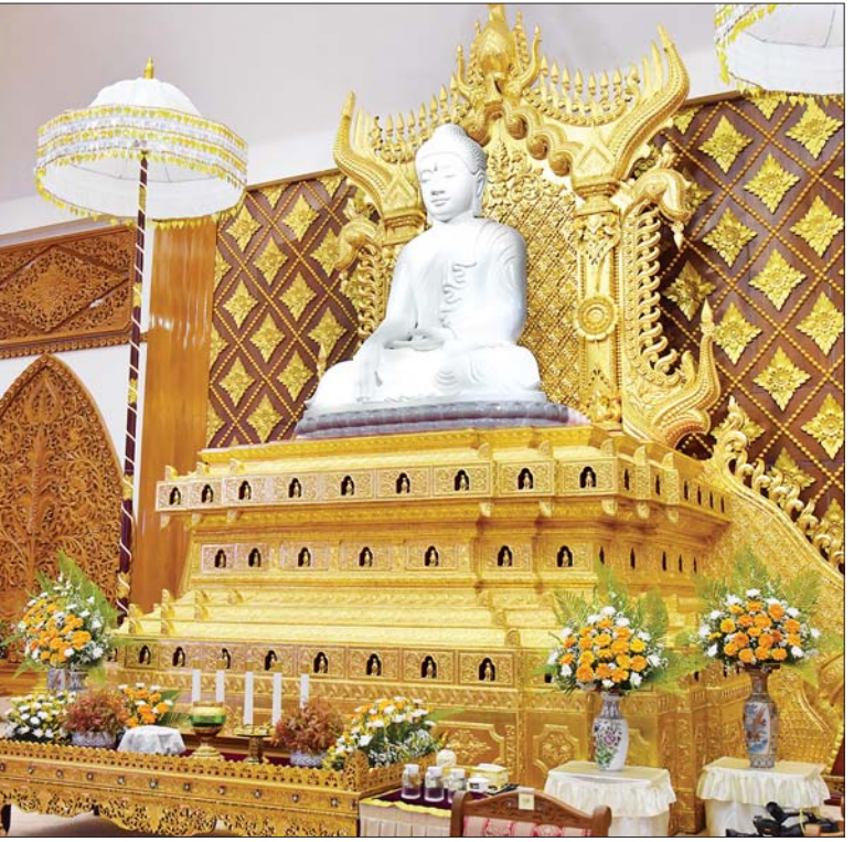
နိုင်ငံတော်စီမံအုပ်ချုပ်ရေးကောင်စီဥက္ကဋ္ဌ နိုင်ငံတော်ဝန်ကြီးချုပ် ဗိုလ်ချုပ်မှူးကြီးမင်းအောင်လှိုင် အဂ္ဂိမပတိ သာသနာ့ဗိမာန်တော်ကြီးအတွင်းရှိ မာရဝိဇယနောင်တော်ကြီးဗုဒ္ဓရုပ်ပွားတော်မြတ်အား မြသပိတ်ဆွမ်းတော်၊ သစ်သီး၊ ပန်းမန်၊ သောက်တော်ရေချမ်းနှင့် ဆီမီးတို့ ကပ်လှူပူဇော်စဉ်။

မူသော မေတ္တာသုတ်ပရိတ်တရားတော်များကို နာယူကြည့်ညိကြသည်။