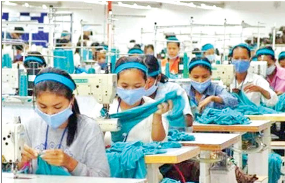
ကြိတ်ခွဲပြီးဆန်၊ ငှက်ပျောသီး၊ သီဟိုဠ်စေ့နှင့် ကွမ်းသီးနှင့် ခရီးသွားထုတ်ကုန်၊ ရေနံ၊ ဆောက်လုပ်ရေးပစ္စည်း၊ ဖုန်း၊ ဆိုင်ကယ်နှင့် လူသုံးကုန်ပစ္စည်းများဖြစ်

ယခုနှစ် ပထမနှစ်လအတွင်း ပြည်ပကုန်တန်ဖိုး သည် ကန်ဒေါ်လာ ၄ ဒသမ ၄၆ ဘီလီယံရှိလာခဲ့ပြီး ယမန်နှစ် အလားတူကာလထက် ၁၁ ဒသမ ၉ ရာခိုင်နှုန်း ပိုမိုမြင့်တက်လာကာ သွင်းကုန်တန်ဖိုးမှာ ကန်ဒေါ်လာ ၄ ဒသမ ၉၈ ဘီလီယံရှိလာခဲ့ကြောင်း သိရသည်။ တရုတ်နိုင်ငံသည် ကမ္ဘောဒီးယားနိုင်ငံ၏ အကြီးဆုံးကုန်သွယ်ဖက်နိုင်ငံဖြစ်ကာ ၎င်း၏နောက်တွင် အမေရိကန်၊ ဗီယက်နမ်၊ ထိုင်းနှင့် ဂျပန်နိုင်ငံတို့ တည်ရှိနေသည်။ ကမ္ဘောဒီးယားနိုင်ငံ၏ ပို့ကုန်များမှာ အဝတ်အထည်၊ ဖိနပ်နှင့် ခရီးသွားထုတ်ကုန်၊ စက်ဘီး၊ တာယာ၊ ဆိုလာပြား၊ ရော်ဘာခြောက်၊