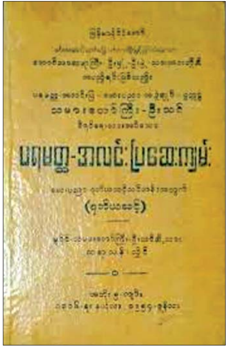
တိုင်းရင်းဆေးသမားတော်ကြီး ပရမတ္ထအလင်းပြဆရာသင် ရေးသားပြုစုခဲ့သည့် ပရမတ္ထအလင်းပြဆေးကျမ်း။

သမားတော်ကြီး ၁၀ ဦး၏ အတ္ထုပ္ပတ္တိအကျဉ်းကို ဂုဏ်ပြုရေးသားလိုက်ပါသည်။