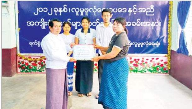
မြို့နယ်(ပြန်/ဆက်)

အဖွဲ့ဝင်များ၊ မိသားစုဝင်များရှေ့မှောက်တွင် ခွင့်ပြုထုတ်ပေးခဲ့ကြောင်း သိရသည်။