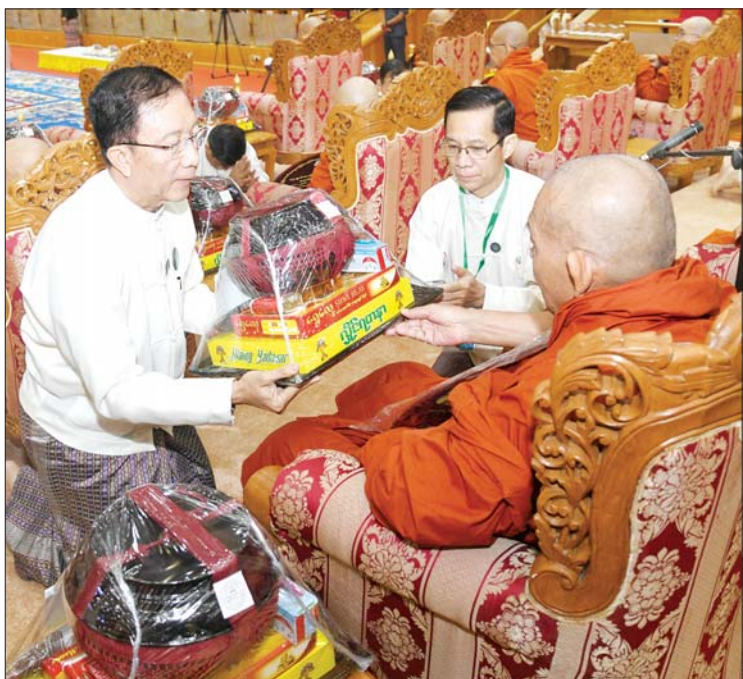
ဒုတိယဝန်ကြီးချုပ်နှင့် ပြည်ထောင်စု ဝန်ကြီး ဦးဝင်းရှိန် အဂ္ဂမဟာပဏ္ဍိတ ဘွဲ့တံဆိပ်တော်ရ ဆရာတော်တစ်ပါးထံ လှူဖွယ်ဝတ္ထုပစ္စည်းများ ဆက်ကပ်လှူဒါန်းစဉ်။ (သတင်း-ရှေ့ဖုံး)