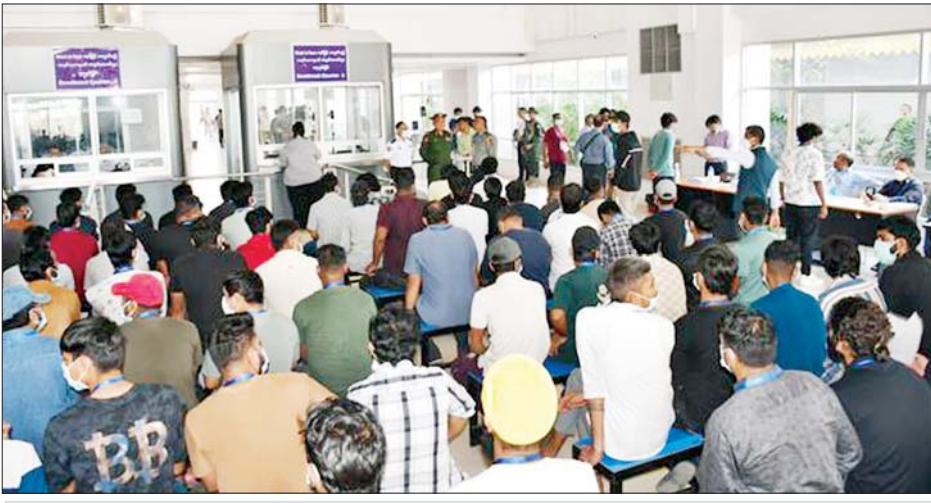
အွန်လိုင်းလောင်းကစားမှုများ၊ အွန်လိုင်းလိမ်လည်မှုများ ကျူးလွန်ခဲ့ကြသည့် ပြည်ပနိုင်ငံသားများကို သက်ဆိုင်ရာနိုင်ငံသို့ လွှဲပြောင်းပေးအပ်စဉ်။

မြန်မာ-တရုတ်-ထိုင်း သုံးနိုင်ငံအကြား သုံးပွင့်ဆိုင် ပူးပေါင်းဆောင်ရွက်မှုပုံစံ (Trilateral Cooperation) ဖြင့် အွန်လိုင်းအသုံးပြုလိမ်လည်မှု (Online Scam) နှင့် အွန်လိုင်းလောင်းကစားမှု (Online Gambling) လုပ်ဆောင်နေကြသူများ၊ ပါဝင်ပတ်သက်သူများနှင့် နောက်ကွယ်မှ ကြိုးကိုင်သော ပြည်ပနိုင်ငံသားများကို ပြတ်ပြတ်သားသား စုံစမ်းဖော်ထုတ်တိုက်ဖျက်လျက်ရှိရာ ယနေ့တွင် အဆိုပါလုပ်ငန်းများ၌ ဆက်စပ်ပါဝင်ခဲ့ကြသည့် အိန္ဒိယနိုင်ငံသား ၂၆၆ ဦးနှင့် မလေးရှားနိုင်ငံသား ၂၅ ဦးတို့အား မြန်မာ-ထိုင်း အမှတ်(၂)ချစ်ကြည်ရေး တံတားမှတစ်ဆင့် သက်ဆိုင်ရာနိုင်ငံများသို့ လူသားချင်းစာနာထောက်ထားမှုနှင့် နိုင်ငံအချင်းချင်း ချစ်ကြည်ရင်းနှီးမှုတို့ကို ရှေးရှု၍ ဥပဒေလုပ်ထုံး လုပ်နည်းများနှင့်အညီ ပြည်ပနိုင်ငံသားများအပေါ် ခွဲပြီး ပြည်ပနိုင်ငံသား ၂၄၇ ဦးကို ထပ်မံစစ်ဆေးဖော်ထုတ်ထိန်းသိမ်းနိုင်ခဲ့သည်။ ဦးစွာ ကရင်ပြည်နယ် လုံခြုံရေးနှင့် နယ်စပ်ရေးရာဝန်ကြီး ဗိုလ်မှူးကြီး မင်းသူကျော်နှင့် တာဝန်ရှိသူများက ပြည်ပနိုင်ငံသားများမှ လုပ်ငန်းများ စနစ်တကျရှာဖွေရေးနှင့် အဆင်ပြေချောမွေ့စေရေးအတွက် လိုက်လံကြည့်ရှုစစ်ဆေးပြီး လိုအပ်သည်များ ပေါင်းစပ်ညှိနှိုင်း ဆောင်ရွက်ပေးသည်။ ထို့နောက် ပြည်ပနိုင်ငံသားများအပေါ်