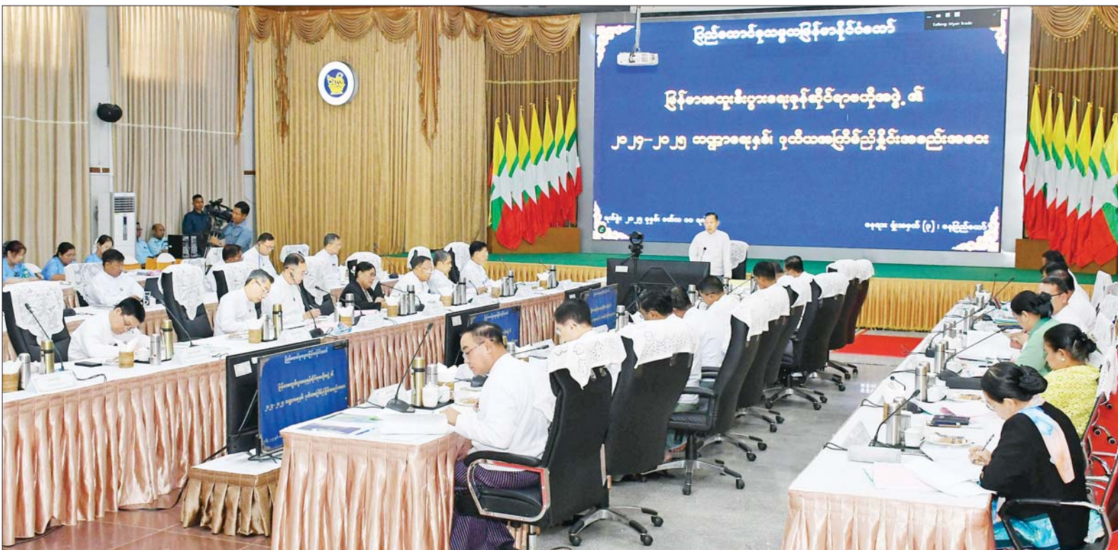
နိုင်ငံတော်စီမံအုပ်ချုပ်ရေးကောင်စီ ဒုတိယဥက္ကဋ္ဌ ဒုတိယဝန်ကြီးချုပ် ဒုတိယဗိုလ်ချုပ်မှူးကြီး စိုးဝင်း မြန်မာအထူးစီးပွားရေးဇုန်ဆိုင်ရာဗဟိုအဖွဲ့၏ ၂၀၂၄-၂၀၂၅ ဘဏ္ဍာနှစ် ဒုတိယအကြိမ်အစည်းအဝေးတွင် အမှာစကားပြောကြားစဉ်။

နေပြည်တော် မတ် ၁၁ မြန်မာ အထူးစီးပွားရေးဇုန်ဆိုင်ရာဗဟိုအဖွဲ့၏ ၂၀၂၄-၂၀၂၅ ဘဏ္ဍာနှစ် ဒုတိယအကြိမ် အစည်းအဝေးကို ယနေ့မနက် ၉ နာရီခွဲတွင် နေပြည်တော်ရှိ စီးပွားရေးနှင့် ကူးသန်းရောင်းဝယ်ရေးဝန်ကြီးဌာန ညီလာခံခန်းမ၌ ကျင်းပရာ မြန်မာအထူးစီးပွားရေးဇုန်ဆိုင်ရာဗဟိုအဖွဲ့ဥက္ကဋ္ဌ နိုင်ငံတော်စီမံအုပ်ချုပ်ရေးကောင်စီ ဒုတိယဥက္ကဋ္ဌ ဒုတိယဝန်ကြီးချုပ် ဒုတိယဗိုလ်ချုပ်မှူးကြီး စိုးဝင်း တက်ရောက် အမှာစကားပြောကြားသည်။ အစည်းအဝေးသို့ မြန်မာအထူးစီးပွားရေးဇုန်ဆိုင်ရာ ဗဟိုအဖွဲ့ဝင်များဖြစ်ကြသည့် ပြည်ထောင်စုဝန်ကြီးများ၊ ဒုတိယဝန်ကြီးများ၊ သီလဝါ၊ ကျောက်ဖြူနှင့် ထားဝယ် အထူးစီးပွားရေးဇုန်တို့မှ စီမံခန့်ခွဲမှု ကော်မတီဥက္ကဋ္ဌများ၊ စာမျက်နှာ ၇ ကော်လံ ၁ သို့ ၊