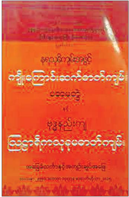
တိုင်းရင်းဆေးသမားတော်ကြီး တွံတေးဦးဘိုးမင်း ရေးသားပြုစုခဲ့သည့် နရသုခိအဓိပ္ပာယ်ကျမ်း။