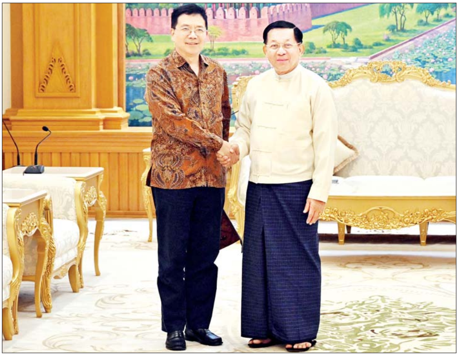
နိုင်ငံတော်စီမံအုပ်ချုပ်ရေးကောင်စီ ဥက္ကဋ္ဌ နိုင်ငံတော်ဝန်ကြီးချုပ် ဗိုလ်ချုပ်မှူးကြီး မင်းအောင်လှိုင် တရုတ်နိုင်ငံခြားရေးဝန်ကြီးဌာန အာရှရေးရာ အထူးကိုယ်စားလှယ် H.E. Mr. Deng Xijun အား လက်ခံတွေ့ဆုံစဉ်။

ရင်းရင်းနှီးနှီးတွေ့ဆုံ နိုင်ငံတော် စီမံအုပ်ချုပ်ရေးကောင်စီဥက္ကဋ္ဌ နိုင်ငံတော်ဝန်ကြီးချုပ် ဗိုလ်ချုပ်မှူးကြီး မင်းအောင်လှိုင်နှင့် တရုတ်နိုင်ငံခြားရေး ဝန်ကြီးဌာန အာရှရေးရာ အထူးကိုယ်စားလှယ် H.E. Mr. Deng Xijun တို့ ရင်းရင်းနှီးနှီး တွေ့ဆုံနှုတ်ဆက်စဉ်။