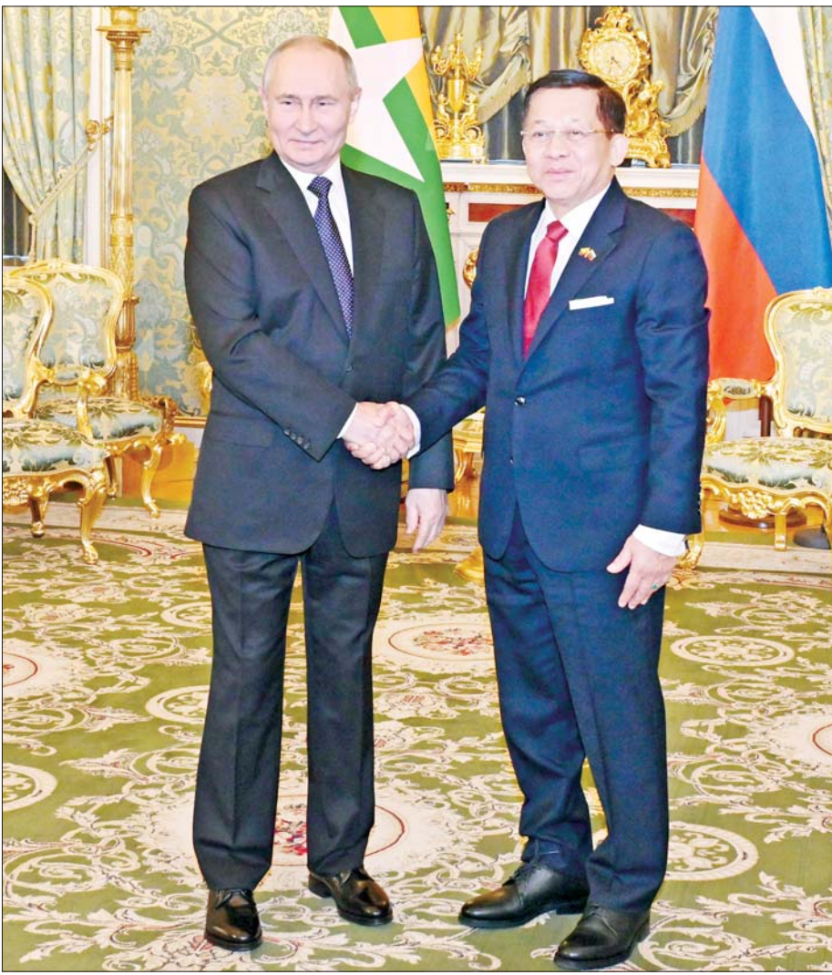
မတ်လ ၄ ရက်က နိုင်ငံတော်စီမံအုပ်ချုပ်ရေးကောင်စီဥက္ကဋ္ဌ နိုင်ငံတော်ဝန်ကြီးချုပ် ဗိုလ်ချုပ်မှူးကြီး မင်းအောင်လှိုင်အား ရုရှားဖက်ဒရေးရှင်းနိုင်ငံသမ္မတ H.E. Vladimir Vladimirovich Putin က ကရင်မလင်နန်းတော်၌ ရင်းရင်းနှီးနှီး ကြိုဆိုနှုတ်ဆက်စဉ်။

(Red Square) ကို မော်စကို၏ အသည်းနှလုံးဟုပင် တင်စားခေါ်ဝေါ်ကြသည်။ ရာဇဝင်တွင်မည့် ကြီးမား သောအဖြစ်အပျက်ကြီးများ၊ သမိုင်းအလှည့် အပြောင်းများမှာ သည်ရင်ပြင်နီပေါ်တွင် ဖြတ်သန်း စီးဆင်းခဲ့ကြခြင်းဖြစ်သည်။