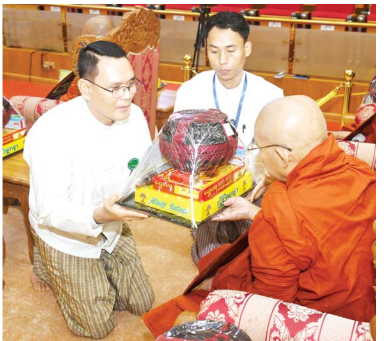
ကာကွယ်ရေး ဦးစီးချုပ်(ရေ) ဗိုလ်ချုပ်ကြီး ထိန်ဝင်း အဂ္ဂမဟာ ပဏ္ဍိတ ဘွဲ့တံဆိပ်တော်ရ ဆရာတော် တစ်ပါးထံ လှူဖွယ်ဝတ္ထုပစ္စည်းများ ဆက်ကပ်လှူဒါန်းစဉ်။ (သတင်း-ရှေ့ဖုံး)