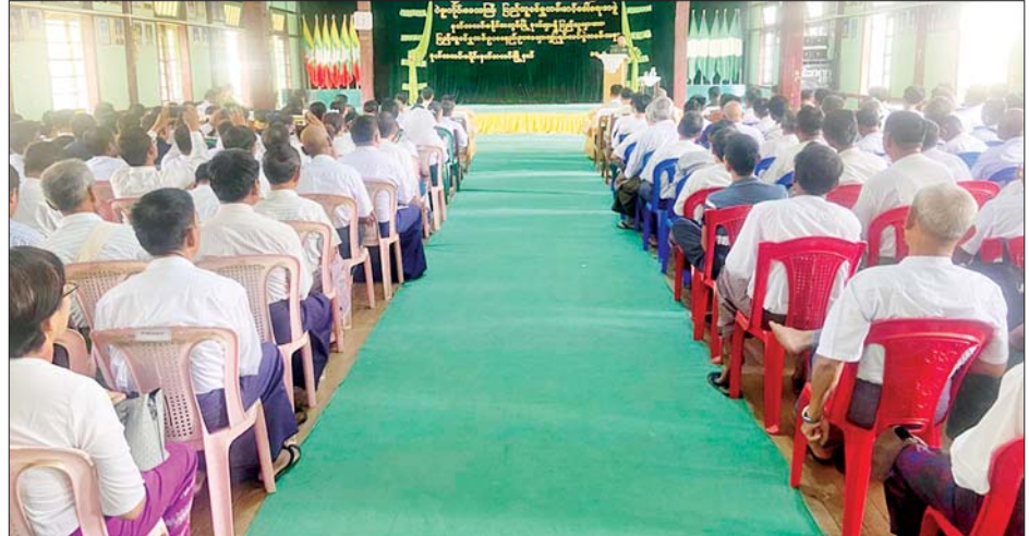
ဝေယံမြီး(ပြန်/ဆက်)

ပြည်သူ့စစ်မှုထမ်းဥပဒေ ပြဋ္ဌာန်း ချက်ပါ ပြည်သူ့စစ်မှုထမ်းဆောင် ခြင်းတာဝန်မှ ကင်းလွတ်ခွင့်ရသူ များ၊ လျှော့ပေါ့ခွင့်ရသူများနှင့် ရွှေ့ဆိုင်းခွင့်ရသူများ၊ ပြည်သူ့ စစ်မှုထမ်းရန်ကာလ၊ ပြည်သူ့ စစ်မှုထမ်းတို့၏ခံစားခွင့် စသည့် ပြည်သူ့စစ်မှုထမ်းဥပဒေ၊ ပြည်သူ့ စစ်မှုထမ်းနည်းဥပဒေပါ အချက် များကို ရှင်းလင်းဆွေးနွေးသည်။ ထို့နောက် တက်ရောက်လာ သော ဒေသခံပြည်သူများက သိရှိ လိုသည်များကို မေးမြန်းဆွေးနွေး ရာ လုံခြုံရေးနှင့် နယ်စပ် ရေးရာဝန်ကြီး ဗိုလ်မှူးကြီး အောင်သောင်းထိုက်က ပြန်လည် ဆွေးနွေး ဖြေကြားခဲ့ကြောင်း သိရသည်။