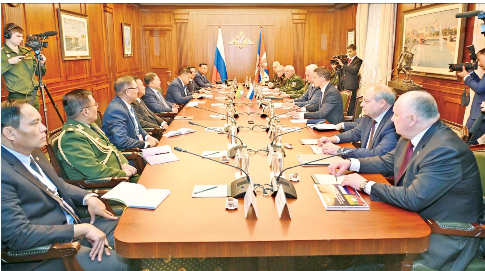
နိုင်ငံတော်စီမံအုပ်ချုပ်ရေးကောင်စီဥက္ကဋ္ဌ နိုင်ငံတော်ဝန်ကြီးချုပ် ဗိုလ်ချုပ်မှူးကြီး မင်းအောင်လှိုင်နှင့် ရုရှားဖက်ဒရေးရှင်းနိုင်ငံ ကာကွယ်ရေးဝန်ကြီး H.E. Mr. Andrei Removich တို့ တွေ့ဆုံဆွေးနွေးစဉ်။

နေပြည်တော် မတ် ၅ ရုရှားဖက်ဒရေးရှင်း နိုင်ငံ မော်စကိုမြို့၌ တရားဝင်ချစ်ကြည်ရေးခရီး ရောက်ရှိနေသည့် နိုင်ငံတော်စီမံအုပ်ချုပ်ရေးကောင်စီဥက္ကဋ္ဌ နိုင်ငံတော်ဝန်ကြီးချုပ် ဗိုလ်ချုပ်မှူးကြီး မင်းအောင်လှိုင်သည် ယနေ့နံနက်ပိုင်းတွင် ရုရှားဖက်ဒရေးရှင်းနိုင်ငံ ကာကွယ်ရေးဝန်ကြီး H.E. Mr. Andrei Removich နှင့် ရုရှားဖက်ဒရေးရှင်းနိုင်ငံ ကာကွယ်ရေးဝန်ကြီးဌာန အစည်းအဝေးခန်းမ၌ တွေ့ဆုံဆွေးနွေးသည်။