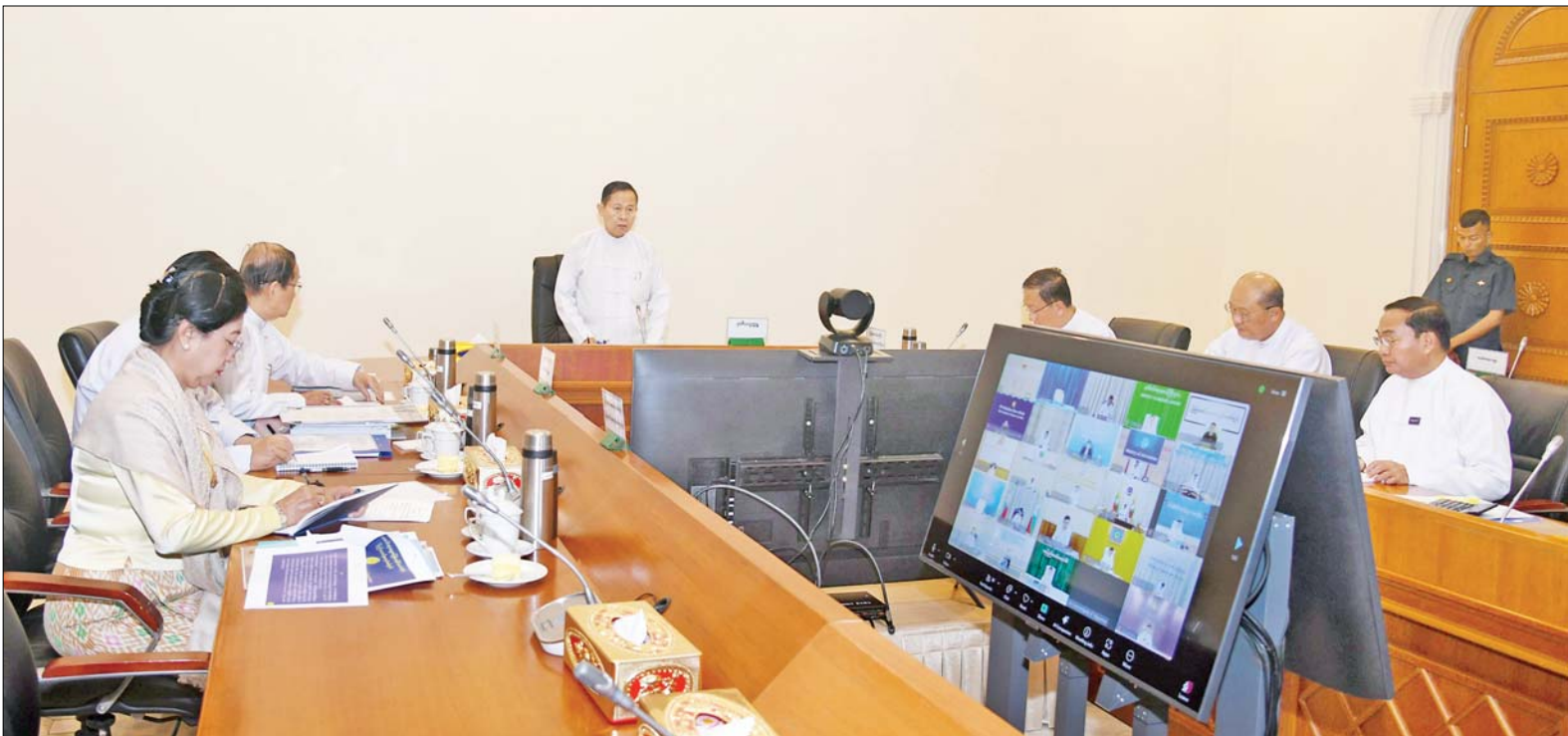
နိုင်ငံတော်စီမံအုပ်ချုပ်ရေးကောင်စီ ဒုတိယဥက္ကဋ္ဌ ဒုတိယဝန်ကြီးချုပ် ဒုတိယဗိုလ်ချုပ်မှူးကြီး စိုးဝင်း ၂၀၂၅-၂၀၂၆ ဘဏ္ဍာရေးနှစ် ပြည်ထောင်စု၏ အရအသုံးခန့်မှန်း ခြေငွေစာရင်းများ စိစစ်ခြင်းဆိုင်ရာ ညှိနှိုင်းအစည်းအဝေးတွင် အမှာစကားပြောကြားစဉ်။