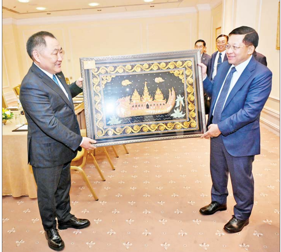
အမှတ်တရလက်ဆောင်ပစ္စည်းများ အပြန်အလှန်ပေးအပ်

အမှတ်တရ လက်ဆောင်ပစ္စည်းများ အပြန်အလှန်ပေးအပ်ပြီး မှတ်တမ်းတင် ဓာတ်ပုံရိုက်ခဲ့ကြကြောင်း သိရသည်။ သတင်းစဉ်