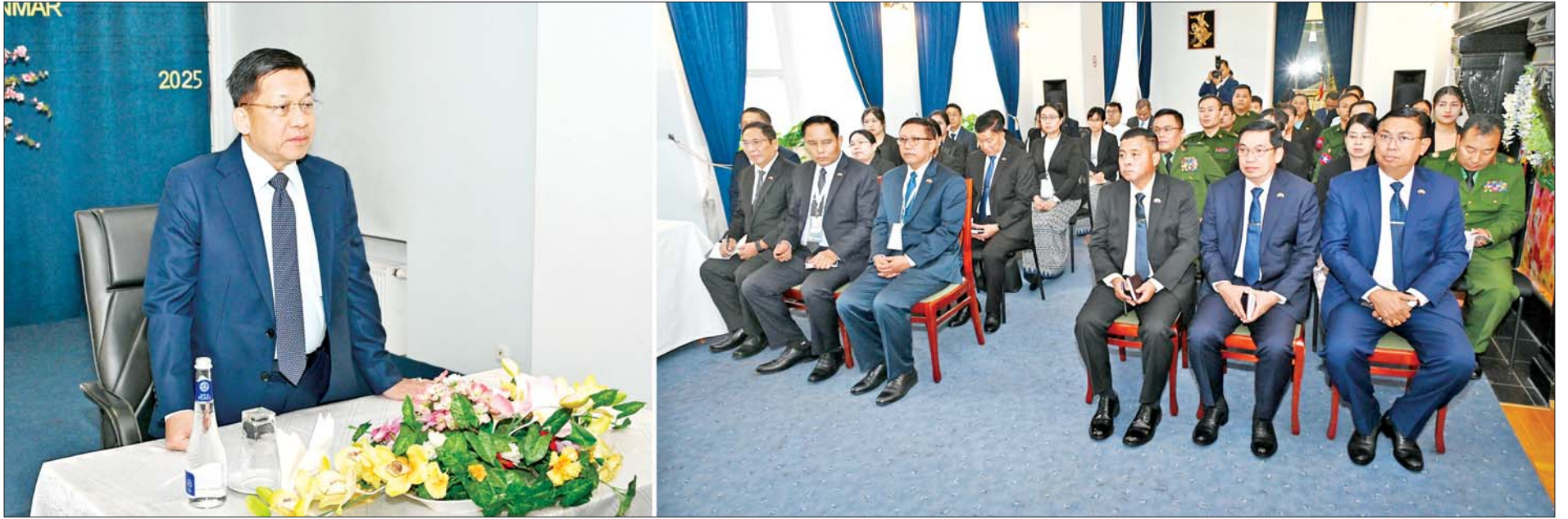
နိုင်ငံတော်စီမံအုပ်ချုပ်ရေးကောင်စီဥက္ကဋ္ဌ နိုင်ငံတော်ဝန်ကြီးချုပ် ဗိုလ်ချုပ်မှူးကြီးမင်းအောင်လှိုင် ရုရှားဖက်ဒရေးရှင်းနိုင်ငံဆိုင်ရာ မြန်မာသံရုံးနှင့် စစ်သံရုံးမိသားစုများအား တွေ့ဆုံအမှာစကားပြောကြားစဉ်။