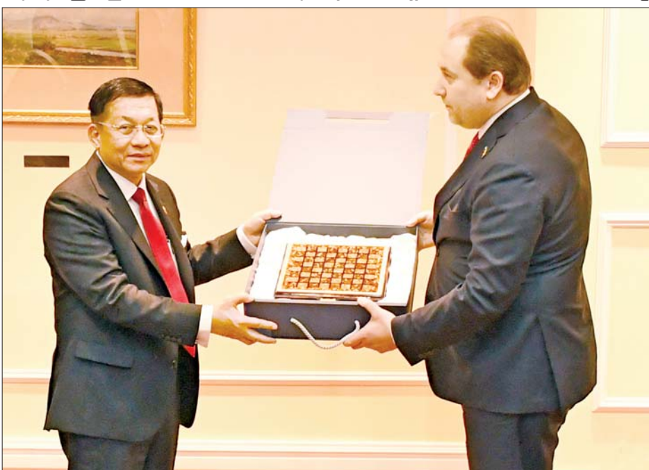
ရုရှား-အာဆီယံ စီးပွားရေးကော်မရှင်ဥက္ကဋ္ဌ Mr. Ivan Polyakov ဦးဆောင်သည့် အဖွဲ့အား မော်စကိုမြို့ Radisson Collection ဟိုတယ်ရှိ အစည်းအဝေးခန်းမ၌ လက်ခံတွေ့ဆုံသည်။

တက်ရောက် အဆိုပါတွေ့ဆုံပွဲသို့ နိုင်ငံတော်စီမံအုပ်ချုပ်ရေးကောင်စီ ဥက္ကဋ္ဌ နိုင်ငံတော်ဝန်ကြီးချုပ်နှင့် အတူ ချစ်ကြည်ရေးခရီးစဉ် လိုက်ပါလာသည့် ကောင်စီတွဲဖက်အတွင်းရေးမှူး ဗိုလ်ချုပ်ကြီး ရဲဝင်းဦး၊ ကောင်စီအဖွဲ့ဝင် ဗိုလ်ချုပ်ကြီး ညိုစော၊ ပြည်ထောင်စုဝန်ကြီးများ၊ ရုရှားဖက်ဒရေးရှင်းနိုင်ငံဆိုင်ရာ မြန်မာသံအမတ်ကြီးနှင့် တာဝန်ရှိသူများ တက်ရောက်ကြပြီး ရုရှား-အာဆီယံ စီးပွားရေးကော်မရှင်ဥက္ကဋ္ဌနှင့် အတူ ကော်မရှင်မှ တာဝန်ရှိသူများ တက်ရောက်ကြသည်။ ထိုသို့တွေ့ဆုံရာတွင် ရုရှား-မြန်မာစီးပွားရေး ကော်မရှင်၏ လုပ်ငန်းဆောင်ရွက်မှုအခြေအနေများ၊ မြန်မာနိုင်ငံနှင့် ရုရှားနိုင်ငံတို့ အကြား စိုက်ပျိုးရေးကဏ္ဍပူးပေါင်းဆောင်ရွက်မှုများ ဖွံ့ဖြိုးတိုးတက်ရေးကိစ္စရပ်များ၊ မြန်မာနိုင်ငံတွင် စိုက်ပျိုးဖြစ်ထွန်းသည့် ဖရဲသီး၊ သရက်သီး စသည့်အသီးအနှံများအား ရုရှားနိုင်ငံသို့ တင်ပို့နိုင်သည့် အခြေအနေများ၊ စွန့်ပစ်အမှိုက်များအား Recycle ဖြင့် ပြန်လည်အသုံးပြုနိုင်ရေး ကိစ္စရပ်များ၊ အာကာသနှင့် နည်းပညာပူးပေါင်းဆောင်ရွက်ရေးဆိုင်ရာ ကိစ္စရပ်များနှင့် နှစ်နိုင်ငံအကြား အခြား တွေ့ဆုံပွဲအပြီးတွင် နိုင်ငံတော်စီမံအုပ်ချုပ်ရေးကောင်စီ ဥက္ကဋ္ဌ နိုင်ငံတော်ဝန်ကြီးချုပ်နှင့် ရုရှား-အာဆီယံစီးပွားရေး ကော်မရှင်ဥက္ကဋ္ဌတို့သည် လက်ဆောင်ပစ္စည်းများ အပြန်အလှန်ပေးအပ်ခဲ့ကြောင်း သိရသည်။