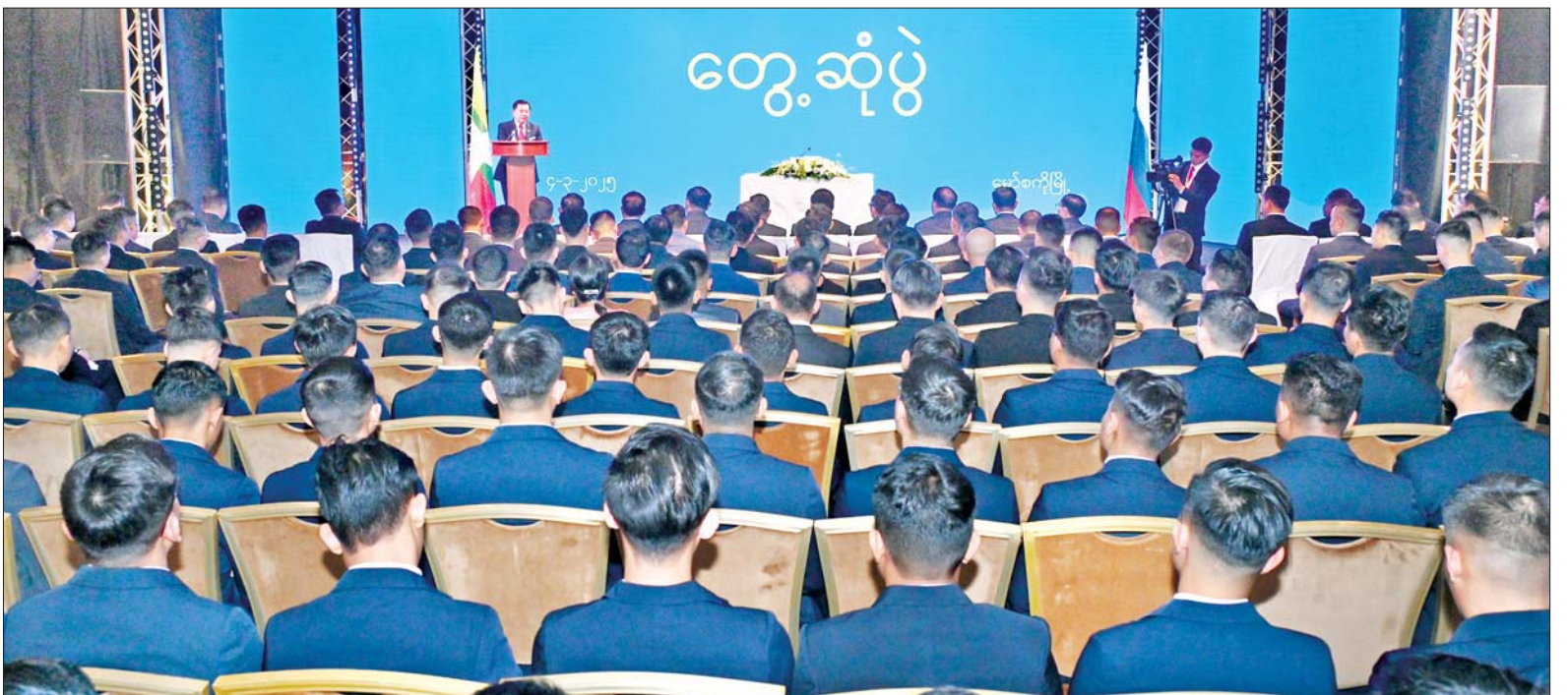
နိုင်ငံတော်စီမံအုပ်ချုပ်ရေးကောင်စီဥက္ကဋ္ဌ နိုင်ငံတော်ဝန်ကြီးချုပ် ဗိုလ်ချုပ်မှူးကြီးမင်းအောင်လှိုင် ရုရှားဖက်ဒရေးရှင်းနိုင်ငံတွင် ပညာတော်သင်ရောက်ရှိနေသည့် စစ်ဘက်၊ အရပ်ဘက်မှ သင်တန်းသား အရာရှိများအား တွေ့ဆုံအမှာစကားပြောကြားစဉ်။

နေပြည်တော် မတ် ၅ ရုရှားဖက်ဒရေးရှင်း နိုင်ငံသို့ တရားဝင် ချစ်ကြည်ရေးခရီး ရောက်ရှိနေသည့် နိုင်ငံတော်စီမံအုပ်ချုပ်ရေးကောင်စီ ဥက္ကဋ္ဌ နိုင်ငံတော် ဝန်ကြီးချုပ် ဗိုလ်ချုပ်မှူးကြီးမင်းအောင်လှိုင်သည် မတ် ၄ ရက် ဒေသစံတော်ချိန် ညပိုင်းတွင် ရုရှားဖက်ဒရေးရှင်းနိုင်ငံ၌ ပညာတော်သင် ရောက်ရှိနေသည့် စစ်ဘက်၊ အရပ်ဘက်မှ သင်တန်းသားအရာရှိများအား မော်စကိုမြို့၊ ရှိ Radisson Collection ဟိုတယ် Conference Hall ၌ တွေ့ဆုံအမှာစကားပြောကြားသည်။