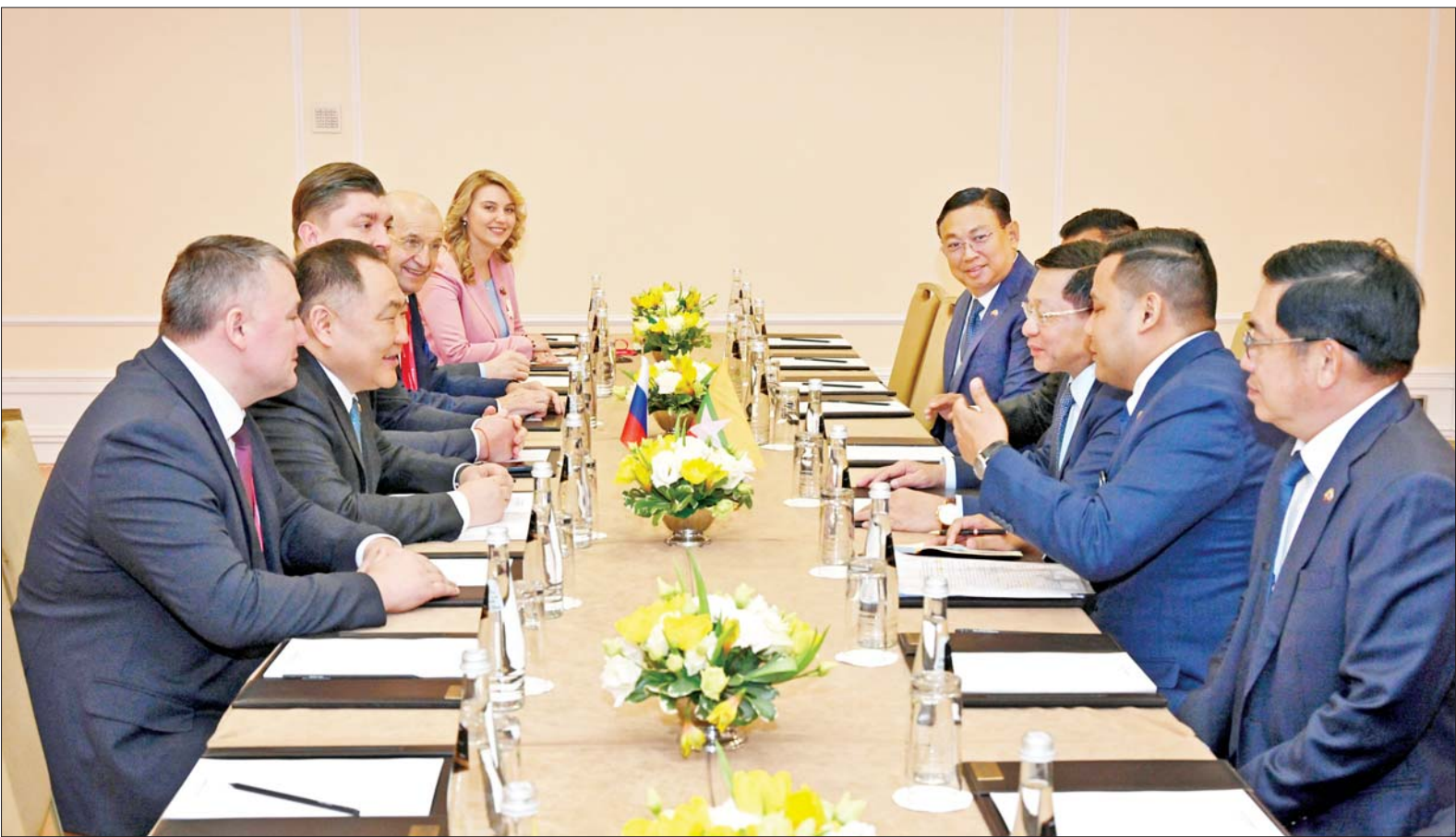
နိုင်ငံတော် စီမံအုပ်ချုပ်ရေးကောင်စီဥက္ကဋ္ဌ နိုင်ငံတော်ဝန်ကြီးချုပ် ဗိုလ်ချုပ်မှူးကြီးမင်းအောင်လှိုင်နှင့် ရုရှားဖက်ဒရေးရှင်းနိုင်ငံ ဒူးမားလွတ်တော် ဒုတိယဥက္ကဋ္ဌ H.E. Mr.Sholban Kara-Ool တို့ ရင်းနှီးပွင့်လင်းစွာ တွေ့ဆုံဆွေးနွေးကြစဉ်။

ယင်းနောက် နိုင်ငံတော်စီမံအုပ်ချုပ်ရေးကောင်စီ ဥက္ကဋ္ဌ နိုင်ငံတော်ဝန်ကြီးချုပ်ထံ ရုရှား