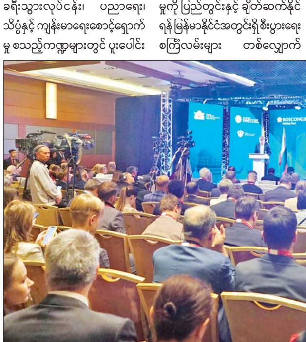
ရုရှားဖက်ဒရေးရှင်းနိုင်ငံ စီးပွားရေးဖွံ့ဖြိုးတိုးတက်မှုဝန်ကြီး Mr. Maxim Gennadyevich Reshetnikov အဖွဲ့အမှာစကား ပြောကြားစဉ်။

ရှင်းလင်းတင်ပြ ယင်းနောက် မြန်မာနိုင်ငံ ကုန်သည်များနှင့် စက်မှုလက်မှု လုပ်ငန်းရှင်များ အသင်းချုပ် (UMFCCI)ဥက္ကဋ္ဌက “မြန်မာနိုင်ငံ တွင် စီးပွားရေးလုပ်ငန်းများ လုပ်ကိုင်ခြင်းဆိုင်ရာ အကျဉ်းချုပ်” ကိုပြောကြားပြီး တက်ရောက်လာ ကြသည့်နှစ်နိုင်ငံမှ ကိုယ်စားလှယ် များက ခေါင်းစဉ်များအလိုက် အကျဉ်းချုပ် ရှင်းလင်းတင်ပြကြ သည်။ ထို့နောက် မြန်မာနိုင်ငံတွင် ရုရှား MIR Card များ လက်ခံသုံးစွဲ နိုင်ရေး ဆောင်ရွက်မှုလုပ်ငန်း အခြေအနေ Video Clip ကို ကြည့်ရှုကြပြီး ဖိုရမ်အား ခေတ္တ ရပ်နားသည်။ မွန်းလွဲပိုင်းတွင် ရုရှား-မြန်မာ စီးပွားရေးဖိုရမ်အား ဆက်လက် ကျင်းပရာ နိုင်ငံတော်စီမံအုပ်ချုပ်