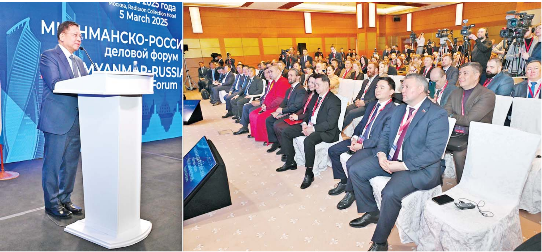
နိုင်ငံတော်စီမံအုပ်ချုပ်ရေးကောင်စီဥက္ကဋ္ဌ နိုင်ငံတော်ဝန်ကြီးချုပ် ဗိုလ်ချုပ်မှူးကြီးမင်းအောင်လှိုင် မြန်မာ-ရုရှား စီးပွားရေးဖိုရမ်တွင် ဖြည့်စွက်အမှာစကားပြောကြားစဉ်။

မြန်မာ-ရုရှား စီးပွားရေးဖိုရမ်ကျင်းပ၊ နိုင်ငံတော်စီမံအုပ်ချုပ်ရေးကောင်စီဥက္ကဋ္ဌ နိုင်ငံတော်ဝန်ကြီးချုပ် ဗိုလ်ချုပ်မှူးကြီးမင်းအောင်လှိုင် ဖြည့်စွက်အမှာစကားပြောကြား နှစ်နိုင်ငံအကြား အစိုးရအချင်းချင်း ချိတ်ဆက်ဆောင်ရွက်ခြင်းဖြင့် ပုဂ္ဂလိကစီးပွားရေးလုပ်ငန်းများအကြား အခွင့်အလမ်းများဖန်တီးပေးနိုင်ရေးနှင့် အလုပ်အကိုင်များရရှိနိုင်အောင် ဆက်လက်ပံ့ပိုးကူညီသွားမည်