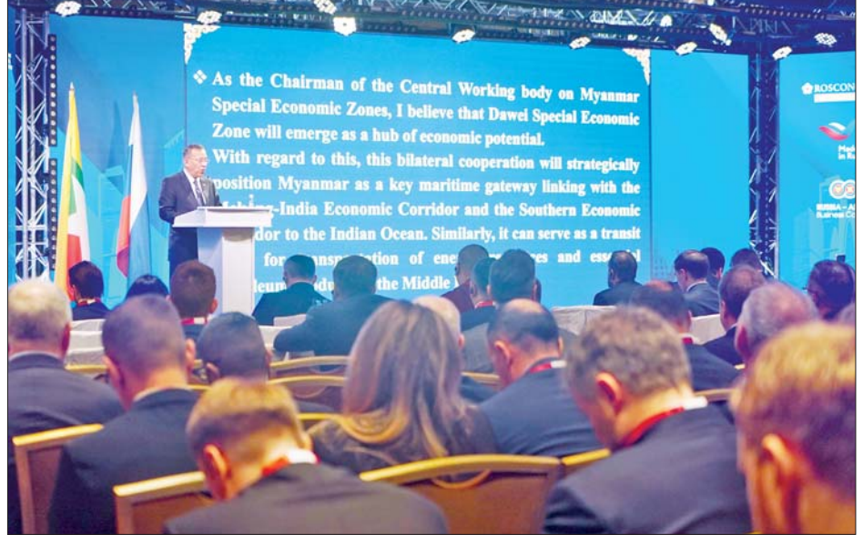
မြန်မာနိုင်ငံ ရင်းနှီးမြှုပ်နှံမှုနှင့် နိုင်ငံခြားစီးပွားဆက်သွယ်ရေးဝန်ကြီးဌာန ပြည်ထောင်စုဝန်ကြီး ဒေါက်တာကံဇော် အဖွဲ့အမှာစကား ပြောကြားစဉ်။

အဆိုပါ ကော်မရှင်အစည်း အဝေးမှနေ၍ ဆွေးနွေးမှုရလဒ် များအဖြစ် ဥပဒေမူဘောင်များ၊ ကုန်သွယ်မှုနှင့် ရင်းနှီးမြှုပ်နှံမှု၊ စွမ်းအင်၊ ပို့ဆောင်ရေး၊ ဆောက်လုပ် ရေးနှင့် အခြေခံအဆောက်အအုံ ဖွံ့ဖြိုးတိုးတက်မှု၊ ဘဏ်လုပ်ငန်း နှင့် ငွေကြေး၊ သတင်းအချက် အလက်ဆက်သွယ်ရေးနည်းပညာ၊ ခရီးသွားလုပ်ငန်း၊ ပညာရေး၊ သိပ္ပံနှင့် ကျန်းမာရေးစောင့်ရှောက် မှု စသည့်ကဏ္ဍများတွင် ပူးပေါင်း