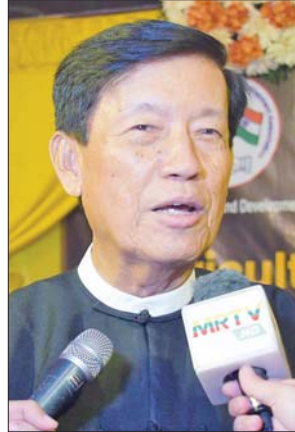
ဦးရန်ဝင်း

အိန္ဒိယနိုင်ငံနဲ့လည်း IT နည်းပညာနဲ့ ဆေးဝါးကဏ္ဍတွေမှာ ပူးပေါင်းဆောင်ရွက်သွားဖို့လည်း ရှိပါတယ်။ ဦးရန်ဝင်း ဥက္ကဋ္ဌ၊ မြန်မာခရီးသွားဘဏ်နှင့် မြန်မာနိုင်ငံ ခရီးသွားလုပ်ငန်းအဖွဲ့ချုပ် နိုင်ငံတော် အကြီးအကဲက စိုက်ပျိုးရေးနဲ့ မွေးမြူရေးကဏ္ဍကနေ စီးပွားရေးဖွံ့ဖြိုးတိုးတက်အောင်လုပ်ဆောင်ဖို့ လမ်းညွှန်ထားတာရှိပါတယ်။ စိုက်ပျိုးရေး၊ မွေးမြူရေးနဲ့ ဆောက်လုပ်ရေးကဏ္ဍဖွံ့ဖြိုးလာအောင် အားလုံးပူးပေါင်း ဆောင်ရွက်သွားရမှာပါ။ ခရီးသွားကဏ္ဍကလည်း စိုက်ပျိုးရေး၊ မွေးမြူရေးနဲ့ ဆက်သွယ်ဆက်စပ်နေပါတယ်။ ဘယ်လိုပဲဖြစ်ဖြစ် ဒီလိုနိုင်ငံတကာနဲ့ ဆက်သွယ်ပြီး ကွန်ဖရင့်တွေကျင်းပခြင်းဟာ နိုင်ငံအတွက် အကျိုးကျေးဇူးများစွာ ရရှိစေပါတယ်။ မြန်မာနိုင်ငံရဲ့ စိုက်ပျိုးရေး၊ ခရီးသွားလုပ်ငန်း၊ ဘဏ်လုပ်ငန်းနဲ့ တခြားသောလုပ်ငန်းတွေ တိုးတက်ဖွံ့ဖြိုးဖို့ အထောက်အကူဖြစ်စေမှာပါ။ နိုင်ငံတော်က ခရီးသွားကဏ္ဍမြှင့်တင်ဖို့ တရုတ်၊ အိန္ဒိယ၊ ဂျပန်၊ ကိုရီးယား၊ အာဆီယံနိုင်ငံတွေနဲ့ လက်တွဲဆောင်ရွက်နေတာ ရှိပါတယ်။ နိုင်ငံတော်က လမ်းဖွင့် ဆောင်ရွက်ပေးမှုအပေါ် အဖွဲ့ အစည်းတွေက အပြန်အလှန်