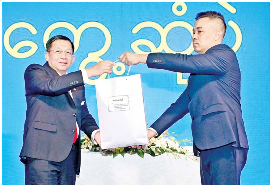
နိုင်ငံတော်စီမံအုပ်ချုပ်ရေးကောင်စီဥက္ကဋ္ဌ နိုင်ငံတော်ဝန်ကြီးချုပ် ဗိုလ်ချုပ်မှူးကြီး မင်းအောင်လှိုင် ရုရှားဖက်ဒရေးရှင်းနိုင်ငံတွင် ပညာတော်သင်ရောက်ရှိနေသည့် စစ်ဘက်၊ အရပ်ဘက်မှ သင်တန်းသားများအတွက် စားသောက်ဖွယ်ရာများနှင့် ချီးမြှင့်ငွေများ ပေးအပ်စဉ်။

ယနေ့ခေတ်သည် နည်းပညာခေတ်ဖြစ်ပြီး AI ခေတ်အထိ ရောက်ရှိနေပြီ ဖြစ်ကြောင်း၊ နိုင်ငံတိုင်းသည် နည်းပညာဖွံ့ဖြိုးတိုးတက်ရေးအတွက် ကြိုးပမ်းဆောင်ရွက်လျက် ရှိကြောင်း၊ နည်းပညာနှင့် ပတ်သက်၍ နောက်ကျမကျန်နေစေရေး မိမိတို့အနေဖြင့် ကြိုးပမ်းအားထုတ်နေရန်လိုကြောင်း၊ မိမိတို့နိုင်ငံအတွက် လိုအပ်သည့် နည်းပညာများတိုးတက်စေရေး ကြိုးပမ်းသင်ယူကြရန် လိုကြောင်း၊ အလားတူ AI နှင့် ပတ်သက်၍ လည်း စဉ်ဆက်မပြတ်လေ့လာနေရန်လိုကြောင်း၊ အကောင်းဘက်ကို ဦးတည်သည့် AI နည်းပညာများကို လေ့လာသင်ယူကြရန် လိုကြောင်း။