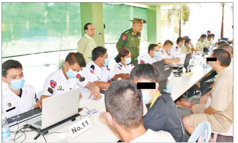
ထိန်းသိမ်းထားသည့် ပြည်ပနိုင်ငံသားများကို သက်ဆိုင်ရာနိုင်ငံများသို့ ပြန်လည်လွှဲပြောင်းပေးနိုင်ရေး ကိုယ်ရေးအချက်အလက်များနှင့် မှတ်တမ်းများ စာရင်းကောက်ယူခြင်းလုပ်ငန်း ဆောင်ရွက်စဉ်။

ဇန်နဝါရီ ၃၀ ရက်မှ မတ် ၅ ရက်အထိ မြန်မာနိုင်ငံအတွင်းသို့ တရားမဝင် ဝင်ရောက်လာသည့် ပြည်ပနိုင်ငံသား စုစုပေါင်း ၄၂၄ ဦးကို စစ်ဆေးဖော်ထုတ်ထိန်းသိမ်းနိုင်ခဲ့ကာ ၎င်းတို့အနက်မှ ၇၅၇ ဦးကို ထိုင်းနိုင်ငံမှတစ်ဆင့် သက်ဆိုင်ရာနိုင်ငံသို့ ဥပဒေလုပ်ထုံးလုပ်နည်းများနှင့်အညီ စနစ်တကျ လွှဲပြောင်းပေးခဲ့ပြီး ကျန်ရှိသည့် ပြည်ပနိုင်ငံသား