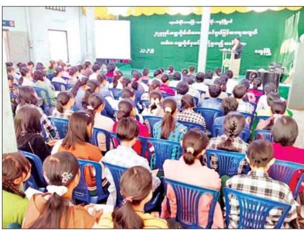
STEAMS- 1 ၁၇၃ ဦး၊ အထက(၂) လွန်တွင် STEAMS-2 ၂၆၄ ဦး၊ အမက ညောင်ပင်ဈေးတွင်

လွန် ဖေဖော်ဝါရီ ၃ ဧရာဝတီ တိုင်းဒေသကြီး လွန်မြို့နယ် ပညာရေးမှူးရုံးမှ ကြီးမှူး၍ ၂၀၂၅ ခုနှစ် တက္ကသိုလ်ဝင် စာမေးပွဲ အောင်ချက်မြှင့်မားရေး အတွက် ဟင်္သာတတက္ကသိုလ်မှ ပါမောက္ခ၊ ကထိကများ ဦးဆောင် ၍ ဘာသာရပ်အလိုက် သင်ကြား ပို့ချခြင်းကို ယမန်နေ့နံနက် ၉ နာရီတွင် အထက(၁)လွန်၊ အထက(၂)လွန်နှင့် အမက ညောင်ပင်ဈေး ကျောင်းတို့ရှိ ခန်းမတို့၌ ပြုလုပ်သည်။ ယင်းသို့ သင်ကြားပို့ချရာ တွင် အထက(၁)လွန်တွင်