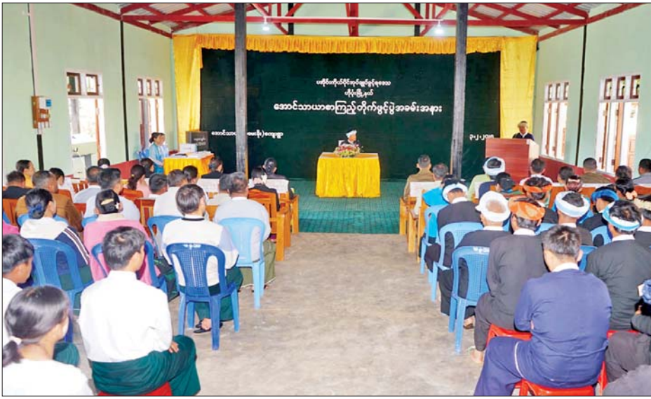
အုပ်ချုပ်ခွင့်ရဒေသ စီမံအုပ်ချုပ် ရေးအဖွဲ့ဥက္ကဋ္ဌ ဦးခွန်ရဲထွေး၊ ဟိုပုံးတပ်နယ်မှူး ဗိုလ်မှူးချုပ် သိန်းနိုင်၊ ပြန်ကြားရေးနှင့် ပြည်သူ့ ဆက်ဆံရေးဦးစီးဌာန ပအိုဝ်း ကိုယ်ပိုင် အုပ်ချုပ်ခွင့်ရဒေသ အဆင့်ရုံး လက်ထောက်ညွှန်ကြား ရေးမှူး ဒေါ်ခင်အိအိသိန်း၊ စာကြည့်တိုက် ကော်မတီဥက္ကဋ္ဌ ဦးထွန်းငွေတို့က ဖဲကြိုးဖြတ် ဖွင့်လှစ်ပြီး ပအိုဝ်းကိုယ်ပိုင်အုပ်ချုပ် ခွင့်ရဒေသ စီမံအုပ်ချုပ်ရေးအဖွဲ့ ဥက္ကဋ္ဌက အဖွင့်အမှာစကား ပြောကြားသည်။ ထို့နောက် ပအိုဝ်းကိုယ်ပိုင်အုပ်ချုပ်ခွင့်ရဒေသ စီမံအုပ်ချုပ်ရေးအဖွဲ့ ဥက္ကဋ္ဌနှင့် တာဝန်ရှိသူများသည် စာကြည့် တိုက် အဆောက်အအုံသစ်အား လှည့်လည်ကြည့်ရှုခဲ့ကြသည်။ ပေါင်လင်း ကျေးရွာအုပ်စု ခုံမေးခိုးကျေးရွာရှိ အောင်သာယာ စာကြည့်တိုက်သည် မြန်မာနိုင်ငံ စာကြည့်တိုက်များဖွံ့ဖြိုးတိုးတက် ရေး ပူးပေါင်းဆောင်ရွက်မှု ကော်မတီက ခွဲဝေပေးသည့် ငွေကျပ်သိန်း ၁၅၀၊ ကျေးရွာ ပြည်သူ့လူထု ငွေကျပ်သိန်း ၁၅၀၊ ကျေးရွာ ဖွံ့ဖြိုးတိုးတက်ရေး လုပ်ငန်းစီမံကိန်း(VDP) ငွေကျပ် သိန်း ၁၅၀ နှင့် ပြည်သူ့လူထုမှ ထည့်ဝင်ငွေ ကျပ်သိန်း ၃၀၀ အလျား ပေ ၆၀၊ အနံ ၃၈ ပေ၊ အမြင့် ၁၂ ပေရှိ တစ်ထပ်အုတ်ညှပ် အဆောက်အအုံဖြစ်သည်။ စင်စင် ကျေးရွာအုပ်စု စအွန်ကျေးရွာရှိ လင်းရောင်ခြည် စာကြည့်တိုက် သည် မြန်မာနိုင်ငံ စာကြည့်တိုက် များ ဖွံ့ဖြိုးတိုးတက်ရေးပူးပေါင်း ဆောင်ရွက်မှုကော်မတီက ခွဲဝေ ပေးသည့် ငွေကျပ်သိန်း ၁၅၀ နှင့် ကျေးရွာဖွံ့ဖြိုးတိုးတက်ရေးလုပ်ငန်း စီမံကိန်း(VDP) ငွေကျပ်သိန်း ၁၅၀၊ ပြည်သူ့လူထုထည့်ဝင်ငွေ ကျပ်သိန်း ၂၅၀ ဖြင့် အလျား ပေ ၅၀၊ အနံ ၃၈ ပေ၊ အမြင့် ၁၂ ပေ တစ်ထပ်အုတ်ညှပ်အဆောက်အအုံ ဖြစ်ကြောင်း သိရသည်။ ပအိုဝ်းဒေသ(ပြန်/ဆက်)

ဟိုပုံး ဖေဖော်ဝါရီ ၃ ရှမ်းပြည်နယ် (တောင်ပိုင်း) ပအိုဝ်းကိုယ်ပိုင်အုပ်ချုပ်ခွင့်ရဒေသ ဟိုပုံးမြို့နယ်၌ (၇၈)နှစ်မြောက် ပြည်ထောင်စုနေ့ကိုကြိုဆိုဂုဏ်ပြု သောအားဖြင့် ပေါင်လင်း ကျေးရွာအုပ်စု ခုံမေးခိုးကျေးရွာရှိ အောင်သာယာ စာကြည့်တိုက်နှင့် စင်စင်ကျေးရွာအုပ်စု စအွန်ကျေးရွာ ရှိ လင်းရောင်ခြည် စာကြည့်တိုက် ဖွင့်ပွဲ အခမ်းအနားကို ယနေ့နံနက် ပိုင်းက အဆိုပါကျေးရွာရှိ စာကြည့် တိုက်၌ ကျင်းပသည်။ ဦးစွာ ပအိုဝ်းကိုယ်ပိုင်အုပ်ချုပ် ခွင့်ရဒေသ စီမံအုပ်ချုပ်ရေးအဖွဲ့ ဥက္ကဋ္ဌ ဦးခွန်ရဲထွေး၊ ဟိုပုံး တပ်နယ်မှူး ဗိုလ်မှူးချုပ် သိန်းနိုင်၊ ရှမ်းပြည်နယ် ပြန်ကြားရေးနှင့် ပြည်သူ့ဆက်ဆံရေး ဦးစီးဌာန ညွှန်ကြားရေးမှူး ဦးစိုးညွန့်ရွှေ၊ အောင်သာယာ စာကြည့်တိုက် ကော်မတီဥက္ကဋ္ဌ ဦးခွန်ကျော်လွင် တို့က ပေါင်လင်းကျေးရွာအုပ်စု အောင်သာယာ ကျေးရွာရှိ အောင်သာယာ စာကြည့်တိုက် အဆောက်အအုံသစ်အား ဖဲကြိုး ဖြတ်ဖွင့်လှစ်သည်။ ဆက်လက်၍ စင်စင်ကျေးရွာ အုပ်စု စအွန်ကျေးရွာရှိ လင်းရောင် ခြည်စာကြည့်တိုက် အဆောက် အအုံသစ်အား ပအိုဝ်းကိုယ်ပိုင်