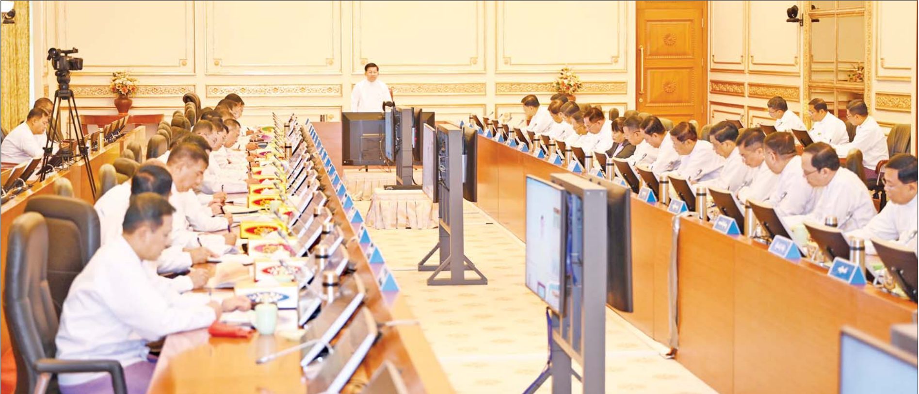
နိုင်ငံတော်စီမံအုပ်ချုပ်ရေးကောင်စီဥက္ကဋ္ဌ နိုင်ငံတော်ဝန်ကြီးချုပ် ဗိုလ်ချုပ်မှူးကြီး မင်းအောင်လှိုင် ပြည်ထောင်စုအစိုးရအဖွဲ့ လုပ်ငန်းညှိနှိုင်းအစည်းအဝေးတွင် အမှာစကားပြောကြားစဉ်။