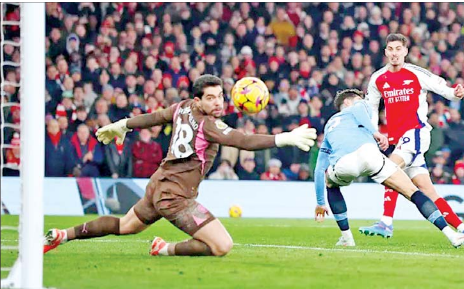
အာဆင်နယ်အသင်းနှင့် မန်စီးတီးအသင်းတို့ ယှဉ်ပြိုင်ကစားကြစဉ်။

ပရီမီယာလိဂ်ပွဲစဉ် (၂၄)ရဲ့ ဖေဖော်ဝါရီ ၂ ရက်ညနေပိုင်းပွဲနဲ့ အကောင်းဆုံး ပွဲစဉ်တစ်ပွဲဖြစ်တဲ့ အာဆင်နယ်အသင်းနဲ့ မန်စီးတီး အသင်းတို့ပွဲစဉ်မှာ အာဆင်နယ် အသင်းက မန်စီးတီးအသင်းကို ငါးဂိုး-တစ်ဂိုးဖြင့် အနိုင်ရရှိခဲ့တာ ကြောင့်အမှတ်ပေးဇယား ထိပ်ဆုံး က လီဗာပူးအသင်းကိုဆက်လက် ဖိအားပေးနိုင်ခဲ့ပြီ ဖြစ်ပါတယ်။ အာဆင်နယ်အသင်းနဲ့ မန်စီးတီး အသင်းတို့ပွဲစဉ်မှာ အာဆင်နယ် အသင်းအတွက် သွင်းဂိုးတွေကို ပွဲကစားချိန် ၂ မိနစ်မှာ အိုဒီဂါ၊ ၅၆ မိနစ်မှာ သောမက်ပါတေး၊ ၆၂ မိနစ်မှာ လီဝစ်ကယ်လီ၊ စာမျက်နှာ ၁၆ ကော်လံ ၅ သို့ ၉