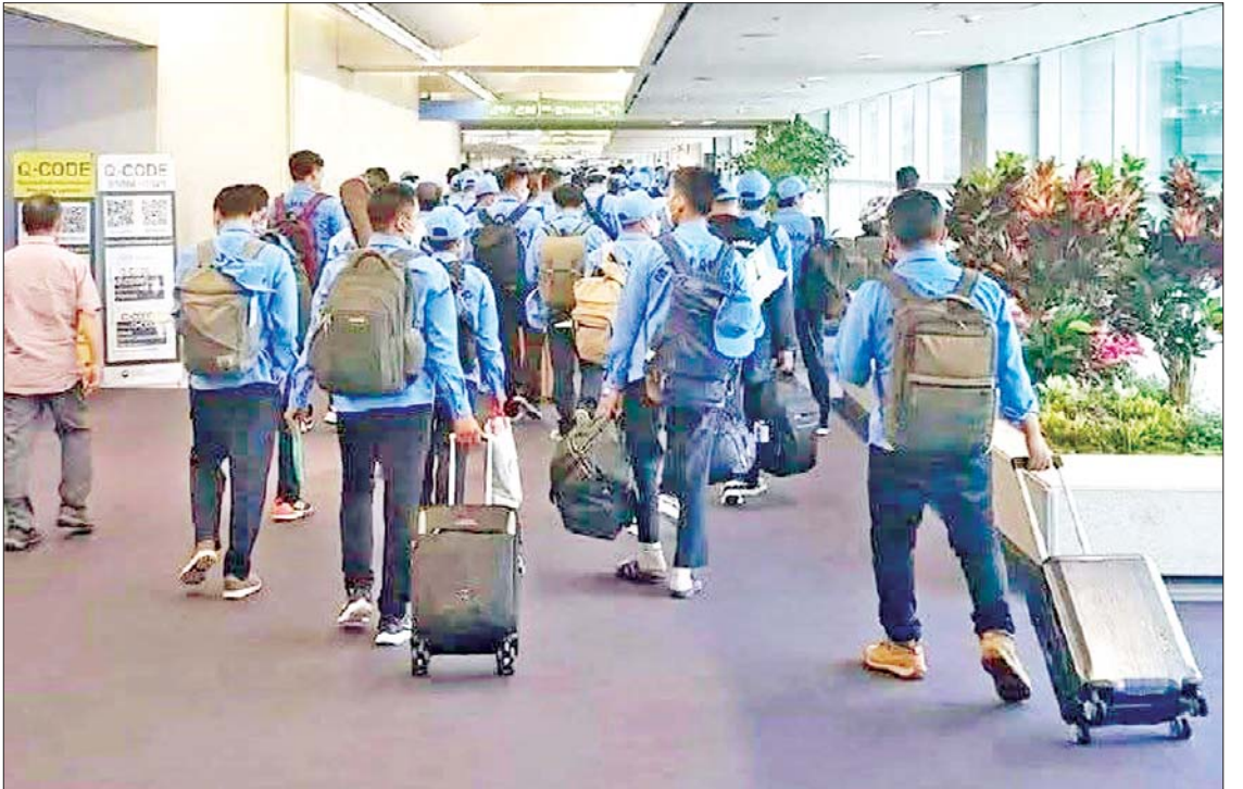
ယခင်နှစ်က ဂျပန်နိုင်ငံကုမ္ပဏီများသို့ သွားရောက်လုပ်ကိုင်သည့် မြန်မာလုပ်သားများကို တွေ့ရစဉ်။

ရန်ကုန် ဖေဖော်ဝါရီ ၃ ဂျပန်ကုမ္ပဏီ ၄၅၀ ကျော်က မြန်မာ လုပ်သား ၁၅၀၀ ခန့် ခေါ်ယူမည် ဖြစ်ကြောင်း ဂျပန်နိုင်ငံဆိုင်ရာမြန်မာသံရုံး ၏ အလုပ်ကမ်းလှမ်းစာ ထုတ်ပြန်ထား သည့်စာရင်းများအရ သိရသည်။ သံရုံး၏ထုတ်ပြန်ချက်၌ မြန်မာသံရုံး တို့ကျိုမြို့အနေဖြင့် အလုပ်သမားဝန်ကြီး ဌာနက နိုင်ငံခြားရေးဝန်ကြီးဌာနမှ တစ်ဆင့် ပေးပို့လာသည့် အလုပ်ကမ်း လှမ်းစာ (Demand Letter) များကို စိစစ် ဆောင်ရွက်ပေးလျက်ရှိပြီး ထိုသို့ စိစစ် ဆောင်ရွက်ရာတွင် ဂျပန်နိုင်ငံရှိ အလုပ် သမား ကြီးကြပ်ရေးကုမ္ပဏီနှင့် အလုပ် ခေါ်ယူသည့် စက်ရုံ/ ကုမ္ပဏီများသည် ဂျပန်နိုင်ငံတွင် တရားဝင်တည်ထောင် ထားခြင်း ရှိ/ မရှိ စာရွက်စာတမ်း အထောက်အထားများ စိစစ်ပြီး စိစစ်တွေ့ ရှိချက်များ၊ သဘောထားမှတ်ချက်များကို နိုင်ငံခြားရေးဝန်ကြီးဌာနမှ တစ်ဆင့် စာမျက်နှာ ၁၉ ကော်လံ ၁ သို့ ၀