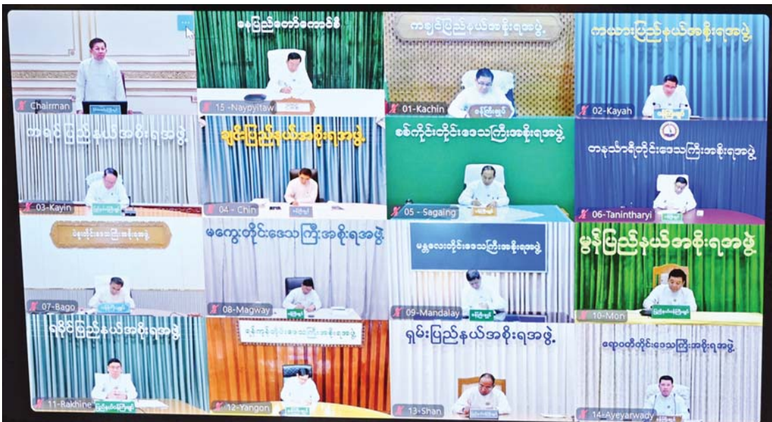
ပြည်ထောင်စုအစိုးရအဖွဲ့ လုပ်ငန်းညှိနှိုင်းအစည်းအဝေးသို့ နေပြည်တော်ကောင်စီဥက္ကဋ္ဌ တိုင်းဒေသကြီးနှင့် ပြည်နယ် ဝန်ကြီးချုပ်များက ဗီဒီယိုကွန်ဖရင့်စနစ်ဖြင့် တက်ရောက်ကြစဉ်။

( ၃-၉-၂၀၂၄ ရက်နေ့တွင် နိုင်ငံတော်စီမံအုပ်ချုပ်ရေးကောင်စီဥက္ကဋ္ဌ နိုင်ငံတော် ဝန်ကြီးချုပ် ဗိုလ်ချုပ်မှူးကြီး မင်းအောင်လှိုင် ရှမ်းပြည်နယ် အစိုးရအဖွဲ့ဝင်များ၊ ပြည်နယ်နှင့် ခရိုင်အဆင့် ဌာနဆိုင်ရာတာဝန်ရှိသူများအား ပြောကြားသည့် အမှာ စကားမှ ကောက်နုတ်ချက် )