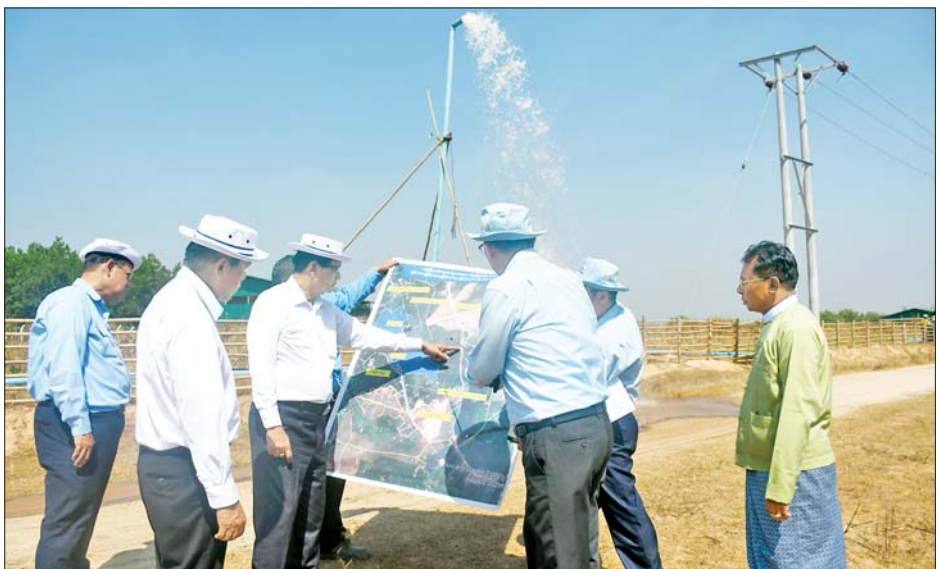
အမှတ်(၂) တည်ဆောက်ခြင်း လုပ်ငန်းခွင်အတွင်း အလိုက် ရှင်းလင်းတင်ပြရာ တိုင်းဒေသကြီး လှည့်လည်ကြည့်ရှုစစ်ဆေးပြီး ရှင်းလင်းဆောင်တွင် ဝန်ကြီးချုပ်က လိုအပ်သည်များ မှာကြားခဲ့ကြောင်း ညွှန်ကြားရေးမှူး ဦးကျော်နိုင်ဦးက လုပ်ငန်းကဏ္ဍ သိရသည်။ ဆန်းကျော်ဦး(ပြန်/ဆက်)

အဖွဲ့သည် ရှင်းလင်းဆောင်တွင် တိုင်းဒေသကြီးဌာန ဆိုင်ရာများ၊ မွေးမြူရေးလုပ်ငန်းရှင်များနှင့် တွေ့ဆုံပြီး ဇုန်အတွင်း မွေးမြူရေးလုပ်ငန်းဆောင်ရွက် နေမှုများအတွက် လျှပ်စစ်မီးနှင့် ဆိုလာစနစ်ဖြင့် ရေလုံလောက်စွာရရှိရေး လုပ်ငန်းကိစ္စရပ်များ ဆောင်ရွက်နေမှုများနှင့်စပ်လျဉ်း၍ ဆွေးနွေးကြ သည်။ ယင်းနောက် တိုင်းဒေသကြီး ဝန်ကြီးချုပ်နှင့် အဖွဲ့သည် မွေးမြူရေးဇုန်အတွင်း လျှပ်စစ်မီးရရှိရေး ရန်ကုန်မြို့တော် လျှပ်စစ်ဓာတ်အားပေးရေး ကော်ပိုရေးရှင်းက 11 KV - Switch Board ဓာတ်အား ပေးရုံတည်ဆောက်ထားရှိမှု၊ တိုင်းဒေသကြီး ဆည်မြောင်းနှင့် ရေအသုံးချမှုစီမံခန့်ခွဲရေးဦးစီးဌာန က ကန်ကြီးကုန်းရေလှောင်ကန်မှ မွေးမြူရေးဇုန် များသို့ ရေပေးဝေရန်နှင့် ဆိုလာပန်ဖြင့် ရေမြှင့်တင် ပေးခြင်းလုပ်ငန်း ဆောင်ရွက်နေမှု၊ ကံဘဲကျေးရွာ အုပ်စုအတွင်း နွေစပါးဧက ၄၀၀၀ စိုက်ပျိုးရေး ရရှိရေး၊ ၆ ပေ ၁၂ ပေ ၆ ပေ ပေါက် ကဘင်းရေထိန်းတံခါး