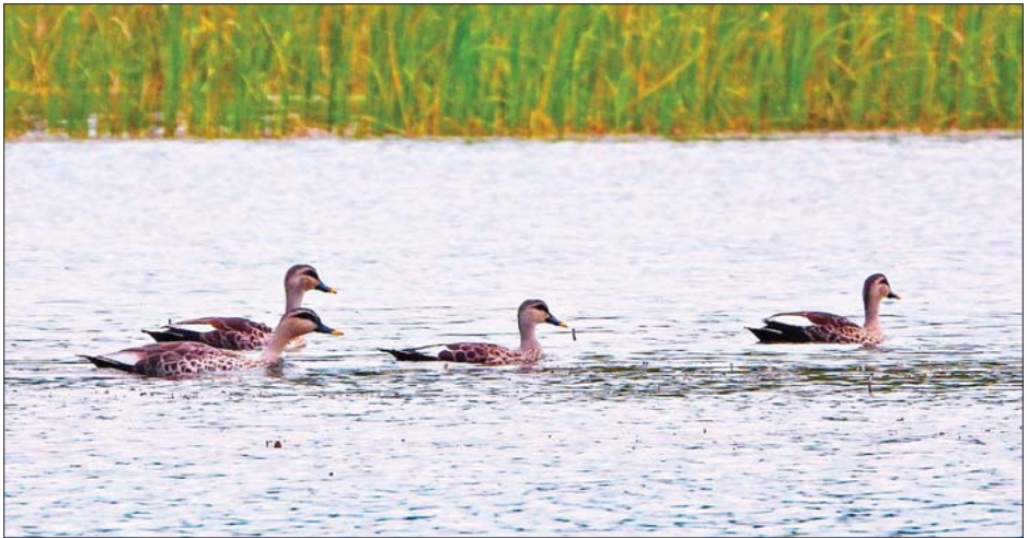
ကြက်မောက်တောင်ဆည်အတွင်း ဝင်ရောက်ကျက်စားနေသည့် ဆောင်းခိုရေပျော်ငှက် ဂျားမငှက်အုပ်ကို တွေ့ရစဉ်။