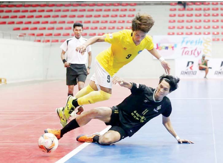
7 Dragon အသင်းနှင့် YCDC Marga Youth အသင်းတို့ ယှဉ်ပြိုင်ကစားကြစဉ်။

ရန်ကုန် ဖေဖော်ဝါရီ ၁၂၀၂၄-၂၀၂၅ ရာသီ MFF ဖူဆယ်လိဂ်-၂ ပြိုင်ပွဲ ပွဲစဉ်(၉)ကို ဖေဖော်ဝါရီ ၁ ရက်က ရန်ကုန်မြို့ သုဝဏ္ဏဘောလုံးကွင်းရှိ MFF ဖူဆယ်အားကစားရုံ၌ ဆက်လက်ကျင်းပရာ ဇယားထိပ်ပိုင်းအသင်းအားလုံး နိုင်ပွဲရရှိသည်။ ပွဲစဉ်(၉)တွင် Pacific Sun Far အသင်းက KKY အသင်းကို သုံးဂိုး-တစ်ဂိုး၊ Black Cross အသင်းက ရွှေပြည်သာယူနိုက်တက်အသင်းကို ခုနစ်ဂိုး-တစ်ဂိုး၊ Gold Dream အသင်းက လက်ဝဲသုန္ဒရအသင်းကို ခြောက်ဂိုး-တစ်ဂိုး၊ JZ Yangon အသင်းက 7 Brother အသင်းကို သုံးဂိုး-နှစ်ဂိုး၊ 7 Dragon အသင်းက YCDC Marga Youth အသင်းကို စာမျက်နှာ ၂၁ ကော်လံ ၁ သို့ *