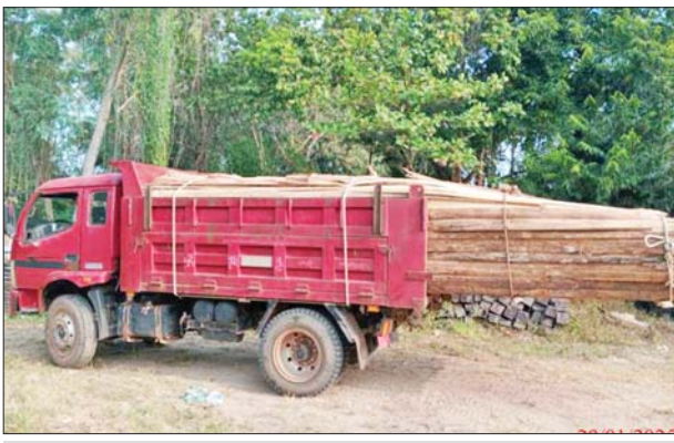
ပဲခူးတိုင်းဒေသကြီး၌ သိမ်းဆည်းရမိမှု။

နေပြည်တော် ဖေဖော်ဝါရီ ၁ တရားမဝင် ကုန်သွယ်မှု တိုက်ဖျက်ရေးဦးဆောင်ကော်မတီ ၏ကြီးကြပ်ကွပ်ကဲမှုဖြင့် တရားမဝင် ကုန်သွယ်မှုများကို ဥပဒေနှင့်အညီ ထိရောက်စွာ တားဆီးအရေးယူ နိုင်ရေး ဆောင်ရွက်လျက်ရှိသည်။