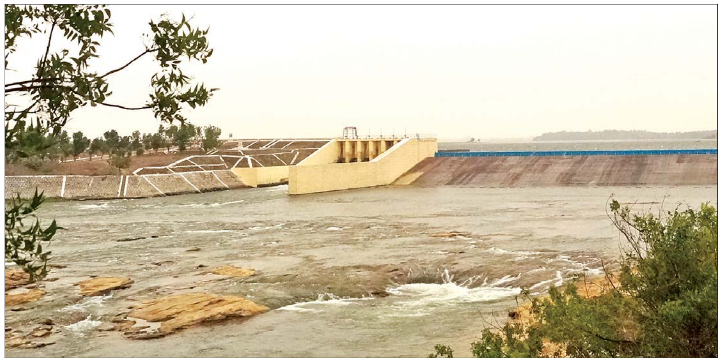
ကန့်ဘလူမြို့နယ်အတွင်းရှိ ကင်းတပ်ရေလှောင်တံခံကို တွေ့ရစဉ်။

ကန့်ဘလူ ဖေဖော်ဝါရီ ၁ စစ်ကိုင်းတိုင်းဒေသကြီး ကန့်ဘလူမြို့နယ်အတွင်းရှိ ဒေသခံတောင်သူလယ်သမားများ ယခုနှစ် နွေစပါးစိုက်ပျိုးရာသီ၌ နွေစပါး ဧက ၂၄၀၀၀ ကျော် အတွက် စိုက်ပျိုးရေးများကို ဖေဖော်ဝါရီ ၇ ရက်တွင် စတင်ပေးဝေရန် စီစဉ်ထားကြောင်း မြို့နယ်ဆည်မြောင်းနှင့် ရေအသုံးချမှုစီမံခန့်ခွဲရေးဦးစီးဌာနမှ သိရသည်။ စာမျက်နှာ ၃ ကော်လံ ၁ သို့ ၀