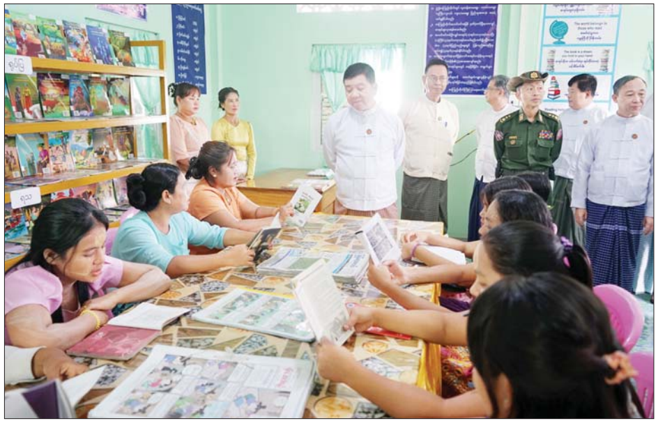
ငါးသိန်း စုစုပေါင်း စာကြည့်တိုက်ငွေပဒေသာပင် ကိုလှူဒါန်းပေးအပ်လှူဒါန်းခဲ့ကြောင်း သိရသည်။ စာကြည့်တိုက်ဖောင်ဒေးရှင်းနှင့် နွေးထွေးသောရင်ခွင် စည်သူ(ပြန်/ဆက်)

မွန်ပြည်နယ်အစိုးရအဖွဲ့က စာကြည့်တိုက်ငွေပဒေသာ ပင်အတွက် လှူဒါန်းငွေကျပ် ငါးသိန်းနှင့် ရပ်ကွက်သူ ရပ်ကွက်သားများက စုပေါင်းလှူဒါန်းငွေကျပ်