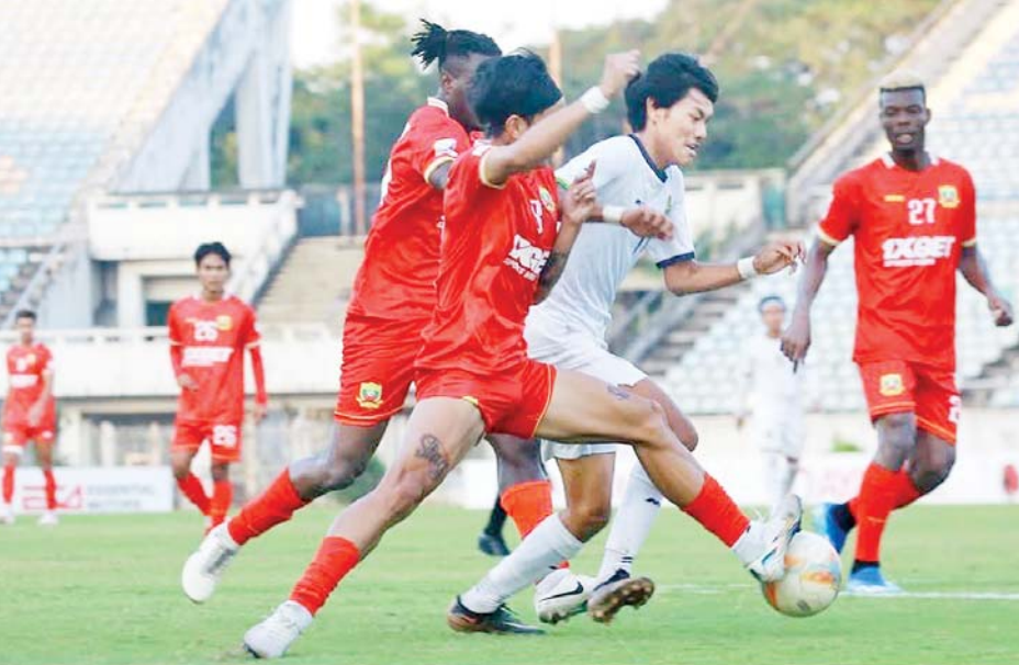
ဒဂုံစတားယူနိုက်တက်အသင်းနှင့် ရှမ်းယူနိုက်တက်အသင်းတို့ ယှဉ်ပြိုင်ကစားကြစဉ်။

ရန်ကုန် ဖေဖော်ဝါရီ ၁၂၀၂၄-၂၀၂၅ ရာသီ MNL အမှတ်ပေးပြိုင်ပွဲ ပွဲစဉ်(၁၈) တတိယနေ့ကို ဖေဖော်ဝါရီ ၁ ရက်က ရန်ကုန်မြို့ရှိ သုဝဏ္ဏကွင်း၌ ကျင်းပရာ ဒဂုံစတားယူနိုက်တက်အသင်းနှင့် ရှမ်းယူနိုက်တက်အသင်းတို့ ဂိုးမရှိသရေကျခဲ့သည်။ ဇယားထိပ်ဆုံးတွင် အမှတ်ဖြတ်ဦးဆောင်နေသည့် လက်ရှိချန်ပီယံ ရှမ်းယူနိုက်တက် အသင်းသည် နိုင်ပွဲဆက်မူ ရပ်တန့်ခဲ့ရသော်လည်း ရှုံးပွဲမရှိစံချိန်ကို ဆက်ထိန်းထားနိုင်ခဲ့သည်။ ယခုသရေရလဒ်မှာ ဒဂုံစတားအသင်းအတွက် အဖိုးတန် သရေတစ်မှတ်ဖြစ်ခဲ့ပြီး စာမျက်နှာ ၂၁ ကော်လံ ၁ သို့ *