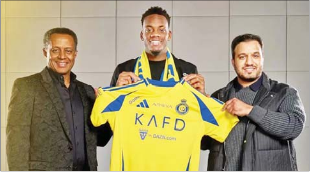
တိုက်စစ်မှူး ဝျန်ဒူရန်အား အယ်လ်နားဆားအသင်းနှင့် စာချုပ် အပြီးတွင် တွေ့ရစဉ်။

(နိုင်ငံတော်စီမံအုပ်ချုပ်ရေးကောင်စီဥက္ကဋ္ဌ နိုင်ငံတော်ဝန်ကြီးချုပ် ဗိုလ်ချုပ်မှူးကြီးမင်းအောင်လှိုင်၏ ၂၀၂၄ ခုနှစ်၊ စက်တင်ဘာလ ၃ ရက်နေ့တွင် ရှမ်းပြည်နယ်အစိုးရအဖွဲ့ဝင်များ၊ ပြည်နယ်နှင့် ခရိုင်အဆင့် ဌာနဆိုင်ရာတာဝန်ရှိသူများအား တွေ့ဆုံအမှာစကား ပြောကြားမှုမှ ကောက်နုတ်ချက်)