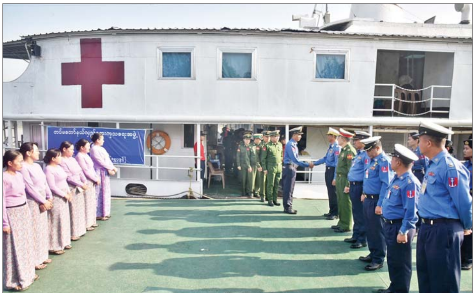
ဦးစီးချုပ်ကိုယ်စား ရေတပ်လေ့ကျင့်ရေးဌာနချုပ် ဌာနချုပ်မှူးက ပေးအပ်ချီးမြှင့်ခဲ့ပြီး စားသောက် ဖွယ်ရာများဖြင့် တည်ခင်းဧည့်ခံခဲ့သည်။ တပ်မတော်နယ်လှည့်အထူးကု ဆေးအဖွဲ့များ ပါဝင်သော တပ်မတော်မြစ်တွင်းသွားဆေးရုံရေယာဉ် (ရွှေပုဇွန်)နှင့် မြစ်ရေယာဉ်(စကု)တို့ဖြင့် ၂၀၁၃ ခုနှစ် မှစတင်၍ ရောဂါမြစ်ဝကျွန်းပေါ်ဒေသနှင့် မြစ်ကြောင်းများတစ်လျှောက် ဆေးကုသရန် ခက်ခဲ သော ကျေးရွာများရှိ ဒေသခံပြည်သူများအား ကျန်းမာရေးစောင့်ရှောက်မှုလုပ်ငန်းများ ဆောင်ရွက် ပေးခဲ့ရာ ယခုခရီးစဉ်သည် ၁၉ ကြိမ်မြောက်ဖြစ်ပြီး ဒေသခံပြည်သူစုစုပေါင်း ၁၈၅၅၆၈ ဦးတို့ကို ကျန်းမာ ရေးစောင့်ရှောက်မှုလုပ်ငန်းများ ဆောင်ရွက်ပေးနိုင်ခဲ့ ကြောင်းနှင့် တပ်မတော်မြစ်တွင်းသွားဆေးရုံရေယာဉ် (ရွှေပုဇွန်)ရှိ သားဖွားခန်း၌ ကိုယ်ဝန်ဆောင်မိခင် ၃၁ ဦးတို့အား အောင်မြင်စွာ မွေးဖွားပေးနိုင်ခဲ့ကြောင်း သိရသည်။ သတင်းစဉ်

ဦးနှင့် သွားနှင့်ခံတွင်းရောဂါ ၇၀၄ ဦးတို့ကို လိုအပ် သည့်ဆေးဝါးကုသမှုများ ဆောင်ရွက်ပေးပြီး ၎င်းတို့ အနက် အထွေထွေခွဲစိတ်လူနာ ၁၀၅ ဦး၊ မျက်စိ ခွဲစိတ်လူနာ ၄၂ ဦးတို့ကို ဆေးရုံရေယာဉ်ပေါ်တွင် ခွဲစိတ်ကုသမှုများ ဆောင်ရွက်ပေးနိုင်ခဲ့သည်။ ထို့ပြင် ဓာတ်မှန်ရိုက်လူနာ ၂၄၉ ဦး၊ အာထရာ ဆောင်းဖြင့် စမ်းသပ်စစ်ဆေးလူနာ ၄၇၄ ဦး၊ ECG စက်ဖြင့် နှလုံးစမ်းသပ်လူနာ ၄၀၄ ဦးနှင့် ဓာတ်ခွဲ စမ်းသပ်လူနာ ၈၁၅ ဦးတို့ကို ရောဂါရှာဖွေစမ်းသပ် ပေးခြင်းများ ဆောင်ရွက်ပေးနိုင်ခဲ့ပြီး ဆေးရုံရေယာဉ် ပေါ်ရှိ သားဖွားခန်း၌ ကိုယ်ဝန်ဆောင်မိခင် သုံးဦးတို့ အား အောင်မြင်စွာ မွေးဖွားပေးနိုင်ခဲ့ကာ ဆေးရုံ တက်ရောက်ကုသရန်လိုအပ်သော ဒေသခံပြည်သူ ၆၀ တို့ကိုလည်း သက်ဆိုင်ရာမြို့နယ်အသီးသီးရှိ တပ်မတော်ဆေးရုံများနှင့် ပြည်သူ့ဆေးရုံများသို့ တက်ရောက်ကုသနိုင်ရေး စီစဉ်ဆောင်ရွက်ပေးနိုင်ခဲ့ သည်။ တပ်မတော်မြစ်တွင်းသွား ဆေးရုံရေယာဉ် (ရွှေပုဇွန်)နှင့် မြစ်ရေယာဉ်(စကု)တို့ဖြင့် ပြန်လည် ရောက်ရှိလာသည့် တပ်မတော်နယ်လှည့်အထူးကု ဆေးအဖွဲ့များအား နိုင်ငံတော်စီမံအုပ်ချုပ်ရေး ကောင်စီဥက္ကဋ္ဌ တပ်မတော်ကာကွယ်ရေးဦးစီးချုပ် ဗိုလ်ချုပ်မှူးကြီးမင်းအောင်လှိုင်မှ ဂုဏ်ပြုပေးအပ် ချီးမြှင့်သောလက်ဆောင်ပစ္စည်းများကို နိုင်ငံတော်စီမံ အုပ်ချုပ်ရေးကောင်စီဥက္ကဋ္ဌတပ်မတော်ကာကွယ်ရေး