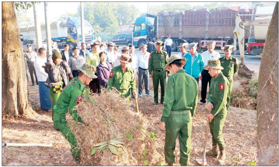
ကြောင်းနှင့် သန့်ရှင်းရေးပြုလုပ်ကြသူများအား လက်ဖက်ရည်များဖြင့် ပြန်လည်ဧည့်ခံကျွေးမွေး ပြည်သူများက ကောက်ညှင်းပေါင်း၊ အကြော်၊ ခဲကြကြောင်း သိရသည်။ တိုင်းဒေသကြီး(ပြန်/ဆက်)

ပဲခူးတိုင်းဒေသကြီးအစိုးရအဖွဲ့က ဦးဆောင်၍ တိုင်းဒေသကြီးအတွင်း မြို့နယ် ၂၈ မြို့နယ်ရှိ တက္ကသိုလ်များ၊ ဒီဂရီကောလိပ်များ၊ စာသင်ကျောင်း များ၊ ဆေးရုံများ၊ ဘာသာရေးအဆောက်အအုံများ၊ ဌာနဆိုင်ရာရုံးများ၊ အများနှင့်သက်ဆိုင်သော ပန်းခြံ များနှင့် သောက်သုံးရေကန်များတွင် တိုင်းဒေသ ကြီး/ခရိုင်/မြို့နယ်အဆင့် ဌာနဆိုင်ရာဝန်ထမ်းများ၊ တပ်ရင်းတပ်ဖွဲ့များ၊ ကျောင်းသား ကျောင်းသူများ၊ ရပ်ကွက်နေပြည်သူများ၊ လူမှုရေးအသင်းအဖွဲ့များ၏ ပေါင်းစုအားဖြင့် စုပေါင်းသန့်ရှင်းရေးပြုလုပ်ခဲ့ကြ