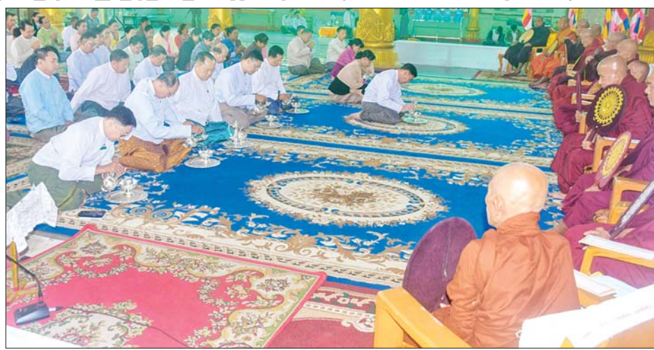
မဟာဂန္ထဝါစကပဏ္ဍိတ ဘဒ္ဒန္တ အနုမောဒနတရား နာယူကြပြီး သွန်းချ အမျှပေးဝေခဲ့ကြောင်း နာဂိန္ဒမဟာထေရ်မြတ် ထံမှ လှူဒါန်းမှုအစုစုအတွက် ရေစက် သိရသည်။ တင်ထွန်း (ပြန်/ဆက်)

ပရိသတ်များက ကိုးပါးသီလခံယူ ဆောက်တည်ကြပြီး သံဃာတော်အရှင်သူမြတ်များက ပရိတ်တရားတော်များရွတ်ပွား ချီးမြှင့်တော်မူကြသည်။ ထို့နောက် ပြည်နယ်ဝန်ကြီးချုပ်က သာသနာရေးဆိုင်ရာများ လျှောက်ထားပြီး သံဃာတော် အရှင်သူမြတ်များအား ပြည်နယ်ဝန်ကြီးချုပ်နှင့်ဇနီး၊ တာဝန်ရှိသူများက လှူဖွယ်ဝတ္ထုများ ဆက်ကပ်လှူဒါန်းကြသည်။ ယင်းနောက် မြို့နယ်ဩဝါဒါစရိယ စစ်တွေမြို့ ပညာလင်္ကာရ ကျောင်းတိုက်ဆရာတော် အဂ္ဂ