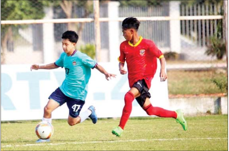
Sparrow အသင်းနှင့် စစ်ကိုင်းယူနိုက်တက်အသင်းတို့ ယှဉ်ပြိုင်ကစားကြစဉ်။

Muu Region အသင်း၊ Middle Shan State အသင်းနှင့် အင်းလေးလူငယ်အသင်းတို့ ခြောက်သင်း ယှဉ်ပြိုင်နေသည်။ တောင်ကြီးဇုန်ပွဲစဉ်များကို ဖေဖော်ဝါရီ ၁ ရက်မှ ဇွန် ၁၅ ရက်အထိ နှစ်ကျော့စနစ်ဖြင့် ကျင်းပမည်ဖြစ်ပြီး အမှတ်အများဆုံး ရရှိသည့်အသင်းမှာ Grand Final သို့ တက်ရောက်ယှဉ်ပြိုင်ခွင့်ရမည်ဖြစ်သည်။ ယခုရာသီ MFF ယူ-၁၅ လိဂ်ပြိုင်ပွဲကို ရန်ကုန်၊ တောင်ကြီးနှင့် မန္တလေးမြို့တို့တွင် ဇုန်သုံးခုခွဲ၍ ကျင်းပလျက်ရှိသည်။ သတင်း-ရှိုင်းထက်ဇော်၊ ဓာတ်ပုံ-MFF