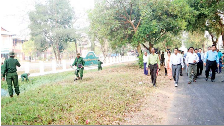
တာဝန်ရှိသူများနှင့် ညှိနှိုင်းဆောင်ရွက်ပေး သည်။

ဦးစွာ တိုင်းဒေသကြီးဝန်ကြီးချုပ်နှင့် တာဝန်ရှိ သူများက အမှတ်(၂) အခြေခံပညာအထက်တန်း ကျောင်းဝင်းအတွင်း စုပေါင်းသန့်ရှင်းရေးလုပ်ငန်း များ ဆောင်ရွက်နေမှုကို လှည့်လည်ကြည့်ရှုအားပေး ပြီး တိုင်းဒေသကြီးဝန်ကြီးချုပ်က ကျောင်းဝင်း အတွင်း ကျောင်းဆောင်သစ်ဆောက်လုပ်နေမှု အခြေအနေများ၊ ကျောင်းသား ကျောင်းသူများ ကစားလျက်ရှိသည့် ဘောလုံးကွင်းအား ကြည့်ရှု စစ်ဆေးကာ လိုအပ်သည်များကို သက်ဆိုင်ရာ