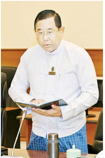
ပြည်ထောင်စုဝန်ကြီး ဒုတိယဗိုလ်ချုပ်ကြီး ထွန်းထွန်းဇော် ဆွေးနွေးတင်ပြစဉ်။

များနှင့်အညီ နိုင်ငံရေးပါတီ ပြန်လည် မှတ်ပုံတင်ခွင့်လျှောက်ထားသည့် ပါတီ ၅၀ ပါတီနှင့် ပါတီအသစ် တည်ထောင်ခွင့် လျှောက်ထားသည့်ပါတီ ၁၈ ပါတီရှိခြင်း ကြောင့် စုစုပေါင်း ၆၈ ပါတီရှိပြီဖြစ် ကြောင်း၊ ဥပဒေနှင့်အညီ ပြန်လည်မှတ်ပုံ တင်ခွင့် လျှောက်ထားခြင်းမရှိသည့် နိုင်ငံရေးပါတီ ၄၀ ပါတီအနေဖြင့် မှတ်ပုံ တင်ခြင်းဥပဒေပုဒ်မ ၂၅ အရ နိုင်ငံရေး ပါတီအဖြစ်မှ အလိုအလျောက် ပျက်ပြယ် ပြီးဖြစ်ကြောင်း၊ ပြည်ထောင်စု ရွေးကောက်ပွဲကော်မရှင်အနေဖြင့် ပြန်လည် မှတ်ပုံတင်ခွင့်နှင့် အသစ်တည်ထောင် မှတ်ပုံတင်ခွင့် တင်ပြလာသည့် နိုင်ငံရေး ပါတီ ၆၈ ပါတီအနက်မှ နိုင်ငံရေးပါတီ