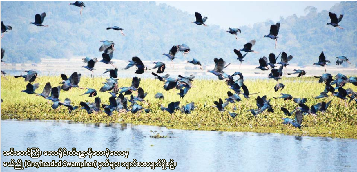
အမီးတော်ကြီး တောရိုင်းတိရစ္ဆာန်အေးမွဲတောမှ ဖော်ဗီဗြို (Greyheaded Swamphen) ဖွတ်များ ဖျော်စားချေစာခြေခြင်း

ရေဝပ်ဒေသများသည် ကမ္ဘာ့နိုင်ငံအသီးသီးအတွက် အရေးပါသည့် အလျောက် ရေဝပ်ဒေသများ ဝိုင်းဝန်းထိန်းသိမ်းကြရန်အတွက် “ရေဝပ်ဒေသများ ကွန်ဗင်းရှင်း (Convention on Wetlands)” ကို ၁၉၇၁ ခုနှစ် ဖေဖော်ဝါရီလ ၂ ရက်နေ့တွင် အီရန်နိုင်ငံ ရမ်ဆာမြို့ (Ramsar) ၌ ဖွဲ့စည်း