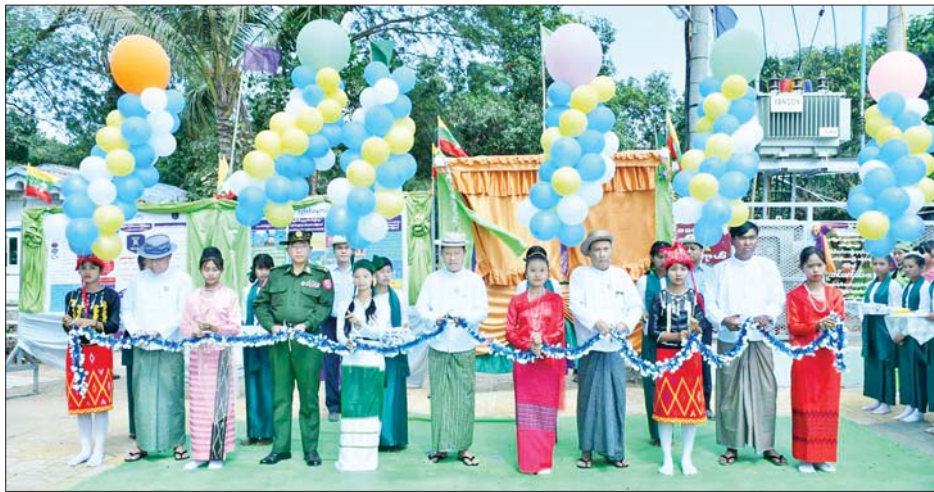
ဝန်ကြီးချုပ်နှင့် တာဝန်ရှိသူများသည် ကျေးရွာအတွင်း မိတာတပ်ဆင်ထားမှုအခြေအနေများကို လှည့်လည်ကြည့်ရှုစစ်ဆေးသည်။ အဆိုပါ လက်ပံကျွန်းကျေးရွာ လျှပ်စစ်မီးလင်းရေးလုပ်ငန်းကို ၂၀၂၄-၂၀၂၅ ဘဏ္ဍာနှစ် တိုင်းဒေသကြီးဘဏ္ဍာရန်ပုံငွေဖြင့် ဆောင်ရွက်သည့် မဟာဓာတ်အားလိုင်းမှ