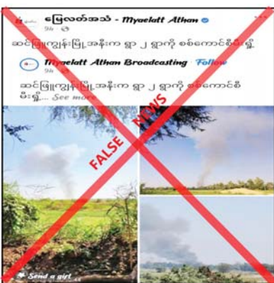
လုပ်ကြံရေးသား ဖြန့်ဝေနေခြင်းဖြစ်ကြောင်း သိရသည်။ သတင်းစဉ်

ငြိမ်းချမ်းစွာ နေထိုင်လျက်ရှိသော ပြည်သူ လူထုအား ငွေကြေးကောက်ခံခြင်း၊ လူသစ် စုဆောင်းခြင်းနှင့် အနိုင်ကျင့်ခြင်းခြောက်မှုများ အား ဥပဒေမဲ့ လုပ်ဆောင်လျက်ရှိပြီး ၎င်းတို့ အပေါ်ထောက်ခံအားပေးမှုမရှိသည့် ကျေးရွာ များအားမီးရှို့ဖျက်ဆီးခြင်းများ လုပ်ဆောင် လျက်ရှိကြောင်း၊ လုံခြုံရေးတပ်ဖွဲ့ဝင်များ အနေဖြင့် ပြည်သူများ ငြိမ်းချမ်းစွာနေထိုင်နိုင် ရေးအတွက် နယ်မြေလုံခြုံရေးလုပ်ငန်းများ ဆောင်ရွက်လျက်ရှိသည်ကို တရားမဝင် ပြည်ပျက်မီဒီယာများက လုံခြုံရေးတပ်ဖွဲ့ဝင် များအပေါ် ပြည်သူများ အထင်အမြင်လွှဲမှား စေရန် ရည်ရွယ်၍ ယခုကဲ့သို့ အခြေအမြစ်မရှိ သည့် ဓာတ်ပုံများကိုအသုံးပြု၍ မဟုတ်မမှန်