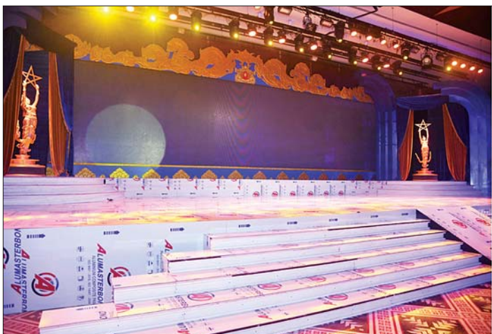
လစ်ဟာမူမရှိအောင် ကြိုတင်ပြင်ဆင်ထားရှိရန်နှင့် အခမ်းအနား အစီအစဉ်များအလိုက် စနစ်တကျဖြစ်စေရေး ကြိုတင်လေ့ကျင့်မှုများ ဆောင်ရွက်ရန် မှာကြားသည်။ ၂၀၂၄ ခုနှစ်အတွက် မြန်မာ့ရုပ်ရှင်ထူးချွန်ဆုချီးမြှင့်ပွဲအခမ်းအနား

ဦးစွာ ပြည်ထောင်စုဝန်ကြီးနှင့် အဖွဲ့သည် အဝင်မုခ်ဦး၊ Photo Booth၊ Interview Booth၊ ဂုဏ်ပြုခံလျှောက်လမ်း (Red Carpet) နေရာများ၊ အခမ်းအနားကျင်းပမည့် ကျောက်စိမ်းခန်းမ၌ အကယ် ဒဗ်ဆုပေးပွဲစင်မြင့် တည်ဆောက်နေမှု၊ အသံစနစ်နှင့် မီးစနစ်များ တပ်ဆင်ပြီးစီးမှု၊ Stage LED Screen နှင့် LED ဘုတ်များ တပ်ဆင်မည့် နေရာများ၊ နေရာထိုင်ခင်းများနှင့် မီဒီယာဇုန်သတ်မှတ်ထားသည့် နေရာများ ပြင်ဆင်ဆောင်ရွက်နေမှုတို့အား လိုက်လံကြည့်ရှုစစ်ဆေးပြီး သတ်မှတ်ရက်အတွင်း ဆောင်ရွက်ရမည့် လုပ်ငန်းစဉ်များကို အချိန်မီ ပြီးစီးအောင် ဆောင်ရွက်ရန်၊ အသံပိုင်းနှင့် မီးပိုင်းဆိုင်ရာကိစ္စရပ်များ