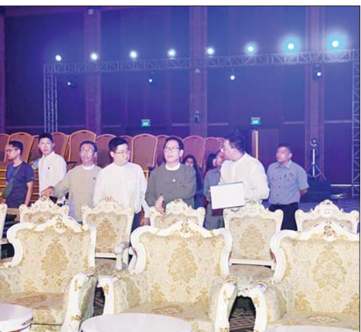
ကို ဖေဖော်ဝါရီ ၉ ရက်တွင် နေပြည်တော်ရှိ မြန်မာအပြည်ပြည် ဆိုင်ရာကွန်ဗင်းရှင်းဗဟိုဌာန-၁ ၌ ခမ်းနားထည်ဝါစွာ ကျင်းပသွားမည် ဖြစ်ကြောင်း သိရသည်။ သတင်းစဉ်