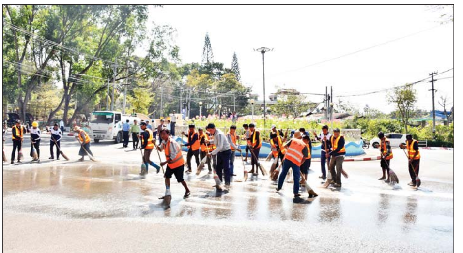
ဈေးဆိုင်များ၊ ဟိုတယ်များ စသည်တို့အနေဖြင့် မိမိတို့ခြံဝင်းရှေ့ဥပစာ သာယာလှပရေးအတွက် သန့်ရှင်းရေးပြုလုပ်ခြင်း၊ မြက်ခင်းစိုက်ပျိုးခြင်း၊ ပန်းအလှပင်များ စိုက်ပျိုးခြင်းလုပ်ငန်းများ ပူးပေါင်းပါဝင် ဆောင်ရွက်နိုင်ရေးအတွက် ရွက်ပေးခဲ့ကြောင်း သိရသည်။ ခရိုင်(ပြန်/ဆက်)

အဆိုပါ ရေဖျန်းသန့်ရှင်းရေးဆောင်ရွက်ရာနေရာသို့ မန္တလေးတိုင်းဒေသကြီး စည်ပင်သာယာရေးဝန်ကြီး ဦးကျော်ဆန်းနှင့် မန္တလေးတိုင်းဒေသကြီး စည်ပင်သာယာရေးအဖွဲ့ ညွှန်ကြားရေးမှူး ဦးမင်းအောင်မြင့်စိုးတို့က မြို့ပေါ်အဓိကလမ်းမကြီးများအား လစဉ် ရေဆေးသန့်ရှင်းရေး ဆောင်ရွက်နိုင်ရေးနှင့် ယာဉ်စည်းကမ်း၊ လမ်းစည်းကမ်း၊ လမ်းညွှန်ဆေးလှိုင်းများ၊ ပလက်ဖောင်းနှင့် လမ်းလယ်ကျွန်း တစ်လျှောက်တို့ရှိ (ဖြူနီကျား၊ ဝါနက်ကျား) ဆေးလှိုင်းများအား ပေါ်လွင်ထင်ရှားနေအောင် လစဉ် ဆေးကြောရေးကိစ္စ ဆောင်ရွက်ပေးရန်တို့ကို တာဝန်ရှိသူများအား မှာကြားခဲ့ပြီး အမျိုးသားကန်တော်ကြီးဥယျာဉ်သို့ သွားရောက်သည့် နန္ဒာလမ်းဘေး ဝဲ/ယာတစ်လျှောက်တွင် ပန်းအလှပင်များ စိုက်ပျိုးနေမှုကို လှည့်လည်ကြည့်ရှုစစ်ဆေးကြသည်။ ပူးပေါင်းဆောင်ရွက်ထို့နောက် ပြင်ဦးလွင်မြို့လမ်းမကြီး လမ်းဘေးဝဲ/ယာတစ်လျှောက်ရှိ လူနေအိမ်များ၊