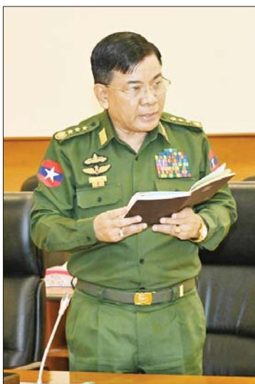
ပြည်ထောင်စုဝန်ကြီး ဗိုလ်ချုပ်ကြီး မောင်မောင်အေး ဆွေးနွေးတင်ပြစဉ်။

နိုင်ငံတော်စီမံအုပ်ချုပ်ရေးကောင်စီ အနေဖြင့် ချမှတ်ထားသည့် နိုင်ငံရေး ရည်မှန်းချက်(၂)ရပ်ဖြစ်သည့် စစ်မှန်၍ စည်းကမ်းပြည့်ဝသော ပါတီစုံဒီမိုကရေစီ စနစ်ခိုင်မာရေးနှင့် ဒီမိုကရေစီနှင့်ဖက်ဒရယ် စနစ်ကို အခြေခံသည့် ပြည်ထောင်စု တည်ဆောက်ရေးကို အကောင်အထည် ဖော် ဆောင်ရွက်နေခြင်းကြောင့် ရွေးကောက်ပွဲတစ်ရပ်ကို မဖြစ်မနေ ကျင်းပပေးရမည်ဖြစ်ကြောင်း၊ ထို့ကြောင့် ရွေးကောက်ပွဲကို ကျင်းပနိုင်ရန် အဘက်ဘက်မှ ပြင်ဆင်မှုများကို အတတ်နိုင်ဆုံး ကြိုးပမ်းဆောင်ရွက်နေခြင်း ဖြစ်ကြောင်း၊ ကျင်းပမည့် အထွေထွေရွေးကောက်ပွဲ သည် စစ်မှန်သည့်ပြည်သူ့ဆန္ဒကို ဖော်ပြ နိုင်ရန် အရေးကြီးကြောင်း၊ ရွေးကောက်ပွဲ ဥပဒေ၊ နည်းဥပဒေများအရ ဆန္ဒမဲ မည်မျှ ပေးမှသာ ရွေးကောက်ပွဲဖြစ်မြောက်မည် ဟု ပြဋ္ဌာန်းထားခြင်းမရှိသည်ကိုလည်း တွေ့ရပါကြောင်း၊ ပြည်သူ့လူထု၏ စစ်မှန် သည့် လိုလားချက်ဖြစ်သော ပါတီစုံဒီမို ကရေစီစနစ်ကို ပြည်သူ့လူထုကသာ စောင့်ရှောက်ရမည်ဖြစ်ကြောင်း၊ စည်းစနစ် ကျနမှုရှိပြီး လွတ်လပ်ပြီး တရားမျှတမှု အပြည့်ရှိသည့် ရွေးကောက်ပွဲဖြစ်ရန်၊ သိက္ခာရှိသော ရွေးကောက်ပွဲဖြစ်ရန်လို ကြောင်း၊ ဆန္ဒမဲပေးပိုင်ခွင့်ရှိသူများ မကျန် ရအောင် အဖြစ်နိုင်ဆုံး ဆောင်ရွက်ပေးရန် လည်းလိုကြောင်း၊ အဆိုပါအချက်များ ဖြစ်ပေါ်ရန် နယ်မြေဒေသအလိုက် တည်ငြိမ်အေးချမ်းပြီး လုံခြုံမှုရှိရန် အရေး ကြီးကြီးကြောင်း တပ်မတော်နှင့် လုံခြုံရေး အဖွဲ့အစည်းများအနေဖြင့် လုံခြုံရေး လုပ်ငန်းများကို တိုးမြှင့်ဆောင်ရွက်နေ ခြင်းဖြစ်ကြောင်း၊ မိမိတို့ရည်မှန်းထား သည့် ဒီမိုကရေစီလမ်းကြောင်းကို ခိုင်ခိုင်မာမာဖြင့် လျှောက်လှမ်းနိုင်ရန်