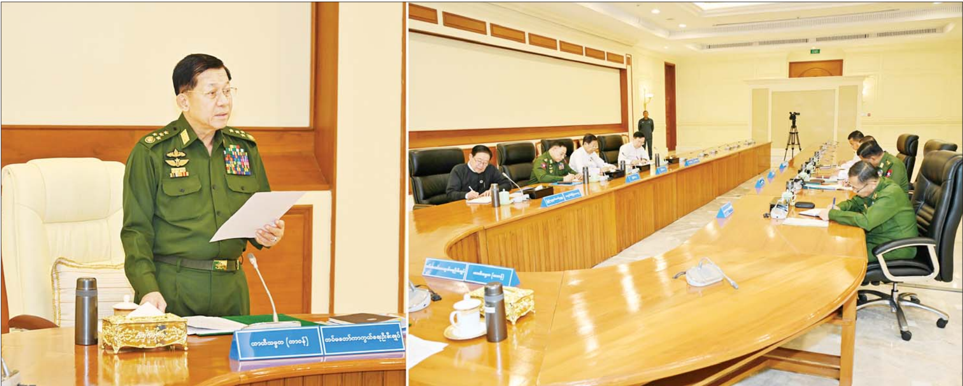
ပြည်ထောင်စုသမ္မတမြန်မာနိုင်ငံတော် အမျိုးသားကာကွယ်ရေးနှင့် လုံခြုံရေးကောင်စီအစည်းအဝေး(၁/၂၀၂၅) ကျင်းပစဉ်။