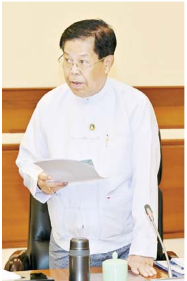
ပြည်ထောင်စုဝန်ကြီး ဦးသန်းဆွေ ဆွေးနွေးတင်ပြစဉ်။

မှု ညှိနှိုင်းရေးကော်မတီအနေဖြင့် စတင် ဖွဲ့စည်းချိန်မှ ယနေ့အချိန်အထိ NCA လက်မှတ်ရေးထိုးထားသည့်အဖွဲ့ ခုနစ်ဖွဲ့၊ လက်မှတ်ရေးထိုးထားခြင်းမရှိသည့် အဖွဲ့ ခြောက်ဖွဲ့တို့ဖြင့် ငြိမ်းချမ်းရေးဆွေးနွေး မှုပေါင်း ၁၁၄ ကြိမ်ပြုလုပ်ခဲ့ကြောင်း၊ နိုင်ငံရေးပါတီများနှင့်(၂၁)ကြိမ်၊ ငြိမ်းချမ်း ရေးလိုလားသည့် အခြားအဖွဲ့အစည်း များနှင့် (၁၀)ကြိမ် တွေ့ဆုံဆွေးနွေးခဲ့ ကြောင်း၊ တွေ့ဆုံဆွေးနွေးမှုများအရ လာမည့်လွှတ်တော်ကာလများတွင် အချို့ ကိစ္စရပ်များကို လွှတ်တော်၌ဆွေးနွေးနိုင် ရေးအတွက် သဘောတူညီမှုဆွေးနွေး ချက်များ ရရှိပြီးဖြစ်ကြောင်း၊ သဘောတူ ညီမှုများ ပိုမိုရရှိစေရေး တွေ့ဆုံဆွေးနွေး မှုများကို ဆက်လက်ဆောင်ရွက်သွားမည် ဖြစ်ကြောင်း။ ၂၀၂၄ ခုနှစ် စက်တင်ဘာ ၂၆ ရက် တွင်လည်း နိုင်ငံတော်၏ လူသားအရင်း အမြစ်များ၊ အခြေခံအဆောက်အအုံများ၊ ပြည်သူများ၏ အသက်အိုးအိမ်စည်းစိမ် များ များစွာဆုံးရှုံးခဲ့ရသောကြောင့် နိုင်ငံရေးပြဿနာကို နိုင်ငံရေးနည်းလမ်း ဖြင့် ဖြေရှင်းရန် ကမ်းလှမ်းဖိတ်ခေါ်ခဲ့ ကြောင်း၊ ဒေသအလိုက် လက်နက်ကိုင် ပဋိပက္ခများ ချုပ်ငြိမ်းမှသာ လွတ်လပ်ပြီး တရားမျှတမှုအပြည့်ရှိသည့် ရွေးကောက် ပွဲကျင်းပနိုင်မည်ဖြစ်ကြောင်း၊ မိမိ အနေဖြင့် လက်နက်ကိုင်ပဋိပက္ခများ ချုပ်ငြိမ်းပြီး ငြိမ်းချမ်းရေးရရှိရန်အတွက် ချမှတ်ထားသည့် လုပ်ငန်းစဉ်များအတိုင်း စဉ်ဆက်မပြတ် ဆက်လက်အကောင်