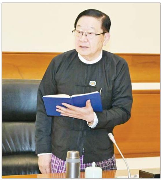
ပြည်သူ့လွတ်တော်ဥက္ကဋ္ဌ ဦးတီခွန်မြတ် ဆွေးနွေးတင်ပြစဉ်။

○ ရှေ့ဖုံးမှ နိုင်ငံတော်ကာကွယ်ရေးနှင့် လုံခြုံရေးအခြေအနေ ထိုသို့တင်ပြရာတွင် ၂၀၂၃ ခုနှစ် ဖေဖော်ဝါရီလ ၄ ရက်နေ့တွင် အဆိုပါ အချိန်က နိုင်ငံတော်တွင်ဖြစ်ပေါ်နေသည့် အခြေအနေများနှင့်ကိုက်ညီပြီး ထိထိ ရောက်ရောက် ဆောင်ရွက်နိုင်မည့် ရှေ့လုပ်ငန်းစဉ်(၅)ရပ်နှင့် ဦးတည်ချက် (၉)ရပ်ချမှတ်ခဲ့ကြောင်း၊ နိုင်ငံတော်စီမံ အုပ်ချုပ်ရေးကောင်စီ၏ ရှေ့လုပ်ငန်းစဉ် (၅)ရပ်မှ ပထမဆုံးဖြစ်သည့် “လွတ်လပ် ပြီးတရားမျှတသော ပါတီစုံဒီမိုကရေစီ အထွေထွေရွေးကောက်ပွဲ အောင်မြင်စွာ ကျင်းပနိုင်ရေး ပြည်ထောင်စုတစ်ဝန်းလုံး တည်ငြိမ်အေးချမ်း၍ တရားဥပဒေစိုးမိုး ရေးအပြည့်အဝရရှိလာအောင် အလေး ထားဆောင်ရွက်သွားမည်” ဆိုသည့် အချက်နှင့်ပတ်သက်ပြီး တိုင်းရင်းသား လက်နက်ကိုင်အဖွဲ့အချို့နှင့် PDF အမည်ခံ အကြမ်းဖက်သမားများအနေဖြင့် မြို့/ရွာ များကို အကြမ်းဖက်တိုက်ခိုက်ခြင်းနှင့် ပြည်သူလူထု၏ အသက်အိုးအိမ်စည်းစိမ် များကိုဖျက်ဆီးခြင်း၊ လူယက်ခြင်းများ ပြုလုပ်ပြီး နယ်မြေဒေသတည်ငြိမ်အေးချမ်း မှုမရှိအောင် ဖန်တီးလျက်ရှိကြောင်း၊ အချို့သောတိုင်းရင်းသား လက်နက်ကိုင် အဖွဲ့များအနေဖြင့်လည်း အဆိုပါ အခြေ အနေကို အခွင့်ကောင်းရယူပြီး နယ်မြေ ချဲ့ထွင်နိုင်အောင် ကြိုးပမ်းနေသည်ကို တွေ့ရကြောင်း၊ ၆ လတာ ကာလအတွင်း အကြမ်းဖက်တိုက်ခိုက်မှု အမျိုးမျိုး ကြောင့် ထိခိုက်သေဆုံးပျက်စီးမှုကို ကြည့်မည်ဆိုပါက အပြစ်မဲ့ပြည်သူ/ နိုင်ငံ့ဝန်ထမ်း ၃၈၃ ဦး သေဆုံးခဲ့ရကြောင်း၊ ပညာရေး/ ကျန်းမာရေးနှင့် လူနေ အဆောက်အအုံအပါအဝင် နိုင်ငံ့ဖွံ့ဖြိုး တိုးတက်ရေးအတွက် အခြေခံအဆောက်