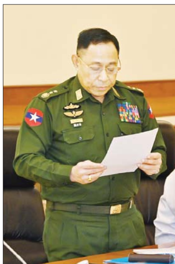
ပြည်ထောင်စုဝန်ကြီး ဒုတိယဗိုလ်ချုပ်ကြီး ရာပြည့် ဆွေးနွေးတင်ပြစဉ်။

သည် သဘာဝပေးထားသည့် ရာသီဥတု နှင့် မြေအနေအထား၊ တည်နေရာအနေ အထားအရ စိုက်ပျိုးရေးလုပ်ငန်းများနှင့် မွေးမြူရေးလုပ်ငန်းများ ကောင်းစွာ ဖြစ်ထွန်းနိုင်သည့်နိုင်ငံ ဖြစ်ကြောင်း၊ သို့သော်လည်း စိုက်ပျိုးရေးနှင့် မွေးမြူရေး ထွက်ကုန်များ ဈေးနှုန်းကြီးမြင့်ခြင်းကို ကျော်လွှားနိုင်ရန် ပန်းတိုင်ရည်မှန်းချက် ပြည့်မီအောင် ဆောင်ရွက်ရန်၊ သီးထပ် စွမ်းအား နှစ်ဆမှ သုံးဆထိရအောင် ကြိုးပမ်းဆောင်ရွက်ရန်လိုကြောင်း။ ပြည်တွင်းမှ စိုက်ပျိုးမွေးမြူရေး ထုတ်ကုန်များကို မြှင့်တင်နိုင်ရန်နှင့် ပြည်ပ မှ တင်သွင်းကုန်များ လျှော့ချနိုင်ရေးကို လည်း အလေးထားဆောင်ရွက်ခဲ့ကြောင်း၊ ကုန်ထုတ်လုပ်မှုတိုးမြှင့်နိုင်မှသာ ၎င်းတို့ နှင့်ဆက်စပ်နေသည့် ကုန်ထုတ်လုပ်ငန်း များ၊ ဝန်ဆောင်မှုလုပ်ငန်းများ တိုးတက် လာနိုင်မည်ဖြစ်ကြောင်း၊ ပြည်ပမှတင်သွင်း ကုန်များ လျှော့ချနိုင်ပြီး နိုင်ငံခြားငွေ