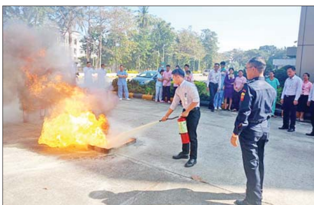
ရန်ကင်းမြို့နယ် မီးသတ်ဦးစီးမှူး အနေဖြင့် မီးချိတ်မီးကပ်များ နှင့်သဲအိတ်များ ထားရှိကြရန်။

ရန်ကင်း ဇန်နဝါရီ ၃၁ ရန်ကင်းတိုင်းဒေသကြီး ရန်ကင်း မြို့နယ် အမှတ်(၁၅)ရပ်ကွက် မိုးကောင်းလမ်းရှိ မိုးကောင်း ရတနာ ဆေးရုံ ဝန်ထမ်းများအား မီးဘေးအန္တရာယ်ဖြစ်ပွားမှု မရှိ စေရေးအတွက် မီးဘေးအန္တရာယ် ဆိုင်ရာ အသိပညာပေးဟောပြော ခြင်းနှင့် ရှေးဦးလက်တွေ့မီးငြိမ်း သတ်ရေး သရုပ်ပြမှုများကို ယနေ့မွန်းလွဲ ၁နာရီက သရုပ်ပြ ဆောင်ရွက်ခဲ့ကြသည်။ ထိုသို့ ဆောင်ရွက်ရာတွင်