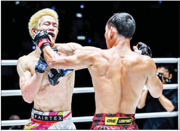
အဲဒီနှင့် မူဂါဆီတို့ ယှဉ်ပြိုင်ထိုးသတ်စဉ်။

ချန်ပီယံလိဂ်ပြိုင်ပွဲရဲ့ play-offs ပွဲစဉ်များကို မဲခွဲဆုံးဖြတ်ခဲ့ရာမှာ မန်စီးတီးအသင်းဟာ ချန်ပီယံလိဂ်ဖလားကို (၁၅)ကြိမ်အထိ ရယူဆွတ်ခူးထားတဲ့ ရီးယဲလ်မက်ဒရစ်အသင်းနဲ့ ယှဉ်ပြိုင်ကစားရမှာဖြစ်ပြီး ဆဲလ်တစ်အသင်းကတော့ ဘိုင်ယန်မြူးနစ်အသင်းနဲ့ ထိပ်တိုက်တွေ့ဆုံနေတာဖြစ်ပါတယ်။ ၂၀၂၃ ခုနှစ်က ချန်ပီယံလိဂ်ဖလားကိုဆွတ်ခူးထားတဲ့ မန်စီးတီးအသင်းဟာ ဒုတိယအကျော့အဖြစ် စပိန်မြေကို သွားရောက်မကစားမီ စာမျက်နှာ ၁၀ ကော်လံ ၅ သို့ ✨