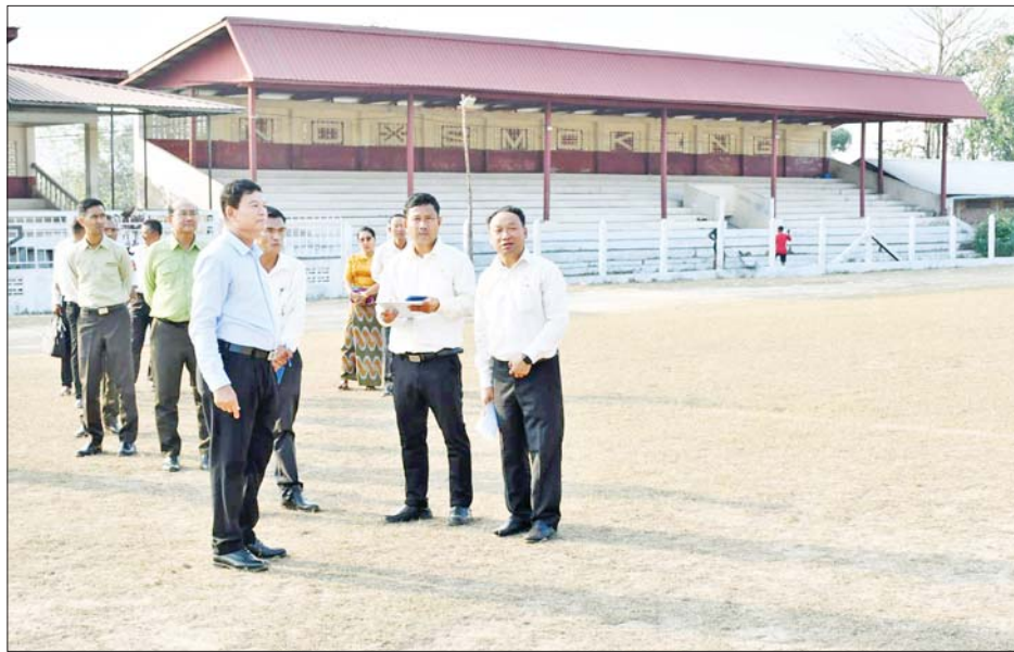
လည်းကောင်း ကြည့်ရှုအားပေးပြီး ပြည်ထောင်စုဝန်ကြီးက အများပြည်သူများ လွတ်လပ်စွာ လာရောက် လေ့ကျင့်ကစားနိုင်ရေး၊ ဝါသနာပါသည့် အားကစားသမားများကိုဖိတ်ခေါ်၍ စနစ်တကျလေ့ကျင့်

နေပြည်တော် ဇန်နဝါရီ ၂၇ အားကစားနှင့် လူငယ်ရေးရာဝန်ကြီးဌာန ပြည်ထောင်စုဝန်ကြီး ဦးမင်းသိန်းဇံသည် တာဝန်ရှိသူများနှင့်အတူ ယနေ့မွန်းလွဲပိုင်းတွင် မြိတ်ခရိုင်အတွင်းရှိ အားကစားကွင်း/အားကစားရုံများကို လိုက်လံကြည့်ရှုစစ်ဆေးသည်။