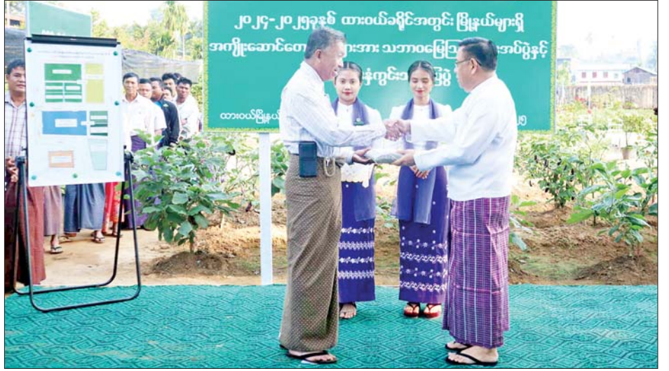
အထက်တန်းကျောင်းရှိကျောင်းသား ကျောင်းသူများ ကြက်ဥများ ပေးအပ်ခဲ့ကြောင်း သိရသည်။ အား ရင်းရင်းနှီးနှီးတွေ့ဆုံပြီး စာရေးကိရိယာများနှင့် တိုင်းဒေသကြီး(ပြန်/ဆက်)

နှင့် DAR ပူးပေါင်းဆောင်ရွက်သည့် မတ်ပဲလေးမျိုး စိုက်ခင်း၊ အောင်မြင်ဖြစ်ထွန်းနေသည့် နေကြာစိုက်ခင်း၊ မြေပဲသီးနှံ၊ မတ်ပဲမျိုးစေ့ထုတ်စိုက်ကွက်၊ အစေ့ထုတ်ပြောင်း၊ ပိုက်ဆံလျှော်နှင့် ဟင်းသီးဟင်းရွက်စိုက်ခင်း၊ Strip Cross အကန့်လိုက်စိုက်နည်းစနစ်၊ တိရစ္ဆာန်အစာပင်နေဗီယာမြက်စိုက်ခင်း၊ Home Garden သီးနှံများစသည့် တောင်သူပညာပေးကွင်းသရုပ်ပြပွဲအား ကြည့်ရှုအားပေးပြီး တောင်သူများအားရင်းရင်းနှီးနှီး လိုက်လံနှုတ်ဆက်သည်။ ဆက်လက်၍ တိုင်းဒေသကြီးဝန်ကြီးချုပ်က အမှတ်(၄) စက်မှု စိုက်ပျိုး၊ မွေးမြူရေးကျောင်းမှ သရုပ်ပြပွဲအားကြည့်ရှုစစ်ဆေးပြီး လိုအပ်သည်များမှာကြားကာ စက်မှု၊ စိုက်ပျိုး၊ မွေးမြူရေး