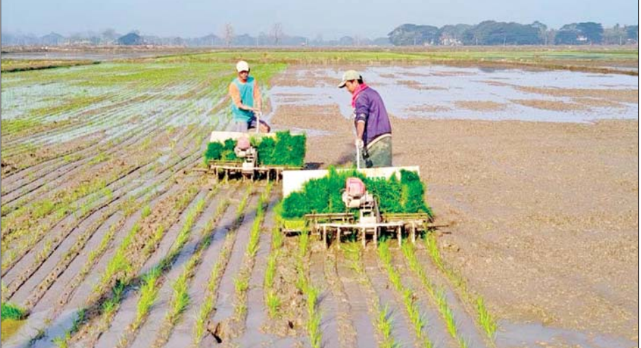
ဇီးကုန်းမြို့နယ်၌ လက်ဆွဲကောက်စိုက်စက်ဖြင့် နွေစပါးစိုက်ပျိုးနေမှုကို တွေ့ရစဉ်။

ဇီးကုန်း ဇန်နဝါရီ ၂၇ ပဲခူးတိုင်းဒေသကြီး ဇီးကုန်းမြို့နယ်တွင် တောင်ညိုဆည်နှင့် ဘော်ဘင်ဆည်တို့မှ ပို့လွှတ်သော ဆည်ရေဖြင့် ၂၀၂၄-၂၀၂၅ ခုနှစ် နွေစပါးစိုက်ဧက ၇၉၇၃ ဧက လျာထားဆောင်ရွက်လျက်ရှိရာ ၂၅၃၄ ဧက စိုက်ပျိုးပြီးစီးပြီးဖြစ်ကြောင်း သိရသည်။ ဈေးနှုန်းချိုသာစွာ ဖြန့်ဖြူးပေးလျက်ရှိ စိုက်ပျိုးသီးနှံများ ပန်းတိုင်အထွက်နှုန်း ပြည့်မီ ကျော်လွန်နိုင်ရေးအတွက် တိုင်းဒေသကြီးအစိုးရ၏ လမ်းညွှန်မှုဖြင့် အစေ့ချက်ရှိလာ၊ ကောက်စိုက်စက်များဖြင့် စိုက်ပျိုးလျက်ရှိပြီး မျိုးကောင်းမျိုးသန့် အသုံးပြုစိုက်ပျိုးရေး၊ သွင်းအားစု အချိန်ကိုက်သုံးစွဲ နိုင်ရေးအတွက် စိုက်ပျိုး/မွေးမြူရေးကြီးကြပ်အဖွဲ့က ကြီးကြပ်၍ သွင်းအားစုများကို အချိန်မီသုံးစွဲနိုင်ရေး အတွက် စာမျက်နှာ ၃ ကော်လံ ၁ သို့ *