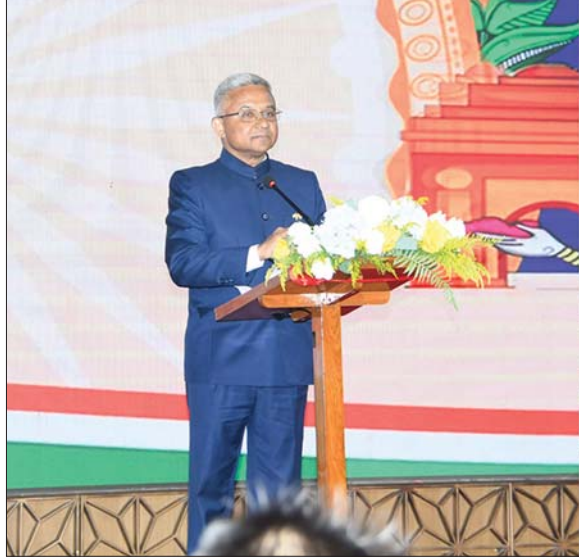
မြန်မာနိုင်ငံဆိုင်ရာ အိန္ဒိယနိုင်ငံသံအမတ်ကြီး H.E.Mr. Abhay Thakur အိန္ဒိယသမ္မတနိုင်ငံ၏ (၇၆)နှစ်မြောက် အမျိုးသားနေ့အထိမ်းအမှတ် ညွှန်ပွဲအခမ်းအနားတွင် နှုတ်ခွန်းဆက်စကားပြောကြားစဉ်။