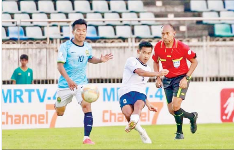
ဒဂုံစတားယူနိုက်တက်အသင်းနှင့် သစ္စာအားမာန်အသင်းတို့ ယှဉ်ပြိုင် ကစားကြစဉ်။

ရန်ကုန် ဇန်နဝါရီ ၂၇ ၂၀၂၄-၂၀၂၅ ရာသီ MNL အမှတ်ပေး ပြိုင်ပွဲ ပွဲစဉ်(၁၇) စတုတ္ထနေ့ကို ဇန်နဝါရီ ၂၇ ရက်က သုဝဏ္ဏကွင်း၌ ကျင်းပရာ ဒဂုံစတားယူနိုက်တက်အသင်းက သစ္စာ အားမာန်အသင်းကို နှစ်ဂိုး-တစ်ဂိုးဖြင့် အနိုင်ရခဲ့သည်။ ထိပ်ဆုံးသုံးသင်း စာရင်းဝင်ရန် ကြိုးပမ်းနေသည့် ဒဂုံစတားယူနိုက်တက် အသင်းသည် ဒုတိယပိုင်းသွင်းဂိုးဖြင့် အမှတ်ပြည့်ရယူနိုင်ခဲ့သည်။ ပထမပိုင်း တွင် ဂိုးမရှိသရေကျနေသော်လည်း ဒုတိယပိုင်းမှ အပြန်အလှန်သွင်းဂိုးများဖြင့် ပွဲကောင်းတစ်ပွဲဖြစ်ခဲ့သည်။ စာမျက်နှာ ၂၁ ကော်လံ ၂ သို့ ✦