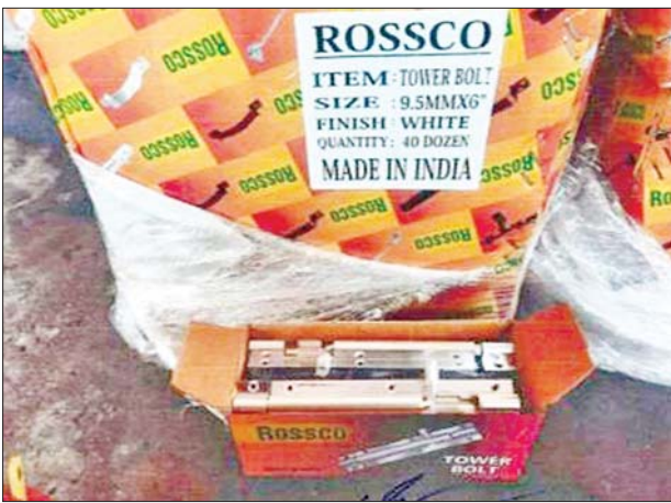
အေးရှားဝေါလ်ကုန်သေတ္တာစစ်ဆေးရေးစခန်း၌ သိမ်းဆည်းရမိမှု။

ဆက်လက်၍ ရန်ကုန်တိုင်းဒေသကြီး တရားမဝင်ကုန်သွယ်မှု တိုက်ဖျက်ရေးအဖွဲ့၏ စီမံခန့်ခွဲမှုဖြင့် တာဝန်ကျပူးပေါင်းအဖွဲ့က စစ်ဆေးမှုများဆောင်ရွက်ခဲ့ရာ လှိုင်သာယာ(အရှေ့ပိုင်း)မြို့နယ် ကျိုစု ကျေးရွာ မွေးမြူရေးဇုန်ရှိ အမှတ်(၇၄/က)သို့လှောင်ရုံ၌ ယာဉ်တစ်စီး ပေါ်မှ တရားမဝင်စာရွက်စာတမ်း အထောက်အထားတင်ပြနိုင်ခြင်းမရှိ သည့် လူသုံးကုန်ပစ္စည်းခုနစ်မျိုး၊ လုပ်ငန်းသုံးပစ္စည်းလေးမျိုး (ခန့်မှန်း တန်ဖိုးငွေ ၈၂၀၇၈၄၆၆ကျပ်)နှင့် အဆိုပါပစ္စည်းများတင်ဆောင်လာသည့် Mitsubishi Canter Truck တစ်စီး (ခန့်မှန်းတန်ဖိုးငွေကျပ် ၃၀၀၀၀၀၀) စုစုပေါင်းခန့်မှန်းတန်ဖိုးငွေ ၁၁၂၀၇၈၄၆၆ ကျပ်ကို သိမ်းဆည်းရမိခဲ့ပြီး