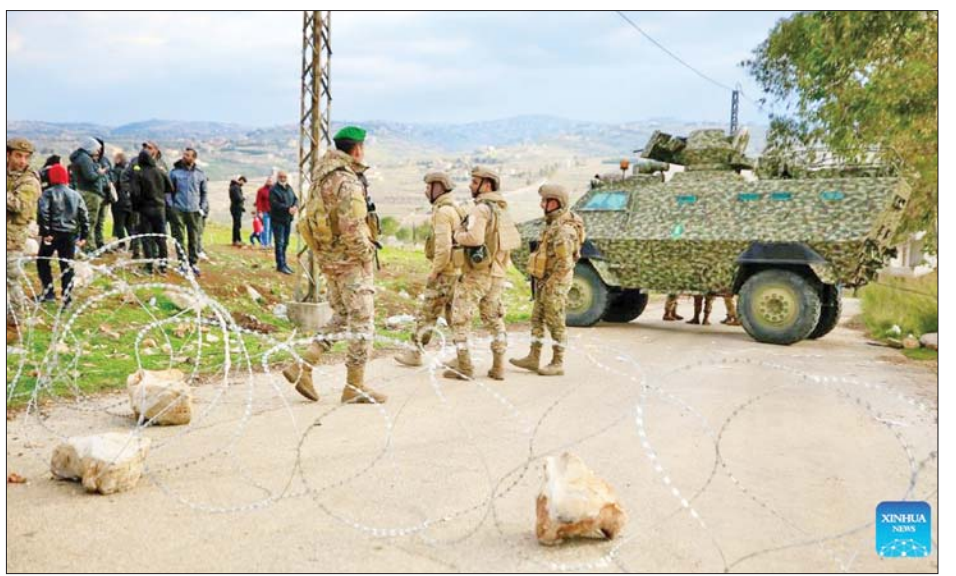
အစွဲရေးတပ်မတော်က လက်ဘနွန်နိုင်ငံအတွင်း ထိခိုက်သေဆုံးမှုများရှိခဲ့သည်။ တိုက်ခိုက်မှုများ ထပ်မံဆောင်ရွက်သောကြောင့် ကိုးကား - ဆင်ဟွာ၊ ဘာသာပြန် - စိုးသူရ

တွင် စုဝေးနေသည့် အရပ်သားများအား အစွဲရေးတပ်မတော်က တင့်ကားများ၊ မြေတူးစက်များ ပါဝင်သည့် တပ်ဖွဲ့များနှင့် တိုက်ခိုက်ခဲ့ကြောင်း သိရသည်။ လက်ဘနွန်နိုင်ငံတောင်ပိုင်းရှိ နကာယာဒေသရှိ ကုလသမဂ္ဂယာယီတပ်ဖွဲ့ဌာနချုပ် အဝင်လမ်းကိုလည်း အစွဲရေးတပ်မတော်က ပိတ်ထားခဲ့ပြီး ပစ်ခတ်မှုများ ဆောင်ရွက်ခဲ့ကြောင်း သိရသည်။ ဇန်နဝါရီ ၂၆ ရက်သည် အစွဲရေးတပ်မတော် တပ်ဖွဲ့များ လက်ဘနွန်နိုင်ငံနယ်နိမိတ်မှ ထွက်ခွာရမည့် နောက်ဆုံးရက်ဖြစ်သည်။ ယမန်နှစ် နိုဝင်ဘာလအတွင်းက အစွဲရေးနှင့် လက်ဘနွန်ဟစ်ဘိုလာအဖွဲ့တို့အကြား အပစ်အခတ်ရပ်စဲရေးသဘောတူညီချက် ရရှိခဲ့သော်လည်း