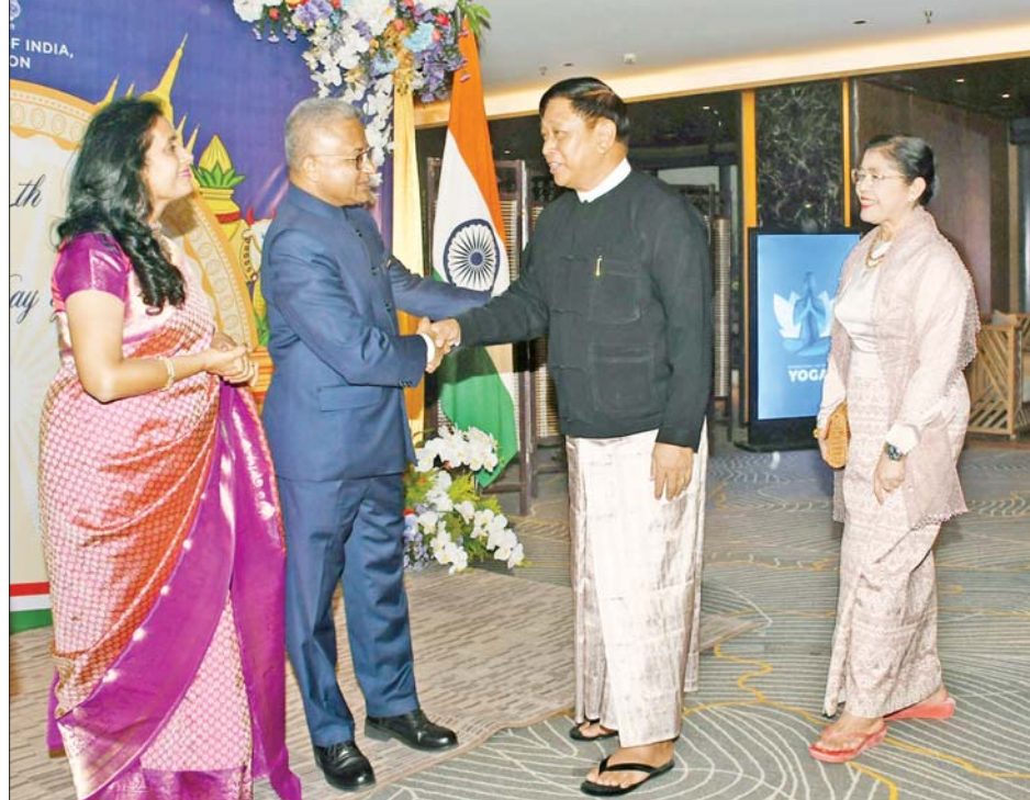
နိုင်ငံတော်စီမံအုပ်ချုပ်ရေးကောင်စီအဖွဲ့ဝင် ဒုတိယဝန်ကြီးချုပ်နှင့် ပြည်ထောင်စုဝန်ကြီး ဗိုလ်ချုပ်ကြီး တင်အောင်စန်းနှင့် ဇနီးတို့အား မြန်မာနိုင်ငံဆိုင်ရာ အိန္ဒိယနိုင်ငံသံအမတ်ကြီး H.E.Mr. Abhay Thakur နှင့် ဇနီးတို့က ရင်းရင်းနှီးနှီး ကြိုဆိုနှုတ်ဆက်စဉ်။

ဇနီး၊ သံအမတ်ကြီးနှင့် ဇနီးတို့ သည် ညွှန်ပွဲအခမ်းအနား သို့ တက်ရောက်လာကြသူများ နှင့်အတူ စုပေါင်းမှတ်တမ်းတင် ဓာတ်ပုံရိုက်ကြပြီး သံအမတ်ကြီး နှင့်ဇနီးတို့က ညစာစားပွဲဖြင့် တည်ခင်းပေးခဲ့ကြသည်။ အခမ်းအနားသို့ ရန်ကုန်တိုင်း ဒေသကြီးဝန်ကြီးချုပ် ဦးစိုးသိန်း နှင့် ဇနီး၊ ရန်ကုန်တိုင်းစစ်ဌာနချုပ် တိုင်းမှူး ဗိုလ်ချုပ် ဇော်ဟိန်းနှင့် ဇနီး၊ တိုင်းဒေသကြီးဝန်ကြီးများ နှင့် ၎င်းတို့၏ဇနီးများ၊ တပ်မတော် အရာရှိများနှင့် ၎င်းတို့၏ ဇနီး များ၊ ရန်ကုန်မြို့ရှိ နိုင်ငံခြားသံရုံး များမှ သံအမတ်ကြီးများ၊ သံရုံး ယာယီတာဝန်ခံများ၊ စစ်သံမှူး များ၊ ကုလသမဂ္ဂဆိုင်ရာဌာန ကိုယ်စားလှယ်များနှင့် ဖိတ်ကြား ထားသူများ တက်ရောက်ကြ ကြောင်း သိရသည်။ သတင်းစဉ်