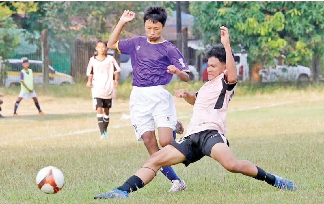
MFF ယူ-၁၅ လိဂ် ရန်ကုန်ဇုန်ပွဲစဉ်များ ကျင်းပနေစဉ်။

ရန်ကုန် ဇန်နဝါရီ ၂၇ MFF ယူ-၁၅ လိဂ်ပြိုင်ပွဲ တောင်ကြီးဇုန်နှင့် မန္တလေးဇုန်ပွဲစဉ်များကို ဖေဖော်ဝါရီ ၁ ရက်တွင် စတင်ကျင်းပမည်ဖြစ်သည်။ မြန်မာနိုင်ငံဘေးလုံးအဖွဲ့ချုပ်သည် ယခုနှစ် ယူ-၁၅ လိဂ်ပြိုင်ပွဲကို ဇုန်သုံးခုခွဲ၍ ကျင်းပမည်ဖြစ်ပြီး ရန်ကုန်ဇုန်ပွဲစဉ်များကို ဒီဇင်ဘာလ နောက်ဆုံးပတ်ကတည်းက ကျင်းပနေပြီး တောင်ကြီးဇုန်နှင့် မန္တလေးဇုန်ကို ဖေဖော်ဝါရီလမှ စတင်ကျင်းပမည်ဖြစ် သည်။ စာမျက်နှာ ၂၁ ကော်လံ ၂ သို့ *