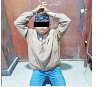
အကြီးတန်းစာရေးကျော်ခိုင်လတ်