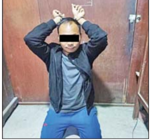
အငယ်တန်းစာရေး သူရိန်ညွန့်

သည့် ပြည်သူ့စစ်မှုထမ်းဥပဒေနှင့်အညီသာ ရွေးချယ်ဆောင်ရွက်လျက်ရှိသည်။ ထို့ပြင် ပြည်သူ့စစ်မှုထမ်း ဆင့်ခေါ်ရေးဆိုင်ရာ ကိစ္စရပ်များနှင့်ပတ်သက်၍ ပြည်သူ့များ သိရှိနားလည်စေရန် ရုပ်မြင်သံကြားများနှင့် သတင်းစာများတွင် ထုတ်ပြန်လျက်ရှိပြီး ပြည်သူ့စစ်မှုထမ်းဥပဒေအရ အကျုံးဝင်သည့် အသက် ၁၈ နှစ်မှ ၃၅ နှစ်အထိ အမျိုးသားများကိုသာ ဥပဒေလုပ်ထုံးလုပ်နည်းနှင့်အညီ ဆင့်ခေါ်ဆောင်ရွက်လျက်ရှိသည်။ ထိုကဲ့သို့ ဥပဒေနှင့်အညီ ဆောင်ရွက်လျက်ရှိသော်လည်း ဇန်နဝါရီ ၂၆ ရက်တွင် တာဝန်သိ ပြည်သူ့စစ်မှုထမ်း၏ သတင်းပေးပို့