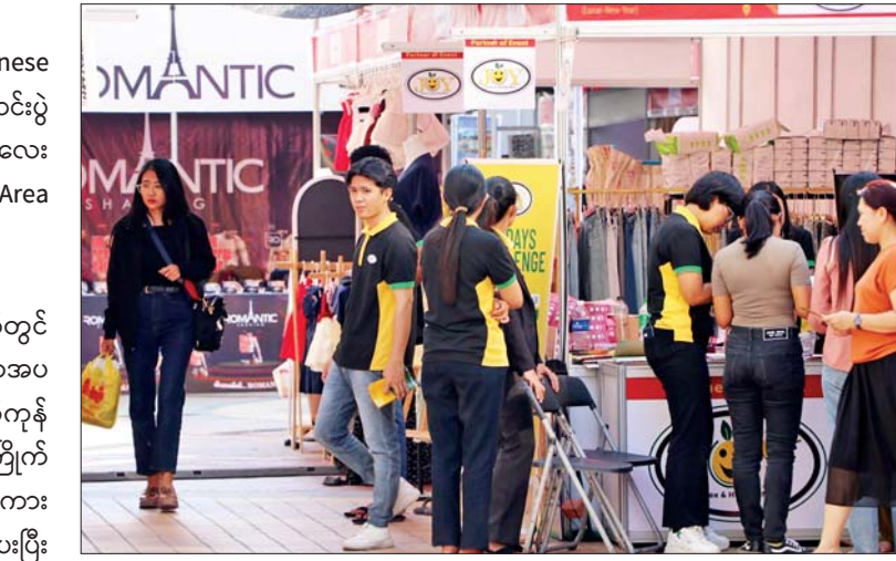
အဆိုပါ ဈေးရောင်းပွဲတော် စီစဉ်သူ ကြီးမှာ ပစ္စည်းအမျိုးအစားအလိုက် အထူး ပရိုမိုးရှင်းတွေလည်းရှိတယ်။ တချို့သော ဆိုင်ခန်းတွေမှာဆိုလည်း ဗလာမပါ

မန္တလေး ဇန်နဝါရီ ၂၄ တရုတ်နှစ်သစ်ကူးအကြို Chinese New Year Mandalar Expo ဈေးရောင်းပွဲ တော်ကို ယနေ့နံနက်ပိုင်းတွင် မန္တလေး မြို့ရှိ မင်္ဂလာမန္တလေး Promotion Area ၌ ကျင်းပသည်။ ခင်းကျင်းရောင်းချ အဆိုပါ ဈေးရောင်းပွဲတော်တွင် အစားအသောက်၊ Fashion၊ အလှအပ ရေးရာ၊ လူသုံးကုန်နှင့်စားသောက်ကုန် မျိုးစုံနှင့်အတူ လူကြီး၊ လူငယ်အကြိုက် ဈေးဆိုင်ခန်းပေါင်းများစွာဖြင့် စည်ကား သိုက်မြိုက်စွာ ခင်းကျင်းရောင်းချပေးပြီး ပစ္စည်းအမျိုးအစားအလိုက် Promotion အစီအစဉ်များကိုလည်း ထည့်သွင်းပေး သည်။