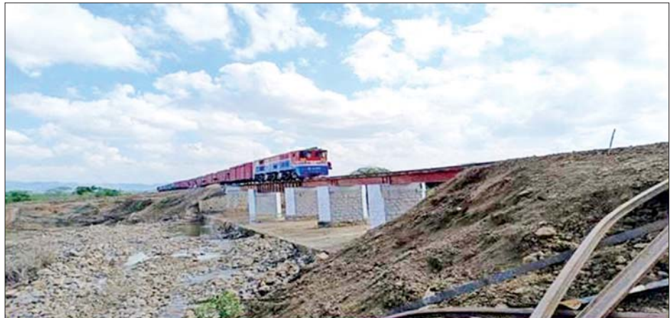
သာစည်-လှိုင်းတက်ကြား တံတားအမှတ်(၂၈)ပြန်လည်ပြုပြင်ဆောင်ရွက်ပြီးစီးမှုကို တွေ့ရစဉ်။

အတွက် လက်မှတ်ခမှာ ရိုးရိုးတန်း ငွေကျပ် ၉၀၀၀ နှုန်းနှင့် အထက်တန်း လက်မှတ်ခမှာ ငွေကျပ် ၁၂၀၀၀ နှုန်း ဖြစ်သည်။ ထို့ပြင် ပြည်တွင်းမှ ခရီးသွားလာမည့် ပြည်သူများ၊ နိုင်ငံခြားသား ခရီးသွားလာသူများအား ရှမ်းပြည်နယ်(တောင်ပိုင်း)အတွင်းရှိ ရေမြေတောတောင် သဘာဝ ရှုခင်းများ၊ ဒေသခံပြည်သူများနှင့် ချစ်ကြည်ရင်းနှီးမှုရရှိစေရန်နှင့် ဒေသန္တရဗဟုသုတများ ရရှိစေရန် ရည်ရွယ်၍ အောင်ပန်း-ကလေး (အသွား-အပြန်) ခရီးစဉ်နှင့် ကလေး-မြင်းဒိုက် (အသွား-အပြန်) ခရီးစဉ်များကို ခရီးသည် ၁၅ ဦး လိုက်ပါစီးနင်းနိုင်သည့် RGC ရထားစင်းလုံးငှား ခရီးစဉ်အဖြစ် ပုဂ္ဂလိက ခရီးသွားလာရေးအဖွဲ့များ၊ မိသားစုများ၊ လေ့လာရေးအဖွဲ့များအနေဖြင့် ခရီးစဉ်တစ်ခုအတွက် (အသွား-အပြန်) ငွေကျပ် ၁၂၀၀၀ နှုန်းဖြင့် စိတ်ပါဝင်စားသည့် မည်သူမဆို ဇန်နဝါရီ ၂၄ ရက် မှစတင်၍ ငှားရမ်းစီးနင်းနိုင်မည်ဖြစ်သည်။ ပို့ဆောင်ရေးနှင့် ဆက်သွယ်ရေးဝန်ကြီးဌာန မြန်မာ့မီးရထားအနေဖြင့် အများပြည်သူလူထုရထားဖြင့် ခရီးသွားလာမှုအဆင်ပြေချောမွေ့ စေရေးအတွက် အဓိက ရထားလမ်းပိုင်းများဖြစ် သည့် ရန်ကုန်-မန္တလေးလမ်းပိုင်း၊ ရန်ကုန်-ပြည်လမ်းပိုင်း၊ ရန်ကုန်-မော်လမြိုင် လမ်းပိုင်းများနှင့် ရန်ကုန်မြို့ပတ်နှင့် ဆင်ခြေဖုန်းလမ်းပိုင်းများတွင်သာမက အခြားလမ်းပိုင်းများဖြစ်သော ပုသိမ်-ဟင်္သာတ-ကြိုခင်း လမ်းပိုင်း၊ ပျဉ်းမနား-တောင်တွင်းကြီး လမ်းပိုင်း၊ ရန်ကုန်-ပြည်-ပုဂံလမ်းပိုင်း၊ မြစ်ကြီးနား-မိုးကောင်းလမ်းပိုင်း၊ လက်ဝဲတန်း-သာရဝေါလမ်းပိုင်း စသည့်လမ်းပိုင်းများတွင် လူစီးရထားခရီးစဉ်များကို စီစဉ် ပြေးဆွဲပေးလျက်ရှိကြောင်း သိရသည်။