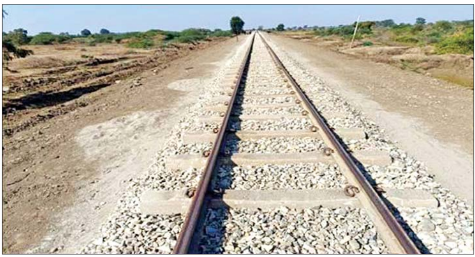
သာစည်-လှိုင်းတက်ကြား ရထားလမ်းတာပေါင် ပြန်လည်ပြုပြင်ဆောင်ရွက်ပြီးစီးမှုကို တွေ့ရစဉ်။

ပြန်လည်ဖွင့်လှစ်ပြီး လူစီးရထားများနှင့် ကုန်ရထားများကို ပုံမှန်ခရီးစဉ်များအဖြစ် ပြန်လည်ပေးဆွဲပေးနိုင်ခဲ့သည်။ ထို့အတူ သာစည်-ရွှေညောင်လမ်းပိုင်းအတွင်း ပျက်စီးမှုများဖြစ်ပေါ်ခဲ့သည့် လမ်းပိုင်းအလိုက် ဦးစားပေး ပြုပြင်နိုင်ခဲ့သဖြင့် ဇန်နဝါရီ ၂၈ ရက်တွင် လမ်းပိုင်းအားလုံး ပြန်လည်ဖွင့်လှစ်ပေးနိုင်မည်ဖြစ်၍ သာစည်-ရွှေညောင်လမ်းပိုင်းတွင် ပြေးဆွဲပေးခဲ့သော အမှတ်(၁၄၁)အဆန် သာစည်-ရွှေညောင် လူစီးရထားကို ဇန်နဝါရီ ၃၁ ရက်(သောကြာနေ့)တွင် လည်းကောင်း၊ အမှတ်(၁၄၂) အစုန်ရထားသည် ရွှေညောင်မှ နံနက် ၇ နာရီ ထွက်ခွာ၍ သာစည်သို့ ညနေ ၆ နာရီတွင် ရောက်ရှိမည်ဖြစ်သည်။ ခရီးစဉ်အစအဆုံး