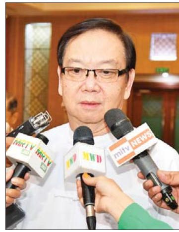
ဒေါက်တာအောင်မြတ်ဦး

မနေ့က ဆွေးနွေးပွဲမှာတော့ ဖွဲ့စည်းပုံအခြေခံဥပဒေ ပြင်ဆင်ဖြည့်စွက်ရေးနဲ့ ပတ်သက်ပြီး ဆွေးနွေးခဲ့ကြပါတယ်။ ဒီနေ့မှာတော့ ဖွဲ့စည်းပုံအခြေခံဥပဒေ ပြင်ဆင်ရေးကို ဆက်လက်ဆွေးနွေးပြီး လက်ရှိနိုင်ငံနဲ့ ပြည်သူတွေ ရင်ဆိုင်နေရတဲ့