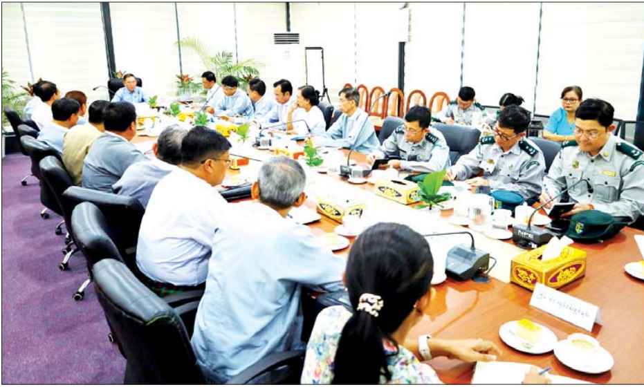
အတွက် သဘာဝတောများမှ နှစ်စဉ်ထုတ်လုပ်နိုင်သော ဝါးလုံးရေ ၃၀ သန်းနှင့် ကြိမ်လုံးရေ ၇၇ သန်း ရှိပြီး ပုဂ္ဂလိကဝါးစိုက်ခင်းများတည်ထောင်မှုကိုလည်း စိစစ်ခွင့်ပြုပေးလျက်ရှိကြောင်း ပြောကြားသည်။ ဆက်လက်၍ ပြည်ထောင်စုဝန်ကြီးက သစ်အခြေခံစက်မှုလုပ်ငန်းများနှင့် ကြိမ်၊ ဝါး အချောထည် လုပ်ငန်းများ ဖွံ့ဖြိုးတိုးတက်စေရေးအတွက် လုပ်ငန်းရှင်များအနေဖြင့် ဈေးကွက်သစ်များ ရှာဖွေ

နေပြည်တော် ဇန်နဝါရီ ၂၄ သယံဇာတနှင့် သဘာဝပတ်ဝန်းကျင် ထိန်းသိမ်းရေးဝန်ကြီးဌာန ပြည်ထောင်စုဝန်ကြီး ဦးခင်မောင်ရီသည် ယနေ့နံနက်ပိုင်းတွင် ရန်ကုန်တိုင်း ဒေသကြီး မင်္ဂလာဒုံမြို့နယ် ပုလဲမြို့သစ်ရှိ ရွှေပင်လယ် ကြိမ်အချောထည်စက်ရုံသို့ရောက်ရှိပြီး ကြိမ်အချော ထည်ထုတ်လုပ်နေမှု လုပ်ငန်းအဆင့်ဆင့်အား လှည့်လည်ကြည့်ရှု စစ်ဆေးသည်။ မွန်းလွဲပိုင်းတွင် ပြည်ထောင်စုဝန်ကြီးသည် ဗိုလ်တထောင်မြို့နယ်ရှိ သစ်တောထွက်ပစ္စည်း ဖက်စပ်ကော်ပိုရေးရှင်းရှင်းတွင် သစ်အခြေခံ ကြိမ်နှင့် ဝါးလုပ်ငန်းရှင်များ၊ ဌာနမှတာဝန်ရှိသူများနှင့်တွေ့ဆုံ၍ မြန်မာနိုင်ငံ၏ သစ်တောသယံဇာတများ ရေရှည် တည်တံ့စေရန် သစ်တောသယံဇာတ ထုတ်ယူသုံးစွဲခြင်းကို အကန့်အသတ်ဖြင့် ထုတ်ယူလျက်ရှိကြောင်း၊ သစ်အခြေခံစက်မှုလုပ်ငန်းများအတွက် လိုအပ်သောကုန်ကြမ်းများကို သဘာဝတောများနှင့် နိုင်ငံပိုင်၊ ပုဂ္ဂလိကပိုင်စိုက်ခင်းများမှ ဖြည့်ဆည်းပေးလျက်ရှိကြောင်း၊ အလားတူ ဝါးနှင့် ကြိမ်လုပ်ငန်းများ