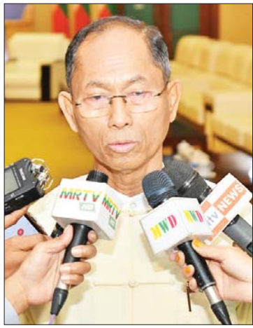
ဦးကိုကိုကြီး

နိုင်ငံတစ်နိုင်ငံမှာ အမြင့်ဆုံးဥပဒေက ဖွဲ့စည်းပုံအခြေခံဥပဒေ ဖြစ်ပါတယ်။ ဒီဥပဒေရဲ့ သဘောတရားကလည်း ကျင့်သုံးရင်းနဲ့ လိုအပ်ချက်တွေအားနည်းချက်တွေရှိရင် တဖြည်းဖြည်းပြင်ဆင်ပြီးတော့ ကောင်းသည်ထက်ကောင်းအောင် ကြိုးစားကြရတာဖြစ်ပါတယ်။ ပြီးခဲ့တဲ့ လွှတ်တော်သက်တမ်း နှစ်ဆက်အတွင်း ၂၀၀၈ ခုနှစ် ဖွဲ့စည်းပုံအခြေခံဥပဒေ ကျင့်သုံးပြီးတဲ့အချိန်မှာ လိုအပ်ချက်တွေ အားနည်းချက်တွေကို တွေ့ရှိလာတာတွေ ရှိပါတယ်။ လက်ရှိနိုင်ငံတော်ရဲ့ အခက်အခဲတွေကို ဖွဲ့စည်းပုံအခြေခံဥပဒေဘောင်အတွင်းကနေ ဖြေရှင်းရမယ်ဆိုရင် မဖြစ်မနေ ပြင်ဆင်သင့်တဲ့အချက်တွေကို ဆွေးနွေးကြပါတယ်။ ဒီအချက်တွေထဲမှာ အမျိုးသားစည်းလုံးညီညွတ်ရေးနှင့် ငြိမ်းချမ်းရေးဖော်ဆောင်မှုညှိနှိုင်းရေးကော်မတီတက်က အဆိုပြုတဲ့အချက်တွေ ရှိသလို ကျွန်တော်တို့ နိုင်ငံရေးပါတီများ အစုအဖွဲ့ကလည်း အဆိုပြုတဲ့အချက်တွေ ရှိပါတယ်။ ဒီအချက်တွေကို နှစ်ဖက်ညှိနှိုင်းပြီးတော့ ဖြစ်ပေါ်လာမယ့် လွှတ်တော်မှာ ပြင်ဆင်တဲ့အခါ ကြိုတင်ညှိနှိုင်းသဘောတူပြီးသားဖြစ်အောင် ကြိုးစားဆွေးနွေးခဲ့ကြတာဖြစ်ပါတယ်။