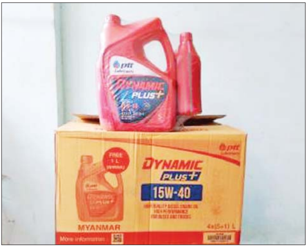
ပဲခူးတိုင်းဒေသကြီး၌ သိမ်းဆည်းရမိမှု။

နေပြည်တော် ဇန်နဝါရီ ၂၄ တရားမဝင် ကုန်သွယ်မှု တိုက်ဖျက်ရေးဦးဆောင်ကော်မတီ ၏ကြီးကြပ်ကွပ်ကဲမှုဖြင့် တရားမဝင် ကုန်သွယ်မှုများကို ဥပဒေနှင့်အညီ ထိရောက်စွာ တားဆီးအရေးယူ နိုင်ရေး ဆောင်ရွက်လျက်ရှိရာ ဇန်နဝါရီ ၂၂ ရက်တွင် နေပြည်တော် တရားမဝင်ကုန်သွယ်မှုတိုက်ဖျက် ရေးအထူးအဖွဲ့၏ စီမံခန့်ခွဲမှုဖြင့် တာဝန်ကျ ပူးပေါင်းအဖွဲ့များက စစ်ဆေးမှုများ ဆောင်ရွက်ခဲ့ရာ ဥတ္တရခရိုင် ဥတ္တရသီရိမြို့နယ် အတွင်း၌ တရားမဝင် အခြားသစ် ၁ ဒသမ ၉၈၈ တန်(ခန့်)မှန်းတန်ဖိုး ငွေကျပ် ၁၁၁၁၇၆)ကို သိမ်းဆည်း ရမိခဲ့ပြီး သစ်တောဥပဒေနှင့်အညီ အရေးယူဆောင်ရွက်လျက်ရှိသည်။ ထို့အတူဧရာဝတီတိုင်းဒေသကြီး တရားမဝင်ကုန်သွယ်မှုတိုက်ဖျက် ရေးအထူးအဖွဲ့၏ စီမံခန့်ခွဲမှုဖြင့် တာဝန်ကျ ပူးပေါင်းအဖွဲ့များက စစ်ဆေးမှုများ ဆောင်ရွက်ခဲ့ရာ ကျိုပျော်ခရိုင်၊ ပုသိမ်ခရိုင်နှင့် မြန်အောင်ခရိုင်တို့ အတွင်း၌ တရားမဝင် ကျွန်းသစ် သုည ၃၃၀၀ တန်၊ သစ်မာ ၅ ဒသမ ၂၈၉ တန်၊ အခြားသစ် ၂၂ ဒသမ ၉၃၈ တန်(စုစုပေါင်း ခန့်မှန်းတန်ဖိုး ငွေကျပ် ၅၅၅၁၇၇)ကို သိမ်းဆည်း ရမိခဲ့ပြီး သစ်တောဥပဒေနှင့်အညီ အရေးယူဆောင်ရွက်လျက်ရှိသည်။ ထို့အပြင် ဇန်နဝါရီ ၂၃ ရက်တွင် ရန်ကုန်တိုင်းဒေသကြီး တရားမဝင် ကုန်သွယ်မှုတိုက်ဖျက်ရေး အထူး အဖွဲ့၏ စီမံခန့်ခွဲမှုဖြင့် တာဝန်ကျ ပူးပေါင်းအဖွဲ့များက စစ်ဆေးမှု များဆောင်ရွက်ခဲ့ရာ လှည်းကူး မြို့နယ်နှင့် မင်္ဂလာဒုံမြို့နယ်တို့၌ တရားမဝင် ကျွန်းသစ် ၂ ဒသမ ၆၈၈ တန်၊ အခြားသစ် သုည ၃၃၀၀ တန်(စုစုပေါင်း ခန့်မှန်းတန်ဖိုး ငွေကျပ် ၂၃၆၈၄၄)ကို သိမ်းဆည်း ရမိခဲ့ပြီး သစ်တောဥပဒေနှင့်အညီ အရေးယူ ဆောင်ရွက်လျက်ရှိသည်။