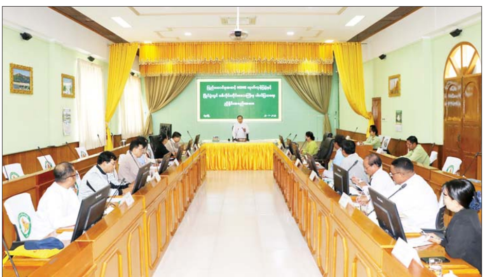
ဆက်လက်ပြီး တိုင်းဒေသကြီးအစိုးရအဖွဲ့ဝင် များက ပြည်ထောင်စုအဆင့် MSME ထုတ်ကုန်ပြပွဲ နှင့်ပြိုင်ပွဲတွင် စစ်ကိုင်းတိုင်းဒေသကြီးမှ ပါဝင်ပြသ သွားမည့်အခြေအနေများနှင့်ပတ်သက်၍ ဖြည့်စွက် ဆွေးနွေးတင်ပြကြရာ တိုင်းဒေသကြီးဝန်ကြီးချုပ်က ဆွေးနွေးတင်ပြချက်များအပေါ် လိုအပ်သည်များကို တာဝန်ရှိသူများနှင့် ဖြည့်ဆည်းပေါင်းစပ်ဆောင်ရွက် ပေးကာ နိဂုံးချုပ်စကား ပြောကြားခဲ့ကြောင်း သိရ သည်။ တိုင်းဒေသကြီး(ပြန်/ဆက်)

ရယူကာ ယခုနှစ်ပြပွဲနှင့် ပြိုင်ပွဲများတွင်လည်း အောင်မြင်အောင် ပေါင်းစပ်ဆောင်ရွက်သွားကြရန် လိုအပ်ကြောင်း၊ မိမိတို့တိုင်းဒေသကြီးအစိုးရ အဖွဲ့အနေဖြင့် လိုအပ်သည်များကို ပံ့ပိုးကူညီ ဆောင်ရွက်ပေးသွားမည်ဖြစ်ကြောင်း ပြောကြား သည်။ ယင်းနောက် တိုင်းဒေသကြီးအဆင့် ဌာနဆိုင်ရာ များက ပြည်ထောင်စုအဆင့် MSME ထုတ်ကုန်ပြပွဲနှင့် ပြိုင်ပွဲတွင် စစ်ကိုင်းတိုင်းဒေသကြီးမှ ပါဝင်ပြသသွား မည့် တိုင်းဒေသကြီးအတွင်းမှ ဒေသအလိုက်ထွက်ရှိ သည့် ထုတ်ကုန်ပစ္စည်းများ၊ တိုင်းရင်းသားရိုးရာအစား အစာများ၊ ငွေထည်/ကြေးထည်နှင့် အဝတ်အထည် များ ပြသရောင်းချသွားမည့် အခြေအနေများနှင့် ပတ်သက်၍ မိမိတို့တာဝန်ယူဆောင်ရွက်သွားမည့် လုပ်ငန်းများကို ရှင်းလင်းတင်ပြကြသည်။