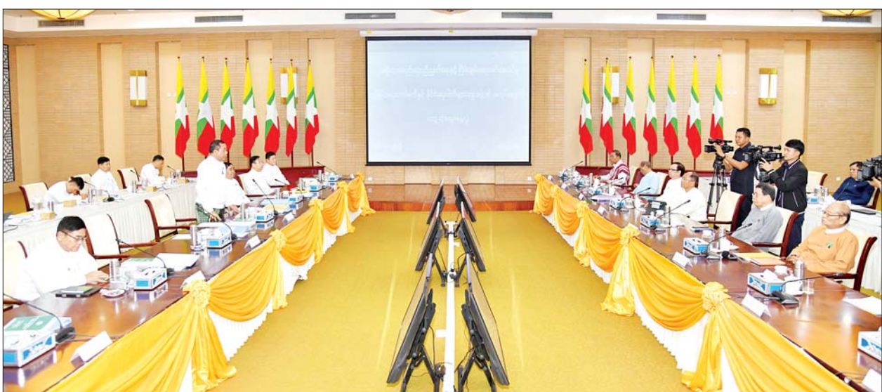
အမျိုးသားစည်းလုံးညီညွတ်ရေးနှင့် ငြိမ်းချမ်းရေးဖော်ဆောင်မှု ညှိနှိုင်းရေးကော်မတီနှင့် နိုင်ငံရေးပါတီများအစုအဖွဲ့၏ အလုပ်အဖွဲ့တို့ ဒုတိယနေ့ တွေ့ဆုံဆွေးနွေးပွဲ။

တက်ရောက် တွေ့ဆုံ ဆွေးနွေးပွဲတွင် တက်ရောက် လာကြသူများက ပထမနေ့ဆွေးနွေးပွဲ၌ မပြီးပြတ် ဝန်ကြီး၊ အမျိုးသားစည်းလုံး ညီညွတ်ရေးနှင့် ငြိမ်းချမ်းရေး ဖော်ဆောင်မှုညှိနှိုင်းရေးကော်မတီ ဥက္ကဋ္ဌ ဒုတိယဗိုလ်ချုပ်ကြီး ထွန်းထွန်းနောင်နှင့် ညှိနှိုင်းရေး ကော်မတီဝင်များ၊ နိုင်ငံရေးပါတီ များအစုအဖွဲ့၏ အလုပ်အဖွဲ့ ခေါင်းဆောင် ပြည်သူ့ပါတီဥက္ကဋ္ဌ ဦးကိုကိုကြီးနှင့် အလုပ်အဖွဲ့ ကိုယ်စားလှယ်များ တက်ရောက် ကြသည်။