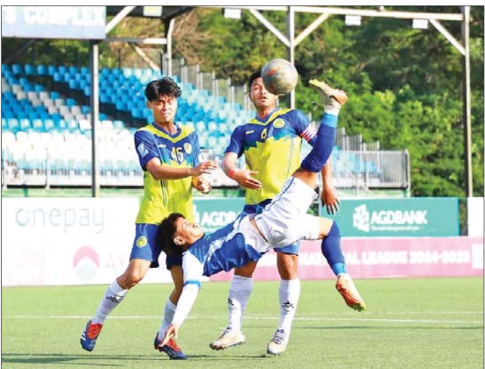
မဟာယူနိုက်တက်အသင်းနှင့် အား/ကာသိပ္ပံအသင်းတို့ ယှဉ်ပြိုင်ကစားကြစဉ်။