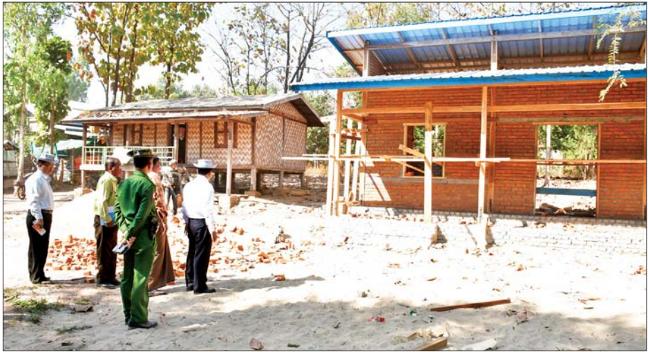
ငွေလုံးငွေရင်းရန်ပုံငွေဖြင့် ကွန်ကရစ်လမ်းဖောက်လုပ်ထားမှုကို ကြည့်ရှုစစ်ဆေးပြီး သားခိုတောင် မဟာအတုလ လောကရန်အောင် ဆုတောင်းပြည့်စေတီမြတ်ကြီးအား ဖူးမြော်ကြည့်ညိကြာ အလှူငွေများ လှူဒါန်းသည်။ ထို့နောက် တပ်ကုန်းမြို့နယ် ရွေးစု(မြောက်) ကျေးရွာအနီးတွင် ရေကြီးနစ်မြုပ်ခဲ့သည့် လယ်ယာမြေ ၁၅၆ ဒဿမ ၆၅ ဧကကို နေပြည်တော်စက်မှုလယ်ယာဦးစီးဌာနက စက်ယန္တရားများဖြင့် သဲနုန်းဖယ်ရှားခြင်းနှင့် မြေပြုပြင်ခြင်းလုပ်ငန်းများ ဆောင်ရွက်ပေးနေမှုကို ကြည့်ရှုစစ်ဆေးပြီး လိုအပ်သည်များကို ပေါင်းစပ်ဆောင်ရွက်ပေးခဲ့ကြောင်း သိရသည်။ သတင်းစဉ်

ရေပေးနေသည့် သောက်ရေတွင်းအခြေအနေကို လည်းကောင်း၊ သဘာဝဘေးကြောင့် ပွဲစားဆည်တစ်ကျိုးပဲ့မှုအခြေအနေကို လည်းကောင်း၊ တပ်ကုန်းမြို့နယ် သစ်ဆိမ့်ပင်ကျေးရွာတွင် စာကြည့်တိုက် အဆောက်အအုံသစ် တည်ဆောက်နေမှုကိုလည်းကောင်း၊ လှည့်လည်ကြည့်ရှုစစ်ဆေးပြီး နေပြည်တော်ကောင်စီဥက္ကဋ္ဌက လိုအပ်သည်များ မှာကြားကာ စာကြည့်တိုက်အတွက် အလှူငွေကျပ် ၁၀ သိန်းကို ပေးအပ်လှူဒါန်းသည်။ မွန်းလွဲပိုင်းတွင် အုန်းပင်ကျေးရွာအနီး ခရီးသွားနေရာအဖြစ်ဖော်ဆောင်ထားသည့် ရှေးဟောင်းသမိုင်းဝင် သားခိုတောင် မဟာအတုလလောကရန်အောင် ဆုတောင်းပြည့်စေတီမြတ်ကြီးအား ပြည်သူများ အဆင်ပြေစွာသွားလာဖူးမြော်နိုင်ရေးအတွက် ၂၀၂၃-၂၀၂၄ ဘဏ္ဍာနှစ် နေပြည်တော်