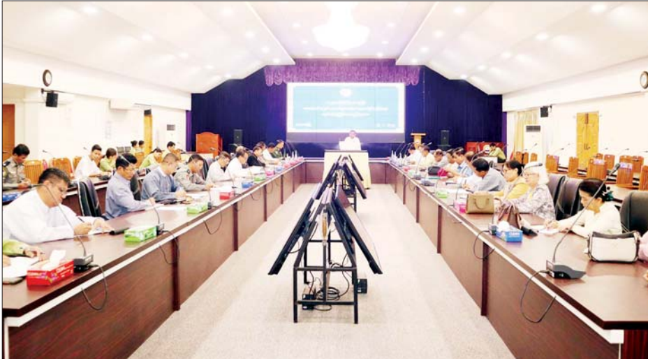
အတွင်းရှိ စာဖြေဌာနများမှ ဖြေဆို သာမဏေ၊ သီလရှင်များအား အောင်မြင်တော်မူကြသည့် ရဟန်း/ ချီးကျူးဂုဏ်ပြု ပူဇော်နိုင်ရေး အနား ကျင်းပနိုင်ရေးအတွက် တိုင်းဒေသကြီး(ပြန်/ဆက်)