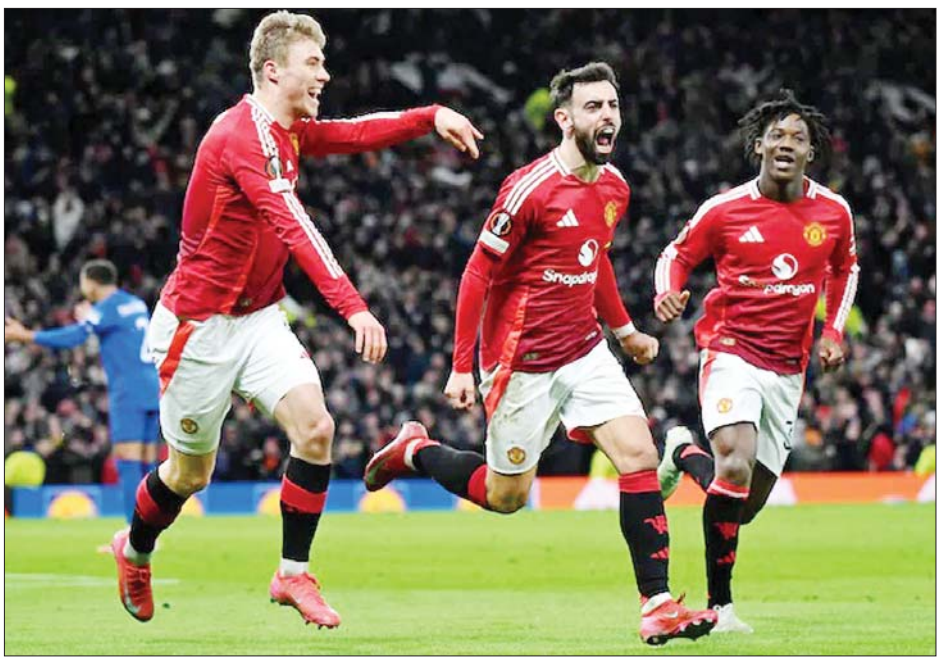
ရိန်းဂျားစ်အသင်းကို အနိုင်ရရှိပြီး မန်ယူကစားသမားများ အောင်ပွဲခံနေစဉ်။