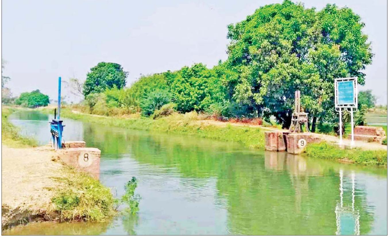
ပွင့်ဖြူမြို့နယ်အတွင်းရှိ သီးနှံစိုက်ဧကများသို့ မဲဇလီရေလွှဲဆည်မှ ရေပေးဝေနေမှုကို တွေ့ရစဉ်။