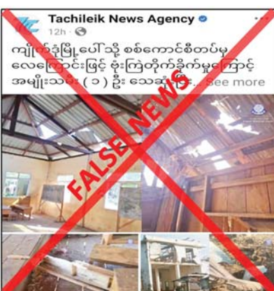
လုပ်ကြံရေးသား ဖြန့်ဝေခြင်းဖြစ်ကြောင်း သိရ သည်။

အနေဖြင့် စစ်ရေးပစ်မှတ်မဟုတ်သည့် အရပ်ဘက်ပစ်မှတ်များကို ပစ်ခတ်တိုက်ခိုက် ခြင်းမရှိကြောင်း၊ အကြမ်းဖက်သမားများ အနေဖြင့် ၎င်းတို့အား ထောက်ခံအားပေးခြင်း မရှိသည့် နယ်မြေများအား ၎င်းတို့အပေါ် အကြောက်တရားလွှမ်းမိုးစေရန် လက်နက်ကြီး များဖြင့် ပစ်ခတ်ခြင်း၊ ဒရုန်းများဖြင့် ပုံးကြဲခြင်း များ ဆောင်ရွက်လျက်ရှိကြောင်း၊ အကြမ်းဖက် အားပေး ပြည်ပျက်မီဒီယာများက အကြမ်းဖက် သမားများ၏ အကြမ်းဖက်လုပ်ရပ်များကို ဖုံးကွယ်ရန်နှင့် လုံခြုံရေးတပ်ဖွဲ့ဝင်များအပေါ် ပြည်သူ့လူထုက အထင်အမြင်လွဲမှားစေရန် လူမှုကွန်ရက်မှတစ်ဆင့် သတင်းအမှားများကို