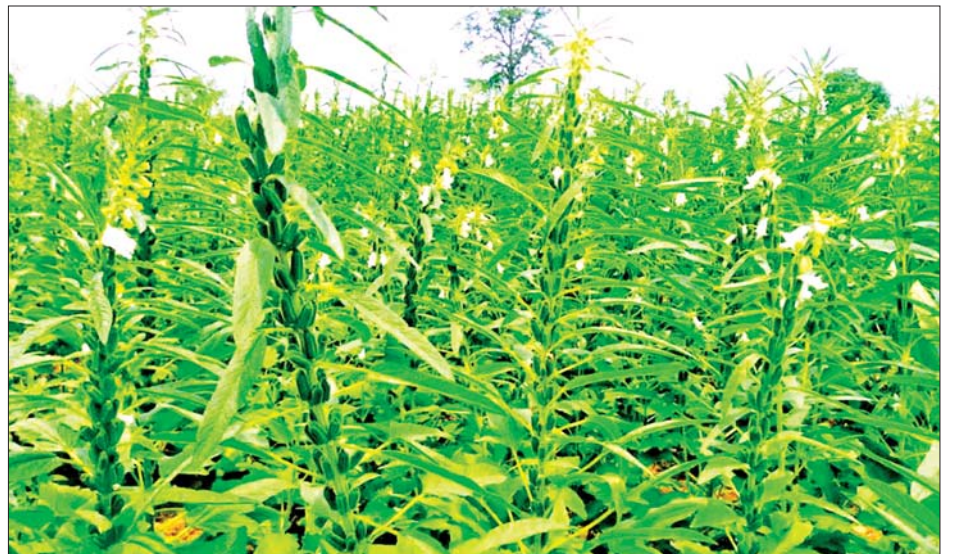
ပွင့်ဖြူမြို့နယ်၌ နှမ်းစိုက်ခင်း အောင်မြင်ဖြစ်ထွန်းမှုကို တွေ့ရစဉ်။