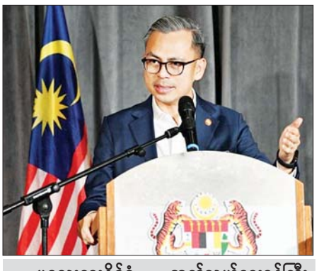
မလေးရှားနိုင်ငံ ဆက်သွယ်ရေးဝန်ကြီး Fahmi Fadzil ဆိုရှယ်မီဒီယာပလက်ဖောင်းများအပါအဝင် နည်းပညာကုမ္ပဏီကြီးများအနေဖြင့် မလေးရှားနိုင်ငံ ဥပဒေများကို လိုက်နာရန်လိုကြောင်း ပြောကြားစဉ်။

၂၁ ရာစု၏ ထုတ်ကုန်တစ်ခုဖြစ်သည့် ဉာဏ်ရည်တု(AI)နည်းပညာများနှင့် ပေါင်းစပ်ခဲ့ပြီး နောက်တွင် ဆိုရှယ်မီဒီယာပလက်ဖောင်းများ၏ ကောင်းကျိုးနှင့် ဆိုးကျိုးသက်ရောက်မှုများသည် ပိုမိုကြီးမားပြင်းထန်လာခဲ့သည်။ Deep Fake နည်းပညာကို အလွယ်တကူ လက်လှမ်းမီအသုံးပြုလာနိုင်မှုများကြောင့် သတင်းတု၊ သတင်းမှားနှင့် လုပ်ကြံဖန်တီးထားသည့် သတင်းများဖြန့်ဝေမှု၊ အမှန်းစကားဖြန့်ဝေမှုများမှတစ်ဆင့် လူ့အဖွဲ့အစည်းအတွင်း မလိုလားအပ်သည့် ထိခိုက်နစ်နာစေမှုများ (Negative Externalities) ပိုတိုးလာစေ