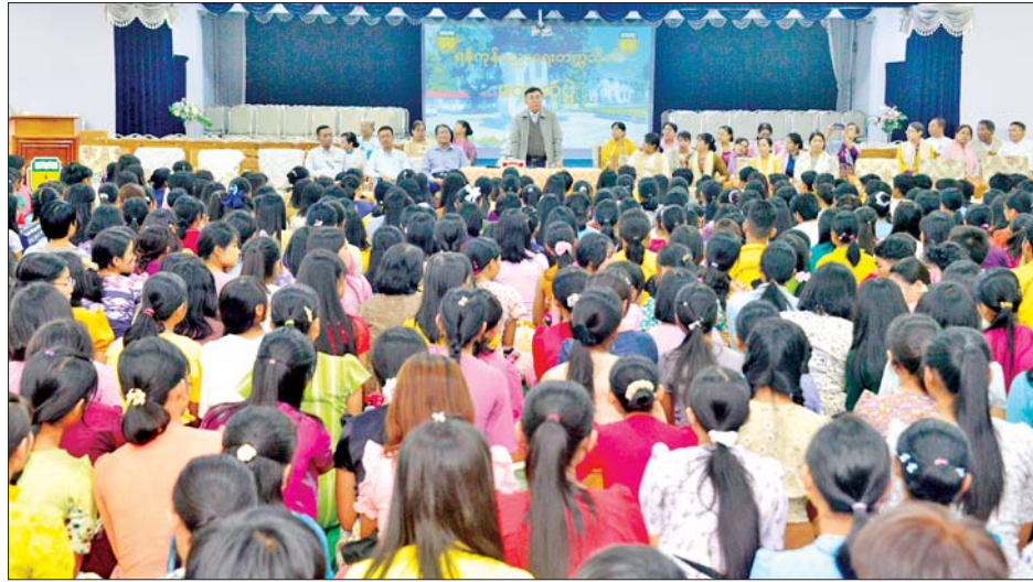
အား အရည်အချင်းရှိသူများဖြစ်လာစေရန် လေ့ကျင့် သင်ကြားပေးရန်လိုအပ်ကြောင်းပြောကြားပြီး ဆရာ သင်တန်းများ၏ တင်ပြချက်များအပေါ် လိုအပ်သည်များ ကို ညှိနှိုင်းဖြည့်ဆည်းဆောင်ရွက်ပေးသည်။ မွန်လွဲပိုင်းတွင် နိုင်ငံခြားဘာသာတက္ကသိုလ် (ရန်ကုန်)စာသင်ခန်း၌ ကျောင်းသား ကျောင်းသူများ သတင်းစဉ်

လေ့ကျင့်သင်ကြားပေးရန်လို ထို့နောက် ဒဂုံတက္ကသိုလ် ၌ နည်းသင်တန်းများ ပါမောက္ခချုပ်၊ ဒုတိယပါမောက္ခချုပ်များ၊ ပါမောက္ခ/ ဌာနမှူးများ၊ တွဲဖက်ပါမောက္ခများ၊ တာဝန်ရှိသူများ နှင့်တွေ့ဆုံပြီး ပြည်ထောင်စုဝန်ကြီးက ဘာသာရပ် ဆိုင်ရာ ဆရာကြီး ဆရာမကြီးများအနေဖြင့် ဘာသာ ရပ်တစ်ခုချင်းစီကို လွှဲပြောင်းတာဝန်ယူမည့်သူများ