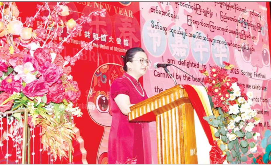
မြန်မာနိုင်ငံဆိုင်ရာ တရုတ်နိုင်ငံသံအမတ်ကြီး H.E. Ma Jia တရုတ်နှစ်သစ်ကူးအထိမ်းအမှတ် နှုတ်ခွန်းဆက်စကားပြောကြားစဉ်။

ရေမြေတောတောင်များ ထိစပ်လျက်ရှိပြီး နှစ်နိုင်ငံပြည်သူများအကြား ရှေးပဝေသဏီကတည်း က ချစ်ကြည်ရင်းနှီးသည့်ဆက်ဆံရေးထားရှိခဲ့ပါ ကြောင်း၊ နှစ်နိုင်ငံ သံတမန်ဆက်ဆံရေး ခေတ်သစ်