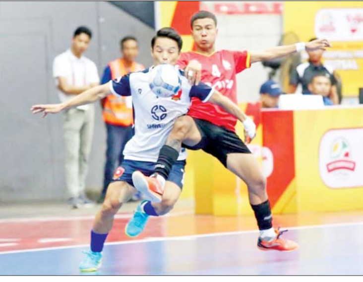
MH Dream Team အသင်းနှင့် SGF အသင်းတို့ ယှဉ်ပြိုင်ကစားကြစဉ်။

ရန်ကုန် ဇန်နဝါရီ ၂၃ ၂၀၂၄-၂၀၂၅ ရာသီ MFF ဖူဆယ် လိဂ်-၁ ပြိုင်ပွဲ ပွဲစဉ်(၆)ကို ဇန်နဝါရီ ၂၃ ရက်ကရန်ကုန်မြို့ သုဝဏ္ဏဘောလုံးကွင်းရှိ MFF ဖူဆယ်အားကစားရုံ၌ ကျင်းပရာ ဇယားထိပ်ပိုင်းမှ အသင်းအများစု အနိုင် ရရှိသည်။ ပွဲစဉ်(၆)တွင် MH Dream Team အသင်းက SGF အသင်းကို ၁၀ ဂိုး-သုံးဂိုး၊ MIU အသင်းက ဖူဆယ်ချစ်သူအသင်းကို သုံးဂိုး-ဂိုးမရှိ၊ Generations အသင်းက Winner Soccer အသင်းကို သုံးဂိုး-တစ်ဂိုး၊ VUC အသင်းက YCDC Margga အသင်းကို ငါးဂိုး-သုံးဂိုး၊ YRG အသင်းက M2K အသင်း ကို လေးဂိုး-နှစ်ဂိုးဖြင့် အနိုင်ရခဲ့သည်။ ယခုတစ်ပတ်တွင် ထိပ်ဆုံးမှ MIU အသင်း၊ စာမျက်နှာ ၂၁ ကော်လံ ၁ သို့ ❖