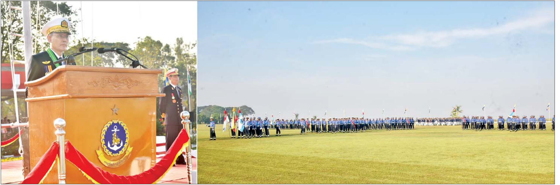
နိုင်ငံတော်စီမံအုပ်ချုပ်ရေးကောင်စီဥက္ကဋ္ဌ တပ်မတော်ကာကွယ်ရေးဦးစီးချုပ်ကိုယ်စား ကာကွယ်ရေးဦးစီးချုပ်(ရေ) ဗိုလ်ချုပ်ကြီး ထိန်ဝင်း တပ်မတော်(ရေ)အရာရှိငယ်(စီမံခန့်ခွဲရေး)သင်တန်းအမှတ်စဉ်(၈၄) နှင့် တပ်မတော်(ရေ)အရာရှိငယ်(အင်ဂျင်နီယာ) သင်တန်းအမှတ်စဉ်(၅၈) သင်တန်းဆင်းဂုဏ်ပြုစစ်ရေးပြအခမ်းအနားတွင် မိန့်ခွန်းပြောကြားစဉ်။