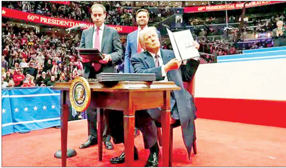
မပြုသည့်အမိန့်တစ်ရပ်ကို သမ္မတ ထရမ်က ဇန်နဝါရီ ၂၀ ရက်က လက်မှတ်ရေးထိုးခဲ့သည်။ သမ္မတထရမ်သည် အမေရိကန်ဖွဲ့စည်းပုံအခြေခံ

သို့သော် ၎င်းတို့၏မိခင်များသည် နိုင်ငံအတွင်း တရားမဝင် သို့မဟုတ် ခေတ္တနေထိုင်သူများဖြစ်ပါက ၎င်းတို့၏ ဖခင်များသည် အမေရိကန်နိုင်ငံသား သို့မဟုတ် တရားဝင်အမြဲတမ်းနေထိုင်သူများ မဟုတ် ပါက အမေရိကန်နိုင်ငံ၌ မွေးဖွားသော ကလေးများ အား အလိုအလျောက် နိုင်ငံသားအဖြစ် ခံယူခွင့်