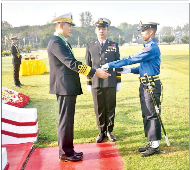
ကာကွယ်ရေးဦးစီးချုပ်(ရေ) ဗိုလ်ချုပ်ကြီးထိန်ဝင်း တပ်မတော် (ရေ) အရာရှိငယ်(အင်ဂျင်နီယာ)သင်တန်း အမှတ်စဉ်(၅၈)မှ ရေကြောင်းအင်ဂျင်နီယာပညာ စာပေထူးချွန်ဆုရ ရေ ၅၇၇၀ ဗိုလ်ဘုန်းမြင့်ကျော်အား ထူးချွန်ဆုပေးအပ်ချီးမြှင့်စဉ်။

ယာဉ်များက ရန်ကုန်မြစ်အတွင်းမှ ဆက်လက်၍ ကာကွယ်ရေး ဦးစီးချုပ်(ရေ)က တပ်မတော်(ရေ) အရာရှိငယ်(စီမံခန့်ခွဲရေး)သင်တန်း အမှတ်စဉ်(၈၄)မှ အကောင်းဆုံး