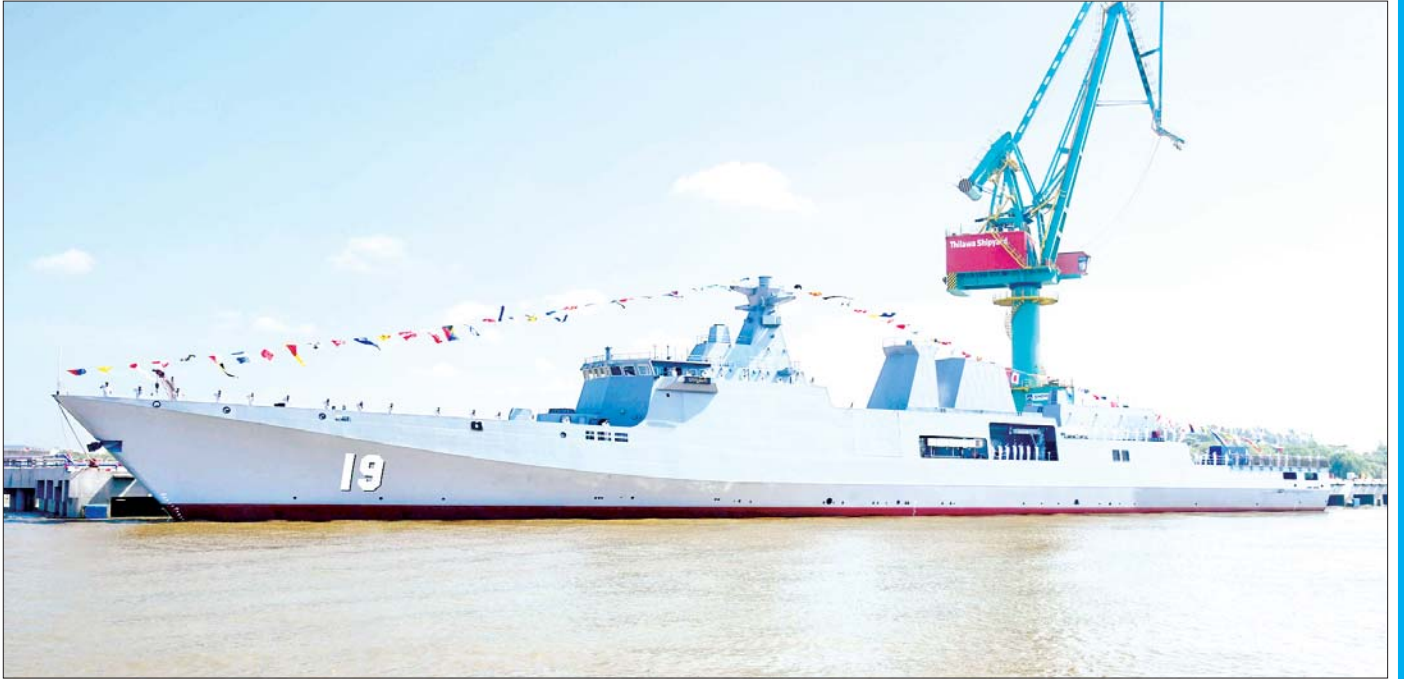
၂၄-၁၂-၂၀၂၄ ရက်နေ့က တပ်မတော်(ရေ)၏ (၇၇)နှစ်မြောက် နှစ်ပတ်လည်နေ့အခမ်းအနားတွင် အမည်ပေးခြင်းနှင့် ရေချခြင်းမင်္ဂလာပြုလုပ်ခဲ့သည့် တပ်မတော်(ရေ)က တည်ဆောက်ပြီးစီးခဲ့သော ၁၃၅ မီတာ ဖရိဂိတ်စစ်ရေယာဉ်ကြီး “သာလွန်မင်း”ကို တွေ့ရစဉ်။

တပ်မတော်သည် နိုင်ငံတော်၏အစိတ်အပိုင်း တစ်ခုဖြစ်သကဲ့သို့ တပ်မတော်(ရေ)သည်လည်း တပ်မတော်၏ အစိတ်အပိုင်းတစ်ခုဖြစ်သည်။ တပ်မတော်ဟုဆိုရာ၌ ကြည်းတပ်၊ ရေတပ်၊ လေတပ်တို့ပါဝင်သော နိုင်ငံတော်ကာကွယ်ရေး တပ်ပေါင်းစုကိုဆိုခြင်းဖြစ်သည်။ ကြည်း၊ ရေ လေတပ်များသည် နိုင်ငံတော်အတွက် သုံးနားညီ ကြံပုံမာညီညွတ်စွာ ရပ်တည်လျက်ရှိသည်။ တပ်မတော်တစ်ရပ်၏ စွမ်းအားဆိုသည်မှာ လူ၊ လက်နက်၊ နည်းပညာတို့စုံလင်စွာရှိပြီး အသုံးပြု နိုင်ခြင်းဖြစ်သည်။ ခေတ်မီတန်ဖိုးကြီးသော စစ်လက်နက်ပစ္စည်းများကို အသုံးပြုစေကာမူ ကျွမ်းကျင်ပိုင်နိုင်စွာ အသုံးမပြုတတ်ပါက အကျိုး ရှိမည်မဟုတ်ပေ။