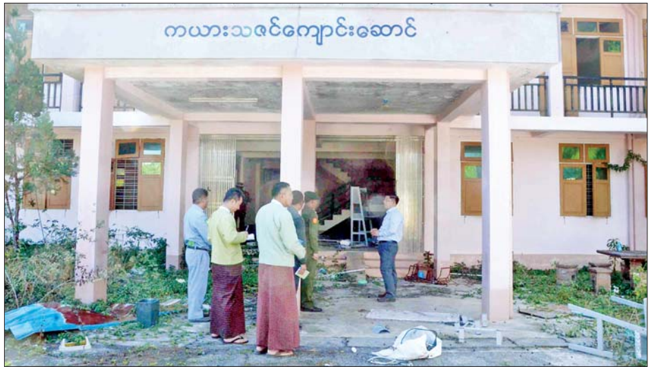
ဓမ္မာရုံအသစ် အပြီးသတ်လုပ်ငန်းများ ဆောင်ရွက် အား လိုအပ်သည်များ ပေါင်းစပ်ညှိနှိုင်းပေးခဲ့ကြောင်း နေမှုများကို လှည့်လည်ကြည့်ရှုပြီး တာဝန်ရှိသူများ သိရသည်။ ပြည်နယ်(ပြန်/ဆက်)

ဆက်လက်၍ သီရိမင်္ဂလာတောင်ကွဲစေတီတော် မြတ်နှင့် အရံစေတီတော်များအား လုံးတော်ပြည့် ရွှေသင်္ကန်းကပ်လှူပူဇော်မှု၊ ဘက်စုံပြုပြင်မွမ်းမံခြင်း လုပ်ငန်းများ ဆောင်ရွက်နေမှုနှင့် တောင်ကွဲစေတီတော်