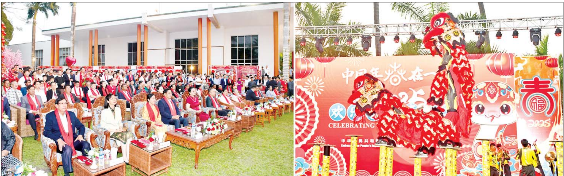
နိုင်ငံတော်စီမံအုပ်ချုပ်ရေးကောင်စီအဖွဲ့ဝင် ဒုတိယဝန်ကြီးချုပ်နှင့် ပြည်ထောင်စုဝန်ကြီး ဗိုလ်ချုပ်ကြီးတင်အောင်စန်းနှင့် ဇနီး၊ မြန်မာနိုင်ငံဆိုင်ရာ တရုတ်နိုင်ငံသံအမတ်ကြီး H.E. Ma Jia နှင့် တက်ရောက် လာကြသည့် ဧည့်သည်တော်များ တရုတ်ရိုးရာယဉ်ကျေးမှုတူရိယာဖျော်ဖြေမှုများ၊ အကအလှများဖြင့် ဖျော်ဖြေတင်ဆက်မှုကို ကြည့်ရှုအားပေးကြစဉ်။

( ၃-၉-၂၀၂၄ ရက်နေ့တွင် နိုင်ငံတော်စီမံအုပ်ချုပ်ရေးကောင်စီဥက္ကဋ္ဌ နိုင်ငံတော် ဝန်ကြီးချုပ် ဗိုလ်ချုပ်မှူးကြီးမင်းအောင်လှိုင် ရှမ်းပြည်နယ်အစိုးရအဖွဲ့ဝင်များ၊ ပြည်နယ် နှင့် ခရိုင်အဆင့် ဌာနဆိုင်ရာတာဝန်ရှိသူများအား ပြောကြားသည့်အမှာစကားမှ ကောက်နုတ်ချက် )