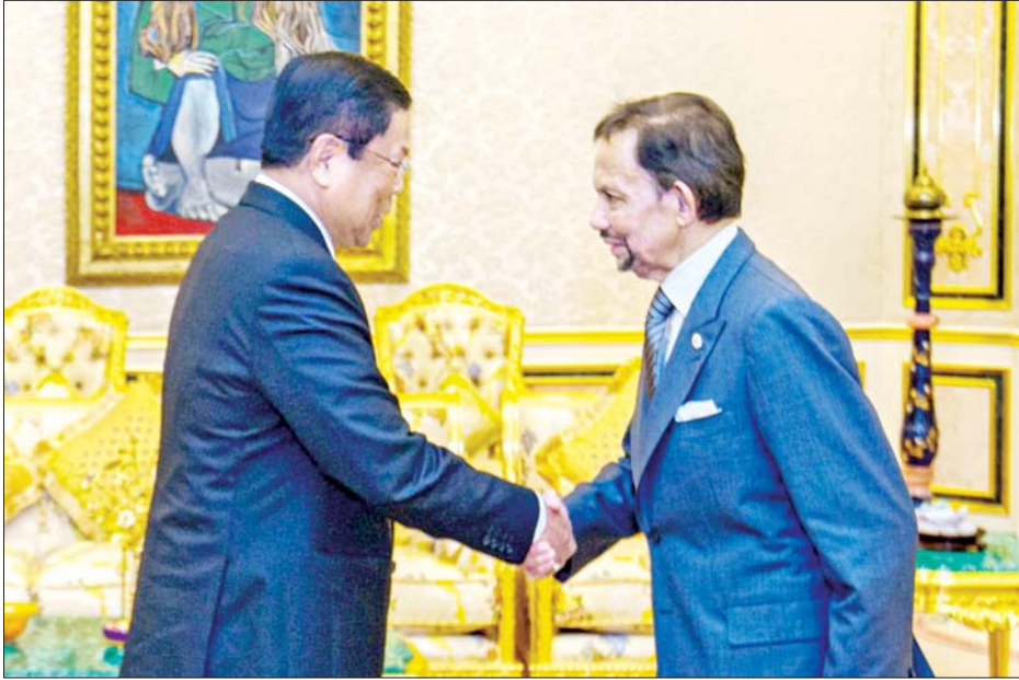
ဒုတိယဝန်ကြီးချုပ်နှင့် ပြည်ထောင်စုဝန်ကြီး ဦးသန်းဆွေ ဘရူနိုင်းဒါရူဆလမ်နိုင်ငံ ဘရင်မင်းမြတ်ဆူလ်တန် ဟာဂျီ ဟာဆာနယ်လ် ဘိုလ်ကီးယား မူအစ်ဇာဒင် ဝါဒူလာ အား ဂါရဝပြုတွေ့ဆုံစဉ်။

နေပြည်တော် ဇန်နဝါရီ ၂၃ ဘရူနိုင်းဒါရူဆလမ်နိုင်ငံ နိုင်ငံခြားရေးဝန်ကြီး (၂) ဒါတို ဆရီဆတီယာ ဟာဂျီ အယ်ရီဝမ် ဘင်ပိဟင် ယူဆွတ်၏ ဖိတ်ကြားချက်အရ ဒုတိယဝန်ကြီးချုပ်နှင့် နိုင်ငံခြားရေးဝန်ကြီးဌာန ပြည်ထောင်စုဝန်ကြီး ဦးသန်းဆွေသည် ဘရူနိုင်းဒါရူဆလမ်နိုင်ငံ ဘန်ဒါဆရီဘီဂါဝန်မြို့သို့ ဇန်နဝါရီ ၂၂ ရက်မှ ၂၃ ရက်ထိ တရားဝင်ခရီးစဉ် သွားရောက်ခဲ့သည်။