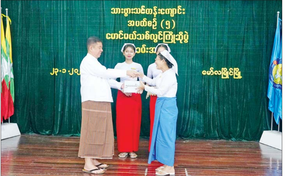
များအား ရင်းရင်းနှီးနှီးလိုက်လံ သူနာပြု သားဖွားသင်တန်းကို သင်ကြားပို့ချမည် ဖြစ်ကြောင်း နှုတ်ဆိုခဲ့သည်။ အဆိုပါအပတ်စဉ်(၅)ပထမနှစ် သင်တန်းသား သင်တန်းသူ ၂၃ ဦး၊ သိရသည်။ သင်တန်းကာလ သုံးနှစ်ကြာ စည်သူ(ပြန်/ဆက်)

ပေးလျက်ရှိပြီး ကျန်းမာရေး ကျန်းမာရေး အတွက် လူ့စွမ်းအားအရင်းအမြစ် များ စဉ်ဆက်မပြတ် မွေးထုတ်ပေး ကျောင်း မော်လမြိုင်မှ သူနာပြု သင်တန်းကျောင်း သင်တန်းသား သင်တန်းသူများ အနေဖြင့်လည်း သူနာပြုများ လိုက်နာရမည့် ကျင့်ဝတ် စည်းကမ်းများနှင့်အညီ မိမိနှင့်လျော်ညီသော တာဝန် ဝတ္တရားများကို ထမ်းဆောင်ကြ ရန်နှင့် ပြည်သူ့လူထုမှ အားကိုး ယုံကြည်ရသော မွန်မြတ်သော လုပ်ငန်းအဖြစ် ရေရှည်တည်တံ့ ခိုင်မြဲစေရေးအတွက် ကြိုးစား သင်ယူလေ့လာ ဆည်းပူးသွားကြ ရန် တိုက်တွန်းလိုကြောင်း ပြော ကာ သင်တန်းသား သင်တန်းသူ