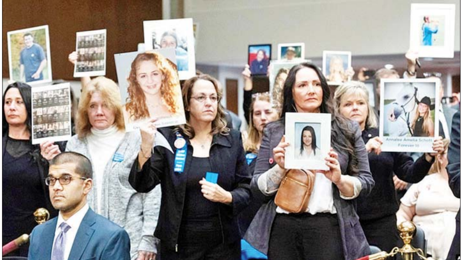
၃၁-၁-၂၀၂၄ ရက်နေ့က ဝါရှင်တန်ရှိ Capitol Hill တွင် အထက်လွှတ်တော် တရားစီရင်ရေးကော်မတီ၏ အွန်လိုင်း ကလေးဘေးကင်းရေးကော်မတီ ကြားနာပွဲအတွင်း တက်ရောက်သူများက ဆိုရှယ်မီဒီယာကြောင့် ထိခိုက်ခဲ့ရသူများ၏ ဓာတ်ပုံများကို ကိုင်ဆောင်ထားစဉ်။

ဆိုရှယ်မီဒီယာပလက်ဖောင်း ဝန်ဆောင်မှုပေးသူများအနေဖြင့် ASP(C) လိုင်စင်လျှောက်ထားရန်အတွက် ကူးပြောင်းချိန်ကာလ ငါးလ(၂၀၂၄ ခုနှစ် ဩဂုတ်လ ၁ ရက်နေ့မှ ၂၀၂၅ ခုနှစ် ဇန်နဝါရီလ ၁ ရက်နေ့အထိ) သတ်မှတ်ခဲ့ပြီး စာမျက်နှာ ၁၇ သို့