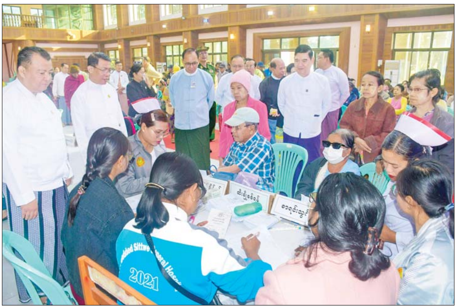
ဆောင်ရွက်ပေးကြပြီး လိုအပ်သော ဆေးဝါးများကိုလည်း အခမဲ့ထုတ်ပေးကြသည်။ အလားတူ တိုင်းရင်းဆေးပညာဦးစီးဌာနမှ ပြည်နယ်ဦးစီးမှူးနှင့် ဝန်ထမ်းများကလည်း အငြိမ်းစားဝန်ထမ်းများအား တိုင်းရင်းဆေးဝါးများနှင့် ကုသပေးခြင်းများကို ဆောင်ရွက်ပေးကြပြီး တိုင်းရင်းဆေးများကို အခမဲ့ ချီးမြှင့်ပေးအပ်ခဲ့ကြကြောင်း သိရသည်။ တင်ထွန်း (ပြန်/ဆက်)

ဆောင်ရွက်ပေးကြပြီး လိုအပ်သော ဆေးဝါးများကိုလည်း အခမဲ့ထုတ်ပေးကြသည်။ အလားတူ တိုင်းရင်းဆေးပညာဦးစီးဌာနမှ ပြည်နယ်ဦးစီးမှူးနှင့် ဝန်ထမ်းများကလည်း အငြိမ်းစားဝန်ထမ်းများအား