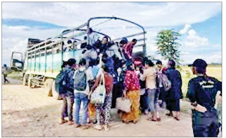
KNPP အဖွဲ့နှင့် PDF အမည်ခံ အကြမ်းဖက်အဖွဲ့များက လျှင်ကော်တက္ကသိုလ်မှ ဆရာ ဆရာမများ၊ ပညာရေးဝန်ထမ်းများနှင့် ကျောင်းသား ကျောင်းသူများအား အတင်းအဓမ္မဖမ်းဆီးခေါ်ဆောင်သွားမှုကို အွန်လိုင်းအထောက်အထားဓာတ်ပုံများမှတစ်ဆင့် တွေ့ရစဉ်။

အပြင် မဟာဘွဲ့သင်တန်းများ အထိ ဖွင့်လှစ်ပို့ချခဲ့ပြီး ပြည်နယ်၊ ပြည်မမှ ဆရာ ဆရာမများ၊ ဝန်ထမ်းများ လာရောက်သင်ကြား ပို့ချတာဝန်ထမ်းဆောင်ခဲ့ကြသည် ကို တွေ့ရှိရကြောင်း၊ နေ့သင်တန်း နှင့် အဝေးသင်သင်တန်း ကျောင်း သား ကျောင်းသူများစွာ အဆင့် မြင့်ပညာ ဆည်းပူးခဲ့ကြသည့်