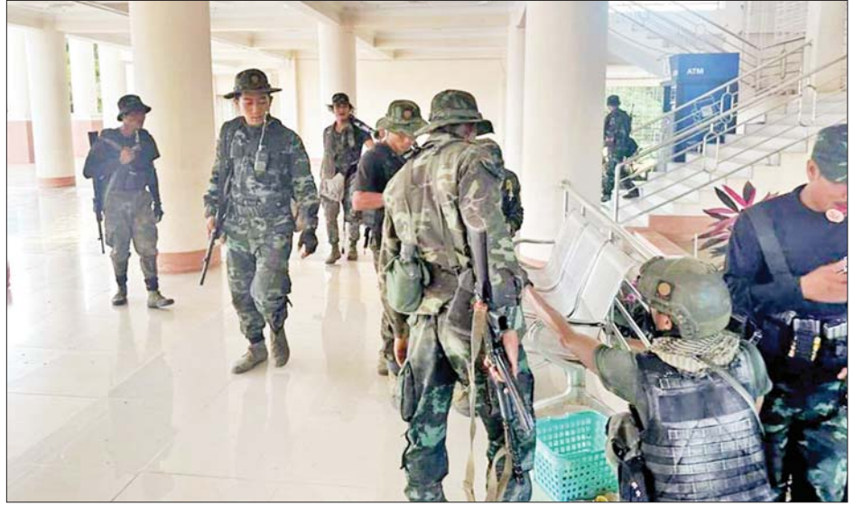
KNPP အဖွဲ့နှင့် PDF အမည်ခံ အကြမ်းဖက်အဖွဲ့များက စစ်ရေးပစ်မှတ်မဟုတ်သည့် လျှင်ကော်တက္ကသိုလ်အတွင်း စီးနင်းဝင်ရောက်မှုအား အွန်လိုင်းအထောက်အထားဓာတ်ပုံများမှတစ်ဆင့် တွေ့ရစဉ်။