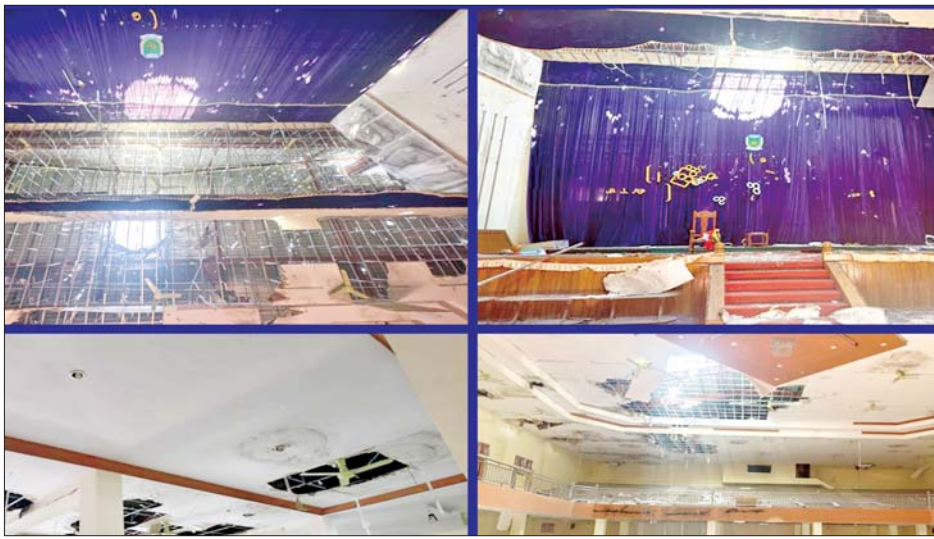
ကယားပြည်နယ် လွိုင်ကော်တက္ကသိုလ်အား အကြမ်းဖက်သောင်းကျန်းသူများ ဖျက်ဆီးမှုကြောင့် နှစ်ထပ်ဘွဲ့နှင့်သဘင်ခန်းမ (၁၈၈ ပေ x ၁၆၄ ပေ) အတွင်းပိုင်းပျက်စီးမှုအခြေအနေကို တွေ့ရစဉ်။