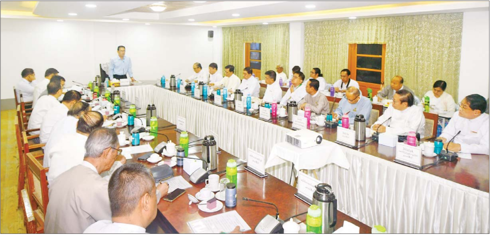
ပြည်ထောင်စုဝန်ကြီး ဦးမောင်မောင်အုန်း သတင်းမီဒီယာကဏ္ဍ ဖွံ့ဖြိုးတိုးတက်ရေးအတွက် မြန်မာနိုင်ငံ သတင်းမီဒီယာကောင်စီဝင်များနှင့် တွေ့ဆုံဆွေးနွေးပွဲတွင် အမှာစကားပြောကြားစဉ်။

ရန်ကုန် ဇန်နဝါရီ ၂၁ သတင်းမီဒီယာကဏ္ဍ ဖွံ့ဖြိုးတိုးတက်ရေးအတွက် မြန်မာနိုင်ငံ သတင်းမီဒီယာ ကောင်စီဝင်များနှင့် တွေ့ဆုံဆွေးနွေးပွဲကို ယနေ့နံနက် ၁၀ နာရီတွင် ရန်ကုန်မြို့ ဗဟန်းမြို့နယ်ရှိ ပြန်ကြားရေးနှင့် ပြည်သူ့ဆက်ဆံရေးဦးစီးဌာန ရုပ်ရှင်မြှင့်တင်ရေးဌာနခွဲ၌ ကျင်းပရာ ပြန်ကြားရေးဝန်ကြီးဌာန ပြည်ထောင်စုဝန်ကြီး ဦးမောင်မောင်အုန်း တက်ရောက် အမှာစကားပြောကြားသည်။