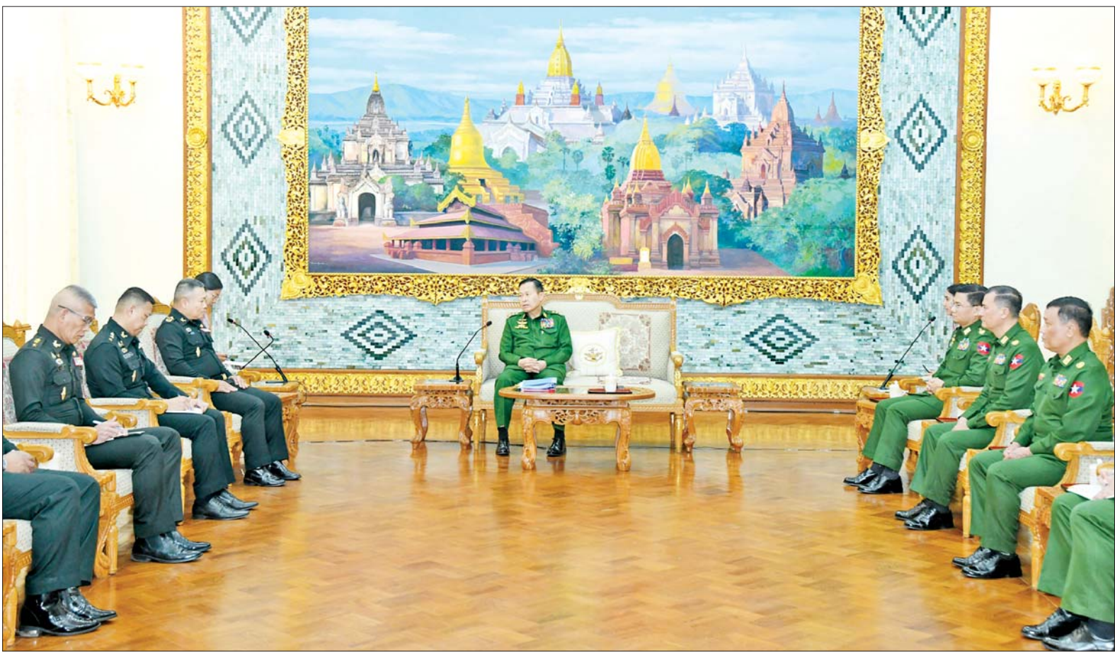
နိုင်ငံတော်စီမံအုပ်ချုပ်ရေးကောင်စီဒုတိယဥက္ကဋ္ဌ ဒုတိယတပ်မတော်ကာကွယ်ရေးဦးစီးချုပ် ကာကွယ်ရေးဦးစီးချုပ်(ကြည်း) ဒုတိယဗိုလ်ချုပ်မှူးကြီးစိုးဝင်း ထိုင်းဘုရင့် ကြည်းတပ်ဦးစီးချုပ်ရုံး အကြံပေးဘုတ်အဖွဲ့ဥက္ကဋ္ဌ ဗိုလ်ချုပ်ကြီး ဒီရစ်ဘွန်ကန် ဦးဆောင်သည့် ကိုယ်စားလှယ်အဖွဲ့အား လက်ခံတွေ့ဆုံစဉ်။

နေပြည်တော် ဇန်နဝါရီ ၂၁ နိုင်ငံတော် စီမံအုပ်ချုပ်ရေး ကောင်စီဒုတိယဥက္ကဋ္ဌ ဒုတိယ တပ်မတော်ကာကွယ်ရေးဦးစီးချုပ် ကာကွယ်ရေးဦးစီးချုပ် (ကြည်း) ဒုတိယဗိုလ်ချုပ်မှူးကြီး စိုးဝင်း သည် ထိုင်းဘုရင့်ကြည်းတပ်ဦးစီး ချုပ်ရုံး အကြံပေးဘုတ်အဖွဲ့ဥက္ကဋ္ဌ နှင့် Army Operations Center၊ Neighboring Countries Coordination Center(NCCC) ဌာန တာဝန်ခံ General Direk Bongkarn ဦးဆောင်သည့် ကိုယ်စားလှယ်အဖွဲ့အား ယနေ့ မွန်းလွဲပိုင်းတွင် နေပြည်တော်ရှိ ဘုရင့်နေောင်ရိပ်သာ ဧည့်ခန်းမ ဆောင်၌ လက်ခံတွေ့ဆုံသည်။ ထိုသို့ တွေ့ဆုံဆွေးနွေးရာတွင် နှစ်နိုင်ငံနှင့် တပ်မတော်နှစ်ရပ် အကြား သံတမန်ဆက်ဆံရေးနှင့် ချစ်ကြည်ရင်းနှီးမှုများ ကောင်းမွန် လျက်ရှိသည့် အခြေအနေများ၊ တပ်မတော် နှစ်ရပ်အကြား ခေါင်းဆောင်များနှင့် အဆင့်မြင့် တပ်မတော် အရာရှိကြီးများ စာမျက်နှာ ၃ ကော်လံ ၁ သို့ ။