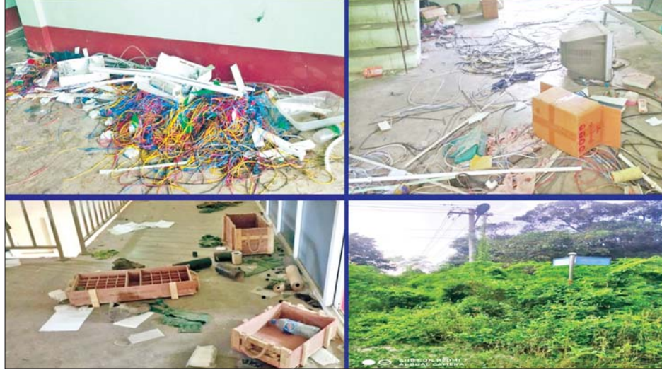
ကယားပြည်နယ် လျှင်ကော်တက္ကသိုလ်အား အကြမ်းဖက်သောင်းကျန်းသူများ ဖျက်ဆီးမှုကြောင့် M&E (Internal and External lines) ပျက်စီးမှုအခြေအနေကို တွေ့ရစဉ်။ (ပျက်စီးမှု ခန့်မှန်းတန်ဖိုး - ကျပ် ၁၀၀.၀၀ သန်း)

ဖြစ်ပွားချိန်တွင် ဆရာ ဆရာမများ အနေဖြင့် နီးစပ်ရာ စာသင်ခန်းများ၊ နေအိမ်များတွင် ကြောက်လန့် တကြား ပုန်းအောင်းနေထိုင်ခဲ့ကြ ရကြောင်း။ လုံခြုံရေးတပ်ဖွဲ့ဝင်များ အနေ ဖြင့် ဆရာ ဆရာမများ၊ ဝန်ထမ်း များ၊ ကျောင်းသား ကျောင်းသူများ ထိခိုက်ဒဏ်ရာ မရရှိစေရေး၊ ဘေးကင်းလုံခြုံစေရေးကို အဓိက ထား ဆောင်ရွက်ခဲ့သည့်အပြင် ကယားပြည်နယ်၏ အဆင့်မြင့် ပညာသင်ကြားရာ လျှင်ကော် တက္ကသိုလ်၏ပင်မဆောင်၊ စာမျက်နှာ ၆ သို့ ☆