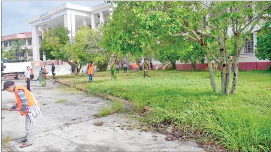
လွိုင်ကော်မြို့ အခြေအနေတည်ငြိမ်မှုရှိလာပြီးနောက် လွိုင်ကော်တက္ကသိုလ်၌ စုပေါင်းသန့်ရှင်းရေး ဆောင်ရွက်စဉ်။