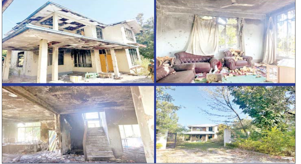
ကယားပြည်နယ် လျှင်ကော်တက္ကသိုလ်အား အကြမ်းဖက်သောင်းကျန်းသူများ ဖျက်ဆီးမှုကြောင့် နှစ်ထပ် ပါမောက္ခချုပ်နေအိမ် (၄၁ ပေ x ၃၄၀ ပေ) ပျက်စီးမှုအခြေအနေကို တွေ့ရစဉ်။ (ပျက်စီးမှု ခန့်မှန်းတန်ဖိုး - ကျပ် ၂၀၀.၀၀ သန်း)