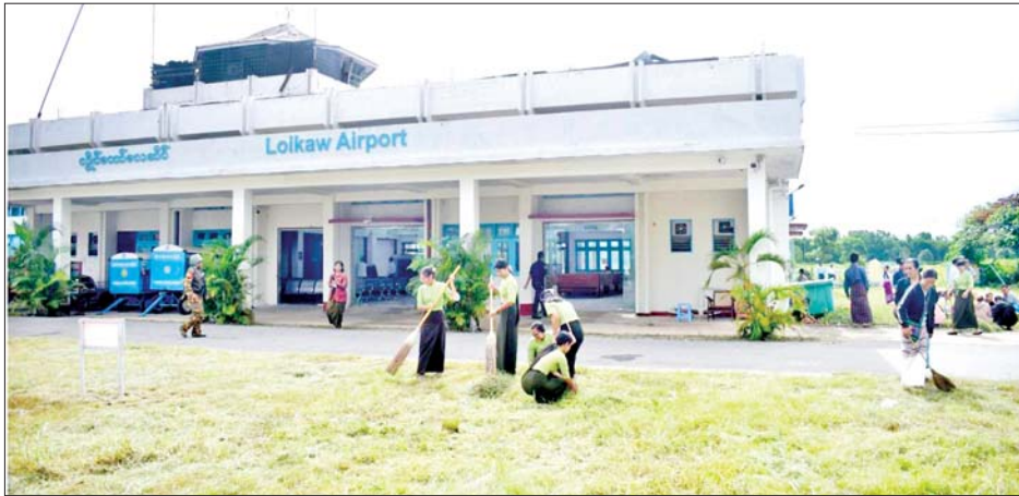
လွိုင်ကော်မြို့ အခြေအနေတည်ငြိမ်မှုရှိလာပြီးနောက် လွိုင်ကော်လေယာဉ်ကွင်း၌ စုပေါင်းသန့်ရှင်းရေး ဆောင်ရွက်စဉ်။

ဒုတိယဝန်ကြီးက တည်ဆောက်ရေး လုပ်ငန်းများတွင် နည်းပညာပိုင်းဆိုင်ရာ၊ အရည်အသွေး၊ စံချိန်စံညွှန်းပိုင်းဆိုင်ရာ ပြည့်မီစေရေး ပံ့ပိုးဆောင်ရွက်သွားမည့် အခြေအနေများကို လည်းကောင်း ရှင်းလင်းတင်ပြကြသည်။ ဆက်လက်၍ အစည်းအဝေးသို့ တက်ရောက်လာကြသူများက လွိုင်ကော်တက္ကသိုလ် အမြန်ဆုံး ပြန်လည်ဖွင့်လှစ်နိုင်ရေး၊ ပြုပြင်ရေးလုပ်ငန်းများ ဆောင်ရွက်ရာတွင် ဦးစားပေး လုပ်ဆောင်ရမည့် လုပ်ငန်းများ၊ ဆောက်လုပ်ရေး လုပ်ငန်းသုံးပစ္စည်းများ ဈေးနှုန်း သက်သာစွာ ရရှိရေးနှင့် သယ်ယူပို့ဆောင်ရေး ကိစ္စရပ်များကို ဆွေးနွေးတင်ပြကြသည်။ တင်ပြချက်များအပေါ် နိုင်ငံတော်စီမံအုပ်ချုပ်ရေး ကောင်စီ