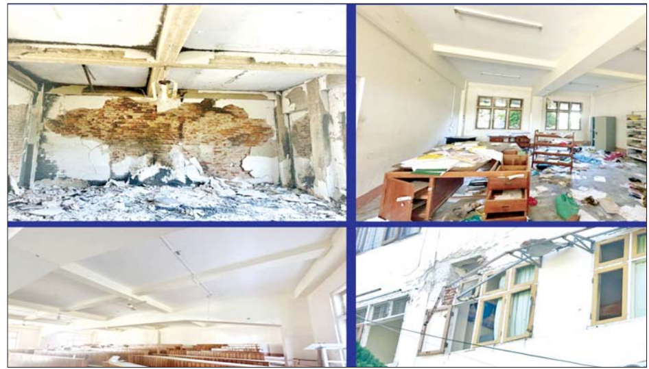
ကယားပြည်နယ် လွိုင်ကော်တက္ကသိုလ်အား အကြမ်းဖက်သောင်းကျန်းသူများ ဖျက်ဆီးမှုကြောင့် သုံးထပ်ပင်မဆောင် (ပေ ၄၀၀ x ၈၃ ပေ) အတွင်းပိုင်းပျက်စီးမှုအခြေအနေကို တွေ့ရစဉ်။

တွင် ပါဝင်သည့် အဓိကအချက်များအနေဖြင့် ကလေးများ၊ ကျောင်းများနှင့် ဆရာများကို မတိုက်ခိုက်ရန်၊ လက်နက်ကိုင်ပဋိပက္ခအတွင်းတွင် ပညာသင်ကြားခွင့်ကို အကာအကွယ်ပေးရန်၊ ကျောင်းသည် ပညာရေးအတွက် လုံခြုံစိတ်ချရသည့်နေရာ ဖြစ်ရန်၊ ကျောင်းများသည် အရပ်ဘက်စရိုက်လက္ခဏာ ရှိသည်ဖြစ်၍ လေးစားကာကွယ်ရန်၊ လက်နက်ကိုင် ပဋိပက္ခဖြစ်နေပါကလည်း ပညာသင်ကြားခွင့်ကို လွယ်ကူချောမွေ့စွာ ဆက်လက်ရရှိရန် ဆိုသည့် အချက်များပင်ဖြစ်ကြောင်း၊ စာမျက်နှာ ၅ သို့ ✕