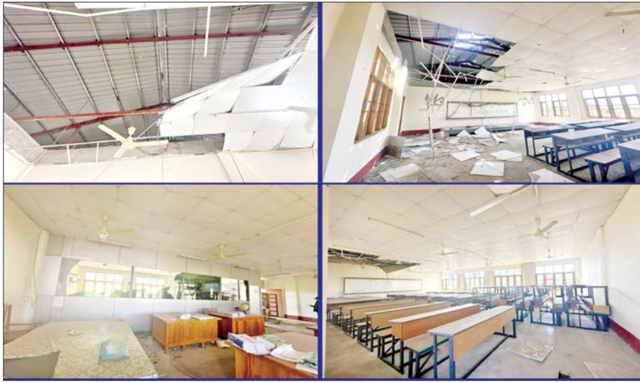
ကယားပြည်နယ် လွိုင်ကော်တက္ကသိုလ်အား အကြမ်းဖက်သောင်းကျန်းသူများ ဖျက်ဆီးမှုကြောင့် နှစ်ထပ်စာသင်ဆောင် (၂၀၈ ပေ x ၃၈ ပေ) အတွင်းပိုင်း ပျက်စီးမှုအခြေအနေကို တွေ့ရစဉ်။