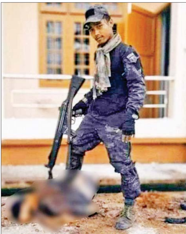
KNPP အဖွဲ့နှင့် PDF အမည်ခံ အကြမ်းဖက်အဖွဲ့များက လျှင်ကော်တက္ကသိုလ်မှဆရာဆရာမအချို့အားရက်စက်စွာသတ်ဖြတ် ထားရှိမှုကို အွန်လိုင်းအထောက်အထားဓာတ်ပုံများမှတစ်ဆင့် တွေ့ရစဉ်။

ကမ္ဘာ့နိုင်ငံ အများစုက ထောက်ခံအတည်ပြုထားသည့် လုံခြုံစိတ်ချသည့် ကျောင်းများ ဆိုင်ရာကြေညာချက် (The Safe Schools Declaration) တွင် လည်း လက်နက်ကိုင်ပဋိပက္ခ၏ အဆိုးရွားဆုံး သက်ရောက်မှုများ ကနေ ကျောင်းသား ကျောင်းသူ များ၊ ဆရာ ဆရာမများ၊ ကျောင်း များနှင့်တက္ကသိုလ်များကိုကာကွယ် ရန် အကြမ်းဖက်မှု သို့မဟုတ် တိုက်ခိုက်မှုများကိုစိုးရိမ်ကြောင့်ကြ စရာမလိုဘဲ ပညာသင်ကြားခွင့်ရရှိ ရန်၊ ဆရာ ဆရာမ၊ ပါမောက္ခနှင့် ကျောင်း အုပ်ချုပ်သူတိုင်းသည် ဘေးကင်းရေး၊ လုံခြုံရေးနှင့် ဂုဏ်သိက္ခာဆိုင်ရာ အခြေအနေ များတွင် သင်ကြား သုတေသန ပြုနိုင်ရန်၊ တက္ကသိုလ်တိုင်းသည် ကျောင်းသားများနှင့် ပညာရှင်များ အတွက် လုံခြုံသည့်နေရာဖြစ်ရန် စသည့်အချက်များ ပါဝင်သည်ကို တွေ့ရမည်ဖြစ်ကြောင်း။