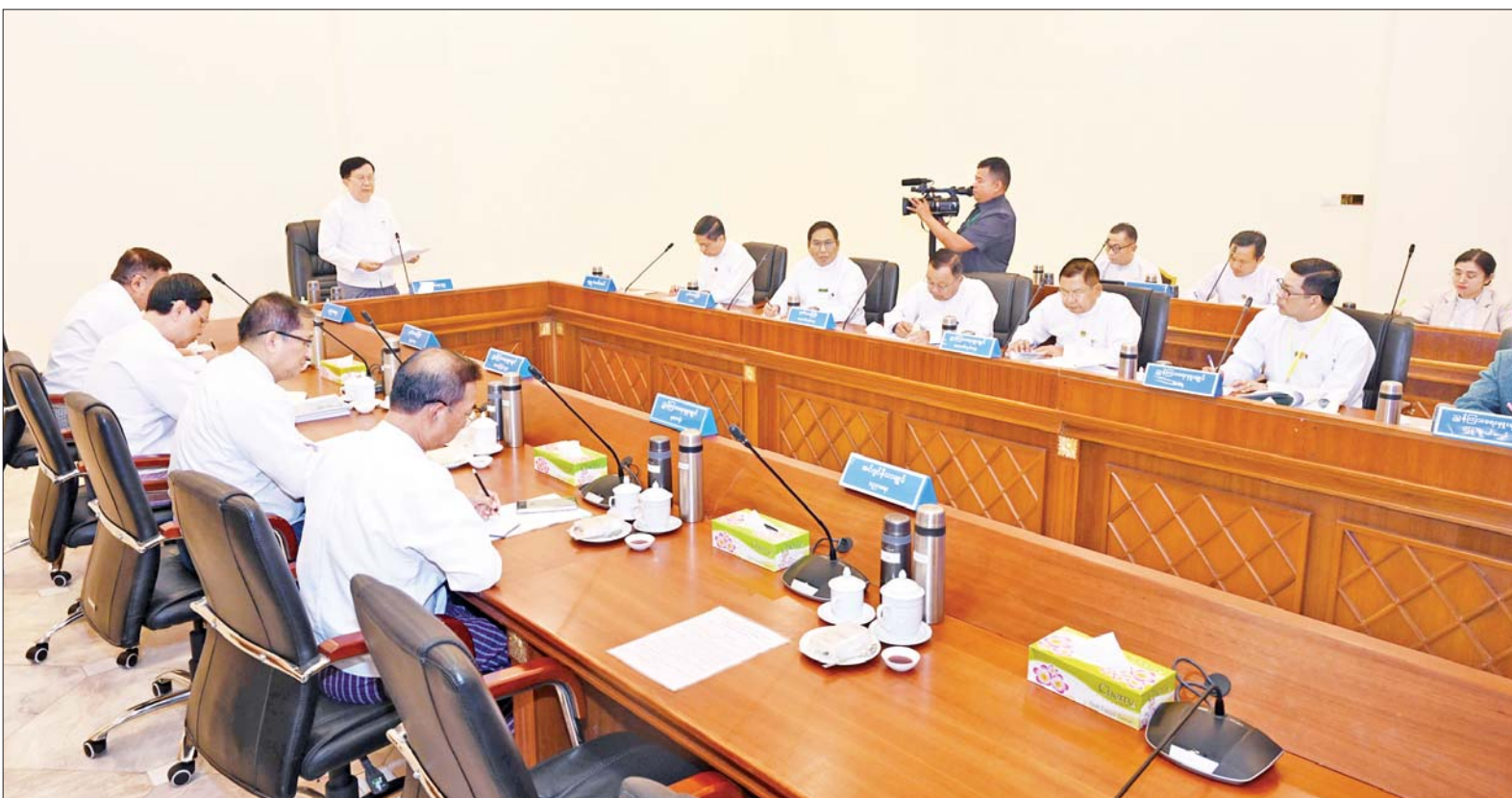
နိုင်ငံတော်စီမံအုပ်ချုပ်ရေးကောင်စီအတွင်းရေးမှူး ဗိုလ်ချုပ်ကြီးအောင်လင်းဒွေး ကယားပြည်နယ် လွိုင်ကော်တက္ကသိုလ်အား အကြမ်းဖက်သောင်းကျန်းသူများ ဖျက်ဆီးမှုကြောင့် အဆောက်အအုံများပျက်စီးခဲ့မှုအခြေအနေနှင့် ပြန်လည်ပြုပြင်ရေးဆိုင်ရာ ညှိနှိုင်းအစည်းအဝေးတွင် အမှာစကားပြောကြားစဉ်။

နေပြည်တော် ဇန်နဝါရီ ၂၁ KNPP/KNDF အဖွဲ့နှင့် PDF အမည်ခံ အကြမ်းဖက်သမားများသည် ကယားပြည်နယ်အတွင်း အစိုးရ၏ အုပ်ချုပ်မှုယန္တရား ပျက်ပြားစေရန် ရည်ရွယ်၍ ၂၀၂၁ ခုနှစ် ဒီဇင်ဘာလမှစတင်ကာ လူနေ အဆောက်အအုံများ၊ ဘာသာရေး၊ ကျန်းမာရေး၊ ပညာရေးဆိုင်ရာ အဆောက်အအုံများကို အကာအကွယ်ရယူ၍ အဖျက်အမှောင်လုပ်ရပ်များကို လုပ်ဆောင်ခဲ့ကြသည့်အပြင် စစ်ရေးနှင့် သက်ဆိုင်သော ပစ်မှတ်မဟုတ်သည့် ကယားပြည်နယ် လွိုင်ကော်တက္ကသိုလ်အား လက်နက်ကြီး၊ လက်နက်ငယ်များဖြင့် ရည်ရွယ်ချက်ရှိရှိ လာရောက်ပစ်ခတ်တိုက်ခိုက်ခဲ့ကာ ပညာရေးဆိုင်ရာ အဆောက်အအုံများ ဖျက်ဆီးခြင်း၊ တက္ကသိုလ်တွင်တာဝန်ထမ်းဆောင်လျက်ရှိသည့် ပါမောက္ခချုပ် အပါအဝင် ဆရာ ဆရာမများ၊ ပညာရေးဆိုင်ရာ ဝန်ထမ်းများနှင့် ပညာ သင်ကြားလျက်ရှိသည့် ကျောင်းသား ကျောင်းသူများအား အတင်းအဓမ္မ ဖမ်းဆီးချုပ်နှောင်ခြင်း၊ ပညာရေးဝန်ထမ်းများနှင့် ကျောင်းသား ကျောင်းသူများကို လူသားတိုင်းအနေဖြင့် အကာအကွယ်ပြုတိုက်ခိုက်ခြင်း၊ နိုင်ငံအတွက် အရေးကြီးသည့် ပညာရေးဆိုင်ရာ အဆောက်အအုံများကို အကာအကွယ်ရယူ ပစ်ခတ်တိုက်ခိုက်ခြင်း စသည့် မည်သူတစ်ဦးတစ်ယောက်ကိုမျှ အကျိုးမရှိစေဘဲ တိုင်းပြည်၏အနာဂတ်ကို ပျက်စီးစေလိုသည်။ အသိဉာဏ်ကင်းမဲ့သည့် လူမဆန်သော လုပ်ရပ်များကို လုပ်ဆောင်ခဲ့ကြသည်။