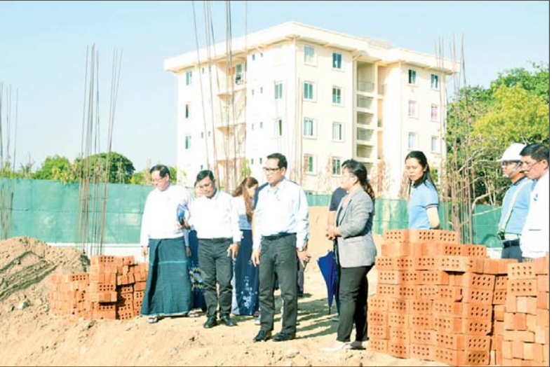
ပြည်ထောင်စုဝန်ကြီး ဦးမောင်မောင်အုန်း စာဆိုဗိမာန်အဆောက်အအုံတည်ဆောက်နေမှုကို ကြည့်ရှုစစ်ဆေးစဉ်။

အရ ရင့်ကျက်ပြီးသူများဖြစ်သဖြင့် သတင်းမီဒီယာကဏ္ဍ ဖွံ့ဖြိုးတိုးတက်အောင် ကြိုးပမ်းဆောင်ရွက်နိုင်လိမ့်မည်ဟု ယုံကြည်ပါကြောင်း၊ လုပ်ငန်းများဆောင်ရွက်ရာတွင် ယနေ့ဖြစ်ပေါ်နေသည့် ပကတိ အခြေအနေမှန်များ၊ ပြည်တွင်း/ပြည်ပ နိုင်ငံရေးအခြေအနေများကို စဉ်းစားချင့်ချိန်ဆောင်ရွက်မှသာ အကျိုးရှိနိုင်မည်ဖြစ်ကြောင်း၊ ယနေ့ခေတ်တွင် သတင်းမီဒီယာသည် လွန်စွာ အရေးကြီးသည်ကို တက်ရောက်