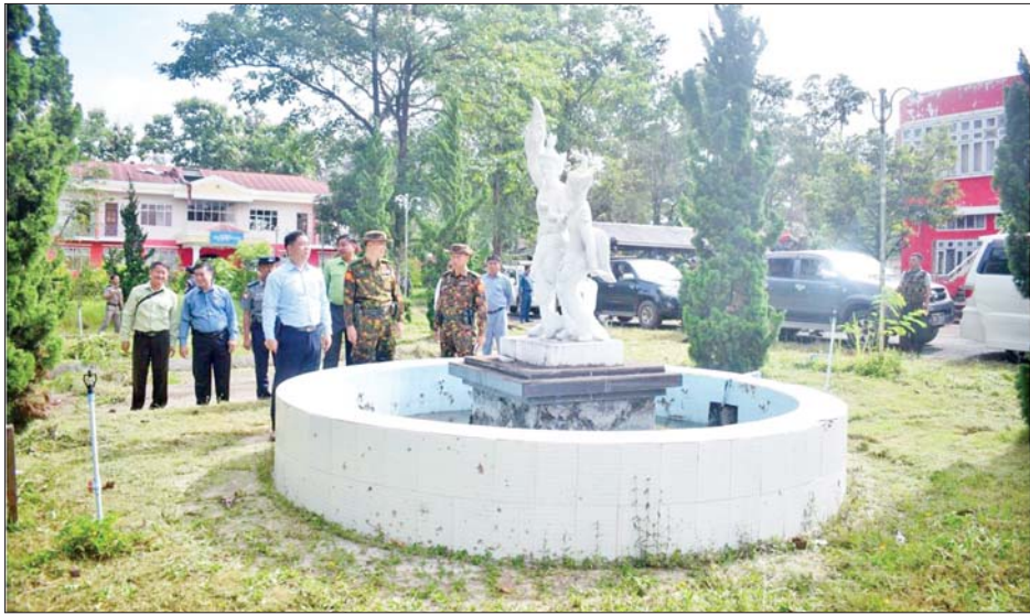
လွိုင်ကော်မြို့ အခြေအနေတည်ငြိမ်မှုရှိလာပြီးနောက် လွိုင်ကော်ယဉ်ကျေးမှုပြတိုက်တွင် သန့်ရှင်းရေး ပြုလုပ်နေမှုအား ကယားပြည်နယ်ဝန်ကြီးချုပ် ဦးဇော်မျိုးတင်၊ အရှေ့ပိုင်းတိုင်းစစ်ဌာနချုပ် တိုင်းမှူး ဗိုလ်ချုပ်ဇော်မင်းလတ်နှင့် တာဝန်ရှိသူများ လှည့်လည်ကြည့်ရှုစဉ်။

ယင်းနောက် လူမှုဝန်ထမ်း၊ ကယ်ဆယ်ရေးနှင့် ပြန်လည်နေရာချထားရေး ဝန်ကြီးဌာန ပြည်ထောင်စုဝန်ကြီး ဒေါက်တာ စိုးဝင်းက လွိုင်ကော်တက္ကသိုလ် ပြန်လည်ပြုပြင်တည်ဆောက်ရေး လုပ်ငန်းများ ဆောင်ရွက်ရာတွင် အထူးကိစ္စရပ်အနေဖြင့် အမျိုးသား သဘာဝ ဘေးအန္တရာယ်ဆိုင်ရာ အညီ ထုတ်ယူသုံးစွဲနိုင်မည့် အခြေအနေများကိုလည်းကောင်း၊ ကယားပြည်နယ် ဝန်ကြီးချုပ် ဦးဇော်မျိုးတင်က အကြမ်းဖက်သောင်းကျန်းသူများ ဖျက်ဆီးမှုကြောင့် လွိုင်ကော်တက္ကသိုလ် ပျက်စီးမှုနှင့် ပြုပြင်ဆောင်ရွက်ရမည့် အခြေအနေ၊ လက်ရှိ နယ်မြေဒေသ လုံခြုံရေးဆိုင်ရာ ကိစ္စရပ်များ၊ တက္ကသိုလ် ပြန်လည်ဖွင့်လှစ်နိုင်ရေး ဆောင်ရွက်ရာတွင် ပြုပြင်ရေး လုပ်ငန်းများနှင့်အတူ စီမံအုပ်ချုပ်ရေး၊ လုံခြုံရေးဆိုင်ရာ ကိစ္စရပ်များ ဆောင်ရွက်သွားမည့် အခြေအနေများကိုလည်းကောင်း၊ ဆောက်လုပ်ရေး ဝန်ကြီးဌာန