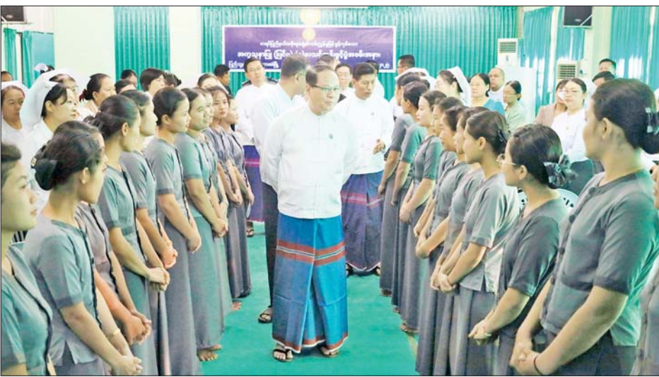
အသီးသီးမှ သင်တန်းသူ ၂၀ ဖွင့်ပွဲတွင် ပြည်နယ်ဝန်ကြီးချုပ်က တက်ရောက်ကြပြီး သင်တန်းဦးစောမြင့်ဦးက အကူအညီပြုများသည် ကုသရေးလုပ်ငန်းတွင် စ-လယ်-ဆုံး ပါဝင်သည့်အသုံးပြု

ဘားအံ ဇန်နဝါရီ ၂၁ ကရင်ပြည်နယ်အတွင်း ကျန်းမာရေးစောင့်ရှောက်မှုကဏ္ဍ မြှင့်တင်နိုင်ရေး၊ လူငယ်များ အလုပ်အကိုင်အခွင့်အလမ်း ရရှိစေရေးနှင့် ကျန်းမာရေး လူ့စွမ်းအားအရင်းအမြစ်များ ရရှိစေရေးအတွက် ယနေ့နံနက် ၈ နာရီက ပြည်နယ်ပြည်သူ့ဆေးရုံကြီး (ဘားအံ) သုံးထပ် တိုးချဲ့လူနာဆောင်အပေါ်ထပ်၌ အကူအညီပြု(ပြင်ပ) ကိုးလသင်တန်းကို ဖွင့်လှစ်သည်။ ကုသရေးလုပ်ငန်း အဆိုပါသင်တန်းသို့ ကရင်ပြည်နယ်အတွင်းရှိ မြို့နယ်