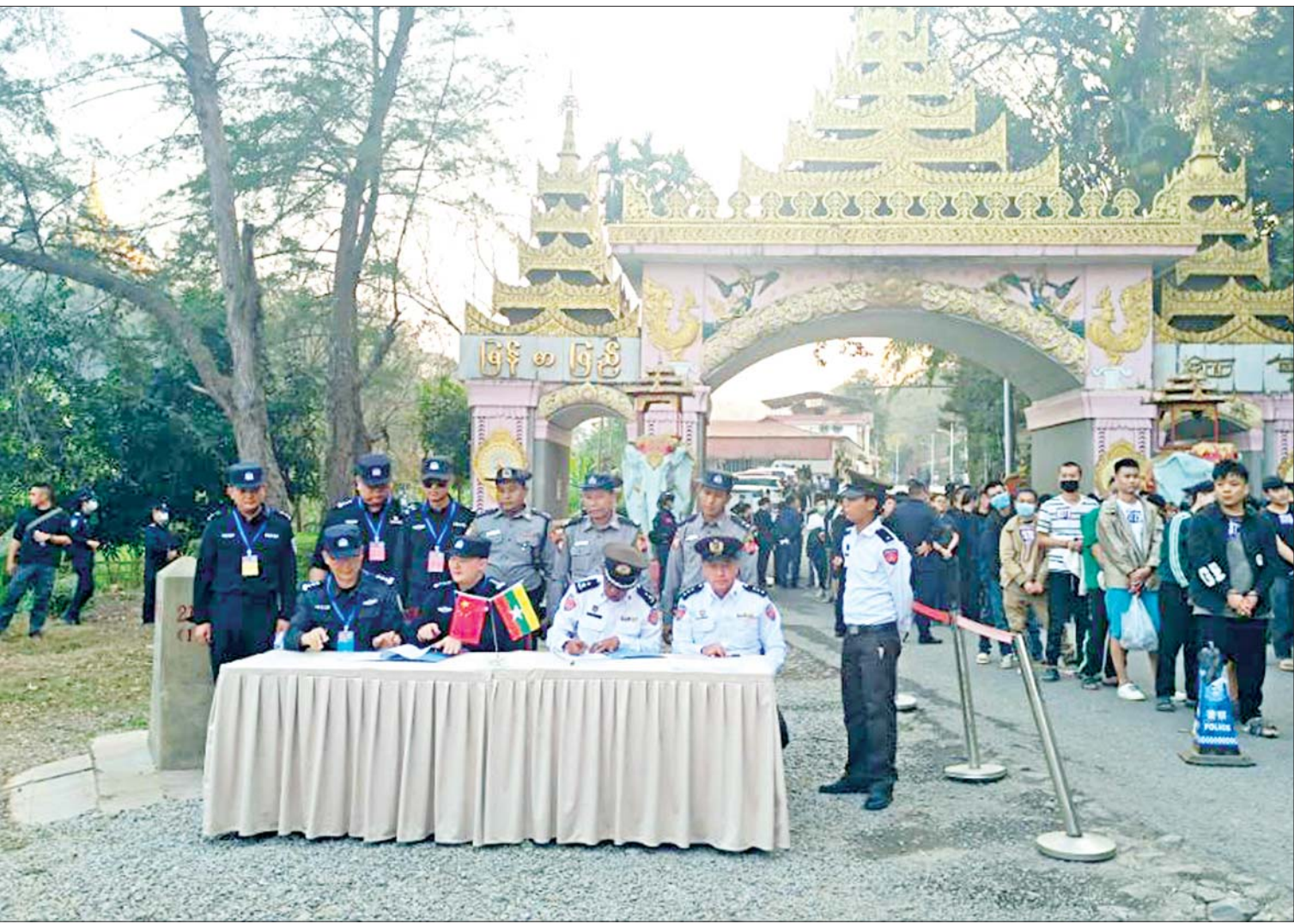
မြန်မာနိုင်ငံအတွင်းသို့ တရားမဝင် ဝင်ရောက်လာပြီး အွန်လိုင်းလောင်းကစားမှုကျူးလွန်နေကြသည့် ပြည်ပနိုင်ငံသားများအား သက်ဆိုင်ရာနိုင်ငံများသို့ ပြန်လည်လွှဲပြောင်းပေးအပ်စဉ်။

နေပြည်တော် ဇန်နဝါရီ ၂၀ ယခုလတ်တလောတွင် ကရင်ပြည်နယ် မြဝတီ-ရွှေကုက္ကိုလ်နှင့် KK Park နယ်မြေအတွင်း တရားမဝင် အွန်လိုင်း လောင်းကစားအပါအဝင် ဒုစရိုက်မှုများ ဖြစ်ပေါ်လျက်ရှိကြောင်း သိရှိရသည်။ အဆိုပါ ရွှေကုက္ကိုလ်နယ်မြေသည် ၂၀၁၆ ခုနှစ်ကတည်းကပင် ဒေသဖွံ့ဖြိုးတိုးတက်ရေးအတွက် စီးပွားရေးကိစ္စရပ်များ ဆောင်ရွက်နိုင်ရန်အကြောင်းပြု၍ စီမံကိန်းတစ်ရပ်အဖြစ် တည်ဆောက်ခဲ့ခြင်းဖြစ်ကြောင်းနှင့် နောက်ပိုင်းတွင် မီဒီယာများမှ ဖော်ပြချက်များ၊ တရားမဝင် စီးပွားရေးလုပ်ငန်းများ ဆောင်ရွက်နေသည်ဆိုသည့် သတင်းများကြောင့် စီမံကိန်း ဆက်လက်တည်ဆောက်ခြင်းအား ရပ်ဆိုင်းခဲ့သည့် ဒေသဖြစ်သည်။ အဆိုပါနယ်မြေအတွင်း၌ လက်နက်ကိုင် အဖွဲ့ပေါင်းစုံ လှုပ်ရှားနေထိုင်လျက်ရှိခြင်း၊ တရားဥပဒေစိုးမိုးရေး အဖွဲ့များနှင့် အုပ်ချုပ်ရေးပိုင်းဆိုင်ရာ တာဝန်ရှိသူများ အပြည့်အဝ စိုးမိုးအုပ်ချုပ်ရန် အခက်အခဲနှင့် ကန့်သတ်ချက်များရှိခြင်းတို့ကြောင့် နယ်မြေဒေသမတည်ငြိမ်မှုများ ဖြစ်ပေါ်လျက်ရှိသကဲ့သို့ ဆက်စပ်နေရာများမှ ကိုယ်ကျိုးစီးပွားရှာသူများ အနေဖြင့် အခွင့်ကောင်းရယူကာ အွန်လိုင်းလောင်းကစားအပါအဝင် ဒုစရိုက်မှုများကို ကျူးလွန်နေခြင်းဖြစ်သည်။ စာမျက်နှာ ၅ ကော်လံ ၁ သို့ ■