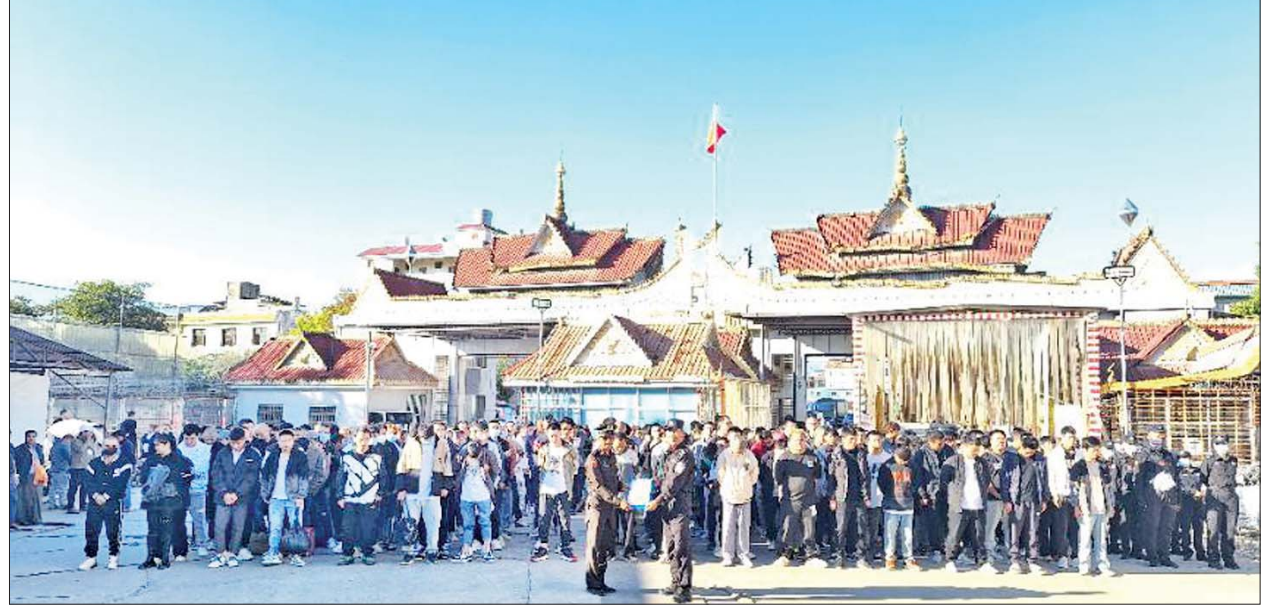
မြန်မာနိုင်ငံအတွင်းသို့ တရားမဝင် ဝင်ရောက်လာပြီး အွန်လိုင်းလောင်းကစားမှုကျူးလွန်နေကြသည့် ပြည်ပနိုင်ငံသားများအား သက်ဆိုင်ရာနိုင်ငံများသို့ ပြန်လည်လွှဲပြောင်းပေးအပ်စဉ်။

ဒေသဆိုင်ရာ အဖွဲ့အစည်းများ၊ နိုင်ငံသူ၊ နိုင်ငံသားများအနေဖြင့်လည်း ၎င်းအွန်လိုင်းလိမ်လည်မှုနှင့် ပတ်သက်သည့် သတင်းအချက်အလက်များ ရရှိပါက သက်ဆိုင်ရာသို့ ပေးပို့ခြင်းဖြင့် အွန်လိုင်းလောင်းကစားမှုတိုက်ဖျက်ရေးကို အမျိုးသားရေးတာဝန်တစ်ရပ်အဖြစ် ခံယူကာ ပူးပေါင်းတိုက်ဖျက်သွားကြပါရန် သတင်းထုတ်ပြန်အပ်ပါသည်။