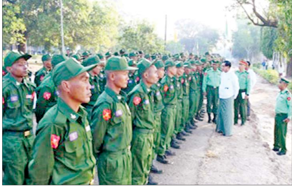
ရန်ကုန်တိုင်းဒေသကြီးဝန်ကြီးချုပ် ဦးစိုးသိန်း ပြည်သူ့စစ်မှုထမ်းသင်တန်း အမှတ်စဉ်(၉) မှ သင်တန်းသားများအား လိုက်လံနှုတ်ဆက်အားပေးစဉ်။