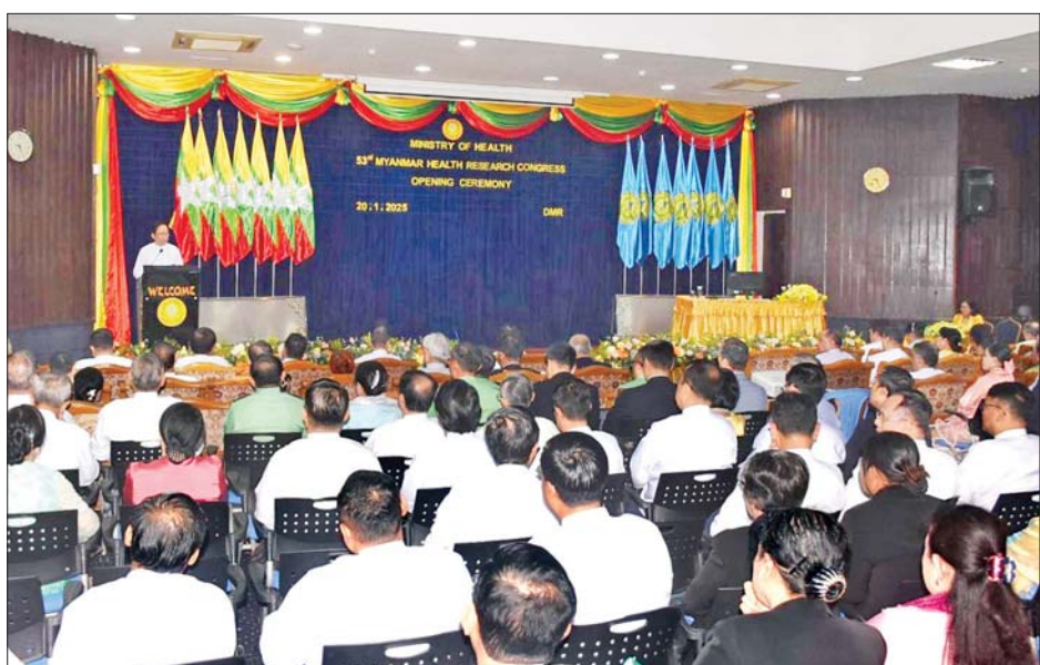
ပြည်ထောင်စုဝန်ကြီး ပါမောက္ခဒေါက်တာသက်ခိုင်ဝင်း (၅၃)ကြိမ်မြောက် မြန်မာနိုင်ငံကျန်းမာရေးဆိုင်ရာ သုတေသနညီလာခံဖွင့်ပွဲအခမ်းအနားတွင် အမှာစကားပြောကြားစဉ်။

ဖလှယ်ပွဲ (၂၀၂၅)” - “Myanmar-Korea Joint Symposium (2025)”၊ “ကျန်းမာရေးပြဿနာ ဖြစ်စေနိုင်သည့် အချက်အလက်များဖော်ထုတ်ခြင်းဖြင့် ကျန်းမာရေးနှင့် ညီညွတ်သော လူမှုဘဝ မြှင့်တင်စေရန် ဆောင်ရွက်ခြင်း” - “Promoting a Healthy Lifestyle and Addressing Health Risk Behaviors”၊ “သွေးလွန်တုပ်ကွေး၊ ဆင်တုပ်ကွေးနှင့် ဇီကာဗိုင်းရပ်စ် ရောဂါများ၏ ဗိုင်းရပ်စ်ပိုးဆိုင်ရာနှင့် သွေးရည်ကြည်ပြောင်းလဲမှု ဆိုင်ရာများကို မီးမောင်းထိုးပြခြင်း” - “Virological and Immunological Highlights of Dengue, Chikungunya and Zika Virus Infections in Myanmar”၊ “ဥာဏ်ရည် တုနည်းပညာ (Artificial Intelligence) ကို ဆေးပညာတွင် အသုံးပြု၍ ကျန်းမာရေးမျိုးဆက်သစ်များကို ပုံဖော်ဖွဲ့စည်းထုတ်နိုင်ရန် ဆောင်ရွက်နေမှု” - “Artificial