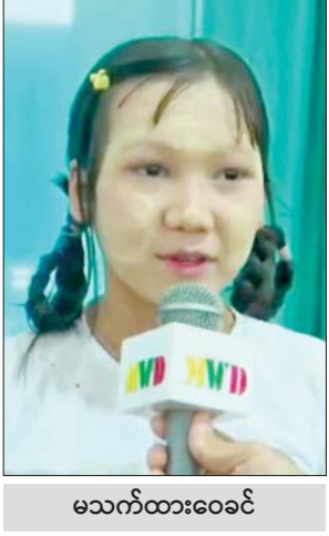
မသက်ထားဝေခင်