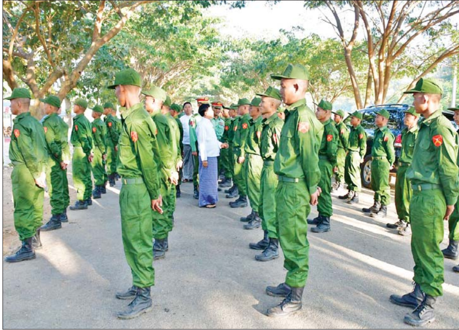
နေပြည်တော်ကောင်စီဥက္ကဋ္ဌ ဦးသန်းထွန်းဦး ပြည်သူ့စစ်မှုထမ်းသင်တန်း အမှတ်စဉ်(၉) မှ သင်တန်းသားများအား လိုက်လံနှုတ်ဆက်အားပေးစဉ်။

နိုင်ငံတော်ကာကွယ်ရေးနှင့် လုံခြုံရေးတာဝန် ထမ်းဆောင်နိုင်ရန်အတွက် ပြည်သူ့စစ်မှုထမ်း သင်တန်းအမှတ်စဉ်(၉)တွင်ပါဝင်တက်ရောက်ကြ မည့် အရည်အချင်းကိုကိုင်ညီသူ နိုင်ငံ့သားကောင်းများ သည် သက်ဆိုင်ရာတိုင်းစစ်ဌာနချုပ် နယ်မြေများရှိ သင်တန်းကျောင်းအသီးသီးသို့ရောက်ရှိ၍ လိုအပ် သည့် ကြိုတင်ပြင်ဆင်မှုများကို ဆောင်ရွက်ခဲ့ကြ သည်။ ယနေ့နံနက်ပိုင်းတွင်အဆိုပါသင်တန်းကျောင်း အသီးသီး၌ ပြည်သူ့စစ်မှုထမ်းသင်တန်းအမှတ်စဉ်(၉) သင်တန်းဖွင့်ပွဲများ ပြုလုပ်ကြသည်။ သင်တန်းဖွင့်ပွဲ များတွင် သင်တန်းကျောင်းများအလိုက် ကျောင်းအုပ် ကြီးများက သင်တန်းဖွင့်အမှာစကားများ ပြောကြား ကြသည်။