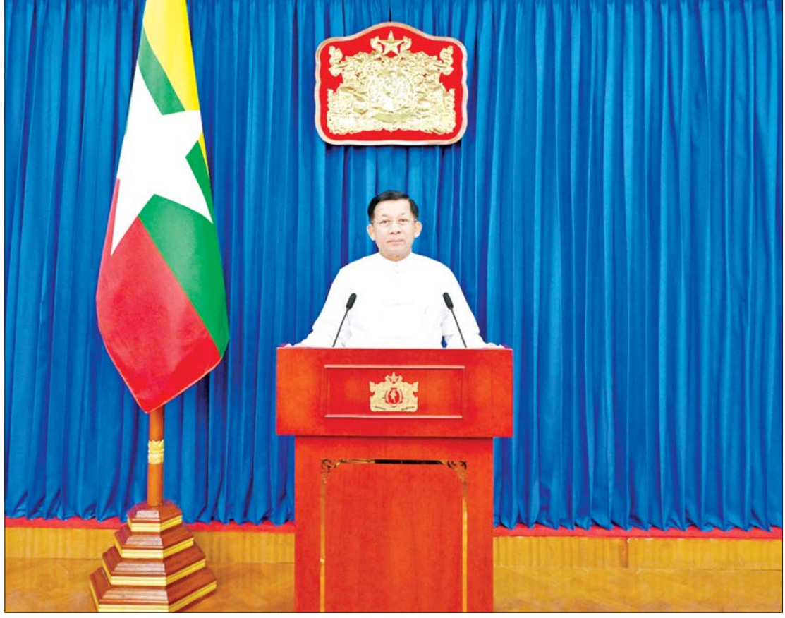
နိုင်ငံတော်စီမံအုပ်ချုပ်ရေးကောင်စီဥက္ကဋ္ဌ နိုင်ငံတော်ဝန်ကြီးချုပ် ဗိုလ်ချုပ်မှူးကြီး မင်းအောင်လှိုင် (၅၃)ကြိမ်မြောက် မြန်မာနိုင်ငံကျန်းမာရေးဆိုင်ရာ သုတေသနညီလာခံ ဖွင့်ပွဲအခမ်းအနားတွင် ဂုဏ်ပြုဗီဒီယိုမိန့်ခွန်းပြောကြားစဉ်။

အားလုံးမင်္ဂလာပါ။ ဒီနေ့ကျင်းပပြုလုပ်တဲ့ “(၅၃)ကြိမ်မြောက် မြန်မာနိုင်ငံ ကျန်းမာရေးဆိုင်ရာ သုတေသနညီလာခံ”ကို တက်ရောက် လာကြတဲ့ ဧည့်သည်တော်များအားလုံး စိတ်၏ချမ်းသာခြင်း၊ ကိုယ်၏ကျန်းမာ ခြင်းနှင့်ပြည့်စုံပြီး ကျက်သရေမင်္ဂလာ အပေါင်းနဲ့ ပြည့်စုံကြပါစေလို့ ဦးစွာ ဆုမွန်ကောင်းတောင်းရင်း နှုတ်ခွန်း ဆက်သအပ်ပါတယ်။ မြန်မာနိုင်ငံရဲ့ ကျန်းမာရေးဆိုင်ရာ သုတေသနလုပ်ငန်းတွေကို နိုင်ငံတကာ နဲ့ ရင်ပေါင်တန်းဆောင်ရွက်နိုင်စေဖို့ ရည်ရွယ်ပြီး မြန်မာနိုင်ငံ ကျန်းမာရေး ဆိုင်ရာ သုတေသနညီလာခံကို ကျင်းပ လာခဲ့တာ ယခုအခါ (၅၃)ကြိမ်တိုင်ခဲ့ပြီ ဖြစ်ပါတယ်။ ၁၉၆၅ ခုနှစ်မှာ ပထမအကြိမ် ညီလာခံကို စတင်ကျင်းပနိုင်ခဲ့ပါတယ်။ ညီလာခံ စတင်ကျင်းပခဲ့တဲ့နှစ်တွေမှာ သုတေသနစာတမ်းတွေကိုသာ တင်သွင်း ဖတ်ကြားနိုင်ခဲ့ရာက ၁၉၉၁ ခုနှစ်မှာ ပြုလုပ်တဲ့ ကျန်းမာရေးဆိုင်ရာ သုတေသန ညီလာခံကစပြီး သုတေသနပိုစတာပြပွဲ ကို ထည့်သွင်းနိုင်ခဲ့တာ တွေ့ရပါတယ်။ စာမျက်နှာ ၃ ကော်လံ ၁ သို့ ☆