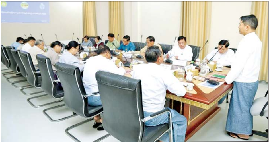
နိုင်ရန် သဘာဝမြေဩဇာ ထည့်သွင်းမြေပြင်ခြင်း၊ လိုအပ်ချက်ကို လုပ်ငန်းရှင်များနှင့် ညှိနှိုင်း ဆောင်ရွက်ပေးမည့် အစီအစဉ်များနှင့်စပ်လျဉ်း၍ ဆွေးနွေးခဲ့ကြောင်း သိရသည်။

မွန်းလွဲပိုင်းတွင် ပြည်ထောင်စုဝန်ကြီး၊ ဒုတိယဝန်ကြီးနှင့် တာဝန်ရှိသူများသည် ဇေယျာသီရိမြို့နယ်တွင် ဆောင်ရွက်လျက်ရှိသည့် စက်မှုလယ်ယာစနစ်ကျလယ်မြေဖော်ထုတ်ခြင်း စီမံကိန်းကို ကြည့်ရှုစစ်ဆေးပြီး ကျေးရွာအုပ်ချုပ်ရေးမှူးများ၊ နေပြည်တော်ကောင်စီနယ်မြေ လယ်ယာကဏ္ဍဆိုင်ရာ တာဝန်ရှိသူများနှင့်တွေ့ဆုံ၍ ရာသီအချိန်မီ နွေစပါးစိုက်ပျိုး