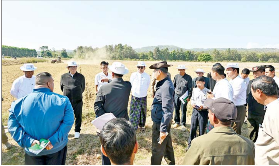
မြေဩဇာအိတ်များကို ပေးအပ်ခဲ့သည်။ ပြည်နယ်အနေဖြင့် ဒေသတွင်း ဆန်ရိက္ခာဖူလုံသော်လည်း စားဆီဖူလုံမှုတွင် လိုအပ်ချက်များစွာ

မြစ်ကြီးနား ဇန်နဝါရီ ၂၀ ကချင်ပြည်နယ်၌ မိုးစပါးရိတ်သိမ်းပြီး ရိုးပြတ်ကျန်လယ်များတွင် ဆောင်းသီးထပ် ဆီထွက်သီးနှံ စိုက်ပျိုးနိုင်ရေး ကြိုးပမ်းဆောင်ရွက်လျက်ရှိရာ ပြည်နယ်ဝန်ကြီးချုပ် ဦးခက်ထိန်နန်နှင့် အဖွဲ့ဝင်များသည် ယနေ့တွင် မြစ်ကြီးနားမြို့နယ် မော်ဖောင်းကျေးရွာအုပ်စုအတွင်းရှိ ဒိန်ရှာကွင်းမှ တောင်သူများနှင့် သွားရောက်တွေ့ဆုံကြသည်။ ထိုသို့တွေ့ဆုံရာတွင် အဆိုပါကွင်းအတွင်းရှိ တောင်သူများက လယ်ကွင်းအတွင်း သီးထပ်စိုက်ပျိုးနိုင်ရေး စိုက်ပျိုးရေလိုအပ်ချက်၊ သီးထပ်သီးနှံအတွက် ခြံဝင်းကာရံပေးနိုင်ရေးနှင့် လိုအပ်သည်များကို တင်ပြကြရာ ပြည်နယ်ဝန်ကြီးချုပ်က သက်ဆိုင်ရာကဏ္ဍအလိုက် ပြည်နယ်အဆင့် ဌာနဆိုင်ရာတာဝန်ရှိသူများနှင့် ပေါင်းစပ်ညှိနှိုင်း၍ ဖြည့်ဆည်းဆောင်ရွက်ပေးခဲ့ပြီး သီးထပ်စိုက်ပျိုးမည့် တောင်သူများအတွက် ဆီထွက်သီးနှံ နေကြာနှင့် ပဲပုပ်မျိုးစေ့အိတ်များ၊ သဘာဝ