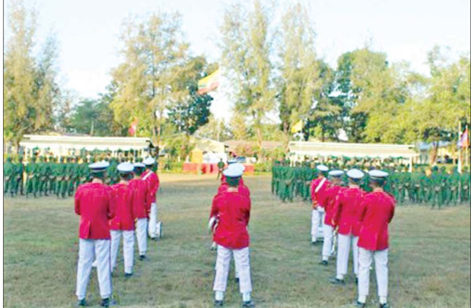
ပြည်သူ့စစ်မှုထမ်းသင်တန်း အမှတ်စဉ်(၉) သင်တန်းဖွင့်ပွဲ ကျင်းပစဉ်။