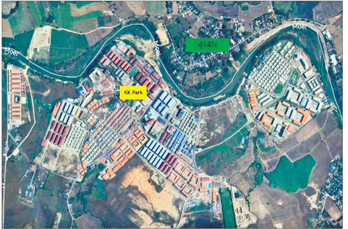
တရားမဝင် အွန်လိုင်းလောင်းကစားအပါအဝင် ဒုစရိုက်မှုများ ဖြစ်ပေါ်လျက်ရှိသည့် မြဝတီ-ရွှေကုက္ကိုလ်နယ်မြေပြပုံ။