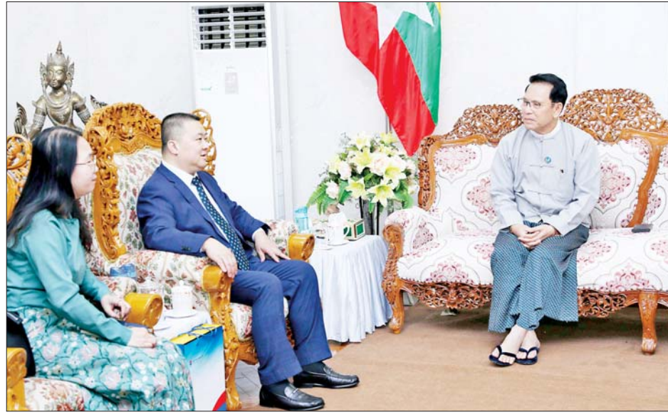
နှင့် တရုတ်ဗဟို အသံနှင့် ရုပ်မြင်သံကြားဌာန China Media Group (CMG) တို့သည် လည်းကောင်း၊ တရုတ်ပြည်သူ့သမ္မတနိုင်ငံ ကွမ်မင်းအသံလွှင့်နှင့် ရုပ်မြင်သံကြားဌာန (GXRTV) တို့သည် လည်းကောင်း၊ Yunnan International Channel ၏ အွန်လိုင်းရုပ်မြင်သံကြားထုတ်လွှင့်မှု Platform ဖြစ်သည့် Yunnan

ပြန်ကြားရေးဝန်ကြီးဌာနနှင့် တရုတ်နိုင်ငံတို့အကြား မီဒီယာကဏ္ဍ ပူးပေါင်းဆောင်ရွက်မှုအနေဖြင့် ၂၀၂၃ ခုနှစ်တွင် မြန်မာ့အသံနှင့် ရုပ်မြင်သံကြား