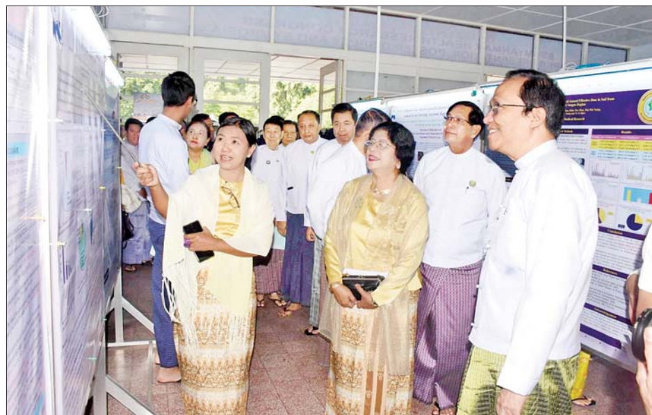
ပြည်ထောင်စုဝန်ကြီး ပါမောက္ခဒေါက်တာသက်ခိုင်ဝင်းနှင့် အခမ်းအနားတက်ရောက်လာကြသူများ သုတေသနပိုစတာပြပွဲကို လှည့်လည်ကြည့်ရှုစဉ်။

ရှိ ညွှန်ကြားရေးမှူးချုပ်များ၊ ပါမောက္ခချုပ်များ၊ ဆေးသုတေသနပညာရှင်များ၊ စာတမ်းဖတ်ကြားမည့် အဓိကသုတေသီများနှင့် ပြည်ပပညာရှင်များသည် သုတေသနပိုစတာပြပွဲကို လှည့်လည်ကြည့်ရှုကြသည်။ ညီလာခံသို့ တင်သွင်းလာသည့် စာတမ်းများမှ အကောင်းဆုံးအခြေခံ သုတေသန (Basic Research) စာတမ်းဆုများ၊ အကောင်းဆုံး လက်တွေ့အသုံးချ သုတေသန (Applied Research) စာတမ်းဆုများ၊ အကောင်းဆုံး ကျန်းမာရေးစနစ် သုတေသန (Health Systems Research) စာတမ်းဆုများ၊ အကောင်းဆုံး ပိုစတာစာတမ်းဆုများနှင့် လူငယ် သုတေသီဆုများကို စာတမ်းဆုရွေးချယ်ရေး ဆပ်ကော်မတီက စိစစ်ရွေးချယ်၍ ဆုများချီးမြှင့်သွားရန် စီစဉ်ထားကြောင်း သိရသည်။ သတင်းစဉ်