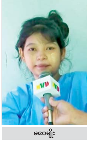
မဝေမျိုး