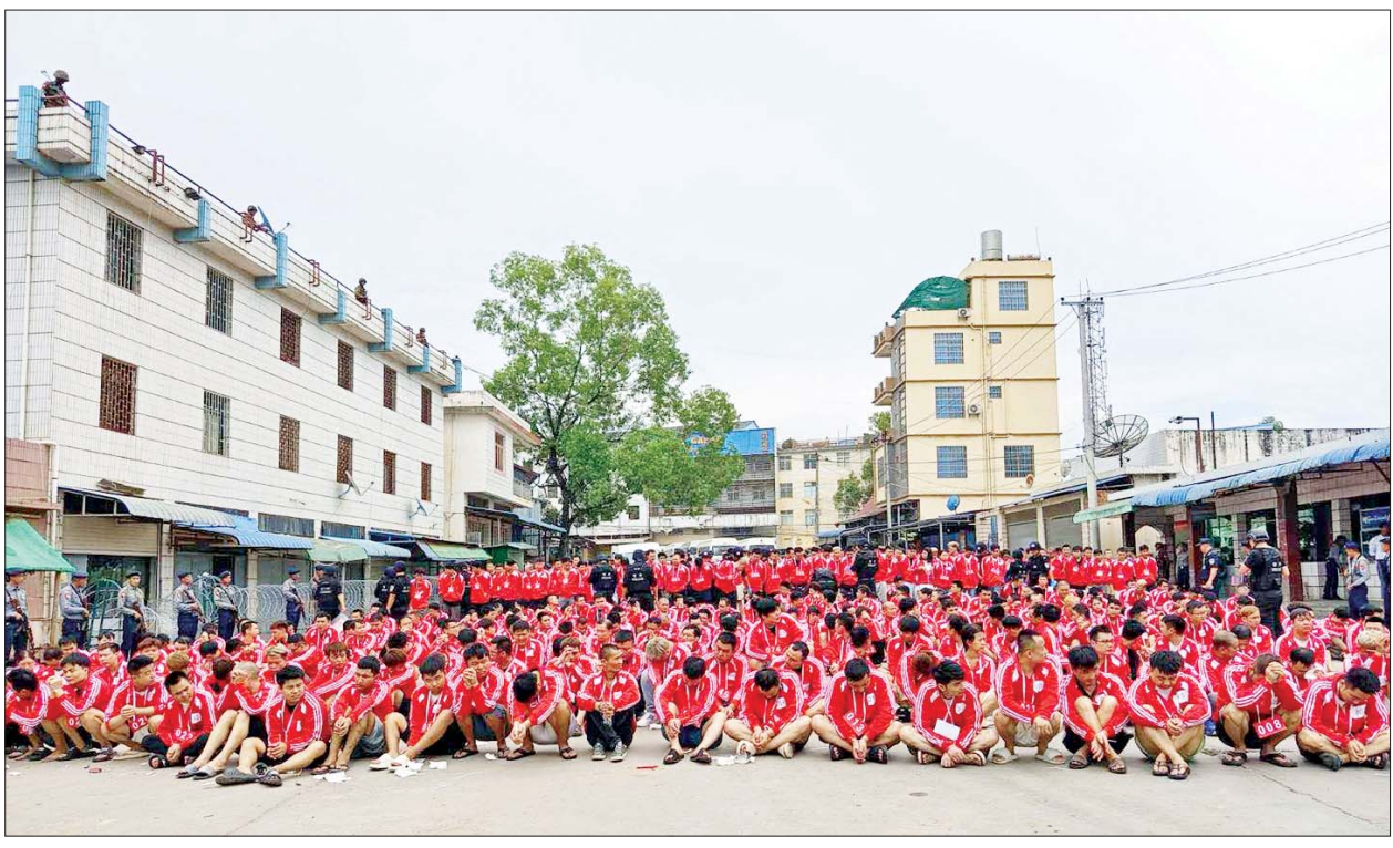
မြန်မာနိုင်ငံအတွင်းသို့ တရားမဝင် ဝင်ရောက်လာပြီး အွန်လိုင်းလောင်းကစားမှုကျူးလွန်နေကြသည့် ပြည်ပနိုင်ငံသားများအား တွေ့ရစဉ်။

ရရှိသည့် တရားမဝင် ဝင်ရောက်နေသူများကို သက်ဆိုင်ရာ နိုင်ငံအလိုက် ပြန်လည်လွှဲပြောင်းပေးလျက်ရှိရာ ၂၀၂၃ ခုနှစ် အောက်တိုဘာလ ၅ ရက်မှ ၂၀၂၅ ခုနှစ် ဇန်နဝါရီလ ၁၃ ရက်အထိ တရုတ်နိုင်ငံသို့ ၅၃၃၈၈ ဦး၊ ထိုင်းနိုင်ငံသို့ ၆၄၈ ဦး၊ ကိုရီးယားနိုင်ငံသို့ ၂၀ ဦး၊ လာအိုနိုင်ငံသို့ ၂၂ ဦး၊ ဗီယက်နမ်နိုင်ငံသို့ ၁၄၄၉ ဦး၊ ဖိလစ်ပိုင်နိုင်ငံသို့ ၁၉ ဦး၊ မလေးရှားနိုင်ငံသို့ ၁၄၂ ဦး၊ တရုတ်(တိုင်ပေ)သို့ ၂၁ ဦး၊ စင်ကာပူနိုင်ငံသို့ ၃၈ ဦး၊ ပိုလန်နိုင်ငံသို့ တစ်ဦး၊ စပိန်နိုင်ငံသို့ တစ်ဦး၊ ရုရှားနိုင်ငံသို့ ၁၃ ဦး၊ အင်ဒိုနီးရှားနိုင်ငံသို့ ၃၈ ဦး၊ ယူဂန်ဒါနိုင်ငံသို့ သုံးဦး၊ အီဂျစ်နိုင်ငံသို့ ၃၈ ဦး၊ ကမ္ဘောဒီးယားနိုင်ငံသို့ သုံးဦး၊ အိန္ဒိယနိုင်ငံသို့ ၉၆ ဦး၊ မော်ရိုကိုနိုင်ငံသို့ ၁၃ ဦး၊ အီသီယိုးပီးယားနိုင်ငံသို့ ၂၉ ဦး၊ နီပေါနိုင်ငံသို့ ၂၆ ဦး၊ ပါကစ္စတန်နိုင်ငံသို့ သုံးဦး၊ မြောက်အိုင်ယာလန်နိုင်ငံသို့ ၃၈ ဦး၊ ကာဇက်စတန်နိုင်ငံသို့ တစ်ဦး၊ ကင်ညာနိုင်ငံသို့ ၃၈ ဦး၊ သီရိလင်္ကာနိုင်ငံသို့ ၆၀ ဦး၊ တောင်အာဖရိကနိုင်ငံသို့ တစ်ဦး၊ တရုတ်-ဟောင်ကောင်သို့ တစ်ဦး၊ ဆီရီယာလီယွန်နိုင်ငံသို့ ၃၈ ဦး၊ ဂါနာနိုင်ငံသို့ တစ်ဦး၊ ဘူဂ္ဂလန်နိုင်ငံသို့ တစ်ဦး၊ တာ့ခမ်မင်နစ္စတန်နိုင်ငံသို့ တစ်ဦး စုစုပေါင်း ၅၅၇၁၁ ဦးအား ပြန်လည်လွှဲပြောင်းပေးနိုင်ခဲ့ပြီး ဆက်လက်၍လည်း စိစစ်ဖော်ထုတ်မှုများကို ဆောင်ရွက်လျက်ရှိသည်။