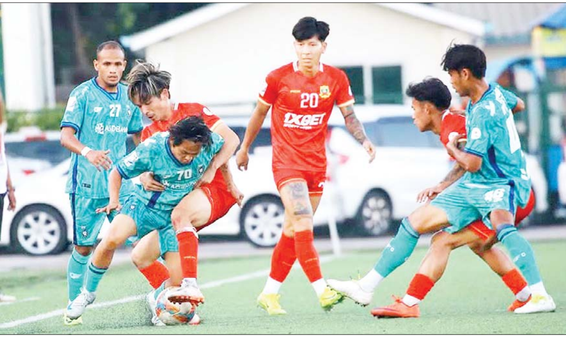
ရှမ်းယူနိုက်တက်အသင်းနှင့် ရန်ကုန်ယူနိုက်တက်အသင်းတို့ ယှဉ်ပြိုင်ကစားကြစဉ်။

ရန်ကုန် ဇန်နဝါရီ ၁၈ ၂၀၂၄-၂၀၂၅ ရာသီ MNL အမှတ်ပေး ပြိုင်ပွဲ ပွဲစဉ် (၁၆) ဒုတိယနေ့ကို ဇန်နဝါရီ ၁၈ ရက်က ဆက်လက်ကျင်းပရာ လက်ရှိ ချန်ပီယံ ရှမ်းယူနိုက်တက်နှင့် ရတနာပုံ အသင်း အနိုင်ရရှိသည်။ ဆက်လက်ဦးဆောင် YUSC ကွင်း၌ ကျင်းပသည့်ပွဲတွင် ရှမ်းယူနိုက်တက်အသင်းက ရန်ကုန် ယူနိုက်တက်အသင်းကို တစ်ဂိုး-ဂိုးမရှိဖြင့် အနိုင်ရခဲ့သည်။ ချန်ပီယံဆုအတွက် အရေးပါသည့်ပွဲတွင် ရှမ်းယူနိုက်တက် အသင်းက ရန်ကုန်အသင်းကို အဝေးကွင်း တွင်အနိုင်ယူပြီး ထိပ်ဆုံးတွင် အမှတ်ဖြတ် ဆက်လက်ဦးဆောင်နိုင်ခဲ့သည်။ ရန်ကုန် ယူနိုက်တက်အသင်းသည် ယခုရာသီ ပထမဆုံးရှုံးပွဲနှင့်အတူ ရှမ်းယူနိုက်တက် အသင်းနှင့် ၁၁ မှတ်အထိ ဖြတ်သွားပြီး စာမျက်နှာ ၁၇ ကော်လံ ၅ သို့ ☆