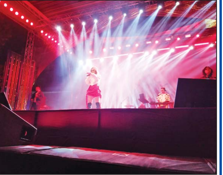
နယူးဒေလီမြို့ သမိုင်းဝင် ပူရာနာဒီလာအဆောက်အအုံ၌ အာဆီယံ-အိန္ဒိယဂီတပွဲတော် ကျင်းပစဉ်။