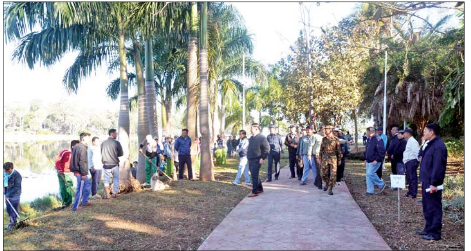
ပြုပြင်ဆောင်ရွက်ပေးနေမှုအခြေအနေကို ကြည့်ရှုစစ်ဆေးပြီး လုပ်ငန်းများ သတ်မှတ်စီမံချိန်စံညွှန်းပြည့်မီစွာ အချိန်မီပြီးစီးရေး အလေးထားကြပ်မတ်

ဆက်လက်၍ ရင်းနှီးမြှုပ်နှံမှုနှင့် ကုမ္ပဏီများညွှန်ကြားမှုဦးစီးဌာန ရုံးအဆောက်အအုံ ပြန်လည်