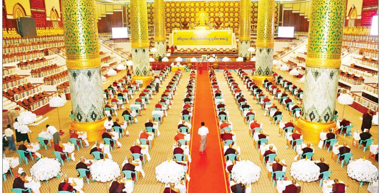
(၇၇)ကြိမ်မြောက် တိပိဋကဓရ တိပိဋကကောဝိဒ ရွေးချယ်ရေးစာမေးပွဲ (သဘောရေးဖြေ)ကျင်းပစဉ်။