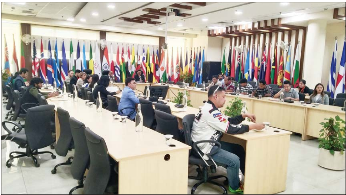
အာဆီယံအဖွဲ့ဝင်နိုင်ငံများမှ သတင်းမီဒီယာကိုယ်စားလှယ်အဖွဲ့ နိုင်ငံတကာနေ့စွမ်းအင်မဟာမိတ်သို့ သွားရောက်လေ့လာကြစဉ်။

ဤအထိမ်းအမှတ်ပွဲကို နိုဝင်ဘာ ၂၈ ရက်မှ ၃၀ ရက်အထိ ကျင်းပခဲ့သည်။ အိန္ဒိယနှင့် အာဆီယံ ၁၀ နိုင်ငံမှ လုပ်ငန်းရှင်များနှင့် နည်းပညာတီထွင်သူများကို စုပေါင်းပြီး နယ်စပ်များကို ကျော်လွှားကာ ပူးပေါင်းဆောင်ရွက်မှုများကို မြှင့်တင်ရန်နှင့် တီထွင်ဆန်းသစ်မှုများကို တွန်းအားပေးရန် ရည်ရွယ်ထားသည်။ ပွဲတော်တွင် အိန္ဒိယ Startups ၆၀ နှင့် အာဆီယံ Startups ၄၀ က လှုပ်ရှားမှုများနှင့် နည်းပညာနှင့် ရေရှည်တည်တံ့သော ဆန်းသစ်မှုများကို အထူးအလေးထားသရုပ်ပြခဲ့ကြသည်။ ဤဆန်းသစ်မှုများသည် ဒေသဆိုင်ရာ စိန်ခေါ်မှုများကို ဖြေရှင်းရန်နှင့် လူမှုစီးပွားတိုးတက်မှုကို အားပေးရန်ရည်ရွယ်ထားပြီး အဆင့်မြင့် နည်းပညာနှင့် တာရှည်တည်တံ့မှုဆိုင်ရာကို အထူးအလေးပေးထားသည်။