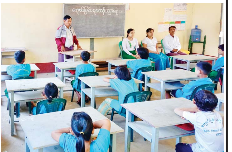
နိုင်ငံတော်စီမံအုပ်ချုပ်ရေးကောင်စီလက်ထက် နိုင်ငံတော်ဝန်ကြီးချုပ်၏ လမ်းညွှန်မှုအရ ကျောင်းပြင်ပပညာရေးကဏ္ဍ၏ စဉ်ဆက်ပညာရေးလုပ်ငန်း ဆောင်ရွက်ချက်များ

စဉ်ဆက်ပညာရေးတွင် (က) စာဖတ်ရိုက်မြှင့် တင်ပေးခြင်းအစီအစဉ် (ခ) ဝင်ငွေတိုးပွားရေး အတွက် ချိတ်ဆက်ဆောင်ရွက်ပေးခြင်းအစီအစဉ် နှင့် (ဂ) ဘဝသာယာရေးအတွက် အသိပညာပေးခြင်း အစီအစဉ် စသည့်အစီအစဉ် (၃)ရပ်တို့ ပါဝင်သည်။ ပညာရေးဝန်ကြီးဌာနအနေဖြင့် ဒေသဆိုင်ရာ အုပ်ချုပ်ရေးအဖွဲ့များ၊ ဆက်စပ်ဝန်ကြီးဌာနများ အောက်ရှိ ဌာနဆိုင်ရာများ၊ မိတ်ဖက်လူမှုရေး အသင်းအဖွဲ့များ၊ တိုင်းရင်းသားစာပေနှင့် ယဉ်ကျေး မှုအဖွဲ့များနှင့်ပူးပေါင်း၍ စဉ်ဆက်ပညာရေး ဆောင်ရွက်ပြီး ဆောင်ရွက်ဆဲနှင့် ဆောင်ရွက်သွား မည့်အစီအစဉ်များကို အောက်ပါဇယားတွင် စုစည်း ဖော်ပြအပ်ပါသည်-