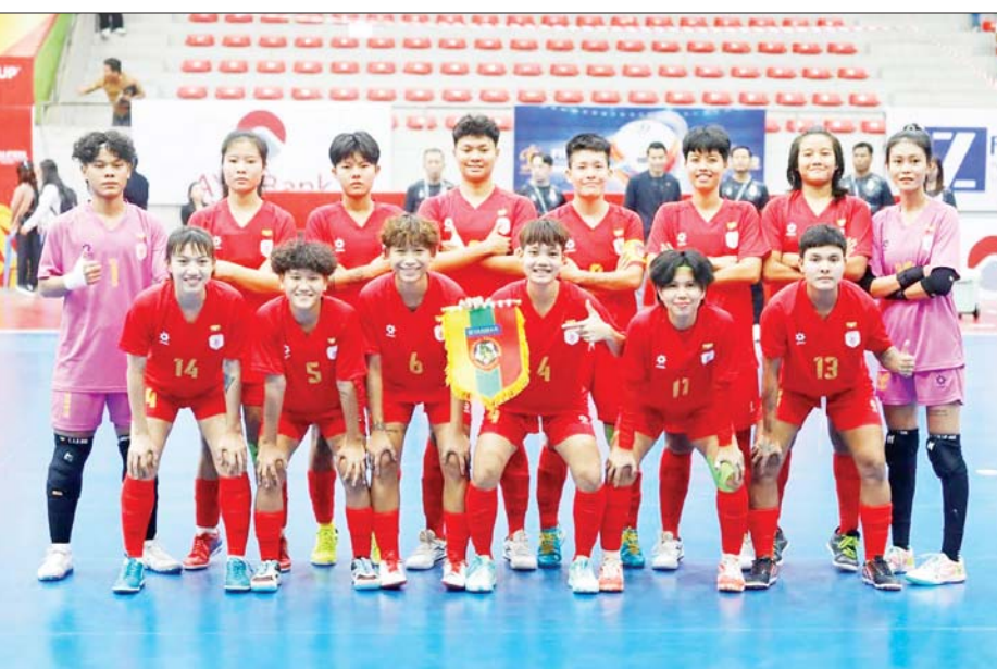
အာရှဖလား အမျိုးသမီးဖူဆယ်ခြေစစ်ပွဲ ယှဉ်ပြိုင်နေသည့် မြန်မာအသင်းကို တွေ့ရစဉ်။

ရန်ကုန် ဇန်နဝါရီ ၁၈ လက်ရှိကျင်းပနေသည့် ၂၀၂၅ အာရှဖလား အမျိုးသမီးဖူဆယ် ခြေစစ်ပွဲ အုပ်စုနောက်ဆုံးပွဲ မတိုင်မီ ခြေစစ်ပွဲအောင်မြင်သည့် အသင်းခြောက်သင်း ထွက်ပေါ် ထားသည်။ ခြေစစ်ပွဲအောင်မြင် ဇန်နဝါရီ ၁၇ ရက် ပွဲစဉ်များ အပြီးတွင် အုပ်စု(A)မှ ထိုင်း အသင်း၊ အုပ်စု(B)မှ အင်ဒိုနီးရှား အသင်းနှင့် ဟောင်ကောင်အသင်း၊ အုပ်စု(C)မှ ဩစတြေးလျအသင်း၊ အုပ်စု(D)မှ ဗီယက်နမ်နှင့် တရုတ် (တိုင်ပေ)အသင်းတို့ ခြေစစ်ပွဲ အောင်မြင်ခဲ့ခြင်း ဖြစ်သည်။ စာမျက်နှာ ၂၅ ကော်လံ ၁ သို့ ☆