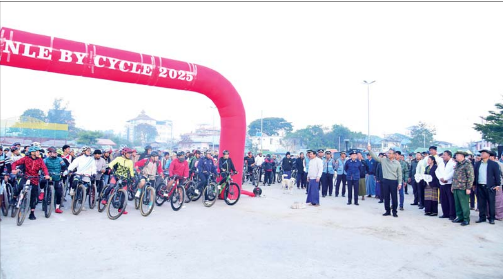
ရှမ်းပြည်နယ်ဝန်ကြီးချုပ် ဦးအောင်အောင် ဆဋ္ဌမအကြိမ်မြောက် အင်လေးကန်ဖြတ် စက်ဘီးစီးပြိုင်ပွဲကို သေနတ်ပစ်ဖောက်၍ တာလွတ်ပေးစဉ်။

❖ ညောင်ရွှေမြို့မှ ဦးစွာ ရှမ်းပြည်နယ်ဝန်ကြီးချုပ် ဦးအောင်အောင် က အမှာစကားပြောကြားပြီး အကြီးတန်း ၃၀ ကီလိုမီတာနှင့် အငယ်တန်း ၁၅ ကီလိုမီတာ စက်ဘီးစီးနင်းခြင်းအတွက် သေနတ်ပစ်ဖောက်၍ တာလွတ်ပေးသည်။ အားကစားသမား ၅၀၀ ကျော် ပါဝင်ဆင်နွှဲ အဆိုပါ စုပေါင်းစက်ဘီးစီးနင်းပွဲအပြီးတွင် ပန်းဝင်သည်အထိ စီးနင်းခဲ့ကြသူများအား ကံစမ်း မဲဖွင့်ဖောက်၍ အမှတ်တရလက်ဆောင်ဆုများ ပေးအပ်ချီးမြှင့်ပွဲကို ဆက်လက်ပြုလုပ်ရာ တာဝန်ရှိ သူများက ဆုရရှိကြသူများအား အမှတ်တရ ဆုလက်ဆောင်များ ပေးအပ်ချီးမြှင့်ခဲ့ကြကြောင်း နှင့် စုပေါင်းစက်ဘီးစီးနင်းပွဲသို့ စက်ဘီးစီး အားကစားသမား စုစုပေါင်း ၅၀၀ ကျော် ပါဝင် ဆင်နွှဲခဲ့ကြကြောင်း သိရသည်။ စိုင်းအယ်ဘဲ