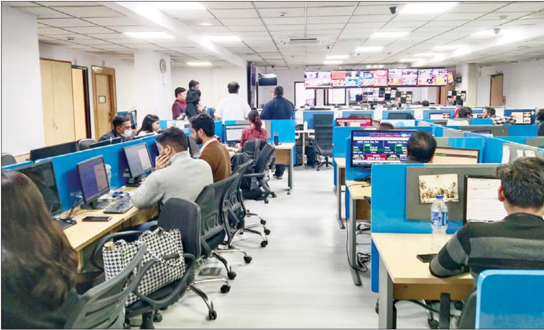
အာဆီယံအဖွဲ့ဝင်နိုင်ငံများမှ သတင်းမီဒီယာကိုယ်စားလှယ်အဖွဲ့ အာရှသတင်းအင်တာနေရှင်နယ် (ANI)သို့ သွားရောက် လေ့လာကြစဉ်။

ခေတ်ဟောင်းနှင့် ခေတ်သစ် ပေါင်းစပ်ထားသည့် နယူးဒေလီ စာရေးသူတို့အဖွဲ့သည် နိုဝင်ဘာ ၂၇ ရက် မွန်းလွဲပိုင်းတွင် နယူးဒေလီ မြို့ အင်ဒီရာဂန္တီလေဆိပ်သို့ ရောက်ရှိခဲ့ကြ သည်။ နယူးဒေလီမြို့သည် အိန္ဒိယနိုင်ငံ ၏ ချမ်းသာကြွယ်ဝခဲ့သော အတိတ်နှင့် တိုးတက်မှု အလားအလာကောင်းများ ပိုင်ဆိုင်ထားသော ပစ္စုပ္ပန်၏ သင်္ကေတ ဖြစ်သည်။ နယူးဒေလီမြို့သည် ခေတ်ဟောင်းနှင့် ခေတ်သစ်ကို အချိုး ကျကျပေါင်းစပ်ပြီး ဖွံ့ဖြိုးတိုးတက်နေ သည့် မြို့လည်းဖြစ်သည်။ နယူးဒေလီမြို့တွင် ရှေးဘုရင်များ